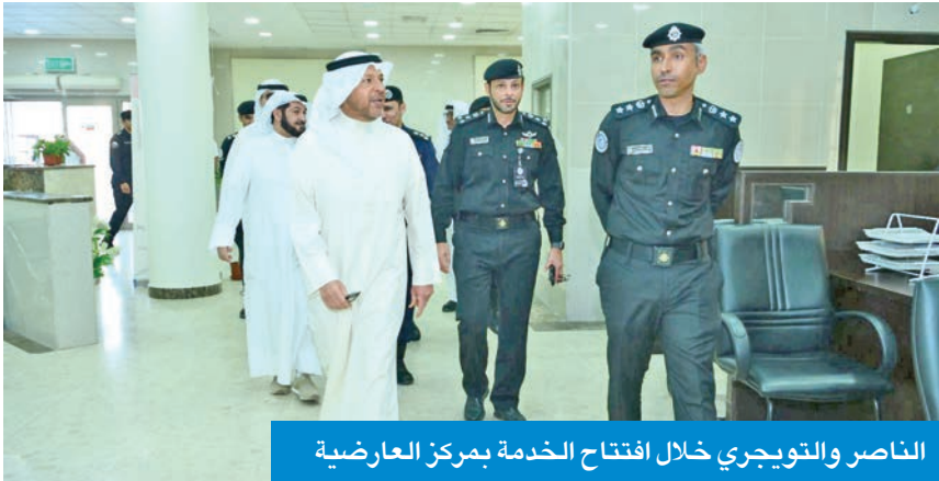
الناصر والتويعري خلال افتتاح الخدمة بمركز العارضية

وقال الناصر لـ«الجريدة»، عقب افتتاحه للخدمة الخاصة في مركز خدمة العارضية لكبار السن وذوي الاحتياجات الخاصة، إنه تابع ميدانياً عملية إزالة المنازل الابلية للسقوط في منطقة جليب الشيوخ، لافتاً إلى أن حل مشاكل المناطق العشوائية يكمن في إنشاء مدن عمالية في مختلف مناطق البلاد، يتم بعدها نقل العمالة إليها وتخفيف الضغط على المناطق المكتظة، والتي تؤثر سلباً على البنية التحتية