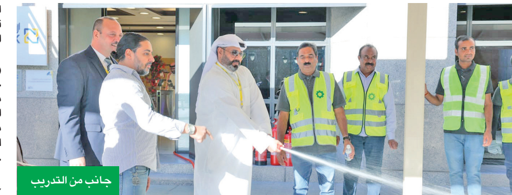
جانب من التدريب

الاختناق التي قد تحصل، وتعزيز قدرات الموظفين وتحسين خطط الاستجابة لديهم. وبشكل ترسيخ معايير الصحة والسلامة المهنية ركيزة رئيسية، خصوصاً أن السلامة ليست مجرد مجموعة من القواعد الواجب اعتمادها بل عبارة عن نظام متكامل مدعوم بوجود خطة استباقية للتعامل مع أي أحداث غير متوقعة خلال العمل. ويعتمد نجاح البنك بشكل كبير على توفير بيئة عمل تعزز الشعور بالأمان والثقة وتحمي الجميع من أي أضرار، حيث يعتبر توفير فرق استجابة داخلية مدربة فوق أعلى المعايير صمام الأمان الأول لحماية الموظفين وتأهيلهم للعمل وتولي زمام الأمور تحت الضغط.