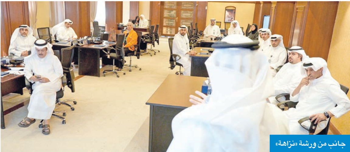
جانب من ورشة «نزاهة»

يحتاج الى الدعم من عدة زوايا واتجاهات، مع دعم المؤسسات العامة، ودعم الموظف العمومي أكثر ليفهم دوره ومحوره في هذا الباب، وكذلك العمل على طلبين الخدمات المالية بأن يكون لديهم الوعي والمعرفة الكافية، خاصة أن هناك تركيزاً على منظمات المجتمع المدني والجهات الإعلامية، لما لهم من دور داعم وأساسي ليقوموا به على الوجه الأمثل.