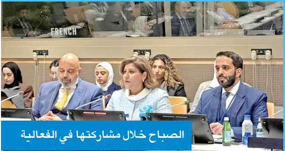
الصباح خلال مشاركتها في الفعالية

أكدت مساعدة وزير الخارجية لشؤون حقوق الإنسان، السفيرة الشبيخة جواهر الصباح، التزام دول مجلس التعاون بتعزيز التعاون الإقليمي والدولي لحماية الإنسان وصون كرامته ودعم العدالة الجنائية. جاء ذلك في تصريح أدلت به الصباح لـ «كونا» أمس الأول أثناء فعالية جانبية نظمها البعثة الدائمة لدولة الكويت لدى الأمم المتحدة في مدينة نيويورك بالتعاون مع بعثة الأمانة العامة لدول مجلس التعاون ومكتب الأمم المتحدة المعني بالمخدرات والجريمة. وأقيمت الفعالية على هامش أعمال الاجتماع الرفيع المستوى للجمعية العامة المعني بتقييم خطة عمل الأمم المتحدة العالمية لمكافحة الاتجار بالأشخاص يومي 24 و 25 الجاري. وقالت الصباح إن «التزام دول المجلس سيظل ركناً أساسيا في الجهود العالمية لمكافحة الاتجار بالأشخاص»، محذرة من أن تلك الجريمة تعد أحد أخطر الانتهاكات في العالم. ولفتت إلى رئاسة الكويت لمجلس التعاون باعتبارها «فرصة لتعزيز العمل الجماعي وحماية الفئات الأكثر ضعفا من خلال مبادرات مبتكرة وشراكات إقليمية ودولية أوسع». من جانبه، استعرض مساعد الأمين العام لدول مجلس التعاون للشؤون القانونية والتشريعية، سلطان السويدي، خلال الفعالية، جهود دول المجلس في مكافحة صور الاتجار بالأشخاص كافة، مشيدا بالتطورات التشريعية والمؤسسية التي شهدتها دول المجلس في السنوات الأخيرة.