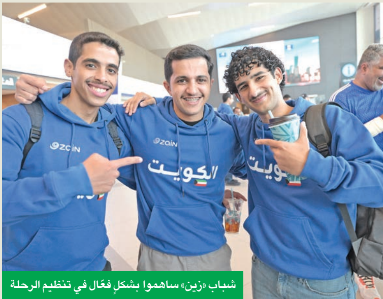
شباب «زين» ساهموا بشكل فعال في تنظيم الرحلة