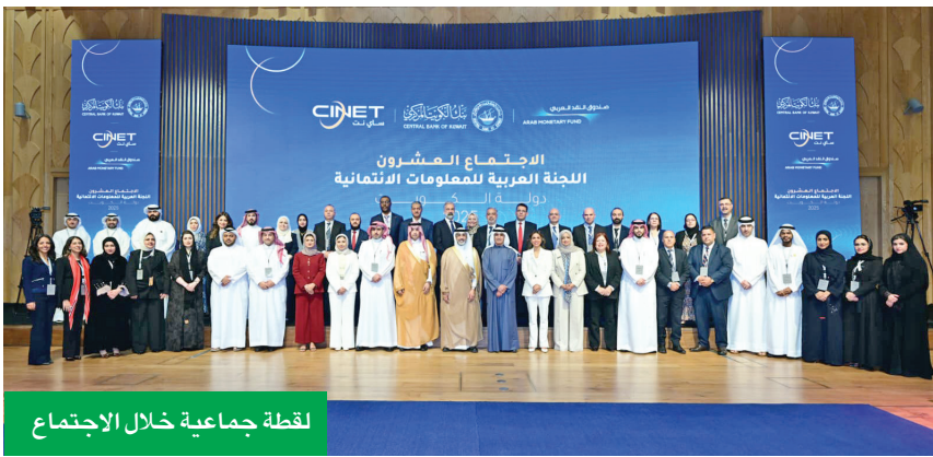
لقطة جماعية خلال الاجتماع

اختتمت في الكويت أعمال الاجتماع السنوي الـ 20 للجنة العربية للمعلومات الائتمانية، والذي تستضيفه شركة شبكة الكويت للمعلومات الائتمانية (ساي نت) للمرة الأولى في الكويت، تحت مظلة صندوق النقد العربي، وبمشاركة نخبة من المسؤولين من مراكز المعلومات الائتمانية في البنوك المركزية ومؤسسات النقد ومديري شركات المعلومات الائتمانية من مختلف الدول العربية.