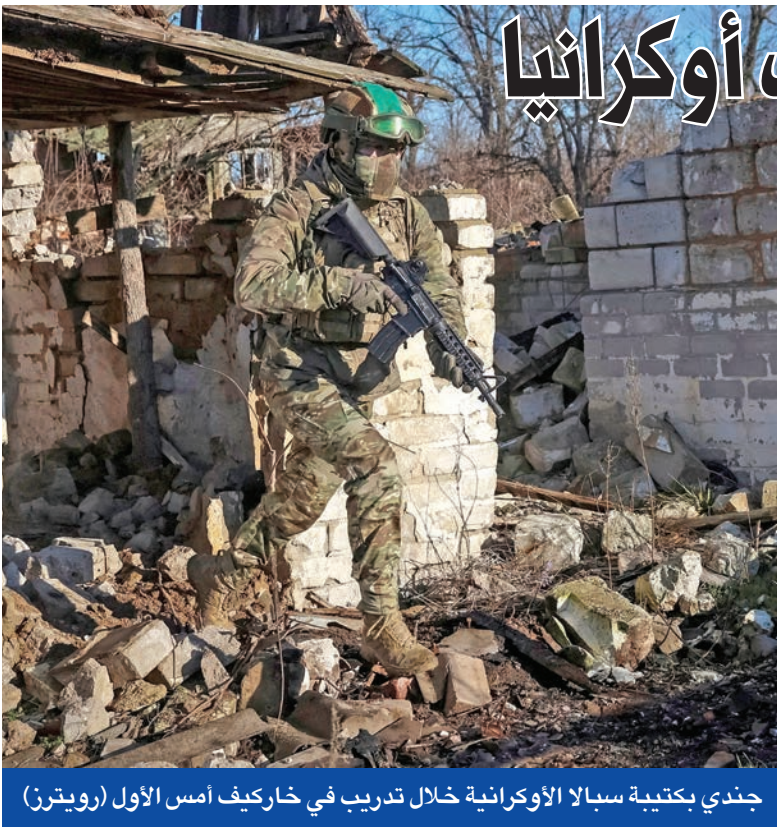
جندي بكتيبة سبلا الأوكرانية خلال تدريب في خاركيف أمس الأول