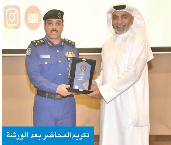
تكريم المحاضر بعد الورشة