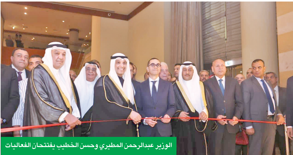
الوزير عبدالرحمن المطيري وحسن الخطيب يفتتحان الفعاليات

التنمية الكويتية. وثمن تنظيم الأسبوع الكويتي في مصر، وما يوفره من منصة مهمة لعرض الفرص الاستثمارية والتجارب الناجحة، وتعزيز التواصل بين مؤسسات القطاعين العام والخاص، مؤكداً أن الحدث يجسد قوة الروابط التاريخية بين الشعبين، ويعكس الالتزام المشترك بدفع العلاقات إلى مستويات أكثر تقدماً.