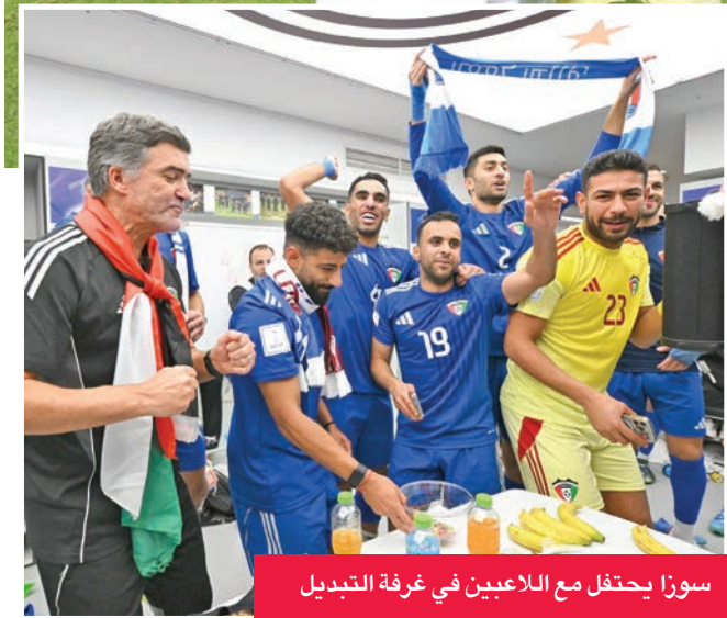
سوزا يحتفل مع اللاعبين في غرفة التبريد