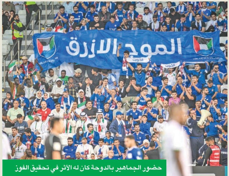
حضور الجماهير بالدوحة كان له الأثر في تحقيق الفوز