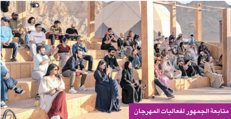
متابعة الجمهور لفعاليات المهرجان