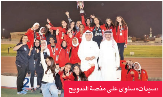
«سيدات» سلوى على منصة التتويج

على نادي فتيات العيون، الذي حلّ وصيفاً بـ7 نقاط، فيما جاء نادي الفتاة ثالثاً بـ6 نقاط، في ختام منافسات استمتمت بالقوة والندية. وفي فئة الناشئات، تالتت فتيات العيون، وحققن المركز الأول بمجموع 126 نقطة، متقدّماً على «سلوى الصباح»، الذي حلّ ثانياً بـ98 نقطة، فيما جاء نادي الفتاة ثالثاً بـ41 نقطة. وفي فئة الصغار، وأصل نادي فتيات العيون تالقة، وتصدّر الترتيب العام بمجموع 189 نقطة، متقدماً على نادي سلوى الصباح، الذي جمع 108 نقاط، فيما جاء نادي الفتاة ثالثاً بـ28 نقطة. وأشاد مسؤولو الاتحاد الكويتي لألعاب القوى بالمستوى الفني المتميز الذي أظهرته اللاعبات، مؤكداً أن البطولة شكّلت محطة مهمة في تطوير الرياضة النسائية، وتعزيز حضورها على الساحة المحلية، كما عكست التزام الأندية بتأهيل الكوادر النسائية في مختلف مسابقات ألعاب القوى.