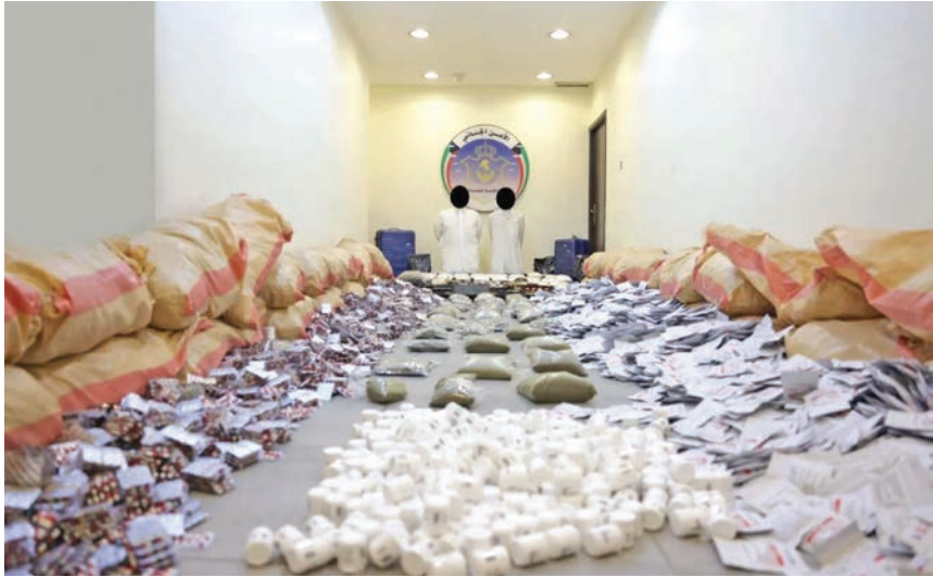
هذا التنظيم أو اشترك في أي من أعماله، وكان عالماً باغراضه.