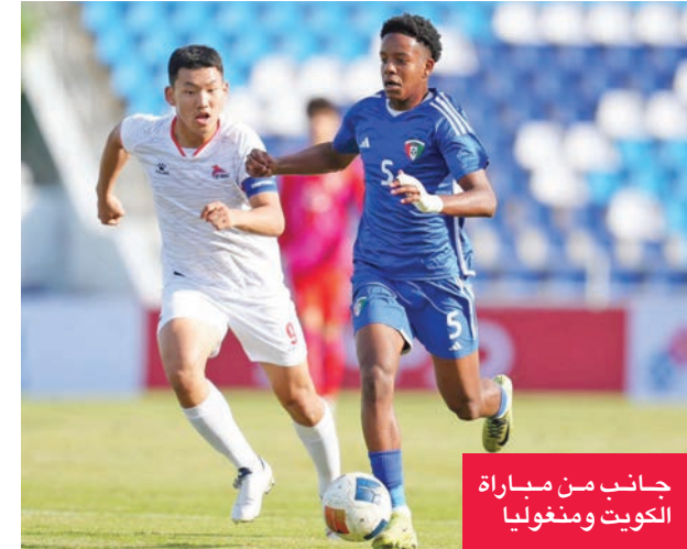
جانب من مباراة الكويت ومنغوليا