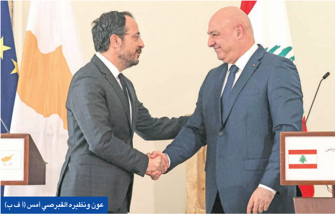
عون ونظيره القبرصي أمس

السلاح وحصره بيد الدولة، وبحال تم تحقيق تقدم في هذا المسار، فيمكن لمصر حينها أن تؤدي دوراً لخفض التصعيد العسكري الإسرائيلي، وصولاً إلى وقف الاعتداءات والبحث في الانسحاب من جنوب لبنان، على أن تستضيف القاهرة لاحقاً مؤتمراً خاصاً بلبنان لإنهاء أي شكل من أشكال التصعيد العسكري، والوصول إلى اتفاق لإنهاء الحرب؛ على غرار اتفاق غزة الذي حصل في شرم الشيخ. في مقابل هذا الطرح، يخفي المصريون وجود مخاوف كبيرة من جدية التصعيد الإسرائيلي، سيما أن الأجواء التي سمعها المسؤولون اللبنانيون في غاية الخطورة، ونشير إلى أن الإسرائيلييين اتخذوا قرارهم بشأن حرب واسعة على لبنان، ولن تقتصر على العمليات الجوية؛ بل هناك خطة لتنفيذ عملية برية تتوغل فيها القوات الإسرائيلية على مناطق واسعة في جنوب لبنان، وتدخل إلى مواقع لتفكيكها، وتغير بموجبها الوقائع العسكرية والميدانية.