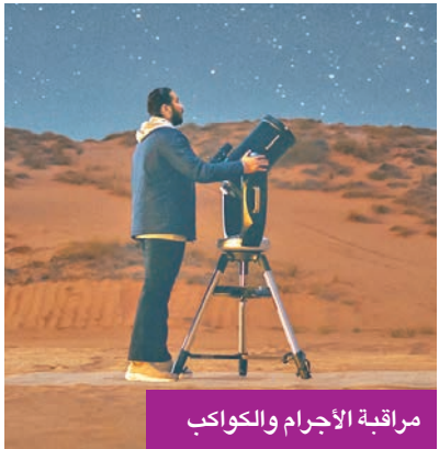
مراقبة الأجرام والكواكب