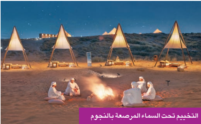
التخييم تحت السماء المرصعة بالنجوم

وحملت الفعاليات في طياتها امتداداً ورؤية جديدة تستلهم من التجربة الافتتاحية وتعتبر عنها بصورة أوسع وأعمق. وتحت راية