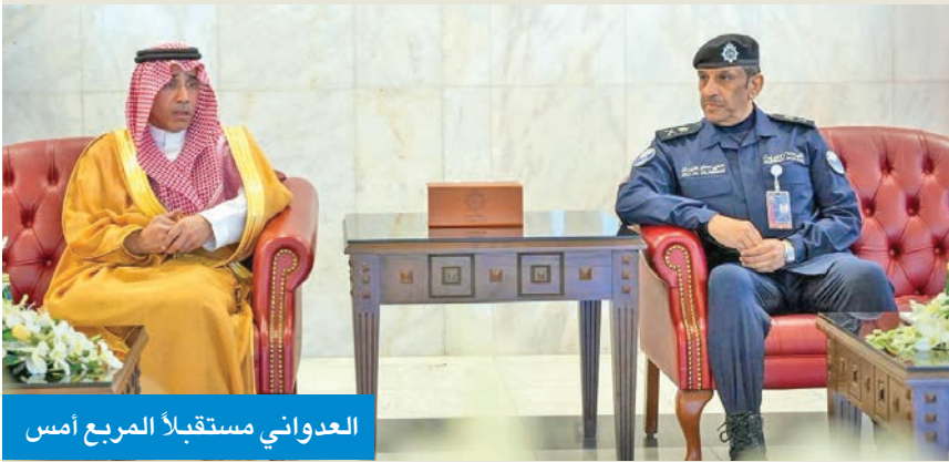
العدواني مستقبلاً المربع أمس