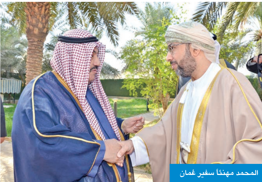
المحمد مهنتاً سفير عُمان

أكد خلال زيارة سفارة السلطنة عمق العلاقات التاريخية بين البلدين