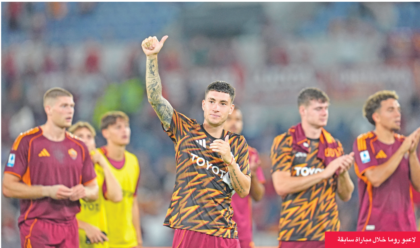
لاعبو روما خلال مباراة سابقة

حين يتواجه نادي العاصمة مع ميدتيلاند الدنماركي المتصدر اليوم، في الجولة الخامسة من المجموعة الموحدة لمسابقة «يوروبا ليغ».