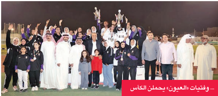
... وفتيات «العيون» يحملن الكأس