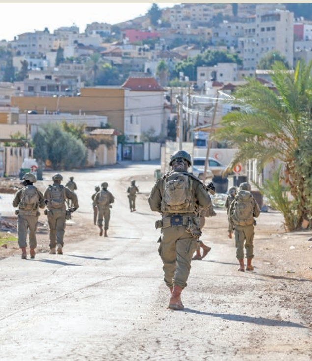
قوات إسرائيلية داخل طوباس شمال الضفة الغربية أمس

وسط تزايد المخاوف بشأن تحرك سلطات الاحتلال باتجاه تهينة الأوضاع لفرص سيطرة شاملة على المنطقة الفلسطينية وتكريس فصلها عن قطاع غزة، عبر سلسلة قوانين وإجراءات تشمل عدم الاعتراف بالدولة الفلسطينية، وتوسيع الاستيطان، ومصادرة الأراضي، بدأت قوات الجيش الإسرائيلي، عملية أمنية واسعة في شمال الضفة الغربية، حيث حوّل العديد من المنازل إلى ثكنات عسكرية. وقال الناطق باسم الجيش، أفخاي أدري، إن قواته وجهت الأمن العام (الشبابك) وقوات الشرطة تشارك في العملية الرامية لـ «إحباط الأنشطة الإرهابية» وملاحقة مطلوبين ليل الخلاء الأرياء. وأفادت الإذاعة العبرية الرسمية بأن 3 ألوية عسكرية تشارك في الحملة، مشيرة إلى أن الجيش يفرض حظر تجول في 5 مناطق بالضفة، من بينها طمون وطوباس وعدة بلدات مجاورة. وذكرت مصادر فلسطينية أن قوات إسرائيلية كبيرة اقتحمت طوباس ترافقها جرافات عسكرية، وسط تحليق لمروحيات الأباتشي. كما عملت الجرافات على إغلاق عدد من الطرق الرئيسية والفرعية في المدينة بالسواتر الترابية. وشددت القوات إجراءاتها العسكرية على حاجزي تياسير والحمر العسكريين أمام