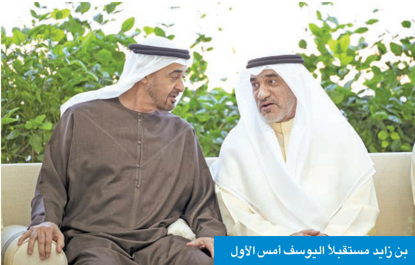
بن زايد مستقبلاً اليوسف أمس الأول

استقبل رئيس دولة الإمارات العربية المتحدة، الشيخ محمد بن زايد، أمس الأول، النائب الأول لرئيس مجلس الوزراء وزير الداخلية الشيخ فهد اليوسف. وذكرت وكالة أنباء الإمارات (وام) أن اللقاء جرى بقصر البحر في أبوظبي، وتناول الروابط الأخوية التي تجمع البلدين الشقيقين وتطوير العمل المشترك في كل الجوانب التي تخدم مصالحهما، وتسهم في تحقيق تطلعات شعبهما نحو التنمية والأزدهار. كما تناول اللقاء أهمية دعم العمل الخليجي المشترك بما يحقق مصالح جميع دول مجلس التعاون لدول الخليج العربية وشعوبها. وخلال اللقاء نقل اليوسف إلى