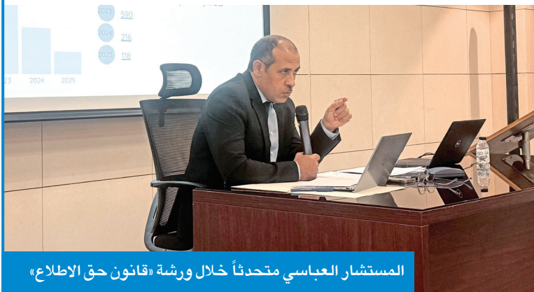
المستشار العباسي متحدثاً خلال ورشة «قانون حق الإطلاع»

90 بالمئة من التقييم النهائي، فيما تمثل المقابلة الشخصية 10 بالمئة فقط، بهدف اختيار الكفاءات الأكثر قدرة على تولي الوظائف الإشرافية بالجمعيات، مشددة على أهمية التزام المتقدمين بالحضور بالمواعيد المحددة، وإحضار شهادة «لا حكم عليه» التي تصدر عبر تطبيق «سهل».