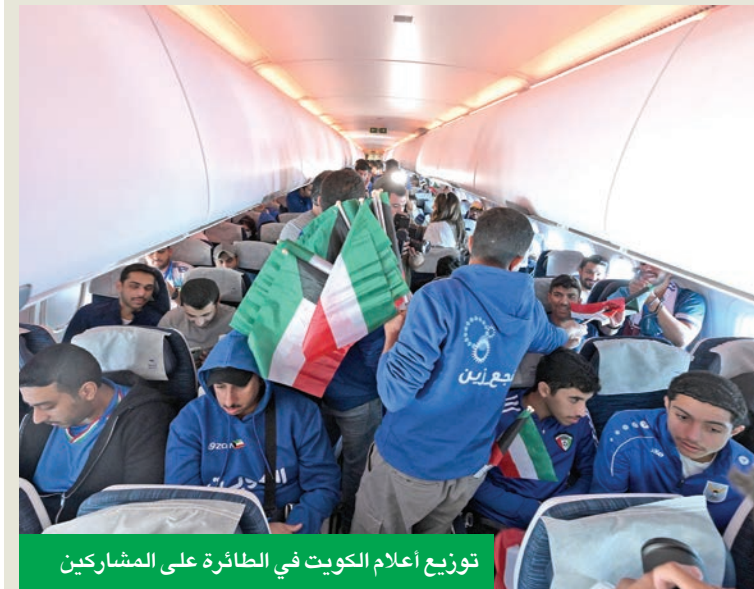
توزيع أعلام الكويت في الطائرة على المشاركين

سبّرت «زين الكويت» رحلات جوية لنقل جماهير منتخب الكويت الوطني لكرة القدم (الأزرق) إلى العاصمة القطرية الدوحة، لمساندة المنتخب في مباراة المُلقح المؤهلة لبطولة كأس العرب أمام نظيره الموريتاني، وذلك عبر تخصيص 3 طائرات لنقل المشجعين، بالتعاون مع الاتحاد الكويتي لكرة القدم وشركة الخطوط الجوية الكويتية. وجاءت هذه الخطوة من «زين» ضمن مبادراتها المستمرة لدعم الرياضة الكويتية، وتعزيز حضور «الأزرق» وجماهيره في الاستحقاقات الإقليمية والقارية، حيث ساهمت الرحلة في توفير أجواء مثالية للمشجعين لمؤازرة المنتخب من المدرجات،