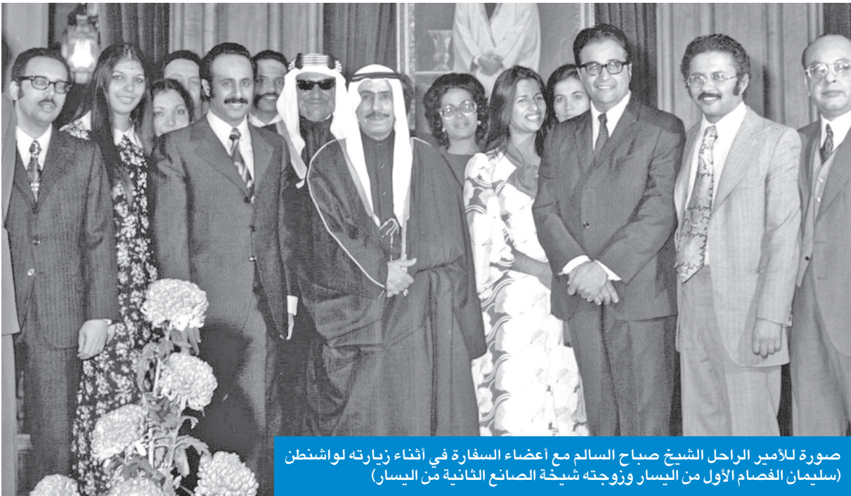
صورة للأمير الراحل الشيخ صباح السالم مع أعضاء السفارة في أثناء زيارته لواشنطن (سليمان الفصام الأول من اليسار وزوجته شبيخة الصانع الثانية من اليسار)

هذه الزيارة الرسمية أقام صاحب السمو في بلير هاوس قصر الضيافة للبيت الأبيض مع الوفد الرسمي المرافق معه، حيث رافقه وزير الخارجية آنذاك الشيخ صباح الأحمد الصباح (رحمه الله)، وبعض الوزراء والمسؤولين في الحكومة الكويتية. وكانت زيارة ناجحة بحث فيها جميع الموضوعات التي تهم البلدين وتطورات الأوضاع على الساحة الدولية في ذلك الوقت. واجتمع سمو الأمير (رحمه الله) مع الرئيس نيكسون والمسؤولين في الإدارة الأميركية، وكانت فعلاً زيارة ناجحة تمت تغطيتها إعلامياً وكتب عنها بالصحف المحلية. وقد أصدر المترجم في البيت الأبيض السيد نوفل، وهو المترجم الرسمي للرؤساء الأمريكيين كتاباً أشار فيه إلى المحادثات بين صاحب السمو الشيخ صباح السالم الصباح والرئيس نيكسون، وقد حضر هذا اللقاء بعض أعضاء الوفد الكويتي الرسمي في الزيارة وبعض المسؤولين في الحكومة الأميركية.