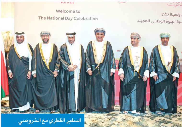
السفير القطري مع الخروصي