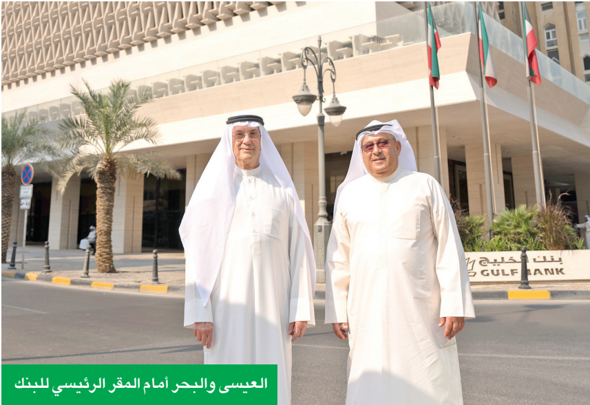
العيسى والبحر أمام المقر الرئيسي للبنك