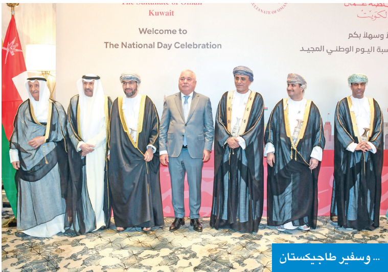
... وسفير طاجيكستان