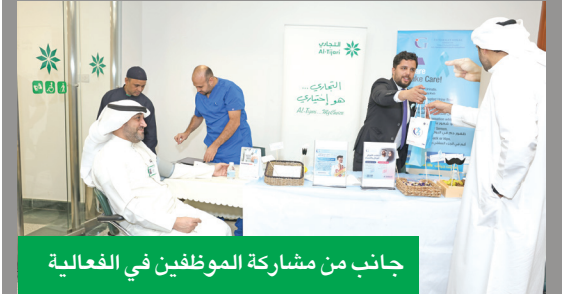
جانب من مشاركة الموظفين في الفعالية

بمناسبة شهر التوعية بصحة الرجل، والذي يصادف شهر نوفمبر من كل عام، وفي إطار جهوده التوعوية المستمرة للحفاظ على الصحة العامة وتعزيز الوعي بمرض سرطان البروستاتا وطرق الوقاية منه، نظم البنك التجاري الكويتي مجموعة من الأنشطة الصحية لموظفيه خلال شهر نوفمبر 2025.