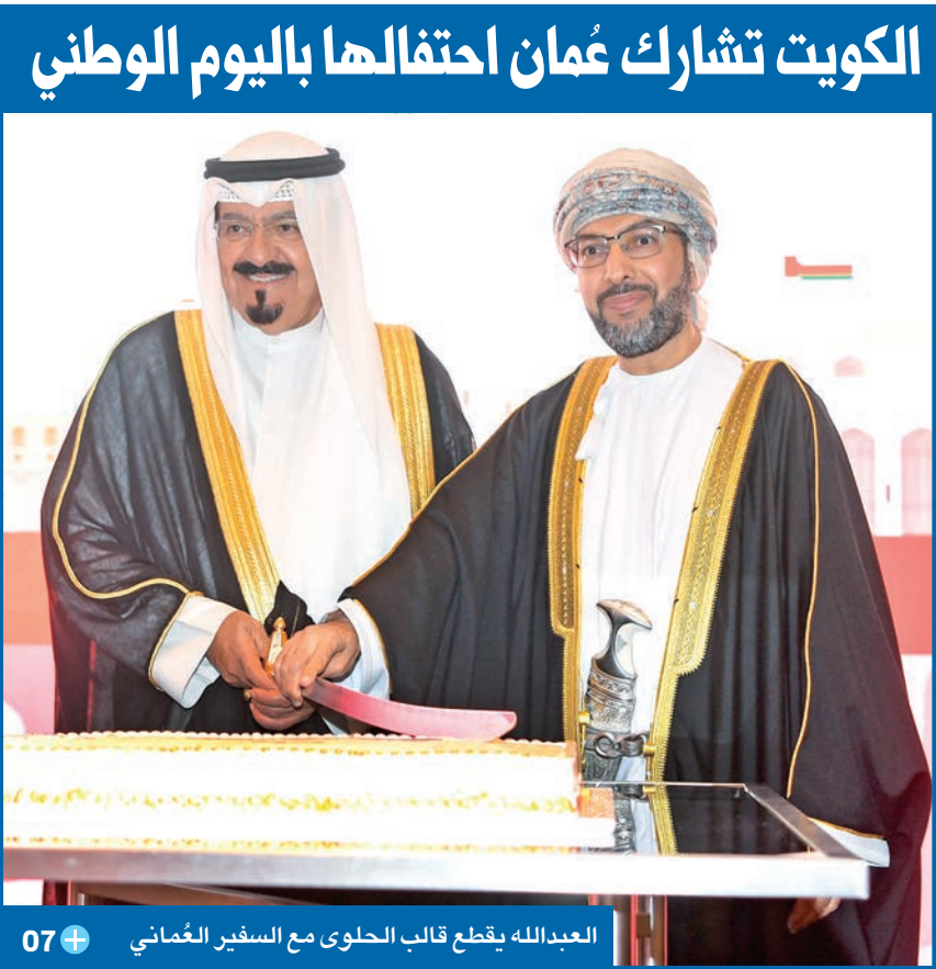
الكويت تشارك عُمان احتفالها باليوم الوطني العدالله يقطع قالب الحلوى مع السفير العُماني

● أضاف مادة توجب على الزوجة خدمة زوجها والاعتناء به وعدم الخروج من مسكنه إلا بإذنه ● ألفاظ مثل «عليّ الطلاق» و«عليّ الحرام» توجب الانفصال إذا كان القسم مقصوداً