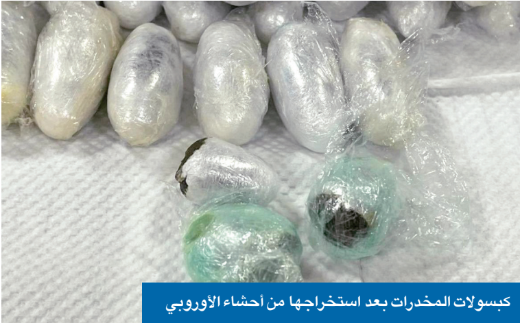
كبسولات المخدرات بعد استخراجها من أحشاء الأوروبي

وأكدت الجمارك أن هذا الإنجاز يعكس الجهود المتواصلة التي يبذلها رجال البحث والتحري الجمركي وجمارك المطار في التصدي لمحاولات تهريب