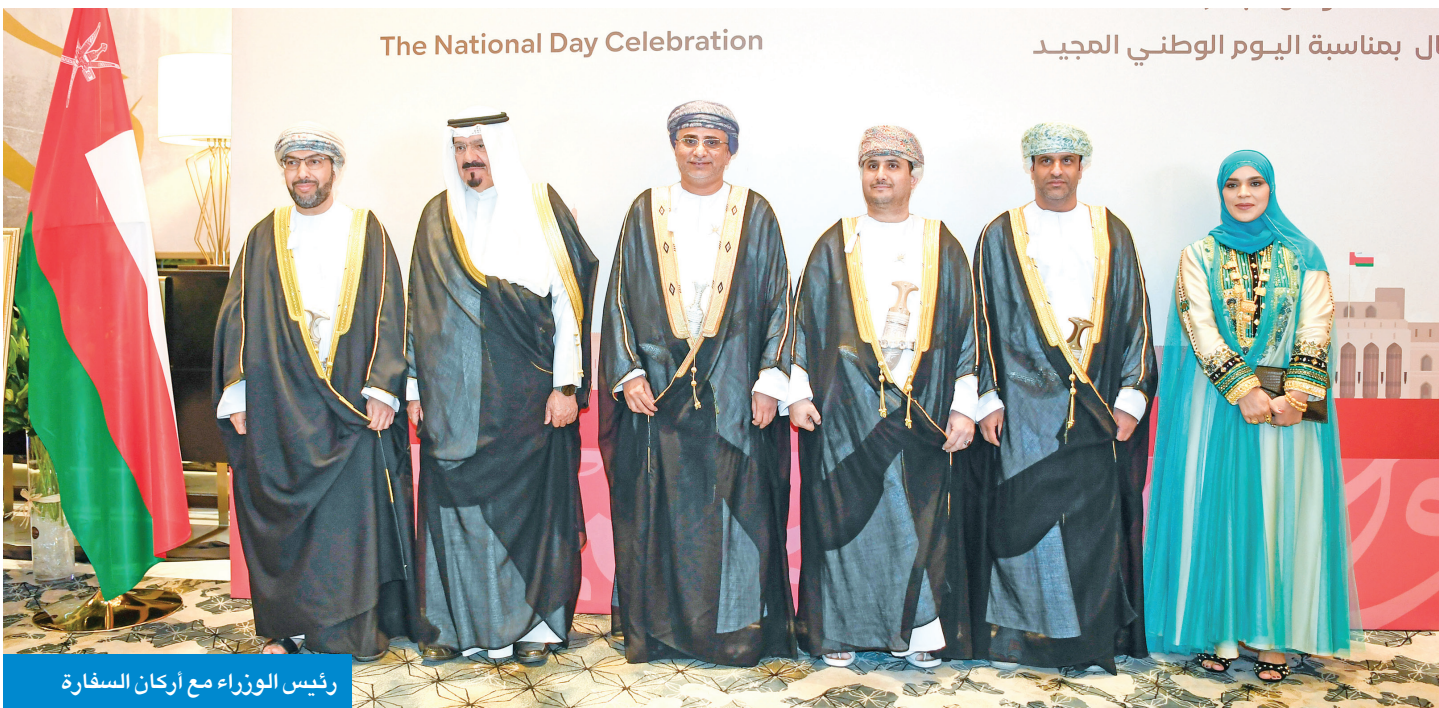
رئيس الوزراء مع أركان السفارة