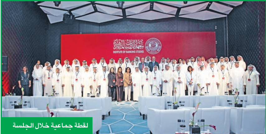
لقطة جماعية خلال الجلسة

حيث ضاعف مخرجاته التدريبية للقطاع المصرفي، وحقق نمواً لافتاً في تدريب غير المصرفيين ليصل عدد المتدربين الإجمالي إلى عدة آلاف سنوياً. وأفادت النيباري بأنه في المجالات الحساسة، كالتحول الرقمي والحوكمة ومكافحة غسل الأموال، نفذ المعهد عشرات الدورات المتخصصة وخزج مئات المختصين، وساهم في دعم البحث والابتكار من خلال إعداد دراسات نوعية وتشجيع خريجه على استكمال دراساتهم العليا في أعرق الجامعات، إضافة إلى تركيزه على تعزيز الجاهزية المهنية في مختلف المجالات، لمواجهة التحديات السيبرانية المتزايدة.