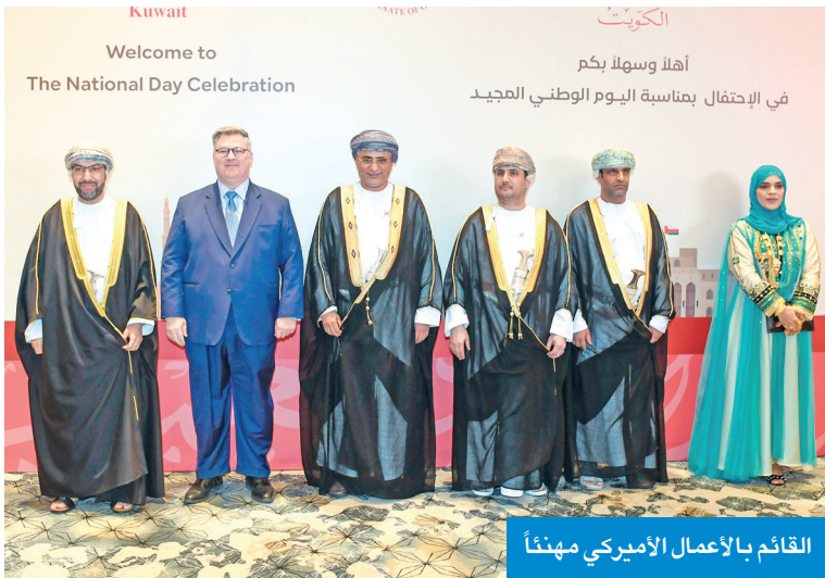
القائم بالأعمال الأميركي مهنئاً