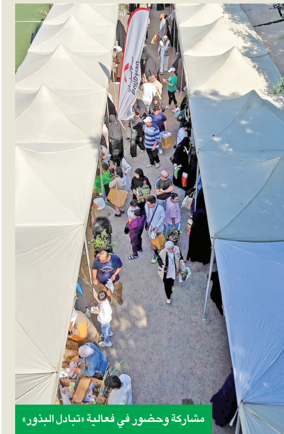
مشاركة وحضور في فعالية «تبادل البذور»

المبادرات والفعاليات التي تحمل قيمة مجتمعية، وتخلق أثراً إيجابياً، وتوفر تجارب تعليمية وتوعوية تعزز من