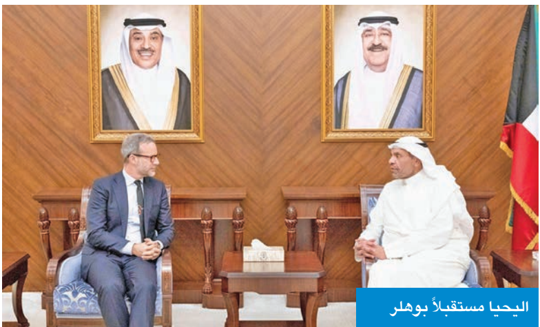
اليحيا مستقبلاً بوهلر

الكويت والولايات المتحدة، والشراكة الاستراتيجية الوثيقة القائمة بين البلدين الصديقين. وأضافت أنه جرى كذلك بحث آخر التطورات في المنطقة والمستجدات على الساحتين الإقليمية والدولية ومناقشة عدد من القضايا محل الاهتمام المشترك.