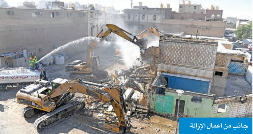
جانب من أعمال الإزالة

أزالت بلدية الكويت، عبر مقالوف الهدم، 9 عقارات سكن خاص، في منطقة جليب الشيوخ، أمس ، في أول إجراء بعد انتهاء المهلة المحددة لإخلاء 67 عقاراً في المنطقة، تمهيداً لهدمها خلال أسبوعين من تاريخ نشر قرار الهدم بالجزيرة الرسمية (الكويت اليوم). ونفذت البلدية عمليات الهدم، بحضور ممثلين من وزارات الداخلية والكهرباء والماء، والأشغال، وقوة الإطفاء، ووفقاً لتقارير المركز الحكومي للفحوصات وضبط الجودة والأبحاث التابع لوزارة الأشغال، الذي أشار إلى عدم سلامة المباني الواقعة في تلك العقارات المتهاكة والآيلة للسقوط، حفاظاً على الأرواح والممتلكات والسلامة العامة. وأكدت البلدية أن الإزالة ستتم حسب