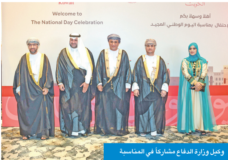
وكيل وزارة الدفاع مشاركاً في المناسبة