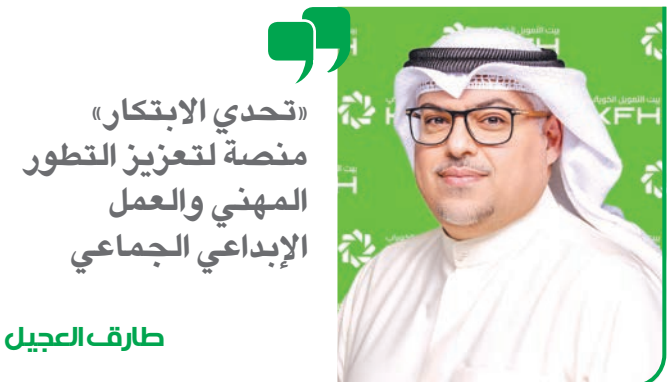
«تحدي الابتكار» منصة لتعزيز التطور المهني والعمل الإبداعي الجماعي

تجدر الإشارة إلى أن مسابقة «تحدي الابتكار» تأتي ضمن جهود «بيت التمويل» المستمرة لترسيخ ثقافة الابتكار، وتشجيع موظفيه على طرح أفكار جديدة تسهم في تطوير الأداء وتحسين جودة الخدمات المقدمة للعملاء.