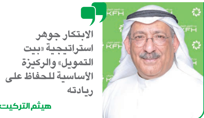
الابتكار جوهر استراتيجية «بيت التمويل» والركيزة الأساسية للحفاظ على ريادته

من جانبه، قدّم نائب المدير العام للتحوّل الرقمي والابتكار في «بيت