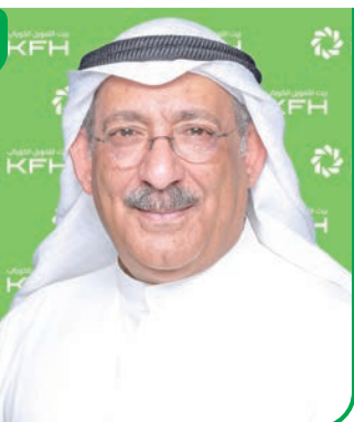
الابتكار جوهر استراتيجية «بيت التمويل» والركيزة الأساسية للحفاظ على ريادته

وأعرب عن خالص التهاني للفائزين، مثنياً مساهماتهم القيمة وروح المبادرة التي يتحلون بها، التي تُعد المحرك الرئيس لمواصلة مسيرة التطوير والابتكار. كما وجّه الشكر لإدارة التحوّل والتكنولوجيا والعمليات،