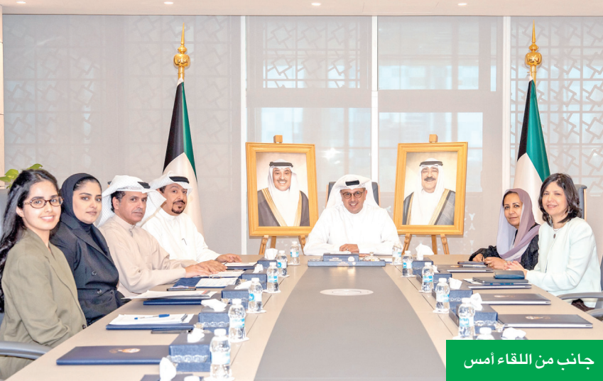
جانب من اللقاء أمس

لمكتب البنك الدولي مهامه في الكويت، كما بحث الجانبان تعزيز دعم البنك الدولي لإجراءات أجندة الإصلاحات الاقتصادية التي تنفذها دولة الكويت.