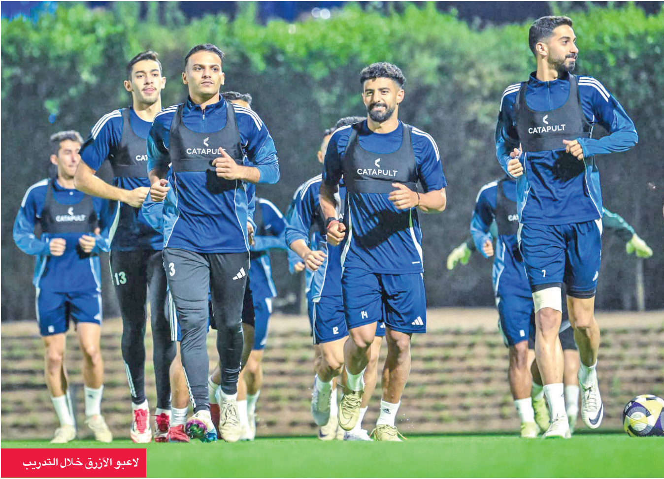
لاعبو الأزرق خلال التدريب