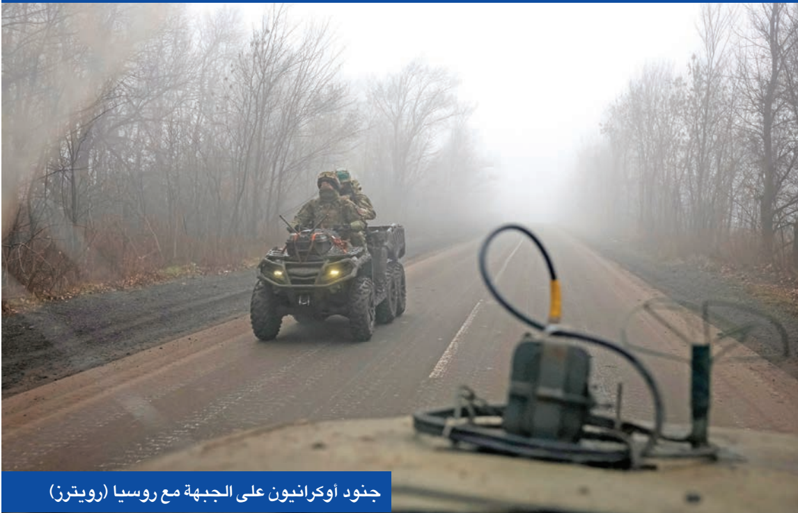
جنود أوكراينيون على الجبهة مع روسيا