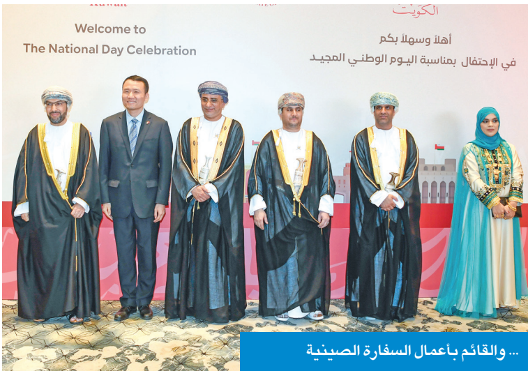
... والقائم بأعمال السفارة الصينية