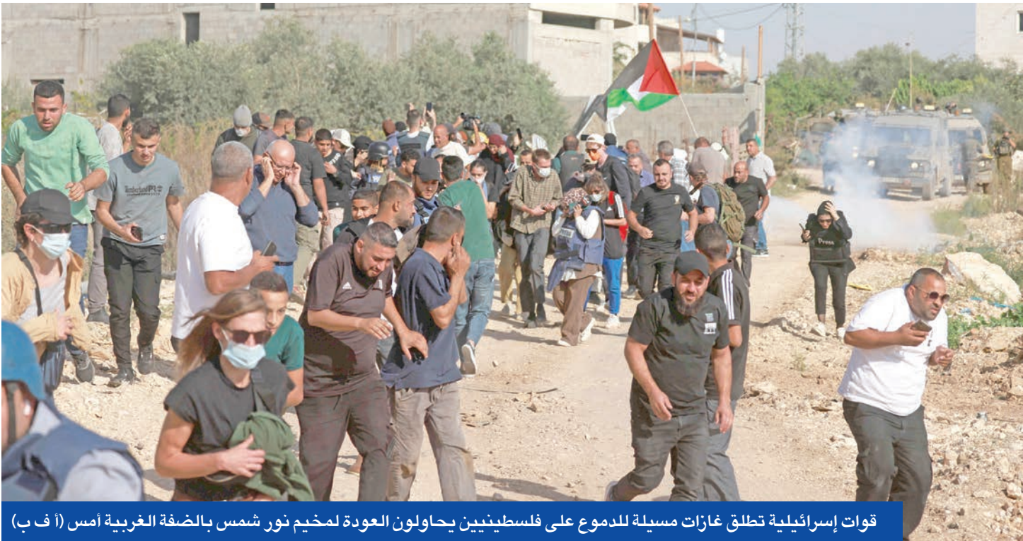
قوات إسرائيلية تطلق غازات مسيلة للدموع على فلسطينيين يحاولون العودة لمخيم نور شمس بالضفة الغربية أمس