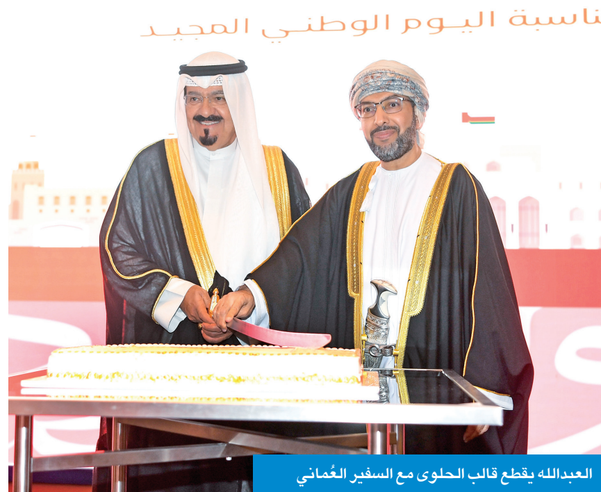
العدالله يقطع قالب الحلوى مع السفير العُماني