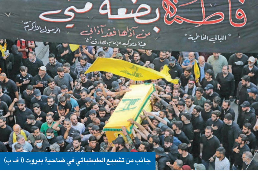
جانب من تشييع الطبباطي في ضاحية بيروت

طهران تتخوف من الضربة المقبلة وتنتظر زيارة مسؤول سعودي