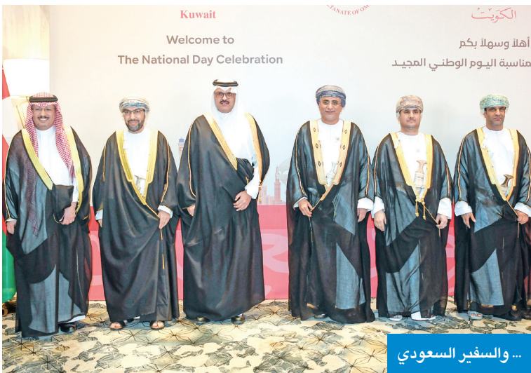
... والسفير السعودي