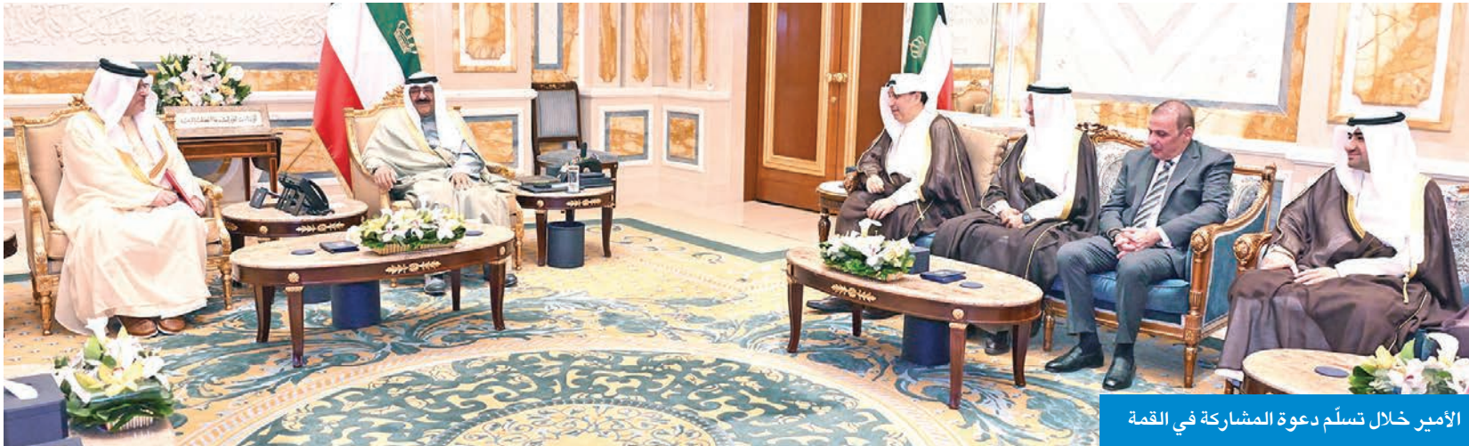
الأمير خلال تسلم دعوة المشاركة في القمة

تسلّم سمو أمير البلاد الشيخ مشعل الأحمد، بقصر بيان صباح أمس، رسالة خطية من ملك البحرين الشقيقة حمد بن عيسى، تضمنت دعوة سموه للمشاركة في اجتماع الدورة العادية السادسة والأربعين للمجلس الأعلى لمجلس التعاون، والمزمع عقده يوم الأربعاء 3 ديسمبر المقبل في البحرين. قام بتسليم الرسالة لسموه سفير مملكة البحرين لدى الكويت صلاح المالكي. حضر المقابلة وزير شؤون الديوان الأميري، الشيخ حمد الجابر، ومدير مكتب صاحب السمو الفريق المتقاعد جمال الزياب، ووكيل الديوان الأميري الشيخ عبدالعزيز المشعل، ووكيل الشؤون الخارجية بالديوان الأميري مازن العيسى.