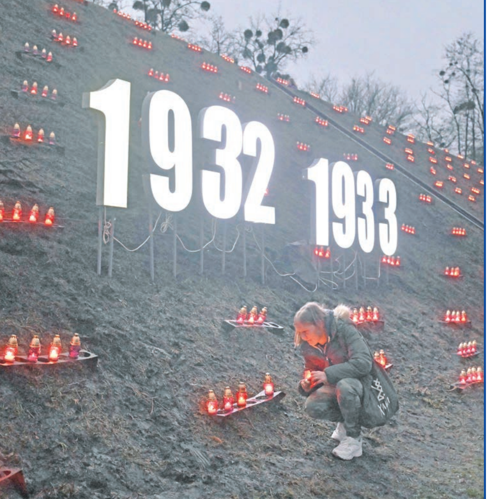
أوكرانية خلال إحياء ذكرى مجاعة 1932 - 1933 التي أودت بحياة نحو 4 ملايين أوكراني في عهد ستالين

وجاءت اجتماعات جنيف وسط فوضى سياسية متصاعدة في واشنطن عقب تضارب المواقف الأميركية بشأن الخطة. فقد أكد 3 من أعضاء مجلس الشيوخ، الجمهوري مايك راوذن، والمستقل أنغوس كينغ، والديمقراطية جين شاهين، أن الوزير روبيو أبلغهم بأن الخطة ليست موقفاً رسمياً للولايات المتحدة، بل تمثل مقترحات روسية نُقلت إلى واشنطن وتبدو أقرب إلى «قائمة أمنيات روسية». وأثار هذا التصريح استغراباً إضافياً بعدما أفاد تقرير لوكالة رويترز بأن روبيو استبعد من جزء أساسي من المشاورات التي وضعت خلالها الخطة في ميامي، والتي حضرها ويتكوف وصهر ترامب جاري كوشنر، ورئيس صندوق الاستثمار المباشر،