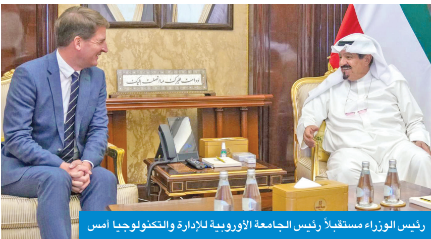
رئيس الوزراء مستقبلاً رئيس الجامعة الأوروبية للإدارة والتكنولوجيا أمس

في مجال آخر، بعث سمو رئيس مجلس الوزراء بترقية تعزية إلى الملك البحريني حمد بن عيسى آل خليفة ضمنها سموه خالص تعازيه وصادق مواساته بوفاة المغفور له بإذن الله تعالى الشيخ إبراهيم بن حمد بن عبدالله آل خليفة. وبعث سمو رئيس مجلس الوزراء بترقية تهنئة إلى الرئيس اللبنانية العماد جوزاف عون بمناسبة ذكرى استقلال بلاده.