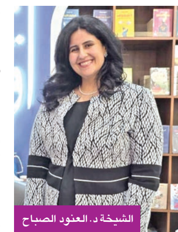
الشبيخة د. العنود الصباح

ورغم أن الكتاب الجديد هو ثاني أعمالها المنشورة، أكدت أنه يُمثّل