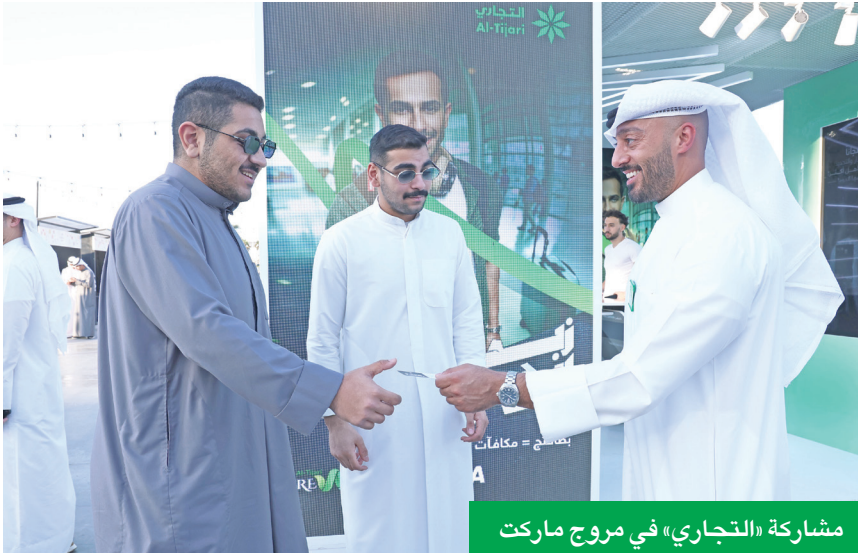
مشاركة «التجاري» في مروج ماركت

لمرة واحدة (OTP) مع أي أحد، والحصول على الخدمات المصرفية فقط من الجهات المعتمدة والخاضعة لرقابة بنك الكويت المركزي لتجنب الوقوع في فخ الاحتيال. وجاءت مشاركة البنك في هذه الفعالية ضمن استراتيجية الحافل بالبنوك الواعي بالمزايا والخدمات