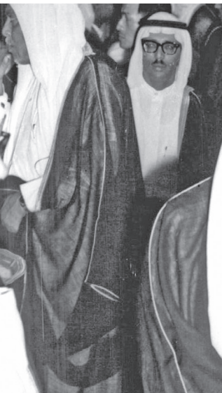
خلال حفل استقبال بجدة ويظهر صاحب السمو الملكي الأمير مشعل بن عبدالعزيز أمير منطقة مكة المكرمة بمناسبة زيارة وفد غرفة تجارة وصناعة الكويت لجدة في 1966م يرأسه عبدالعزيز حمد الصقر -عضوية حمود الزيد الخالد وعبدلطيف يوسف النصف وأحمد الصالح الشايع وعبدالمحسن فيصل الثويني بحضور السفير عيسى العبدالجليل وسليمان الفصام وأعضاء السفارة

وكان السفير الكويتي لدى المملكة العربية السعودية هو السيد عيسى عبداللطيف العبدالجليل (رحمه الله)، وهو أول شخص يصدر له مرسوم