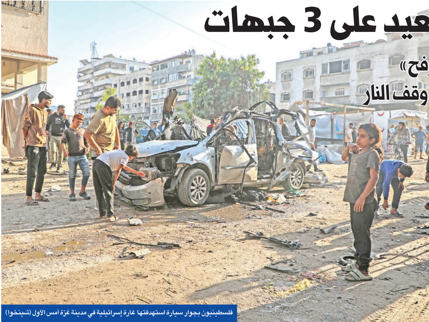
فلسطينيون بجوار سيارة استهدفتها غارة إسرائيلية في مدينة غزة أمس الأول (شينخوا)

مصادر أميركية عن تقليص الولايات المتحدة حضورها العسكري داخل مركز تنسيق، مراقبة اتفاق غزة، الذي أقامته في بلدة إسرائيلية، بهدف إخضاع المقر المشترك لـ«مجلس السلام» المزعم إنشاؤه قريباً برئاسة الرئيس الأميركي دونالد ترامب. وبينما تحدثت أوساط إسرائيلية عن أن واشنطن قد تستغرق أسابيع أو عدة أشهر لاتخاذ قرار بتشكيل قوة الاستقرار ونشرها بالقطاع، صرح الرئيس التركي رجب طيب أردوغان بأن بلاده ستقيم كيف يمكن نشر قوات أمن ضمن القوة متعددة الجنسيات في غزة وستتخذ القرار بعدها.