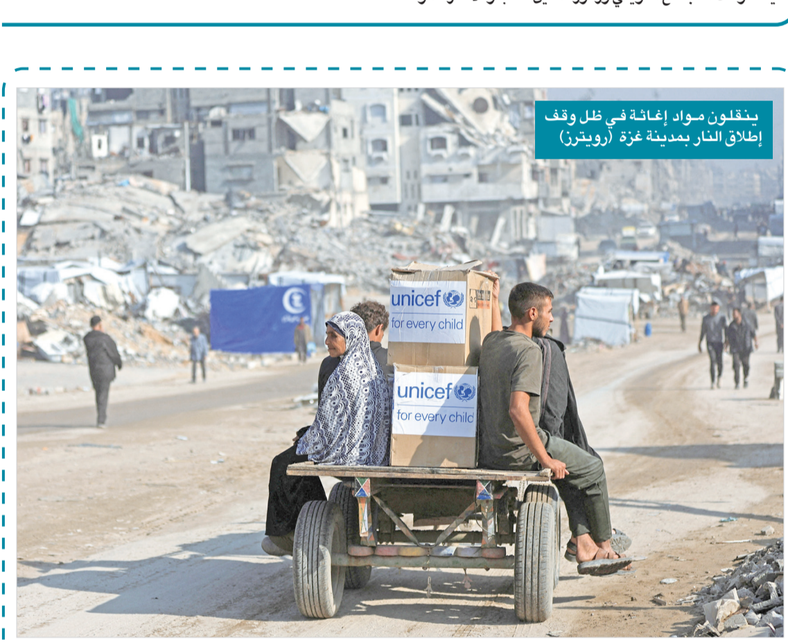
يتقلون سواد إغاثة في ظل وقف إطلاق النار بمدينة غزة