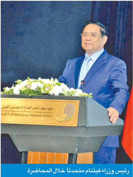
رئيس وزراء فيتنام متحدثا خلال المحاضرة

لفيتنام ورؤيتها للعلاقات الفيتنامية - الكويتية، أمس، في معهد سعود الناصر الدبلوماسي، بحضور عدد من السفراء والدبلوماسيين والأكاديميين، أن القيم المشتركة، المتمثلة في رفض الحروب، والسعي إلى التنمية، والتمسك بالسيادة والاستقلال، هي التي تقرب بين هاتوي والكويت، وتفتح آفاقاً أوسع لتعميق الشراكة الاستراتيجية، خصوصاً في مجالات الطاقة، والأمن الغذائي، والاستثمار، والتعليم، والتعاون العلمي والتكنولوجي. وعبر قام عن بالغ امتنانه لسمو أمير البلاد وسمو رئيس مجلس الوزراء والشعب الكويتي على حفاوة الاستقبال