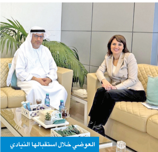
العوضي خلال استقبالها النيابي

بحثت رئيسة المركز الوطني للأمن السيبراني، م. غير العوضي، أمس، وسفير دولة الإمارات لدى البلاد، د. مطر النياي، أوجه التعاون المشترك وتعزيز العلاقات الثنائية في مجالات الأمن السيبراني.