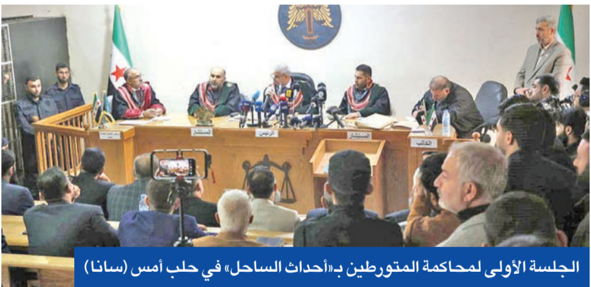
الجلسة الأولى لمحكمة المتورطين بـ«أحداث الساحل» في حلب أمس

إلى ذلك، أجرى وفد مشترك من وزارتي الدفاع السورية والروسية جولة ميدانية شملت تفقّد عدد من النقاط والمواقع العسكرية في الجنوب السوري، وسط معلومات عن اقتراح روسي بإعادة الدوريات الروسية للفرسية القوات السورية والقوات الإسرائيلية التي تحتل عدة نقاط في جنوب سورية. وكانت القوات الروسية أدت سابقاً هذا الدور خلال الصراع السوري بين عامي 2011 و2024.