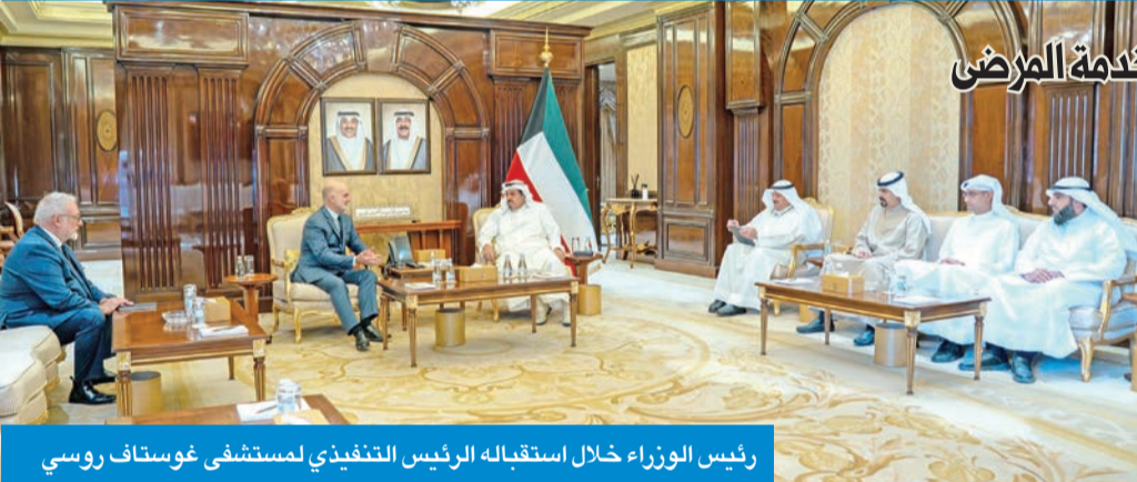
رئيس الوزراء خلال استقبله الرئيس التنفيذي لمستشفى غوستاف روسي