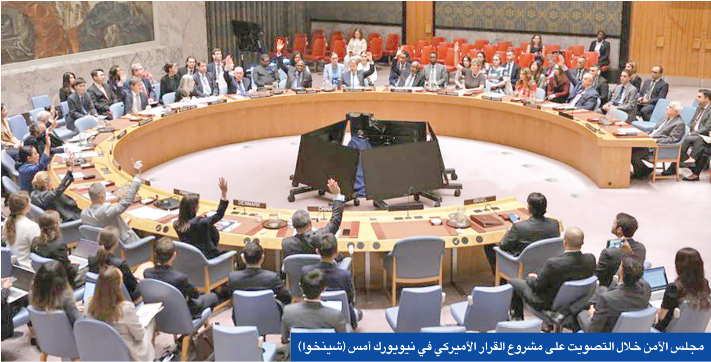
مجلس الأمن خلال التصويت على مشروع القرار الأميركي في نيويورك أمس