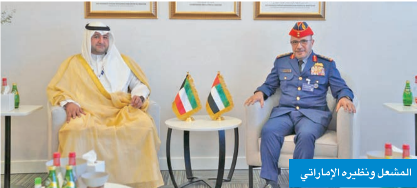
المشعل ونظيره الإماراتي

وجرى خلال الاستقبال بحث سبل تعزيز التعاون المشترك وتنسيق الجهود وتبادل الخبرات.