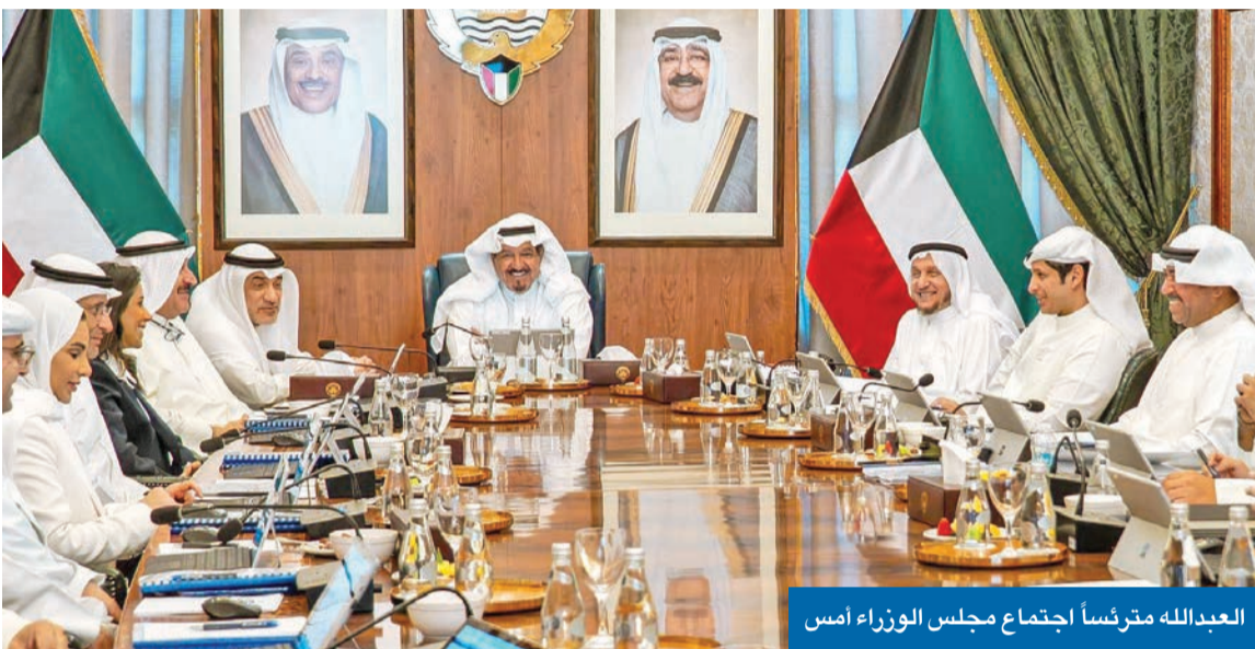
العبالله مترئساً اجتماع مجلس الوزراء أمس

سفير فرنسا: شراكة تمتيزة مع الكويت في مجال الصحة « 03