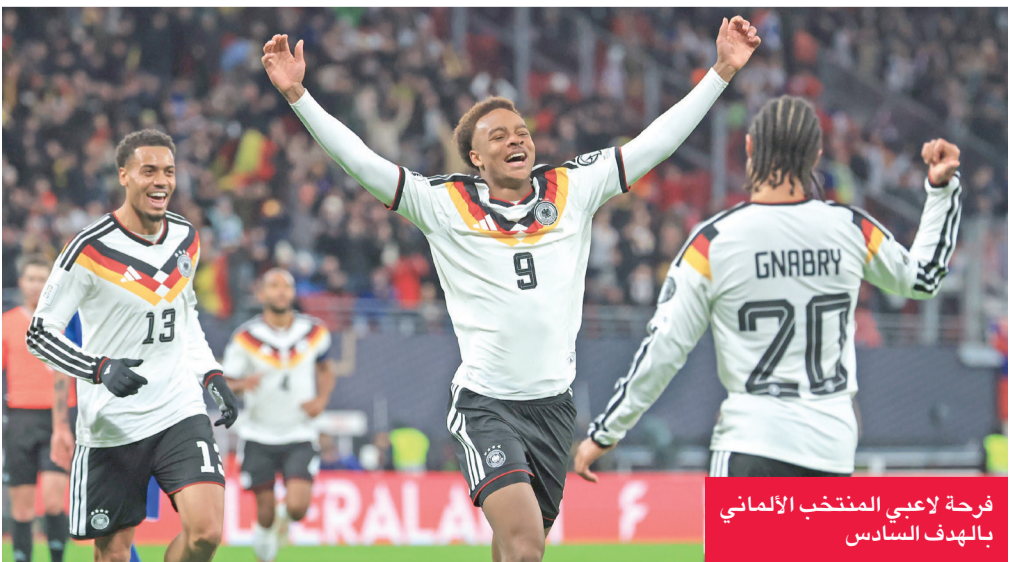
فرحة لاعبي المنتخب الألماني بالهدف السادس

وكان مبابي رحل في صفقة انتقال حر إلى ريال مدريد الإسباني، بعد نهاية عقده مع «البي إس جي» في يونيو 2024. (إفي)