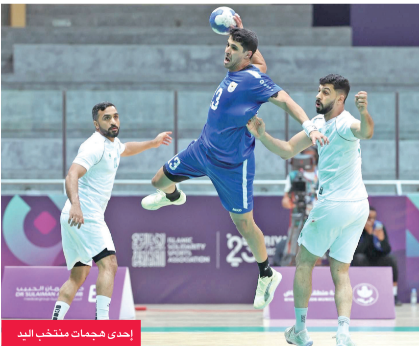
إحدى هجمات منتخب اليد

ودّع منتخب الكويت لكرة اليد منافسات دورة ألعاب التضامن الإسلامي، بعد خسارته في مباراته أمام المنتخب السعودي بنتيجة 20-21، ليحل الأزرق في المركز الثالث خلف المتصدر المنتخب السعودي، والوصيف المنتخب البحريني.