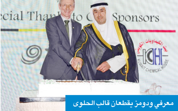
معرفي ودومن يقطعان قالب الحلوى

كويتية قوية في بلجيكا من خلال أكثر من 500 محطة بنزين تديرها شركة البترول الكويتية العالمية Q8، كما تشارك أيضاً الشركة بشكل كبير في قطاع البتروكيماويات الذي يقع في ميناء أنتويرب. وقال: «أعترم تعزيز التواصل بين الناس والتدفقات التجارية بين بلجيكا والكويت، ومن أجل النجاح في هذا المشروع، يجب أن نتجاوز عقبة مهمة، وأنا أشير إلى عدم وجود رحلات مباشرة بين بروكسل والكويت، وسأستمر في العمل على هذا الملف الحاسم».