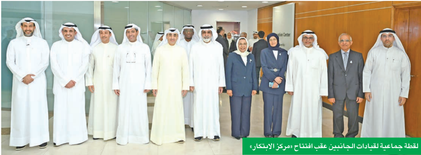
لقطة جماعية لقيادات الجانبين عقب افتتاح «مركز الابتكار»

حاضنة لتعزيز التعليم والابتكار لدى الشباب الكويتيين تتويجاً للشراكة الاستراتيجية بين الجانبين