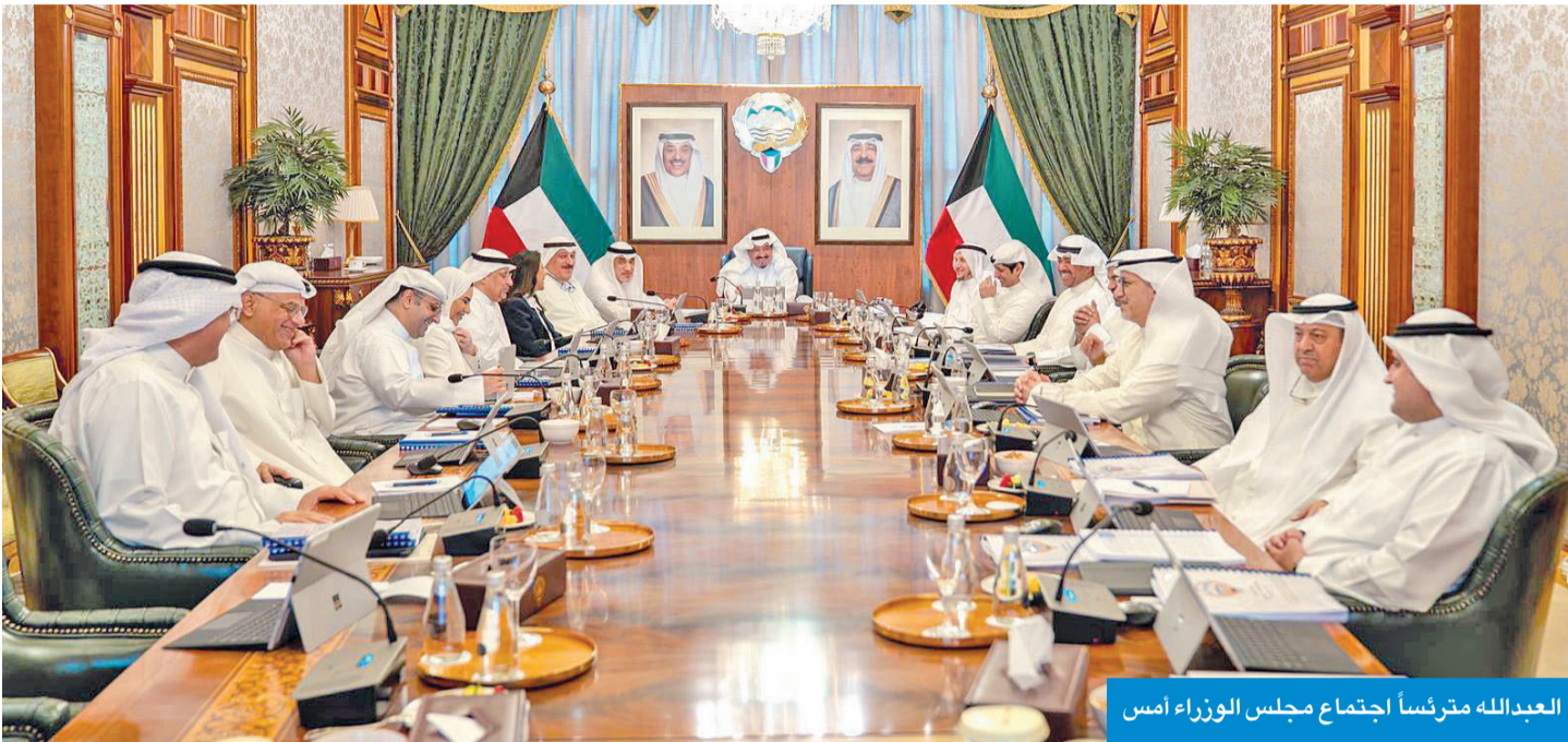
العبدالله مترئسا اجتماع مجلس الوزراء أمس

اطلع على آخر مستجدات منطقة العبدلي الاقتصادية ومشاريع «الاستثمار المباشر»