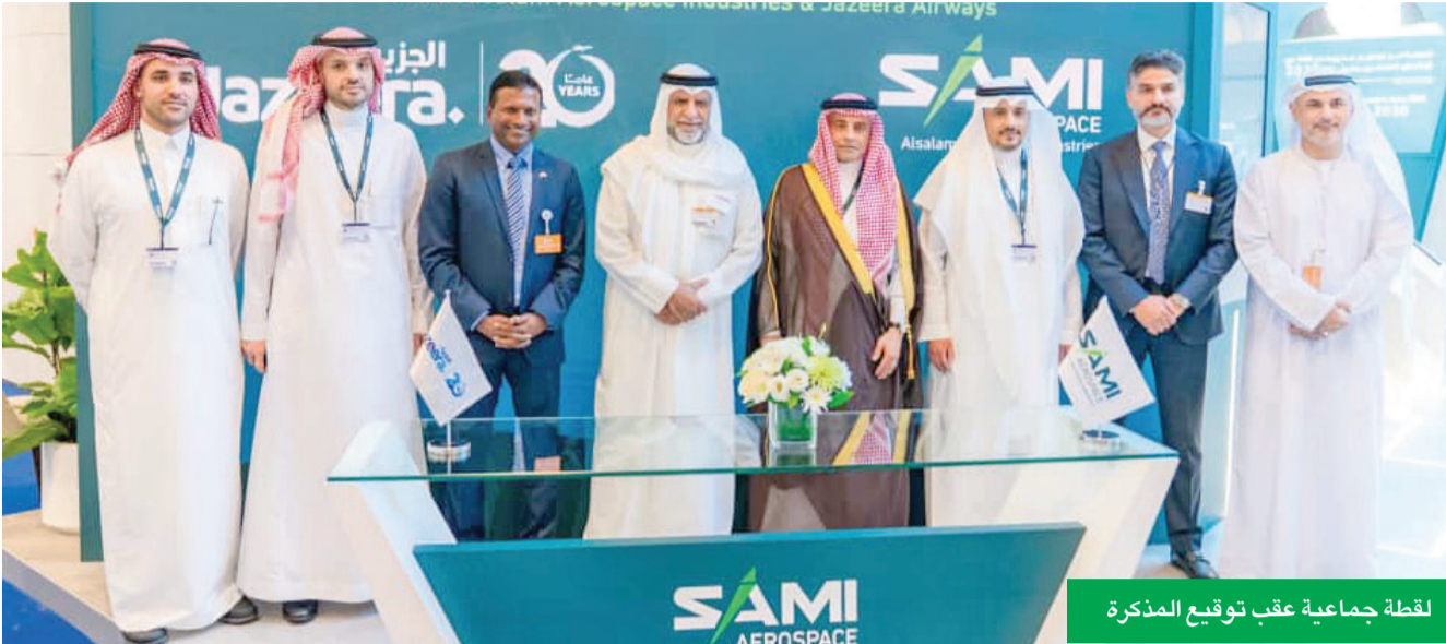
لقطة جماعية عقب توقيع المذكرة