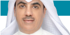
د. سعد الطامي

على الرغم من ابتعاده لاحقاً عن العمل السياسي، فقد ظلّ الراحل مرجحاً يُستشار من قبل نواب وسياسيين ومواطنين، لما عُرف عنه من حكمة ورؤية وطنية صادقة، ومن لم يقابله تعرّف على ملامح هذا الوجه الضارب في جذور تاريخ الكويت من خلال العزاء الذي شارك فيه مكونات المجتمع الكويتي ورموزه الذين تسابقوا لـعزاء الوالد