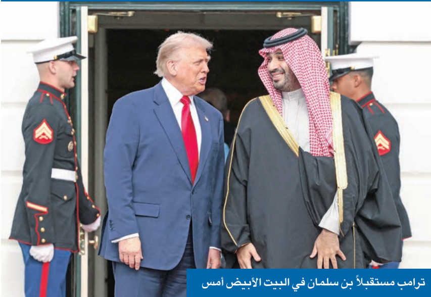
ترامب مستقبلاً بن سلمان في البيت الأبيض أمس

ومن شأن إتمام صفقة الـ «إف 35» أن يمثل تحولاً كبيراً في توازن القوى العسكرية في الشرق الأوسط، ويعزز قدرات المملكة وخلفها دول مجلس التعاون الخليجي في الدفاع عن أجوائها وردع أي محاولات للاعتداء. وكشف مسؤول اميركي أن الزيارة ستضمن توقيع اتفاقات دفاعية، وسيتم الإعلان عن استثمار سعودي - اميركي بالبنية التحتية للذكاء الاصطناعي واتفاق بين الولايات المتحدة والسعودية في مجال الطاقة النووية المدنية.