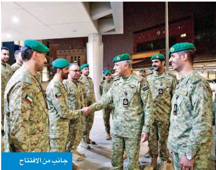
جانب من الافتتاح