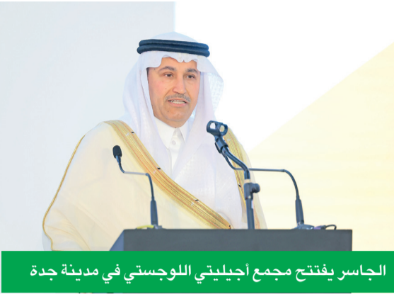
الجاسر يفتتح مجمع أجيليتي اللوجستي في مدينة جدة

السعودية 2030، وقد تم تصميم مجمع أجيليتي اللوجستي في جدة ليواكب هذا الزخم، إذ يوفر منشآت حديثة ومستدامة تمكّن شركات التصنيع والموزعين والشركات الرقمية من التوسع بكفاءة عالية، مع جاهزية كاملة لاحتضان مراكز البيانات، بما يتماشى مع طموحات المملكة في تطوير بنيتها التحتية الرقمية. وإضافة إلى مجمع أجيليتي الجديد في جدة، تدبر شركة «أجيليتي للمجمعات اللوجستية» أحد أكثر المجمعات اللوجستية تطوراً في الشرق الأوسط بالرياض بمساحة 871 ألف متر مربع، ومجمعا آخر في الدمام بمساحة 200 ألف متر مربع. وعلى صعيد الرياض، تعمل الشركة حالياً على تنفيذ مشروع توسعة بقيمة 250 مليون ريال سعودي، سيضيف إضافة 100 ألف متر مربع من المستودعات من الفئة (أ)، ليصل إجمالي مساحة الموقع إلى أكثر من 550 ألف متر مربع، مما يدعم العمل اللوجستي بالمملكة والحراك الاقتصادي ويسهم في توليد المزيد من الفرص الوظيفية.