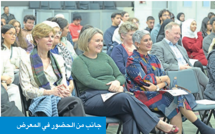
جانب من الحضور في المعرض

تمكين الطلبة من قيادة مبادرات استخدام وتجريب الأدوات المتقدمة التي تعيد تشكيل طرق التعلم والتفاعل مع العالم. وأعلنت رئيسة الجامعة، د. روضة عواد، عن منح الطلبة المشاركين حرية الوصول إلى منصة ChatGPT، من خلال شراكة الجامعة مع شركة OpenAI، بما يتيح لهم مواصلة تطوير مشاريعهم، علماً أن الجامعة الأمريكية في الكويت تعد أول مؤسسة تعليمية بالكويت تعقد شراكة مع OpenAI في مجال التعليم، مما يعزّز موقعها الريادي في الابتكار ودمج التكنولوجيا في العملية الأكاديمية.