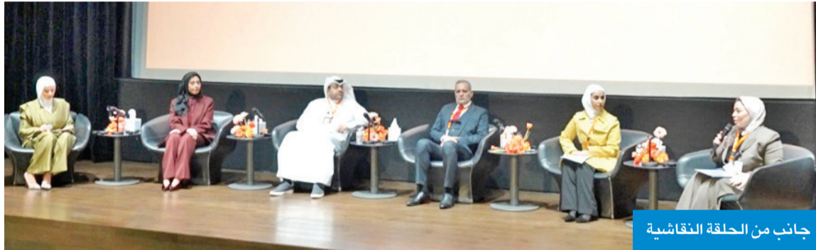
جانب من الحلقة النقاشية