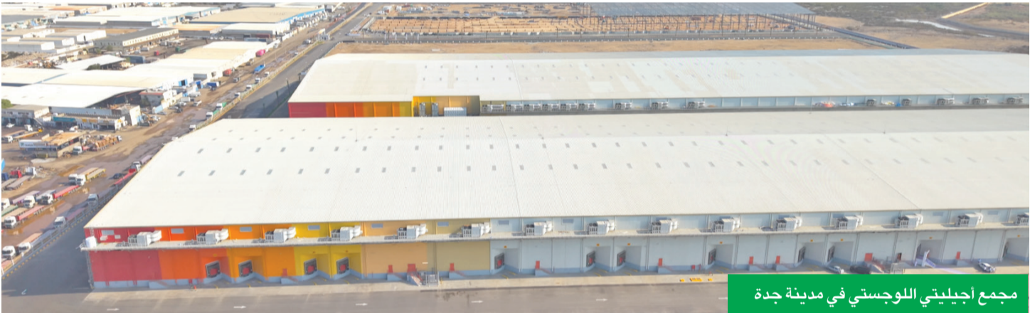
مجمع أجيليتي اللوجستي في مدينة جدة

وبهذه المناسبة، قال الوزير الجاسر إن «الاستثمارات المتنابهة من القطاع الخاص العالمي والمحلي في قطاع الخدمات اللوجستية وسلاسل الإمداد، تعكس جاذبية القطاع اللوجستي السعودي، الذي شهد حزمة من الاستثمارات الواسعة والمتتالية من كبرى الشركات اللوجستية العالمية، جراء الإصلاحات الهيكلية الواسعة، والنمو الكبير في العمليات التشغيلية وارتفاع معدلات الأداء والقوة التنموية في مشاريع البنى التحتية في القطاع اللوجستي، بدعم خادم الحرمين الشريفين وسمو ولي العهد». وأشار إلى الشراكة