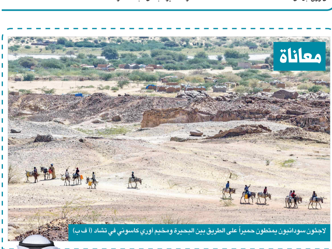
لاجئون سودانيون يمتطون حميراً على الطريق بين البحيرة ومخيم أوري كاسوتي في تشاد