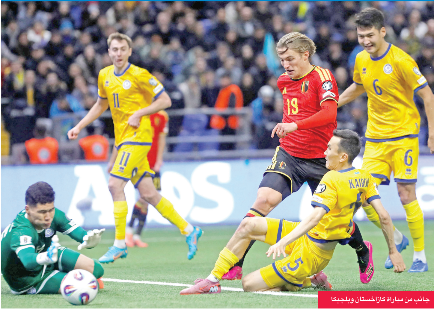
جانب من مباراة كازاخستان وبلجيكا

مباراته ضمن الجولة السادسة والأخيرة أمام كوسوفو للحق بركب المتأهلين، علماً أن تأهله شبه محسوم نظرياً حتى ولو خس، بسبب أفضليته الهائلة في فارق الأهداف مقارنة بمنافسته (12+ مقابل 1+).