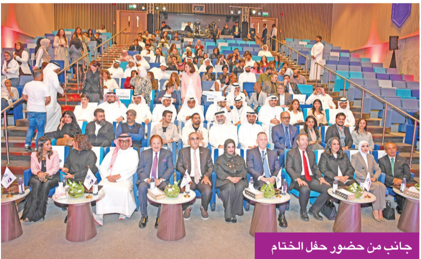
جانب من حضور حفل الختام