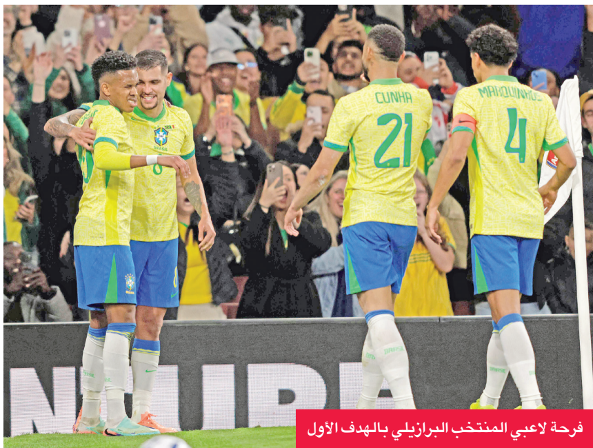
فرحة لاعبي المنتخب البرازيلي بالهدف الأول

وحظي لاعبو المكسيك بفرص تهديفية أفضل في الشوط الأول من المباراة، لكن افتقار كل من راؤول خيمينيز وإرفينغ لورازنو وروبرتو ألفارادو إلى الفعالية الهجومية، لذا لم تكن متفوقين على أوروبا، لكننا لم نستحق الخسارة أيضاً».