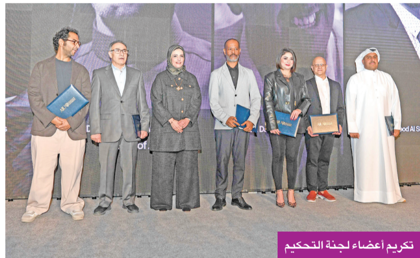
تكريم أعضاء لجنة التحكيم