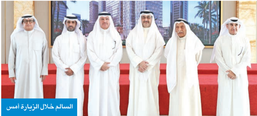
السالم خلال الزيارة أمس

وأشاد بالجهود المبذولة من القائمين على المشروع، مؤكدا حرص المحافظة على متابعة تنفيذ المشاريع التنموية التي تخدم المجتمع وترتقي بالمشهد التنموي والاقتصادي للعاصمة.