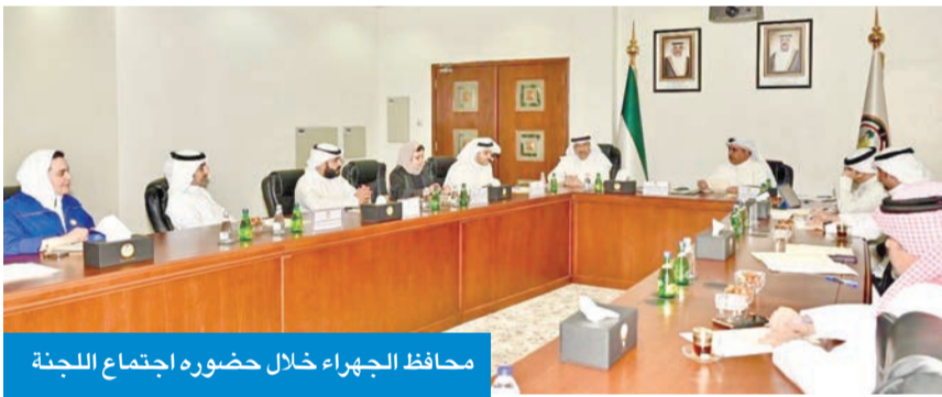
محافظ الجھراء خلال حضوره اجتماع اللجنة

بالجھراء والمناطق المحيطة بها، إضافة إلى تكليف العضو المختص بالتنسيق مع الجهات الحكومية المعنية لتقييم المداخل والمخارج الحالية بما يساهم في تحسين انسيابية الحركة المرورية. كما تابعت اللجنة القرارات والتوصيات السابقة المتعلقة بملف الخفاطة العامة في المحافظة، وآلية التعامل مع السياح في المنطقة، واستحداث وتطوير مرمرات للمشاة في عدد من مناطق المحافظة.