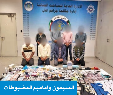
المتهمون وأمامهم المضبوطات

ولفت إلى أنه باستكمال إجراءات البحث تبين قيام مقيم من الجنسية الآسيوية بعمل في أحد المراكز الصحية الحكومية باستغلال وظيفته في سرقة الأدوية وبيعها للمتهمين، ليصل مجموعهم إلى 8 أشخاص من الجنسية الآسيوية. وأكدت «الداخلية» أنه تم اتخاذ الإجراءات القانونية اللازمة ضد المتهمين، والتنسيق مع الرقابة الدوائية في وزارة الصحة، للحفاظ على الأدوية المضبوطة.