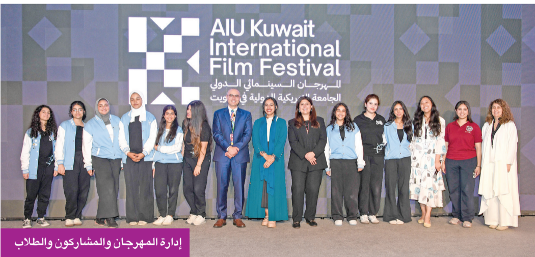
إدارة المهرجان والمشاركون والطلاب

وأضافت أن الطلبة المشاركين في ورش العمل أظهروا شغفاً كبيراً لمعرفة تقنيات البناء السينمائي، وتوظيف الذكاء الاصطناعي، ما يعكس تعاطف الجيل الجديد لصناعة الأفلام على أسس احترافية. من جانبها، أكدت المؤلفة والمخرجة فاطمة الشامسي أن دعم المهرجانات السينمائية في الخليج خطوة ضرورية لاستمرار الإبداع في السينما المستقلة،