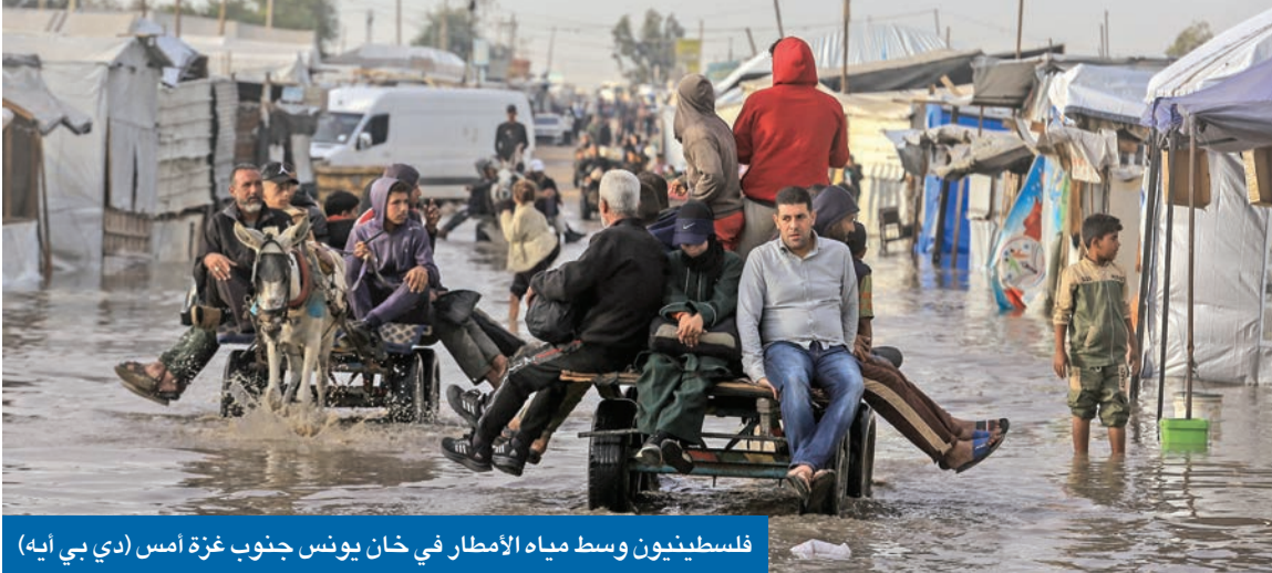
فلسطينيون وسط مياه الأمطار في خان يوش جنوب غزة أمس