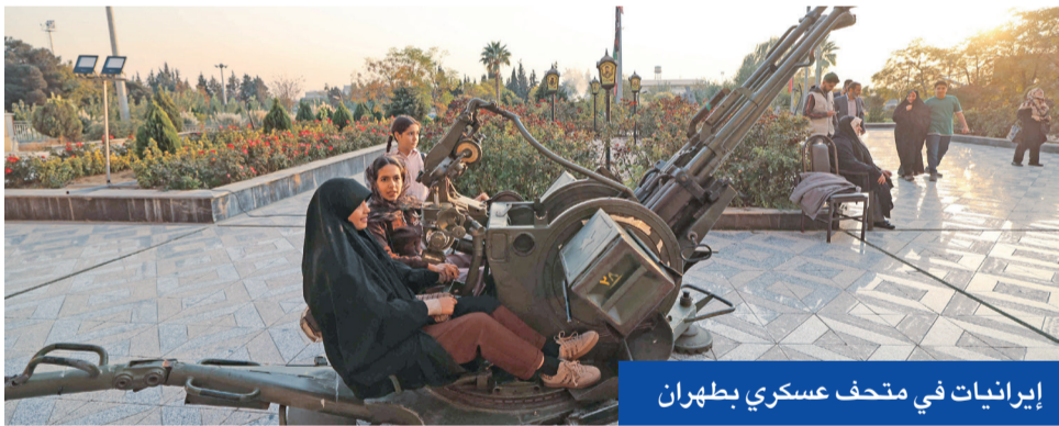
إيرانيات في متحف عسكري بطهران

أكدت إيران، أمس، احتجاز الحرس الثوري لناقلة في مياه الخليج تحمل شحنة من البتروكيماويات كانت في طريقها إلى سنغافورة، بسبب ما قالت إنها مخالقات. وكان مسؤول أميركي ومصادر أمنية بحرية قالت، أمس الأول، إن القوات الإيرانية اعترضت ناقلة منتجات نفطية، وحولت مسارها إلى المياه الإقليمية الإيرانية.