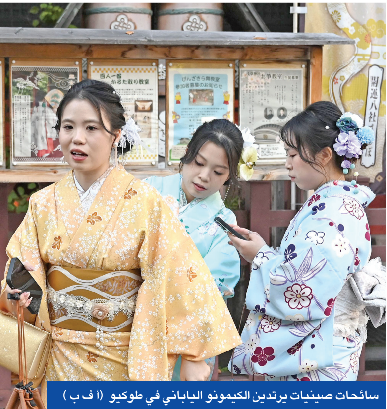
ساحات صينيات يرتدين الكيمونو الياباني في طوكيو

ويعتد ردود صينية ذمينة لتلك التصريحات، استدعت بكين قبل نهاية الأسبوع السفير الياباني لديها، للاحتجاج رسمياً على التدخل في شؤونها الداخلية، قبل أن تدعو رعاياها إلى تجنب السفر إلى اليابان، التي تعتبر مقصداً رئيسياً للكثير من السياح الصينيين. وكانت طوكيو استدعت بدوره السفير الصيني لديها، احتجاجاً على تدوينة على وسائل التواصل الاجتماعي لعضل الصين في أوساكا، علق فيها على تصريحات تاكايتشي بالقول: «إذا مدّدت ذلك العنق القدر إلى مكان لا يحصنك فسيتخ قطعته فوراً»، وقام القنصل بحذف تلك التغريدة بعد ساعات.