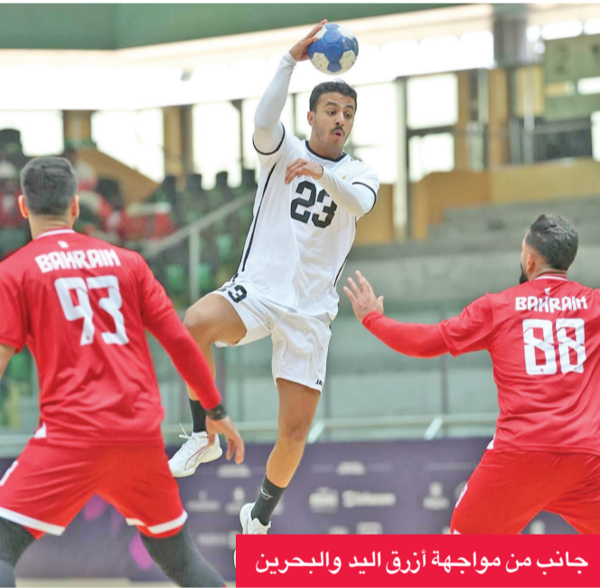
جانب من مواجهة أزرق اليد والبحرين

يخوض المنتخب الوطني لكرة اليد مباراته الثانية أمام منتخب العراق في الثانية ظهر اليوم، ضمن منافسات المجموعة الثانية من دورة ألعاب التضامن الإسلامي السادسة، والمقامة في الرياض حتى 21 الجاري. ويسعى المنتخب الوطني إلى تحقيق الفوز في المباراة، من أجل تعويض خسارته في مباراته الأولى أمام منتخب البحرين بنتيجة 27-28، وكان منتخبنا قد أضعاف فرصة التعادل عندما لم ينجح في تسجيل رمية الجزاء في الثواني الأخيرة من اللقاء الذي انتهى بتفوق المنتخب البحريني الذي يعد من أقوى المنتخبات في الدورة الحالية. وتضم مجموعة الكويت، إلى جانب البحرين، منتخب السعودية والعراق، ويأمل الجهاز الفني والإداري للمنتخب الوطني لتقديم اللاعبين أفضل مستوياتهم، والظهور بشكل يليق بسمعة كرة اليد الكويتية، وحصد نقاط المباراة من أجل المنافسة على التأهل للدور الثاني والحصول على مركز متقدم في الدور الرئيسي (المجموعة).