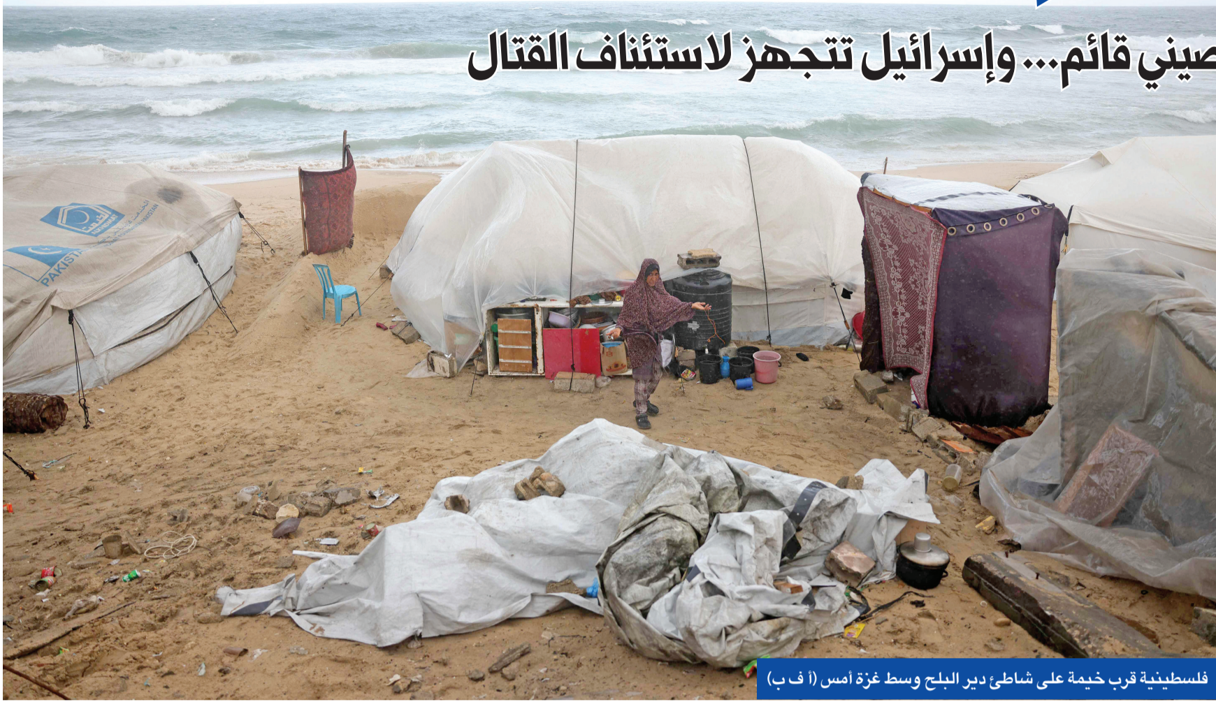
فلسطينية قرب خيمة على شاطئ دير البلح وسط غزة أمس (ا ف ب)

مع وصول خطة الرئيس الأميركي دونالد ترامب الرامية لإنهاء حرب غزة وإعادة اعمار القطاع إلى وضع حرج ينذر بحدوث فراغ خطير يهدد صمود وقف إطلاق النار الهش بين «حماس» وإسرائيل، اختارت واشنطن دفع مشروع قرارها المتعلق بمستقبل المنطقة الفلسطينية المنكوبة الذي يتضمن بنوداً في مقدمتها نشر قوة متعددة الجنسيات وتشكيل هيئة دولية للإشراف على إدارتها للتصويت في مجلس الأمن الدولي، وسط تسريبات عن تحفظ عدة دول عنه، واستعداد روسيا والصين للتصويت ضده.