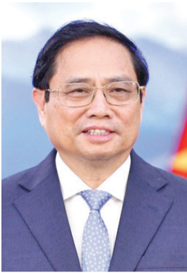
قام مينه تشينه

أول زيارة من نوعها منذ 16 عاماً يلتقي خلالها الأمير وولي العهد