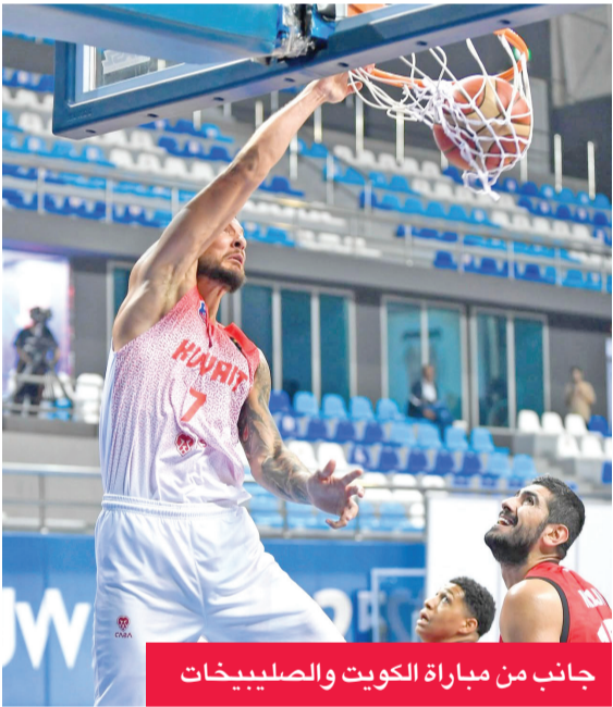
جانب من مباراة الكويت والصليبيخات

حقق فريق الكويت فوزه الرابع على التوالي في الدوري العام لكرة السلة على حساب الصليبيخات بنتيجة 94-123، كما تغلب القادسية على العربي بنتيجة ثقيلة 116-43. أمس الأول، على صالة الاتحاد بمجمع الشيخ سعد العبدالله الرياضي في ختام الجولة الرابعة من البطولة. وكانت الجولة الرابعة افتتحت الخميس الماضي بمبارتين فاز فيهما كاظمة على الساحل 108-38، والقرين على النصر 109-70. وبهذه النتائج، عزز الكويت موقعه في صدارة الترتيب بـ 8 نقاط، بلبه القادسية ثانياً، وكاظمة ثالثاً، والقرين رابعاً، ولكل منهم 7 نقاط، فيما جاء الصليبيخات خامساً بـ 6 نقاط، فالنصر سادساً بـ 5 نقاط، وظل العربي سابغاً والساحل الثامن والأخير، ولكل منهما 4 نقاط. في المباراة الأولى، واصل «الأبيض» عروضه القوية، وأنهى أرباعه بنتيجة: 39-29، 67-50، 99-76، قبل أن يحسم المباراة بنتيجة 123-94، مؤكداً تفوقه المستمر وأداءه المميز طوال اللقاء. وجاءت مباراة القادسية من طرف واحد، بعدما قدّم عرضاً قوياً، وأنهى أشواط اللقاء بفارق كبير، ولولا أن القادسية أشرك عدداً من لاعبيه البدلاء في الربع الأخير، لكانت النتيجة أكثر قسوة على الفريق الأخضر. وفي مواجهة القرين مع النص، أنهى القرين الأرباع لمصلحته بنتيجة: 24-17، 65-33، 85-54، ثم 109-70.