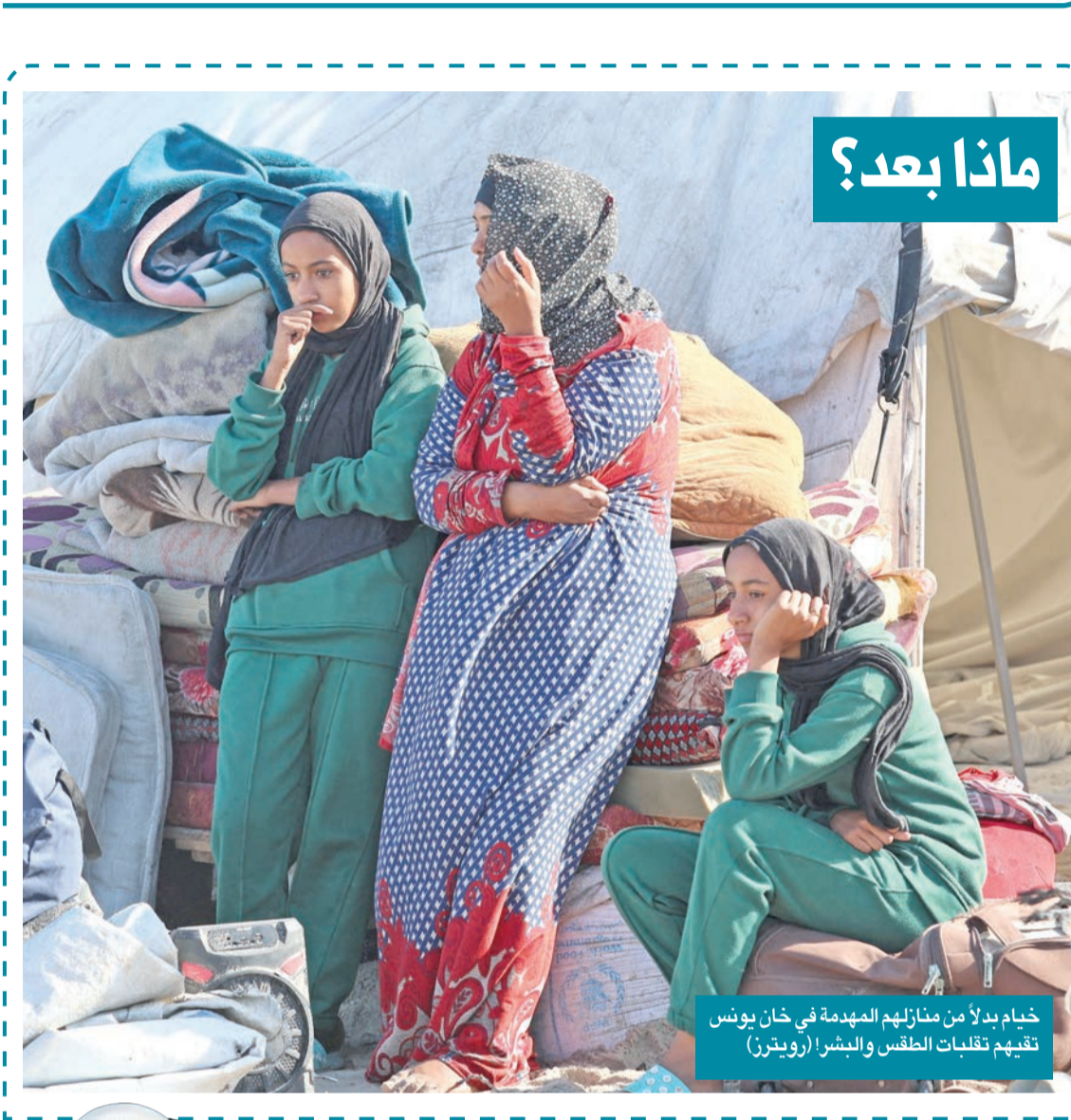
خيام بدلاً من منازلهم المهدمة في خان يونس تقييم ثقلبات الطقس والبشر!