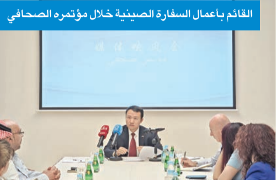
القائم بأعمال السفارة الصينية خلال مؤتمره الصحفي

والكويت إلى مستوى أعلى»، وأردف: «يفضل الاهتمام والرعاية من قِبادتي البلدين، وبفضل الجهود المشتركة لكلا الجانبين، أحرز التعاون الثنائي في المشروعات الكبرى تقدماً إيجابياً. نُقدّر عالياً الاهتمام والجهود غير المسبوقة للحكومة الكويتية في دفع التعاون، وكذلك تعمل الصينية على قدم وساق على هذه المشروعات. لا يمكننا أن نخيب آمال قادة وشاهدين البلدين هذه المشاريع مرتبطة بتنويع الاقتصاد الكويتي والتنمية طويلة الأجل، وتطلب دراسة متأنية من الجانبين، لإيجاد حلول مناسبة لظروف الكويت».