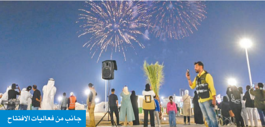
جانب من فعاليات الافتتاح