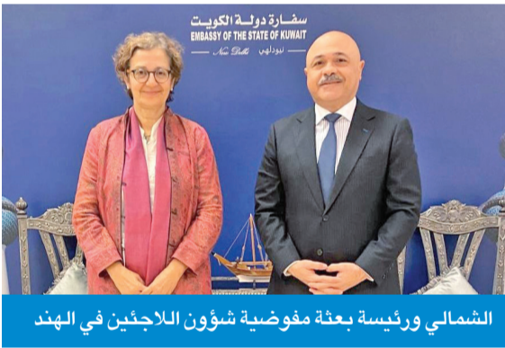
الشمالي ورئيسة بعثة مفوضية شؤون اللاجئين في الهند

ودعما المتواصل، واستعرضت سياني الأنشطة الإنسانية التي يقوم بها وبشراف عليها مكتب الهند في تقديم المساعدة والمساندة للاجئين وطالبي اللجوء في الهند من الجنسيات المختلفة.