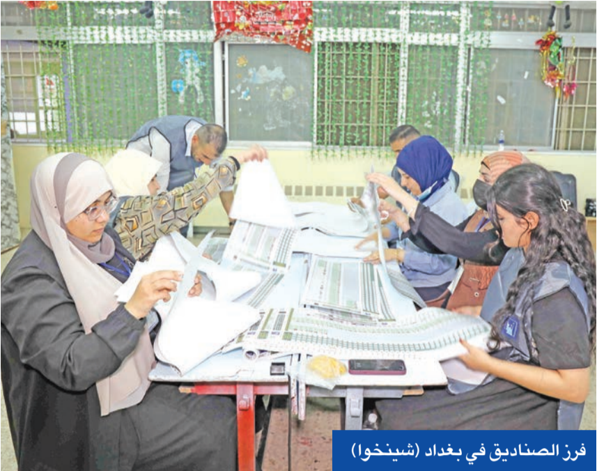
فرز الصناديق في بغداد

ضرورة إطلاق مفاوضات سريعة لتشكيل الحكومة الجديدة، لكن النقاشات الجدية ستبدأ عملياً مع حسم النتائج النهائية. وتوقعت المصادر مفاوضات شاقة على جميع القوى الشيعية تحت مظلة على جميع القوى الشيعية تحت مظلة