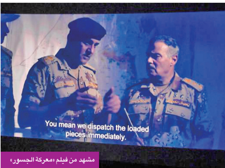
مشهد من فيلم «معركة الجسور»