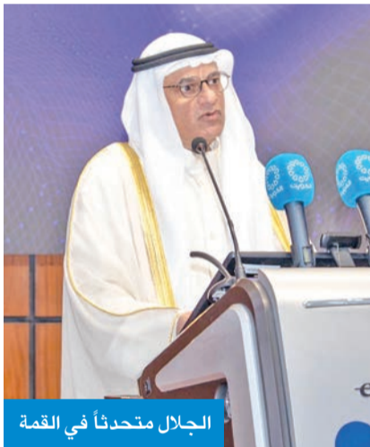
الجلال متحدتاً في القمة

وأضاف الجلال أن «دعم الكويت لهذه القمة نابع من إيمانها العميق بأن الاستثمار في العقول هو أعظم استثمار يمكن أن تقدمه الأمم لنفسها، وأن تمكين الشباب من أدوات الذكاء الاصطناعي