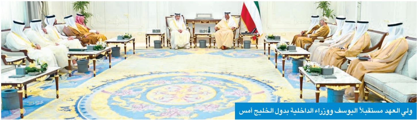
ولي العهد مستقبلاً اليوسف ووزراء الداخلية بدول الخليج أمس

تحيات صاحب السمو أمير البلاد الشيخ مشعل الأحمد، متمنياً سموه لهم التوفيق والسداد. حضر اللقاء رئيس ديوان سمو ولي العهد، الشيخ ثامر الجابر، وكبار المسؤولين.