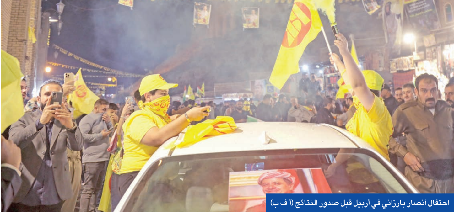
احتفال انصار بارزاني في أربيل قبل صدور النتائج