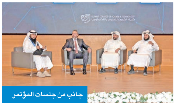
جانب من جلسات المؤتمر

استضافت كلية الكويت للعلوم والتكنولوجيا (KCST) مؤتمر وقمة أواسب العالمية، تحت عنوان «التطبيق الآمن» (SecureApp 2025)، والذي نظم