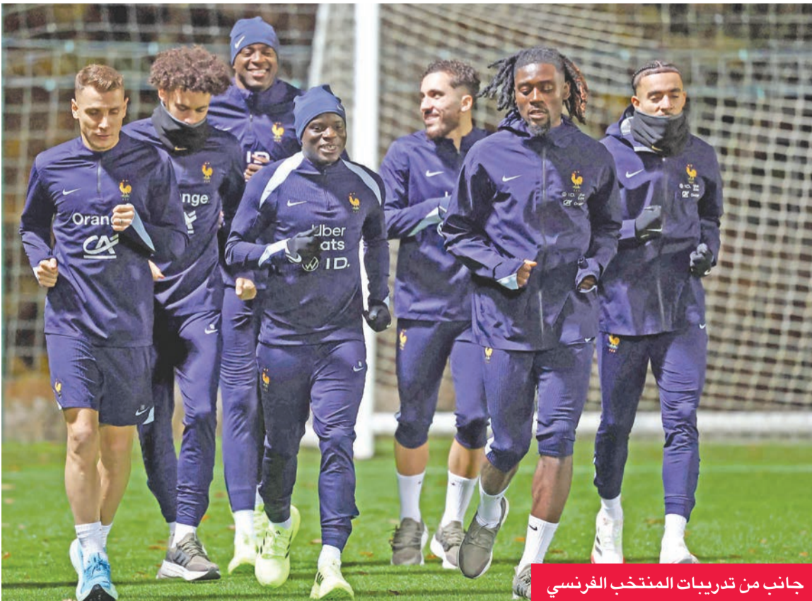
جانب من تدريبات المنتخب الفرنسي

الثانية)، وهولندا (السابعة)، والنمسا (الثامنة)، وبلجيكا (العاشرة)، وكرواتيا (الثانية عشرة)، أن تلحق بركب المتاهلين قبل جولة من النهاية، فيما يتوجب على الماني (الأولى) انتظار خوض مباراتها أمام لوكسمبورغ وسلوفاكيا بعد ثلاثة أيام لمعرفة مصيرها.