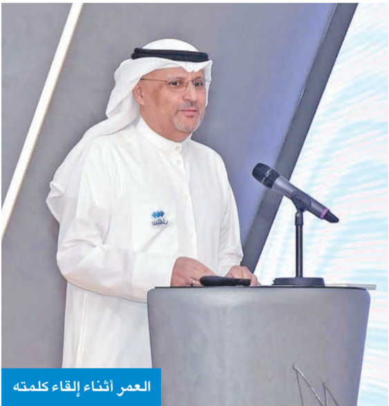
العمر أثناء إلقاء كلمته

حلقة نقاشية مغلفة جمعت ممثلي الجهات الحكومية المختلفة مع الوزير العمر تحت خلالها مناقشة أولويات تطوير الرحلات الرقمية وتبادل التجارب والتحديات، مع تأكيد أهمية التنسيق المشترك لتقديم تجربة حكومية مترابطة ومصممة حول احتياجات المستخدم النهائي.