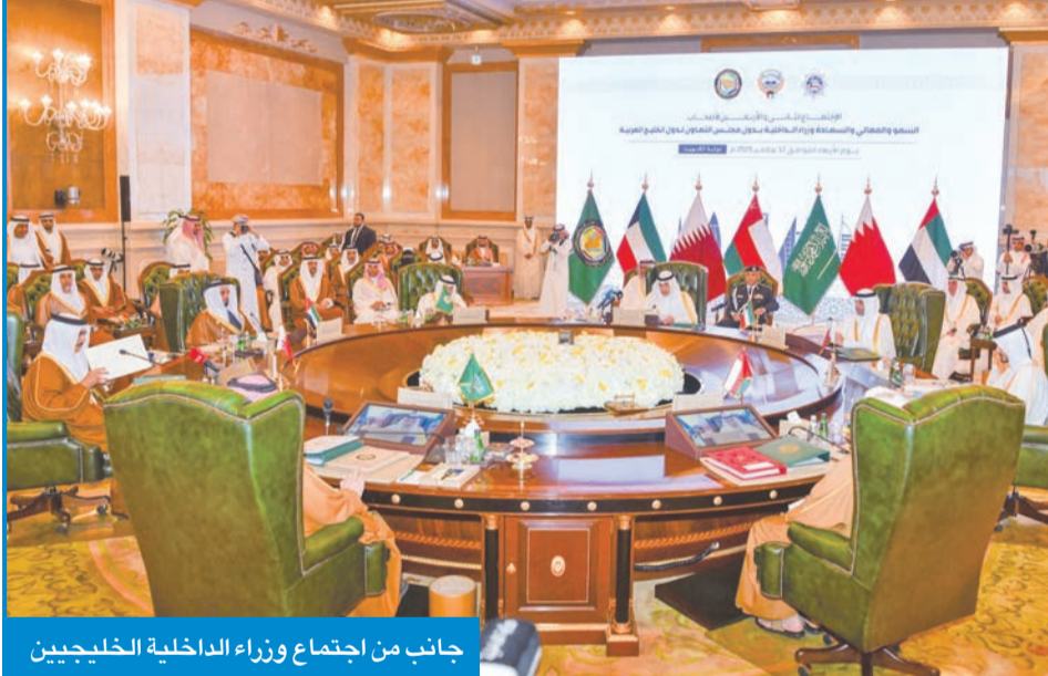
جانب من اجتماع وزراء الداخلية الخليجين

إجراء دراسة استشرافية للتحديات المستقبلية، وأن تكون أهم المرتكزات التي يتم العمل عليها تعزيز القدرات البشرية والوعي المجتمعي. بدوره، قال وزير الداخلية القطري: قائد قوة الأمن الداخلي (خويا)، الشيخ خليفة بن حمد، إن التطورات الإقليمية أثبتت أن أمن الخليج وحدة لا تتجزأ، وأن تعاون وزارات الداخلية في دول المجلس يُعد صمام الأمان بوجه التحديات التي تواجهها المنطقة.