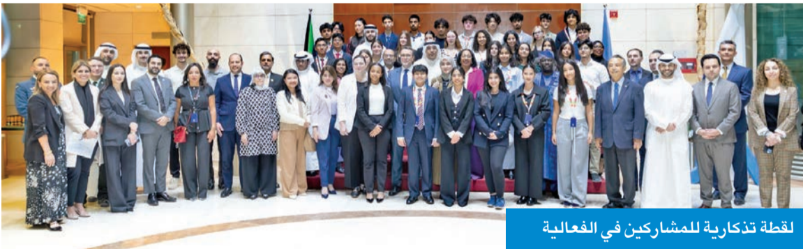
لقطة تذكارية للمشاركين في الفعالية

من سكان العالم في المناطق الحضرية، ومن المتوقع أن تصل هذه النسبة إلى 68% بحلول عام 2050، كما يتنقل الشباب حول العالم إلى المدن بحثاً عن حياة وتعليم وفرص عمل أفضل، ومن الطبيعي أن يوفر التحضر إمكانات اقتصادية هائلة». وذكرت أن «البرنامج الذي يستمر 6 أشهر يشهد مشاركة 40 متدرباً تم اختيارهم بعناية من بين مئات المتقدمين»، موضحة أن عملية الاختيار راعت التنوع بين المدارس الحكومية والخاصة وكذلك بين الجنسيات، بما يعكس طبيعة المجتمع الكويتي الذي يحتضن العديد من الجنسيات. وأكدت أن الكويت دولة رائدة في الدبلوماسية الإنسانية والتنمية، وتساهم في نشر ثقافة الحوار والتفاهم.