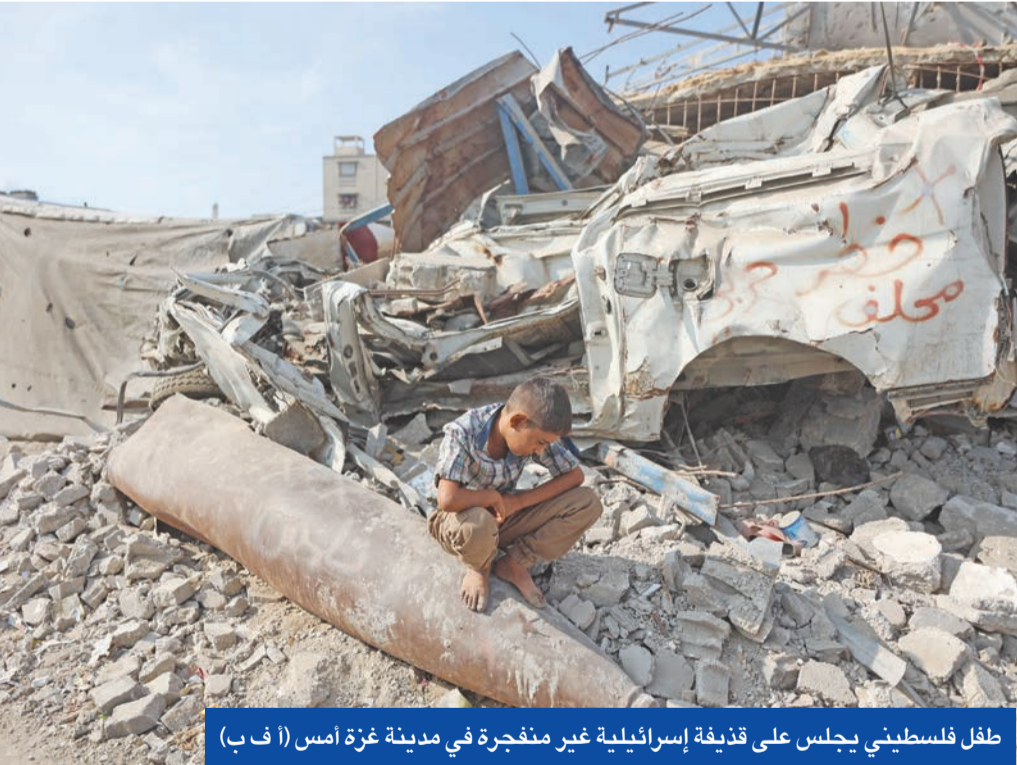
طفل فلسطيني يجلس على قنيفة إسرائيلية غير منفجرة في مدينة غزة أمس (أ ف ب)

بينما كشفت وثائق سرية حصلت عليها «بوليتيكو» أن خطة الرئيس الأميركي دونالد ترامب بشأن السلام في غزة تواجه تحديات هائلة بسبب صعوبة تنفيذ العديد من بنودها الأساسية وسط توقعات باحتمال تقسيم القطاع بين سلطات الاحتلال و«حماس» بحكم الأمر الواقع، أفادت أوساط عبرية رسمية بأن إسرائيل تعمل على قيام ميليشيا «أبوشباب» التي تعاونت مع جيش الاحتلال في الحرب، بتولي مهام لتأمين أعمال إعادة الإعمار في مدينة رفح.