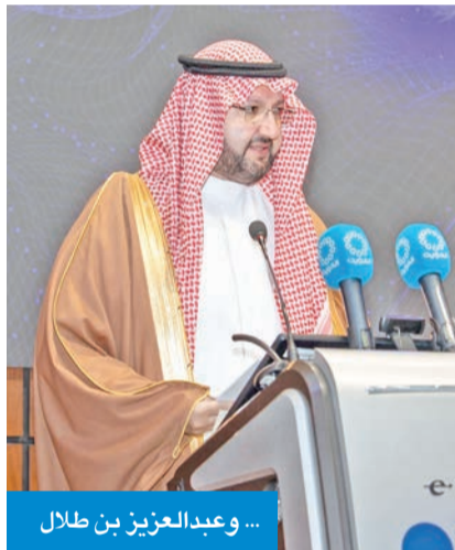
... وعبد العزيز بن طلال

للتقنيات الذكية أصبح ضرورة وطنية؛ لضمان أن يبقى الذكاء الاصطناعي أداة للبناء والتنمية لا مصدراً للتحديات أو المخاطر. وأشار إلى أن تبني الذكاء الاصطناعي في المجتمعات العربية لا يعني فقط التقدم التقني، بل تمكين الإنسان العربي وتطوير قدراته وتحسين جودة حياته، وبناء منظومات معرفية قادرة على تحقيق الرفاه المستدام للأفراد والمجتمعات.