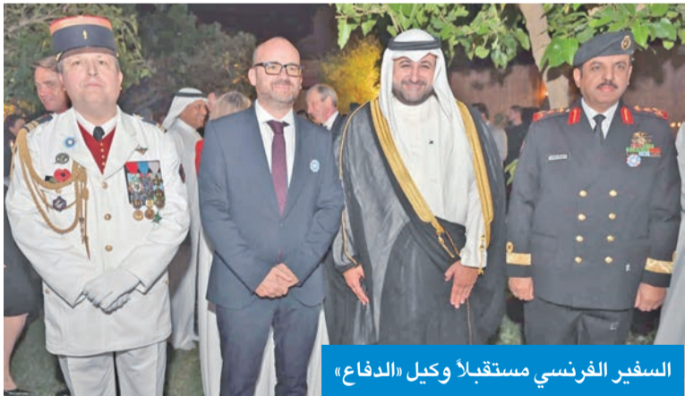
السفير الفرنسي مستقبلاً وكيل «الدفاع»

الصحراء)، وتلا أسماءهم تكريماً لتضحياتهم. وشدد غوفان على أن السلام لا يُكتسب نهائياً، وأن واجب الذاكرة يجب أن يبقى حياً، وفاءً لتضحيات الشهداء وتضامناً مع عائلاتهم ومع المحاربين القدامى، كما تطرق إلى رمزية زهرة «بلوي دو فرانس» التي تمثل علامة تضامن مع العالم العسكري، مؤكداً أهمية استمرار هذه المبادرات التذكارية.