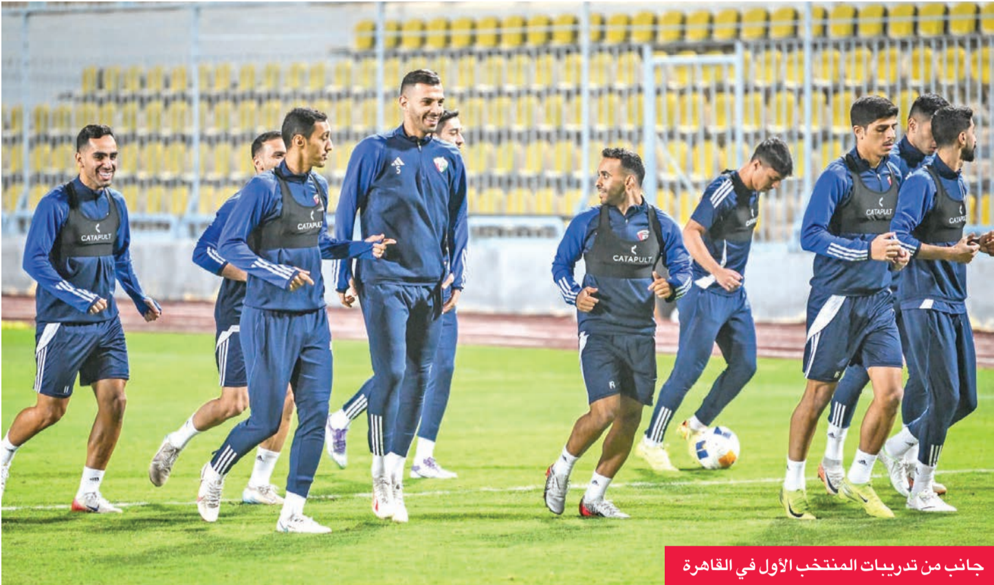
جانب من تدريبات المنتخب الأول في القاهرة