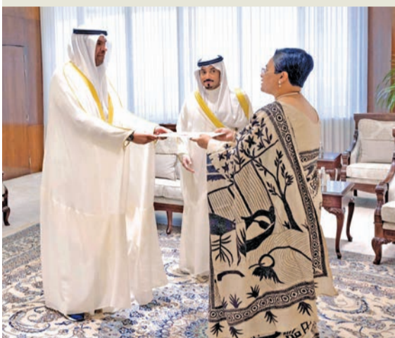
اليحيا متسلماً نسخة من أوراق اعتماد سفيرة الهند أمس

عملها وللعلاقات الثنائية الوثيقة التي تجمع البلدين الصديقين المزيد من التقدم والازدهار.