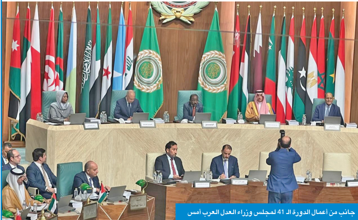
جانب من أعمال الدورة الـ 41 لمجلس وزراء العدل العرب أمس

شأنه ترسيخ أسس العدالة وتوحيد المفاهيم القانونية وصون الحقوق والحريات.