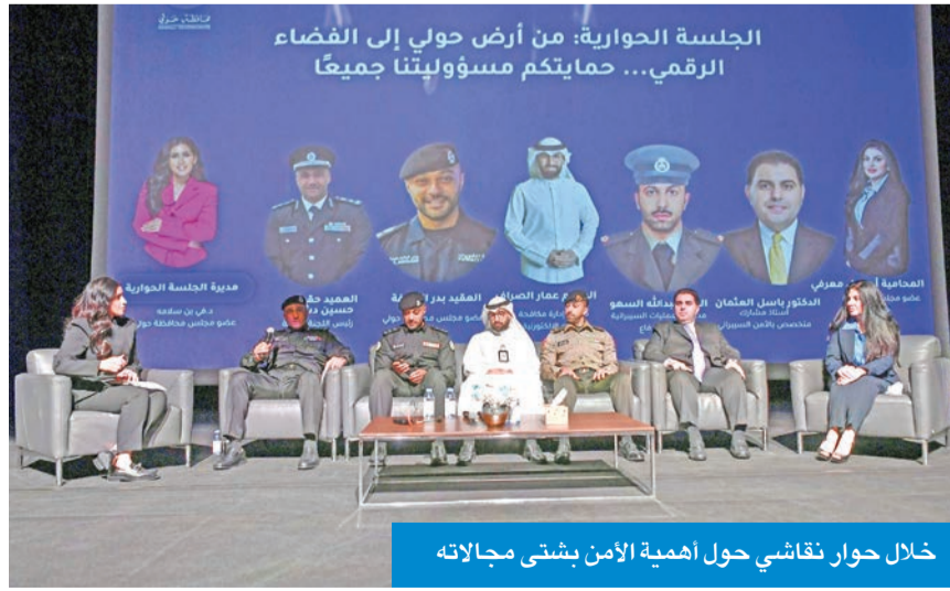
خلال حوار نقاشي حول أهمية الأمن بشتي مجالاته

مهمة؛ منها الجانب الأمني المتعلق بالمرور ومخاطره الناس انخفضت معدلات الجريمة وارتكابها، وتعرّزت الثقة وسادت الطمأنينة، موجها شكره للقائمين على هذه الحملة والمساهمين بها. وتهدف الحملة إلى نشر الوعي الأمني الشامل لأهالي محافظة حولي، إذ تناولت في حلقة نقاشية جوانب