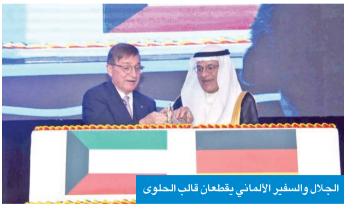
الجلال والسفير الألماني يقطعان قالب الحلوى

انتهى، إذ يُنتج العالم من حولنا فضاءً باعداً لا تصدق، حيث تشغل غزّة وأوكرانيا والسودان وأماكن أخرى أخبارنا وشبكاتنا. إن المعاناة مرعبة لدرجة أن قضايا عالمية مثل تغير المناخ، ونُدرة الطاقة والمياه، أو التوزيع غير العادل للموارد، قد تُغفل. وتابع: «نحن على قناعة بأن الوحدة الأوروبية الداخلية، والشراكة مع جيراننا في العالم هي وحدها القادرة على إحداث فرق، وقد شهد على ذلك الاجتماع الوزاري الناجح بين الاتحاد الأوروبي ومجلس التعاون الخليجي أخيراً، ومنتدى الأعمال رفيع المستوى الأسبوع الماضي، بمشاركة عدد كبير من الشركات الألمانية. فلنعمل على بناء هذه الشراكات من أجل السلام والاستقرار والازدهار».