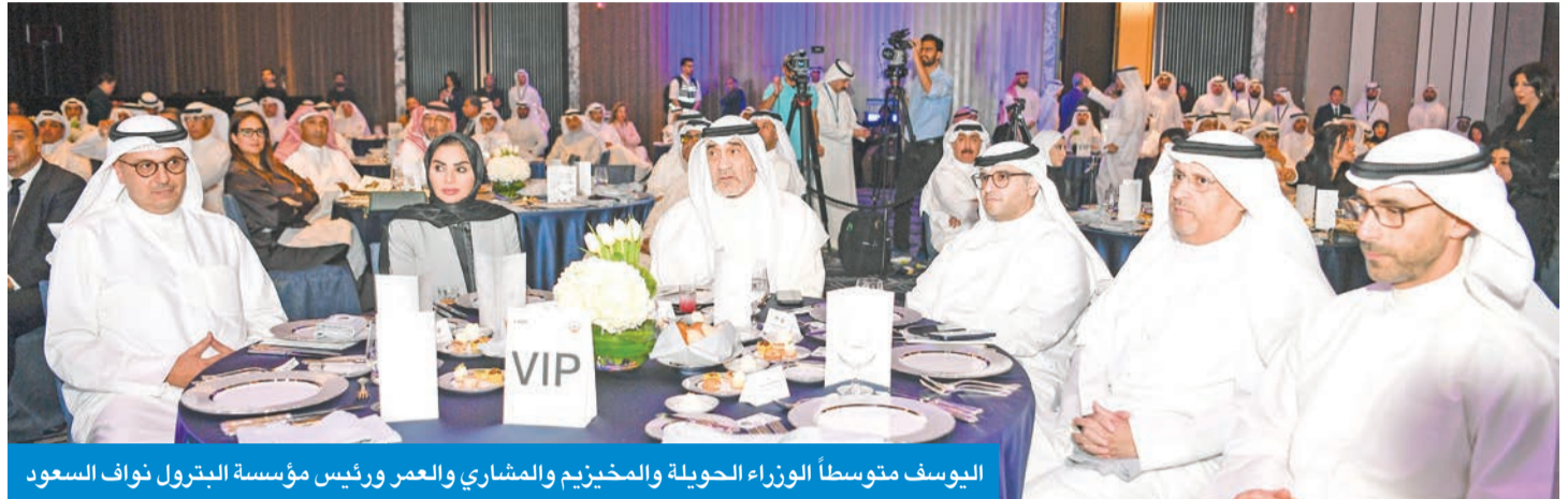
الجابر متحدناً خلال العرض المرئي في الملتقى