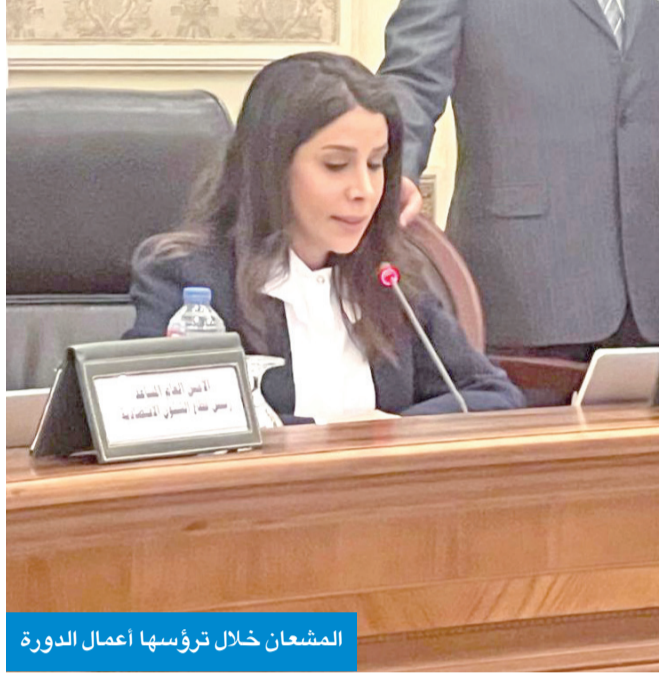
المشعان خلال ترؤسها أعمال الدورة

وأكدت التزام الكويت الثابت خلال فترة رئاستها للمجلس بدعم مسيرة التعاون العربي، داعية الجميع إلى التكاتف والمتابعة الحثيثة لضمان ترجمة قرارات المجلس ومبادراته إلى إنجازات ملموسة تنبض بحياة شعوبنا.