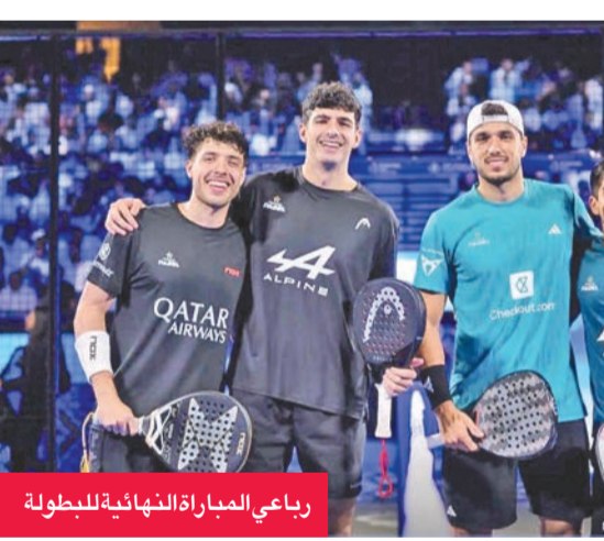
رباعي المباراة النهائية للبطولة

اختتمت أمس الأول منافسات «بطولة العالم للبادل الزوجي 2025» التي استضافتها دولة الكويت على ملاعب «أرينا 360 مول» و«أكاديمية أرفا نادال» بتتويج الثنائي الإسباني ألكساندرو غالان والأرجنتيني فيديريكو تشينغوتو في منافسات «فئة الرجال»، و«الثنائي الإسباني جوزيماريا فيديريكو تشينغوتو في منافسات «فئة الرجال»، و«الثنائي الإسباني باولا جوزيماريا ومواطنتها أريانا سانتشيز في منافسات «فئة السيدات».