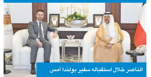
الناصر خلال استقباله سفير بولندا أمس

استقبل محافظ الفروانية، الشيخ عذبي الناصر، في مكتبه بالمحافظة صباح أمس، سفير بولندا لدى الكويت، ميشال جوليا. وجرى خلال اللقاء بحث سبل تعزيز التعاون والتبادل الثقافي بين الجانبين، إضافة إلى مناقشة الموضوعات ذات الاهتمام المشترك، بما يسهم في توطيد العلاقات بين البلدين.