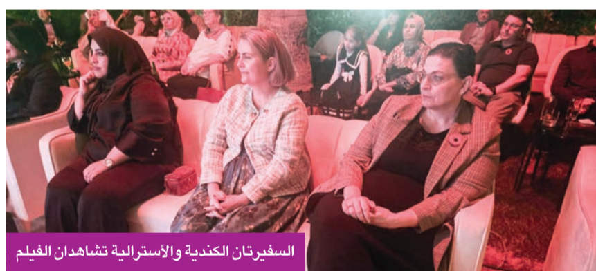
السفيرتان الكندية والأسترالية تشاهدان الفيلم