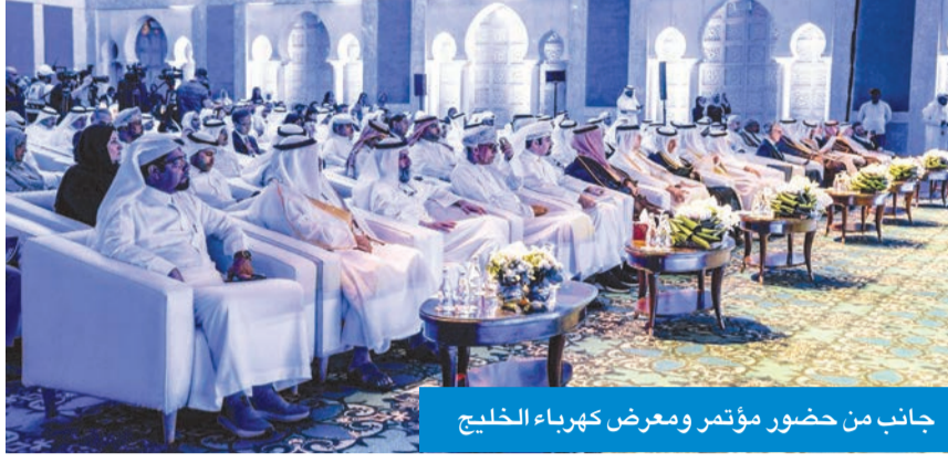
جانب من حضور مؤتمر ومعرض كهرباء الخليج

قانون شراء الطاقة من الغير وتقديم عروض محطة الخيار قريباً الزامل