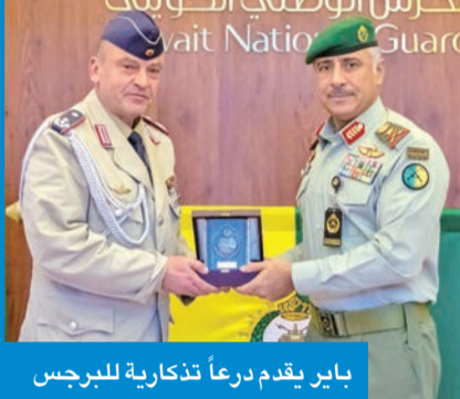
باير يقدم درعاً تذكارية للبرجس