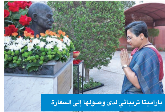
باراميتا تريباتي لدى وصولها إلى السفارة

في بعثات خارجية أخرى، منها بروكسل (2003-2005) وطوكيو (2008-2011). وتحمل تريباتي شهادة ماجستير في الجغرافيا من جامعة جواهر لال نهرو في نيودلهي، وهي تتقن؛ إلى جانب الهندية، اللغتين الإنكليزية والبنغالية، ولديها معرفة عملية باللغة الفرنسية.