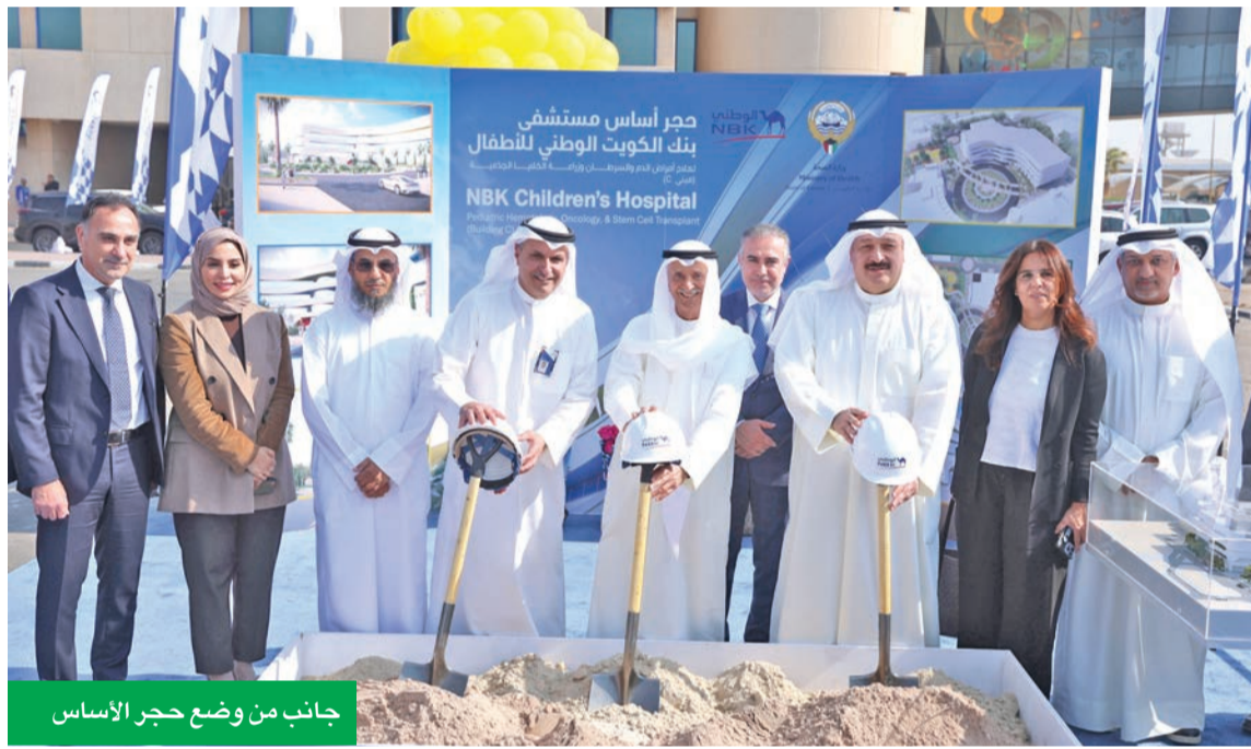
جانب من وضع حجر الأساس

ويواصل «الوطني» ترسيخ مكانته كمساهم رئيسي في دعم المشاريع الإنسانية والتنموية، من خلال شراكات فعالة مع الجهات الحكومية ومؤسسات المجتمع المدني، ليؤكد بذلك أن دوره يتجاوز العمل المصرفي ليشمل الإسهام الفاعل في بناء مجتمع صحي ومتماسك.