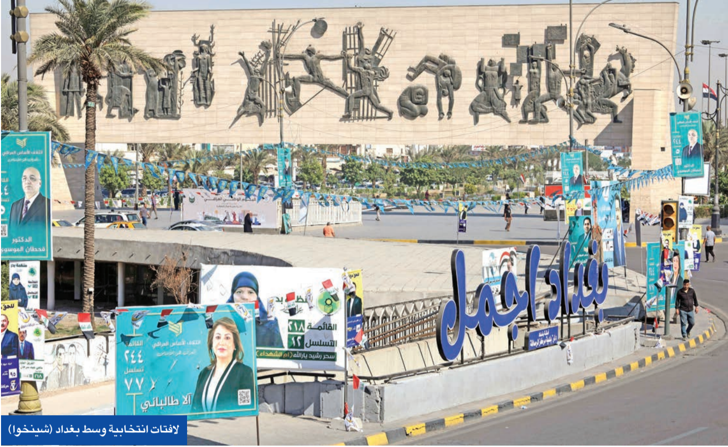
لافتات انتخابية وسط بغداد

الحلبوسي، و«تحالف العزم»، الذي يتزعمه النائب مثنى السامرائي، و«تحالف الحسم الوطني»، الذي يقوده وزير الدفاع ثابت العباسي.