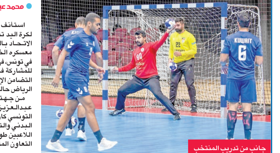
جانب من تدريب المنتخب

والإداري الذي ساهم في تهيئة كل الظروف والعمل على رفع جاهزية اللاعبين بشكل كامل قبل البطولة المقبلة. وقال الزعابي: «إن الجميع يعمل بروح واحدة من أجل رفع اسم الكويت عالياً في جميع المحافل الرياضية للمشاركة في منافسات دورة ألعاب التضامن الإسلامي التي تستضيفها الرياض حالياً. من جهته، أكد مدير المنتخب عبدالعزيز الزعابي أن المعسكر التونسي كان ناجحاً على الصعيدين البدني والتكتيكي، مشيداً بالالتزام اللاعبين طوال فترة المعسكر، وكذلك التعاون المتميز بين الجهازين الفني