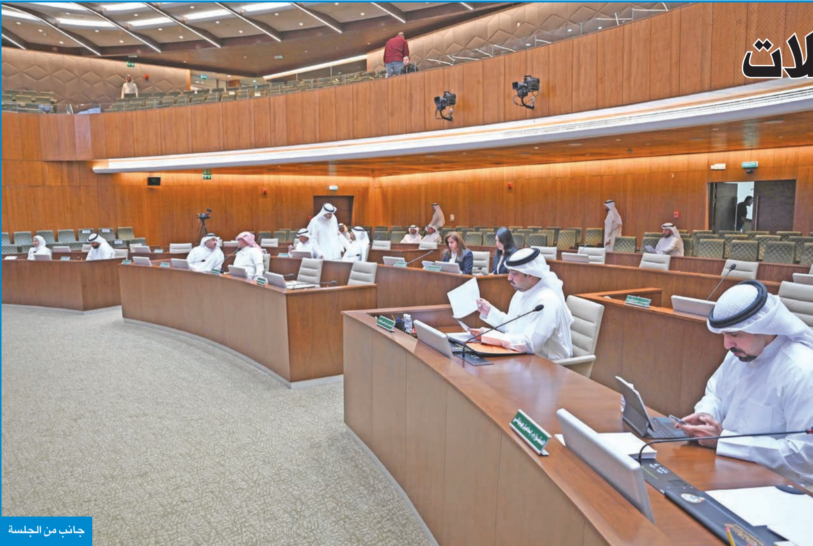
جانب من الجلسة