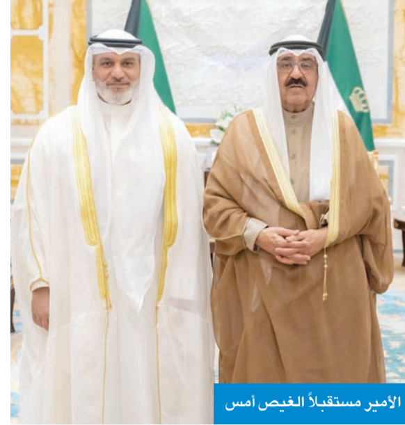
الأمير مستقبلاً الغيص أمس

استقبل سمو أمير البلاد الشيخ مشعل الأحمد، في قصر بيان صباح أمس، الأمين العام لمنظمة البلدان المصدرة للبترول (أوبك)، هيثم الغيص. في مجال آخر، يشتمل صاحب السمو برعايته وحضوره اليوم حفل تكريم كوكبة من المعلمين والمدارس المتميزة بمناسبة اليوم العالمي للمعلم، وذلك عند الساعة العاشرة صباحاً على مسرح الشيخ عبدالله الجابر بجامعة عبدالله السالم في منطقة الشويخ.