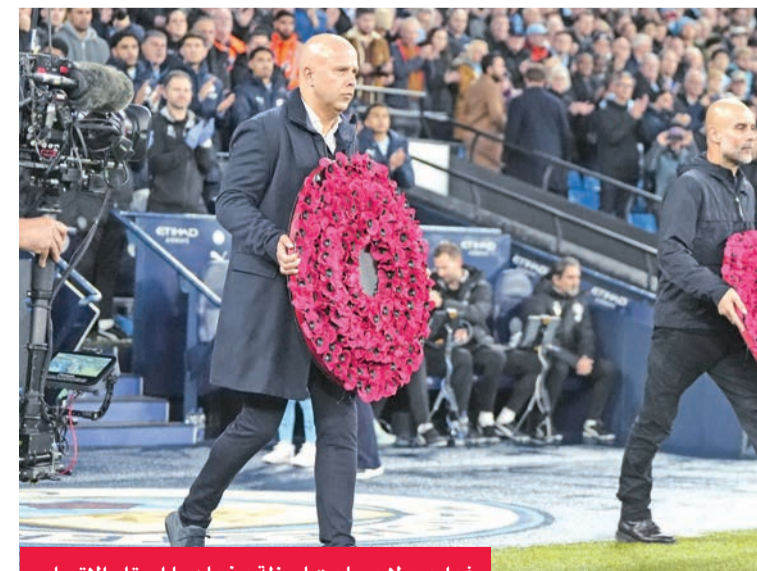
غوارديولا وسلوت لحظة دخولهما استاد الاتحاد

تم اتخاذ، على الأقل من وجهة نظري». وفيما يتعلق بشأن حظوظ فريقه في المنافسة على الصدارة، أكد: «يجب ألا نتحدث عن المركز الأول حالياً، بل نعيّن علينا أن نركز على أداءنا الذي يحتاج إلى تحسين».