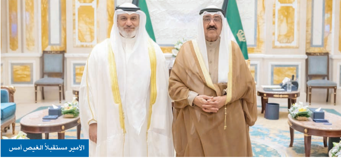
الأمير مستقبلاً الغيص أمس

الأمير يستقبل الأمين العام لـ «أوبك» سموه يرفع اليوم تكريم المعلمين والمدارس المتميزة