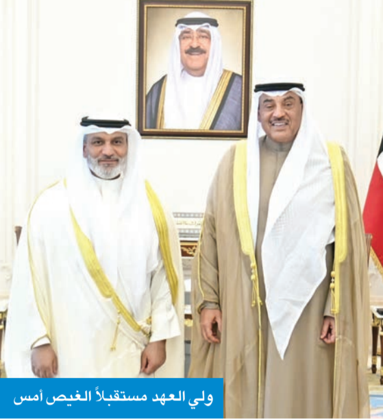
ولي العهد مستقبلاً الغيص أمس

استقبل سمو ولي العهد الشيخ صباح الخالد، بقصر بيان صباح أمس، الأمين العام لمنظمة البلدان المصدرة للبترول (أوبك)، هيثم الغيص.