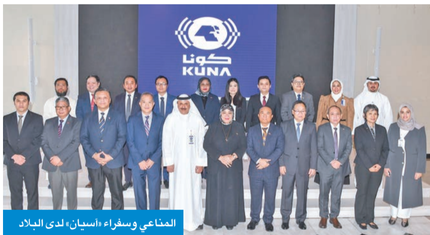
المناعي وسفراء «آسيان» لدى البلاد

دعوة لإقامة شراكات إعلامية تسهم في تعزيز العلاقات