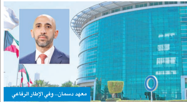
معهد دسمان... وفي الإطار الرفاعي

الرفاعي: تتخلله فحوص واستشارات طبية وتغذوية للكبار والأطفال