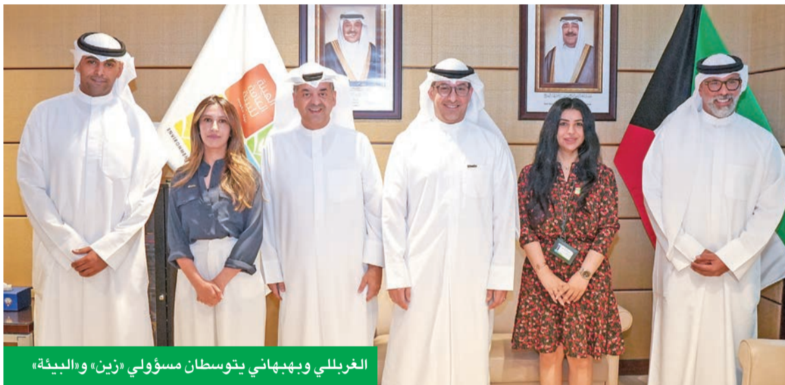
الغريبي وبيههاني يتوسعان مسؤولي «زين» و«البيئة»

للتوسع في العمل المشترك نحو تعزيز الوعي البيئي وتسريع مبادرات الاستدامة