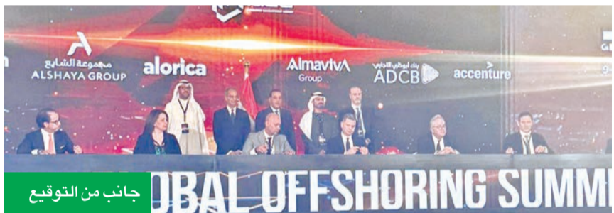
جانبا من التوقيع

وقعت مذكرة تفاهم مع هيئة تنمية صناعة تكنولوجيا المعلومات