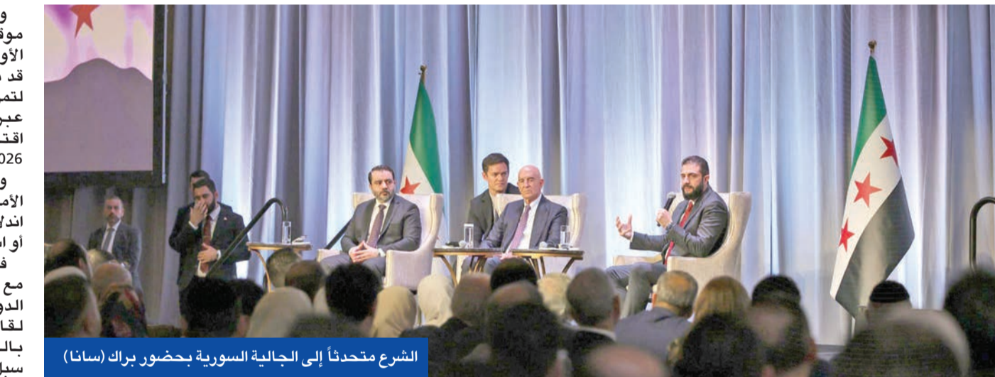
الشرع متحدثاً إلى الجالية السورية بحضور براك

كما التقى الشرع أبناء الجالية السورية في الولايات المتحدة، بحضور الوفد الأمريكي الخاص توماس براك، وشدد على «أهمية دور السوريين بالخارج في الدفاع عن قضايا وطنهم وتعزيز التواصل مع مؤسسات الدولة»، وأكد أن «سورية تتجه إلى مرحلة جديدة من البناء والشراكة مع المجتمع الدولي بعد طي صفحة الحرب والانقسام».