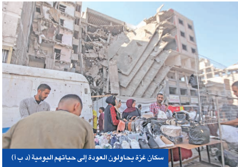
سكان غزة يحاولون العودة إلى حياتهم اليومية (د ب أ)

«فتح» تهتم «حماس» بتعزيز فصل الضفة عن القطاع