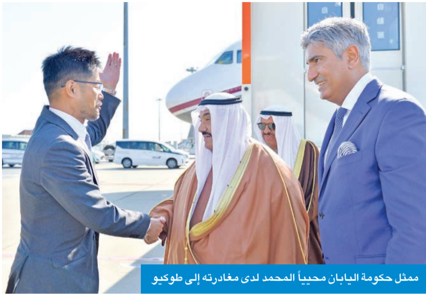
ممثل حكومة اليابان محبياً المحمد لدى مغادرته إلى طوكيو

يزور اليابان لتقلد وسام «الوشاح الأكبر للشمس المشرقة»