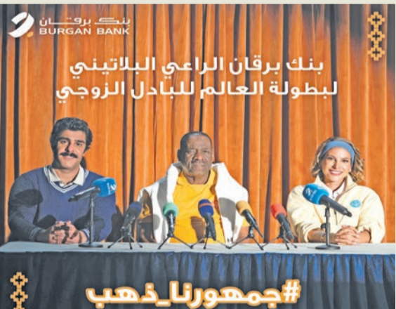
فريق البنك في جناحه بالبطولة