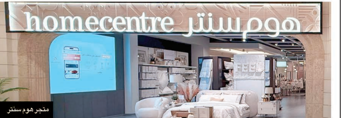
متجر هوم سنتر