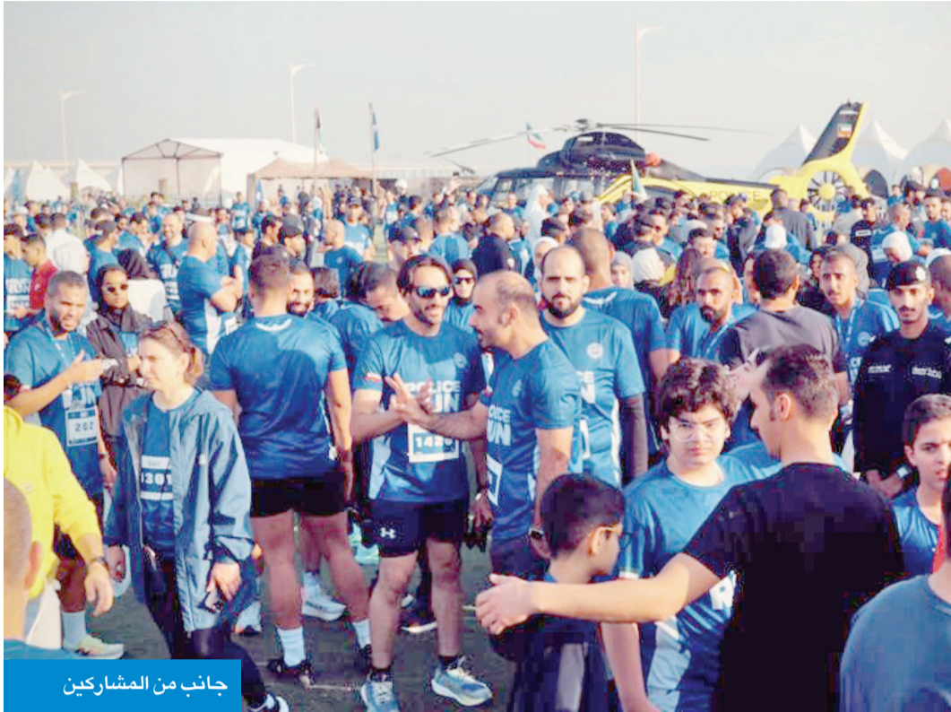
جانب من المشاركين

مجلس اتحاد الشرطة، العميد محمد المنصوري، إن السباق الأول من نوعه في وزارة الداخلية يقام بمشاركة القطاعات العسكرية مثل الحرس الوطني والجيش الكويتي وقوة الإطفاء ولمسافة 5 كيلومترات. وأضاف أن السباق قسّم إلى فئتين: الأولى لمنتسبي وزارة الداخلية والجهات العسكرية المشاركة، بهدف خلق جو من المنافسة بين القطاعات العسكرية، لافتاً إلى أن الفئة الثانية من السباق شملت المدنيين وبمسافة 3 كيلومترات، لافتاً إلى أن عدد المشاركين بلغ نحو 1500 مشارك، منهم 400 عسكري والبقية من المدنيين.