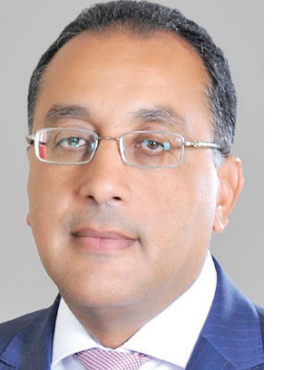
د. مصطفى مدبولي

مقومات الاستثمار المتعددة في مجالات كثيرة بالسياحة والإعلام والعقار والطرق والموانئ والتعليم والصحة والاتصالات وغيرها، مضيفاً أن ما تشهده مصر في عهد الرئيس عبدالفتاح السيسي من طفرة تنمية ونهضة حضارية غير مسبوقة في معدلات زمنية قياسية تنعش على الفخر الريادي والقيادي والمحوري في المنطقة، كما أن مصر تمتلك