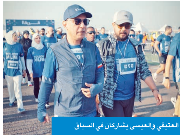
العتيقي والعيسى يشاركان في السباق