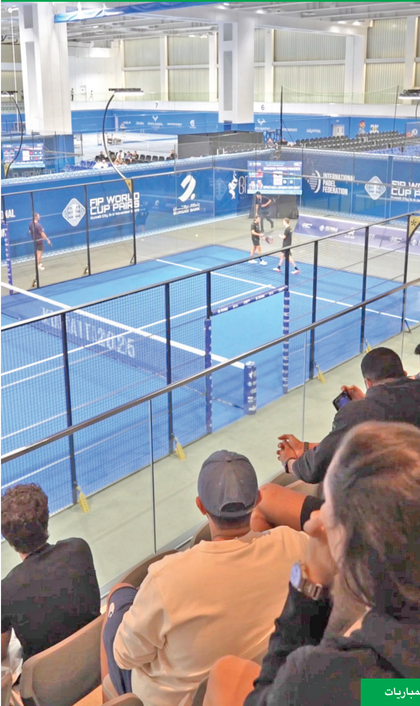
جانب من المباريات