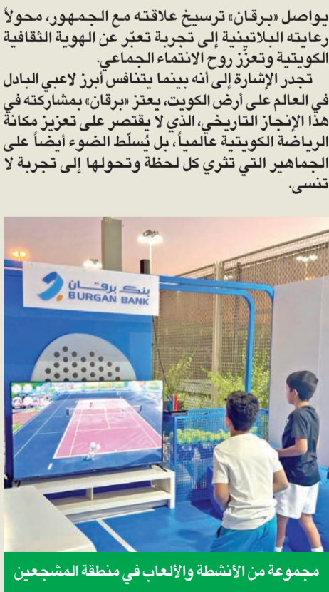
مجموعة من الأنشطة والألعاب في منطقة المشجعين

تزامناً مع نهائي بطولة كأس العالم للبادل الزوجي 2025 اليوم، واستقطاب هذه البطولة للجماهير من مختلف أنحاء الكويت. كشف بنك برقان الراعي البلاتيني للبطولة عن مجموعة من المبادرات المتميزة التي تعتبر عن اهتمام الجمهور الكويتي بالساحة الرياضية، وتعزيز روح المجتمع والتفاعل الإيجابي بين الجمهور، تحت شعار «مسؤوليتنا الاجتماعية صارت وطني». وفي إطار رعايته للبطولة، أطلق «برقان» أغنية خاصة «جمهورنا ذهاب» تحتفي بالبطولة، وتشكل تحية حماسية لجمهور الكويت وجميع اللاعبين والزوار من مختلف بلاد العالم. ويشارك في أداء الأغنية الفنانين خالد الملا، وبيبي عبدالمحسن، وعبد السلام محمد. ومن خلال دمج تقنيات الإنتاج الحديثة، تنقل الأغنية بأيقاعها وكلماتها الرابط العميق الذي يجمع بين الرياضيين والجماهير في انعكاس صادق لروح البطولة نفسها. ولإضافة مزيد من المتعة والحماس إلى أجواء البطولة، أصبحت منطقة المشجعين (Fan Zone) التابعة للبطولة إحدى أبرز نقاط الجذب للجمهور. وتقدم هذه المنطقة المتاحة طوال الأيام التسعة للبطولة، للعائلات والأصدقاء والمشجعين باقة من الأنشطة التفاعلية والألعاب والمسابقات والهدايا، مما يجعلها تجربة ترفيهية نابضة بالحياة. كما تجسد هذه الأنشطة والفعاليات، التزام «برقان» بالتواصل وإشراك فئات المجتمع المختلفة وتعزيز الرفاه الاجتماعي، انسجاماً مع مسؤوليته الاجتماعية ومبادئه في الحوكمة البيئية والاجتماعية والمؤسسية (ESG). ومن خلال الدمج بين الإبداع والمشاركة المجتمعية،