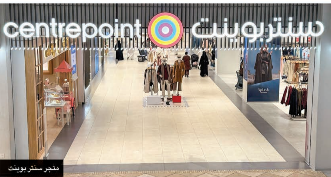
متجر سنتر بوينت

نظرة نحو المستقبل ومع دخول مجموعة لاندمارك عهدها الثالث في دولة الكويت، تواصل السير بخطى نحو تحقيق رسالتها في تحسين جودة الحياة اليومية من خلال تقديم قيمة حقيقية وتجارب مميزة ومبادرات مجتمعية مؤثرة. تواصل المجموعة تعزيز ولاء عملائها والمساهمة في رسم ملامح مستقبل قطاع التجزئة عبر الابتكار، والانفتاح، والنمو المستدام.