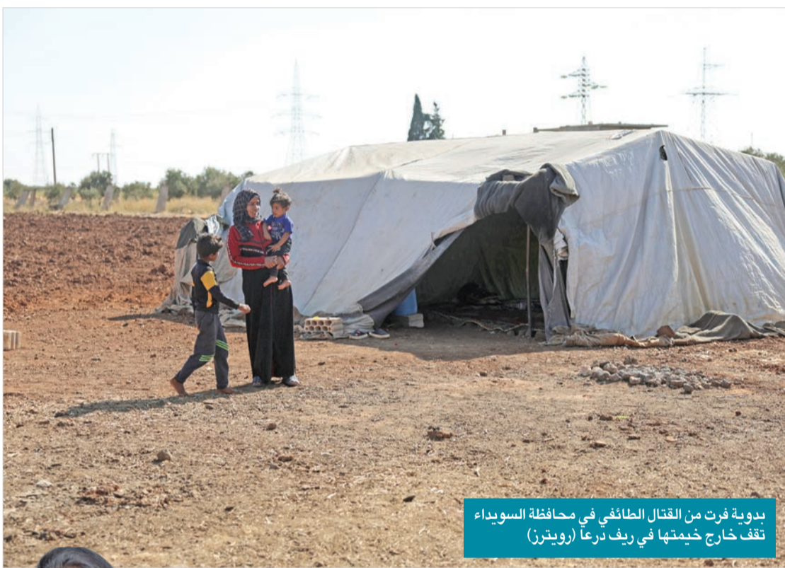
بدوية فرت من القتال الطائفي في محافظة السويداء تقف خارج خيمتها في ريف درعا

توجد عدة تعريفات لمفهوم «العدالة الانتقالية»، أحدها صادر عن المفوضية السامية لحقوق الإنسان، فهذه العدالة هي: «كامل نطاق العمليات والاليات المرتبطة بالمحاولات التي يبذلها المجتمع لتفهم تركمة من تجاوزات الماضي الواسعة النطاق بغية كفالة المساءلة، وإقامة العدالة، وتحقيق المصالحة». وتهدف «إلى الاعتراف بضحايا تجاوزات الماضي على أنهم أصحاب حقوق، وتعزيز الثقة بين