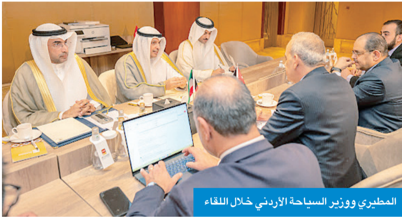
المطيري ووزير السياحة الأردني خلال اللقاء

المباحثات أهمية تعزيز التعاون والتنسيق المشترك في المجالين السياحي والثقافي، مستعرضين أهم الخطط المستقبلية لتلاقع بهذين المجالين في البلدين. وأشاد الجانبان خلال الجلسة بعمر ومثانة العلاقات التي تجمع البلدين الشقيقين في شتى المجالات وعلى كل المستويات، متطلعين إلى عقد المزيد من اللقاءات في المستقبل لدفع عجلة التعاون إلى آفاق أرحب.