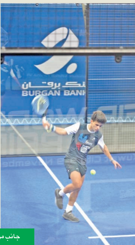
مجموعة من الأنشطة والألعاب في منطقة المشجعين