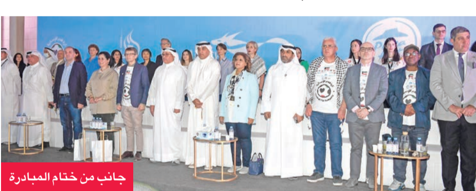
جانب من ختام المبادرة

تواظفياً للشعبية العالمية لكرة القدم في خدمة الدبلوماسية الإنسانية وتقديم الدعم الملموس للأطفال المتأثرين بالأزمات، اختتمت، بنجاح، في الكويت المبادرة الأممية الدبلوماسية «كرة قدم للإنسانية»، فعاليات بطولة النسخة الأولى المخصصة لأطفال فلسطين، تحت رعاية عبدالله علي البجيا، وزير الخارجية، وبالشراكة مع الأمم المتحدة ممثلة في مكتب المنسق المقيم للأمم المتحدة بالكويت واليونيسكو ومنظمة الصحة العالمية واليونيسيف، وبدعم من الاتحاد الكويتي لكرة القدم، بالشراكة مع برنامج الفغا لتنمية المواهب، وتعاون سفارات 11 دولة، ومساندة القطاع الخاص الكويتي. وتقدم الحضور الوزير المفوض عبدالعزيز سعود الجارالله، مساعد وزير الخارجية لشؤون المنظمات الدولية، والسفيرة الشخبة جواهر إبراهيم الدعيج مساعداً وزير الخارجية لشؤون حقوق الإنسان، وسفراء عدد كبير من الدول، والشخبة انتصار سالم العلي رئيسة مجلس إدارة مؤسسة «النوير» غير الربحية، رئيسة اللجنة المنظمة للمبادرة، والشخ أحمد اليوسف رئيس الاتحاد الكويتي لكرة القدم، وناصر الشخ المدير العام للهيئة العامة للشباب، ونائنه وليد الأنصاري وشهيد البطولة المخصصة للصغار حضوراً جماهيرياً واسعاً ومشاركة فاعلة من مؤسسات القطاعين العام والخاص، لتشجيع أكثر من 400 لاعب ولعبة تتراوح أعمارهم من 8 إلى 12 سنة.