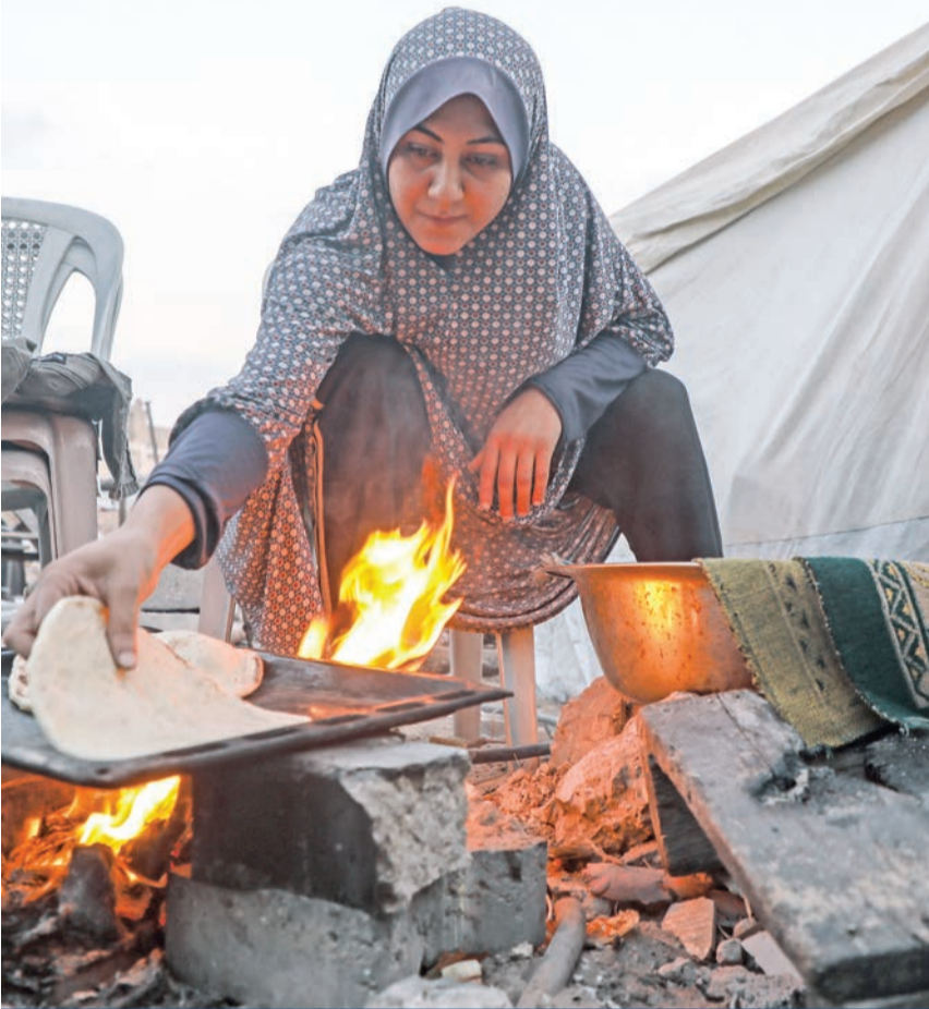
فلسطينية في منطقة حي الرضوان المدمرة قرب مدينة غزة الخميس الماضي