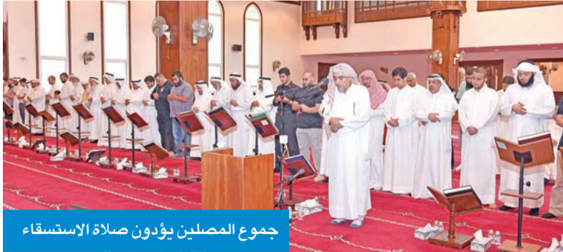
جموع المصلين يؤدون صلاة الاستسقاء

أدت الكويت الاستسقاء في 125 مسجداً في مختلف محافظات الكويت عند الساعة العاشرة والنصف من صباح أمس، عملاً بسنة النبي صلى الله عليه وسلم في طلب الغيث والسقيا من رب العالمين. وتقام هذه الصلاة عند حدوث الجب وانقطاع المطر وشدة حاجة الإنسان والحیوان والنبات إلى الماء.