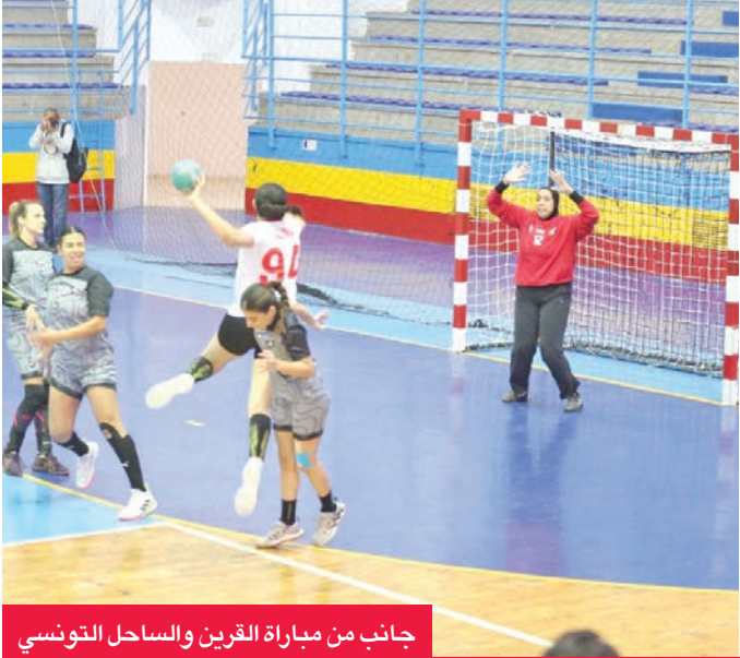
جانب من مباراة القرين والساحل التونسي

ودّعت سيدات القرين لكرة اليد منافسات البطولة العربية الـ 7 للأندية أبطال الدوري والكؤوس للسيدات لكرة اليد، المقامة حالياً في مدينة الحمامات التونسية، بعد خسارتهن أمام فريق الساحل التونسي بنتيجة 32-24 في المباراة التي جمعت الفريقين أمس ضمن دور الثمانية في البطولة. وبذلك، تأهل الساحل التونسي إلى الدور نصف النهائي بالبطولة، فيما سيلعب فريق القرين مباريات الترتيبية لتحديد المراكز من الخامس حتى الثامن. يذكر أن فريق سلوى الصباح لعب مع صاحب الضيافة؛ الحمامات التونسي، في ساعة متأخرة أمس ضمن الدور ربع النهائي للبطولة.