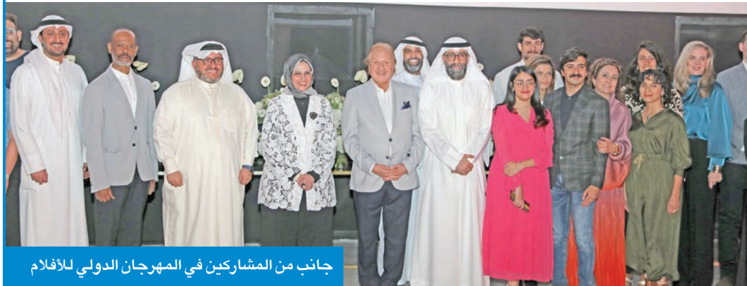
جانب من المشاركين في المهرجان الدولي للأفلام

ما يعزز التبادل الثقافي والتعاون الإقليمي في مجال السينما. ويختتم المهرجان يوم 15 الجاري بحفل توزيع الجوائز في حرم الجامعة، احتفاءً بأفضل الأعمال والمواهب المشاركة، ليؤكد المهرجان مكانته كمصنعة تجمع بين المبدعين الشباب وصنّاع السينما المحترفين، وتعزز الحوار الثقافي والإبداع السينمائي في الكويت والعالم العربي.