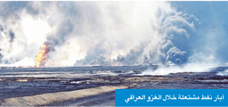
آبار نفط مشتعلة خلال الغزو العراقي

أحييت اليوم الدولي لمنع استخدام البيئة في الحروب والنزاعات المسلحة