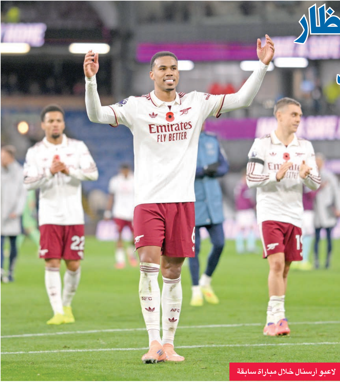
لاعبو أرسنال خلال مباراة سابقة