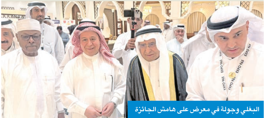
البغلي وجولة في معرض على هامش الجائزة