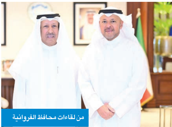
من لقاءات محافظ الفروانية