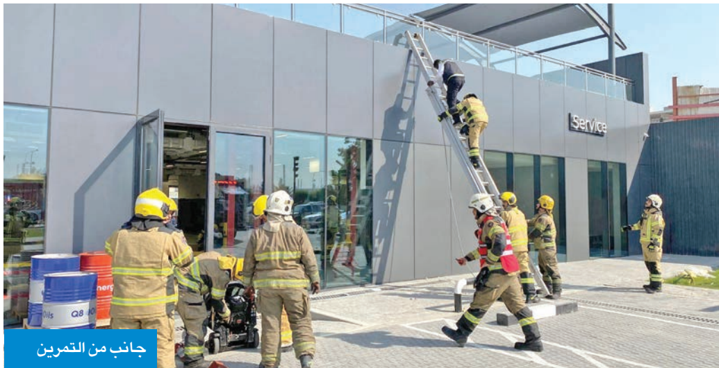
جانب من التمرين

بمنطقة الفحيحيل الصناعية، في إطار خططها التدريبية الهادفة إلى رفع جاهزية فرق الإطفاء، والتعامل مع مختلف أنواع الحوادث.