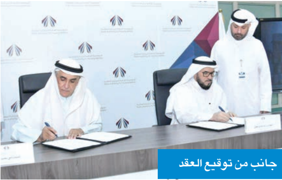
جانب من توقيع العقد