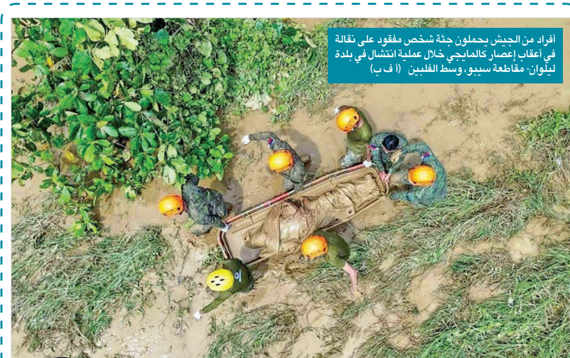
أفراد من الجيش يحملون جثة شخص مفقود، على نقالة في أعقاب إصراع كالمابجي خلال عملية انشغال في بلدة ليلوان- مقاطعة سييو، وسط الفلبين