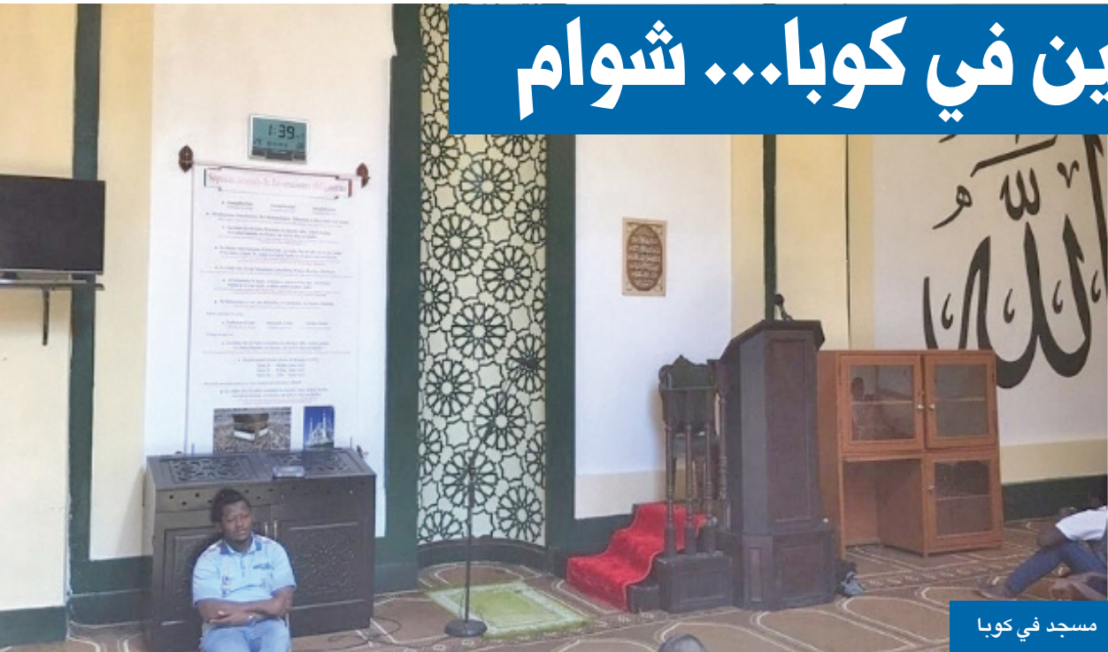
مسجد في كوبا