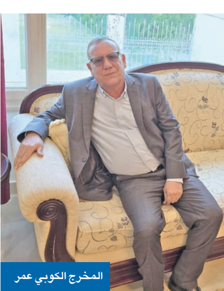
المخرج الكوبي عمر