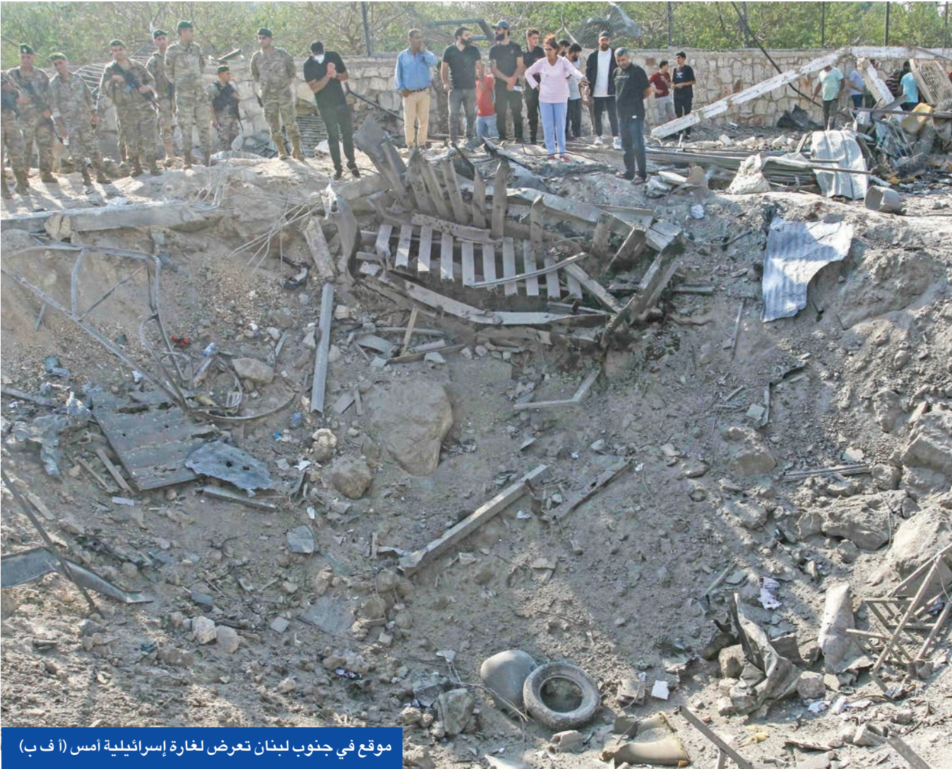
موقع في جنوب لبنان تعرض لغارة إسرائيلية أمس

إبداء الدولة اللبنانية استعدادها للتفاوض مع تل أبيب في سبيل وقف الضربات والإنسحاب من مصادر لبنانية لـ «الجريدة» البحت في إمكانية تعيين شخصية مدنية لنولي المفاوضات مع إسرائيل وقد وقع الاختيار على بول سالم، وهو أكاديمي مرموق يشغل حالياً منصب رئيس معهد الشرق الأوسط ومديره التنفيذي، ويحمل الجنسية الأميركية، وقد طرح سابقاً كمرشح محتمل لوزارة الخارجية اللبنانية في حكومة الرئيس نواف سلام. وسالم هو نجل وزير الخارجية اللبناني الأسبق إليي سالم، الذي كان وزيراً للخارجية عندما توصل لبنان إلى اتفاق 17 أيار (مايو) مع إسرائيل عام 1983.