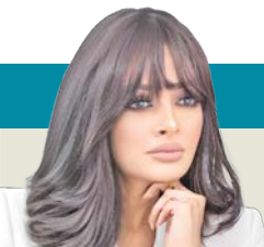
أميرة الحسن *

بعض الأخطاء تمر كظل عابر، وأخرى تترك ندوباً لا تُحسى. فنحن لم نُخلق معصومين، بل خُلقنا لتُخبر بضعفنا البشري الذي يُعيد تشكيلنا كل مرة. ولأن كل شيء قابل لإعادة التشغيل... حتى نحن، فإننا نل كل أسبوع نأخذ لحظة تأمل، نراجع فيها عادة، فكرة، أو علاقة، ونسال أنفسنا: هل نستمر بها؟ أم نضغط زر «ريستارت»... ونبدأ من جديد؟ لن أقول لك «لا تغلط»، فذلك محال. فالإنسان خُلق ناقصاً، يتعلم من عثراته كما ينمو من تجاربه. وحتى الناقصا -عليهم السلام- وهم صفوة الخلق، وقعت منهم هفوات كانت دروساً في الوعي والتوبة. والفارق الجوهري ليس في الوقوع بالخطأ، بل في نوعه وأثره؛ فبعض الأخطاء تلتئم فتعلم، وأخرى كالتار تاكل جذور الروح وتُفقدنا ملامحنا.