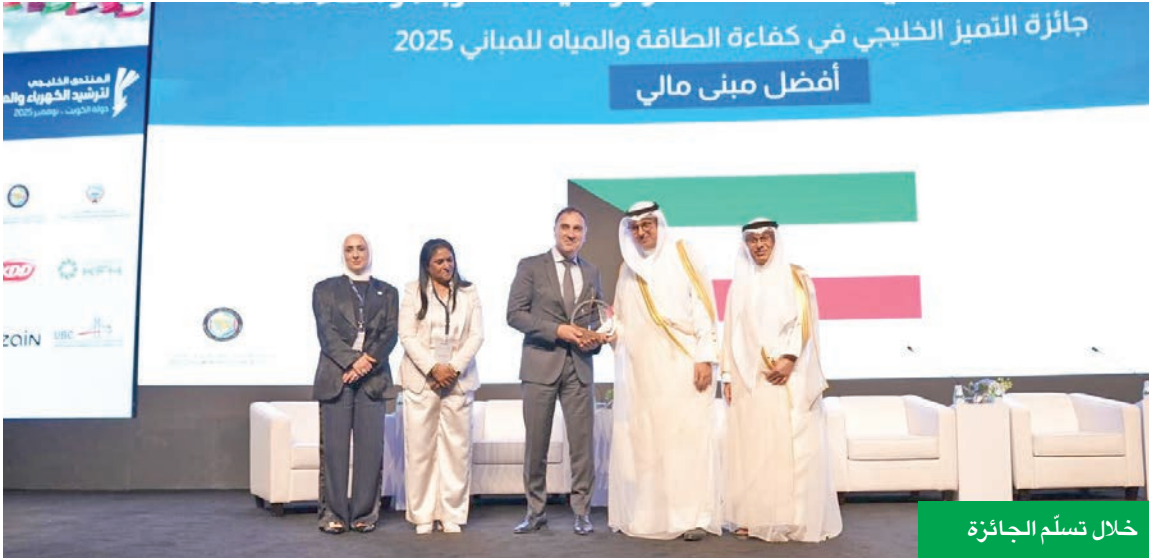
خلال تسلم الجائزة

يذكر أن المقر الرئيسي لبنك الكويت الوطني أصبح علامة فارقة في أفق مدينة الكويت، ورسخ مكانته كمعلم حضاري يجسد التزام البنك بالابتكار والمسؤولية البيئية، ليشكل نموذجاً يحتذى به في القطاع المالي.