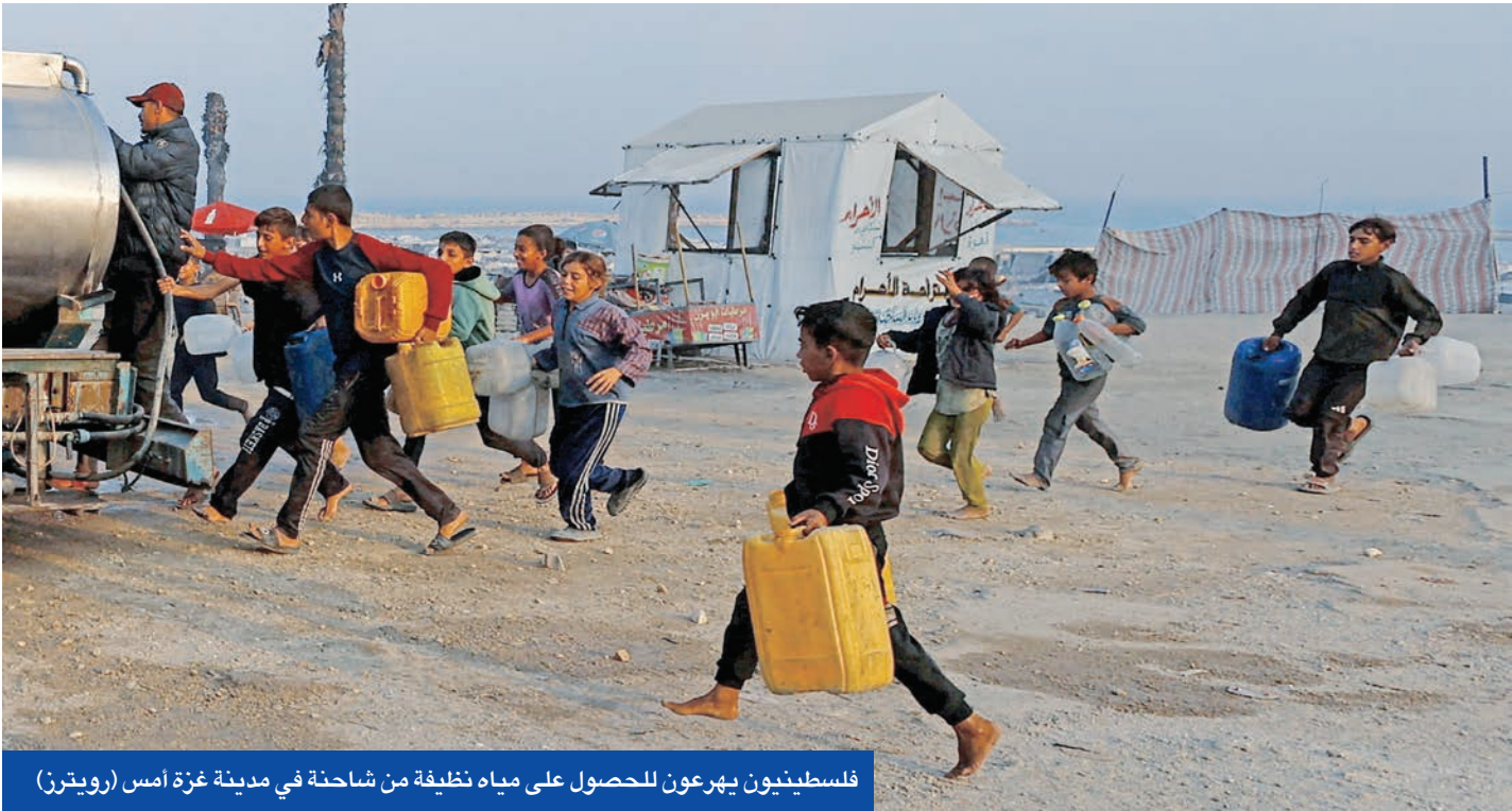
فلسطينيون يهرعون للحصول على مياه نظيفة من شاحنة في مدينة غزة أمس

والدوحة وواشنطن بضمان التقيده. وذكر «حماس» أن اللقاء تناول الانتهاكات الإسرائيلية، بما في ذلك استمرار القصف وإطلاق النار في المناطق التي يسيطر عليها جيش الاحتلال «وإغلاق المعابر بما فيها معبر رفح وتعطيل دخول المساعدات والمستلزمات الطبية واحتياجات إعادة بناء البنية التحتية».