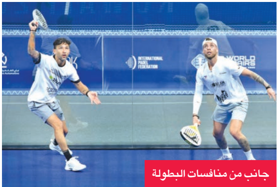
جانب من منافسات البطولة

تنتقل اليوم منافسات الدور ربع النهائي في بطولة كأس العالم للبادل (فئة الزوجي)، التي تستضيفها دولة الكويت حتى 9 الجاري على ملاعب «أرينا» أكاديمية رافا نادال، وسط مشاركة نخبة من أبرز لاعبي ولاعبات العالم.