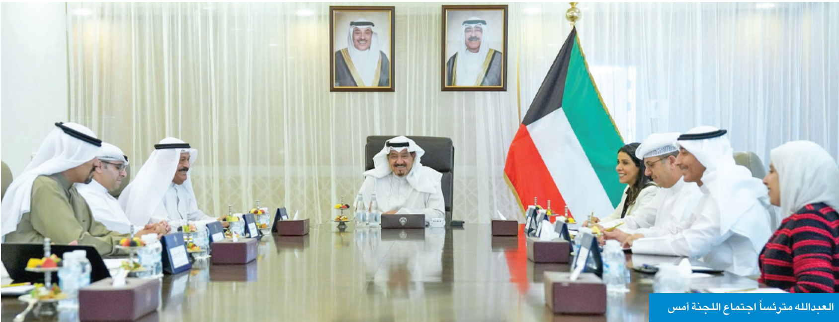
العبدالله مترأساً اجتماع اللجنة أمس

خلال ترؤسه اجتماع اللجنة الوزارية رقم 33 لمتابعة المشاريع التنموية الكبرى في البلاد، أكد رئيس مجلس الوزراء، سمو الشيخ أحمد العبدالله، أن «الاتفاقيات ومذكرات التفاهم السبع، التي وقّعت في 22 سبتمبر 2023 خلال زيارة سمو أمير البلاد الشيخ مشعل الأحمد إلى الصين، بدعوة من الرئيس الصيني شي جينبنغ، كانت الأهم بتاريخ العلاقات الثنائية، وتمثل نقلة نوعية تهدف إلى تعزيز وترسيخ الشراكة الاستراتيجية الشاملة، ومهدت الطريق للتفاهم بين الحكومتين، والبدء بتنفيذ مشاريع تنموية كبرى مشتركة في عدة مجالات مختلفة، وسوف تصب في تعزيز علاقات الصداقة المتميزة، وتدفع بعلاقاتهما في مجالات التعاون الاقتصادية والتجارية والاستثمارية إلى آفاق أرحب».