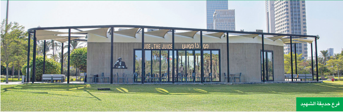
فرع حديقة الشهيد