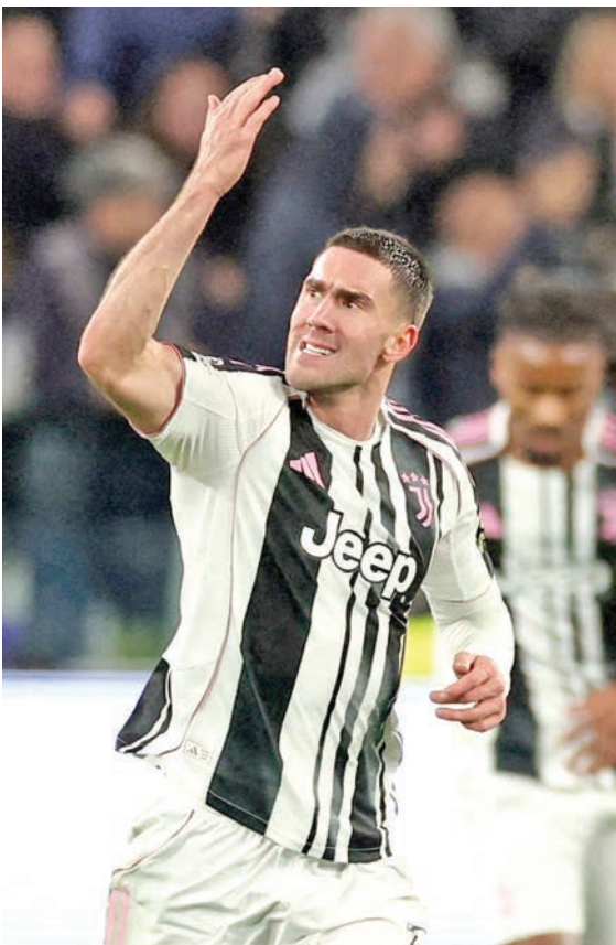
فلاهو فيتش نجم يوفنتوس خلال مباراة سابقة