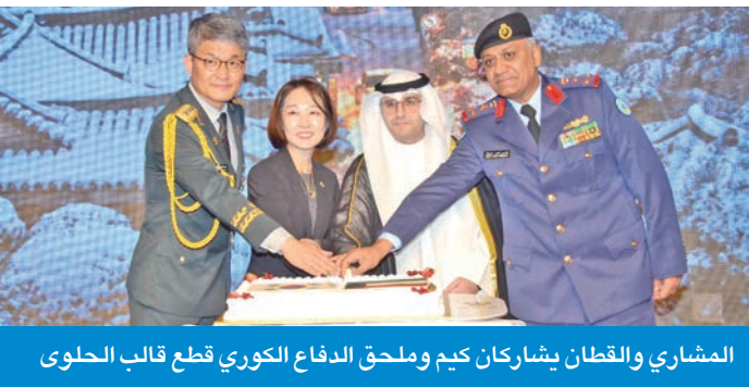
المشاري والقطان يشاركان كيم وملحق الدفاع الكوري قطع قالب الحلوى

وتابع: «وبعيداً عن الحكومات والمؤسسات، فإن ما يوحّدنا حقاً هو شعوبنا. وهنا في الكويت، نلمس ونقدّر بعظم تزايد الإعجاب بالثقافة الكورية وجوانبها المختلفة، مثل اللغة والطعام والسبنا والموسيقى، وذكر لنا الأصدقاء الكويتيون أنهم يدركون وجود أوجه تشابه عدة عند مشاهدتهم للمسلسلات الكورية، مثل الرابط العائلي والرفقي الأبني في التعامل وتكاتف المجتمع، وربما لهذا السبب تبدو تبادلاتنا طبيعية وصارفة. إنه لشرف أن أعمل في بلد يسوده هذا القدر من الصداقة الحقيقية». وقالت: «ستواصل كوريا والكويت في المستقبل التعلم من بعضهما البعض، ومن تمكين الجيل القادم، وتعزيز روح الابتكار والتقارب بينهما، إن الجسر الذي نبنيه ليس جسراً نحو التنمية والطور ففسب، بل جسر مودة وأمل مشتركة، يربط بين إنجازات الماضي وتطلعات الغد».