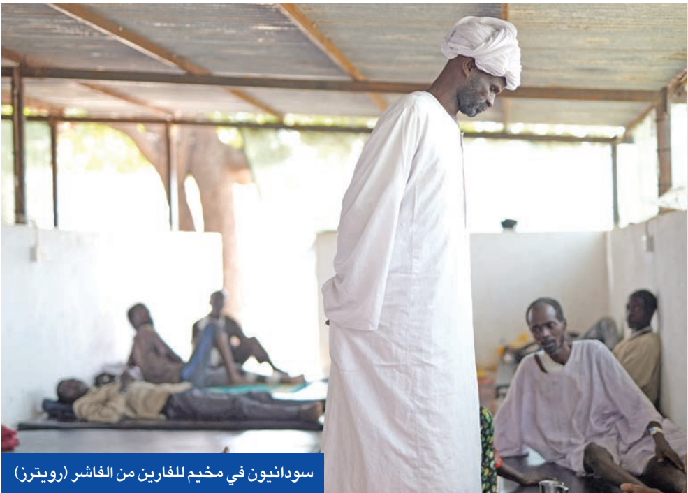
سودانيون في مخيم للفرارين من الفاشر

تسيطر قوات الدعم السريع حالياً على جميع ولايات إقليم دارفور الخمس غرباً، ويسيطر الجيش على معظم مناطق الولايات الـ13 المتبقية بالجنوب والشمال والشرق والوسط. وبشكل إقليمي دارفور نحو خمس مساحة السودان.