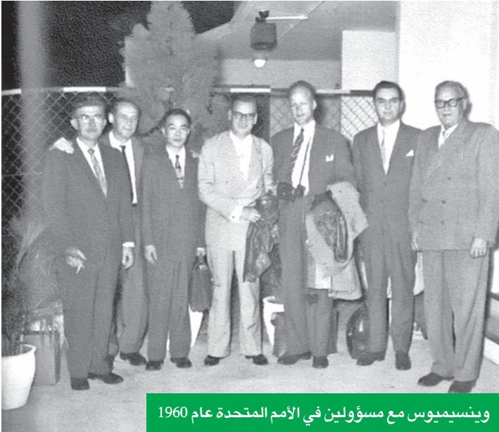
وينسيموس مع مسؤولين في الأمم المتحدة عام 1960

جوهر التخطيط الحقيقي في نظره: أن تزرع فكرة اليوم لتثمر في عقول أبناء الغد لا أن تبحث عن أرقام سريعة في التقارير السنوية