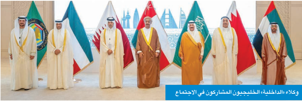
وكلاء «الداخلية» الخليجيون المشاركون في الاجتماع

عقد صباح أمس بالكويت اجتماع وكلاء وزارات الداخلية التحضيري للاجتماع الـ 42 لوزراء الداخلية بدول مجلس التعاون، برئاسة وكيل وزارة الداخلية رئيس الدورة الحالية، اللواء علي العدواني، ومشاركة وكلاء وزارات الداخلية بدول المجلس، وأعضاء الوفود وممثلي الأمانة العامة لمجلس التعاون.