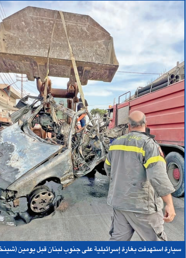
سيارة استهدفت بغارة إسرائيلية على جنوب لبنان قبل يومين

يرتفع وتيرة الخطاب التصعيدي الإسرائيلي تجاه لبنان، إذ يحرس المسؤولون الإسرائيليون يومياً على التلويح بالاستعداد لشنّ عملية عسكرية ضدّ حزب الله، بذريعة إعادة بناء ترسانته العسكرية. هذا التصعيد يثير تبايناً في التقديرات داخل الأوساط اللبنانية، في وقت تشير المعلومات إلى أن إدارة الرئيس الأميركي دونالد ترامب تميل إلى خيار الضغط السياسي، وتفضّل، في الحد الأدنى، منح لبنان مهلة شهر إضافية. في موازاة ذلك، تتكثّف الاتصالات على أعلى المستويات لتأمين مرور هادئ لزيارة البابا لاوون إلى لبنان، المقررة بين 30 الجاري و2 ديسمبر المقبل. وفي أحدث التهديدات الإسرائيلية، نقلت صحيفة معاريف العبرية عن الجيش الإسرائيلي، أمس، قوله إنه قد لا