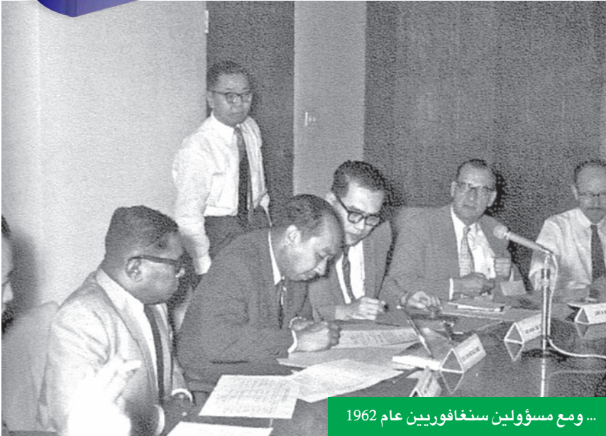
... ومع مسؤولين سنغافوريين عام 1962

في السبعينيات، بدأت نتائج الرؤية الشاملة تتجسّد بوضوح. ارتفع الناتج المحلي الإجمالي بمعدّلات قياسية، وتحول ميزان التجارة من العجز إلى الفائض.