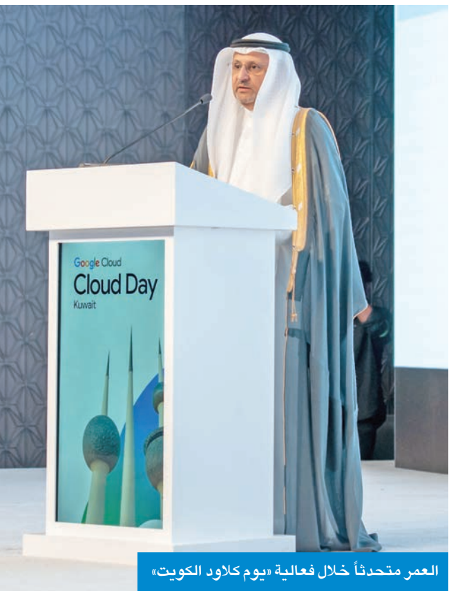
العمر متحدثاً خلال فعالية «يوم كلاود الكويت»

وأوضح أنه في إطار الاتفاقية تم إطلاق عدد من المشاريع الوطنية التي تشكل الأساس العملي للتحول الرقمي في الكويت أولها المنصة الوطنية لتبادل البيانات