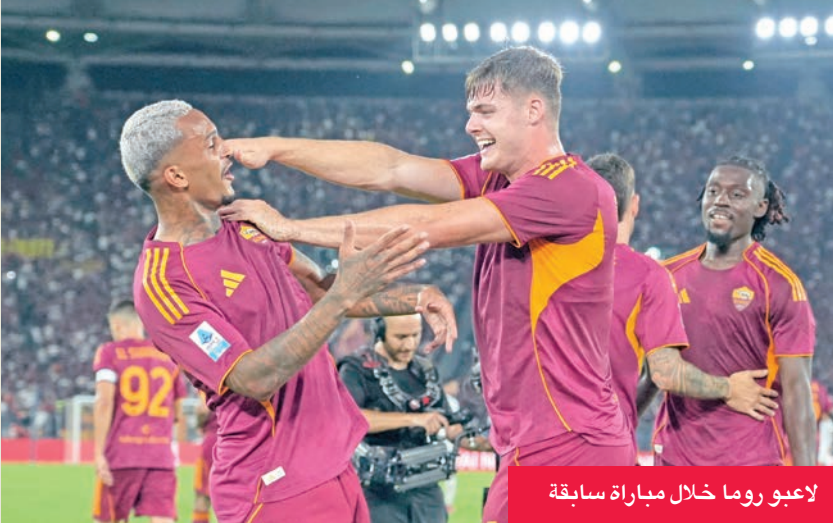
لاعبو روما خلال مباراة سابقة

يخوض روما الإيطالي اختباراً محفوفاً بالمخاطر عندما يحل ضيفاً على رينجرز الاسكتلندي اليوم في الجولة الرابعة من منافسات المجموعة الموحدة ضمن مسابقة الدوري الأوروبي «يوروبا ليغ»، في كرة القدم، في سعيه إلى تصحيح المسار القاري. واستهل فريق العاصمة الإيطالية مشواره في المسابقة التي حل وصيفاً بها في عامي 1991 و2023، بأفضل طريقة ممكنة عندما تغلب على مضيفه نيس الفرنسي 2-1 في الجولة الأولى، لكن مني بخسارتين متتاليتين أمام ضيفه ليل الفرنسي 1-0 وفيكوتوريا بلزن التشيكي 2-1 فوجده نفسه في المركز الثالث والعشرين قبل الأخير المؤهل للدور الفاصل المؤدي إلى ثمن النهائي.