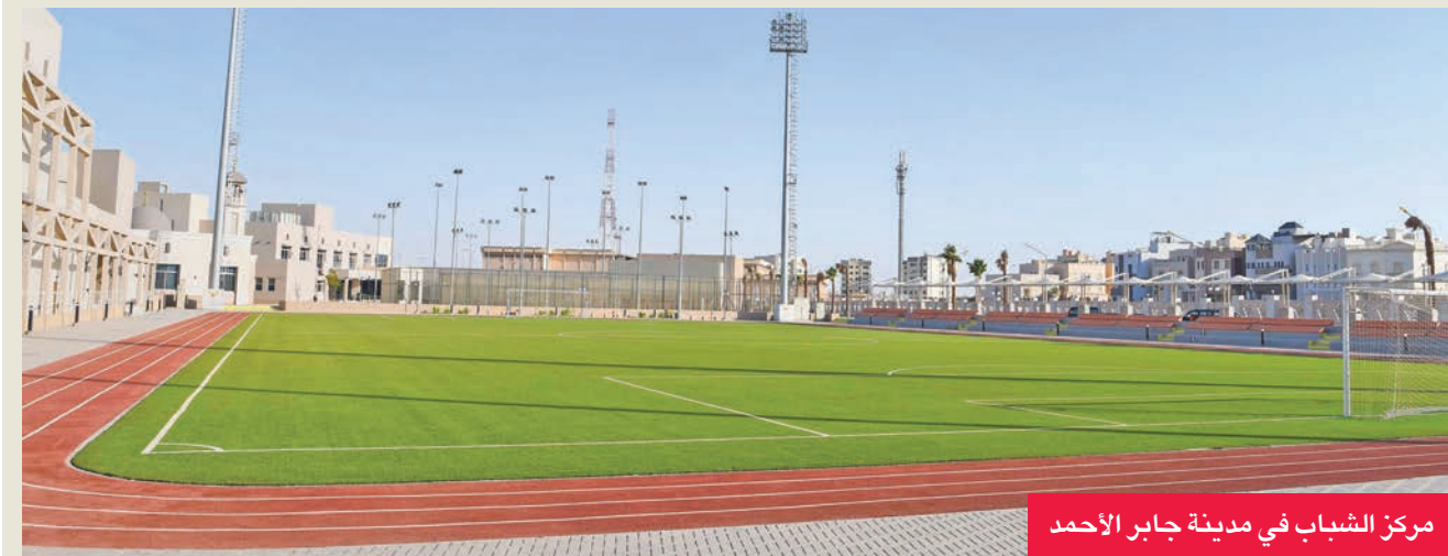
مركز الشباب في مدينة جابر الأحمد

أعمق تحمل معاني الإنسانية بالازمات. كما ترسخ المبادرة دور الرياضة كأداة لبناء السلام وتعزيز التعايش الاجتماعي، بما ينسجم مع أهداف الأمم المتحدة للتنمية المستدامة، ولا سيما الهدف العاشر، المستدام بالحد من عدم المساواة، والهدف السابع عشر المعني ببناء الشراكات، حيث تتماشى المبادرة مع توجهات كل من الأمم المتحدة الإيطالية والتاخي بين الشعوب، فهي تساهم في ترسيخ بيئة صحية تغرس في نفوس الأطفال قيم الروح الرياضية الحقيقية، وتحول حب كرة القدم إلى رسالة