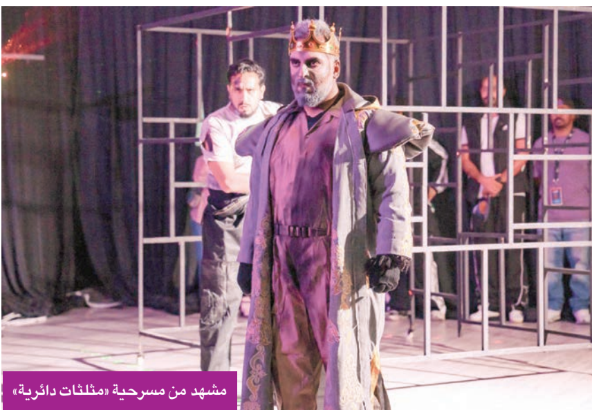
مشهد من مسرحية «مثلثات دائرية»

نجحوا في تجسيد شخصيات العمل بأسلوب جمع بين الأداء الواقعي والطرح الفلسفي. تولى تصميم الاستعراضات يوسف العززي، وأبدع أحمد السلطان في السينوغرافيا التي عكست الطابع التجريبي للعرض، وأسهم في تصميم الصوت محمد التركماني وعبد العزيز البكر، مما أضفى أجواء سمعية مكثفة دعمت الإحساس الدرامي للمشهد.