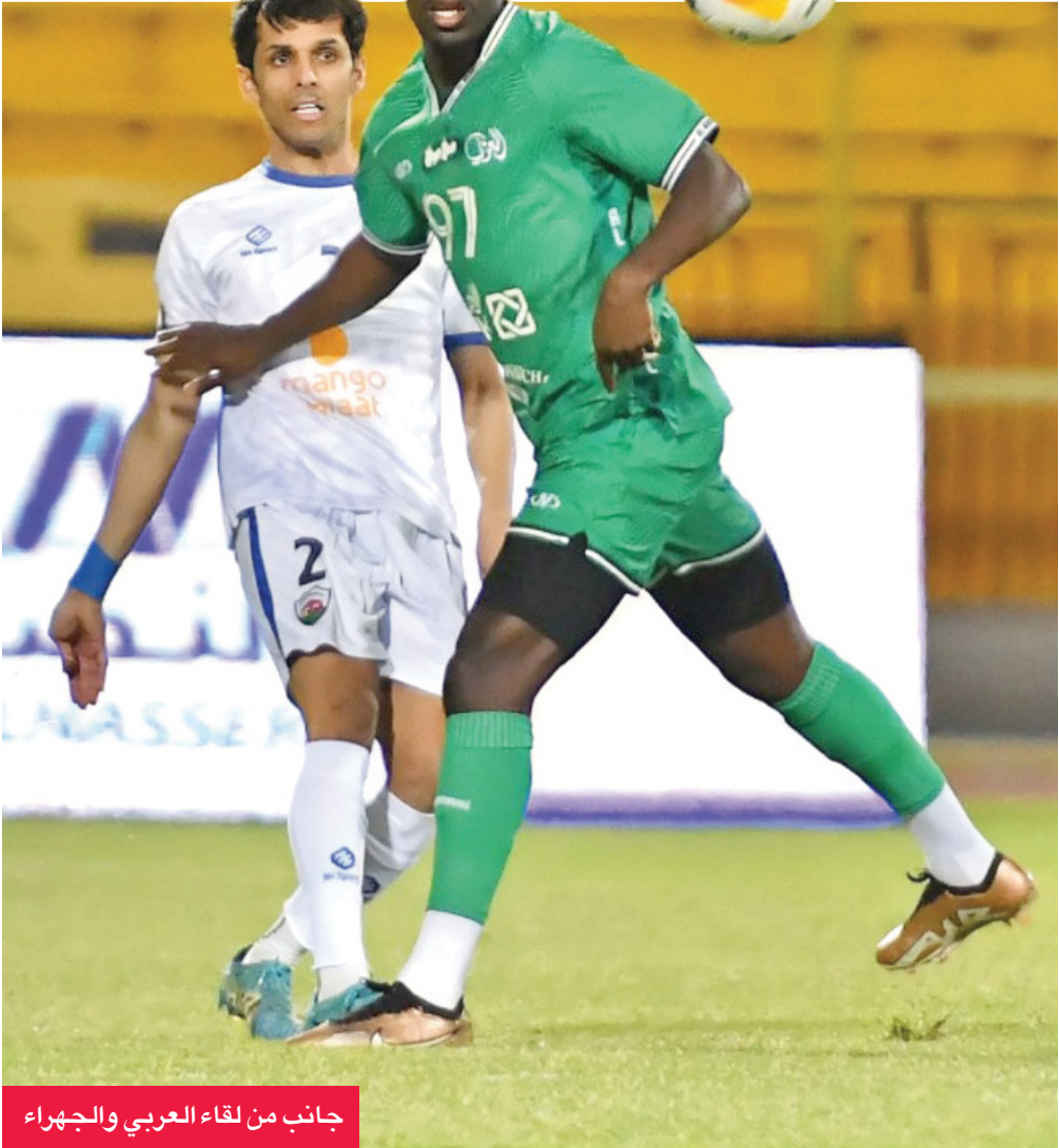
جانب من لقاء العربي والجھراء