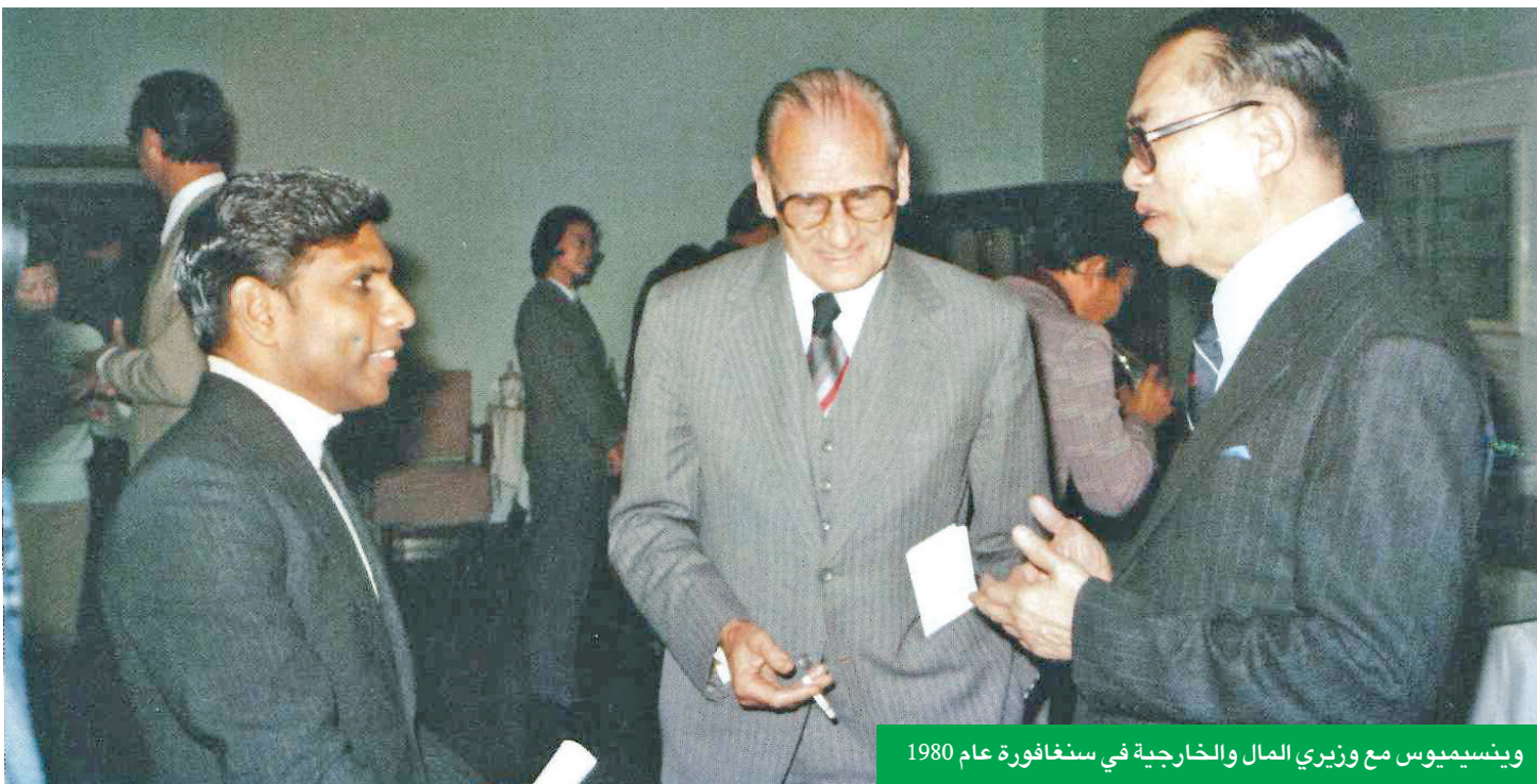
وينسيموس مع وزير المال والخارجية في سنغافورة عام 1980

أولاً: الاقتصاد ليس معادلة جامدة، بل قصة بشرية. كان وينسيموس يؤمن بأن التنمية ليست مجرّد أرقام في الموازنات أو جداول في تقارير البنك الدولي، بل منظومة متكاملة تبدأ من التعليم، وتنتهي في المصانع، مروراً بالقيم الاجتماعية التي تربط الإنسان بوطنه. هذا الفهم الإنساني للاقتصاد هو ما جعل خطته في سنغافورة قابلة للحياة. فقد سعى إلى بناء الإنسان قبل البنية التحتية، وإلى غرس ثقافة عمل قائمة على الكفاءة والنزاهة والانضباط، بدلاً من الاعتماد على الحوافز المالية وحدها.