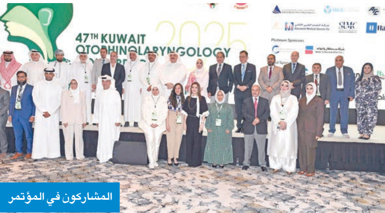
المشاركون في المؤتمر

في مستشفى حكومي على مستوى الشرق الأوسط لمعالجة اضطرابات التنفس أثناء النوم عبر زراعة شريحة ذكية تحفز العصب ال12 تحت اللسان بإيدي أطباء كويتيين. ولفت إلى نجاح المركز في إجراء عمليات زراعة قوقعة لأطفال رضع بعمر ستة وتسعة أشهر، بعد فقدانهم السمع، نتيجة التهاب السحايا، إلى جانب إدخال جهاز «TRV» لعلاج الدوار الحركي كأول جهاز من نوعه في البلاد، واستحداث عبادة أنف وأذن وحنجرة في منطقة صباح الأحد يومين أسبوعياً،