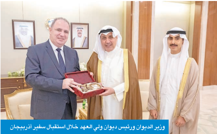
وزير الديوان ورئيس ديوان ولي العهد خلال استقبال سفير أذربيجان

الصادقين، والسبل الكفيلة لتعزيزها وتطويرها، بالتطلع إلى الارتقاء بالمصالح المشتركة. بينهما في المجالات كافة، لاسيما التجارية والثقافية. كما استقبل حمد الجابر سفيرا قبرص لدى الكويت أندرياس بانابوتو. وتناول اللقاء بحث العلاقات الطيبة التي تربط البلدين والشعبين