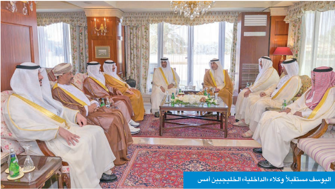
اليوسف مستقبلاً وكلاء «الداخلية» الخليجيين أمس

أكد يوسف أن الاجتماع التحضيري يمثل محطة مهمة في مسار الإعداد والتنسيق لطرح ومناقشة القضايا ذات الاهتمام المشترك، ويحث سبل تطوير البات التعاون وتبادل الخبرات بين وزارات الداخلية بدول المجلس، بما يعزز كفاءة الأجهزة الأمنية ويرسخ الأمن الإقليمي. وتمنى في ختام اللقاء لوكلاء وزارات الداخلية الخليجيين التوفيق والنجاح في أعمال اجتماعهم، وأن تسهم مناقشاتهم في تحقيق نتائج بناءة تدعم مسيرة العمل الخليجي المشترك وتعزز جهود حفظ الأمن والاستقرار في دول المجلس.