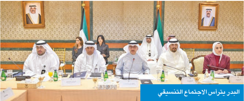
البدر يترأس الاجتماع التسيقي

المجالات السياسية والاقتصادية والاستثمارية والثقافية والتعليمية. وأشار إلى حرص الجهات الكويتية على تقديم أفضل المقترحات التي تعزز أطر الشراكة الاستراتيجية بين البلدين، وتخدم مصالح الشعبين الشقيقين.