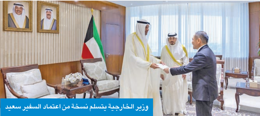
وزير الخارجية يتسلم نسخة من اعتماد السفير سعيد

تسلم وزير الخارجية عبدالله الحيا، أمس، نسخة من أوراق اعتماد سفير سلطنة برونائي دار السلام لدى الكويت حاجي سليلي حاجي سعيد، خلال اللقاء الذي تم في الديوان العام للوزارة.