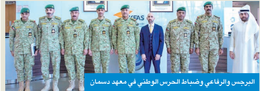
البرجس والرفاعي وضباط الحرس الوطني في معهد دسمان

في سياق آخر، نفذت كتيبة حماية المنشآت الخامسة من لواء الحماية الثاني بالحرس الوطني تمرين «إخلاء 9» في موقع المقوع الشمالي، بمشاركة وزارة الداخلية، وشركة نفط الكويت، بهدف تدريب المنتسبين على مواجهة الحالات الطارئة حال حدوثها، بحضور قائد التعزین العمید الركن عبدالله عبد الله، وقائد الشؤون الأمنية العميد الركن أحمد جرمان. وأكد قائد التعزین حرس الحرس على إجراء مثل هذه التمارين لرفع الجاهزية، مثنياً تعاون الجهات المشاركة في نجاح التمرين الذي أظهر كفاءة القوات في تنفيذ واجباتها في مثل هذه الظروف والمواقف.