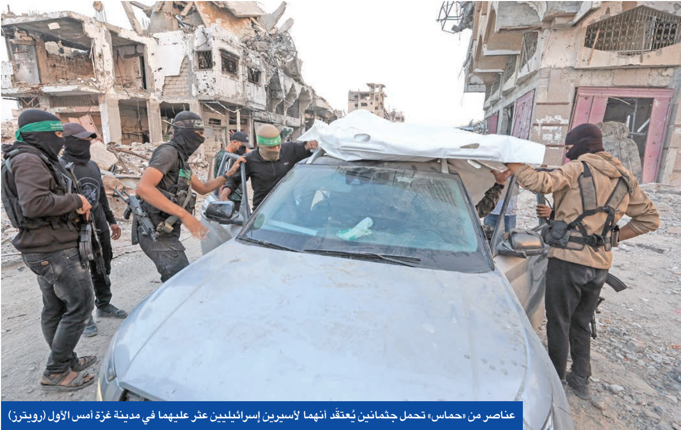
عناصر من «حماس» تحمل جثمانين يُعتقد أنهما لأسيرين إسرائيليين عثر عليهما في مدينة غزة أمس الأول

القتال الحالية وتعليمات الجيش لا توفر استجابة كافية لهذا التحدي وفي ظل غياب الأدوات والقدرات اللازمة للتعامل معه».