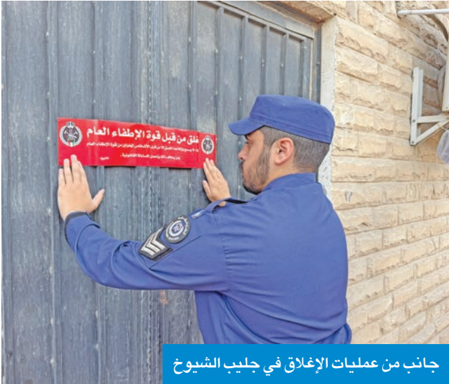
جانب من عمليات الإغلاق في جلبب الشيوخ

نفذت قوة الإطفاء العام، صباح أمس، حملة تفتيش بمنطقة جلبب الشيوخ، تنفيذاً لتوجيهات النائب الأول لرئيس مجلس الوزراء وزير الداخلية الشيخ فهد اليوسف، وبإشراف ميداني من رئيس «الإطفاء» بالإنابة العميد محمد القحطاني، بهدف التأكد من التزام المحلات والمنشآت باشتراطات السلامة والوقاية من الحريق.