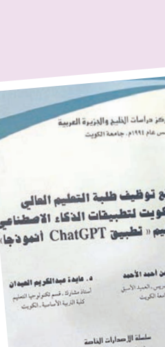
ملحة لإصدار الكتاب (سلسلة علمية عامة) العدد ٢٠٢٥

وكشف البحث عن نتائج مهمة، منها أن 93.3 في المئة من أفراد العينة من طلبة التعليم العالي بالكويت يستخدمون تطبيق Chat GPT في الأغراض العلمية، وأوصى البحث بضرورة توعية الطلبة بحدود التعامل المسموح مع تطبيقات الذكاء الاصطناعي، وتعزيز أخلاقيات التعامل معها، وتخمية المعرفة لديهم بحقوق النشر والقوانين المتعلقة بها.