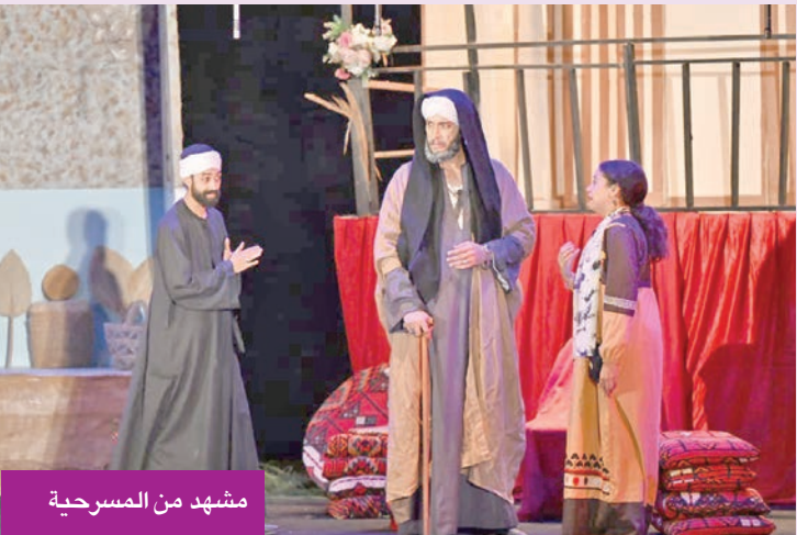
مشهد من المسرحية