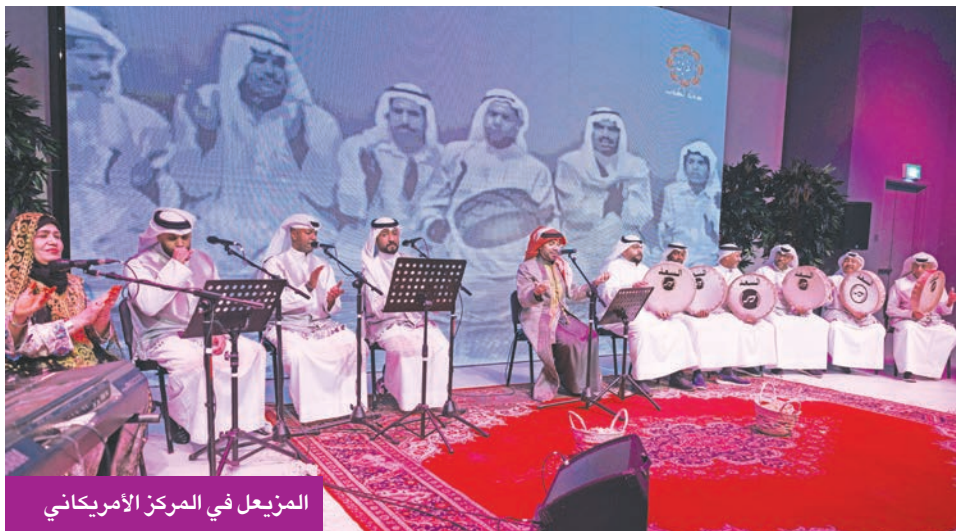
المزيعل في المركز الأمريكي

«وجنكنا يا البيت الرفيع العالي»، فامتلات الأجواء بعبق الماضي، وصوت الطار الذي يفيض ذاكرة الفن الشعبي الكويتي. وانتقل إلى لون آخر من الغناء الشعبي، ليصبح بـ «الحب باهل الهوى فصاح... لا واعداي من أسبابه»، قبل أن يُبحر بالحضور في تنوّع جميل من الفنون الشعبية، مقدّمًا من الفن البدوي أغنية «قولوا هلا بالكويتية»، ومن الفن السواحلي: «عينو رميني»، وصادفت قمرى، ومن الفن القادري «بللى يا ليلى»، ومن الفن السامري «أغنم زمانك أمانة»، واختتمت الأمسية بالأغنية الوطنية «شعب الكويت كلهم»، لينفاعل معها الحضور بحماس كبير وتصفيق متواصل، تعبيراً عن مشاعر الانتماء والفرح.