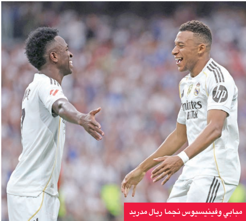
مبابي وفينيسيوس نجما ريال مدريد

الفريق الهجومية المتمثلة في كيليان مبابي، الذي سجل 11 هدفاً في 10 مباريات بالدوري، آخرها في مرمى برشلونة، بالإضافة إلى البرازيلي فينيسيوس جونيور وجود بيلينغهام.