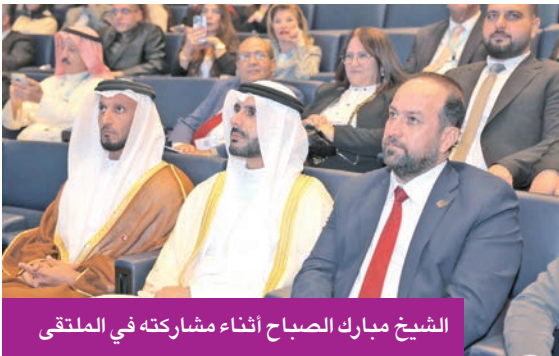
الشيخ مبارك الصباح أثناء مشاركته في الملتقى

العربي في نشر الوعي والتنوير. وأعرب عن سعادته برعاية وحضور الرئيس عون لهذا الحدث العربي الكبير، ووخّه شكره وتقديره لوزير الإعلام اللبناني د. بول مرقس، والأمين العام للملتقى الإعلامي العربي ماضي الخميس، وجميع القائمين على الملتقى، مشيداً بجهودهم المتميزة في إنجاح النسخة الحادية والعشرين من هذا الحدث الإعلامي العربي البارز.