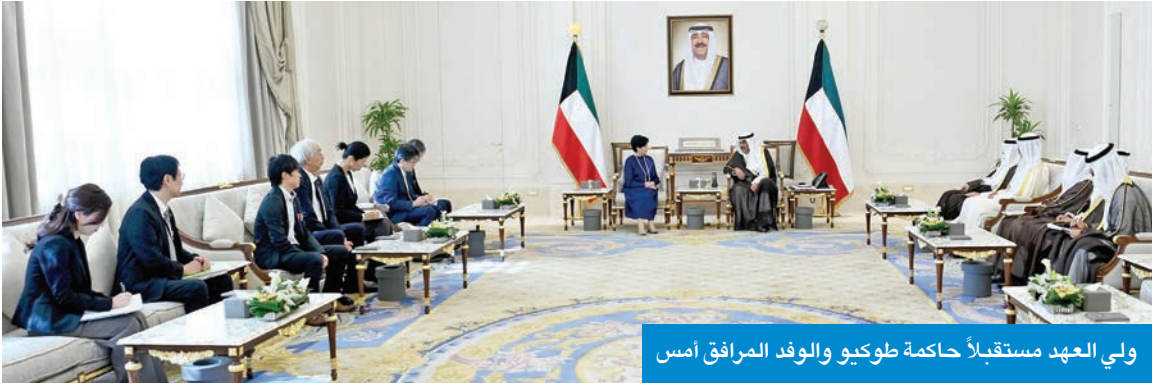
ولي العهد مستقبلاً حاكمة طوكيو والوفد المرافق أمس

استقبل سمو ولي العهد الشيخ صباح الخالد، بقصر بيان، صباح أمس، حاكمة طوكيو في اليابان يوريكو كويكي والوفد المرافق، وذلك بمناسبة زيارتها للبلاد.