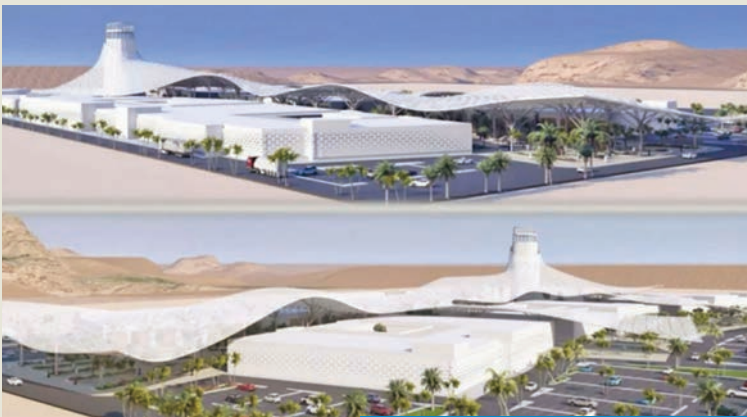
سوقا الخيام والطيور في الجهراء