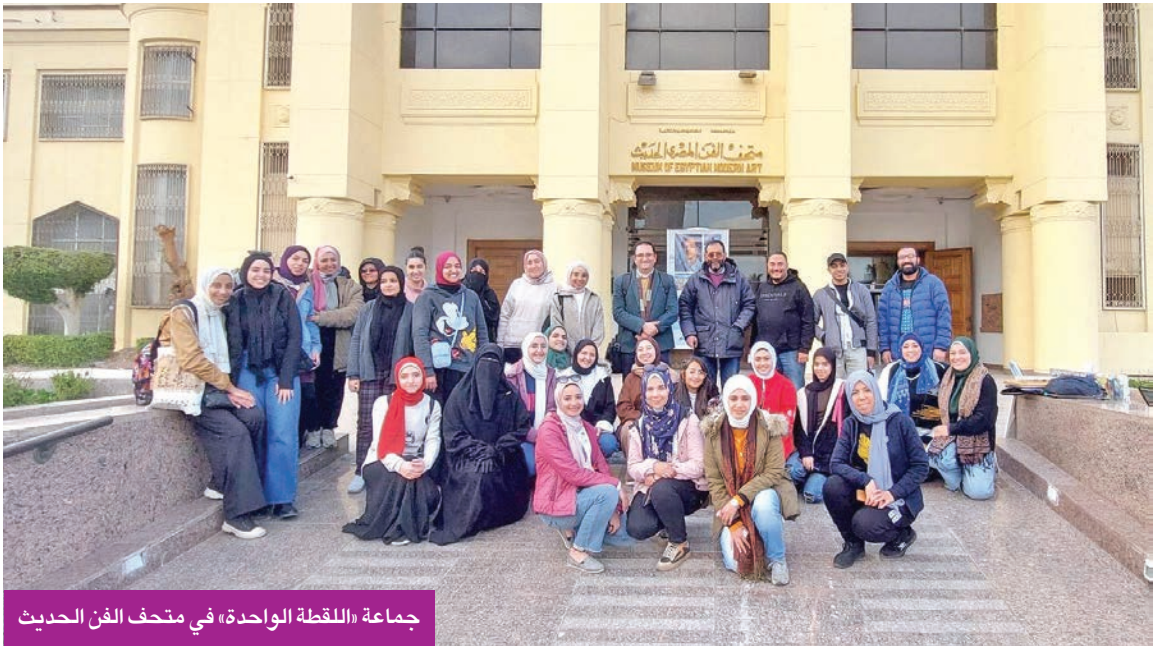
جماعة «اللغة الواحدة» في متحف الفن الحديث