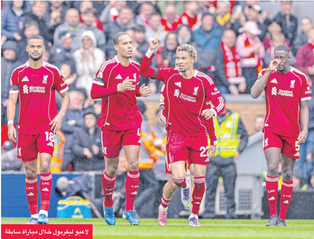
لاعبو ليفربول خلال مباراة سابقة

يحل أستون فيلا ضيفاً على ليفربول، السبت، ضمن المرحلة العاشرة من الدوري الإنكليزي الممتاز لكرة القدم. ويدخل ليفربول المباراة على أمل الخروج من دوامة النتائج السلبية ووضع حد للهزائم المتتالية للفريق في الفترة الماضية. وتلقى فريق المدرب ارني سلوت الهزيمة السادسة في آخر 7 مباريات يوم الأربعاء، وذلك عندما واجه كريستال بالاس في كأس رابطة الأندية الإنكليزية المحترفة، وهذه كانت الخسارة الثالثة لليفربول من كريستال بالاس تحديداً هذا الموسم في مختلف المسابقات.