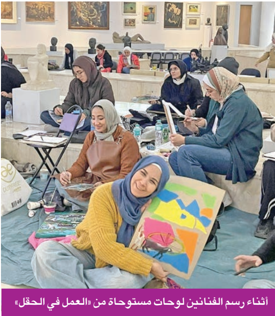
أثناء رسم الفنانين لوحات مستوحاة من «العمل في الحقل»

بين مساحات اللون ووهج الريف المصري، يمتد معرض «حقول عياد»، المُقام حالياً في القاهرة، كمقطوعة بصرية تعزفها ريشات 32 فناناً من جماعة «اللغة الواحدة»، التي تواصل منذ سنوات مشروعاتها في استلهام تراث الفن المصري بروح معاصرة. وفي قاعة صلاح طاهر بدار الأوبرا المصرية، تحولت لوحة الفنان الراحل راغب عياد الشهيرة (العمل في الحقل) إلى بذرة لحكايات لونية جديدة، خرجت من رحم الذاكرة الجماعية لتعيد اكتشاف روح مصر في ثوب حديث.