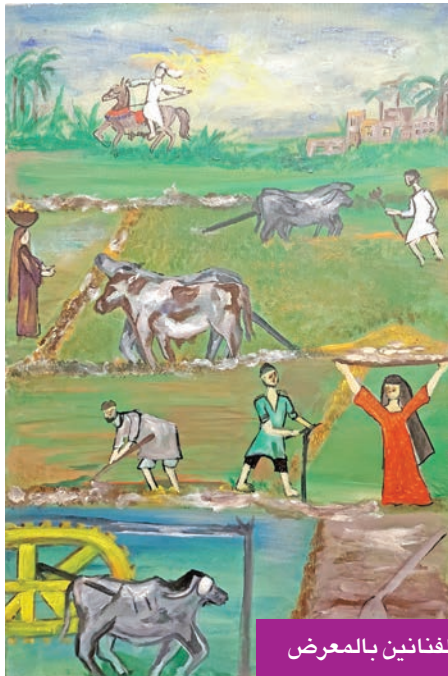
نماذج من أعمال الفنانين بالمعرض