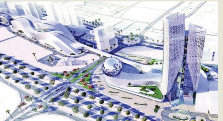
مركز عبدالله الأحمد الثقافي

بشكل يوزع حجم السياح بشكل متساو. وفي السالمة تحديداً، تحمل البلدية على إعداد تصورات نهائية حول استنفار موقع برايبح سالم مع إعطاء فرصة أكبر للصندوق الوطني لرعاية وتنمية المشروعات الصغيرة والمتوسطة لوضع تصوراته وأفكاره التي من شأنها تهدف لدعم فئة المشاريع الصغيرة، خصوصا أن الموقع يعتبر مثاليا في نهاية طريق الدائري الرابع. كما لن تغفل البلدية عن نيتها بتطوير مشروع سوق إنجاز في منطقة الري والقريب من سوق الجمعة، وهو أيضا مخصص ضمن المشاريع الداعمة للمشروعات الصغيرة والمتوسطة، وكان قطاع المشاريع العلم السياحي والترائي في على مستوى الخليج العربي، حينما يزيد الفرق المكلف في قطاع المشاريع من عمل الاجتماعات لإنهاء من رسم البنية التحتية التي تعد لتحدي الأكبر للمشروع كما أعلنت عنه البلدية مسبقاً، ولتكون المرحلة التي تسهل تحويل مواقف السيارات إلى السرداب، وتطوير المساحات الحالية في الموقع الرابطة لمكونات المشروع والضخم، حيث يتكون المشروع من 10 مناطق مترابطة