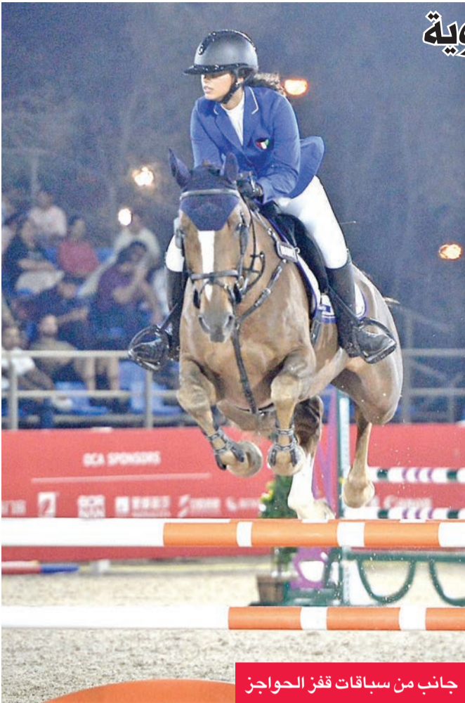
جانب من سباقات قفز الحواجز