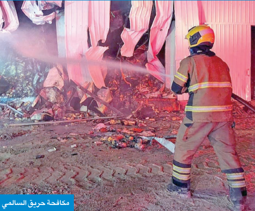
مكافحة حريق السالمي

إلى مواقع أخرى من المزرعة، مشيرة إلى أن الحادث لم يسفر عن وقوع إصابات واقتصر على الخسائر المادية.