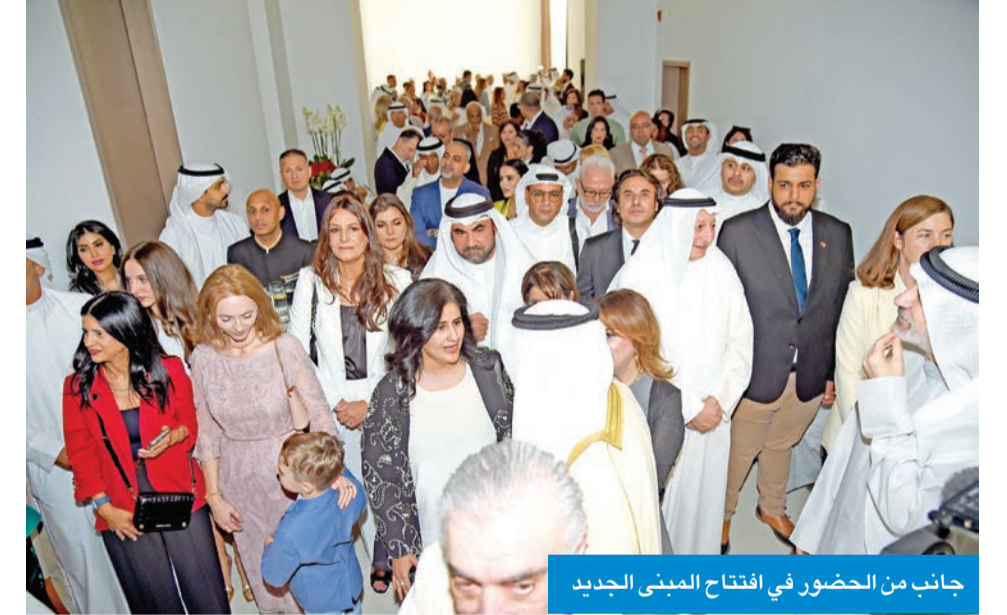
جانب من الحضور في افتتاح المبنى الجديد