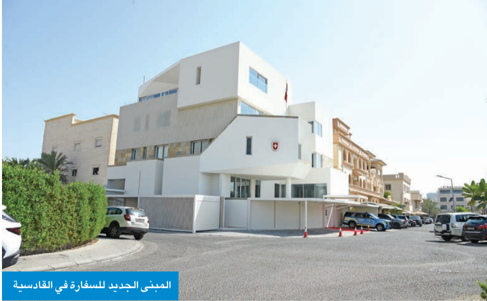
المبنى الجديد للسفارة في القادسية

وأضاف كاسيس، في كلمته بالافتتاح، أن الكويت تمثل نموذجاً في