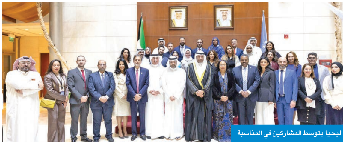
البحيا يتوسط المشاركين في المناسبة