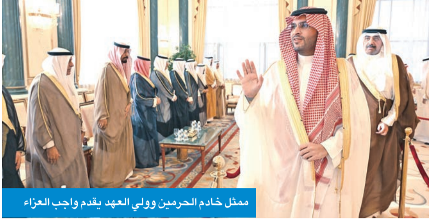
ممثل خادم الحرمين وولي العهد يقدم واجب العزاء