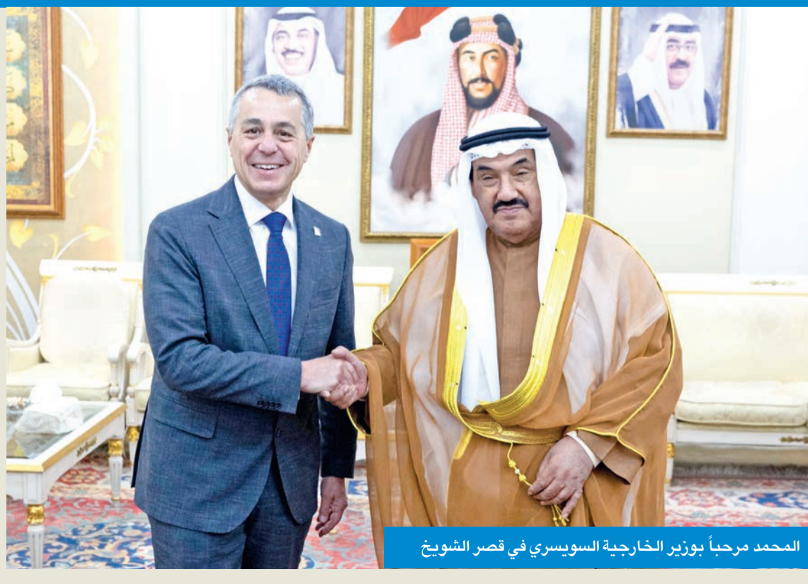
المحمد مرحباً بوزير الخارجية السويسري في قصر الشيوخ

استقبل سمو الشيخ ناصر المحمد في قصر الشيوخ أمس وزير خارجية الاتحاد السويسري اغناسيو كاسيس، وذلك بمناسبة زيارته للبلاد لحضور مراسم افتتاح مبنى السفارة السويسرية الجديد بمنطقة القادسية، كما أقام سموه مأدبة غداء على شرف الوزير الضيف والوفد المرافق له.