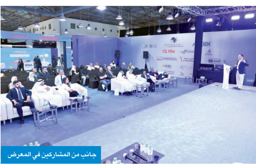
جانب من المشاركين في المعرض

إنجاح هذا الحدث من منظّمين ومتطوعين ومتحدثين. وأكد السيوسف أن هذا المعرض يمثل تجربة رائدة للرابطة في الجمع بين التثقيف الصحي والعلمي، ويعكس التوجه المستقبلي نحو نشر الوعي المتكامل بأمراض الكلى، بما يعود بالنفع على المرضى والمجتمع.