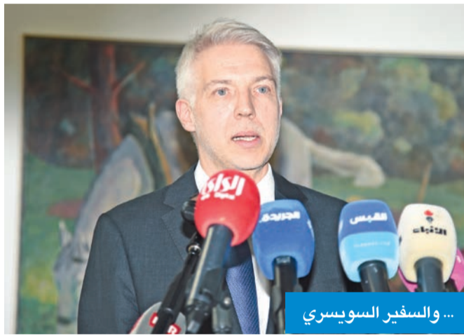
... والسفير السويسري

من جانبه، ذكر وزير الخارجية السويسري إينباتسيو كاسيس أن افتتاح السفارة الجديدة في الكويت