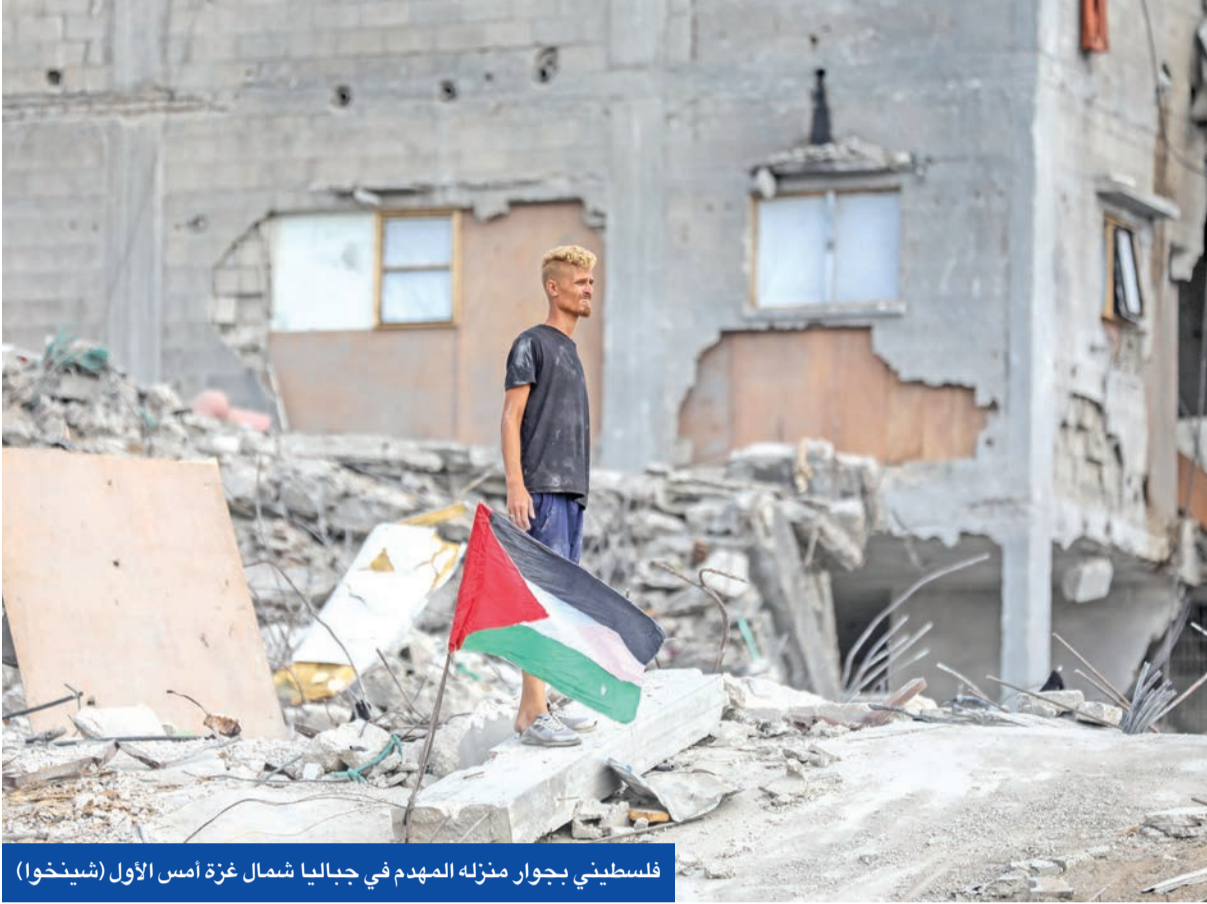
فلسطيني بجوار منزله المهدم في جنابا شمال غزة أمس الأول

تراشق بين الفصائل بعد اجتماع القاهرة... والأردن يرفض المشاركة في «القوة الدولية»