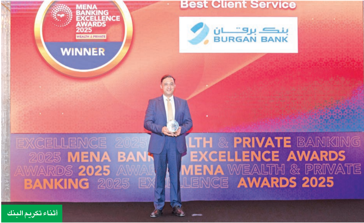
إثناء تكريم البنك

البنك حصل عليها ضمن جوائز ميد للتميز المصرفي بالشرق الأوسط وشمال إفريقيا لعام 2025