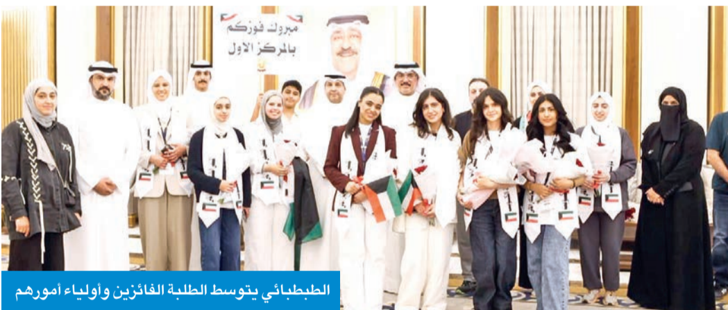
الطبيبائي يتوسط الطلبة الفائزين وأولياء أمورهم

أكد وزير التربية، م. سيد جلال الطبيبائي، اعترازه بإنجازات التي يحققها طلبة الكويت بالمسابقات العلمية، مشيراً إلى أنهم رفعوا اسم الكويت بالمحافل الدولية.