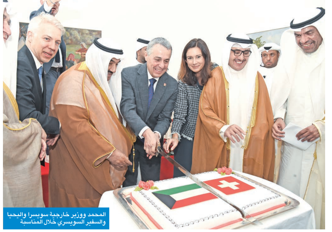
المحمد ووزير خارجية سويسرا واليحييا والسفير السويسري خلال المناسبة