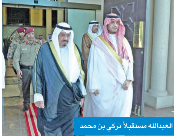
العبدالله مستقبلاً تركي بن محمد

الذين شاركوا في تقديم التعازي بوفاة العبدالله. وقال الديوان، في بيان له، نسال الله تعالى أن يجزيهم خيراً، وأن يحفظهم من كل مكروه، وندعوه سبحانه وتعالى أن يتغمّد الفقيد بواسع رحمته، وأن يسكنه فسيح جناته.