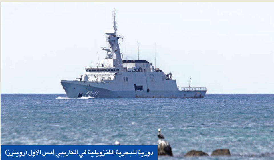
دورية للبحرية الفنزويلية في الكاريبي أمس الأول

والخميس الماضي، وافقت دول الاتحاد الأوروبي على الجولة 19 من العقوبات ضد روسيا، والتي تشمل استهداف قطاع الغاز الطبيعي في البلاد لأول مرة.