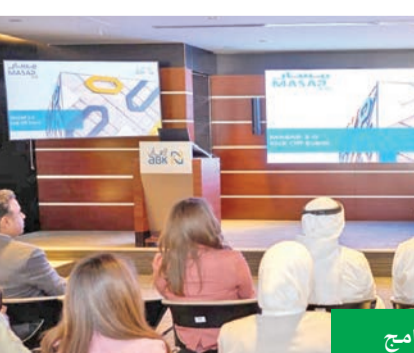
جيل جان فان دير تول متحدثاً في انطلاقة البرنامج

بنسخته الثانية يمثل نقلة نوعية في خطط البنك لتنمية رأس المال البشري ومواكبة التطورات في القطاع، مشيرة إلى تصميمه بعناية فائقة، استجابة للاحتياجات التدريبية للمشاركين، وضمن استراتيجية البنك للموارد البشرية، لضمان أعلى الكفاءات الوطنية الشابة، والاستمرار في تقديم أعلى مستويات الجودة والإنتاجية التي يتوقعها العملاء ويطلع لها البنك.