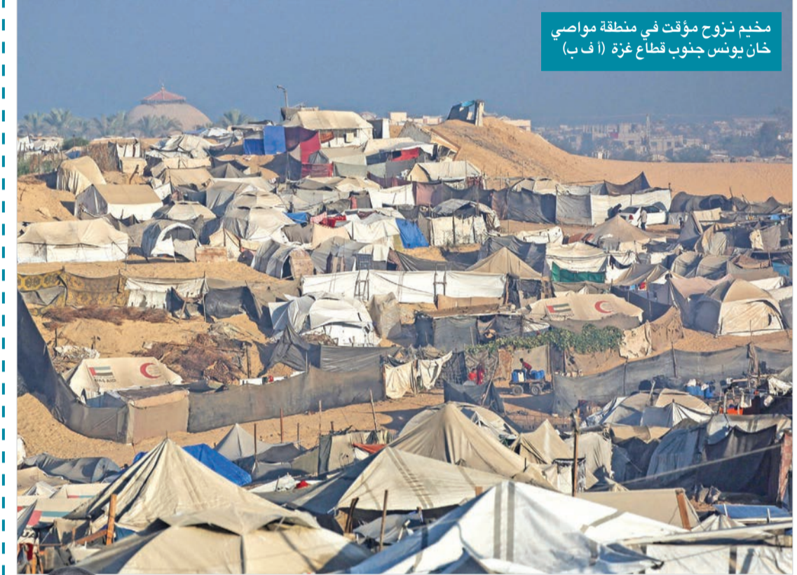
مخيم نزوح مؤقت في منطقة مواصي خان يونس جنوب قطاع غزة