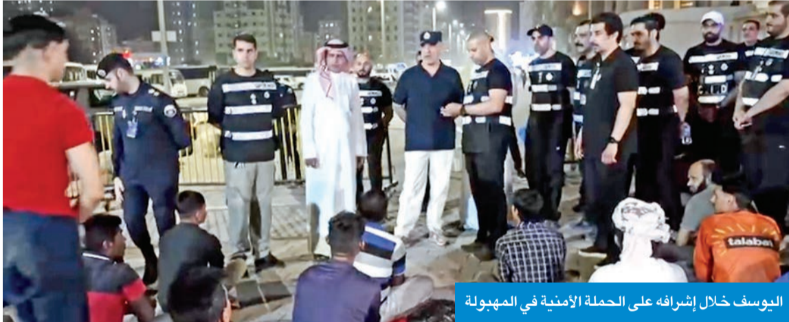
اليوسف خلال إشرافه على الحملة الأمنية في المهبولة

الإجراءات القانونية بحق كل من يخالف القوانين، بما يسهم في حفظ الأمن وتعزيز السلامة المرورية.