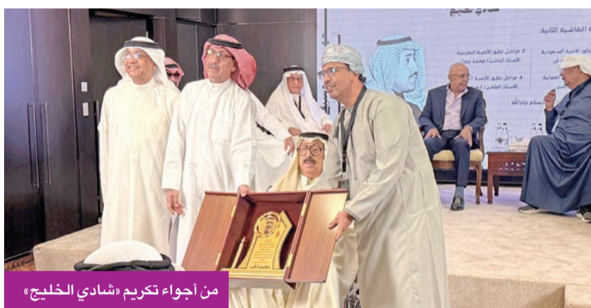
من أجواء تكريم «شادي الخليج»

ملتقى شخصية المهرجان شهد مشاركة مكثفة من الأكاديميين والباحثين