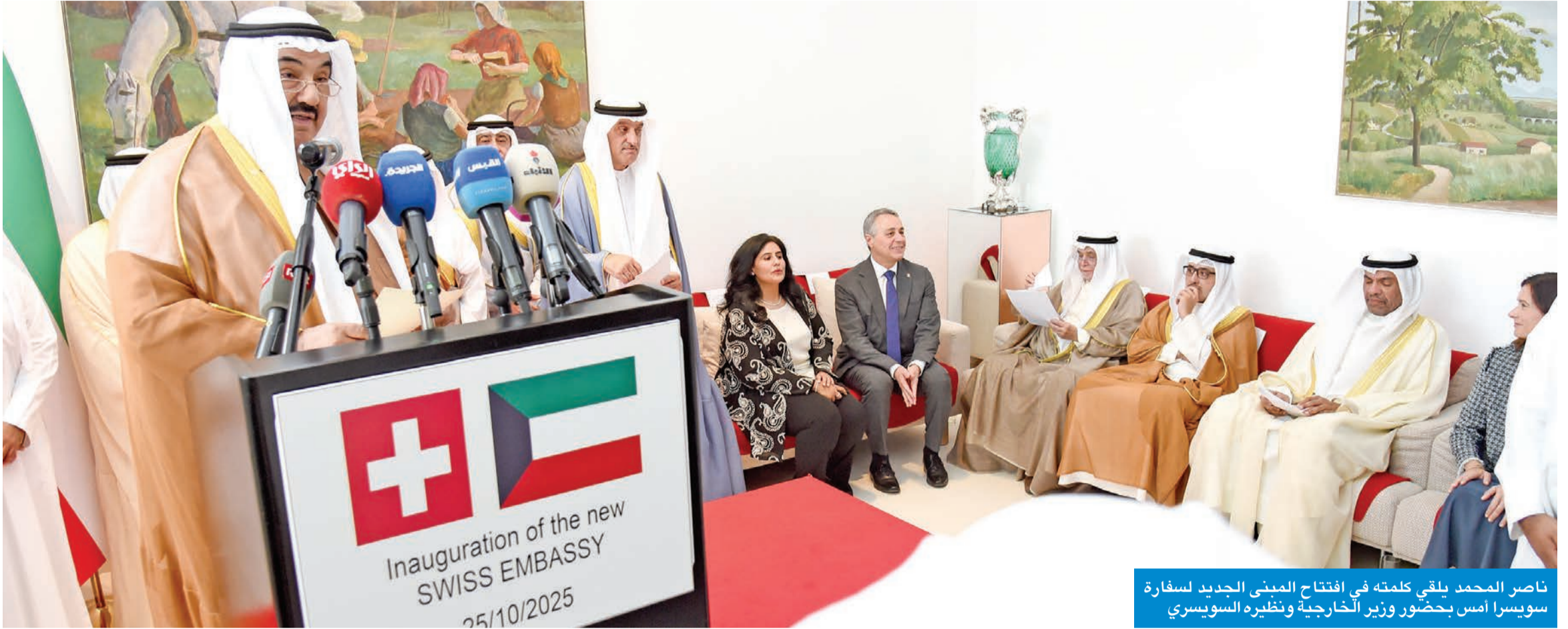
ناصر المحمد يلقي كلمته في افتتاح المبنى الجديد لسفارة سويسرا أمس بحضور وزير الخارجية ونظيره السويسري

● «سويسرا ليست مجرد مركز مالي عالمي أو وجهة آمنة للاستثمارات بل نموذج فريد للدولة الناجحة»