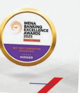
بنك الخليج يحصد جائزة رائدة عن «أفضل برنامج للجيل القادم في إدارة الثروات والخدمات المصرفية الخاصة»

وأعلن بنك الخليج فوزه بجائزة «أفضل برنامج للجيل القادم»، ضمن فعاليات جوائز التميز المصرفي في إدارة الثروات والخدمات المصرفية الخاصة لمنطقة الشرق الأوسط وشمال إفريقيا 2025، التي نظمتها مجلة MEED العالمية في دبي. وتأتي هذه الجائزة تقديراً لجهود بنك الخليج في تطوير برامج مصرفية مبتكرة تستهدف