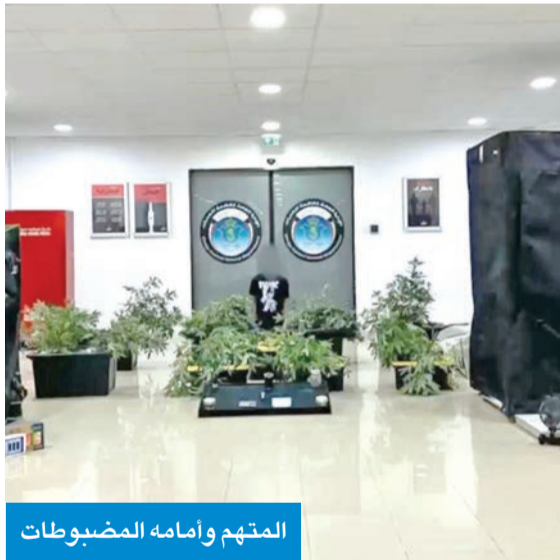
المتهم وأمامه المضبوطات