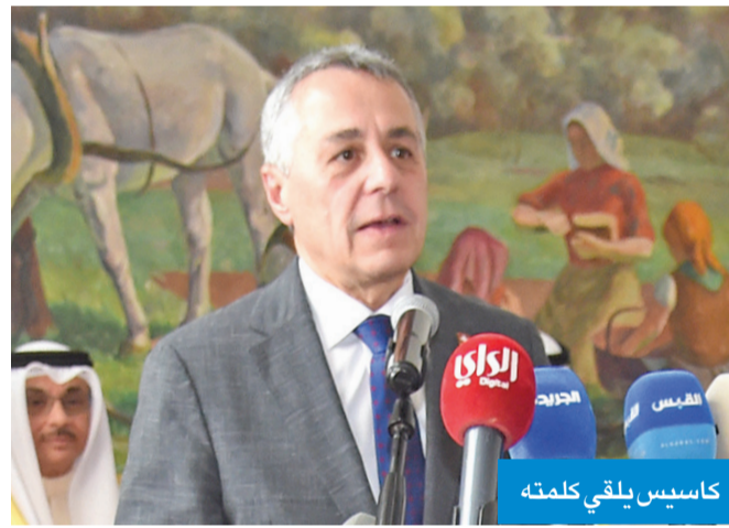
كاسيس يلقي كلمته

وبين السلطة والأخلاق، وقد استطاعت أن تؤدي دوراً فاعلاً كوسيط محايد في القضايا الدولية والإقليمية، بفضل حيادها التاريخي وثقة العالم في سياساتها الخارجية الهادئة. وأردف: «تميزت الدبلوماسية السويسرية بالهدوء والسرية والابتعاد