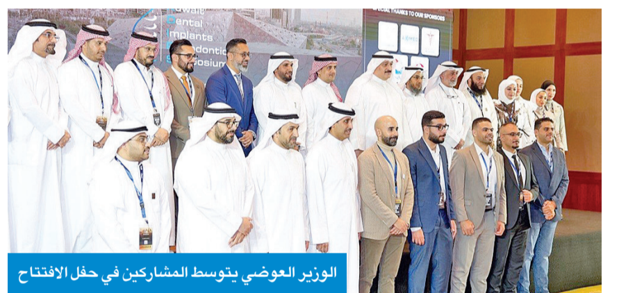
الوزير العوضي يتوسط المشاركين في حفل الافتتاح

تشجيع الكفاءات الوطنية على الإبداع والابتكار والتميز المهني