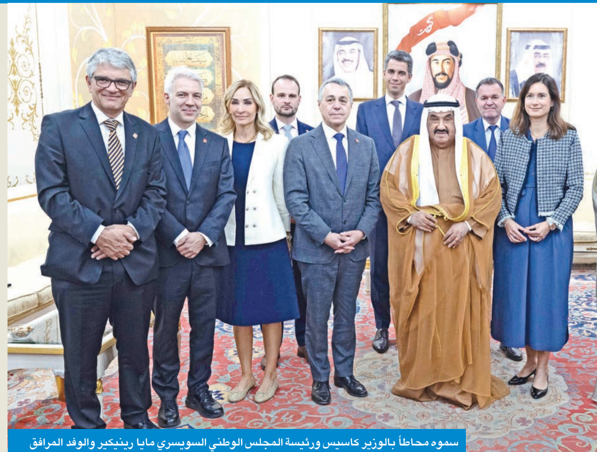
سموه محاطاً بالوزير كاسيس ورئيسة المجلس الوطني السويسري مايا رينيكير والوفد المرافق