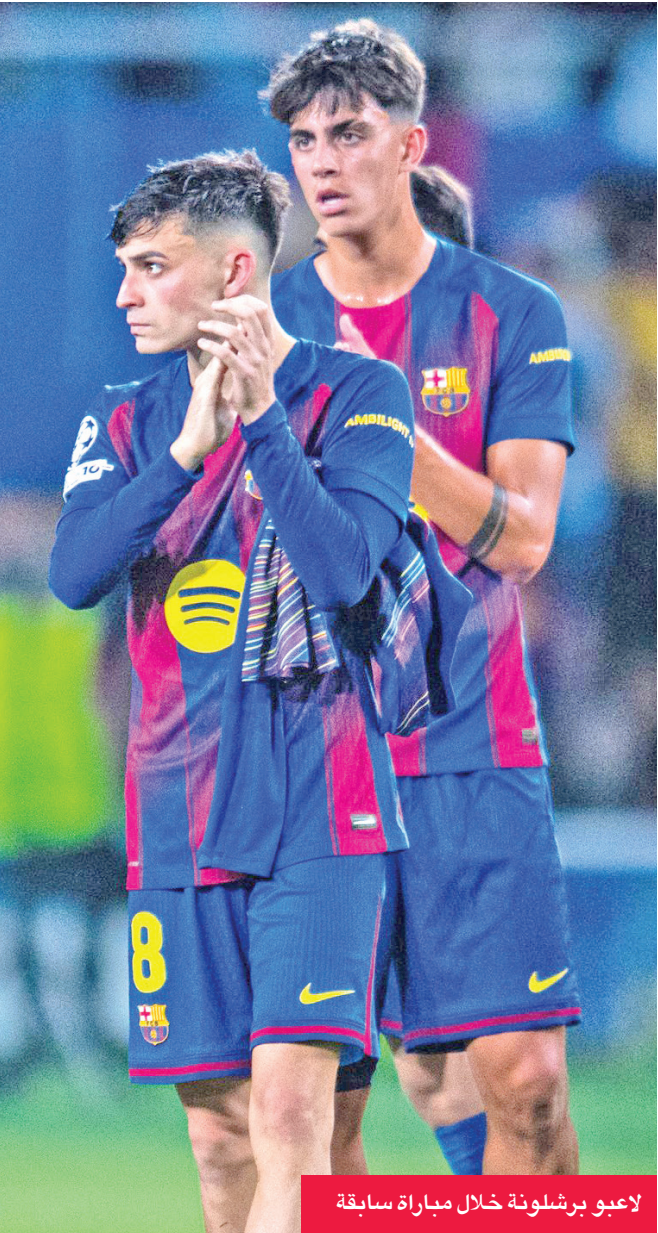
لاعبو برشلونة خلال مباراة سابقة

وغاب النجم الشاب جمال عن الهزيمة القاسية في الأندلس، ثم عن المباراتين الأخيرتين للمنتخب الإسباني في