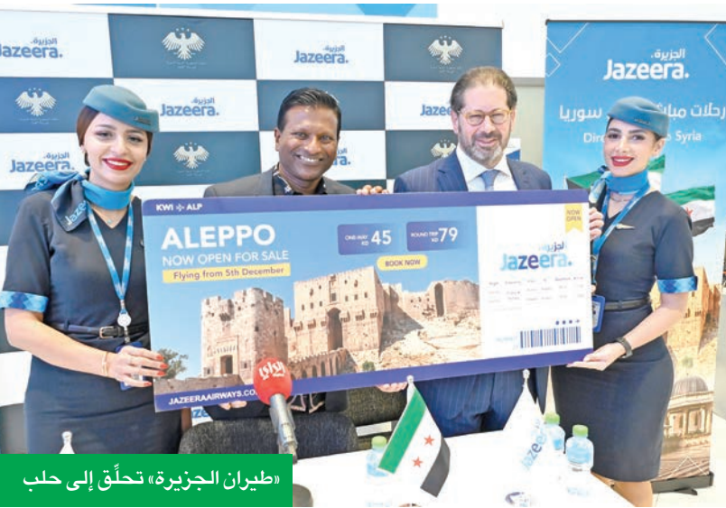
«طيران الجزيرة» تحلق إلى حلب

تبرز بأسواقها القديمة التي يعود تاريخها إلى قرون، والساحات المنحوتة بالحجر، والمقاهي النابضة بالحياة. وتشتهر حلب بلقب «عاصمة المطبخ السوري»، حيث الأطباق والحلويات اللذيذة، مثل الكبة الحلبية. تعود الرحلات بين الكويت وحلب بواقع رحلتين في الأسبوع، لتوفير خيارات سفر مريحة لزيارة العائلة أو السباحة. وتبدأ أسعار الرحلات من 45 ديناراً بالاتجاه الواحد، ومن 79 ديناراً لرحلات العودة.