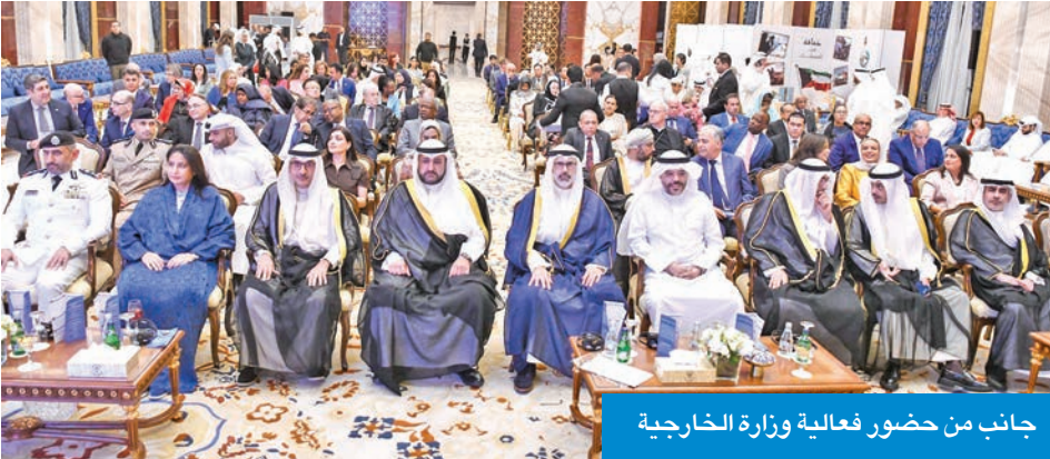
جانب من حضور فعالية وزارة الخارجية

من جانبها، أشادت ممثلة الأمين العام للأمم المتحدة والمنسقة المقيمة لدى الكويت، غادة الطاهر، بدور الكويت عالمياً في المجال الإنساني، حيث أنه لا يمكن أن يذكر العمل الإنساني دون أن تذكر قيادة وريادة الكويت في مجال العمل الإنساني، مضيفة أن الكويت لطالما «اختارت أن تكون في الصفوف الأمامية» في مواجهة الأزمات