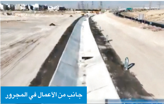
جانب من الأعمال في المجرور

والسلامة، مشيرة إلى أن الأعمال تسير وفق البرنامج الزمني المعتمد، بما يحقق الاستفادة المثلى من المشروع فور اكتماله. ويأتي المشروع ضمن جهود الهيئة الرامية إلى تطوير شبكات تصريف مياه الأمطار، والحد من مخاطر تجمع المياه التي قد تعوق الحركة المرورية أو تتسبب في أضرار للبنية التحتية، إذ من المتوقع أن يسهم المجرور والخزان الجديدين في رفع كفاءة التصريف وخدمة سكان المنطقة، خصوصاً خلال مواسم الأمطار. وأضافت الهيئة أن المشروع يتضمن إنشاء خزان رئيسي بسعة كبيرة مرتبط بشبكة الأنابيب الحديثة لجميع