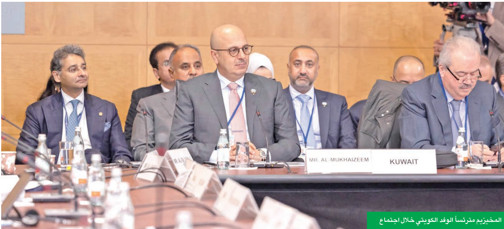
المخيزيم مترئسا الوفد الكويتي خلال اجتماع

شارك وزير الكهرباء والماء والطاقة المتجددة ووزير المالية ووزير الدولة للشؤون الاقتصادية والاستثمار بالوكالة د. صبيح المخيزيم في اجتماع وزراء المالية ومحافظي البنوك المركزية لدول منطقة الشرق الأوسط وشمال إفريقيا ووسط آسيا (MENAP) مع المدير العام لصندوق النقد الدولي كريستالينا جورجييفا. وتم خلال الاجتماع استعراض آخر التطورات الاقتصادية الإقليمية والعالمية، وتبادل وجهات النظر حول أبرز القضايا الاقتصادية العالمية بما في ذلك التحديات الاقتصادية الراهنة.