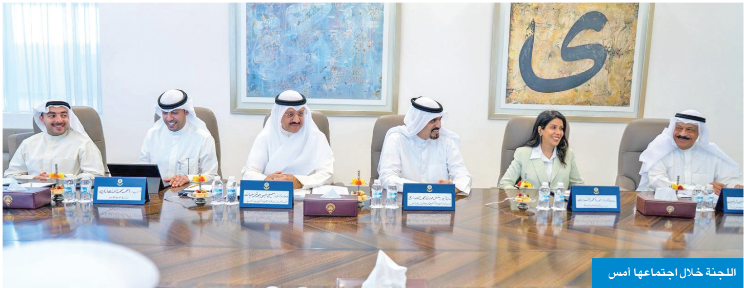
اللجنة خلال اجتماعها أمس