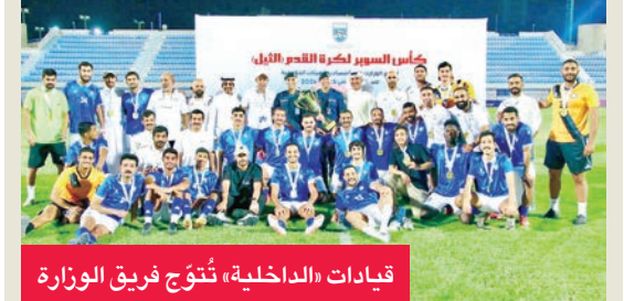
قيادات «الداخلية» تتوّج فريق الوزارة

توّج فريق وزارة الداخلية بلقب كأس السوبر لكرة القدم للوزارات والمؤسسات والهيئات الحكومية للموسم الرياضي 2025-2026، بعد فوزه على فريق الحرس الوطني بنتيجة 2-3 في المباراة التي جمعتهما ضمن البطولة الحكومية. وشهد اللقاء مستوى فنياً عالياً من الطرفين، حيث ظهر لاعبو «الداخلية» بانضباط تكتيكي وروح جماعية مكنّتهم من حسم المباراة، في حين قدم الحرس الوطني أداءً قوياً حتى اللحظات الأخيرة. وعيّن الجهازان الفني والإداري لفرق «الداخلية» عن فخرهم بهذا الإنجاز، مؤكدين أن التتويج جاء نتيجة عمل متواصل وجهود كبيرة في إعداد الفريق. من جانبه، هنا رئيس اتحاد الشرطة الرياضي العميد الركن بحري الشيخ مبارك اليوسف الفريق، وأشاد بالدعم الكبير من القيادة العليا في وزارة الداخلية، مؤكداً استمرار الاتحاد في تطوير النشاط الرياضي وتعزيز روح الانتماء لدى منتسبي الوزارة.