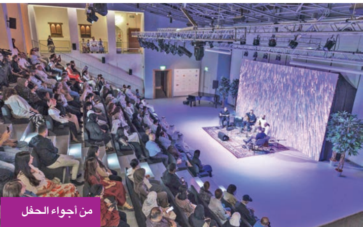
من أجواء الحفل

الفرقة مزجت الحداثة بروح الأداء الحي في حفل ضمن فعاليات «دار الآثار»