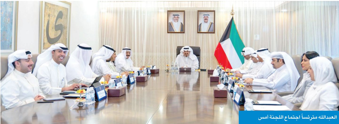
العبدالله مترأساً اجتماع اللجنة أمس

علاقات وثيقة ممتدة تربط البلدين وتغطي أغلب المجالات الحيوية