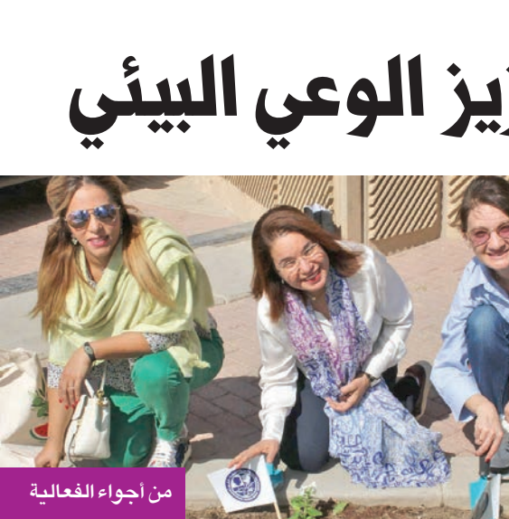
من أجواء الفعالية

إلى العزف بالأمكن العامة. أول فرصة رسمية كانت لنا مع السفارة الفلبينية في حفل خيري، حينها أطلقوا علينا اسم الإخوة الحسن، ومنذ ذلك الحين واصلنا المشوار الفني».