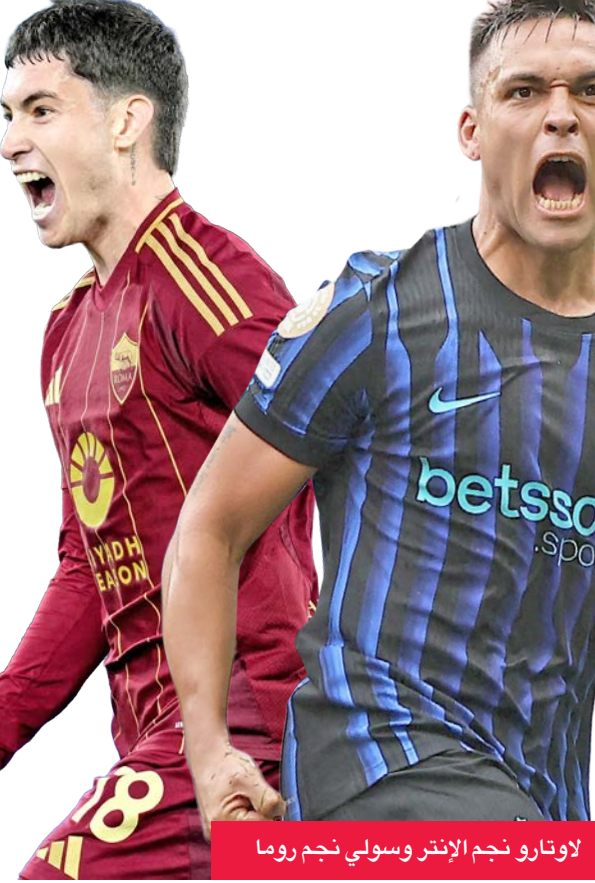
لاوتارو نجم الإنتر وسولي نجم روما