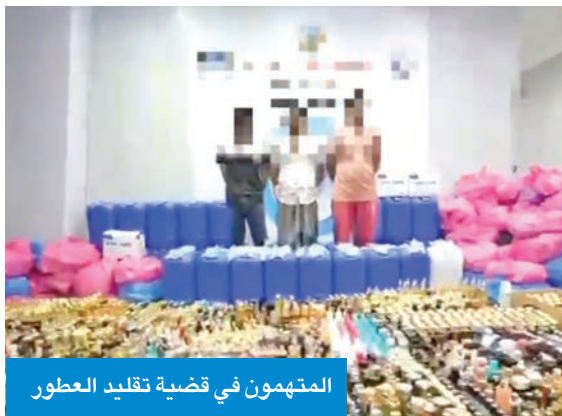
المتهمون في قضية تقليد العطور

وأضافت الوزارة أن رجال مباحث إدارة حماية الآداب العامة ومكافحة الاتجار بالأشخاص، بالتنسيق مع مفتشي وزارة التجارة والصناعة وبلدية الكويت، داهمو المصنع وتمكنوا من ضبط 15 ألف صندوق تعبئة عطور، و28 ألف زجاجة جاهزة للتعبئة، تمهيداً لتوزيعها وبيعها في السوق المحلي، وتم إتلاف المصنع المعد لهذا الغرض، وإحالة المضبوطات والمتهمين إلى جهة الاختصاص، لاتخاذ الإجراءات القانونية بحقهم. وأكدت «الداخلية» استمرار جهودها في حماية المستهلك ومكافحة الغش التجاري بكل أشكاله، داعية الجميع إلى الإبلاغ عن أي أنشطة مشبوهة تمس سلامة المجتمع أو الأمن الاقتصادي للدولة، عبر الاتصال على هاتف الطوارئ (112) أو من خلال القنوات الرسمية للوزارة.