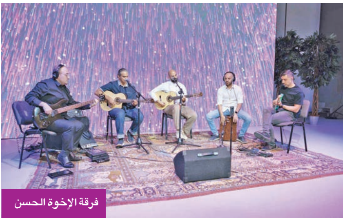
فرقة الإخوة الحسن