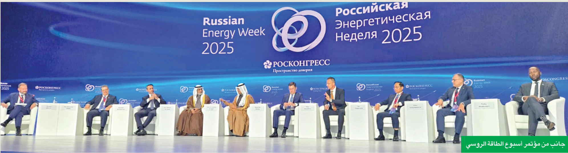
جانب من مؤتمر أسبوع الطاقة الروسي

موسكو - ربيع كلاس وجهه وزير الخارجية الهنغاري بيتر سيارتو انتقادات حادة إلى الاتحاد الأوروبي، واصفاً سياسات بروكسل في مجال الطاقة بأنها «جنونية» وغير واقعية. وجاء ذلك خلال مشاركته في مؤتمر «أسبوع الطاقة الروسي» المنعقد أمس في موسكو بنسخته الثامنة، والذي تشارك فيه «الجريدة»، والذي يعتبر أحد أهم الفعاليات العالمية في قطاع الطاقة، بمشاركة خبراء ومسؤولين من مختلف دول العالم من بينهم وزير النفط السعودي.