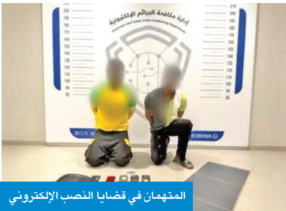
المتهمان في قضايا النصب الإلكتروني