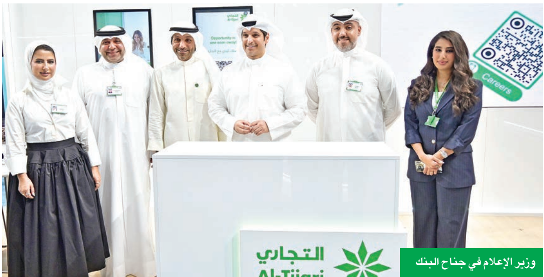
وزير الإعلام في جناح البنك

الاستثمار في جيل الشباب، بما يمكنهم من تحمل المسؤولية وتحقيق رؤية ورؤية البنك الهادفة إلى تمكين وتطوير رأس المال البشري لبناء مستقبل أفضل، وأكد حرص البنك وقطاع الموارد البشرية، ممثلاً في عدد من المسؤولين من القطاعات والإدارات المختلفة، على التواجد في معرض وظيفتي، حيث يقومون بعقد اللقاءات والمقابلات الشخصية والتوظيف الفوري لمن يجاز المقابلات الشخصية، علماً أن البنك يولي اهتماماً كبيراً للاستثمار في المواهب الطموحة وتطوير مهاراتهم وقدراتهم، من خلال توظيف الكوادر الوطنية الواعدة وجذب أفضل الكفاءات إلى صفوفه.