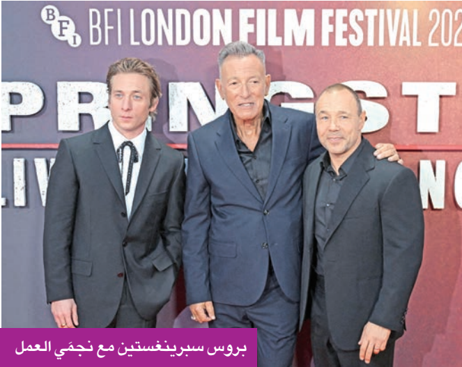
بروس سبرينغستين مع نجمي العمل

إلى أنه سيتم قريباً إعلان موعد العرض الرسمي والقصص التي تم اختيارها. وأشار إلى أن العمل يدور حول طبيب نفسي يسرد مذكراته عن أغرب الحالات