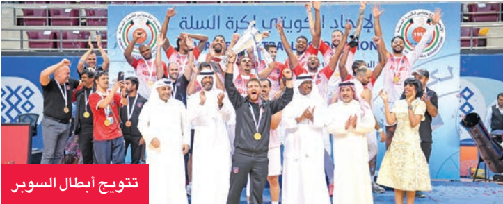
تتويج أبطال السوبر