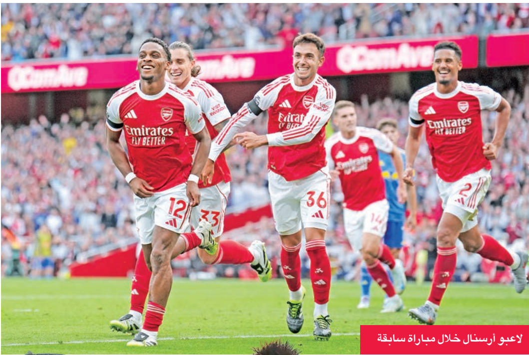
لاعبو أرسنال خلال مباراة سابقة

سواء مع ناديه الإنجليزي أو مع منتخب الترويج.