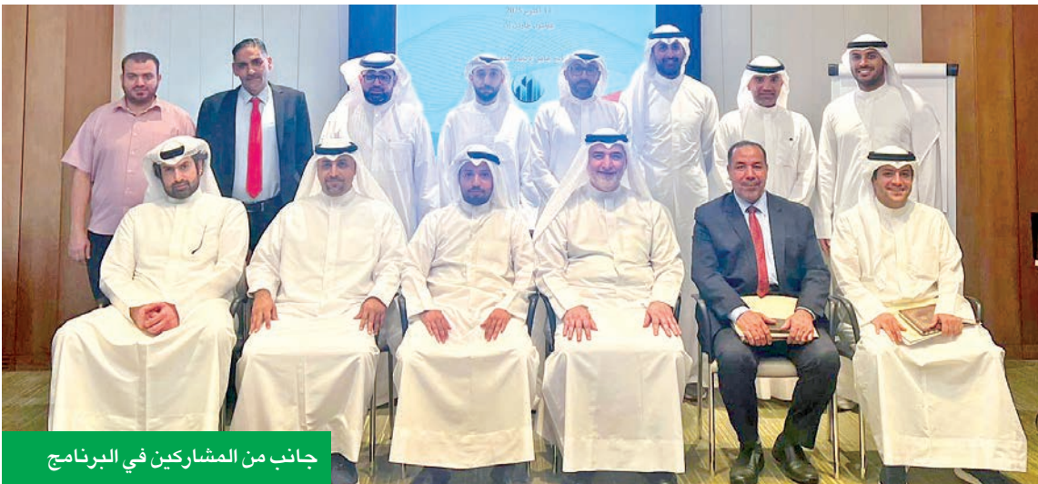
جانب من المشاركين في البرنامج

المدير العام لشركة شوري للاستشارات الشرعية، وتناول خلاله مجموعة من المحاور المتخصصة في