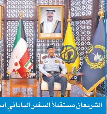
الشريعة مستقبلاً السفير الياباني أمس

بحث رئيس الأركان العامة للجيش، الفريق الركن خالد الشريعة، أمس، مع سفير اليابان لدى البلاد كينيتشيرو موكا، عدداً من المواضيع ذات الاهتمام المشترك. وأعلنت رئاسة الأركان