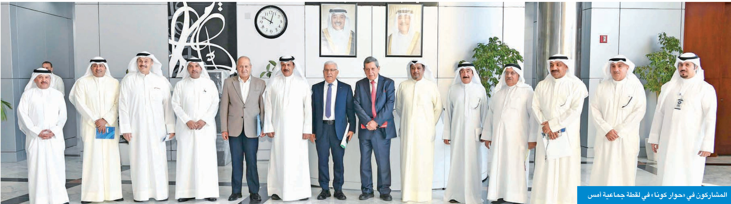
المشاركون في «حوار كونا» في لقطة جماعية أمس

الجلسات النقاشية أكدت أن العلاقة بين وكالات الأنباء والصحف تكاملية لا تنافسية