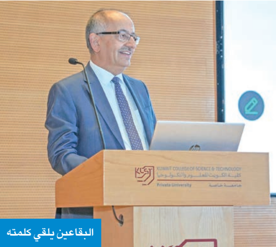
البقاعين يلقي كلمته

برعاية المركز الوطني ومشاركة نخبة من خبراء الكويت والمملكة المتحدة