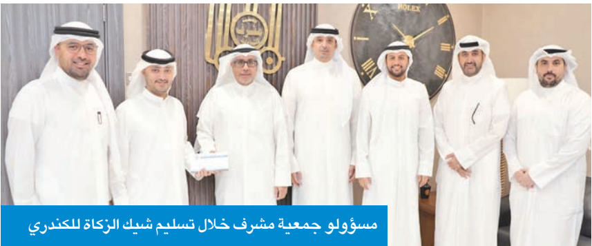
مسؤولو جمعية مشرف خلال تسليم شيك الزكاة للكندري

الاجتماعي الذي يقدمه بيت الزكاة الكويتي من كفالة الأسر المحتاجة والمتعففة وإيصال المساعدة للمتعسرين وإقامة المشاريع الخيرية، وقد وصت الشريعة الإسلامية على التكافل بين المسلمين والحث على الزكاة، وإيماناً منا بسمو هذه الرسالة وأن خير من يمثلها في بلدنا الحبيب هو بيت الزكاة الكويتي أقدمم بالنجابة عن تعاونية مشرف ومساهمتها بتقديم شيك التبرع لبيت الزكاة، بدوره، قال الكندري: «نشكر تعاونية مشرف على أداء زكاتها، وهو ليس بجديد على تعاونية مشرف التي يتجدد اللقاء معها سنوياً، ولا يخفى على أحد دور جمعية مشرف في العمل الاجتماعي ودعمها لمسيرة الأعمال الخيرية، ونتمنى التوفيق والازدهار لإدارة الجمعية».