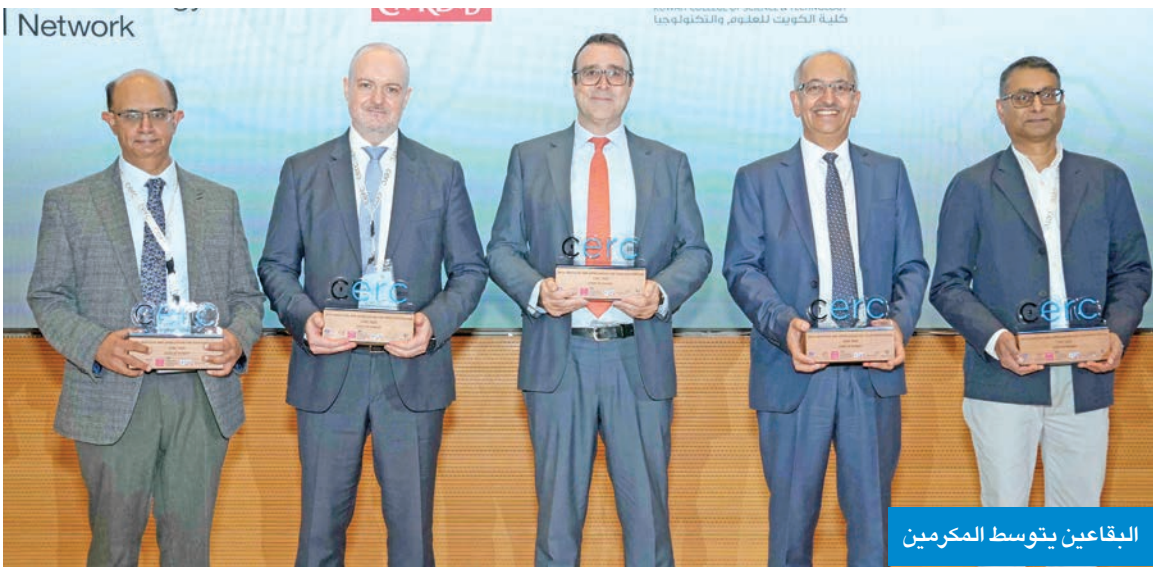
البقاعين يتوسط المكرمين

للمركز الوطني ومشاركة نخبة من خبراء الكويت والمملكة المتحدة