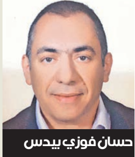
حسان فوزي ييدس

على مدى سنوات، واجهت شركة إنتل صعوبات في مجارة شركة تايوان لصناعة أشباه الموصلات (TSMC) التي أصبحت اليوم أكبر وأحدث مصنع للرقائق الإلكترونية في العالم. وبينما اتجه معظم القطاع إلى فصل تصميم الرقائق عن تصنيعها، اختارت شركة إنتل المسار المعاكس، إذ أبتقت على التصميم وصناعة الرقائق ضمن شركة واحدة. في عام 2021، أطلقت الشركة مشروعها الخاص لتصنيع الرقائق بعقود خارجية تحت اسم (IFS) Intel Foundry Services، بهدف منافسة Samsung و TSMC. لكن هذه المبادرة واجهت مصاعبة في جذب عملاء خارجيين، مما جعل شركة إنتل تتأخر في سباق تزويد شركات التكنولوجيا الكبرى. ورغم هذه التحديات، لا تزال شركة إنتل تمتلك ميزة مهمة، وهي «تقنية تغليف الرقائق المتقدمة»