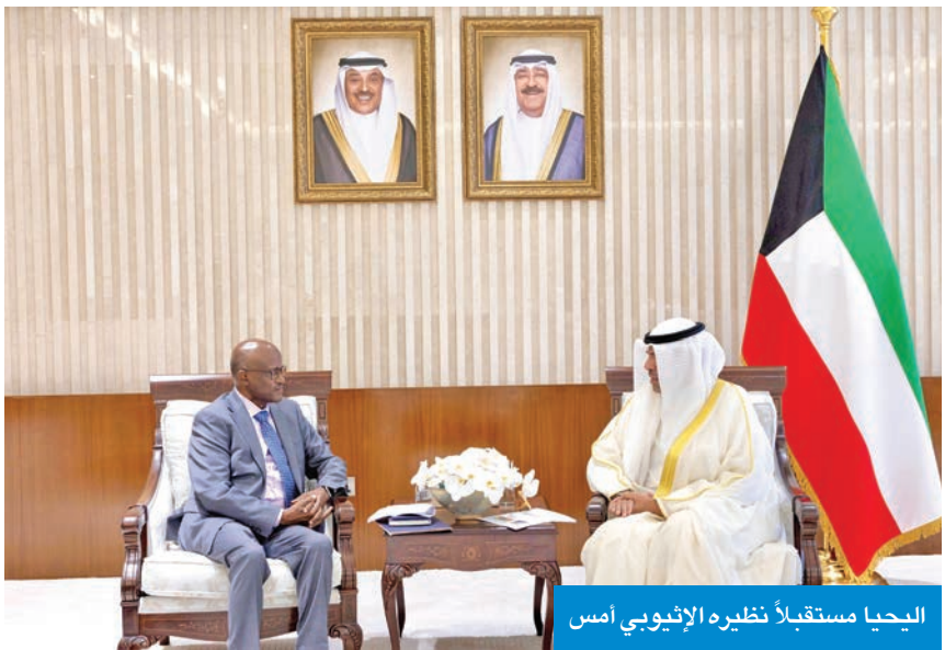
اليحيا مستقبلاً نظيره الإثيوبي أمس

التقى وزير الخارجية عبدالله اليحيا، أمس، وزير الدولة للشؤون الخارجية بجمهورية إثيوبيا الفدرالية الديمقراطية الصديقة هادرا أبر، بمناسبة زيارته الرسمية والوفد المرافق له لدولة الكويت. وتم خلال اللقاء استعراض العلاقات الثنائية التي تربط البلدين الصديقين وسبل تعزيزها وتنميتها في عدد من المجالات، ومناقشة التطورات الإقليمية والدولية.