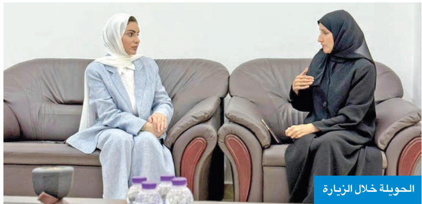
الحويلة خلال الزيارة

وتأتي هذه الزيارة في إطار الحرص على متابعة المرافق الاجتماعية ميدانياً، والوقوف مباشرة على احتياجات المستفيدات، والعمل على تطوير بيئة العمل بما يضمن توفير أفضل سبل الرعاية والحماية والدعم الاجتماعي للنساء المعنفات. وأكدت الحويلة أهمية