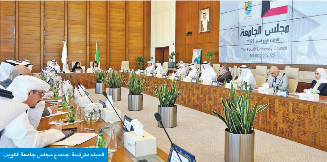
الميليم مترنسة اجتماع مجلس جامعة الكويت

تفويض مديرة الجامعة لتشكيل لجان اختيار عمداء الكليات والعمادات النوعية