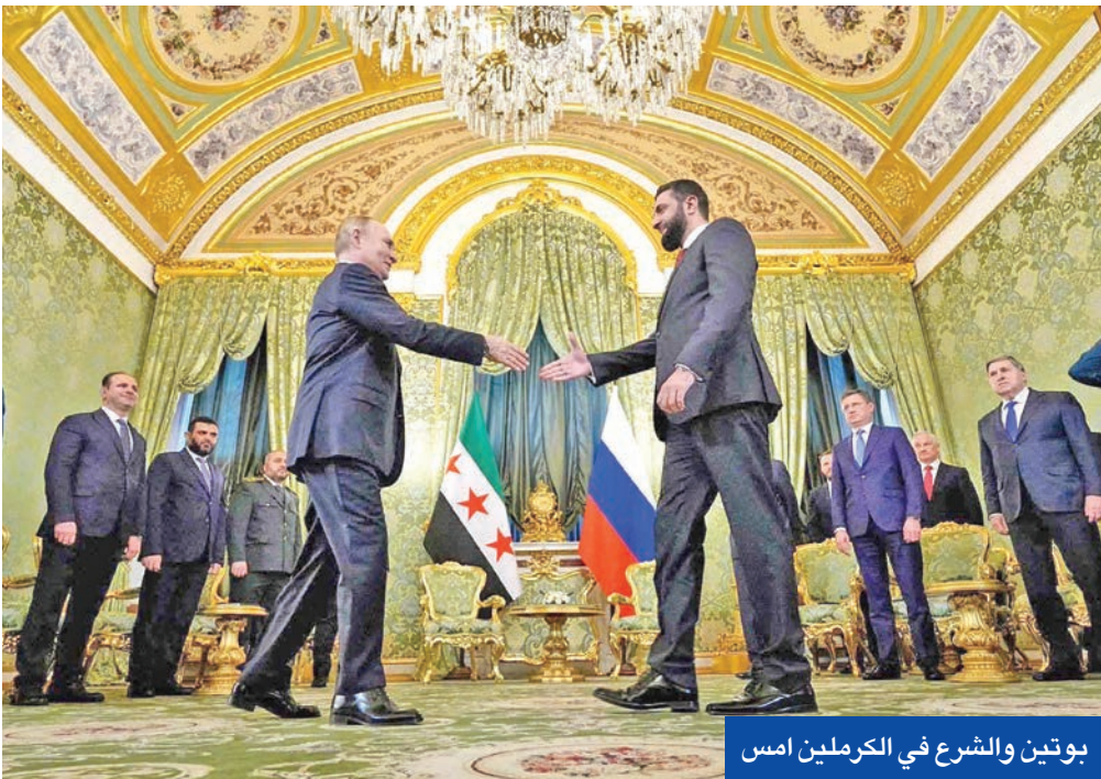
بوتين والشرع في الكرملين امس

في إطار زيارة غير مسبقة إلى موسكو، التقى الرئيس السوري أحمد الشرع لأول مرة بنظيره الروسي فلاديمير بوتين، وبحثا إعادة ضبط العلاقات الاستراتيجية والاقتصادية وتعزيز التعاون العسكري وسبل تثبيت الاستقرار في المنطقة. وأشاد بوتين، خلال استقباله الشرع في الكرملين أمس، بالعلاقات الروسية - السورية الخاصة، وقال إنها «تطورت على مدى عقود وكانت دائماً ذات طابع ودي واستثنائي خالص، ولم تكن مرتبطة بظروفنا السياسية أو مصالحنا الخاصة، بل كان هدفنا دائماً هو مصلحة الشعب السوري». ورحب بوتين بزيارة الشرع وأكد استعداد روسيا لإجراء مشاورات منتظمة مع سورية عبر وزارة الخارجية وإنجاز المشاريع المشتركة مع استئذان اللجنة الحكومية لبلديهما. واعتبر أن الانتخابات البرلمانية