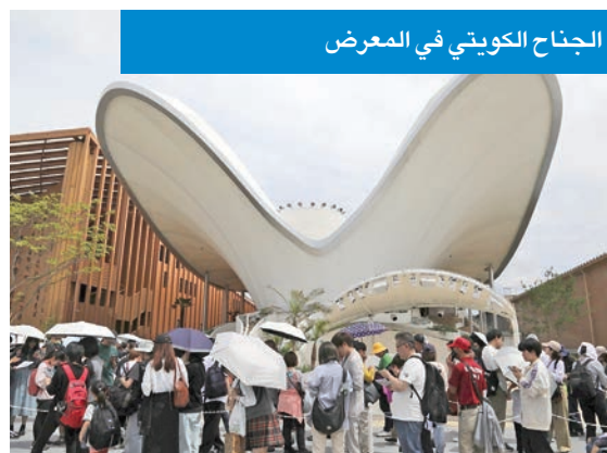
الجناح الكويتي في المعرض

أعرب سفير الكويت لدى اليابان، سامي الزمانان، أمس، عن فخره بالمشاركة الكويتية المتميزة في معرض «إكسبو أوساكا 2025»، مؤكداً أن الجناح الكويتي كان أحد أكثر الأجنحة الدولية زيارة وإقبالاً من جانب الجمهور. وقال السفير الزمانان لـ«كونا»