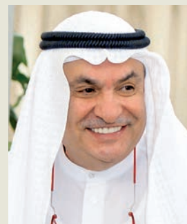
بقلم محمد جاسم الصقر

بالتأكيد لم يكن هذا التحول الجذري في الموقف الرسمي الأميركي نتيجة لحظة ندم واعية، أو وخزة ضمير موجعة، فلا بد من وجود معطيات ومتغيرات موضوعية فرضت هذا التحول، وهنا أسمح لنفسي أن أجتهد، فأقول: إن الأحداث أو الوقائع التالية التي شهدتها فترة الأشهر السبعة (مارس- سبتمبر 2025) كانت إلى حد كبير وراء التحول الحاد