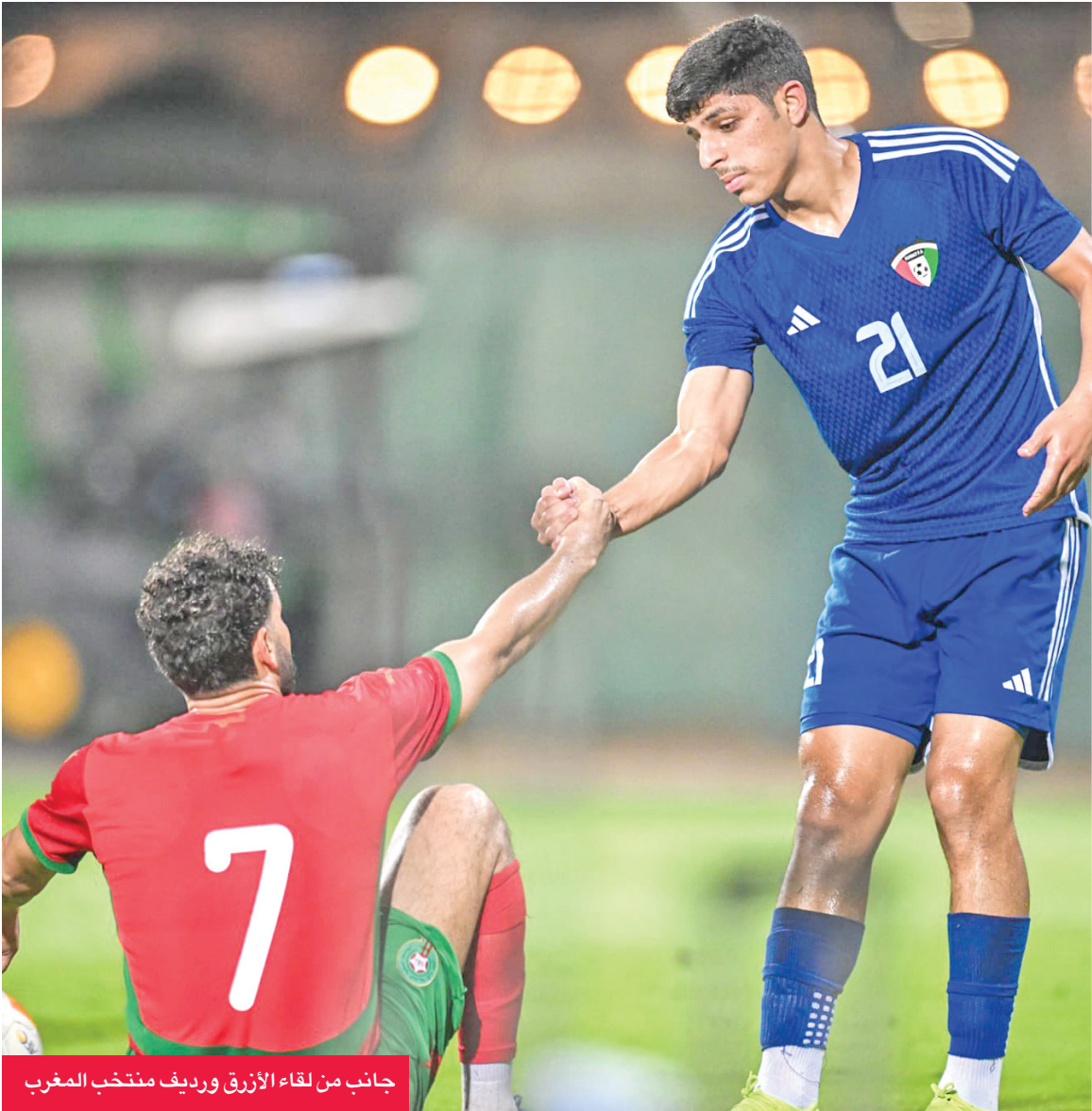
جانب من لقاء الأزرق وريدف منتخب المغرب

إلى المستوى المأمول فنياً وبدنياً، لا سيما أنه يسبق مواجهة موريتانيا، التي يعمل على تخطيها من أجل التأهل لبطولة كأس العرب.