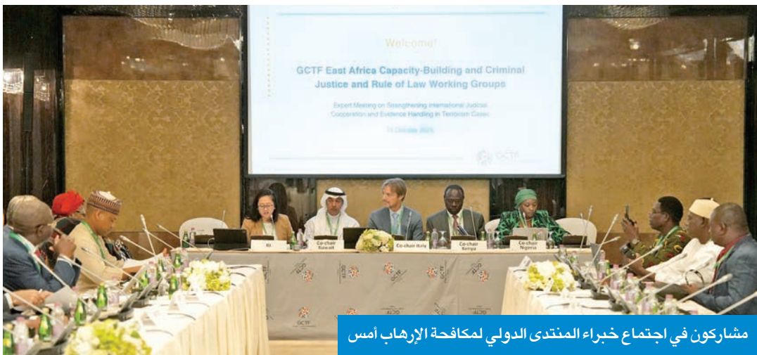
مشاركون في اجتماع خبراء المنتدى الدولي لمكافحة الإرهاب أمس

27 دولة ومنظمة يشاركون في اجتماع خبراء المنتدى الدولي لمكافحة الإرهاب ● المشعان: ساهمنا في نقل 1500 من المقاتلين الأجانب وذويهم من سورية