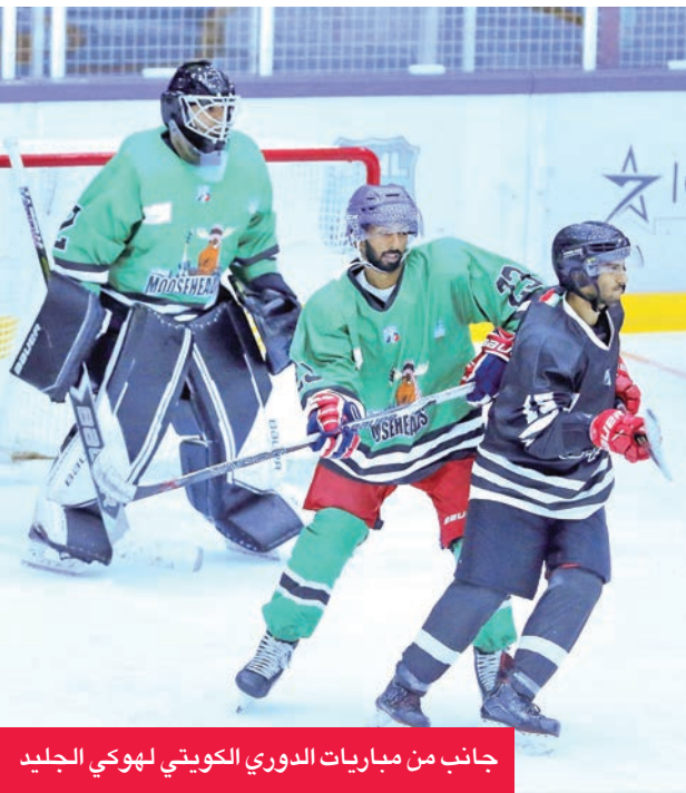
جانب من مباريات الدوري الكويتي لهوكي الجليد

بواصل فريقاً ستارز ووريز صراعهما المحتدم على صدارة الدوري الكويتي الوطني لهوكي الجليد للرجال في موسمه الرياضي 2025-2026، حيث عزز ستارز موقعه في القمة بعد تحقيقه فوزه الخامس على التوالي، رافعاً رصيده إلى 15 نقطة، فيما حافظ ووريز على المركز الثاني بـ12 نقطة إثر فوزه الرابع من أصل 5 مباريات.