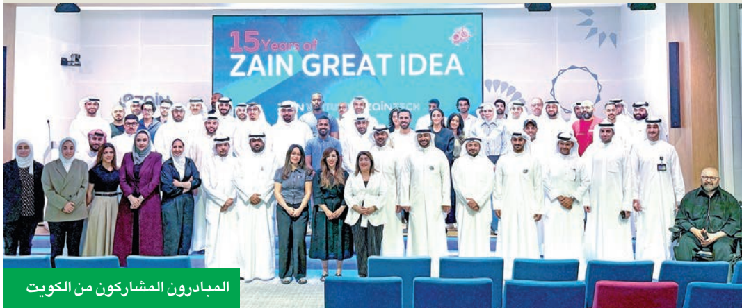
المبادرون المشاركون من الكويت

لتوجيه المبادرين واستكشاف فرص النمو للشركات الناشئة