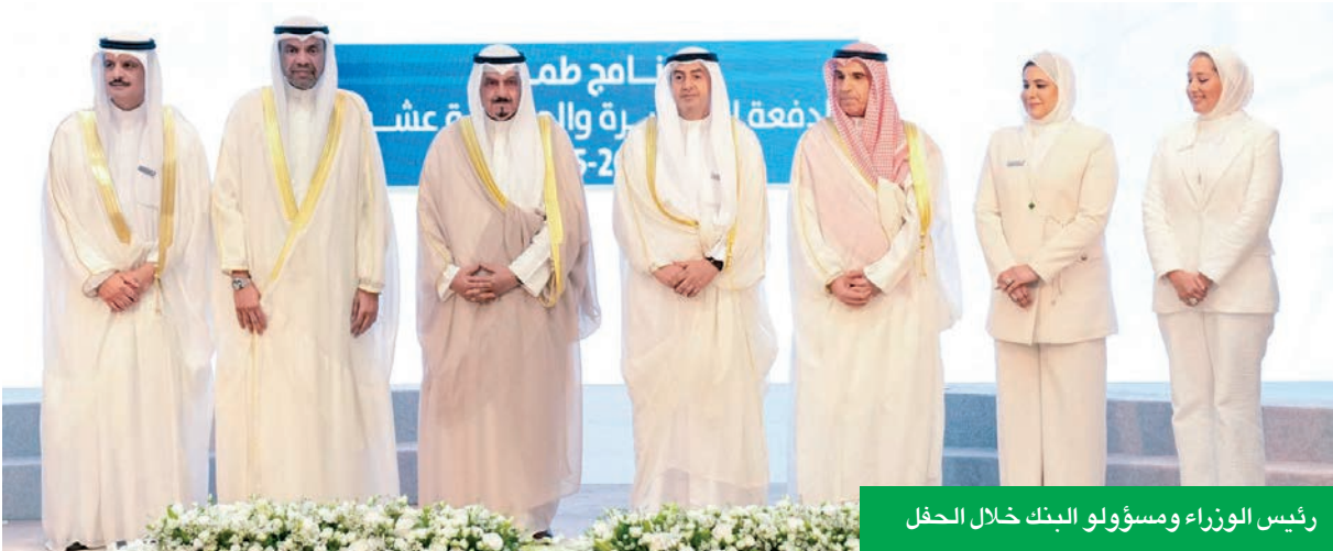
رئيس الوزراء ومسؤولو البنك خلال الحفل

وأضاف السابر: «نحن في بنك وربة نؤمن بأن المستقبل يُصنع اليوم من خلال الاستثمار الذكي في العقول الوطنية المبدعة، إن رؤيتنا (الملك الغد) ليست مجرد شعار، بل خارطة طريق نحو كويت تقود المنطقة في الاقتصاد المعرفي والتميز الدبلوماسي. نحن ننمي جسوراً من الشراكة الحقيقية مع المؤسسات الوطنية الرائدة لنضع الكويت على خارطة التميز العالمي، ونعد جيلاً من القادة الدبلوماسيين الذين سيحملون رسالة الكويت الحضارية إلى العالم. هذا هو التزامنا ونحو وطن يستحق أن نملك له غداً مشرقاً يليق بتاريخه العريق وطموحاته اللامحدودة». وتُجسد استثمارات بنك وربة في المبادرات التعليمية والعلمية والثقافية والدينية التزامه الراسخ ببناء مجتمع واع ومتمكن، إذ يضع البنك الإنسان في قلب مسيرته التنموية. ومن خلال دعمه المستمر لمبادرات تركز على التعليم النوعي، ونشر العلوم والمعرفة، وتعزيز القيم الدينية والثقافية، يسعى بنك وربة إلى الإسهام الفعّال في بناء جيل قادر على قيادة المستقبل، متسلحاً بالعلم والأخلاق والانتعاش.