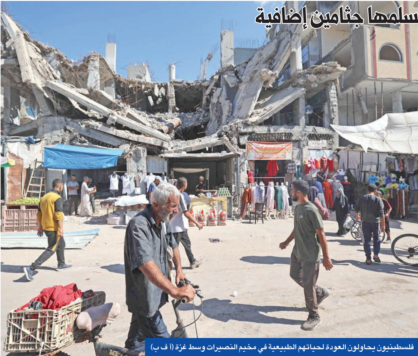
فلسطينيون يحاولون العودة لحياتهم الطبيعية في مخيم النصيرات وسط غزة (ا ف ب)

الواسع الذي لحق بالقطاع ومقتل عدد كبير من عناصرها الميدانيين ممن كانوا يتولون احتجاز الرهائن تسبب في فقدان معلومات تتعلق بمواقعهم. ميدانياً، تسبب قصف إسرائيلي على جباليا وخان يونس في مقتل فلسطينيين بسادس أيام وقف إطلاق النار. وفي الضفة، قُتل مواطن فلسطيني إثر تعرضه لاعتداء من قوات الجيش الإسرائيلي في بلدة الرام، فيما كشف مكتب حركة طالبان التي تحكم أفغانستان والجيش الباكستاني، في وقت سابق، أعلن الجيش الباكستاني صد هجوم لطالبان في منطقتين، فيما اتهمت حكومة حركة طالبان القوات الباكستانية بقصف مناطق حدودية. لاحقاً، أعلنت وزارة الخارجية الباكستانية أن باكستان وأفغانستان اتفقتا على وقف مؤقت لإطلاق النار لمدة 48 ساعة، مضيفة أن الجانبين «سيبذلان جهوداً لإيجاد حل إيجابي».