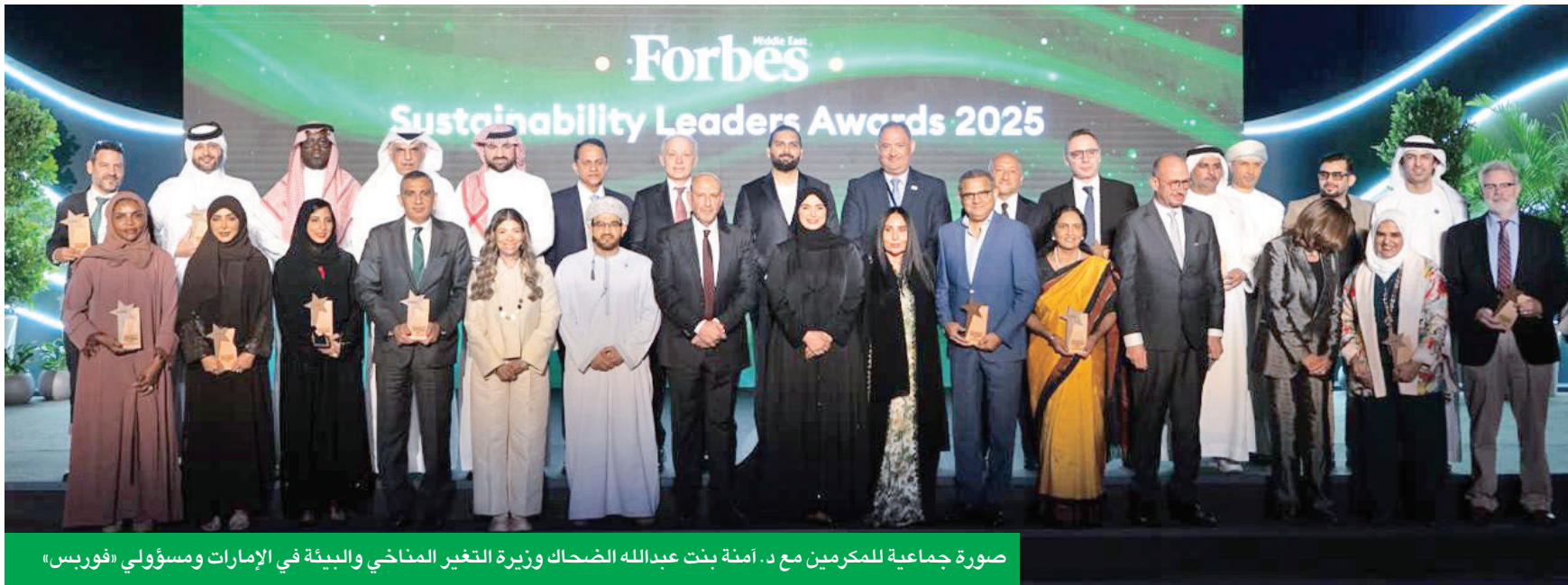
صورة جماعية للمكرمين مع د. أمينة بنت عبدالله الضحاک و وزيرة التغير المناخي والبيئة في الإمارات ومسؤولي «فوربس»

البنك نظم برنامج «استدامة الأعمال» الأول من نوعه لعملائه من الشركات الصغيرة والمتوسطة