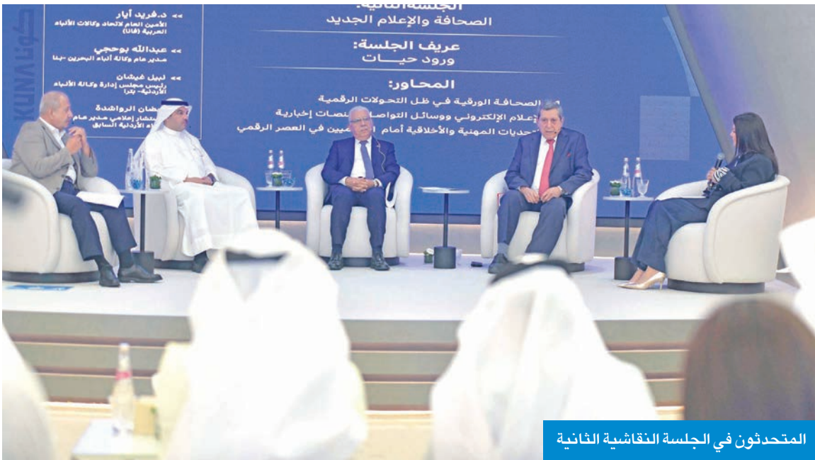
المحتدثون في الجلسة النقاشية الثانية