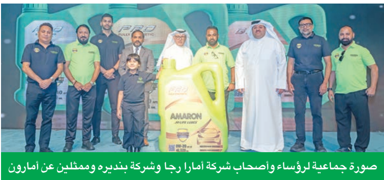
صورة جماعية لرؤساء وأصحاب شركة أمارا رجا وشركة بنديره وممثلين عن أمارون

واسع وأدرج ضمن أفضل 5 علامات تجارية في قطاع زيوت الدراجات النارية. اليوم الكويت هي أول سوق لنا خارج الهند في هذا المجال».