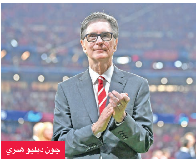
جون دبليو هنري

إسترلينيا (192.81 دولاراً)، وتعليق عمل الموظفين خلال جائحة كورونا، وهما القراران اللذان تم التراجع عنهما أيضاً بعد احتجاجات الجماهير. وقال الثلاثي الإداري في بيان مشترك: «خارج الملعب، كانت هناك أوقات أخطأنا فيها». وأضاف: «نعلم هذا، وتعلمنا منها. جميع قراراتنا يتم اتخاذها مع وضع مصلحة النادي على المدى الطويل في صلب تفكيرنا».