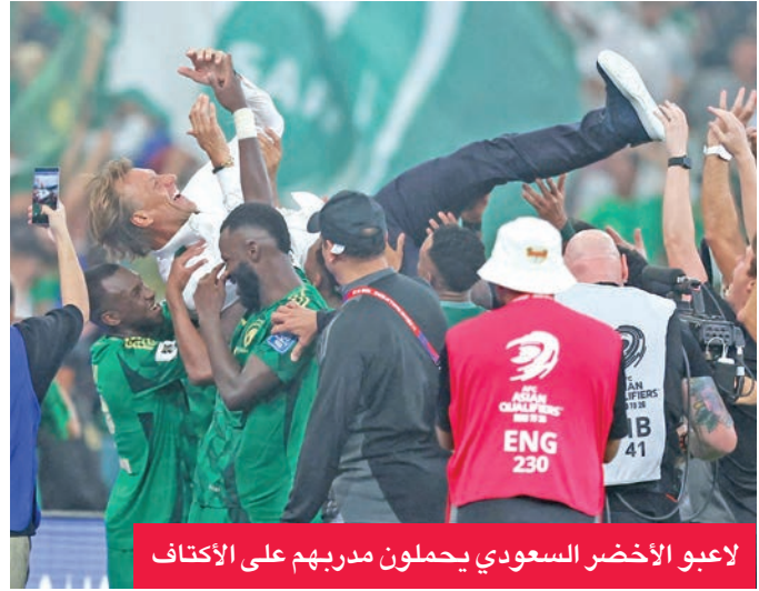
لاعبو الأخضر السعودي يحملون مدربهم على الاكتاف

حسم المنتخب السعودي تأهله لكأس العالم بعد تعادله السلبي مع العراق في اللقاء الذي أقيم على ملعب الجوهرة بمدينة جدة، وسط حضور جماهيري تجاوز 60 ألف متفرج. ورغم السيطرة الفنية التي فرضها «الأخضر» على مجريات المباراة، فإن محاولاته الهجومية لم تترجم إلى أهداف، ليكتفي بصدارة المجموعة الثانية برصيد أربع نقاط، متفوقاً بفارق الأهداف عن العراق، الذي سيواجه الإمارات في مباراة فاصلة لتحديد المتأهل إلى الملحق العالمي. أما المنتخب القطري، فقد حقق فوزاً مثيراً على الإمارات بنتيجة 2-1 في استاد جاسم بن حمد بالدوحة، ليضمن تأهله للمرة