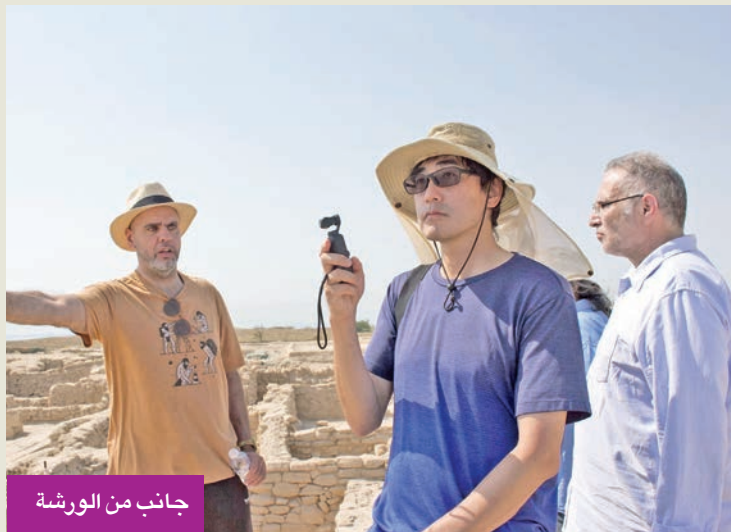
جانب من الورشة

وأوضح أشكناي أن هدف الورشة هو تعزيز التنمية المستدامة في سياق حفظ التراث الثقافي بالكويت، وتحديدًا