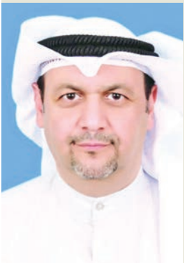
د. سيد عيسى

إنجاز إدارات المجلس الأعلى لشؤون الأسرة 67.5 بالمئة، وهي الأعلى بين قطاعات الوزارة. وأكد عيسى أن الخطة التشغيلية تمثل خريطة طريق واضحة لتوحيد الجهود داخل الوزارة، من خلال متابعة دقيقة لمستوى الأداء في جميع القطاعات، بما يضمن رفع كفاءة العمل وتحسين جودة الخدمات المقدمة للمواطنين والمستفيدين، مشدداً على أهمية الخطة كتمكن في كونها أداة تنفيذية لترجمة أهداف الوزارة الاستراتيجية إلى خطوات عملية قابلة للقياس والتقييم، ما يعزز من مبدأ الشفافية والمساءلة، ويدعم التحول نحو الإدارة الحديثة المبينة على النتائج، بما يتماشى مع توجهات الحكومة نحو تطوير العمل المؤسسي في الجهات الخدمية.