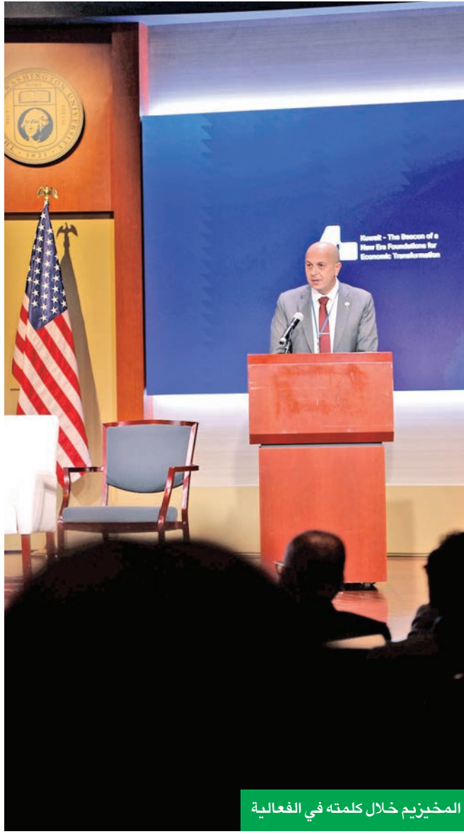
المخيزيم خلال كلمته في الفعالية

الفعالية تهدف إلى إبراز الدور المحوري للقطاع المالي والخاص في دعم مسار التحول