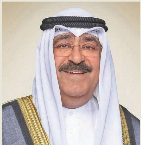
بغادر سمو أمير البلاد الشيخ مشعل الأحمد والوفد المرافق لسموه أرض الوطن اليوم، متوجهاً إلى سلطنة عمان الشقيقة، وذلك في زيارة أخوية.