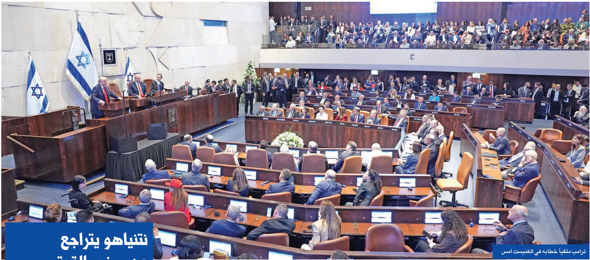
ترامب ملقياً خطابه في الكنيست أمس