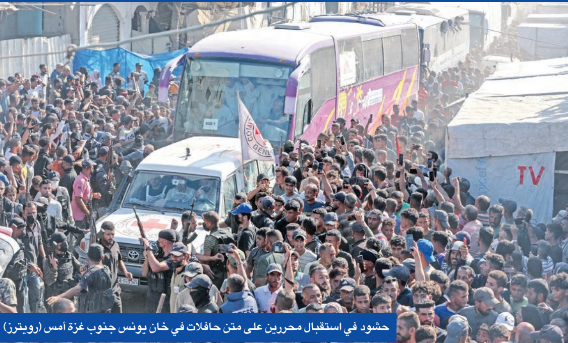
حشود في استقبال محررين على متن حافلات في خان يونس جنوب غزة أمس

وبالتزامن مع تنفيذ عملية التبادل التي تمت عبر الصليب الأحمر وبإشراف مصري ميداني في القطاع وداخل السجون