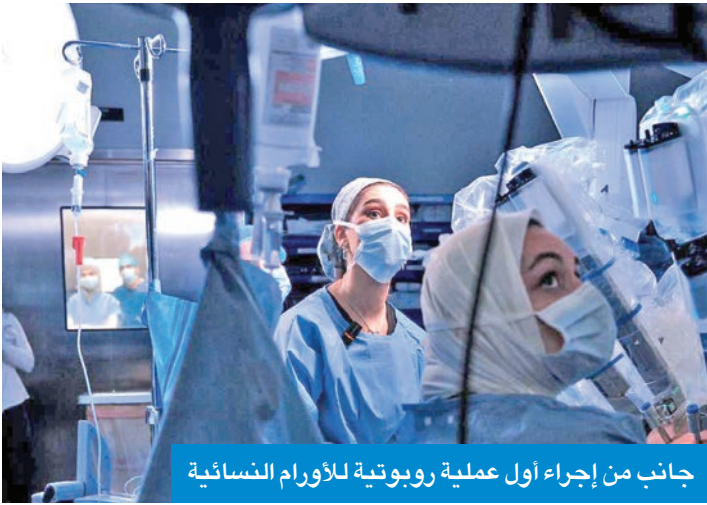
جانب من إجراء أول عملية روبوتية للأورام النسائية