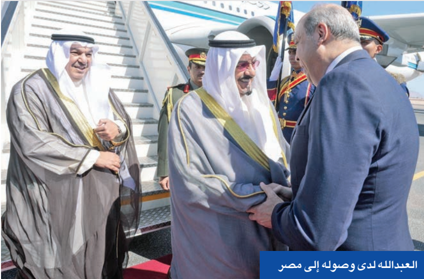
العبدالله لدى وصوله إلى مصر

أكد ممثل سمو أمير البلاد الشيخ مشعل الأحمد، رئيس مجلس الوزراء سمو الشيخ أحمد عبدالله، لدى وصوله إلى مدينة شرم الشيخ المصرية أمس على رأس وفد البلاد للمشاركة في قمة السلام بشأن غزة على أهمية القمة لضمان استكمال خطوات اتفاق إنهاء الحرب في القطاع الفلسطيني ووضع حد للمعاناة الإنسانية التي يعيشها الشعب الفلسطيني. وأشاد سموه بالجهود الإقليمية والدولية الدؤوبة التي بذلتها الدول الشقيقة والصديقة والتي انضمت عن التوصل إلى إتفاق وقف إطلاق النار، معرباً عن الأمل بأن تهيئ القمة الظروف لعملية سياسية تفضي إلى سلام عادل وشامل. وجدد التأكيد على موقف الكويت الداعم لنيل الشعب