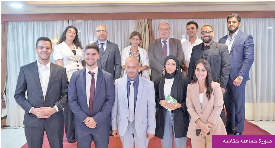
صورة جماعية ختامية