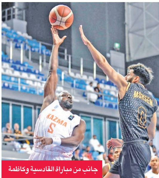
جانب من مباراة القادسية وكازمة

أما الكويت، فقد تاهل بسهولة، بعد أن فرض سيطرته منذ البداية على منافسه القرن، مُحققاً فوزاً عريضاً بنتيجة 88-111. وقُدّم «الأبيض» أداءً قوياً أكد من خلاله جاهزيته للمنافسة على اللقب، ليضرب موعداً مع القادسية في نهائي مرتقب يجمع بين اثنين من أبرز فرق السلة الكويتية. ومن المقرر أن تُقام المباراة النهائية مساء الأربعاء على صالة الاتحاد بمجمع الشيخ سعد العبدالله الرياضي، وسط ترقب جماهيري كبير لمواجهة تحمل طابعاً تنافسياً وتاريخياً على لقب النسخة الحادية عشرة من البطولة.