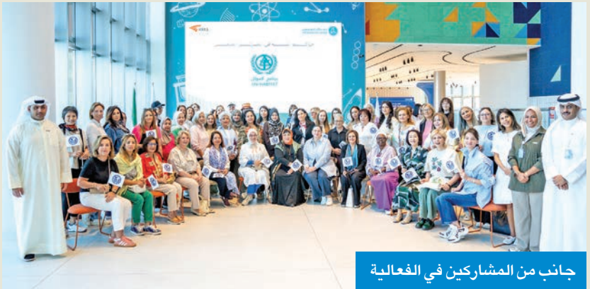
جانب من المشاركين في الفعالية

الحسن افتتحت فعالية «غرس الزهور» في المركز العلمي