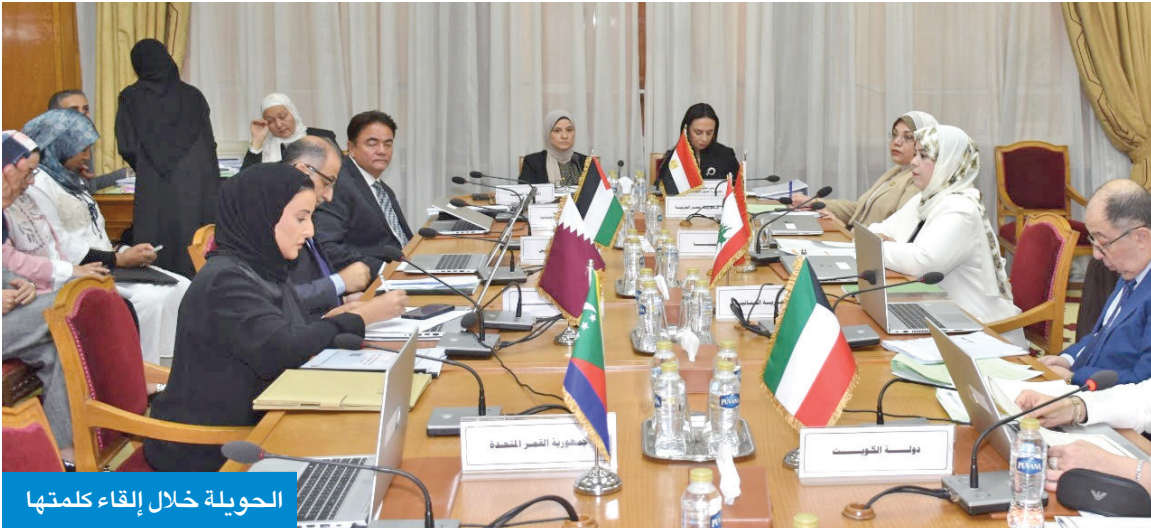
الحويلة خلال إلقاء كلمتها

التنموي العربي المشترك، وفي مقدمتها دعم الأوضاع الاجتماعية في فلسطين، لا سيما في قطاع غزة جراء الممارسات غير الإنسانية التي تمارسها إسرائيل القوة القائمة بالاحتلال.