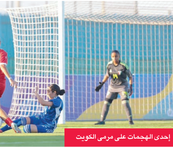
إحدى الهجمات على مرمى الكويت