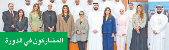
المشاركين في الدورة

في إطار السعي الاستراتيجي لبنك الكويت المركزي لبناء كفاءات وطنية عالية التأهيل في مختلف مجالات العمل المالي والمصرفي، وبهدف تعزيز القدرات في مجال إدارة المخاطر التي تتمتع بأهمية كبيرة لتعزيز بيئة العمل المصرفي وتحسين العمليات المالية، افتتح معهد الدراسات المصرفية يوم الأحد (12 الجاري)، الدورة الرابعة من برنامج «قادة إدارة المخاطر»، الذي يُعد أحد برامج «مبادرة كفاءة» التي أطلقها بنك الكويت المركزي بالتعاون مع البنوك الكويتية، ويديرها المعهد، مستهدفة ببناء كفاءات وطنية عالية التأهيل في مختلف مجالات العمل المالي والمصرفي.