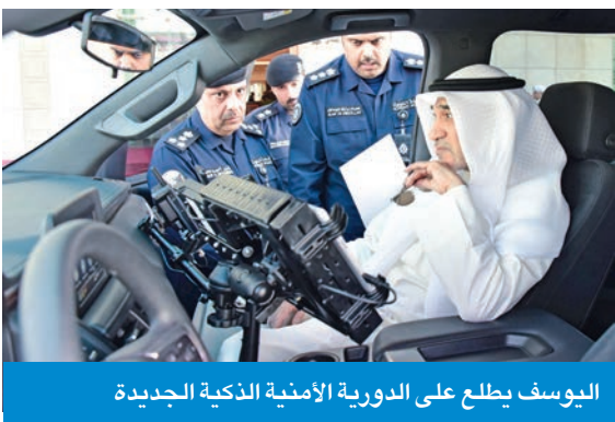
اليوسف يطلع على الدورية الأمنية الذكية الجديدة

الميدان، ويعزز من سرعة ودقة الإجراءات الأمنية. وشدد البجانب على أن «الداخلية» ماضية في تطوير المنظومة الأمنية وتوظيف أحدث التقنيات لخدمة الأمن العام، بما يسهم في تعزيز الأمن والاستقرار في البلاد.