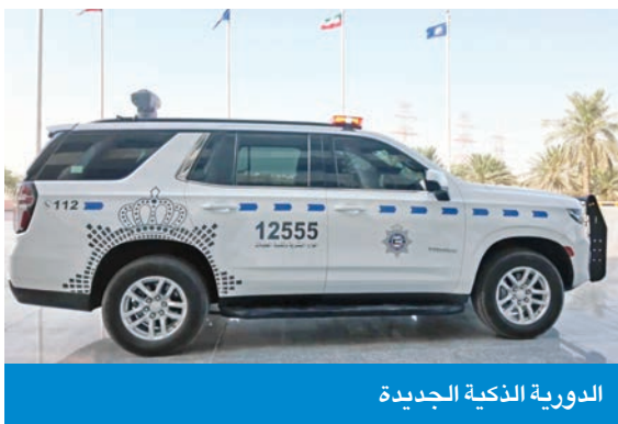
الدورية الذكية الجديدة