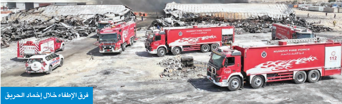
فرق الإطفاء خلال إخماد الحريق

وبأشرت الفرق مكافحة الحريق والسيطرة عليه ولم يسفر الحريق عن أي إصابات بشرية وقد اقتصرت الإضرار على محتويات المخزن.