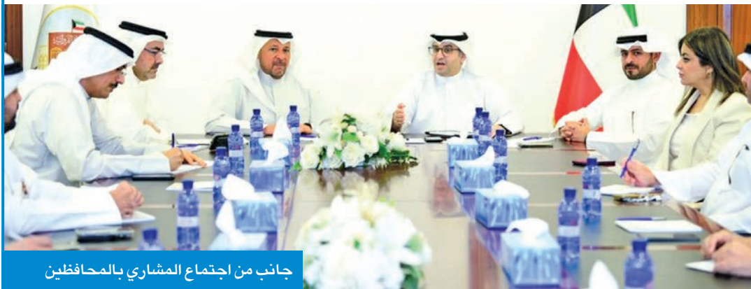
جانب من اجتماع المشاري بالمحافظين

بشكل تفصيلي وشرح مختلف جوانبه، والذي يهدف إلى تطوير الخدمات ورفع كفاءة العمل الإداري والميداني في مختلف المحافظات، إلى جانب بحث أطر التعاون المشترك بين وزارة البلدية والمحافظات.