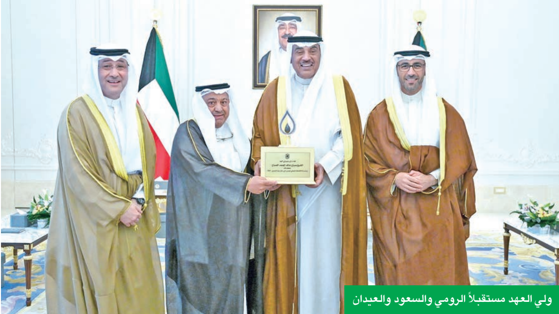
ولي العهد مستقبلاً الرومي والسعود والعيidan

ولي العهد :التوفيق والنجاح والإنجازات في ظل القيادة الحكيمة لسمو الأمير