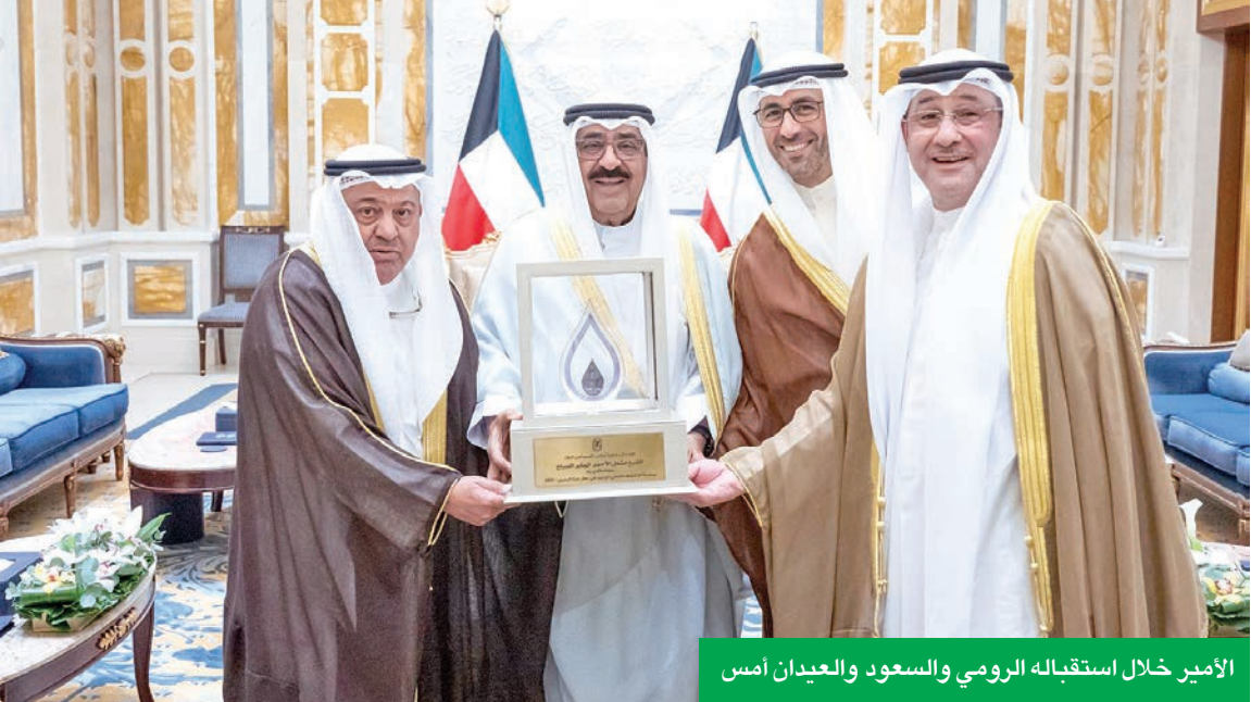
الأمير خلال استقباله الرومي والسعود والعيidan أمس

من جانبه، أعرب السعود عن فخره بهذا الإنجاز قائلاً إن «هذه الاكتشافات تعكس كفاءة الكوادر الوطنية التي أثبتت جدارتها الفنية والمهنية في الخوض في مجالات نفطية غير مسبوقة، وتؤكد جودة البرميل الكويتي من حيث انخفاض الانبعاثات، ما يعكس رؤية استراتيجية طويلة الأمد نحو اقتصاد مستدام ومستقبل آمن للطاقة». كما أشاد العيidan، بجهود موظفي الشركة في تحقيق اكتشافات هيدروكربونية واعدة، مؤكداً أن هذه الإنجازات جاءت ثمرة لتجسيد قيم التميز والابتكار والعمل بروح الفريق الواحد، وأن الشركة ستواصل السير نحو التطوير والريادة.