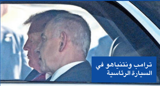
ترامب ونتنياهو في السيارة الرئاسية

رغم تأكيد مكتب رئيس الوزراء الإسرائيلي بنيامين نتنياهو، أمس الأول، أن أي ممثل عن إسرائيل لن يشارك في قمة شرم الشيخ، فإن الصورة سرعان ما تغيرت مع وصول الرئيس الأميركي دونالد ترامب إلى إسرائيل. وحسبما نقل الصحافي براك رافيد، مراسل موقعي اكسبوس الأميركي ووالاه العبري، فإن ترامب لم يكن على علم بأن نتنياهو لم يُدعَ إلى القمة، وقال لرافيد خلال حديث معه على متن الطائرة الرئاسية قبل هبوطه في تل أبيب، إن الجانب المصري هو من تولى توجيه الدعوات. وأضاف رافيد أنه خلال انتقال ترامب ونتنياهو في السيارة الرئاسية من المطار إلى الكنيست، يادر الرئيس الأميركي إلى دعوة نتنياهو للمشاركة في القمة، فوافق الأخير على الفور. وبعدها تواصل ترامب هاتفياً مع الرئيس المصري عبدالفتاح السيسي، ليتولى وساطة بين الرجلين اللذين لم يتحادثا منذ اندلاع الحرب ووفقاً للمصدر ذاته، اتصل السيسي لاحقاً بنتنياهو ودعاو رسمياً، في وقت أعلنت الرئاسة المصرية أن كلاً من نتنياهو والرئيس الفلسطيني محمود عباس سيشركان في القمة. لكن بعد أقل من ساعتين، عاد مكتب نتنياهو ليعلن اعتذاره عن عدم الحضور، مشيراً إلى أن موعد القمة يتزامن مع قرب بدء عيد «سبختا توراه» اليهودي، وجاء في البيان أن «الرئيس الأميركي دونالد ترامب دعا رئيس الوزراء نتنياهو للمشاركة في مؤتمر بعدد اليوم في مصر، وقد أعرب نتنياهو عن شكره على الدعوة، لكنه أوضح أنه لن يتمكن من الحضور بسبب قرب موعد العطلة الدينية". وأكدت الرئاسة المصرية لاحقاً هذا الموقف، موضحة أن نتنياهو اعتذر لأسباب دينية، وأن ترامب هو من اقترح مشاركته في القمة خلال مكالمته مع السيسي.