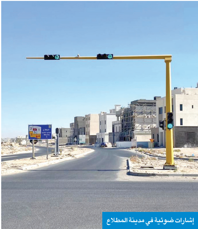
إشارات ضوئية في مدينة المطلاع

● تركيب كل أعمدة الإنارة في الطرق الرئيسية وتشغيل العديد منها