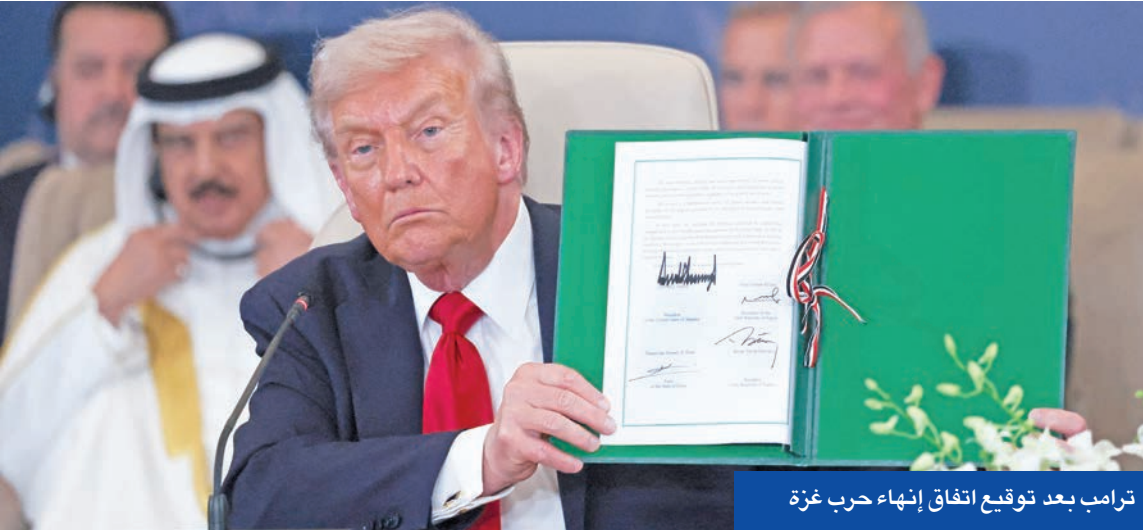
ترامب بعد توقيع اتفاق إنهاء حرب غزة

الفلسطيني حقوقه المشروعة في إقامة دولته المستقلة، موضحاً أن تحقيق السلام العادل والدائم يتطلب إرادة صادقة وحواراً بناءً واحتراماً