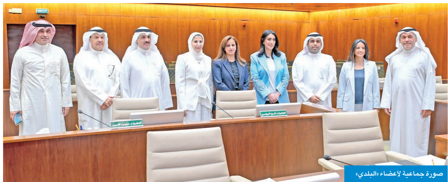
صورة جماعية لأعضاء «البلدي»

المجلس وافق على استحداث طريقين في اللباج و«الصباحية»