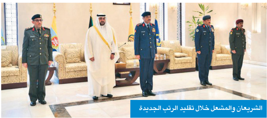
الشريعان والمشعل خلال تقليد الرتب الجديدة

وعدد من كبار الضباط القادة في الجيش. في مجال آخر بحث رئيس الأركان العامة للجيش مع سفير بنغلادش لدى دولة الكويت اللواء سيد طارق حسين أهم المواضيع ذات الاهتمام المشترك لاسيما المتعلقة بالجوانب العسكرية. وذكرت رئاسة الأركان العامة للجيش في بيان صحافي أمس أن الفريق الشريعيان استقبل بمكتبه السفير حسين وبرفقته الملحق العسكري البنغلادشي العميد رقيب الكريم شودري.