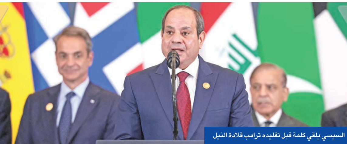
السيسي يلقي كلمة قبل تقليده ترامب قلادة النيل

في أعمال التخطيط و«التوطيد الدبلوماسي» وتدريب قوات الأمن الفلسطينية. وفيما يتعلق بنشر القوة الدولية، أشار إلى أن هناك «إجماعاً» ناشئاً على أن تكون «قوات إقليمية في المقام الأول» مع احتمال مشاركة دول أخرى مثل إندونيسيا التي من المقرر أن يزور رئيسها إسرائيل اليوم. وأبرز ماركون أن إحدى مهام القوة الرئيسية ستكون «تسريح عناصر حماس ونزع سلاحها تحت مراقبة دقيقة من جميع دول المنطقة والمجتمع الدولي». وأعرب وزير الخارجية الروسي سيرغي لافروف عن تمنيات روسيا بنجاح قمة شرم الشيخ، لكنه شدد على أن خطة ترامب تتناول قطاع غزة فقط، ويجب أن تكون أكثر تحديداً بشأن المصير الذي ينتظر الضفة الغربية. وعبر عن تشكك روسيا «في إمكانية التوصل إلى تسوية مستدامة في غزة، فقد تبددت آمال السلام في المنطقة عدة مرات».