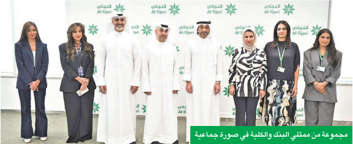
مجموعة من ممثلي البنك والكلية في صورة جماعية

وتابع العبدالله أنه إلى جانب تدريب الطلبة، تتضمن الاتفاقية أيضاً تقديم برامج تدريبية وتطويرية لموظفي البنك، في إطار سعي البنك الدائم لارتقاء بكفاءة موارده البشرية. إن هذه الشراكة تمثل حلقة وصل فعالة بين القطاعين المصرفي والأكاديمي، وتسهم في تطوير قدرات الشباب الكويتي بما يتوافق مع متطلبات سوق العمل.