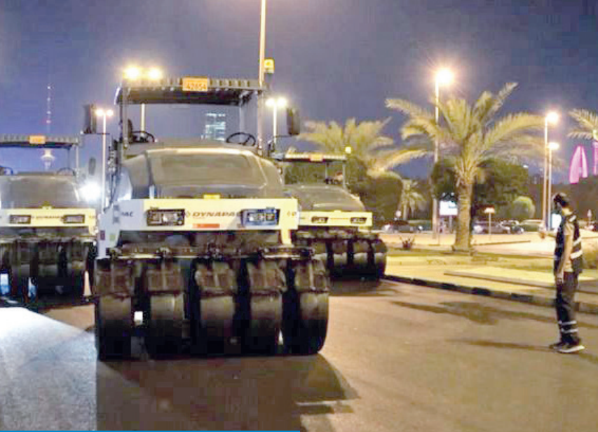
جانب من أعمال الصيانة في شارع دمشق

المرورية وتسهيل الوصول من وإلى المدينة، إضافة إلى تعزيز الربط بشبكات الطرق الرئيسية المجاورة، بما يسهم في دعم خطط الدولة لتطوير المدن السكنية الجديدة، وتوفير بيئة عمرانية متكاملة لخدمة السكان.