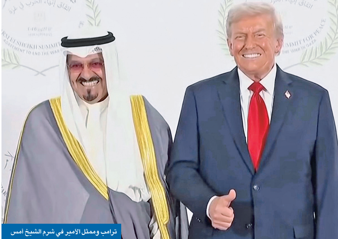
ترامب وممثل الأمير في شرم الشيخ أمس

ممثل الأمير: نأمل أن تهيئ القمة لسلام شامل