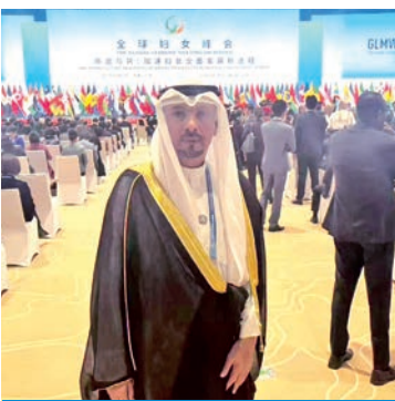
الناجم خلال مشاركته في افتتاح القمة

شارك في افتتاح قمة المرأة العالمية بالعين