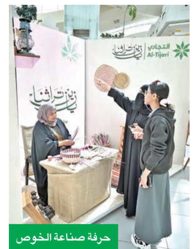
حرفة صناعة الخوص