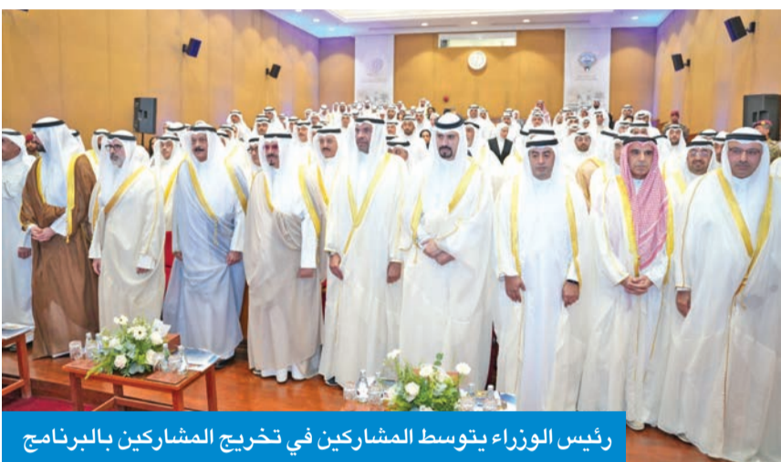
رئيس الوزراء يتوسط المشاركين في تخريج المشاركين بالبرنامج

الشريفة: «نعدكم بأن نقدم أفضل ما نملك من قدرات، ونتعهد بالا تكون الإهواء الشخصية والمصالح الفردية محط انظارنا اطلاقاً، لأن جميع اهدافنا ومصلحتنا ودوافعنا قد اكتسب بالوان علم الكويت، فقد اقسمنّا ان نحفظ سرها ونرعى مصالحها طالما حبيباً». وتخلل الحفل عرض مرئي حول أبرز محطات البرنامج ومسيرة المتدربين، الى جانب تقديم دروع تذكارية لسمو رئيس مجلس الوزراء من أسرة المعهد وبنك وربة راعي الحفل.