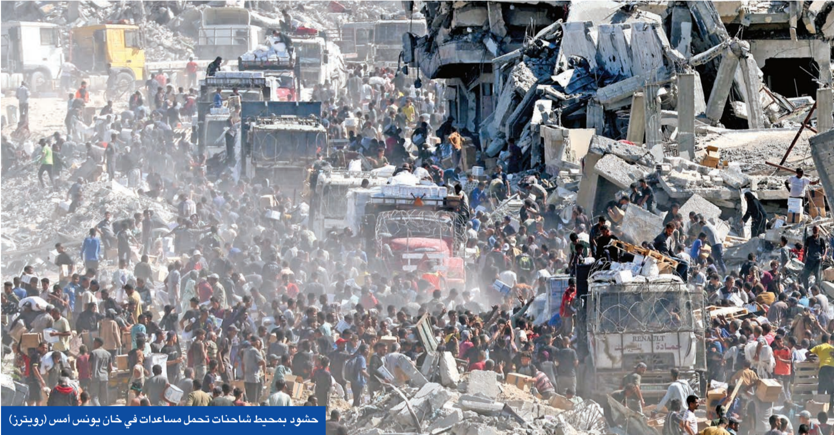
حشود بمحيط شاحنات تحمل مساعدات في خان يونس امس

الأوسط، وإنهاء النزاعات في العالم. ونقل وزير الخارجية بدر عبد العاطي دعوة الرئيس المصري عبدالفتاح السيسي والرئيس الأميركي إلى نظرائهم للمشاركة في قمة شرم الشيخ للسلام المرتقبة اليوم والتي من المنتظر أن تشهد التوقيع على وثيقة قضى بإنهاء الحرب. ومن أبرز المشاركين الذين أكدوا حضورهم القمة، الأمين العام للأمم المتحدة أنطونيو غوتيريش ورئيس الوزراء البريطاني كير ستارمر والرئيس الفرنسي إيمانويل ماكرون ورئيس الوزراء الإسباني بيدرو سانشيز ورئيسة الوزراء الإيطالية جورجيا ميلوني.