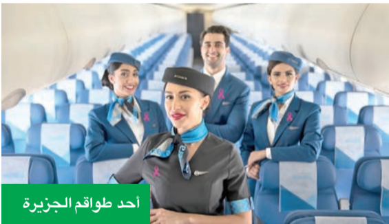
أحد طواقم الجزيرة

بنمناسة الشهر العالمي للتوعية بسرطان الثدي، أعلنت طيران الجزيرة إطلاق عرض خاص يقدم خصماً بنسبة 20 في المئة على أسعار تذاكر الرحلات بالاتجاه الواحد ورحلات العودة، إلى جانب خصماً بنسبة 50 في المئة على خدمة اختيار المقاعد حصرياً للمسافرات.