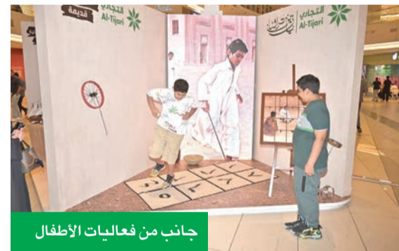
جانب من فعاليات الأطفال

كما شهد جناح «التجاري» خلال الفعالية تفاعلاً مع حملة «لنكن على دراية» التوعوية التي أطلقها بنك الكويت المركزي بالتعاون مع اتحاد مصارف الكويت والبنوك الكويتية من خلال أسئلة تفاعلية مع الجمهور، حيث تهدف الحملة إلى تعزيز الثقافة المالية لدى مختلف فئات المجتمع، ورفع مستوى الوعي بحقوق العملاء وتوعيتهم بالمواضيع المالية والمصرفية المهمة مثل حماية البيانات الشخصية، والتعامل الآمن مع البطاقات البنكية، وتجنب الوقوع في عمليات الاحتيال المالي.