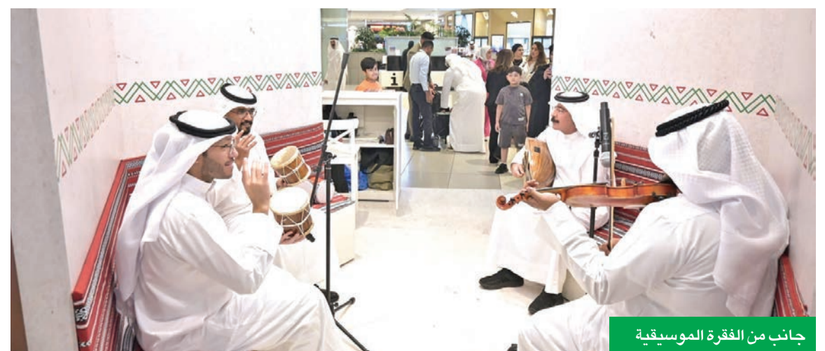
جانب من الفقرة الموسيقية