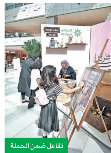
تفاعل ضمن الحملة