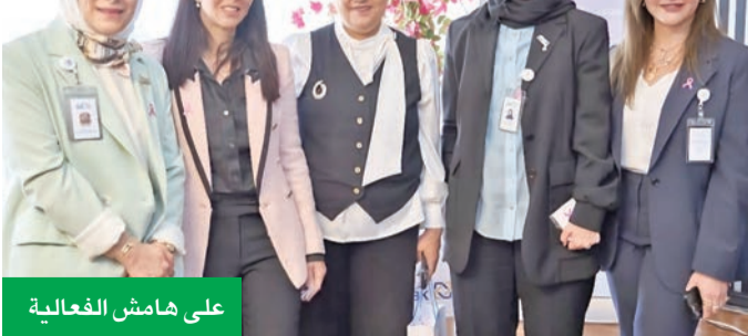
على هامش الفعالية

المبادرات التي يحرص «الأهلي» على تنظيمها للتفاعل مع موظفيه على مدار العام، بما يشمل تطبيق يوم صحي وفحوصات شاملة، وبطولات رياضية متنوعة، وإقامة اليوم المفتوح، وعقد ورش عمل متنوعة، مما يسهم بتعزيز مكانته كجهة عمل جاذبة للمواهب والكفاءات في السوق الكويتي.