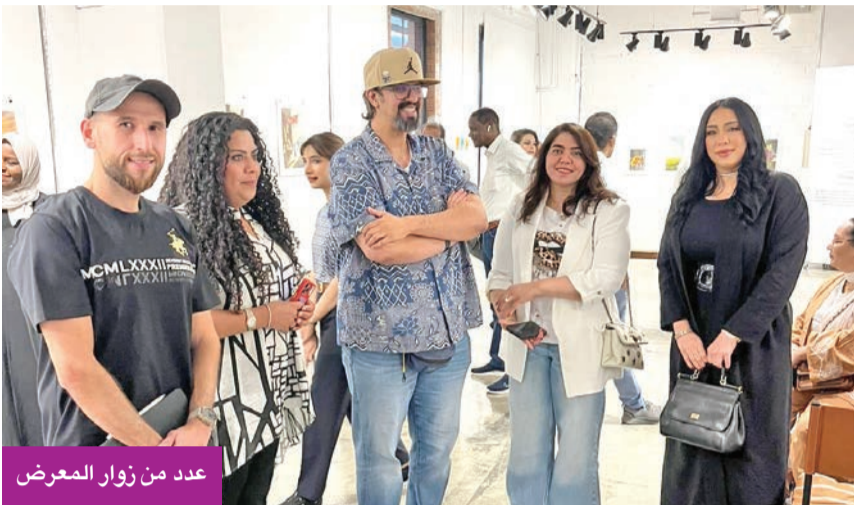
عدد من زوار المعرض