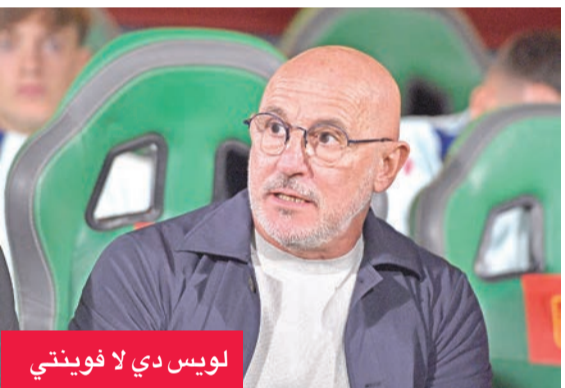
لويس دي لا فوينتي

بشكل منظم ولديه حارس مرمى رائع»، في إشارة إلى جيورجي مامارداشفيلي.