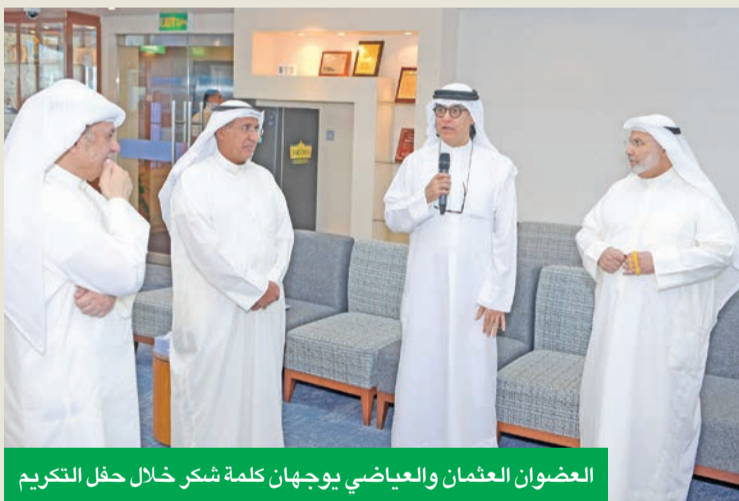
العضوان العثمان والعياضي يوجهان كلمة شكر خلال حفل التكريم