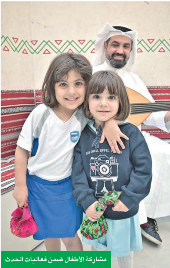
مشاركة الأطفال ضمن فعاليات الحدث