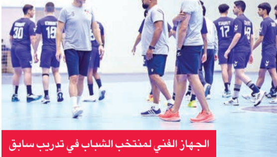
الجهاز الفني لمنتخب الشباب في تدريب سابق

وقال أن «القرعة متوازنة، والمنتخب يمتلك فرصة جيدة لتجاوز الدور الأول، وأتمنى أن يقدم اللاعبون المردود المنتظر الذي يؤهلهم للمنافسة على المراكز الأولى في البطولة».