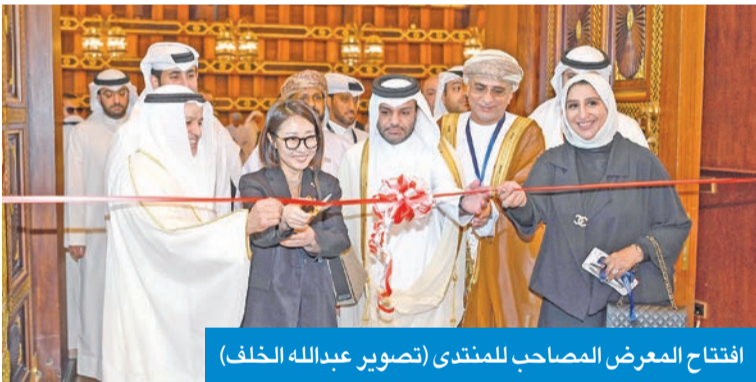
افتتاح المعرض المصاحب للمنتدى

انطلاق المنتدى الدولي للرقمنة ومؤتمر إدارة الوثائق والمحفوظات الزامل: الذكاء الاصطناعي مسؤولية حضارية تتطلب الوعي والإدارة الرشيدة