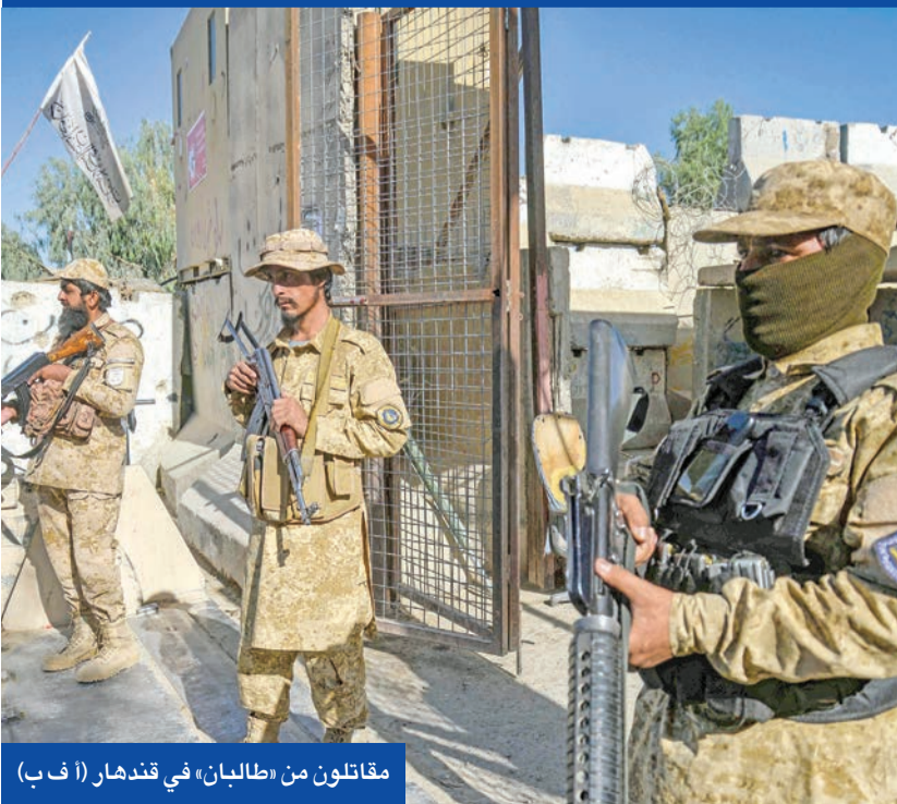
مقاتلون من «طالبان» في قندهار

الإنقاذ «طالبان» بالتوقف عن دعم «طالبان» - باكستان» باءت بالفشل. وأكد «لن نتسامح مع هذا الأمر بعد الآن» داعياً إلى «التكاتف في الرد على من يسهّلون لهم الأمر، سواء كانت المخابئ على أراضينا أو في الأراضي الأفغانية».