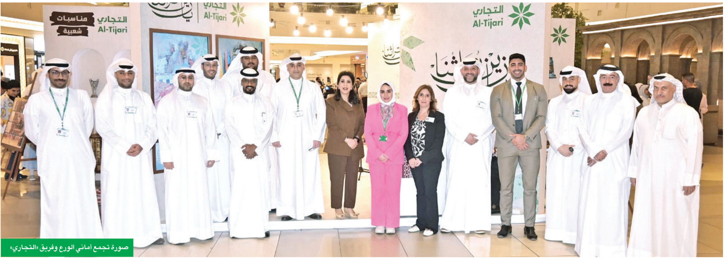
صورة تجمع أمني الورع وفريق «التجاري»