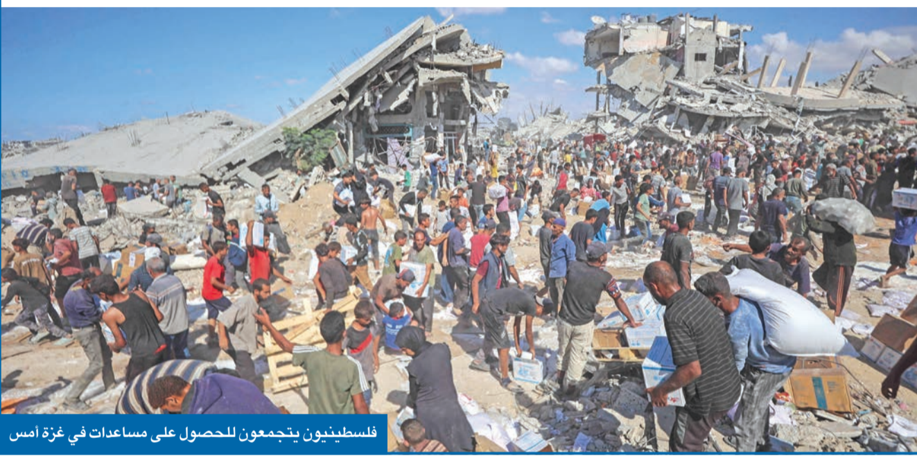
فلسطينيون يتجمعون للحصول على مساعدات في غزة أمس

ابرمها فرنسا وإيطاليا وإسبانيا وإيطاليا، ودول أخرى منها الهند واليابان، في وقت استثنيت من المشاركة إسرائيل وروسيا والصين. وقالت وكالات أنباء إيرانية إن طهران لن ترسل أي مندوب رغم تلقيا دعوة للحضور، في حين أعلن الرئيس الفرنسي إيمانويل ماكرون والمستشار الألماني فرديريش ميرتس، ورئيس الحكومة البريطاني كير ستارمر، ونظيره الإسباني بيدرو سانشيز، ورئيسة الوزراء الإيطالية جورجيا ميلوني مشاركتهم. ووصف وزير الخارجية المصري بدر عبدالعاطي القمة بأنها لقاء تاريخي يهدف إلى «إنهاء الحرب على غزة، وتدشين فصل جديد من السلام والأمن في المنطقة، يساهم في استعادة الاستقرار الإقليمي ووضع حد لمعاناة الشعب الفلسطيني في القطاع».