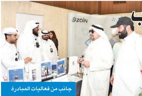
جانب من فعاليات المبادرة

وقالت إن «هذه المبادرة انطلقت من الجامعة قبل 20 عاماً لخلق بيئة صحية مستدامة، مشيرة إلى أنها تعد