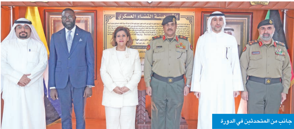
جانب من المتدربين في الدورة

وصلت، أمس، الطائرة الإغاثية الـ19 من الجسر الجوي الكويتي الثاني ضمن الحملة الإنسانية «الكويت بجانبكم» لإغاثة الأشقاء الفلسطينيين في قطاع غزة إلى مطار العريش المصري محملة بـ40 طناً من المساعدات الغذائية، تمهيداً لإيصالها إلى القطاع ليصل إجمالي المساعدات الكويتية حتى أمس إلى 400 طن. وتأتي الطائرات الإغاثية المنطلقة من قاعدة عبدالله المبارك الجوية ضمن حملة «فزة لغزة» التي نظمتها جمعية الهلال الأحمر الكويتي بالتعاون مع جهات خيرية كويتية، بالتنسيق مع وزارات الشؤون والخارجية والدفاع ممثلة بالقوة الجوية الكويتية. وقال رئيس مجلس إدارة الهلال الأحمر الكويتي خالد المغاسم لـ«كونا»، قبيل إقلاع الطائرة، إن الجمعية تواصل جهودها لضمان توفير الاحتياجات الغذائية الأساسية للأشقاء في قطاع غزة، وتيسير نقلها عبر الجسر الجوي بالتعاون مع الجهات المعنية. وأكد المغاسم أن استمرار الجسر الجوي يعكس ثبات الموقف الإنساني للكويت في نصرة الشعب الفلسطيني، مبيناً أن الرحلات ستواصل تباعاً لإيصال المزيد من المواد الغذائية بالتنسيق مع سفارة الكويت لدى مصر والهلال الأحمر المصري.