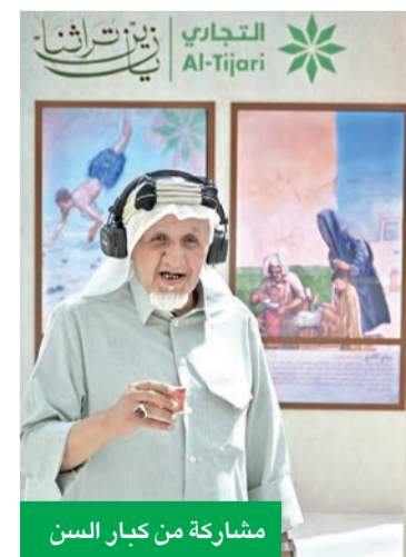
مشاركة من كبار السن