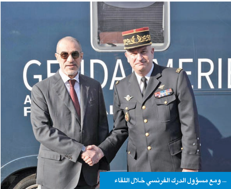
... ومع مسؤول الدرك الفرنسي خلال اللقاء

أكد أن التعاون الدولي حجر الأساس لحماية المجتمعات من الإرهاب والجريمة المنظمة