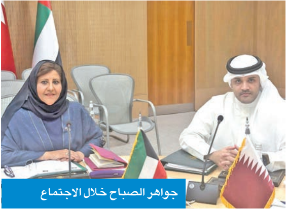
جواهر الصباح خلال الاجتماع

ودعم الشباب وحفظ حقوق الأطفال وتعزيز دور كبار السن والأشخاص ذوي الإعاقة، استناداً إلى القوانين الوطنية والرؤى التنموية للدول الأعضاء.