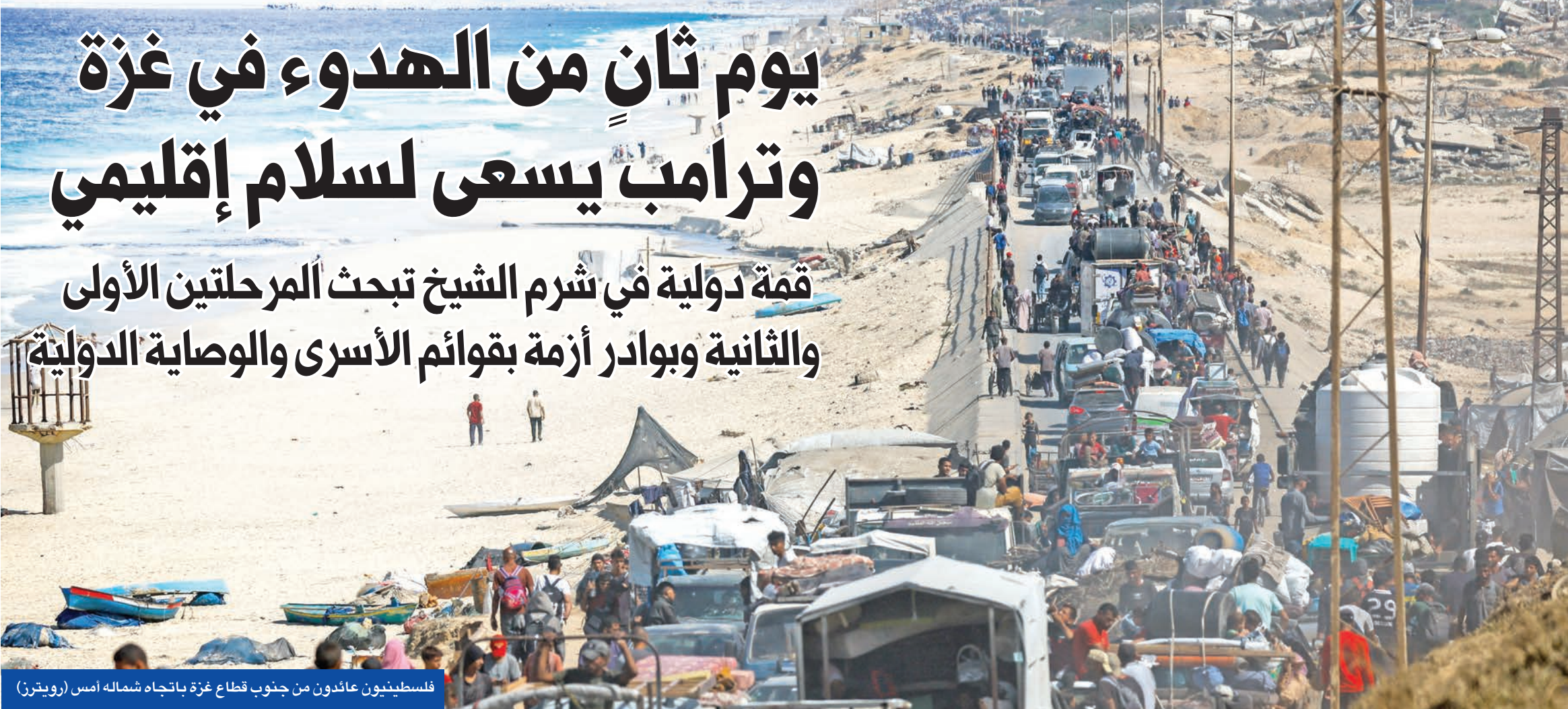
فلسطينيون عائدون من جنوب قطاع غزة باتجاه شماله امس

وفي غضون ذلك، نقلت إسرائيل 195 أسيراً إضافة إلى 60 من المحكومين بالسجن لفترات طبيعية من 5 سجون، إلى مركزين للاعتقال، كتسبوعات في صحراء النقب، وسجن عوفر في رام الله، لإطلاق سراحهم حال مضت الصفقة، ووافقت «حماس» على إطلاق سراح المحتجزين الإسرائيليين. وأشارت توقعات متشائمة إلى أن الحركة ربما تمتنع عن إطلاق جميع المحتجزين لديها في الموعد المحدد لعدم التزام إسرائيل بقائمة الأسرى، فيما ذكرت الحملة الوطنية للكشف عن مصير المفقودين إن إسرائيل تواصل احتجاز 735 جنماتاً فلسطينياً، بينهم 67 طفلاً.