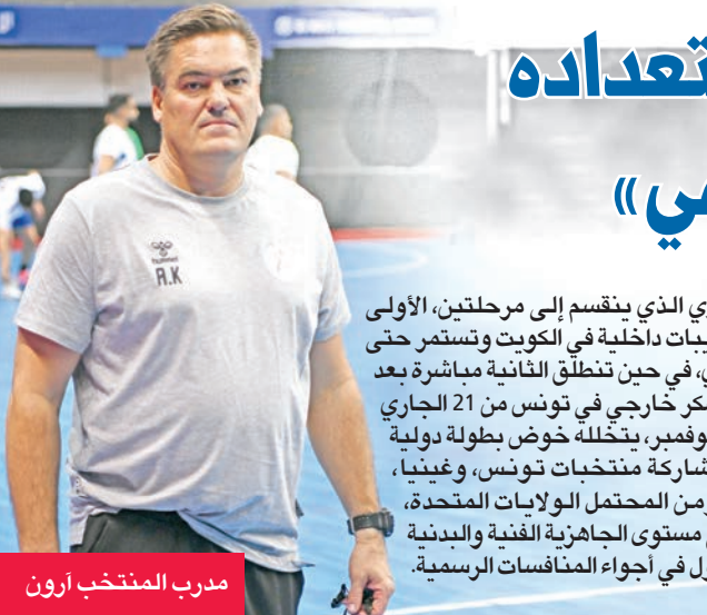
مدرب المنتخب آرون

يبدأ منتخب الكويت الأول لكرة اليد مساء اليوم تدريباته المحلية على صالة نادي الكويت، ضمن استعداداته للمشاركة في دورة ألعاب التضامن الإسلامي، التي تستضيفها العاصمة السعودية الرياض خلال الفترة من 7 إلى 21 نوفمبر المقبل، حيث يسعى الأزرق إلى الظهور بصورة مشرفة تعكس تطور اللعبة محلياً. ويشرف الجهاز الفني بقيادة المدرب الإسباني آرون كرسينسون على البرنامج