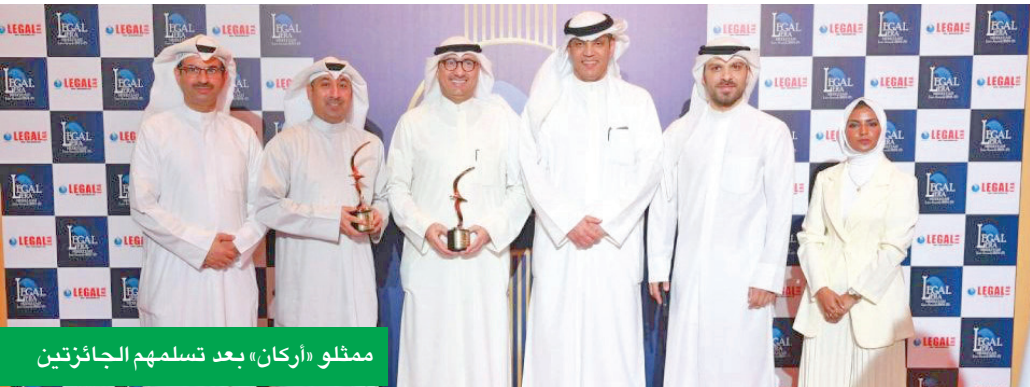
ممثلو «أركان» بعد تسلمهم الجائزتين