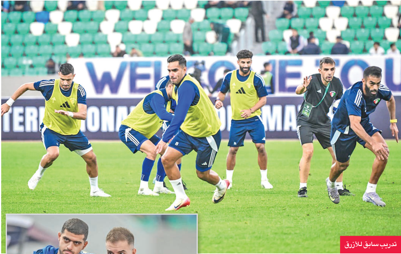
تدريب سابق للأزرق