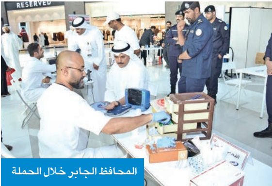
المحافظ الجابر خلال الحملة

بإدارتي خدمات نقل الدم والطوارئ الطبية، والبنك التجاري الكويتي، ومجموعة التمدين، وإدارة المجمع، وغيرها من الجهات المشاركة والداعمة، تقديراً لإسهامهم في تحقيق أهداف الحملة، وتعزيز روح العطاء في المجتمع.