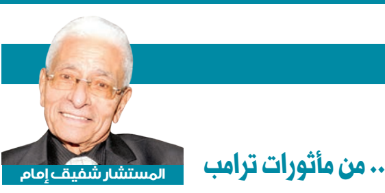
المستشار شفيق إمام