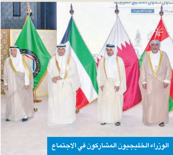
الوزراء الخليجيون المشاركون في الاجتماع

أكد وزراء الثقافة بدول مجلس التعاون لدول الخليج العربية دعمهم لترشح دولة الكويت لعضوية لجنة التراث العالمي التابعة لمنظمة الأمم المتحدة للتربية والعلم والثقافة (اليونسكو).