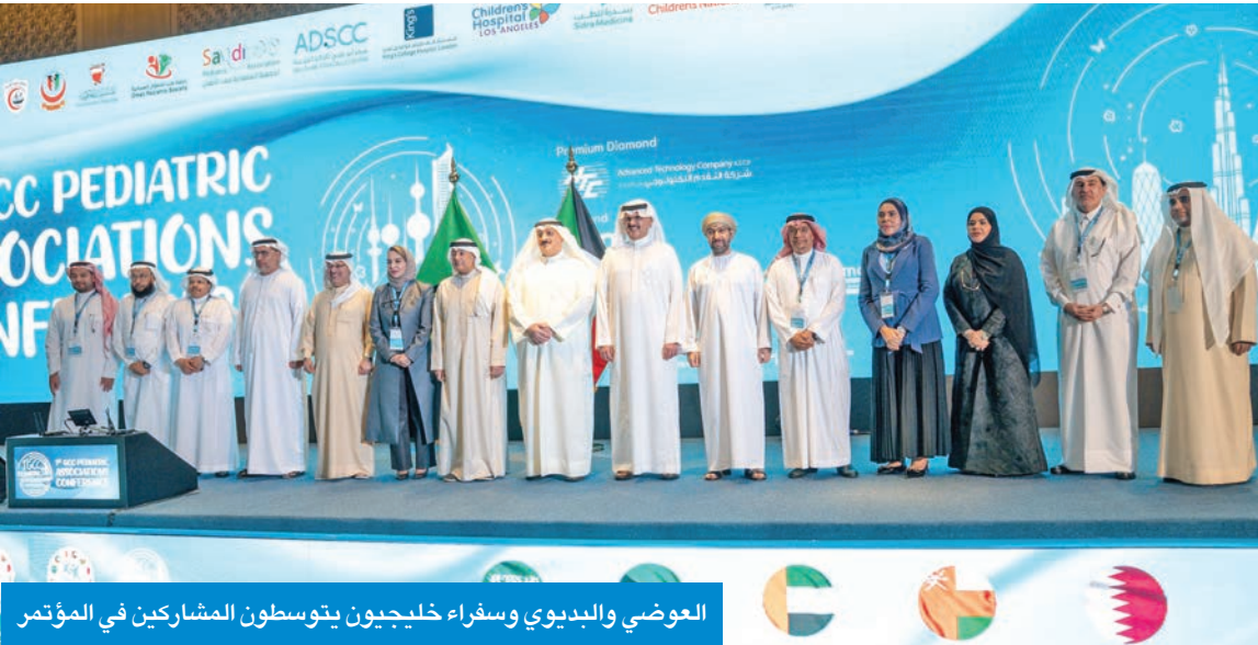
العوضي والبدوي وسفراء خليجيون يتوسطون المشاركين في المؤتمر

قال وزير الصحة د. أحمد العوضي، إن الكويت أولت اهتماماً كبيراً ومبكراً بصحة الطفولة، انطلاقاً من قناعتها الراسخة بأن بناء الإنسان يبدأ من رعاية الطفل منذ نشأته الأولى إلى جانب دعمها المستمر للبحث العلمي والتدريب والتعليم الطبي المستمر.