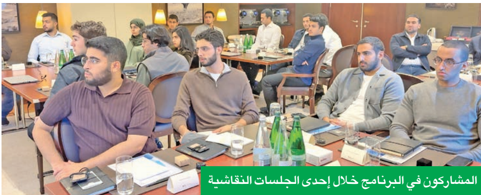
المشاركون في البرنامج خلال إحدى الجلسات النقاشية

البرنامج يُجسد فلسفة «الوطني للثروات» لتجاوز مفهوم الثروة» ويلهم المشاركين لاتخاذ قرارات مالية أكثر وعياً واستدامة