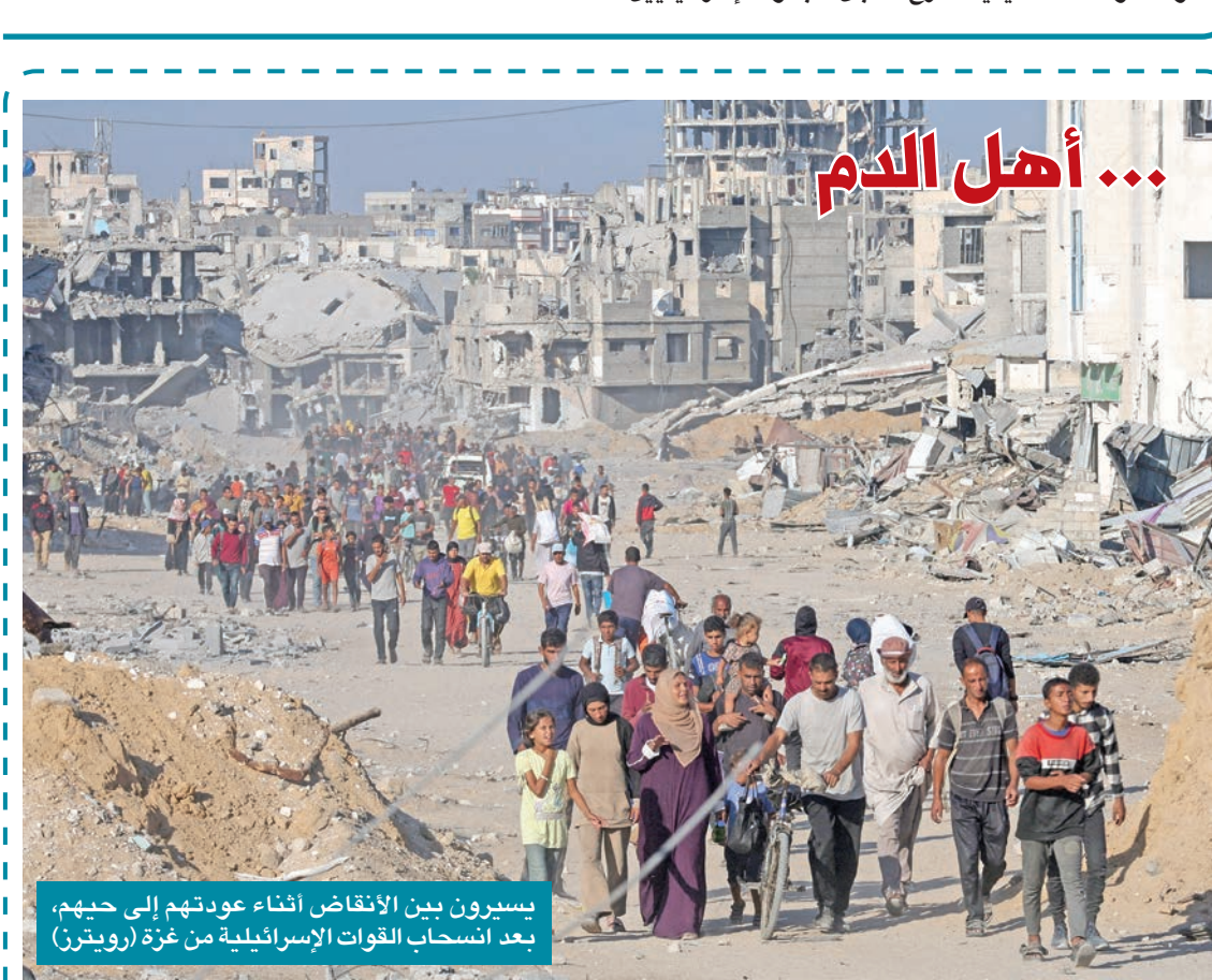
يسيرون بين الانقاض أثناء عودتهم إلى حبيهم، بعد انسحاب القوات الإسرائيلية من غزة