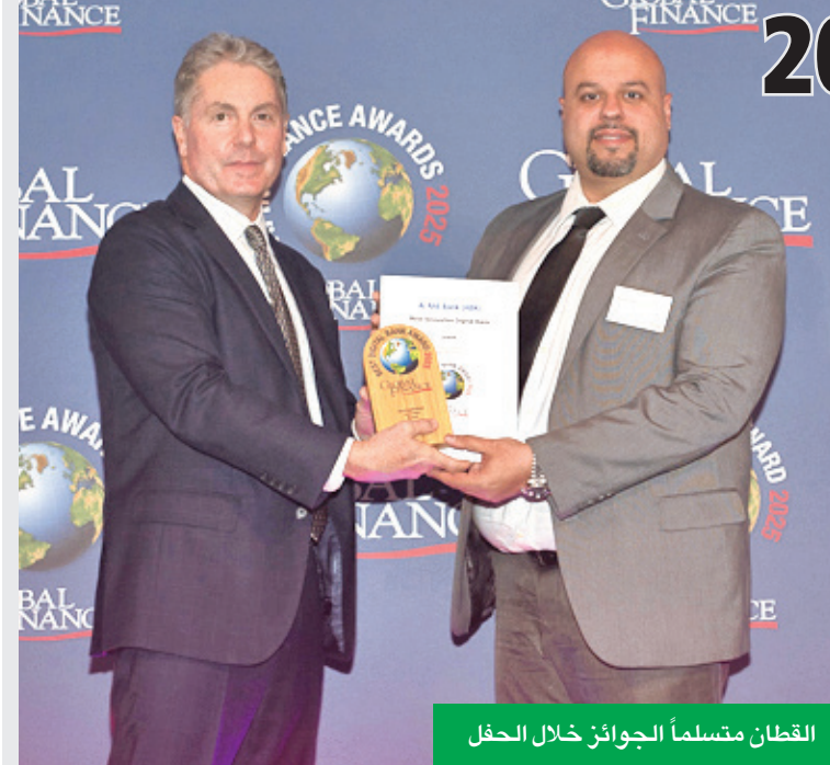
القطان متسلماً للجوائز خلال الحفل

الكويتية والإماراتية، ويخدم كذلك عملاءه الأفراد من خلال فروعها المتواجدة في دبي، وأبوظبي، ومركز دبي المالي العالمي (DIFC).