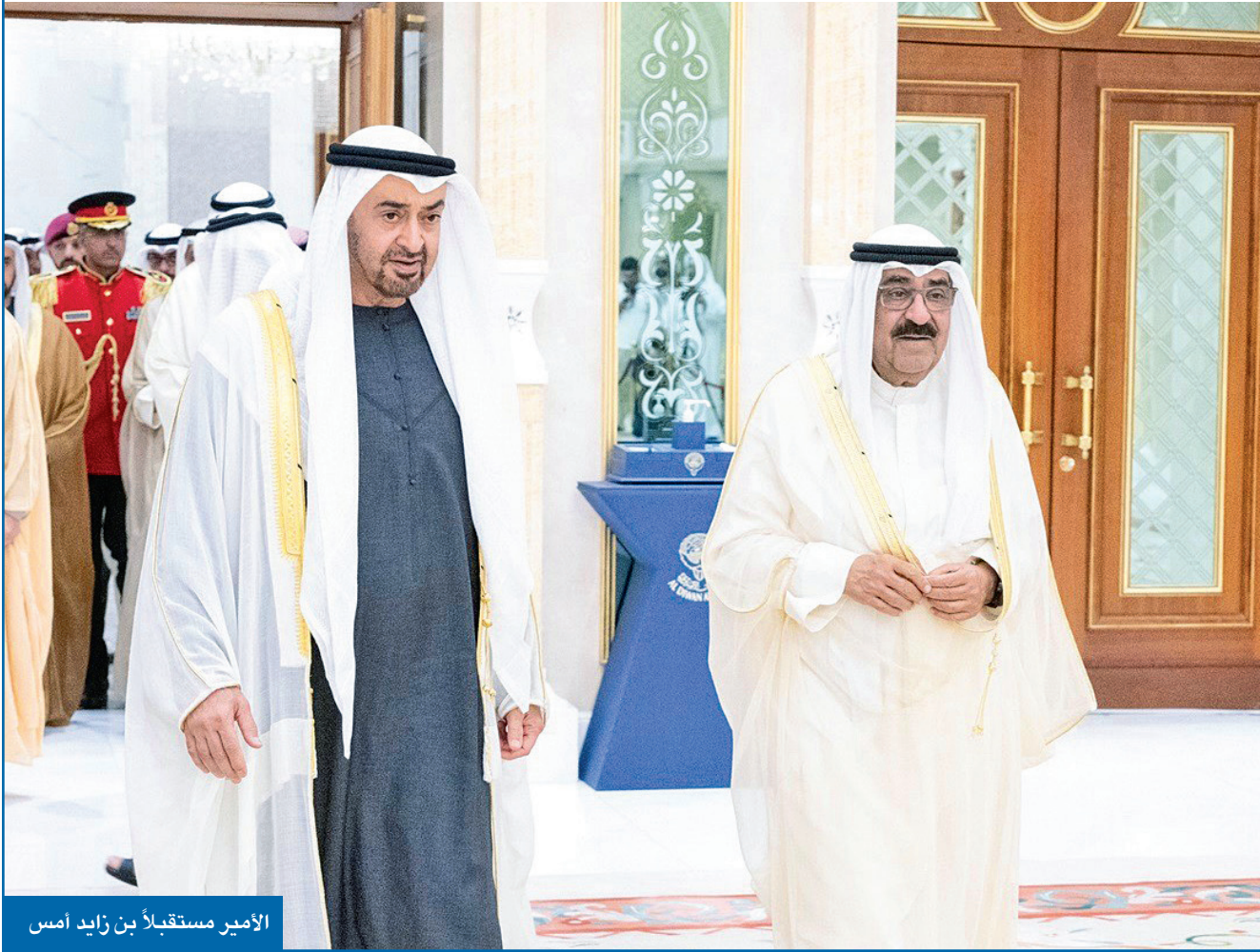
الأمير مستقبلاً بن زايد أمس

الأمير استقبل رئيس الإمارات والوفد المرافق بحضور ولي العهد ورئيس الوزراء