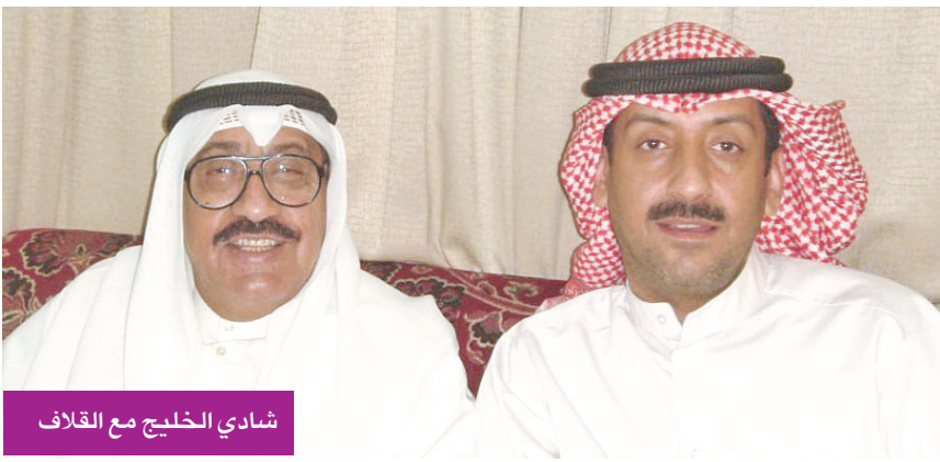
شادي الخليج مع القلاف

باعتباره رمزاً من رموز الفن الكويتي الأصيل، ومثالاً في العطاء والالتزام الفني. إصدار هذا الكتاب يأتي تقديراً لدوره الريادي في بناء الهوية الموسيقية الوطنية، وتقديم الكويت بصورتها الجميل إلى العالم العربي». وأكد أن توثيق مسيرة رموزنا الفنية مسؤولية ثقافية وطنية، فهو يحفظ الذاكرة، ويمنح الأجيال القادمة فرصة للتعرف على رواد الفن الذين أسهموا في تشكيل وجداننا الثقافي».