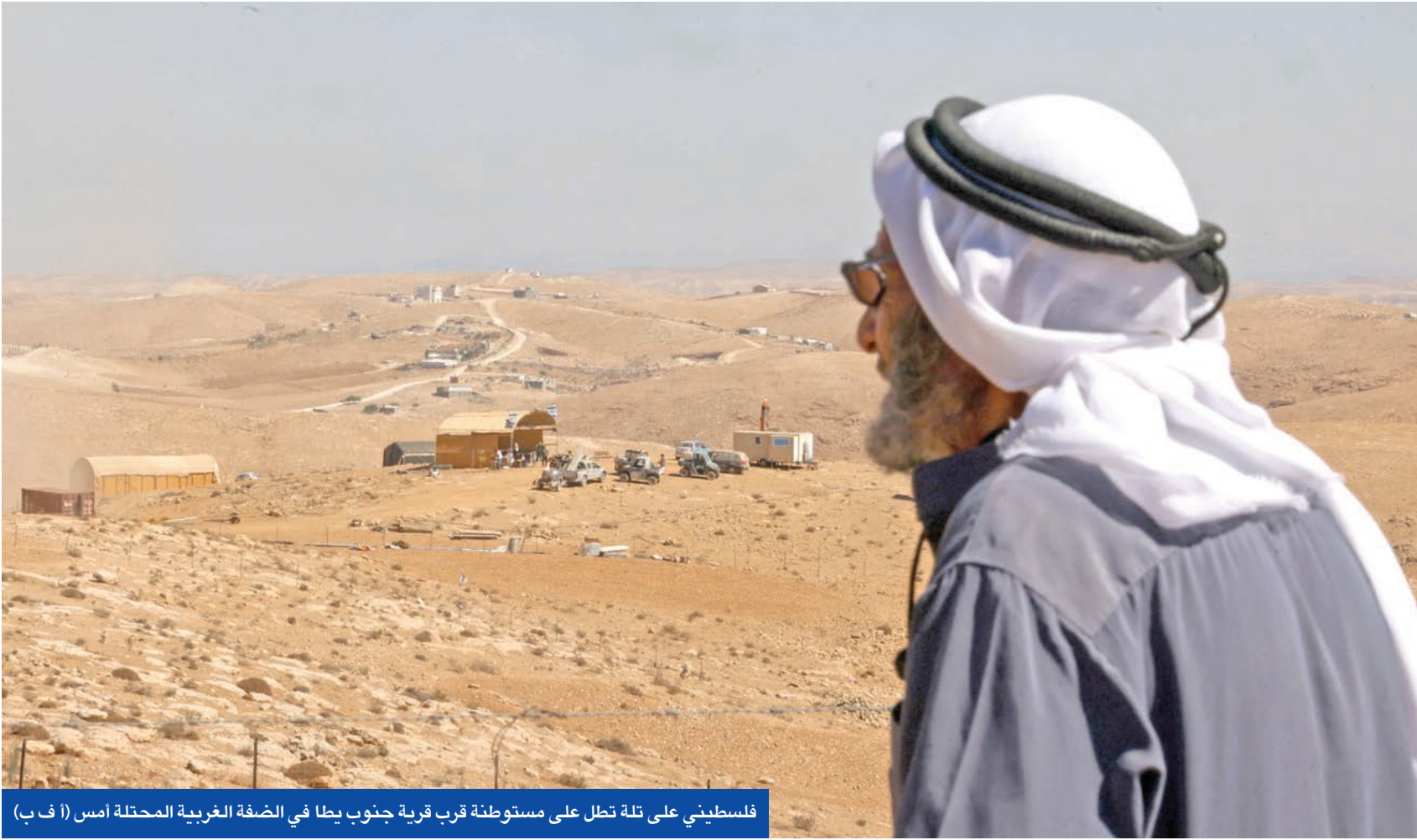
فلسطيني على تلة تطل على مستوطنة قرب قرية جنوب بطا في الضفة الغربية المحتلة أمس

توسعت المفاوضات الدائرة في شرم الشيخ المصرية، منذ الاثنين الماضي، بشأن خطة الرئيس الأميركي دونالد ترامب الشاملة لإنهاء حرب غزة، بمشاركة أطراف فلسطينية ودولية جديدة، أمس، وسط ضغوط مكثفة بمارسها البيت الأبيض لتجاوز الخلافات بشأن القضايا العالقة التي تحول دون تنفيذ المرحلة الأولى من مبادرته التي تقضي بإطلاق سراح جميع المحتجزين الإسرائيليين بالتزامن مع إعلان وقف إطلاق نار وانسحاب جزئي لجيش الاحتلال من القطاع المنكوب.