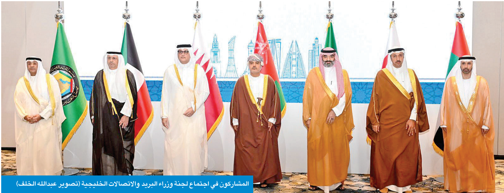
المشاركون في اجتماع لجنة وزراء البريد والاتصالات الخليجية

● البديوي: التعاون الخليجي المشترك أثمر تطوير بيئة تشريعية محفزة للتحول الرقمي