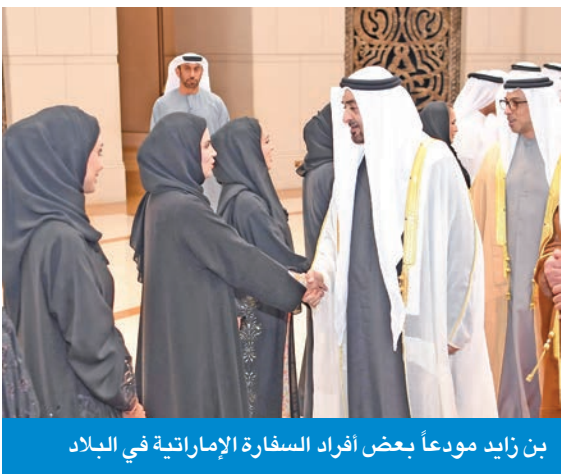
بن زايد مودعاً بعض أفراد السفارة الإماراتية في البلاد