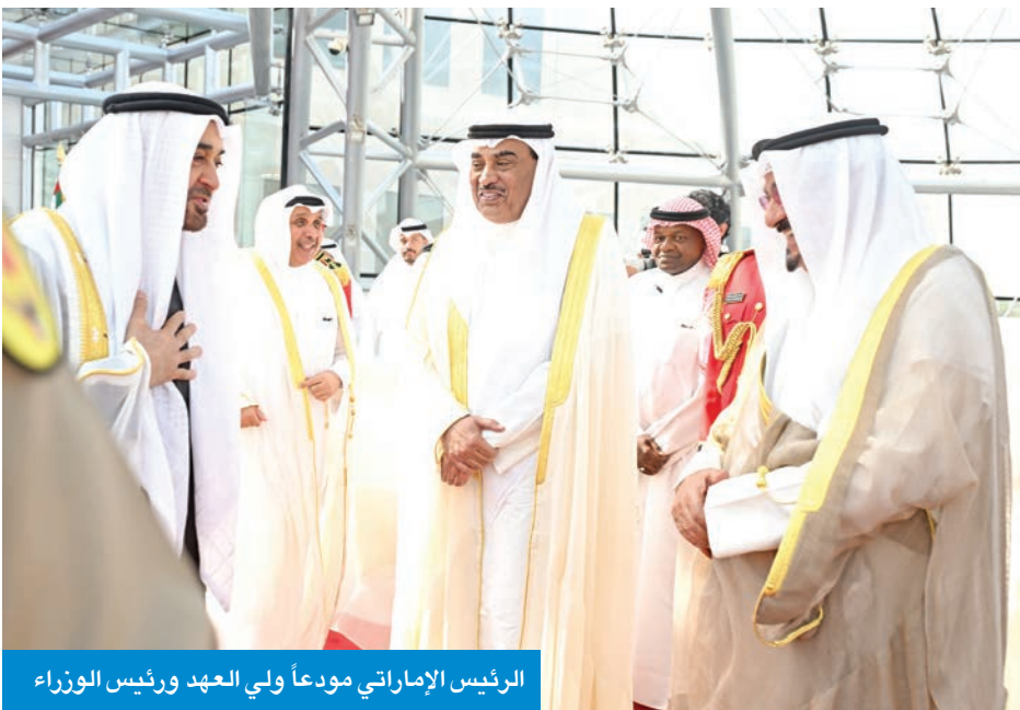
الرئيس الإماراتي مودعاً ولي العهد ورئيس الوزراء