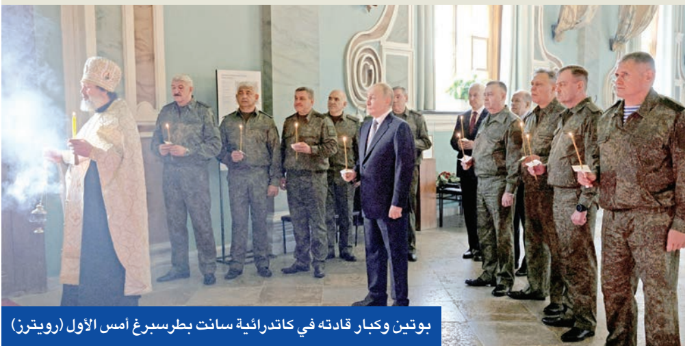
بوتين وكبار قاداته في كاتدرائية سانت بطرسبرغ أمس الأول

البرلمان الأوروبي المخصصة لمناقشة الرد الموحد على انتهاك المقاتلات الروسية والمسرّبات الأجواء في إستونيا وبليجكا وبولندا ورومانيا والدنمارك وألمانيا، هذه الأفعال «ليست مضايقات عشوائية بل حملة منسقة ومتصاعدة تهدف إلى زعزعة استقرار مواطنينا واختيار صمودنا وتقسيم اتحادنا