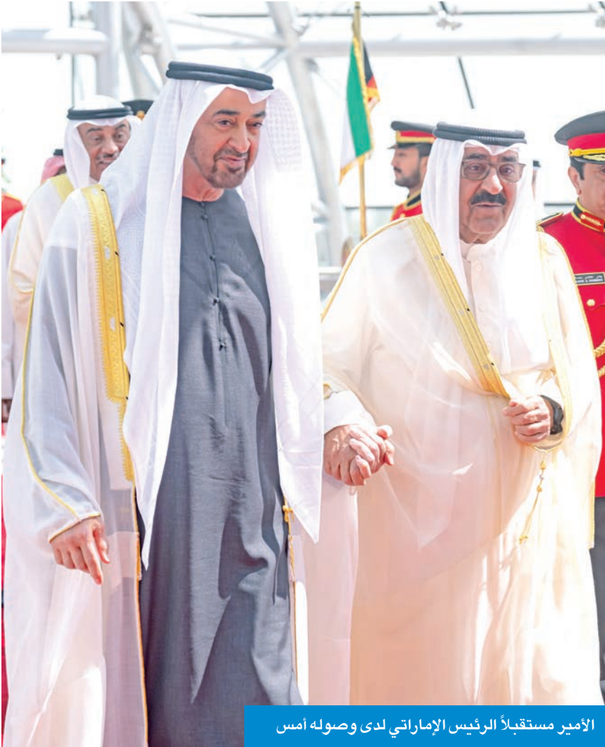
الأمير مستقبلاً الرئيس الإماراتي لدى وصوله أمس