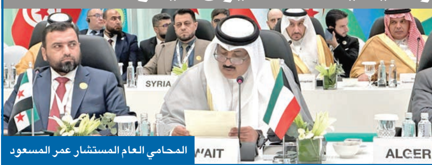
المحامي العام المستشار عمر المسعود

«النيابة»: استرداد أصول موزعة عربياً وخليجياً بـ 89 مليون دينار