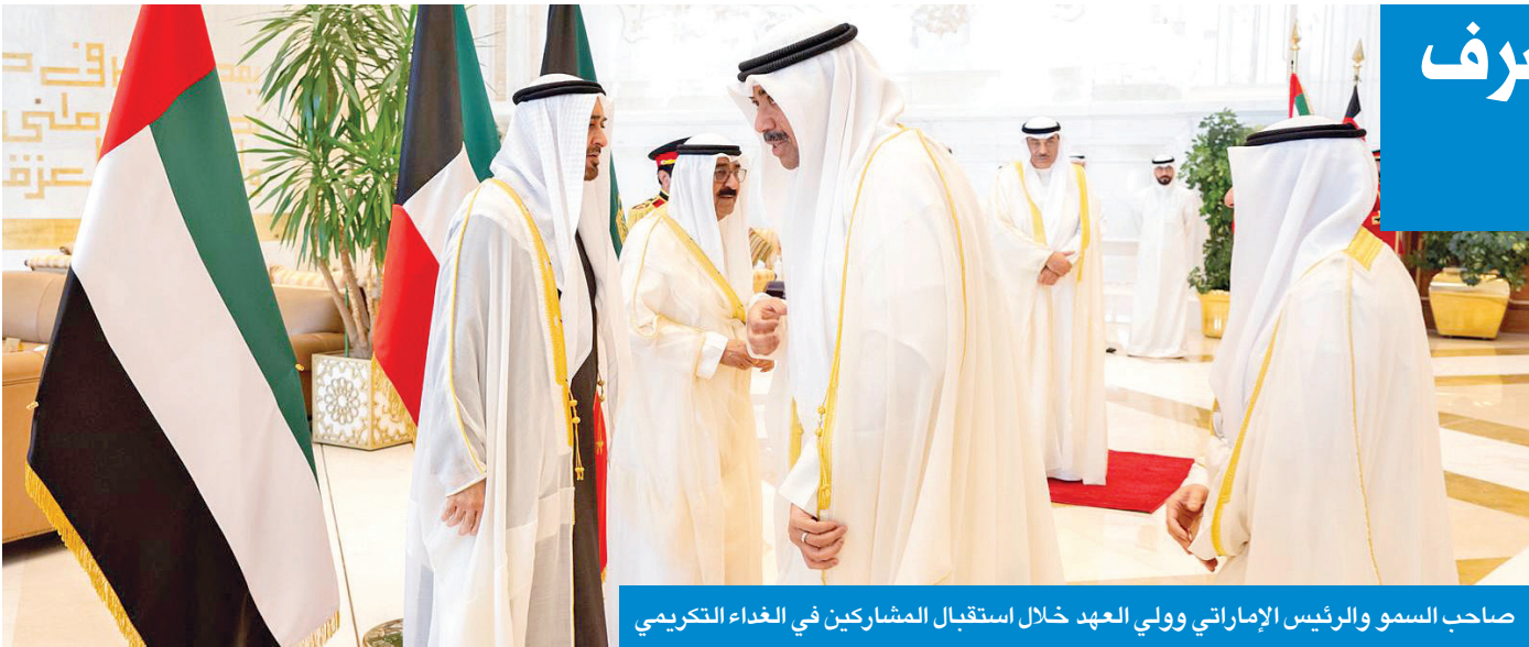
صاحب السمو والرئيس الإماراتي وولي العهد خلال استقبال المشاركين في الغداء التكريمي