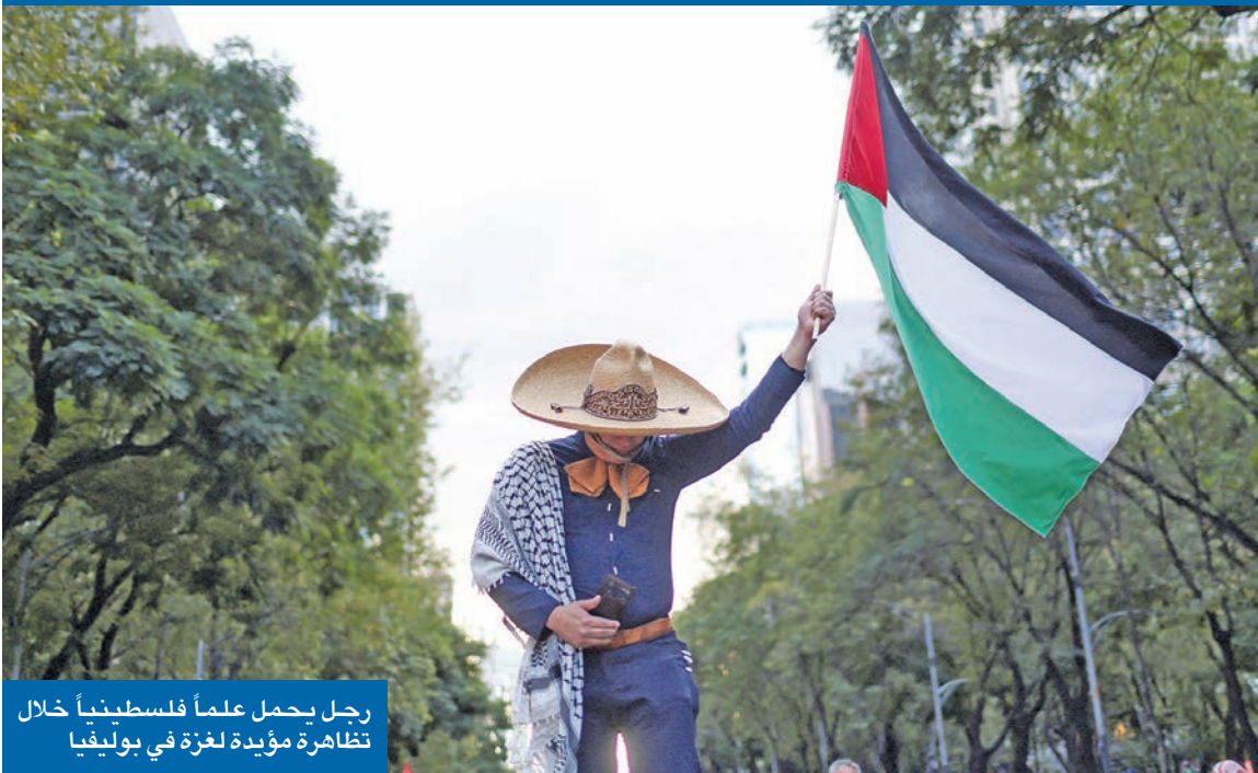
رجل يحمل علماً فلسطينياً خلال تظاهرة مؤيدة لغزة في بوليفيا