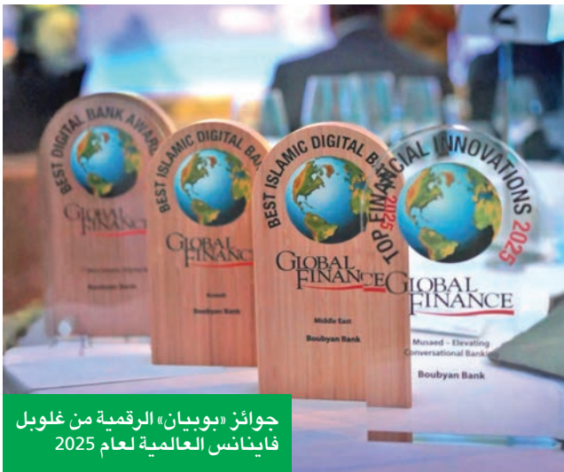
جوائز «بوبيان» الرقمية من غلوبل فاينانس العالمية لعام 2025