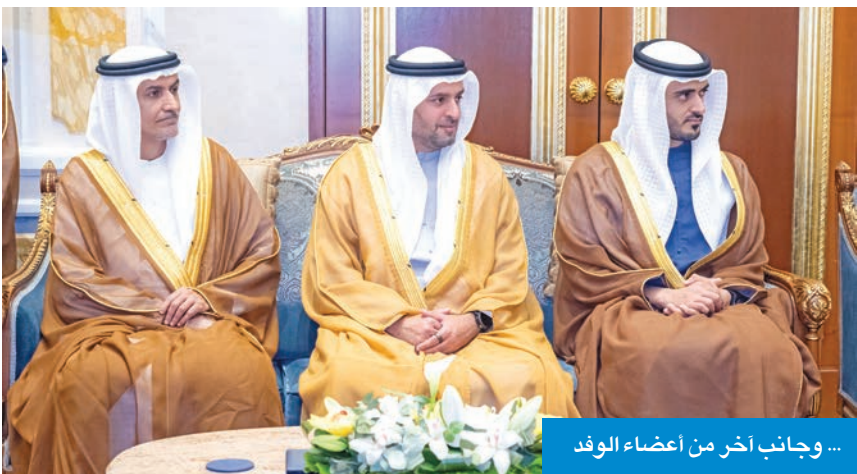
...وجانب آخر من أعضاء الوفد