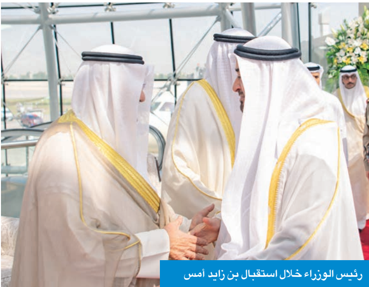
رئيس الوزراء خلال استقبال بن زايد أمس