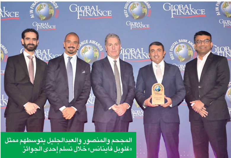
المجعد والمنصور والعبد الجليل بتوسطهم ممثل «غلوبل فاينانس»، خلال تسلّم إحدى الجوائز

● حصد 4 جوائز يؤكد نجاح استراتيجيته في التوسع الرقمي ● «مساعد» الرقمي أفضل ابتكار تفاعلي للذكاء الاصطناعي