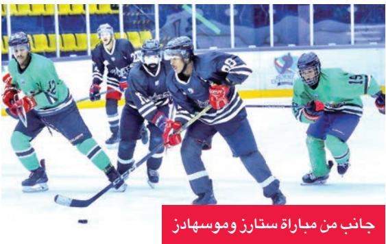
جانب من مباراة ستارز وموسهادر

واصل نادي ستارز تألقه في بطولة الدوري الكويتي لهوكي الجليد للرجال، محافظاً على صدارته للموسم الرياضي 2025 - 2026 بعد أن حقق فوزه الرابع على التوالي في ختام القسم الأول من البطولة التي تضم 5 فرق. وتمكن «ستارز» من التغلب على موسهادر بنتيجة كبيرة بلغت 15 - 5، ليرفع رصيده إلى 12 نقطة ويعزز موقعه في قمة الترتيب. المباراة التي أقيمت مساء الثلاثاء على صالة نادي الألعاب الشتوية، شهدت سيطرة واضحة من جانب ستارز، خاصة في الشق الهجومي، حيث فرض الفريق وصيف النسخة الماضية