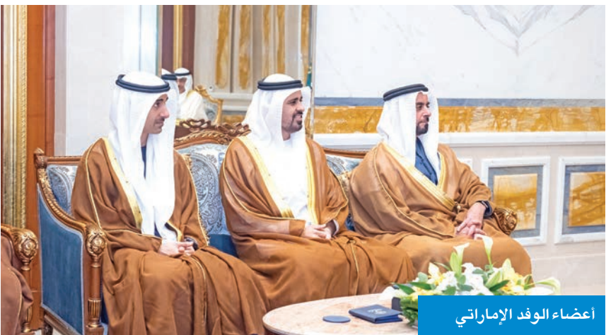
أعضاء الوفد الإماراتي