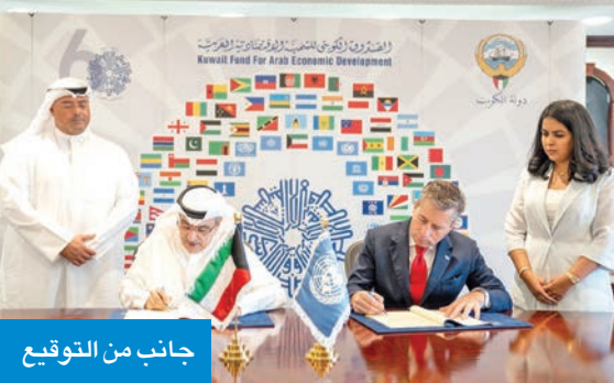
جانب من التوقيع

توفير الخدمات الأساسية في المناطق المتأثرة بالنزاع في السودان. وأوضح أنه يقدم منحة قدرها مليون دولار دعماً لصندوق اليمن الإنساني (واي اتش اف)، مبيحاً أن هذه الاتفاقية تسير على نفس نهج وإجراءات صندوق السودان الإنساني، بهدف تقديم المساعدات الإنسانية المنقذة للحياة.