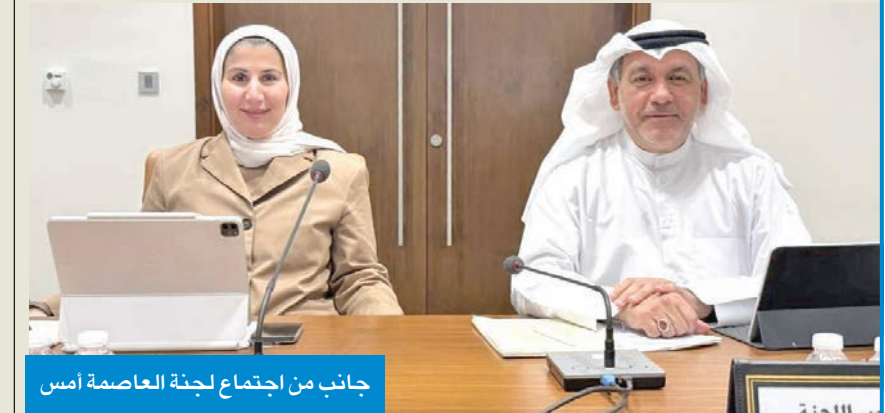
جانب من اجتماع لجنة العاصمة أمس

ووافقت أيضاً على طلب وزارة الكهرباء والماء والطاقة المتجددة تخصيص موقع محطة ثانوية في منطقة الروضة قطعة رقم 2 موقع مقترح رقم 3، بينما أبدت اللجنة عدم موافقتها على طلب شركة إدارة المرافق العمومية إدارة وتشغيل وصيانة مواقف السيارات السطحية المحاورة لبنك الائتمان في منطقة القبلة قطعة رقم 11 خلف موقع البلدية.