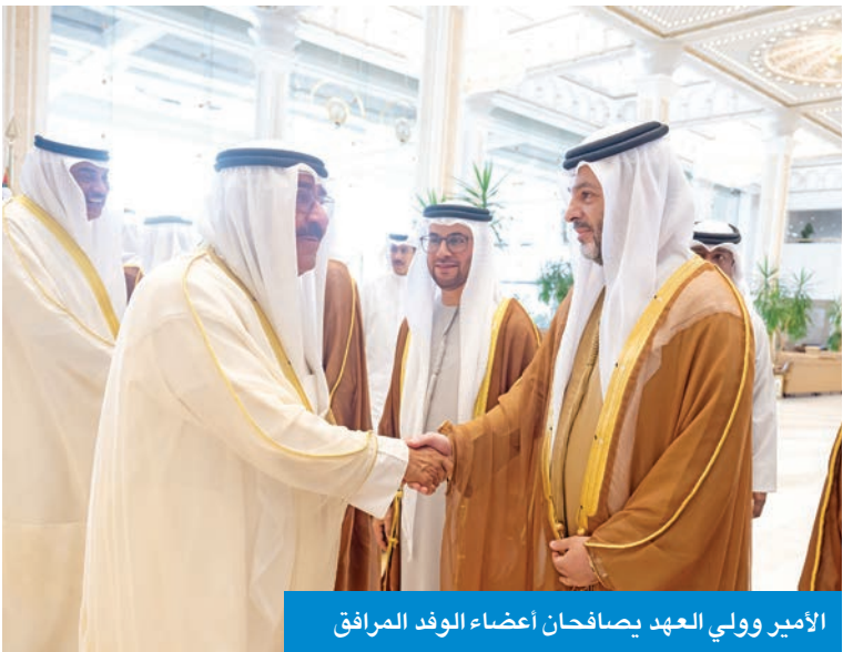
الأمير وولي العهد يصافحان أعضاء الوفد المرافق