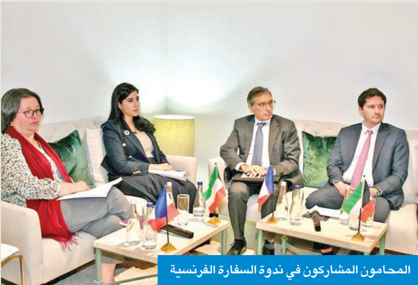
المحامون المشاركون في ندوة السفارة الفرنسية

شارك فيها وفد كويتي رفيع المستوى. وقال إن ندوة هذا العام تشكل امتداداً للقاء الأول الذي عُقد في مايو الماضي بعنوان «المرأة والذكاء الاصطناعي»، في إطار الدبلوماسية النسوية الفرنسية، مؤكداً أن الهدف من هذه اللقاءات هو تعزيز الحوار بين فرنسا والكويت حول تحديات وفرص الثورة الرقمية.