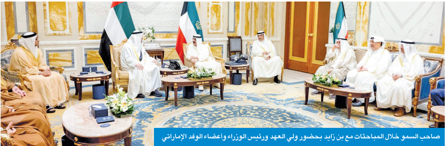
صاحب السمو خلال المباحثات مع بن زايد بحضور ولي العهد ورئيس الوزراء وأعضاء الوفد الإماراتي