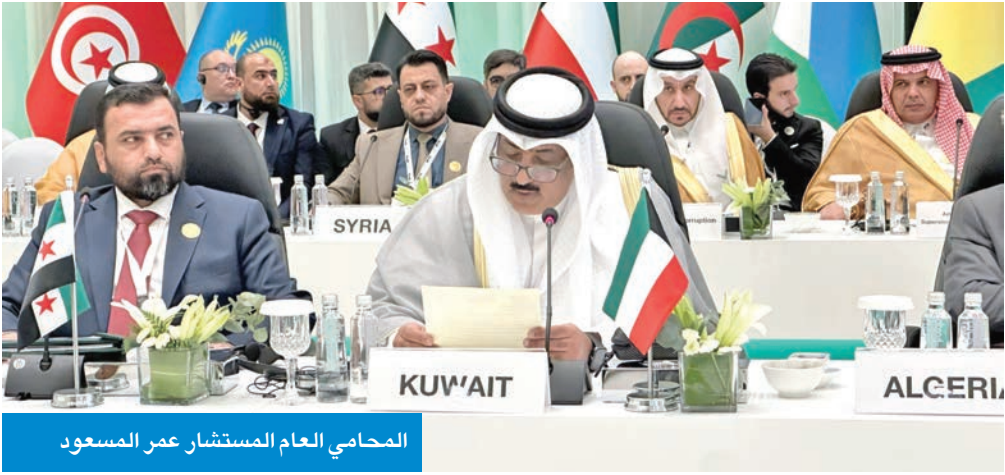
المحامي العام المستشار عمر المسعود

الأصول في منطقة الشرق الأوسط وشمال إفريقيا (مينا-ارين) الانطلاقة الرسمية لعمل الشبكة، بما يسهم في بناء تعاون إقليمي فعال، وتعزيز الشراكات الدولية وأستحداث اليات أكثر كفاءة لمواجهة التحديات المرتبطة باسترداد الأصول وتعزيز النزاهة.