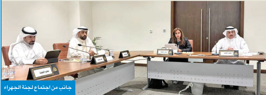
جانب من اجتماع لجنة الجھراء

العامه والحفاظ على البيئة من خلال حملات توعوية ورسائل إعلامية وذلك بهدف تشجيع المواطنين والمقيمين على الالتزام بالقانون وعدم رمي المخلفات والانقاص في غير الأماكن المخصصة لها، مما يساهم في تعزيز السلوك الحضاري والارتقاء بجمال المدن وصحة المجتمع.