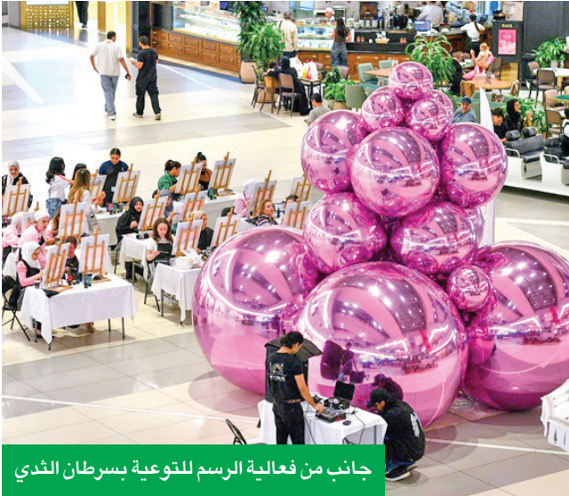
جانب من فعالية الرسم للتوعية بسرطان الثدي

شعار الحملة، حيث سيستمتع الزوار بمقطوعات موسيقية سيتم عزفها دعماً للتوعية بأهمية الكشف المبكر لسرطان الثدي ورفع الروح المعنوية لمحاربات السرطان وغرس روح التفاؤل والأمل لديهن. وتأتي «مو بس وردي» إيماناً من الأقنيوز بالمسؤولية الاجتماعية، والحرص على التأثير الإيجابي على المجتمع، حيث يدعم الأقنيوز العديد من الحملات التوعوية سنوياً، بهدف رفع مستوى الوعي حول العديد من القضايا الصحية والمجتمعية بالتعاون مع العديد من الجهات والمؤسسات ذات الصلة.