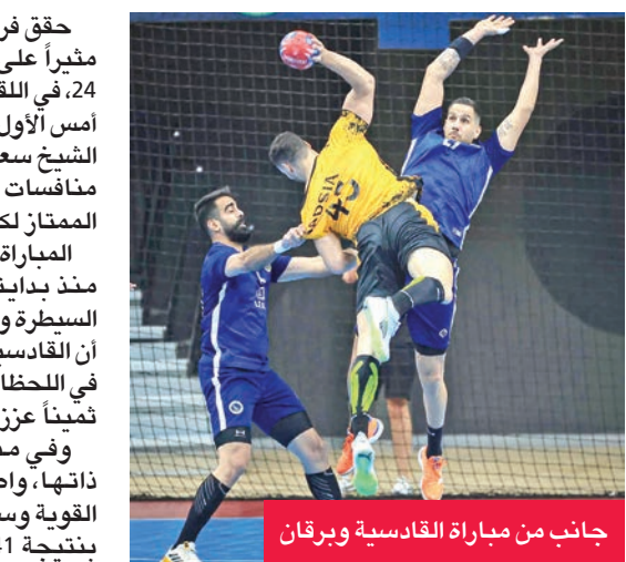
جانب من مباراة القادسية وبرقان