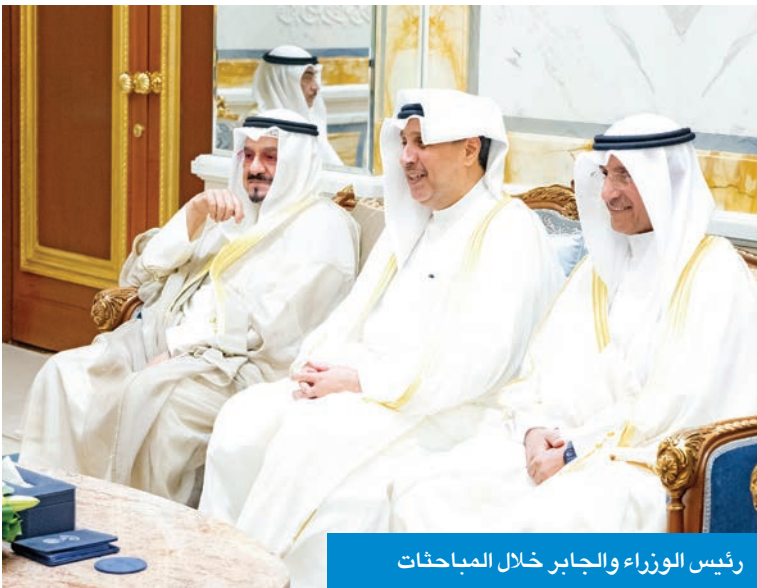
رئيس الوزراء والجابر خلال المباحثات

والمساعي الهادفة إلى إرساء روافد السلام الشامل والعدل الذي يقوم على أساس «حل الدولتين» ووقف إطلاق النار في «قطاع غزة» لتحقيق الأمن والاستقرار في المنطقة. وشدد الأمير وبين زايد على ضرورة استمرار الجهود الدولية للاعتراف بالدولة الفلسطينية لتحقيق كل ما يصبو إليه الشعب الفلسطيني الشقيق من تطلعات