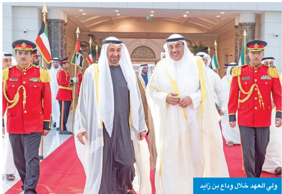
ولي العهد خلال وداع بن زايد

تلقى سمو أمير البلاد الشيخ مشعل الأحمد أمس رسالة خطية من رئيس جمهورية البرازيل لويس إيناسيو لولا دا سيلفا تتعلق بسبل توطيد العلاقات الثنائية بين البلدين الصديقين ومبادئ تعزيز التعاون المشترك في إطار المحافل الدولية. وتتضمن الرسالة دعوة سموه لحضور قمة المناخ المقرر إقامتها يومي 6 و 7 نوفمبر المقبل في مدينة بيليم البرازيلية. وتسلم الرسالة وزير الخارجية عبدالله الجحا لدى استقباله سفير البرازيل لدى دولة الكويت رودريغو دراغو غابش.