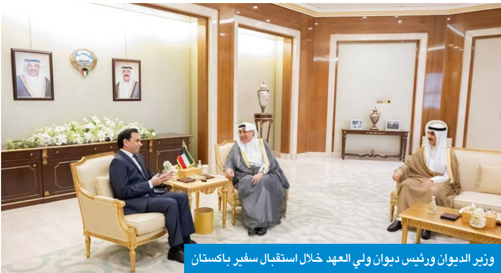
وزير الديوان ورئيس ديوان ولي العهد خلال استقبال سفير باكستان

البلدين الصديقين، والتأكيد على تعزيز الشراكة الاستراتيجية والتعاون بينهما في مختلف القضايا المشتركة.