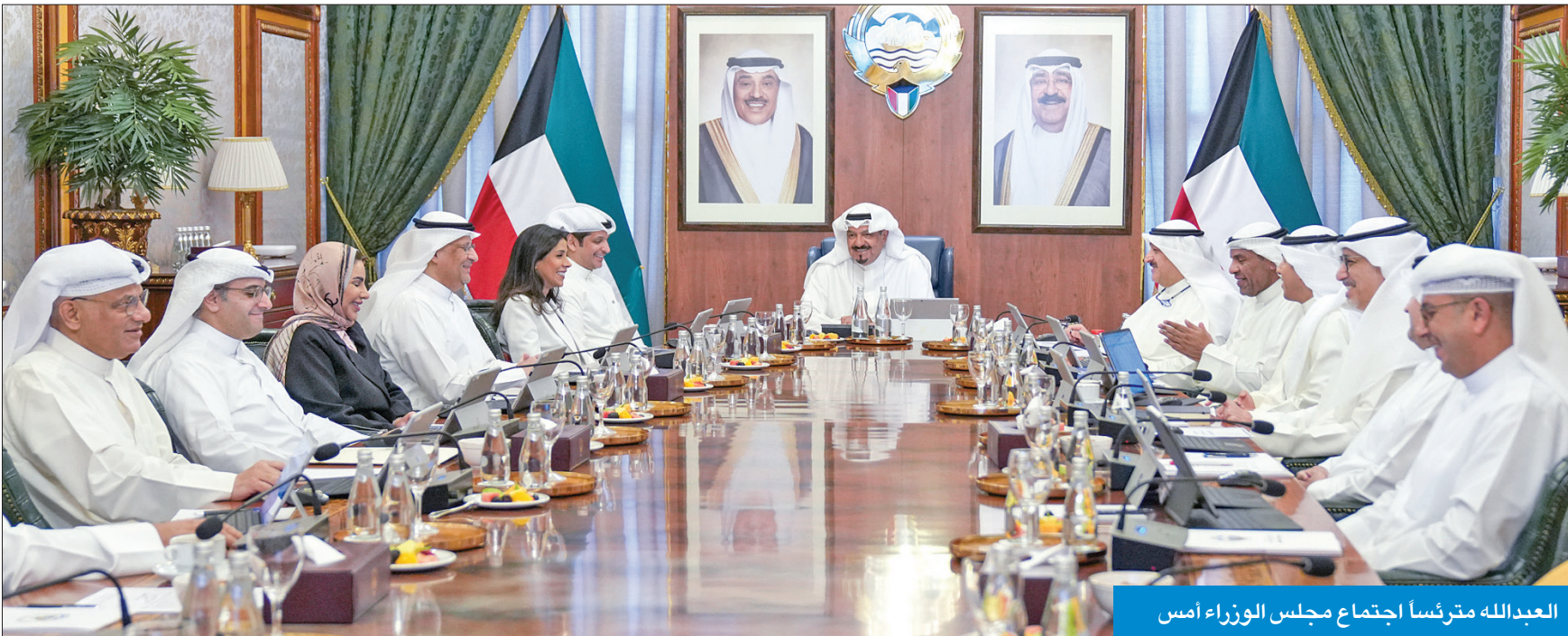
العدالله مترئسا اجتماع مجلس الوزراء أمس

● تعديل «بيت الزكاة» لتشكيل لجنة لتنمية أموال محفظته الاستثمارية المالية والعقارية