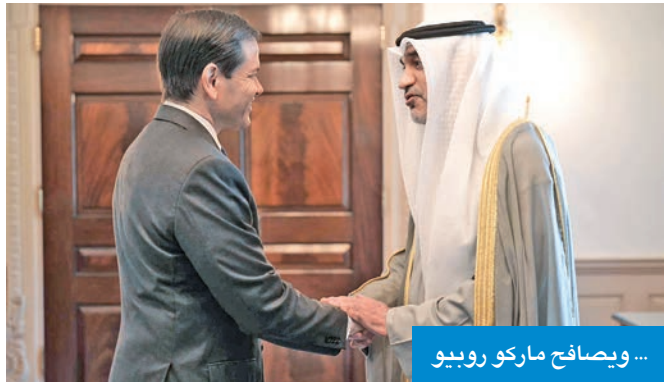
... ويصافح ماركو روبيو

نتطلع إلى مواصلة التنسيق بما يخدم المصالح المشتركة ويدعم تعزيز أمن البلدين