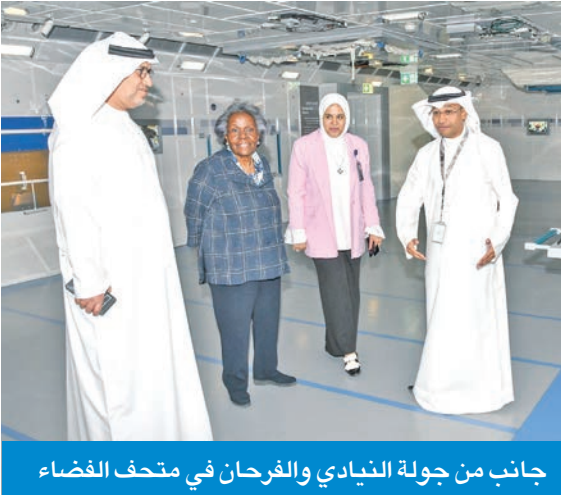
جانب من جولة النيادي والفرحان في متحف الفضاء

النيادي: تعاون وبرامج مشتركة مع الكويت في الاستثمار الفضائي