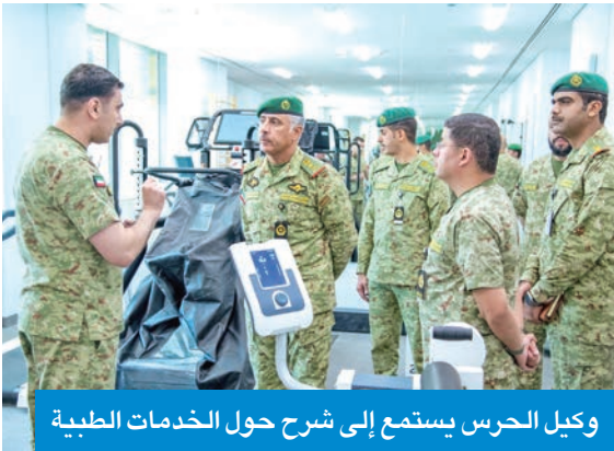
وكيل الحرس يستمع إلى شرح حول الخدمات الطبية

في البنية التحتية والأجهزة والمعدات والتدريب المستمر للوصول إلى أهداف الخطة الاستراتيجية للحرس 2030 (حماية وطن) في ظل الدعم الذي تقدمه قيادة الحرس الوطني للمتسجلين ممثلة في رئيس الحرس، الشيخ مبارك المحمود، ونائب الرئيس الشيخ فيصل النواف.