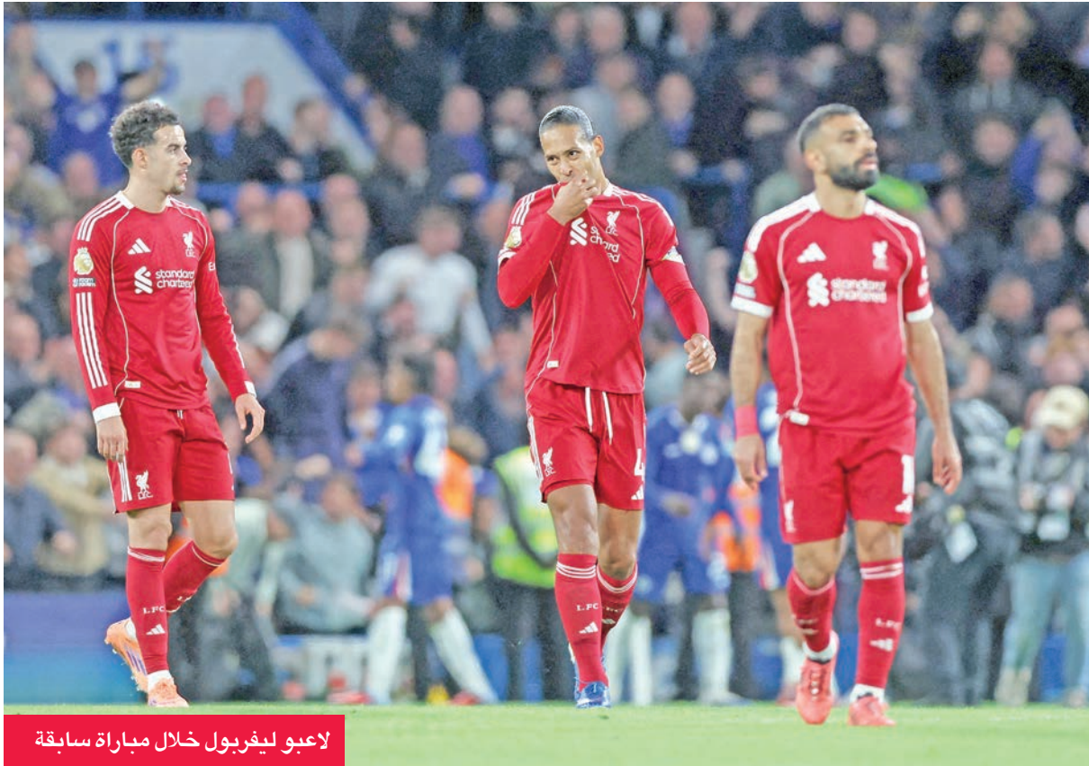
لاعبو ليفربول خلال مباراة سابقة

خلال ثلاثة أسابيع فقط، تتصنّف مواجهات حاسمة أمام مانشستر يونايتد ومانشستر سيتي في الدوري، لقاءً مرتقباً ضد ريال مدريد بدوري الأبطال، إضافة إلى مواجهة في كأس الرابطة أمام كريستال بالاس. (إفي)