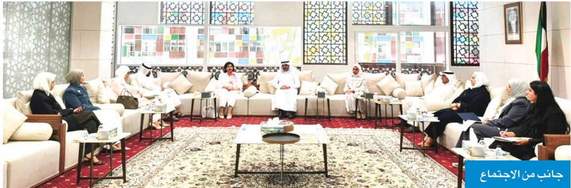
جانب من الاجتماع

العجمي: فخورون بدور «الخارجية» في تعزيز حضور الكويت دولياً