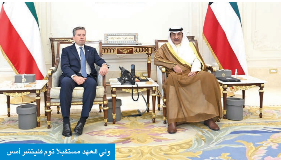
ولي العهد مستقبلاً توم فليتشير أمس

فليتشير، بمناسبة زيارته للبلاد. حضر اللقاء رئيس ديوان سمو ولي العهد الشيخ تامر الجابر وكبار المسؤولين.