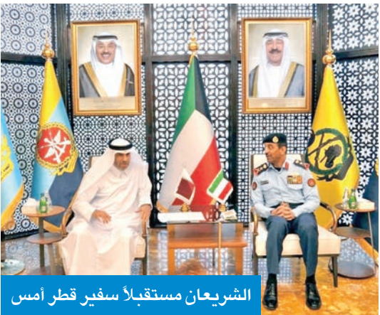
الشريعان مستقبلاً سفير قطر أمس

بحث رئيس الأركان العامة للجيش، الفريق الركن خالد الشريعان، أمس، مع سفير قطر وتركيا لدى البلاد، كل على حدة، عدداً من الموضوعات ذات الاهتمام المشترك.