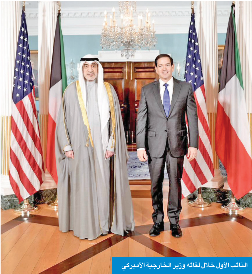
النائب الأول خلال لقائه وزير الخارجية الأمريكي