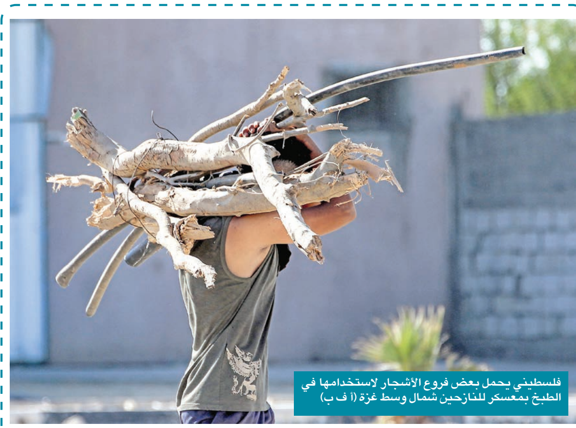
فلسطيني يحمل بعض فروع الأشجار لاستخدامها في الطبخ بمعسكر النازحين شمال وسط غزة