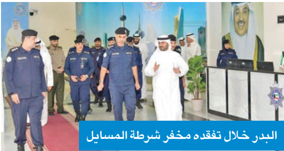
البدر خلال تفقده مخفر شرطة المسابيل

● محمد الشهران للمواطنين والمقيمين وتوفير الأمن والأمان.