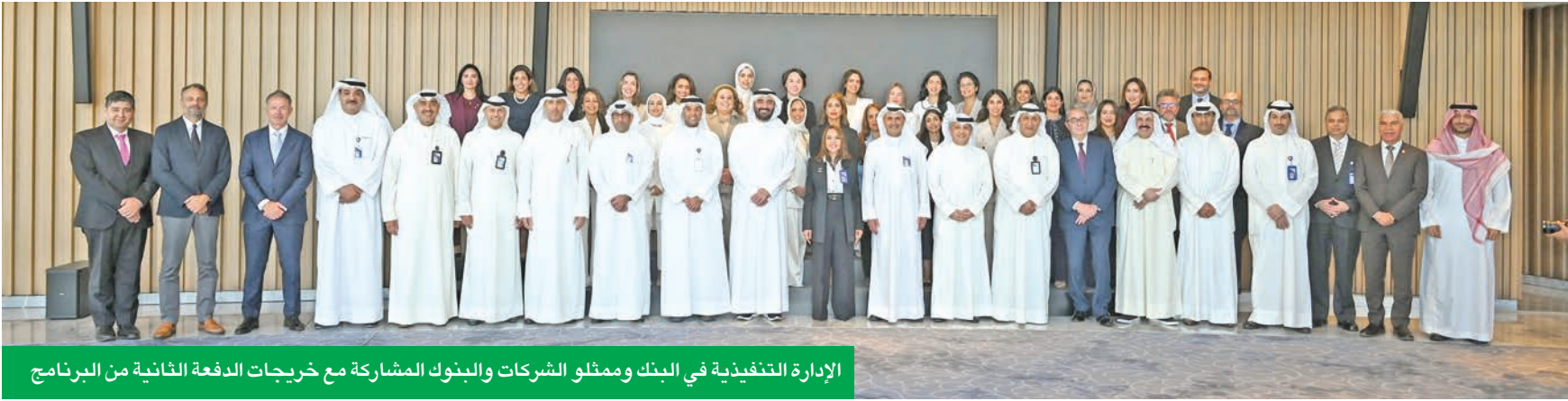
الإدارة التنفيذية في البنك وممثلو الشركات والبنوك المشاركة مع خريجات الدفعة الثانية من البرنامج

يوفرها لدعم وتطوير القيادات النسائية، وهو ما ساعد في زيادة عدد النساء اللواتي يتولين المناصب القيادية والإشرافية في البنك.