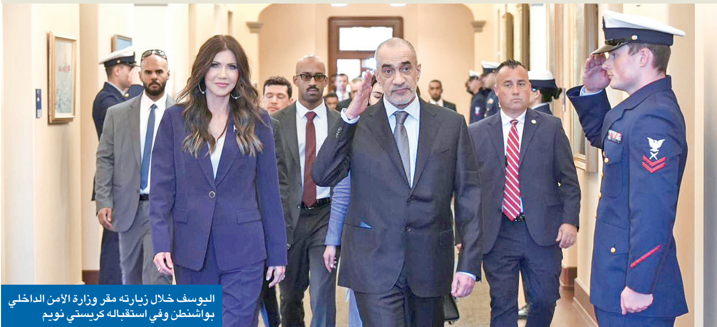
اليوسف خلال زيارته مقر وزارة الأمن الداخلي بواشنطن وفي استقباله كريستي نويم

النائب الأول التقى وزيرَي الخارجية والأمن الداخلي الأميركيين