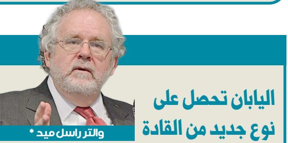
والتر راسل ميد *

بالقلم الأحمر: لماذا لا توجه الحكومة لتكون هذه الكنيسة وجهة للسياحة الدينية، أولاً للمسيحيين والزائرين، وثانياً للمواطنين، للتعرّف على تاريخهم؟