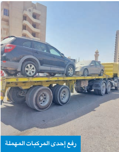
رفع إحدى المركبات المهمة

أعلنت إدارة العلاقات العامة في بلدية الكويت مواصلة الفرق الميدانية لإدارات النظافة العامة وإشغالات الطرق تكثيف جولاتها التفتيشية لرصد وإزالة مخالفات لانتحتي النظافة، وتفعيل الدور الرقابي للأجهزة الرقابية لتطبيق قوانين البلدية. وأوضحت، في بيان لها، أن إدارة النظافة العامة وإشغالات الطرق بفرع بلدية محافظة مبارك الكبير قامت بعمل جولات واسعة على المناطق السكنية، لرفع مستوى النظافة، وكل ما يعمل على إعاقة الطريق، وبشوه المنظر العام، ومنع رمي النفايات خارج الحاويات، كاشفة عن رفع 27 سيارة مهمة وسكراب وقوارب مخالفة، وتحريق 40 مخالفة نظافة عامة وإشغالات طرق، بالإضافة الى توجيه 38 ملصقا للإزالة تضمنت سيارات مهمة وحاولات تجارية مخالفة، وتم تبديل 20 حاوية قديمة بجديدة.