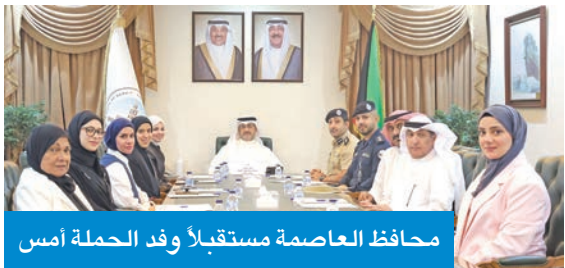
محافظ العاصمة مستقبلاً وفد الحملة أمس

نثمن جهود الحملة الوطنية البيئية «هذا دورك»