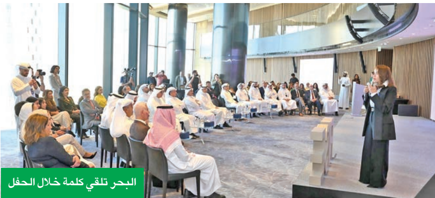
البحر تلقي كلمة خلال الحفل

ويلتزم «الوطني» بترسيخ ثقافة تمكين المرأة على مستوى المجموعة بأكملها وزيادة تواجدها في المناصب القيادية من خلال توفير التوجيه والفرص