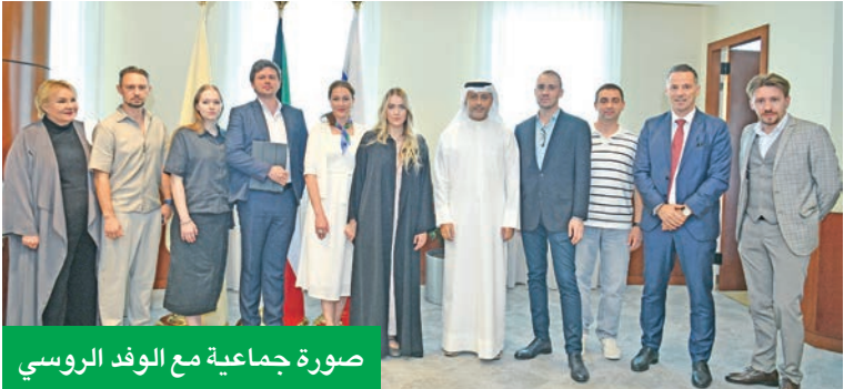
صورة جماعية مع الوفد الروسي

بان يثمر اللقاء تحقيق الأهداف المرجوة، والدفع قدماً نحو تعزيز العلاقات التجارية بين البلدين. وأشار إلى تميّز شركات القطاع الخاص الروسي في الكثير من المجالات التجارية والصناعية، لافتاً إلى ارتباط بعضها بعقود ضخمة مع الحكومة الروسية عبر الخدمات التي توفرها لوزارات الدولة والهيئات الحكومية والجهات الرسمية، وأعرب ممثلو القطاع الخاص الروسي عن الأمل في دخول السوق الكويتي بقوة وتعزيز التواجد التجاري والاستثماري في الكويت.