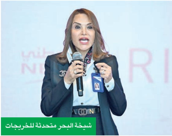
شيخة البحر متحدثة للخريجات

بحضور الإدارة التنفيذية للبنك ورؤساء تنفيذيين وممثلين عن شركات وبنوك