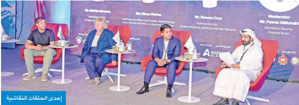
إحدى الحلقات النقاشية

اليوم الثاني لمنتدى «الأمن السيبراني لدول التعاون الخليجي» اتسم بطابع تقني وتطبيقي