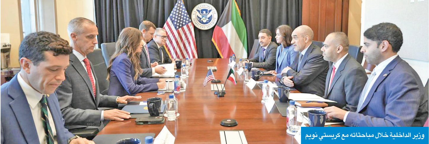
وزير الداخلية خلال مباحثاته مع كريستي نويم

بحث مع وزير الخارجية ووزيرة الأمن الداخلي بالولايات المتحدة تطوير التعاون