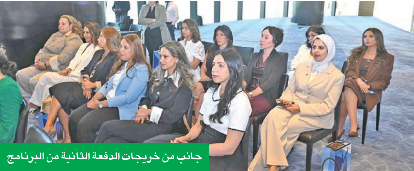
جانب من خريجات الدفعة الثانية من البرنامج

«الوطني» يحرص دائماً على تعزيز تكافؤ الفرص ودعم التنوع والمساواة والشمول