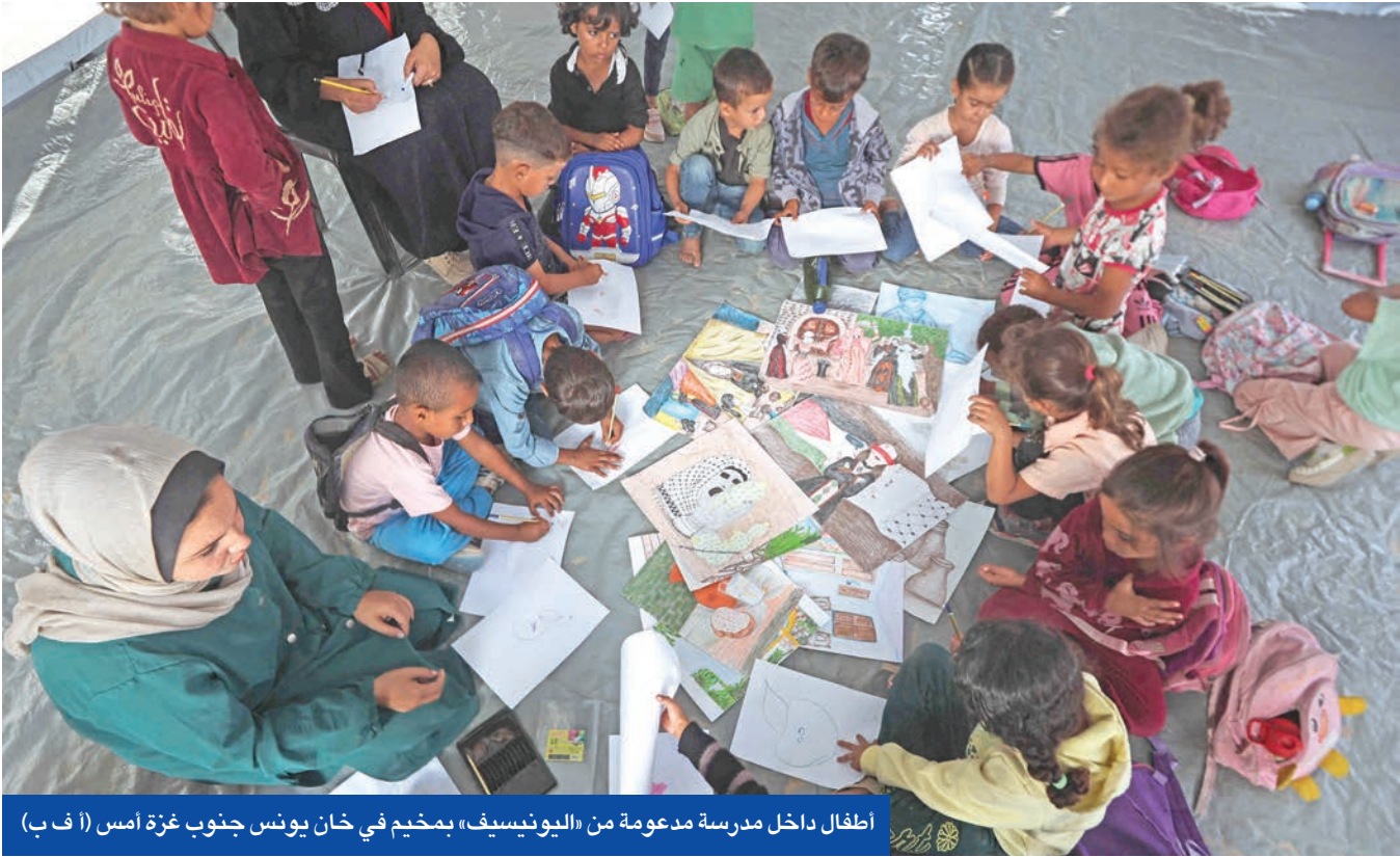
أطفال داخل مدرسة مدعومة من «اليونيسيف» بمخيم في خان يونس جنوب غزة أمس

«حماس» الوسطاء بجاهزيتها للاتفاق الشامل مع توفر ضمانات أميركية ودولية. في هذه الأثناء ورداً على سؤال عن سير المفاوضات، ولا سيما عما إذا كانت لديه شروط مسبقة تشمل موافقة «حماس» على نزع سلاحها، قال ترامب: «لدي خطوط حمراء: إذا لم تتحقق أمور معينة فلن نمضي قدماً. لكنني أعتقد أنّ الأمور تسير على ما يرام، وأعتقد أنّ حماس وافقت على أمور مهمة للغاية». وأضاف: «أعتقد أنّنا سنتوصل إلى اتفاق. من الصعب علي قول ذلك في حين أنهم منذ سنوات وسنوات يحاولون التوصل إلى اتفاق». وتابع: «أنا شبه متأكد من ذلك، نعم سنصل لاتفاق وسيحقق السلام بالشرق الأوسط». وأتى ذلك قبل ساعات من لقاء ترامب بالرهينة الإسرائيلي. الأميركي عياد الكسندر الذي أفرجت عنه «حماس» في مايو كبادرة حسن نوايا مع واشنطن.