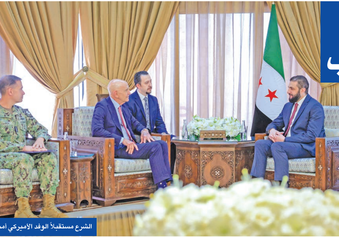
الشرع مستقبلاً الوفد الأميركي أمس

أكدت روسيا خلال الاجتماع السابع لـ «صيغة موسكو» حول أفغانستان، أن أي وجود عسكري لدول غير إقليمية على الأراضي الأفغانية من شأنه أن يفاقم التوترات في المنطقة، في تعليق يبدو موجهاً إلى الرئيس الأميركي دونالد ترامب الذي عبّر عن رغبته في «استعادة» قاعدة باغرام الجوية إحدى المنشآت العسكرية الأساسية خلال الوجود الأميركي في أفغانستان. وزير خارجية حركة طالبان التي تسيطر على أفغانستان أمير خان متقي موسكو وشارك للمرة للمرة الأولى في اجتماع «صيغة موسكو»، الذي حضره ممثلون عن روسيا وإيران والصين والهند وباكستان ودول آسيا الوسطى في حين حضرت السعودية وقطر والإمارات وتركيا وبيلاروسيا بصفة مراقبين.