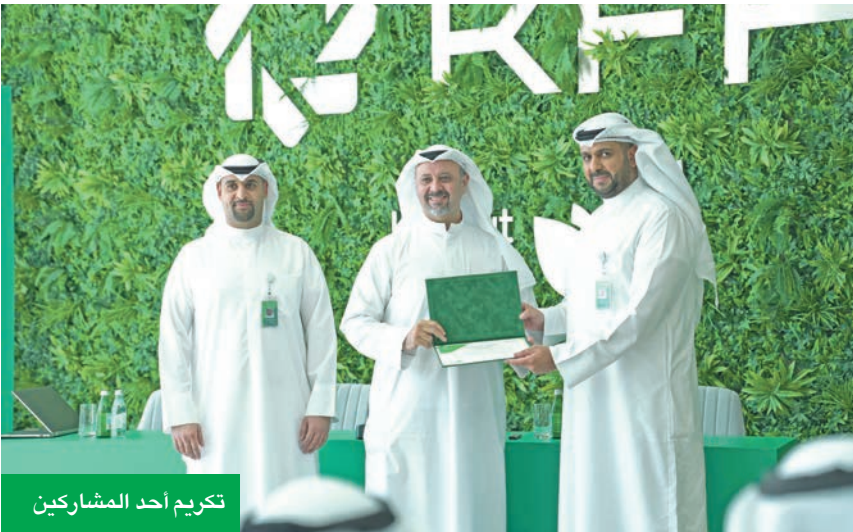
تكرم أحد المشاركين

التمويل الكويتي في الإعداد والتنظيم، كذلك بالمتنوى العلمي المتميز. مؤكداً أن ما تضمنه من معلومات واطلعوا عليه من تطبيقات حول الاستدامة وممارساتها، يؤهلهم لنقل المتنوى العلمي والعملية القيم إلى شركاتهم، وتطبيقه على الوجه الأمثل. يذكر أن البرنامج تناول مفهوم الاستدامة وأركان الـ ESG، مع توضيح المحاور