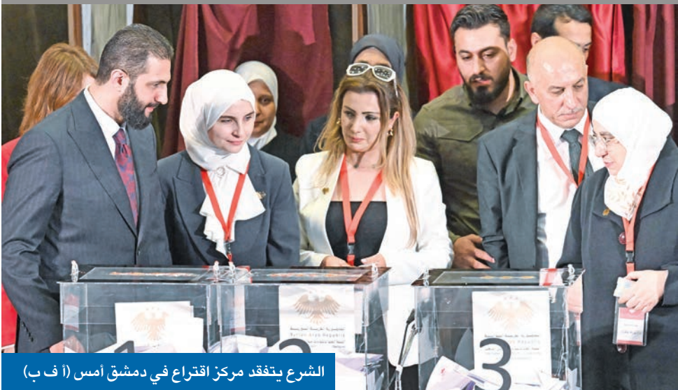
الشرع يتفقد مركز اقتراع في دمشق امس