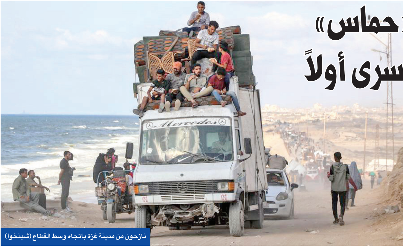
جاه وسط القطاع (شينخوا)

إطلاق سراح جميع الرهائن»، محذرا من العودة للقتال بدع كامل من جميع الدول المعنية بحال لم يتم الإفراج عن كل الرهائن بحلول مهلة ثرابم إسرائيل، وتعتبر وزير الدفاع إسراييل كاتس أن «شدة الضغط السياسي، وتدمير المباني متعددة الطوابق، وقوة مناوره الجيش في المدينة أدى إلى نزوح نحو 900 ألف من سكان غزة جنوبا، وضغط على «محاسن والدول الداعمة لها، وهو ما نرى إلى دفع مبادرة الجسم الأمريكية. ميدانيا، دمر جيش الاحتلال جامعة الأزهر في مدينة غزة بالكامل، فيما بدأت غارات الجرافات المصرية في دخول مناطق شمال النصارى لإنشاء أكبر مخيمات ومسكرات مؤقتة لإيواء النازحين.