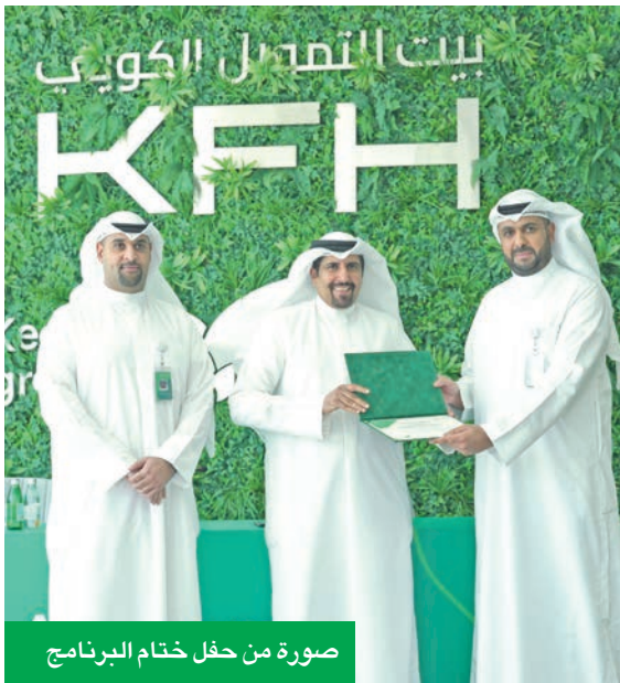
صورة من حفل ختام البرنامج