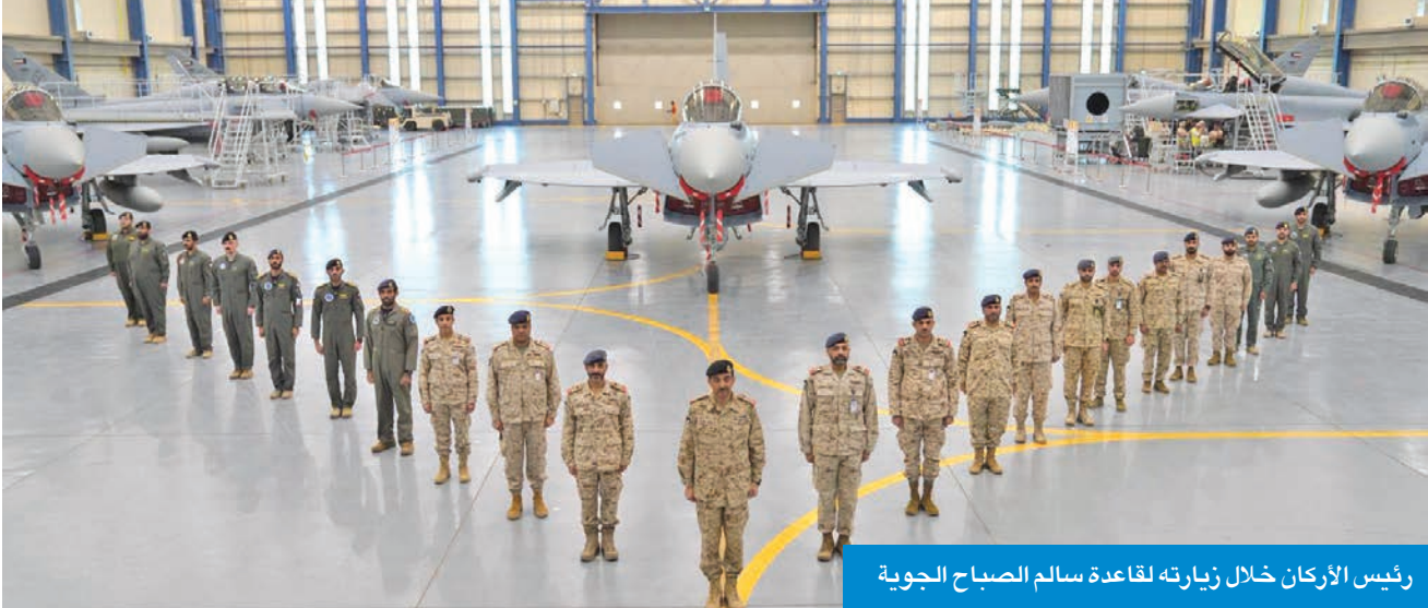
رئيس الأركان خلال زيارته لقاعدة سالم الصباح الجوية

أبرز المهام والواجبات المنوطة بالقاعدة، وما تضمه من إمكانيات وتجهيزات فنية حديثة تدعم مختلف المهام العملياتية للقوة الجوية. وقام رئيس الأركان بجولة ميدانية شملت طائرة «البيرقدار TB2»، واطلع على مستوى جاهزيتها وما تميزت به من قدرات متطورة تواكب متطلبات العمليات الجوية الحديثة. كما شملت الجولة حظائر طائرات اليوروفايتر، حيث استمع إلى شرح حول البية تشغيلها، وبرامج تدريب المعدة لطيارين والفنيين التي تساهم في رفع الكفاءة والجاهزية القتالية للقوة الجوية. من جانب آخر، تلقى رئيس الأركان دعوة من رئيس أركان القوات المسلحة بدولة الإمارات