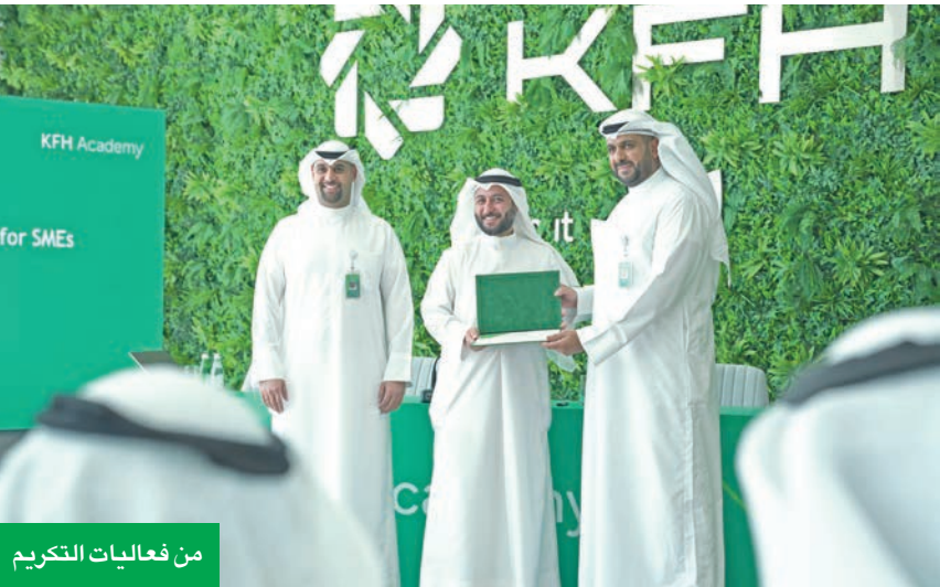
من فعاليات التكرم

وقال العرييد، في كلمته خلال الحفل الختامي للبرنامج، الذي استمر 3 أسابيع: إن «تصميم البرنامج يعتبر خطوة استراتيجية تعكس التزامنا تجاه عملائنا وشركائنا والواقع الاقتصادي بالكويت، وحرصنا فيه على عرض وتوضيح المحاور الأساسية والممارسات العملية المرتبطة بتطبيقات الاستدامة»، مغرباً عن الأمل أن يكون البرنامج قد حقق أهدافه، واستفاد المشاركون فيه مما تضمنه من معلومات وتدريب حول مفهوم