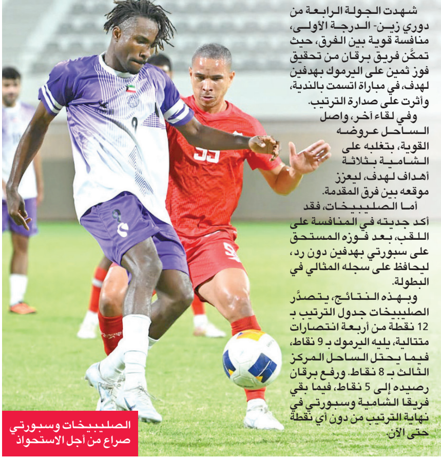
الصليبيخات وسيبورتى صراع من أجل الاستحواذ