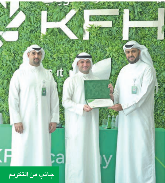
جانب من التكرم