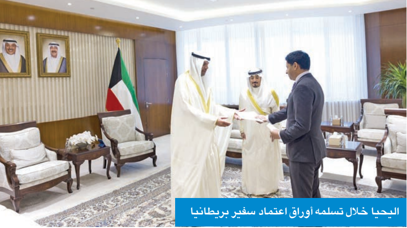
اليحيا خلال تسلمه أوراق اعتماد سفير بريطانيا

تسلّم وزير الخارجية عبدالله اليحيا، أمس، نسختين من أوراق اعتماد سفير المملكة المتحدة لبريطانيا العظمى وأيرلندا الشمالية لدى الكويت قدسي رشيد، وسفير جمهورية أوكرانيا لدى الكويت مكسيم صبح، خلال اللقاءين اللذين عقدا في ديوان عام وزارة الخارجية. وتمنى الوزير اليحيا للسفيرين الجديدين التوفيق في مهام عملهما، وللعلاقات الثنائية الوثيقة التي تجمع بلديهما مع الكويت المزید من التقدم والإزدهار.