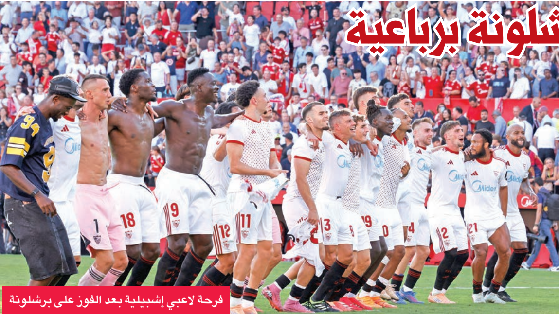
فرحة لاعبي إشبيلية بعد الفوز على برشلونة

شارك يانيس أنيتوكونمبو نجم ميلووكي باكس في تدريبات فريقه لأول مرة هذا الموسم، مساء أمس الأول، بعد غيابه عن بداية فترة الإعداد للموسم الجديد لتعافيه من الإصابة بغيروس كورونا (كوفيد 19) في بلده اليونان. وقال دوك ريفرن، مدرب باكس إن أنيتوكونمبو شارك في التدريبات بدون الاحتكاك بأحد، مضيفاً «لقد قال يانيس إنه يحتاج 3 أيام كاملة». ووصل أنيتوكونمبو إلى ميامي وعقد فريقه يوماً لوسائل الإعلام يوم الاثنين الماضي، شارك به عن بعد، ثم بدأ معسكره في ميلووكي يوم الثلاثاء، وسافر إلى ميامي يوم الخميس لأداء التدريبات في جامعة فلوريدا الدولية قبل خوض أول مباراة ودية استعداداً للموسم الجديد أمام هيت. وقال أنيتوكونمبو «لقد أثر المرض على حالتي الجسدية، ولا أشعر أنني بكامل لياقتي البدنية، أحاول استعادة لياقتي تدريجياً، وأنفذ بعض التدريبات البدنية، وسأكون أفضل مع مرور الوقت».