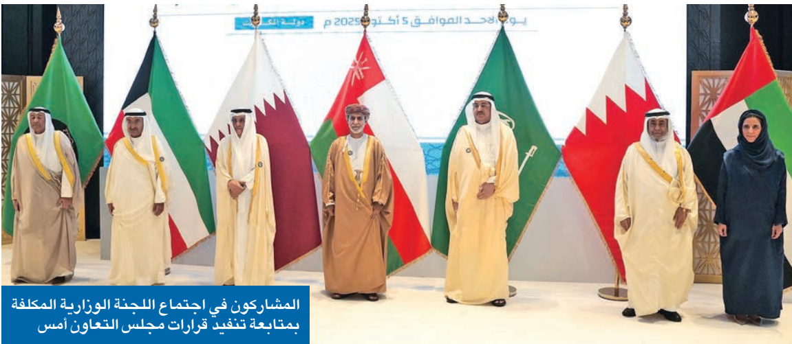
المشاركون في اجتماع اللجنة الوزارية المكلفة بمتابعة تنفيذ قرارات مجلس التعاون امس

الملا: تعزيز التنمية الشاملة ودعم مسيرة الاتحاد الجمركي والسوق المشتركة البيدوي: متابعة قرارات العمل المشترك وصولاً إلى أعلى مراحل التكامل وكيلة «المالية»: ترسيخ أواصر التعاون الاقتصادي لتحقيق الأهداف الاستراتيجية