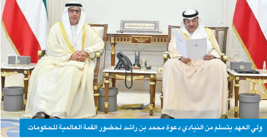
ولي العهد يتسلم من النابدي دعوة محمد بن راشد لحضور القمة العالمية للحكومات

وقام بتسليم الدعوة لسموه سفير دولة الإمارات العربية المتحدة لدى الكويت د. مطر النابادي. حضر اللقاء رئيس ديوان سمو ولي العهد الشيخ ثامر الجابر وكبار المسؤولين.