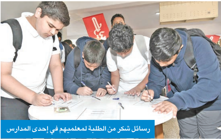
رسائل شكر من الطلبة لمعلميهم في إحدى المدارس