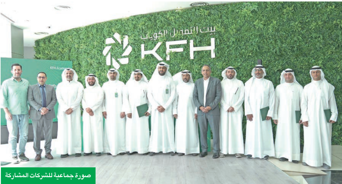
صورة جماعية للشركات المشاركة