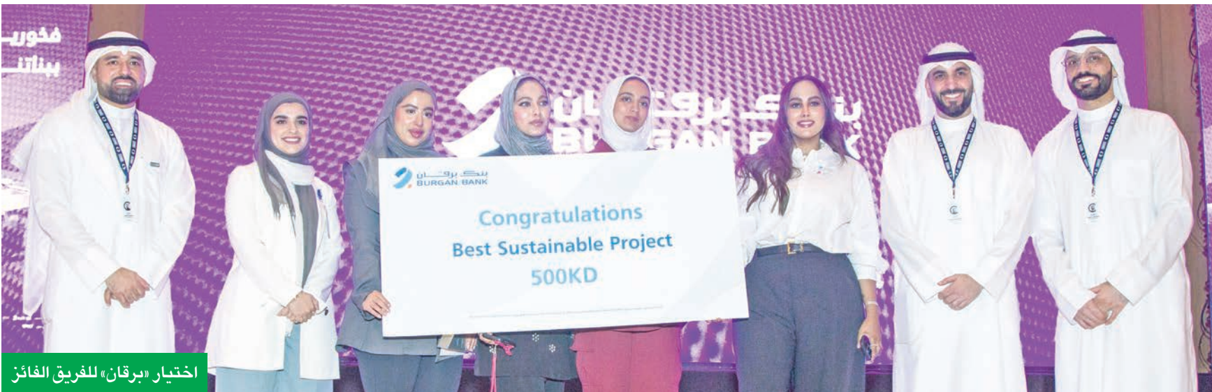
اختيار «برقان» للفريق الفائز