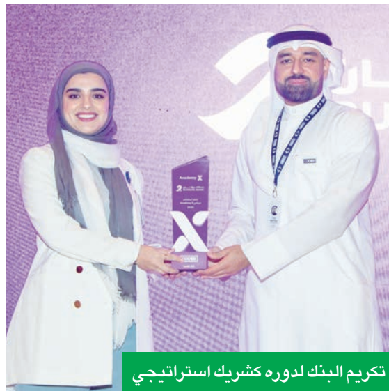
تكريم البنك لدوره كشريك استراتيجي