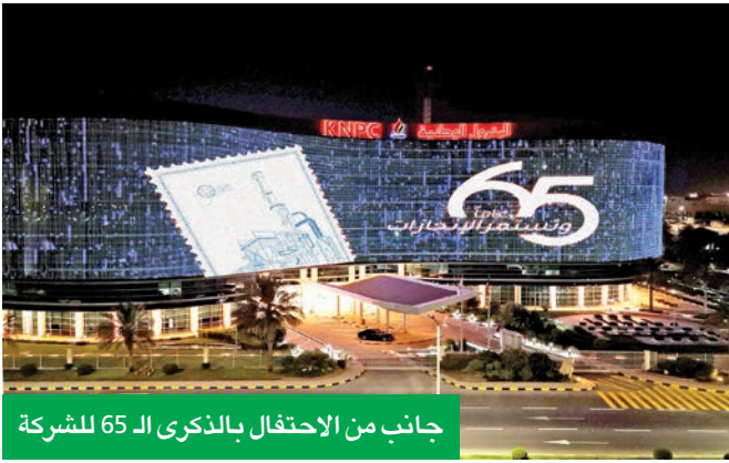
جانب من الاحتفال بالذكرى الـ 65 للشركة

وبيّنت أن الحديث عن ذكرى التأسيس يقود إلى ما تشهده الشركة حالياً من توسع كبير في مهامها وعملياتها، خصوصاً بعد تشغيل مشروع الوقود البيئي في سبتمبر 2021، وتشغيل مصفاة البزور في ديسمبر 2023، والفُضي قُدماً في إجراءات ضم الشركة الكويتية للصناعات البتروولية المتكاملة، التي بدأت في أبريل 2025 في إطار مشروع إعادة الهيكلة الشاملة التي تنفذها وترعاها مؤسسة البترول الوطنية، إضافة إلى نقل تبعية مصنع إنتاج أسطوانات الغاز المسال للشركة في أغسطس 2025. وذكرت الخطيب أن من أهم الأدوار التي قامت بها الشركة، أنها كانت ولا تزال مدرسة مهنية صقلت تجارب برامج تدريب وتطوير داخلية وخارجية وفق أرفع المستويات والمعايير العالمية، كما ساهمت في تقديم الكثير من القابات والكوادر المحترفة، التي استعانت بخبراتها شركات خارجية، نظراً لكفاءتها وتميزها.