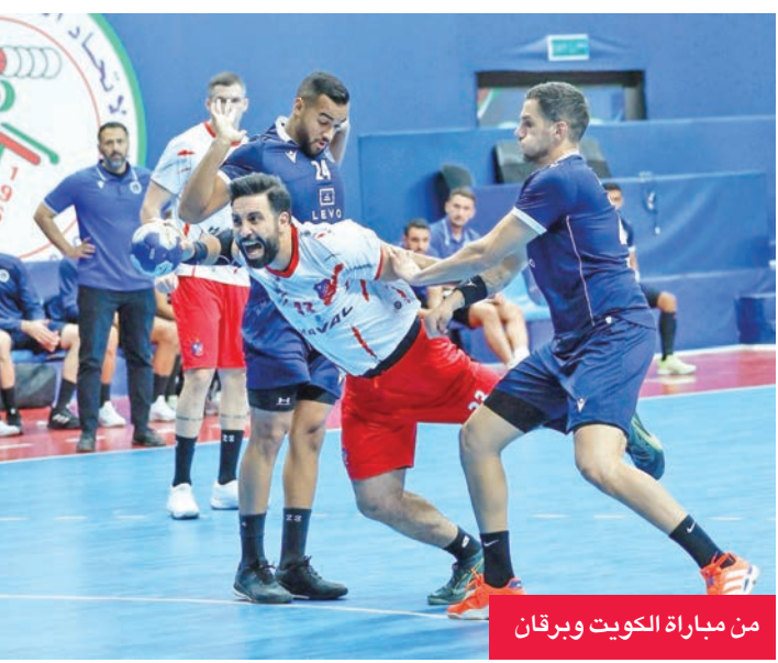
من مباراة الكويت وبرقان

الكويت حسم المواجهة لمصلحته بفارق مريح. وفي مباراة أخرى ضمن الجولة ذاتها، نجح كازمة في استعادة توازنه، بعد سلسلة من النتائج المتذبذبة، وتمكّن من التغلب على النصر بنتيجة 27-23، ليصعد إلى المركز الثاني في جدول الترتيب بـ 9 نقاط. وبنهاية الجولة السابعة، تصدر الكويت الترتيب العام بـ 14 نقطة، يليه كازمة في المركز الثاني بـ 9 نقاط، ثم بركان ثالثاً بـ 8 نقاط. ويحتل القادسية والعربي والسالمية المركزين الرابع إلى السادس برصيد متساو (6 نقاط)، فيما جاء الصليبيخات في المركز السابع بـ 5 نقاط، وظل النصر في المركز الثامن والآخر بنقطتين فقط.