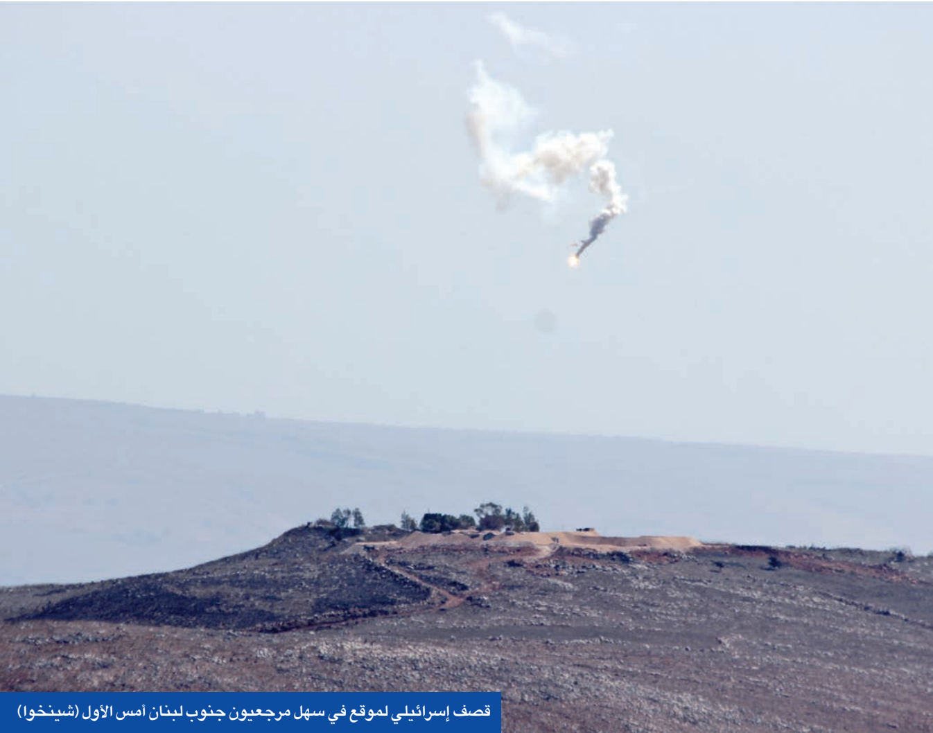
قصف إسرائيلي لموقع في سهل مرجعيون جنوب لبنان أمس الأول

الأميركية مورغان أورتاغوس التي ستلتقي خلال زيارتها بالمسؤولين اللبنانيين، لمناقشتهم بما تحقق حتى الآن وبما يجب تحقيقه للمستقبل، بعد أن أقرت الإدارة الأميركية مساعدات للقوى الأمنية اللبنانية تصل الى 230 مليون دولار، وحديث عن احتمال أن تلجأ إسرائيل إلى التصعيد في حال توقف حرب غزة.