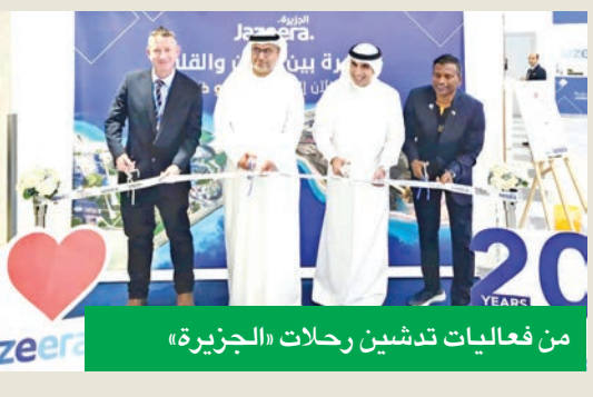
من فعاليات تدشين رحلات «الجزيرة»

احتفلت طيران الجزيرة باستئناف رحلاتها المباشرة إلى كل من أبوظبي والعين، في فعاليات أقيمت بمبنى ركاب الجزيرة T5 في مطار الكويت الدولي، وكذالك في مطار أبوظبي عند وصول أول رحلة للشركة، حيث بدأت بتسيير رحلتين أسبوعياً من مطار الكويت الدولي إلى مطار زايد الدولي في أبوظبي، ورحلتين أسبوعياً إلى مطار العين الدولي. حضر التدشين سفير الإمارات لدى الكويت د. مطر النبادي، ونائب رئيس مجلس إدارة طيران الجزيرة محمد الموسى، والرئيس التنفيذي بارثان باسوباتي، ورئيس القطاع التجاري بول كارول. ومع هذه الخطوط الجديدة، تُسهم طيران الجزيرة في تعزيز الربط الجوي وحرّة السفر والتبادلات التجارية بين البلدين الشقيقين، حيث أصبحت اليوم تخدم ثلاث وجهات في الإمارات، وتوفر للمسافرين مزيداً من الخيارات المرنّة، وبأسعار تنافسية. وبمناسبة تدشين أول رحلة إلى أبوظبي، قام الضيوف أيضاً بزيارة قاعة «حياكم» الخاصة بطيران الجزيرة، والتي سيتم افتتاحها قريباً لخدمة المسافرين عبر مبنى T5.