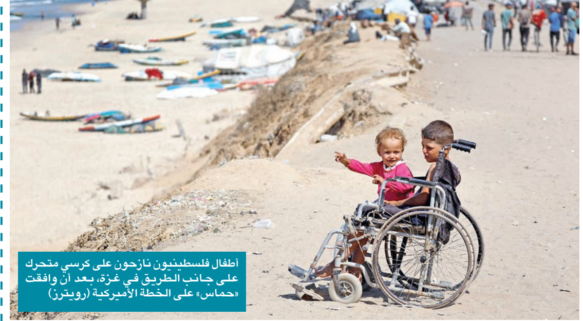
أطفال فلسطينيون نازحون على كرسي متحرك على جانب الطريق في غزة، بعد أن وافقت «حماس» على الخطة الأميركية