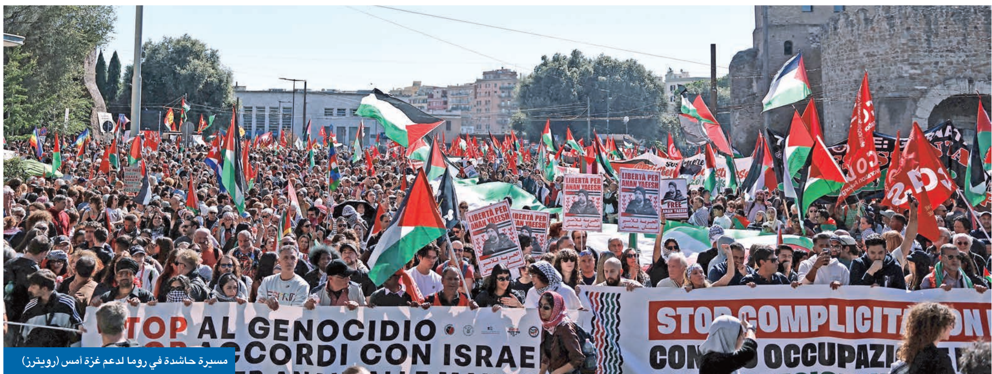
مسيرة حاشدة في روما لدعم غزة أمس (رويترز)

• ننتيا هو فوجئ بإيجابية واشنطن... وجيشه ينتقل إلى وضع دفاعي • مصر تستضيف مفاوضات مكثفة لتنفيذ «المرحلة الأولى»