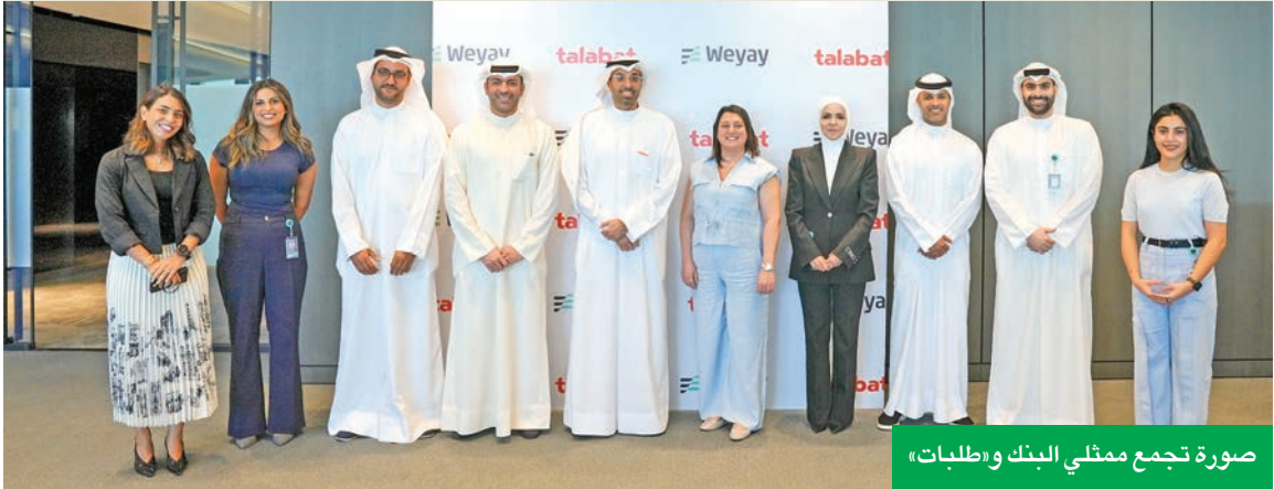
صورة تجمع ممثلي البنك و«طلبات»

لمنح عملاء SELECT استرداداً نقدياً بنسبة 30%