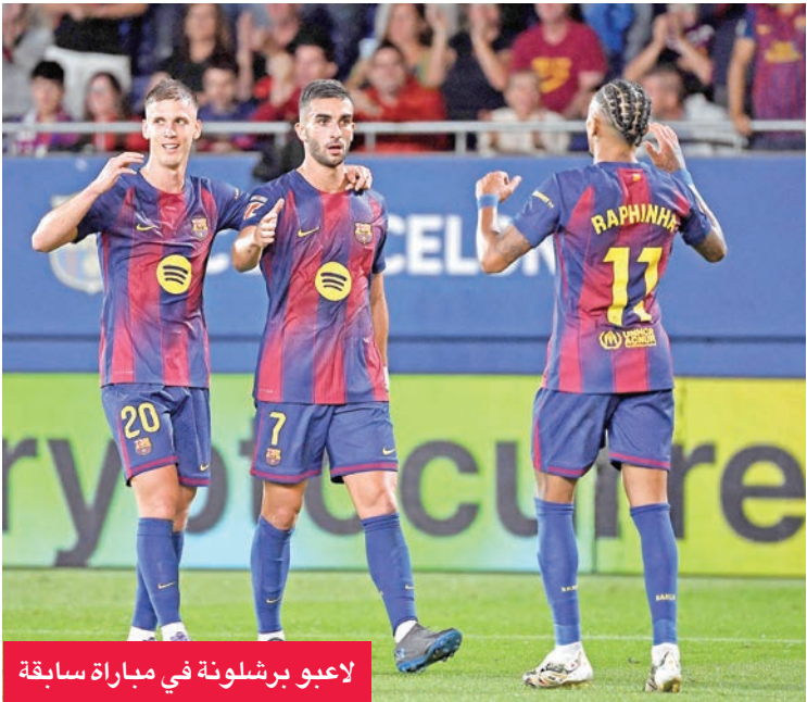
لاعبو برشلونة في مباراة سابقة