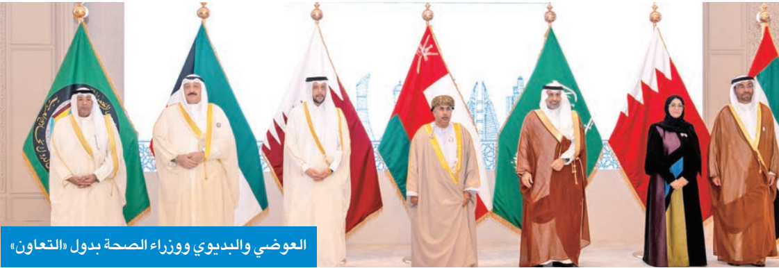
العوضي والبيدوي ووزراء الصحة بدول «التعاون»