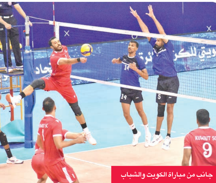
جانب من مباراة الكويت والشباب

أثناء تمثيله لنادي برقان في نهاية الموسم الماضي، إلا أنه لم ينفذ سوى مباراة واحدة من العقوبة، وكان من المفترض أن يغيب عن أول مباراة في الموسم الحالي مع ناديه الجديد العربي لاستكمال فترة الإيقاف.