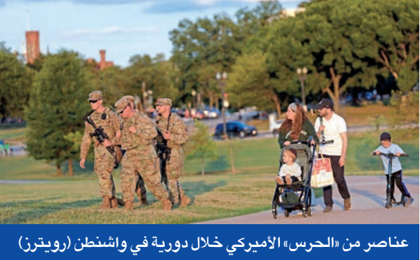
عناصر من «الحرس» الأميركي خلال دورية في واشنطن

ووفقاً لنص المذكرة، فإن «الرئيس وجّه باتخاذ هذه الإجراءات بما يتماشى مع مسؤوليته في حماية الأميركيين ومصالحهم في الخارج، وتعزيزاً للأمن القومي ومصالح سياسته الخارجية، عملاً بسلطته الدستورية ونسائنا الشجعان من البحرية والعلاقات الخارجية».