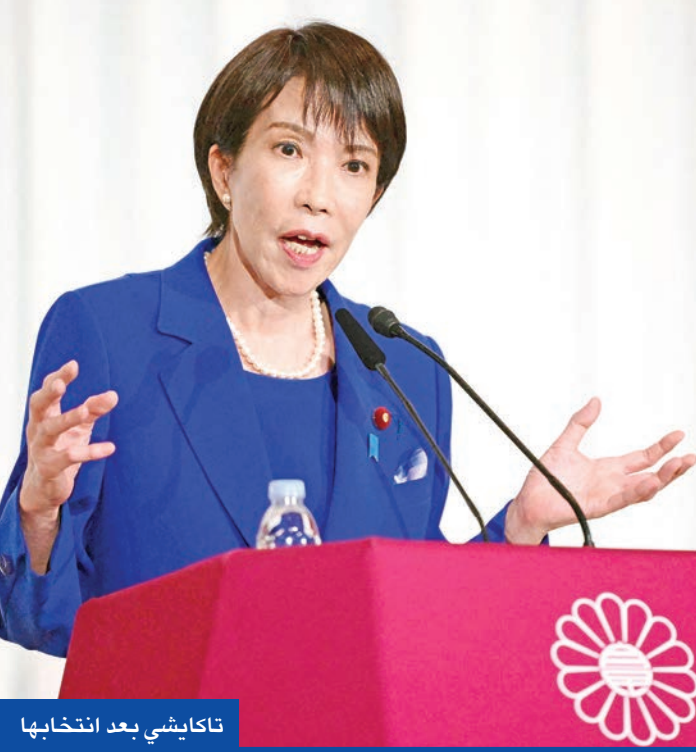
تاكاشي بعد انتخابها

قومية متشددة ضد الصين والأجانب... وتعتبر مارغريت تاتشر قدوة