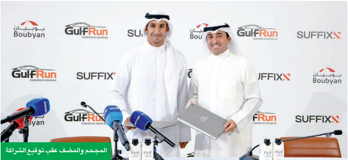
المجّم والمضف عقب توقيع الشراكة

إطلاق العلامة المشتركة الجديدة «GulfRun powered by Boubyan»