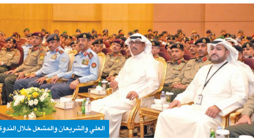
العلي والشريعان والمشعل خلال الندوة

وأشار وزير الدفاع بما تضمنته المحاضرة والحلقة النقاشية من رؤى وأفكار بناءً حول بيئة العمليات المستقبلية، والتي المحاضرة كبير الباحثين في المعهد الملكي البريطاني للخدمات المتحدة (RUSI)، د. جاك واتلينغ وأدار العقيد الركن صباح محمد الصباح الحلقة النقاشية، التي تناولت العديد من الموضوعات