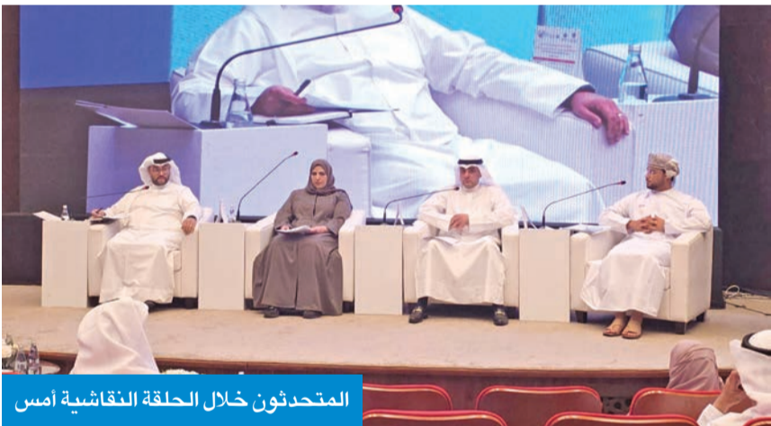
المتحدثون خلال الحلقة النقاشية أمس

وأوصت الحلقة النقاشية، في ختام أعمالها، إلى تعزيز الشراكة مع المركز الإحصائي الخليجي لمتابعة المؤشر الخليجي لجودة حياة كبار السن بشكل سنوي ومراجعة التقدم المُحرز في هذا الشأن، كما دعت إلى إطلاق مبادرات خليجية مشتركة لتعزيز مشاركة كبار السن في الأنشطة الاجتماعية والثقافية والتطوعية، ورفعت التوصيات لعرضها على لجنة الخبراء في الشؤون الاجتماعية بدول المجلس، تمهيداً لرفعها إلى الوزراء المعنيين.