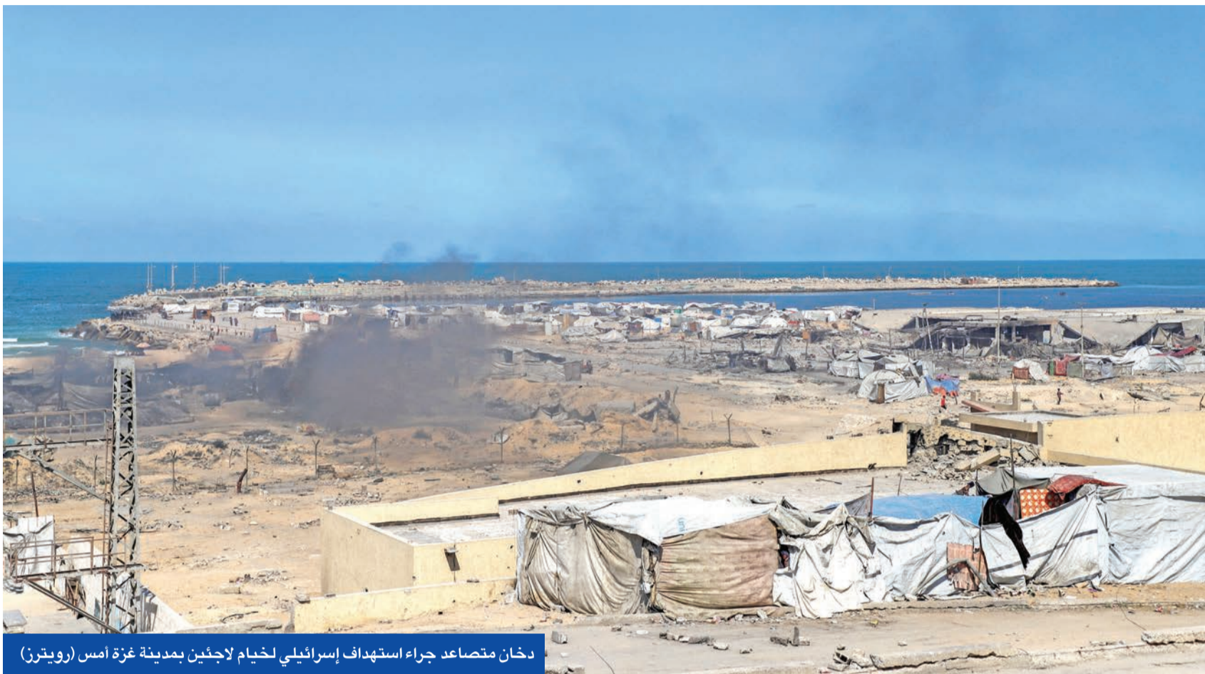
دخان متصاعد جراء استهداف إسرائيلي لخيام لاجئين بمدينة غزة أمس

رجّح مصدر مقرب من «حماس» أن تقبل الحركة خطة الرئيس الأميركي دونالد ترامب بشرط تعديل بعض بنودها الـ 20، فيما كشفت وكالة الأنباء الفلسطينية «معا» أن الحركة أكدت صعوبة عملية إطلاق سراح جميع المحتجزين الأحياء وتسليم جثث القتلى إلى الجانب الإسرائيلي خلال 72 ساعة، كما هو منصوص عليه في مبادرة البيت الأبيض. وبحسب ما أوردته «معا» أمس، أوضحت «حماس» للوسطاء خلال مشاورات الدوحة أن الحركة «تطلب المزيد من الوقت لمراجعة الشروط الواردة في خطة ترامب».