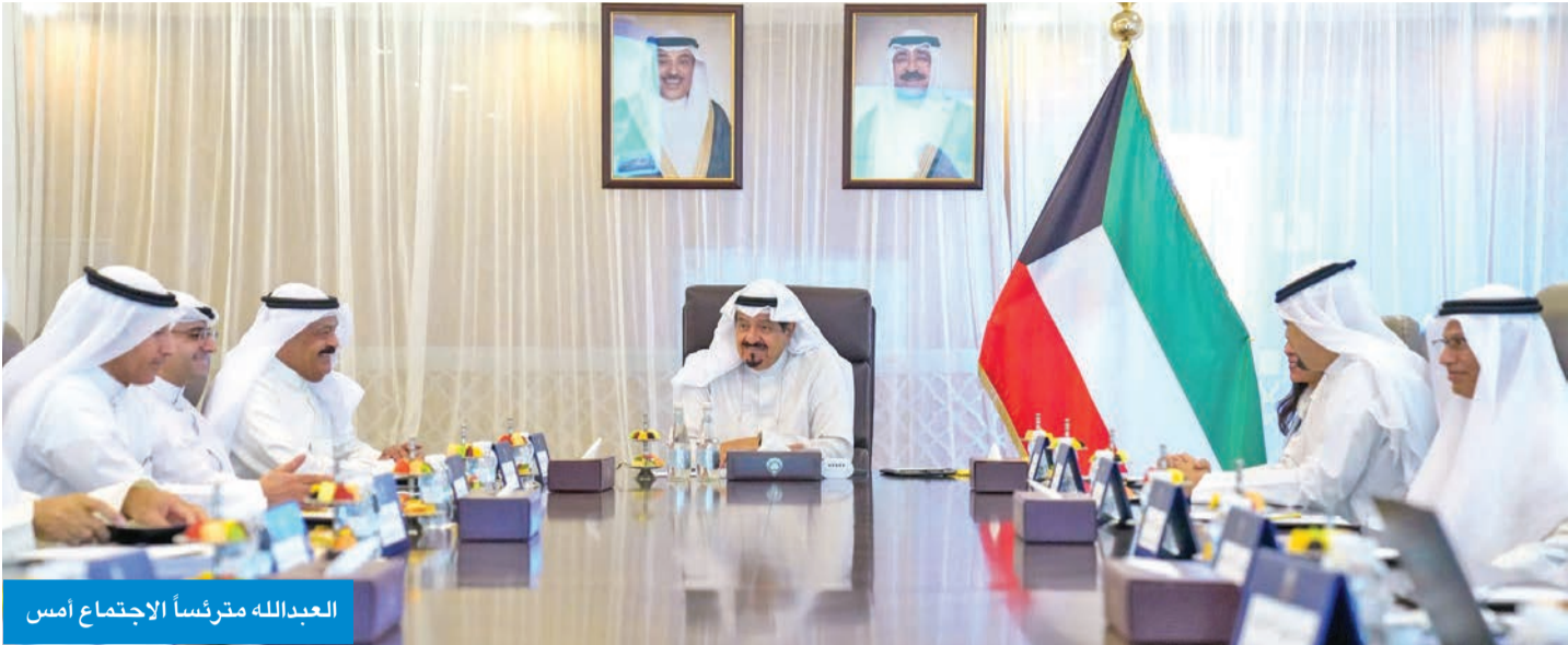
العبدالله مترئساً الاجتماع أمس

سموه ترأس الاجتماع الـ29 للجنة متابعة الاتفاقيات مع الصين