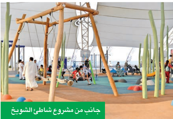
جانب من مشروع شاطئ الشويخ