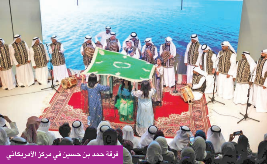
فرقة حمد بن حسين في مركز الأمريكي

شغفه بالفنون الشعبية، مشبهاً إلى أنه حبه للتراث والأغاني التراثية كان الدافع الأكبر وراء استمراره في العطاء والمشاركة، إيماناً منه بأهمية الحفاظ على هذا الموروث.