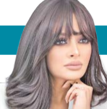
أميرة الحسن *

الحلم ليس أمورا مستحيلة، ليست محسومة بدمع منعين، ليست بالضرورة عقلاقة، خارجة عن المألوف! الأحلام تأتي بأشكال متعددة، متجددة. لك الحق أن تحلم، وعليك أن تعمل لتحقيق، وكما قال محمود درويش: «قف على ناصية الحلم... وقاتل».