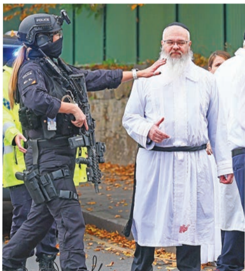
عناصر أمنية بمحيط موقع الهجوم في مانشستر بلندن أمس

وسارع رئيس الوزراء كير ستارمر إلى إدانة الاعتداء باعتباره مروعا، معربا عن صدمته الكبيرة من الهجوم. وقال إن «وقوع الحادث في يوم الغفران، أقدس الأيام اليهودية، يجعله أكثر فظاعة».