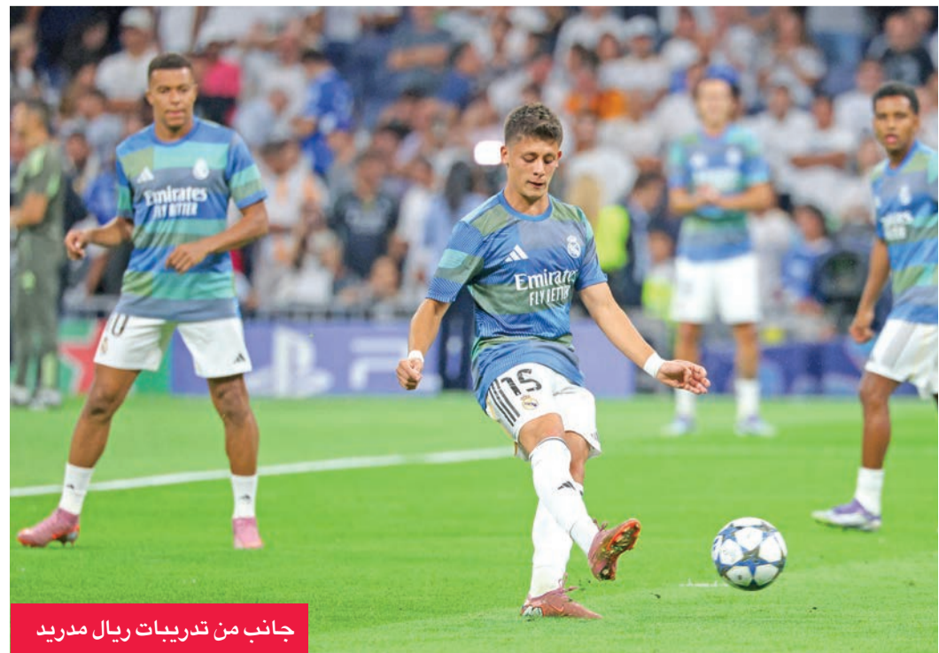
جانب من تدريبات ريال مدريد

ورغم الخسارة الكبيرة التي تعرض لها ريال مدريد أمام أثلتيكو فإن الفريق استعاد القليل من الثقة بعدما فاز على كايرات ألماني الكازاخي 5 - صفر يوم الثلاثاء الماضي في دوري أبطال أوروبا.