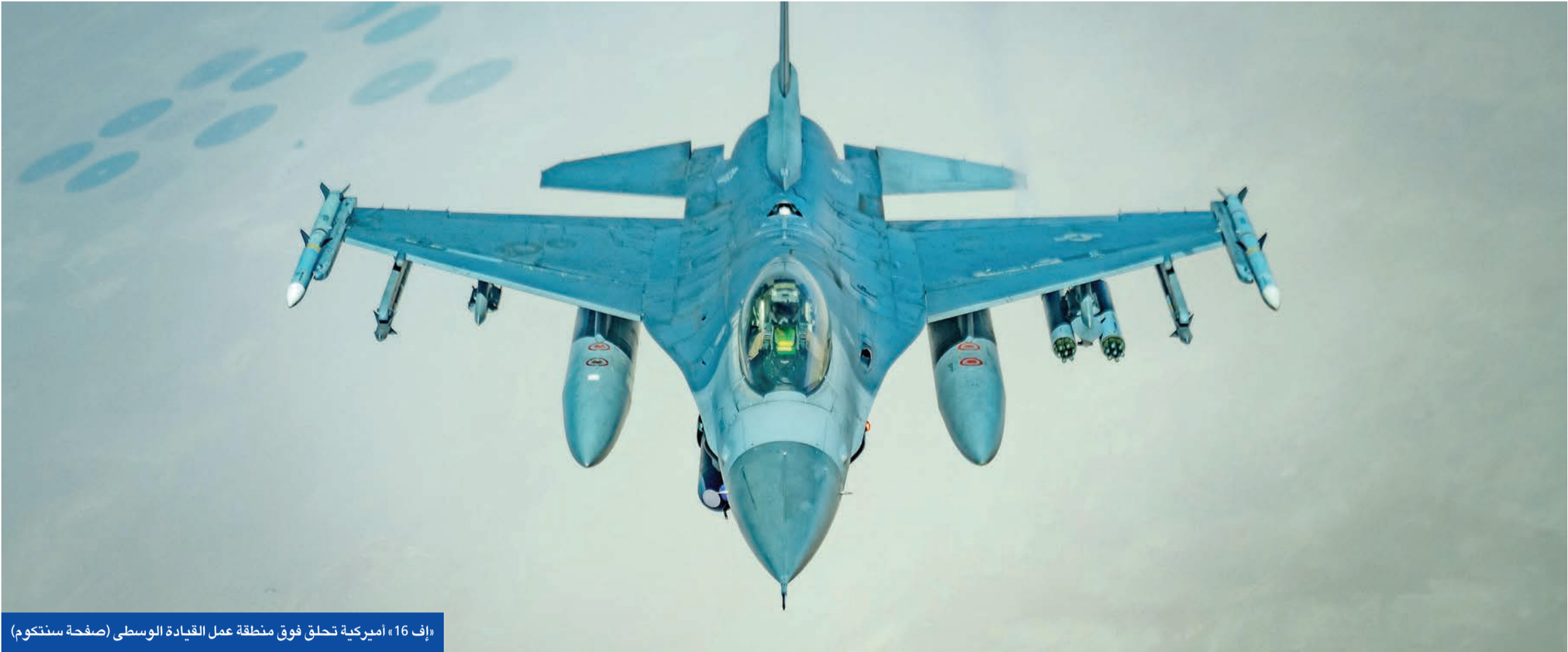
«إف 16» أميركية تحلق فوق منطقة عمل القيادة الوسطى