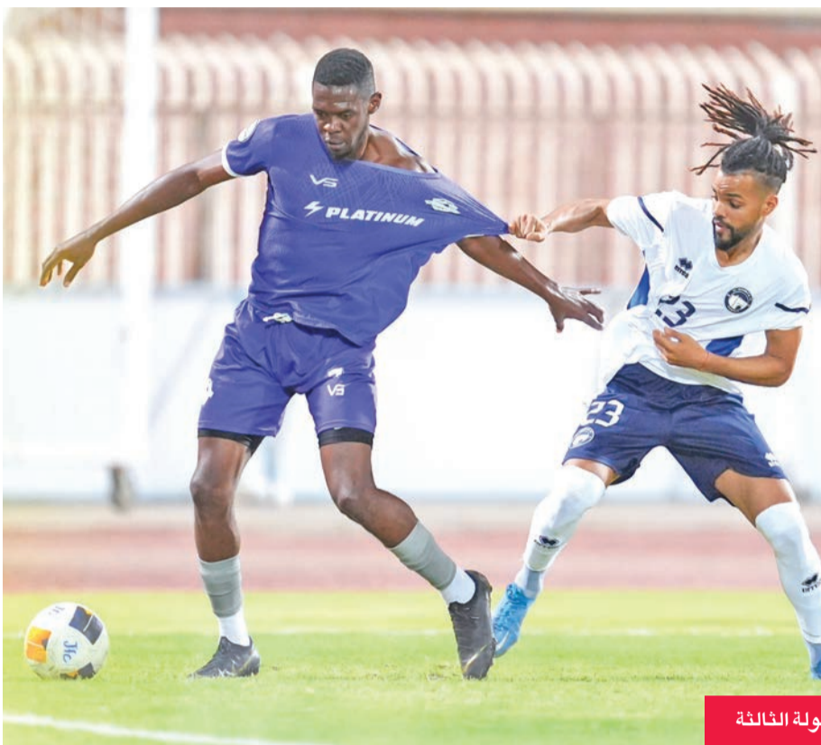
من منافسات الجولة الثالثة