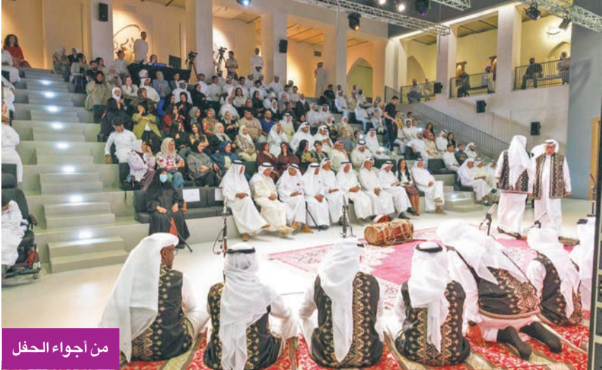
من أجواء الحفل

دشنت أولى الأمسيات الموسيقية في موسم دار الآثار