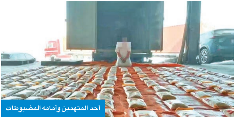
أحد المتهمين وأمامه المضبوطات

هذا الإنجاز يأتي في إطار التعاون الوثيق وتكامل الجهود بين الأجهزة الأمنية في الدولة للتصدي لمحاولات التهريب بكل أشكالها، حمايةً لأمن البلاد والمجتمع، وردعاً لكل من تسوّل له نفسه اللعب بأمن الوطن واستقراره.