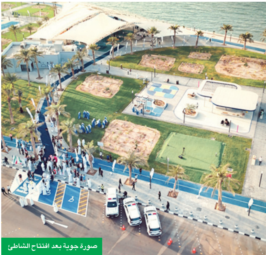
صورة جوية بعد افتتاح الشاطئ

من جانبه، قال محافظ العاصمة الشيخ عبدالله سالم العلي: «يسعدني أن أرحب بالجميع لاحتفال معا بافتتاح مشروع تطوير شاطئ الشويخ، هذا المشروع الحيوي الذي باتني ترجمة للرؤية الطموحة في تحقيق التنمية المستدامة وخطة بارزة نحو تعزيز الوجهة الحضارية للعاصمة، كما أنه يجسد سعيانا الدؤوب نحو تطوير الوجهات البحرية