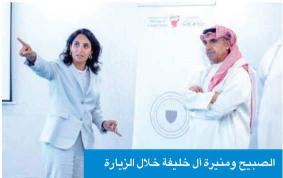
الصبيح ومنيرة ال خليفة خلال الزيارة

بحث مساعد وزير الخارجية لشؤون معاهد سعود الناصر الدبلوماسي، السفير ناصر الصبيح، مع المديرة العامة لأكاديمية محمد بن مبارك آل خليفة للدراسات الدبلوماسية البحرينية، الشبيبة منيرة آل خليفة، مجالات التعاون المشترك بين البلدين. جاء ذلك خلال استقبال آل خليفة للصبيح والوفد المرافق له بمناسبة زيارته للبحرين، حيث أعرب الأخير عن اعتزازه بعمق العلاقات الأخوية الكويتية - البحرينية، مشيداً بما لمسه من مستوى متقدم في عمل الأكاديمية وبرامجها وأهدافها ودورها في تطوير القدرات والمهارات لدى منتسبي وزارة الخارجية. من جانبها، رحبت آل خليفة بالوفد الكويتي، مؤكدة عمق العلاقات الأخوية الراسخة التي تجمع بين البلدين والشعبين الشقيقين، وما تشهده من تعاون متواصل في مختلف المجالات، وأشارت إلى أهمية هذه الزيارات التي تعكس حرص المشترك على تعزيز العلاقات الثنائية وتبادل الخبرات، لاسيما في مجالات التدريب الدبلوماسي، والتحول الرقمي للإجراءات والمعاملات الإدارية.