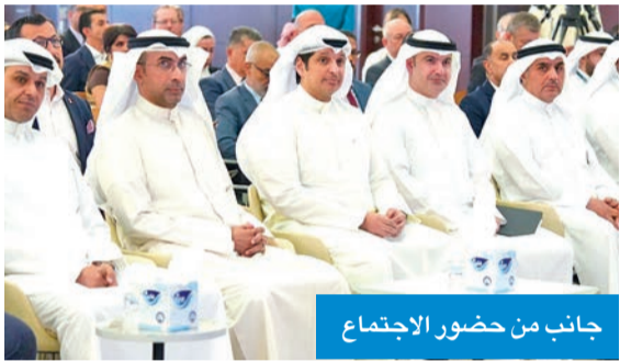
جانب من حضور الاجتماع

استعرض مع الفنادق ومكاتب السفر مقترحات تعزيز القطاع