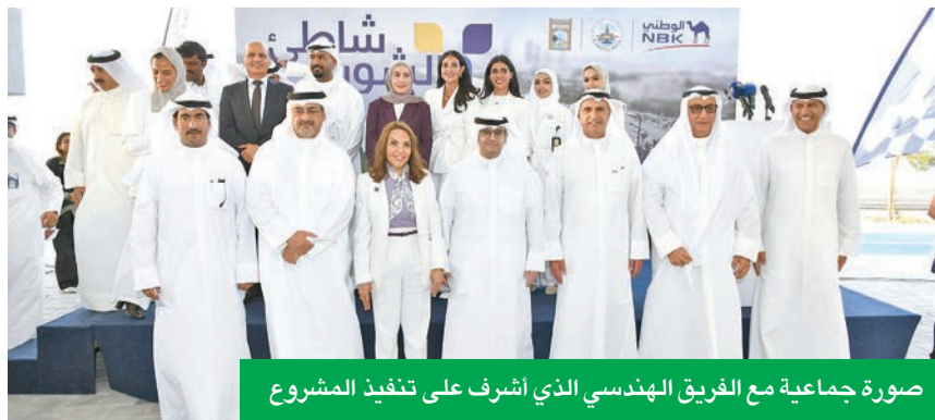
صورة جماعية مع الفريق الهندسي الذي أشرف على تنفيذ المشروع