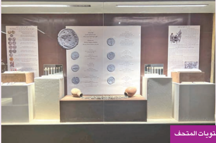
جانب من محتويات المتحف