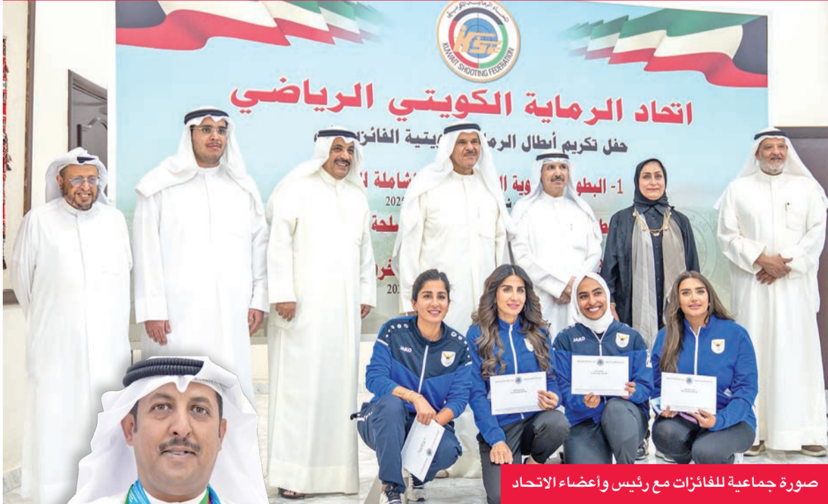
صورة جماعية للفائزات مع رئيس وأعضاء الاتحاد