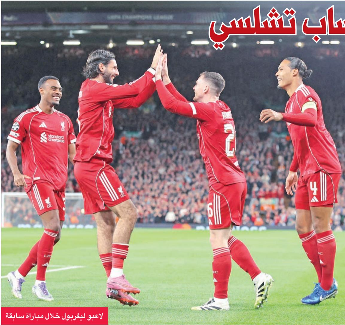
لاعبو ليفربول خلال مباراة سابقة

ضيفة فولهام، في حين يلعب ليفز يونايتد مع توتنهام هوتسبير السبت. (د ب أ)