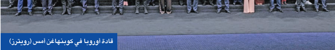
قادة أوروبا في كوبنهاغن أمس

لمصادرة أصولها المجرّدة بالخارج. واقتحرت فون دير لاين والمستشار الألماني فريدريش ميرتس استخدام الأموال الروسية المجمدة، البالغة 200 مليار يورو، لتقديم قروض إضافية إلى أوكرانيا تصل إلى 140 ملياراً. وانتقد رئيس وزراء بلجيكا بارت دي ويفر خطط استخدام الأصول الروسية المجرّدة لديه لتمويل فرض تعويضات لأوكرانيا، وطالب قادة الاتحاد الأوروبي بتقديم ضمانات مكتوبة تؤكد استعدادهم لتحمل المخاطر المرتبطة بالخطّة المقترحة.