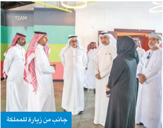
جانب من زيارة للمملكة