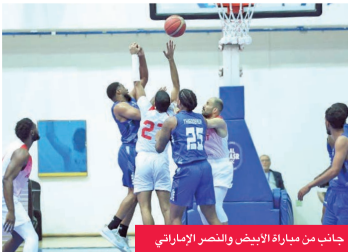
جانب من مباراة الأبيض والنصر الإماراتي

تأهل الفريق الأول لكرة السلة بنادي الكويت للدور ربع النهائي من النسخة السابعة والثلاثين للبطولة العربية للأندية، المقامة حالياً في إمارة دبي، عقب فوزه المستحق على نظيره النصر الإماراتي بنتيجة 88 - 83، في اللقاء الذي جمعهما مساء الأربعاء ضمن منافسات دور الـ16.