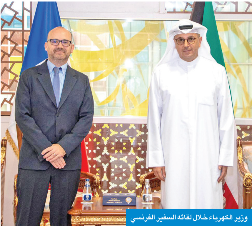
وزير الكهرباء خلال لقائه السفير الفرنسي

العذبة والصليبية والمياه المعالجة وربط المياه. وأوضح أن الزيادة المتحققة جاءت نتيجة تطوير آليات التحصيل التي ينفذها قطاع خدمات العملاء، حيث تم تعزيز الخدمات الإلكترونية عبر موقع الوزارة، وتمكين العملاء من دفع المديونيات إلكترونياً، إلى جانب الربط مع وزارة الداخلية الذي ألزم الوافدين بتسديد التزاماتهم قبل مغادرة البلاد، فضلاً عن التنسيق مع التطبيق الحكومي «سهل». وأكدت مساهمة العدادات الذكية التي جرى تركيبها على نطاق واسع في مختلف القطاعات السكنية في ضبط الاستهلاك وتسريع عمليات التحصيل، ما انعكس إيجاباً على إيرادات الوزارة. وأشارت المصادر إلى أن الوزارة تولي اهتماماً كبيراً بملف تحصيل المديونيات، من خلال تحديث وتطوير أنظمة الدفع وتبني أحدث التقنيات لضمان سداد المستحقات أولاً بأول، مبينة أن زيادة الإيرادات من خدمات الكهرباء والمياه تمثل دعماً لجهود الدولة في تنمية الإيرادات غير النفطية.