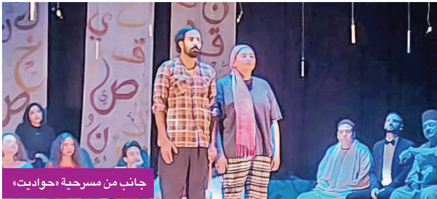
جانب من مسرحية «حواديت»