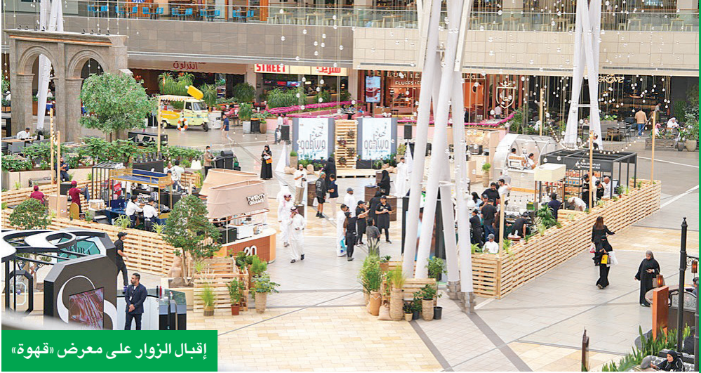
إقبال الزوار على معرض «قهوة»

المعلّقة والنباتات التي تخلق أجواء مبهجة تعكس روح القهوة، ليستمتع الزوار بأجواء احتفالية تفوح برائحة القهوة، وسماع الموسيقى الحية والأغاني الدافئة، وهو ما ساهم في جذب أعداد كبيرة من عشاق القهوة الذين أشادوا بتجربة المعرض وتنوّع الكافيهات والمحال المشاركة. وأكدت إدارة الأفنيوز أن معرض «قهوة» لا يقتصر فقط على الاحتفاء باليوم العالمي للقهوة، بل يمتد أيضاً إلى دعم الكافيهات المحلية المتخصصة في القهوة الموجودة في الأفنيوز، مشيرة إلى حرصها الدائم على تنظيم فعاليات وأنشطة متنوعة على مدار العام بما يعزز من تجربة الزوار.