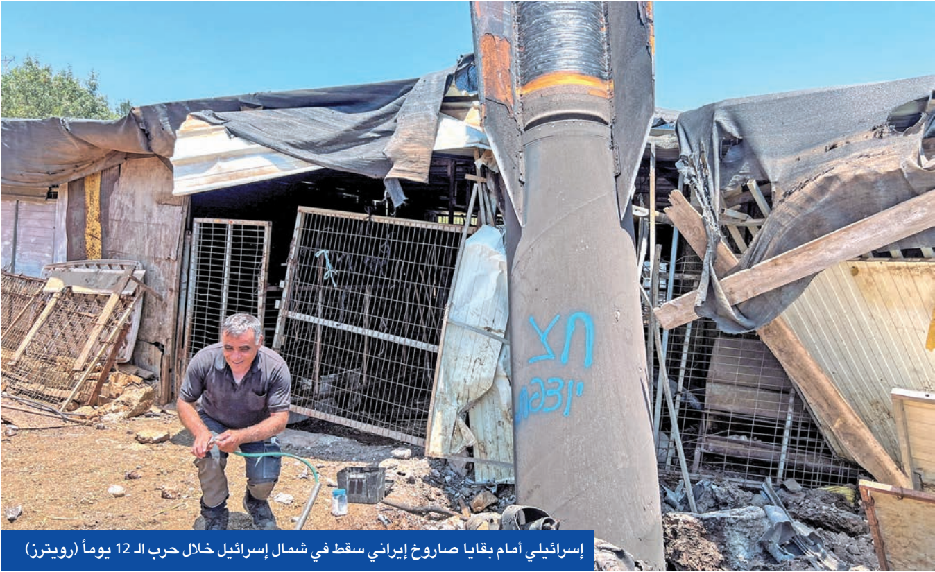
إسرائيلي أمام بقايا صاروخ إيراني سقط في شمال إسرائيل خلال حرب الـ 12 يوماً

ويصل مدى الصواريخ الإيرانية إلى ألفي كيلومتر، وهو المدى الذي حددته إيران لنفسها. وقال مسؤولون في الماضي إن هذا المدى كافٍ لحماية البلاد لأنه يمكن أن يغطي المسافة إلى إسرائيل. وقال نائب مسؤول التفتيش بمقر خاتم الأنبياء العسكري المركزي محمد جعفر أسدي لوكالة أنباء فارس صوابنا متصل إلى المدى الذي تحتاج إليه». وأضاف أن قوة ومدى مسيرة المجال الجوي البولندي الحرب التي بدأتها إسرائيل في يونيو تستمر 12 يوما فقط. وردت طهران بإطلاق مئات الصواريخ على إسرائيل.