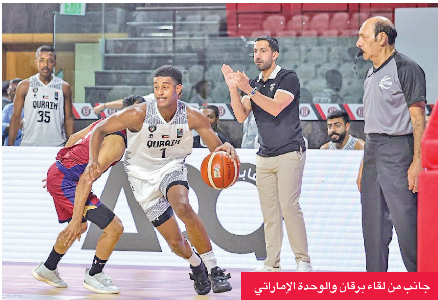
جانب من لقاء برقان والوحدة الإماراتي

الكويتية، وسط ترقب لمباريات الجولة الأخيرة، قد تحسم التأهل إلى نصف النهائي.