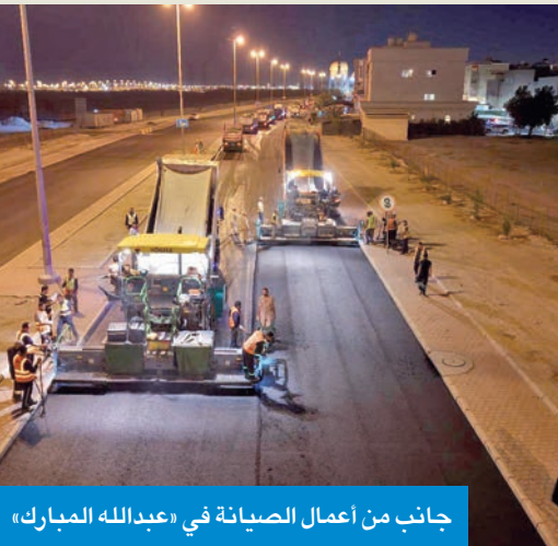
جانب من أعمال الصيانة في «عبدالله المبارك»