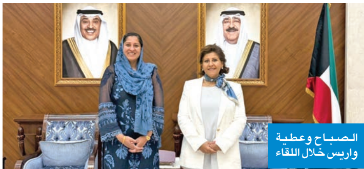
الصباح وعطية وريس خلال اللقاء

وأضافت أن تلك الإنجازات انطلقت من توجيهات سمو أمير البلاد الشيخ مشعل الأحمد وسمو ولي العهد الشيخ صباح الخالد، مؤكدة التزام دولة الكويت بمبادئ العدالة الاجتماعية وإرساء أسس التنمية المستدامة.