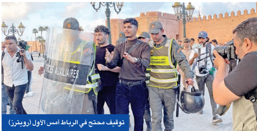
توقيف محتج في الرباط أمس الأول (رويترز)

وقالت إنها «تؤكد وعيها بمختلف التراكمات والإشكالات التي تعرفها المنظومة الصحية منذ عقود، كما تؤكد أن طموح الإصلاح الصادر عن هذه التعبيرات الشبابية يلتقي مع الأولويات التي تشغل عليها الحكومة».