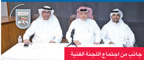
جانب من اجتماع اللجنة الفنية

اعتمدت اللجنة الفنية لدوري الوزارات والهيئات والمؤسسات الحكومية لألحة المسابقات الخاصة بالكرة الطائرة، خلال اجتماعها التنسيقي، الذي عقد بمشاركة ممثلي الجهات المشاركة في البطولة وشهد الاجتماع حضور 9 فرق تمثل 7 جهات حكومية، حيث تم الاتفاق على البنود التنظيمية والفنية، إلى جانب تحديد يوم 19 أكتوبر موعداً لانطلاق منافسات السوبر لكرة الطائرة.