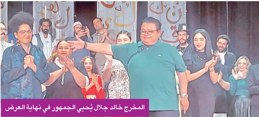
المخرج خالد جلال يُحيي الجمهور في نهاية العرض