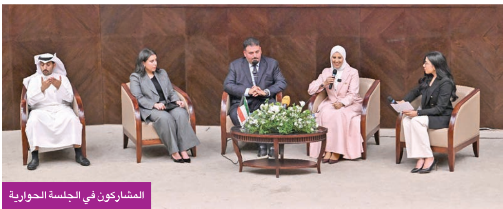
المشاركون في الجلسة الحوارية