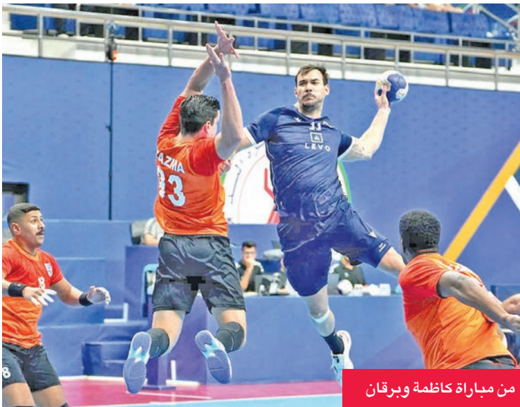
من مباراة كاظمة وبرقان

وبهذا الفوز، أنهى القرين الدور الأول برصيد 4 نقاط من فوز وخسارتين، على أن