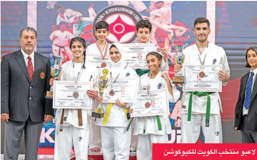
لاعبو منتخب الكويت للكيوكوشن

تُقام مساء اليوم مواجهتان ضمن منافسات الجولة الخامسة من بطولة الاتحاد للمكرة الطائرة، على صالة الاتحاد بجمع الشيخ سعد العبدالله الرياضي، حيث يلتقي في الخامسة مساءً فريق برقان مع العربي، وفي السابعة مساءً كاظمة مع القاسية. وتحظى مباراة كاظمة والقاسية باهتمام خاص نظراً لطموح الفريقين في الحفاظ على سجلهما خالياً من الهزائم، إلى جانب السعي لتحقيق الفوز الثاني على التوالي. ويحتل كاظمة المركز الثاني برصيد 3 نقاط، في حين باتي القاسية في المركز السادس بنقطتين، مما يعكس تقارب المستوى الفني بينهما