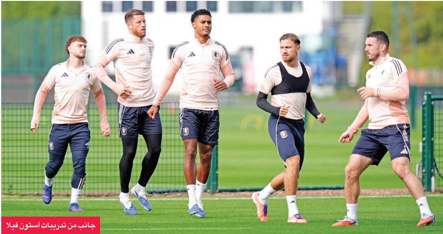
جانب من تدريبات أستون فيلا

إلى الاستمرار في بدايته القوية للموسم عندما يستضيف سالزبورغ ويلعب ممثلاً كرة القدم الألمانية فرايبورغ وشتوتغارت خارج قواعدهما أمام بولونيا، وبازل السويسري، في اختبارات صعبين.