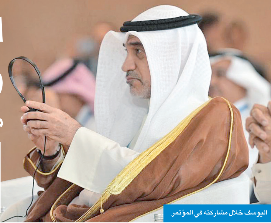
اليوسف خلال مشاركته في المؤتمر

الحوار طريق السلام العادل ولا وجود لأمن إقليمي مستدام مع استمرار العدوان الإسرائيلي