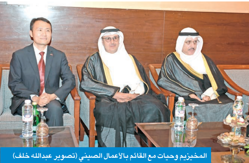
المخيزيم وحيات مع القائم بالأعمال الصيني

أن ذلك يفتح أبواباً مميزة للتعاون في مجالات متنوعة. من ناحيته، أكد القائم بالأعمال في سفارة الصين لدى البلاد، ليو شيانغ، أن العلاقات الصينية - الكويتية تشهد اليوم أفضل مراحلها التاريخية، مشيداً بعظم الصداقة التقليدية التي تجمع البلدين منذ أن كانت الكويت أول دولة خليجية عربية تقيم علاقات دبلوماسية مع الصين.