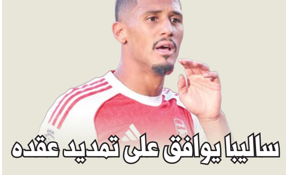
ساليبا يرافيق على تمديد عقده

وافق قلب الدفاع الفرنسي وليام ساليبا على تمديد عقده مع أرسنال الإنجليزي حتى عام 2030، بحسب ما كشف موقع «ذي أتلتيك» الخميس. ومن المتوقع أن يوقع ابن الرابعة والعشرين على العقد في الأيام القليلة المقبلة، علماً بأن عقده الأساسي ينتهي في يونيو 2027. وكان اسم ساليبا ارتبط بالانتقال إلى ريال مدريد الإسباني، لكنه عثر في مارس عن سعادته مع «المدفعية» ورغبته بإحراز الألقاب مع فريق شمال لندن. ويعود اللقب الأخير لأرسنال إلى عام 2020 عندما أحرز لقب الكاس المحلية. وعما إذا كان سيقوع عقداً جديداً مع فريق المدرب الإسباني ميكيل أرتيتا، قال ساليبا في يوليو «نعم، أمل في إتمام الأمر قريباً».