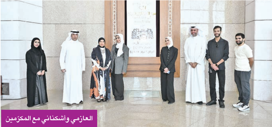
العازمي وأشكناني مع المكمّرين