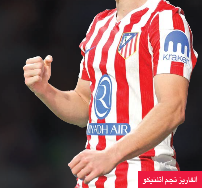
الفاريز نجم أتلتيكو

تتجه الأنظار السبت إلى قمة المرحلة السابعة من الدوري الإسباني لكرة القدم، حيث يلتقي أتلتيكو مدريد مع ضيفه ريال مدريد.