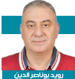
رويد يوناصر الدين

إبراهيم اليازجي صحيفة “الهدى” في نيويورك، وأطلق سليم تقلا مجلة “المكتطف” في مصر، وأبدع إيليا أبو ماضي في مقالاته ومجلاته. كانت الكلمة عندهم رسالة سامية، والصحافة مدرسة حقيقية، لا مكان فيها للابتذال ولا للضحج. ومن هنا يبرز التمني أن تتحمل الحكومات مسؤولية الرقابة بوعي وحكمة، فلا تُقَدِّد الحرية، بل تحميها من الانحصراف، وأن يُشترط في الإعلامي، كما في الطبيب، أن يكون أميناً على العقول قبل أن يكون بارعاً في أدواته، حافظاً للضمير، وصانعاً للوعي.