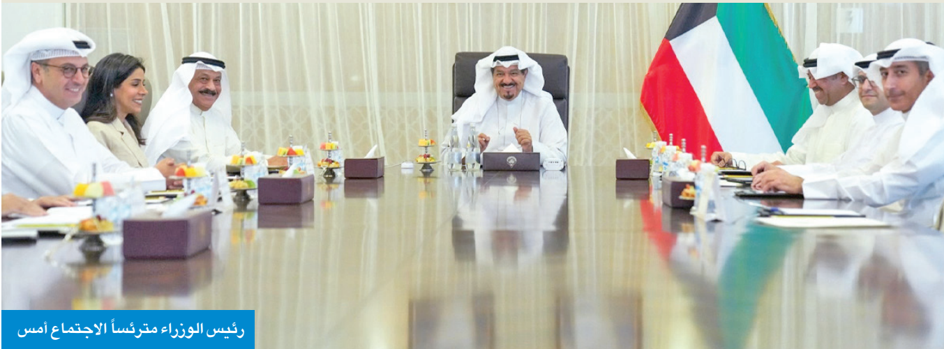
رئيس الوزراء مترأساً الاجتماع أمس

خلال ترؤسه اجتماع اللجنة الوزارية لمتابعة الموقف التنفيذي للاتفاقيات ومذكرات التفاهم الموقعة بين حكومتي دولة الكويت وجمهورية الصين الشعبية الصديقة، أكد رئيس مجلس الوزراء سمو الشيخ أحمد العبدالله أن إنجازات اقتصادية بارزة ستتحقق بفضل الرؤى الاستراتيجية والخطط الموضوعة لعدد من المشاريع التنموية الكبرى، التي تسعى الحكومة إلى تنفيذها بقيادة وتوجيهات سامية من مقام حضرة صاحب السمو أمير البلاد. وقد وجه رئيس الوزراء خلال الاجتماع، الذي عقد في قصر بيان أمس، أعضاء لجنة المتابعة الوزارية كلا حسب اختصاصه بالتنسيق والتشاور والتعاون المشترك مع رؤساء مجالس الشركات الحكومية الصينية العملاقة المرشحة من قبل الحكومة الصينية وحجمهم على البدء في توقيع الطرفين عقود تنفيذ أعمال البناء والتشييد للمرحلة المقبلة في البلاد. وبحث الاجتماع الـ 28 آخر مستجدات تنفيذ المشاريع التنموية