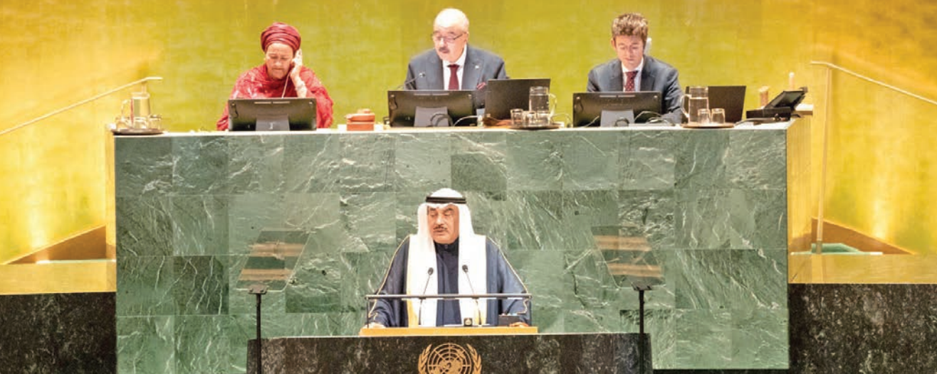
ممثل صاحب السمو خلال إلقائه كلمة الكويت أمام الجمعية العامة للأمم المتحدة

معالجة البرنامج النووي الإيراني وسائر القضايا العالقة.