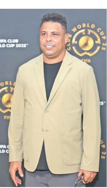
FIFA CLUB WORLD CUP 2025

دعا «الظاهرة» رونالدو، المتوج بطلاً للعالم مرتين مع المنتخب البرازيلي لكرة القدم، الأربعاء، إلى عودة نيمار إلى صفوف «سيليساو» لخوض نهائيات كأس العالم 2026 في الولايات المتحدة وكندا والمكسيك، مؤكداً أن البرازيل «لا تملك لاعب كرة قدم آخر» مثله. ويشارك نيمار بانتظام مع ناديه سانتوس، الذي عاد إلى صفوفه في يناير الماضي، ولم يستدعه المدرب الإيطالي لـ «سيليساو» كارلو أنشيلوتي للمشاركة في التصفيات. وقال رونالدو إن نيمار (33 عاماً)، رغم تعرضه للإصابات، لا يزال «لاعباً حاسماً في (سيليساو)».