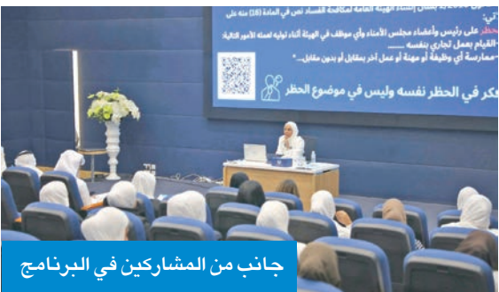
جانب من المشاركين في البرنامج

تخلتص الهيئة العامة لمكافحة الفساد «نزاهة» أمس برنامجاً تدريبياً ميدانياً لطلاب وطالبات كلية الحقوق بجامعة الكويت، ويستمر حتى 11 ديسمبر المقبل. وذكرت «نزاهة»، في بيان صحافي، أن البرنامج يهدف إلى تعزيز مهارات الطلبة، ورفع مستوى الوعي بقيم النزاهة والشفافية، ما يسهم في إعدادهم لمواجهة التحديات القانونية والمهنية المستقبلية. وأضافت أن البرنامج يتضمن جوانب عملية ونظرية يقدمها عدد من المتخصصين بالهيئة من محاضرات متنوعة عن قانون إنشاء الهيئة