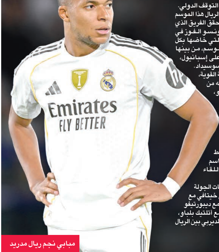
مبابي نجم ريال مدريد

عظيمة خلال فترة التوقف الدولي. وفي المقابل، بدأ الريال هذا الموسم بأداء مثالي، حيث حقق الفريق الذي يقوده تشابي ألونسو الفوز في المباريات السبع التي خاضها بكل البطولات هذا الموسم، من بينها انتصارات مقنعة على إسبانيول، ومارسيليا، وريال سوسيداد. ورغم هذه البداية القوية، حذر ألونسو لاعبيه من الاستهانة بالنتيجة، مشدداً على أن مباريات الديربي كثيرة ما تخالف التوقعات. وفي ظل غياب المادرا، قد تكون هيمنة ريال مدريد في خط الوسط العامل الحاسم الذي يميل بكفة اللقاء لصالحهم. وتستكمل منافسات الجولة الست، حيث يلتقي خيتافي مع ليفانتي، ومايوركا مع ديبورتيفو الأفييس، وفياريال مع أتلتيك بلباو، بالإضافة لمواجهة الديربي بين الريال وأتلتيكو.