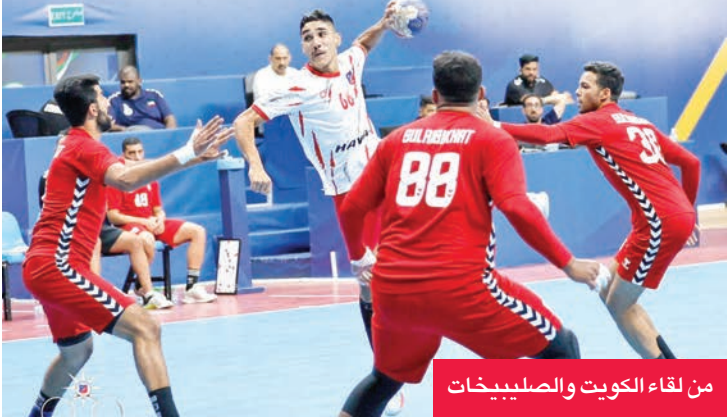
من لقاء الكويت والصليبيخات

العراق بنتيجة 0 - 2، ويسعى إلى حفظ ماء الوجه، وتقديم أداء مشرف في ختام مشاركته. أما المنتخب العراقي، فقد عزز حظوظه في التأهل بعد فوزه على البحرين، رافعاً رصيده إلى 4 نقاط في المركز الثاني خلف السعودية المتصدر بـ 6 نقاط، من انتصاريين متتاليين، ليصبح أول المنتخب الذي تتيجن مقعدها في المربع الذهبي للبطولة، والذي يسعى إلى مواصلة سلسلة انتصاراته، وتأكيد تفوقه في المجموعة بتحقيق العلامة الكاملة.