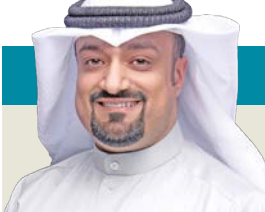
د. أحمد حسين الفيلكاوي @DrAhmadkw

* كاتب عمود في «ول ستريت جورنال» ومؤلف مشارك لكتاب «The Cost: Trump, China and American Revival»