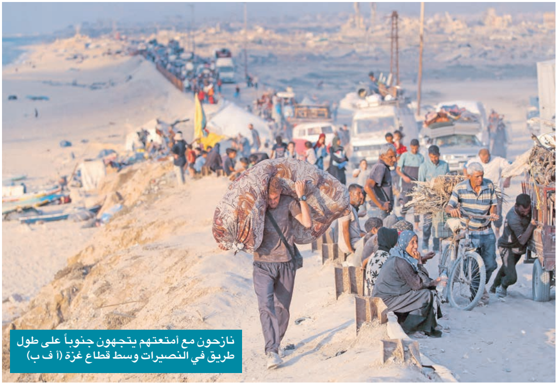
نازحون مع أمتهتهم يتجهون جنوباً على طول طريق في التصيرت وسط قطاع غزة

هبطنا بهدوء في المدرج، وناصر لا يزال مذهولاً مشمت الذهن... هل يضحك معنا؟ أم يبيكي؟ أم يلعن اليوم الذي جاء فيه ليدرس اللغة، أم يبحث عن أقرب مسجد ويلتزم بقسمه! غُدنا إلى Oregon بسلام وأمان، ورحلة من رحلات العمر، عشنا لحظات رهيبة، وشاهدنا مناظر جميلة، وسمعنا اعترافات خطيرة... في 3 دقائق!