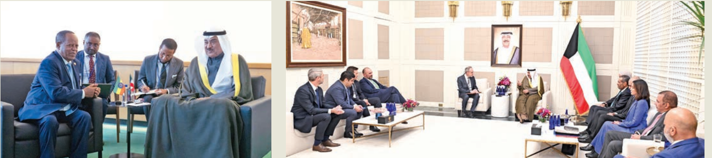
ممثل الأمير مستقبلاً وفد شركة أمارزون