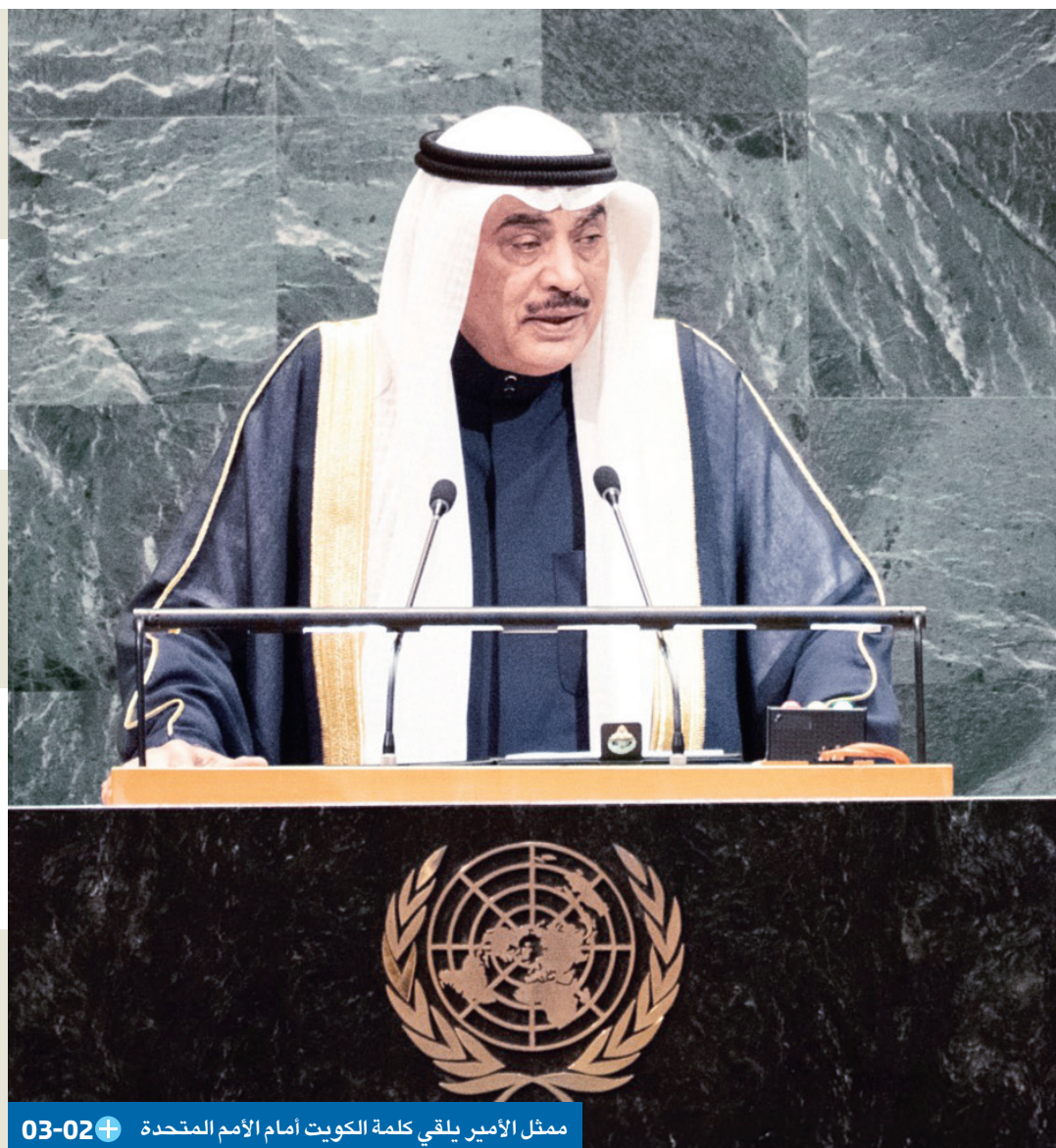
ممثل الأمير يلقي كلمة الكويت أمام الأمم المتحدة 03-02+