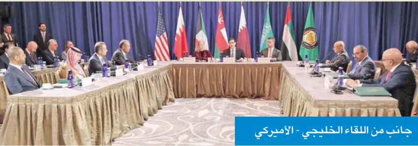
جانب من اللقاء الخليجي - الأميركي

ترأس وزير الخارجية، رئيس الدورة الحالية للمجلس الوزاري لمجلس التعاون، عبدالله الحيا، أعمال الاجتماع الوزاري المشترك بين مجلس التعاون والولايات المتحدة الأميركية، الذي عقد أمس الأول في مدينة نيويورك، على هامش أعمال الدورة الـ 80 للجمعية العامة للأمم المتحدة، في حين ترأس الجانب الأميركي وزير خارجية الولايات المتحدة، ماركو روبيو، وبمشاركة وزراء خارجية دول «التعاون» والأمين العام للمجلس جاسم البدوي.