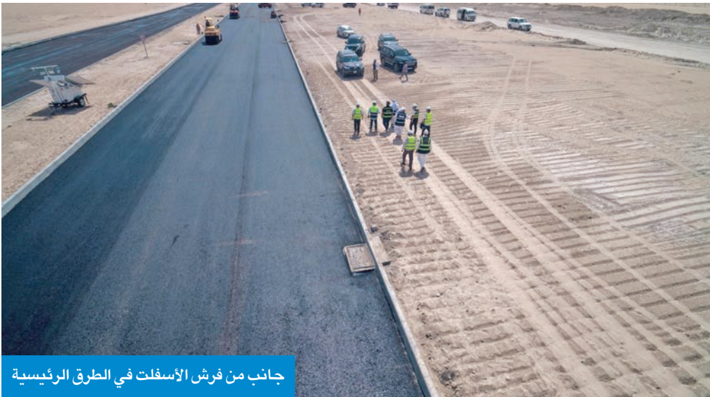
جانب من فرش الأسفلت في الطرق الرئيسية

الكندري: 46.36% الإنجاز الفعلي حتى الشهر الجاري