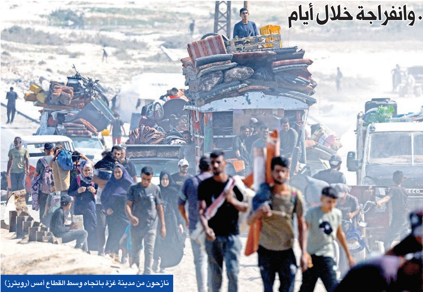
نازحون من مدينة غزة باتجاه وسط القطاع أمس (رويترز)

على عموم القطاع، واعترض صاروخاً فوق بلدات غلاف غزة. وأفاد الجيش بمقتل جندي برصاص قناص بشمال القطاع، في حين دخلت دباباته إلى حي تل هوا وهو آخر المناطق التي لاتزال تعج بالنازحين في مدينة غزة مع تواصل حركة النزوح منها. وبينما أفيد بمقتل 95 فلسطينياً وإصابة المئات جراء الغارات الجوية والقصف على القطاع، قُتل فلسطينيان برصاص إسرائيلي، بعد محاصرتهم في منزل ببلدة طمون جنوب شرقي طوباس بالصفقة الغربية، حيث واصلت سلطات الاحتلال إغلاق معبر الكرامة بين المنطقة الفلسطينية والأردن.