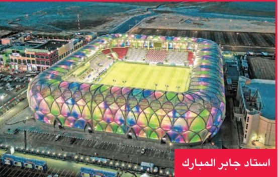
استاد جابر المبارك

أعلنت الهيئة العامة للرياضة اعتماد 7 ملاعب رئيسية لإستضافة المباريات الرسمية لبطولات كرة القدم المحلية، إلى جانب 4 ملاعب بديلة كخيار احتياطي، وذلك بالتنسيق مع الاتحاد الكويتي لكرة القدم، على أن تخصص بقية الملاعب والساحات الرياضية التابعة لها لتدريبات الأندية والمنتخبات الوطنية.