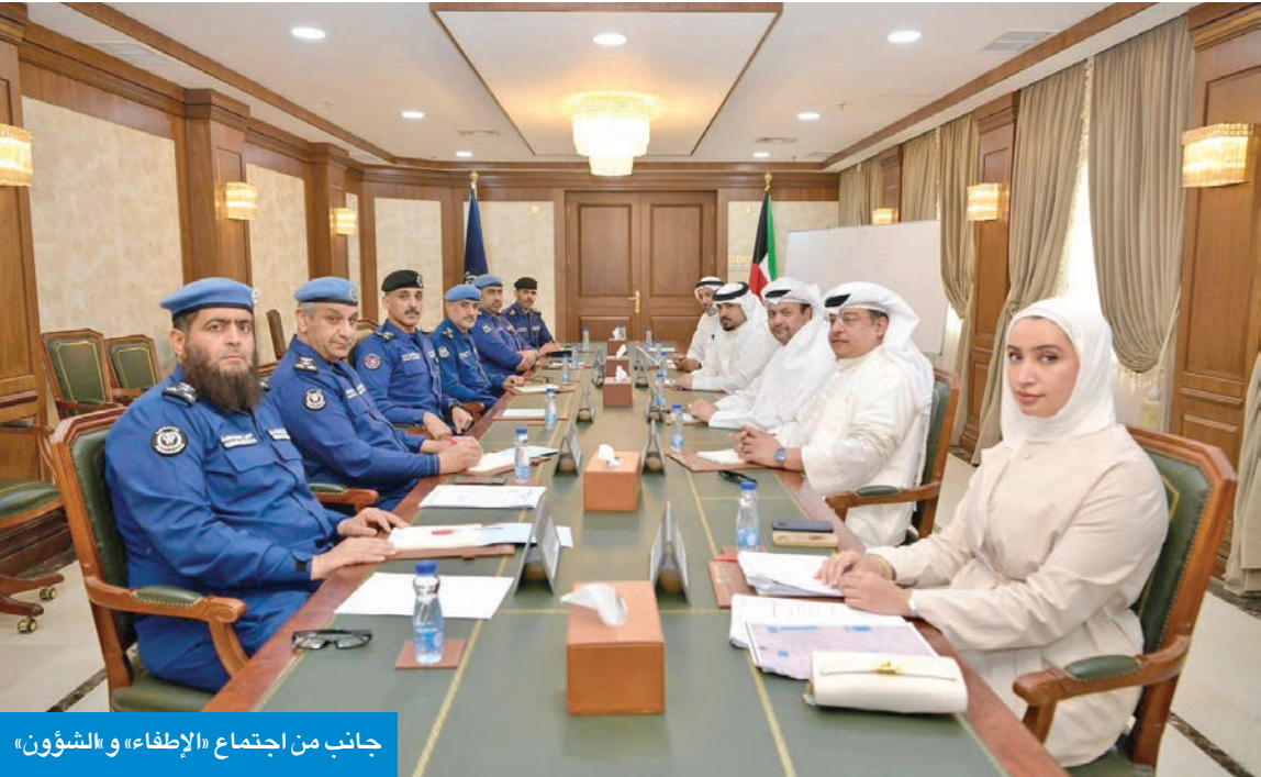
جانب من اجتماع «الإطفاء» و«الشؤون»

الدورية للقوة لمتابعة المشاريع في البلاد والإطلاع على مرافق المشروع واشتراطات السلامة والوقاية من الحريق، والتأكد من تطبيق المخططات المعتمدة، وعدم وجود أي مخالفات وقائية أو تخزين قد يؤثر على سير العمل. وجرى بحث تذليل أي عقبات تواجه التنفيذ، بما يسهم في سرعة إنجاز المشروع الذي يمثل أحد أبرز المشاريع في البلاد.