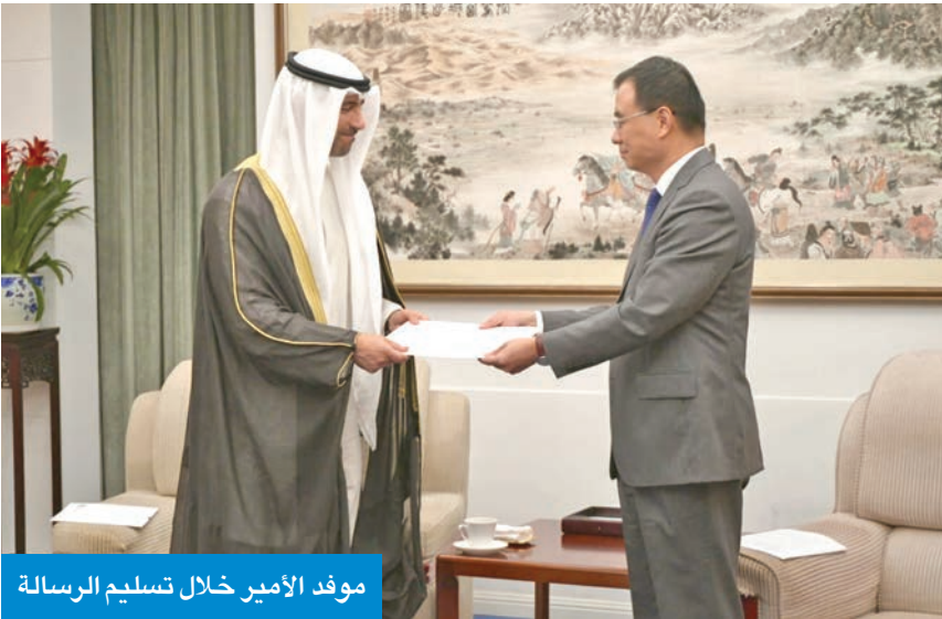
موفد الأمير خلال تسليم الرسالة