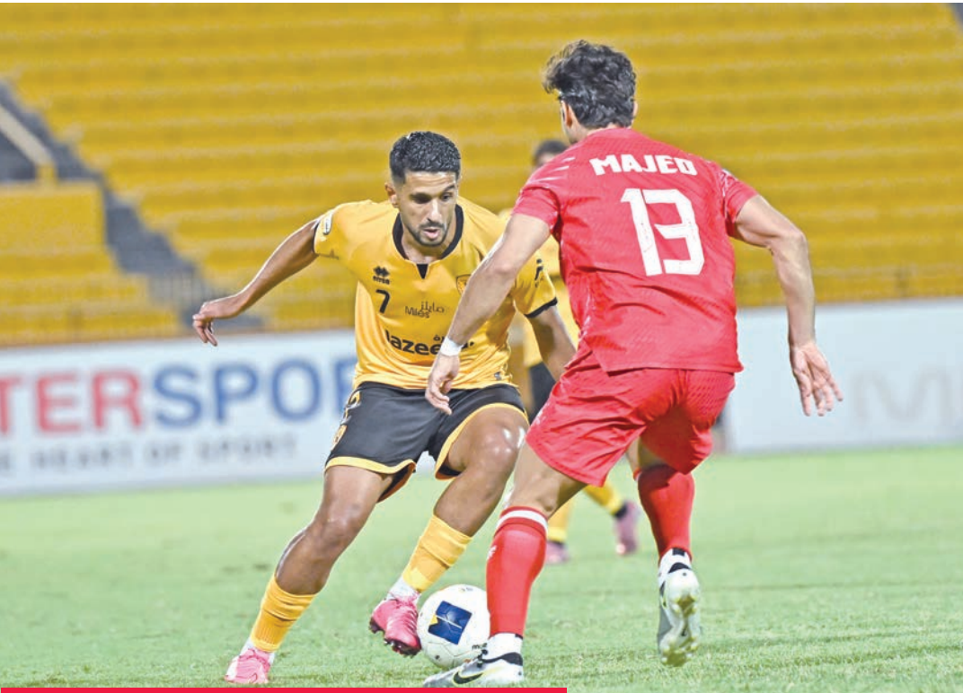
جانب من مباراة القادسية والفحيحيل في الجولة الثالثة بـ «الممتاز»

مع إسدال الستار على الجولة الثالثة من دوري زين الممتاز لكرة القدم، بدأت ملامح المنافسة تتبلور، وظهرت الفوارق الفنية بين الفرق التي تملك أدوات الحسم، وتلك التي لا تزال تبحث عن التوازن.