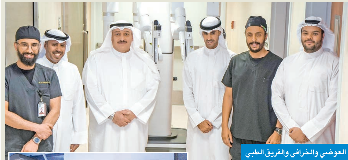
العوضي والخرافي والفريق الطبي

العوضي: السياسة الحكيمة للأمير تقود الكويت بطموح نحو مستقبل رقمي صحي مستدام