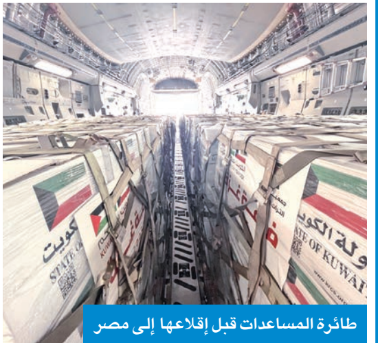
طائرة المساعدات قبل إقلاعها إلى مصر

وصلت الطائرة الإغاثية الـ 13 من الجسر الجوي الكويتي الثاني إلى مطار العريش المصري، وعلى متنها 40 طناً من المساعدات الغذائية، تمهيداً لإيصالها إلى قطاع غزة ضمن الحملة الإنسانية «الكويت بجانكم» لإغاثة الأشقاء الفلسطينيين في قطاع غزة.