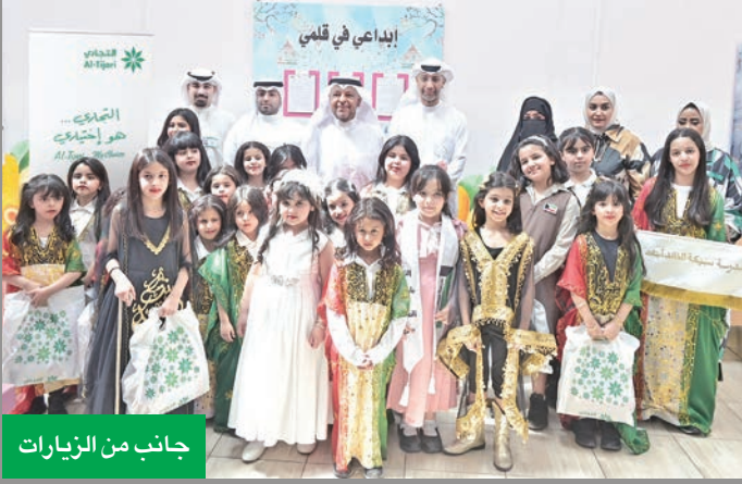
جانب من الزيارات

في إطار تعاون البنك التجاري المستمر مع مختلف محافظات الكويت، ضمن برنامجه الاجتماعي الذي يقوم على رعاية الفعاليات التي تنظمها مؤسسات المجتمع المدني، ومنها محافظات الكويت الـ 6، وانطلاقاً من إيمانه بأهمية دعم ورعاية الفعاليات التعليمية التي تعزز التجربة الدراسية للطلاب في بداية العام الدراسي الجديد، رعى البنك الزيارات المدرسية للمدارس الواقعة في نطاق محافظة الفروانية، والتي قام بها المحافظ الشيخ عذبي الناصر. وقد حظيت هذه الفعالية بحضور المحافظ، وبحسب مسبق بين المحافظة ومنطقة الفروانية التعليمية، وكذلك ثمانية مدير قطاع التواصل المؤسسي في «التجاري»، أماني الورع، وفريق البنك، حيث قام البنك برعاية الزيارات المدرسية بمناسبة العودة لمقاعد الدراسة لكل من مدرسة عبد العزيز قاسم حمادة الابتدائية للبنين، ومدرسة سبيكة الخالد الابتدائية للبنات، في منطقة العارضية، بغرض الاحتفال مع الطلاب والطالبات ببداية العام الدراسي الجديد، وتزويدهم ببعض المستلزمات المدرسية وحثهم على الاهتمام