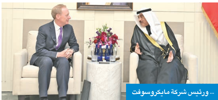
... ورئيس شركة مايكروسوفت