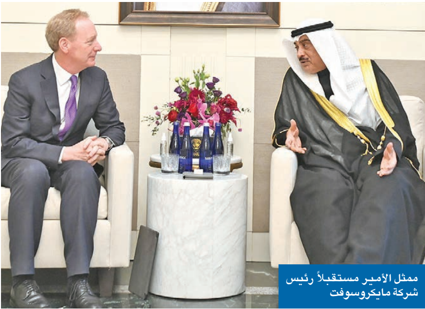
ممثل الأمير مستقبلاً رئيس شركة مايكروسوفت

ممثل الأمير: توسيع قاعدة الاستثمارات وتنويع الاقتصاد رغبة سامية لتعزيز حضور الشركات العالمية في الكويت • ولي العهد استقبل رؤساء شركات وأعضاء من غرفة التجارة الأميركية • دعم الكفاءات الشبابية لتعزيز قدرتها على قيادة المستقبل