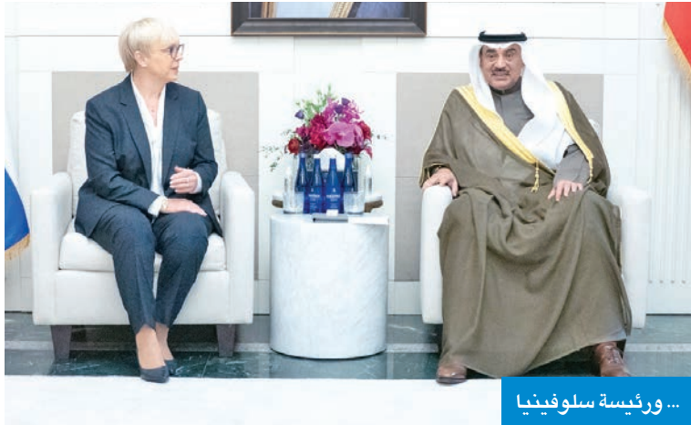
... ورئيسة سلوفينيا