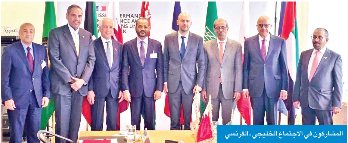
المشاركون في الاجتماع الخليجي - الفرنسي

ناقشا الأخذ بمجالات الشراكة إلى آفاق أوسع في الاقتصاد والتنمية