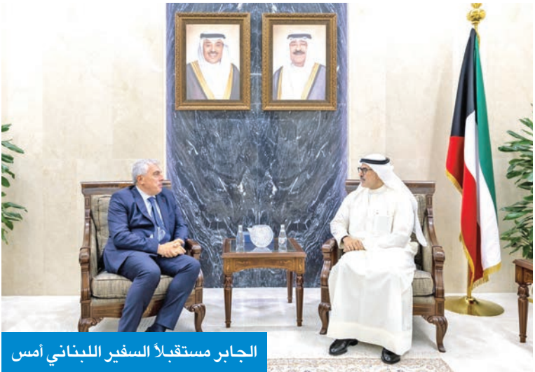
الجابر مستقبلاً السفير اللبناني أمس

استقبل نائب وزير الخارجية، السفير الشيخ جراح الجابر، أمس، سفير الجمهورية اللبنانية لدى الكويت غادي خوري. وذكرت وزارة الخارجية، في بيان، أنه جرى خلال اللقاء استعراض العلاقات الثنائية المتجذرة بين البلدين الشقيقين، وبحث سبل الارتقاء بها إلى آفاق أرحب. واستقبل الجابر سفير مملكة إسبانيا لدى الكويت، مانويل إرنانديث، حيث تم بحث علاقات التعاون، إضافة إلى المواضيع ذات الاهتمام المشترك. كما استقبل سفير اليابان لدى الكويت، موكاي كينيتشيرو، حيث تم بحث العلاقات الثنائية وسبل تطويرها، إضافة إلى تناول أبرز الموضوعات ذات الاهتمام المشترك.