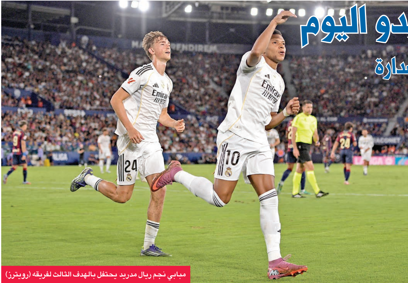
مبابي نجم ريال مدريد يحتفل بالهدف الثالث لفريقه