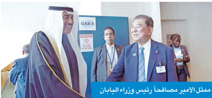
ممثل الأمير مصافحاً رئيس وزراء اليابان