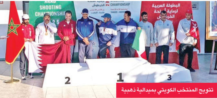
تتويج المنتخب الكويتي بميدالية ذهبية

حتى 28 الجاري، بمشاركة 60 رياضيًا يمثلون 8 دول عربية، بينها الكويت، للتجاري في مختلف المنافسات.