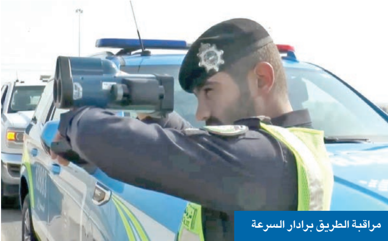
مراقبة الطريق برادار السرعة