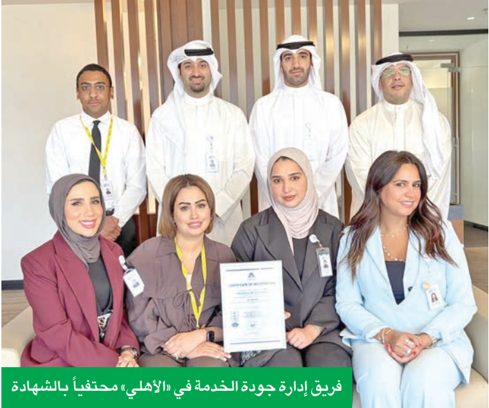
فريق إدارة جودة الخدمة في «الأهلي» يحتفياً بالشهادة

لضمان الكفاءة والشفافية، مما يساهم في بناء ثقافة التحسين المستمر بجميع الإدارات. وتشكل هذه الشهادة إنجازاً يفخر به البنك ويؤكد التزامه الراسخ بتقديم خدمات ممتازة محورها العميل، وهي تعكس قوة أنظمتهم وكفاءة فريق العمل لديه، وتصميمه على البقاء كشريك مصرفي موثوق به. ويأتي ذلك في وقت تتكامل هذه الجودة العالمية يعزز «الأهلي» من جودة خدماته والمطلوبات الرقابية، مع تطوير جميع العمليات بشكل مستمر. وتعتبر شهادة الأيزو 9001:2015 الأكثر شهرةً على مستوى العالم في مجال إدارة الجودة، وهي مصممة لمساعدة المؤسسات على إثبات قدرتها على تقديم خدمات تلبي بشكل مستمر احتياجات العملاء والمطلوبات الرقابية، مع تطوير جميع العمليات بشكل مستمر.