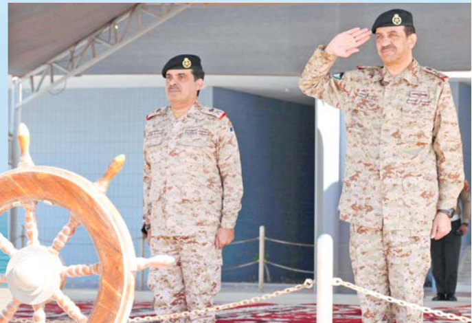
رئيس الأركان خلال زيارة القاعدة البحرية

قام رئيس الأركان العامة للجيش الكويتي، الفريق الركن خالد الشريعان، أمس، بزيارة إلى قاعدة «محمد الأحمد» البحرية، حيث كان في استقباله أمر القوة البحرية اللواء الركن بحري سيف الهملان، وعدد من كبار ضباط القاعدة.