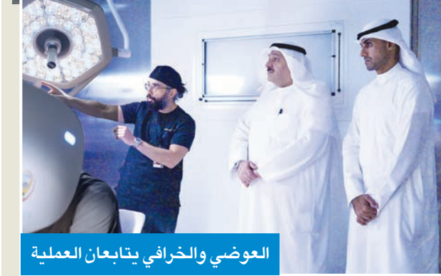
العوضي والخرافي يتابعان العملية

وقال وزير الصحة د. أحمد العوضي، في تصريح له، إن «السياسة الحكيمة لسمو أمير البلاد الشيخ مشعل الأحمد تقود الكويت بخطى ثابتة وإرادة طموحة نحو مستقبل رقمي مستدام للقطاع الصحي». بدوره، قال نائب رئيس مجلس الإدارة الرئيسية التنفيذي في مجموعة «زين» بدر ناصر الخرافي: