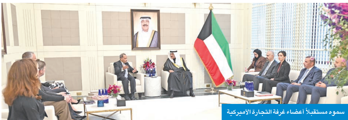
سموه مستقبلاً أعضاء غرفة التجارة الأميركية

واستقبل سموه أيضاً رئيس جمهورية ليبيريا جوزيف بواكاي، وتم خلال اللقاء بحث العلاقات وسبل تطويرها. وحضر اللقاءات وزير الخارجية عبدالله الجبيا، ومدير عام هيئة تشجيع الاستثمار المباشر الشيخ د. مشعل الجابر، ووكيل الشؤون الخارجية بالديوان الأميري مازن العيسى، ومساعد وزير الخارجية لشؤون مكتب الوزير السفير بدر التنب، والمندوب الدائم لدولة الكويت لدى الأمم المتحدة السفير طارق البناي، وعلى هامش اجتماعات الدورة الـ 80 للجمعية العامة للأمم المتحدة، التقى ممثل صاحب السمو، ورئيس وزراء اليابان، شيجيرو إيشيبا، وتم خلال اللقاء استعراض العلاقات الثنائية المتميزة بين البلدين، وسبل دعم العلاقات المشتركة، وتعزيز الشراكة بما فيه مصلحة البلدين والشعبين الصديقين، إضافة إلى مناقشة أبرز المستجدات على الساحة الدولية. كما التقى سموه رئيس وزراء النرويج، جوناس جار ستور، وجرى خلال اللقاء بحث العلاقات وسبل دعمها وتعزيزها لما فيه مصلحة البلدين والشعبين الصديقين، إضافة إلى مناقشة أبرز المستجدات على الساحتين الإقليمية والدولية.