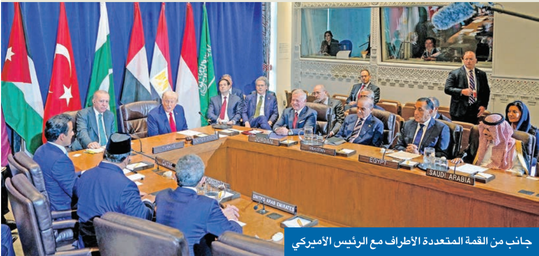
جانب من القمة المتعددة الأطراف مع الرئيس الأميركي

قادة القمة المتعددة الأطراف نقلوا رؤيتهم إلى الرئيس الأميركي وجددوا رفضهم لتهجير الفلسطينيين