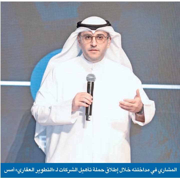
المشاري في مداخلته خلال إطلاق حملة تأهيل الشركات لـ «التطوير العقاري» أمس

وسط تأكيد أنه القطاع الخاص هو الذي سيحل القضية الإسكانية وسيحقق حلم الكويتيين «والرلك عليه»، شدد وزير الدولة لشؤون البلدية وزير الدولة لشؤون الإسكان عبداللطيف المشاري، على أهمية الشراكة مع هذا القطاع بوصفه «الشريك الحقيقي في التنمية»، إلى جانب العمل على قوانين جوهرية جديدة من أهمها «التمويل العقاري» الذي سيرى النور قريباً. جاء ذلك في كلمة المشاري خلال إطلاق المؤسسة العامة للرعاية السكنية، أمس، الحملة الترويجية لتأهيل الشركات لمشاريع التطوير العقاري، متضمنة طرح ثلاث حزم مشاريع في أربع مناطق.