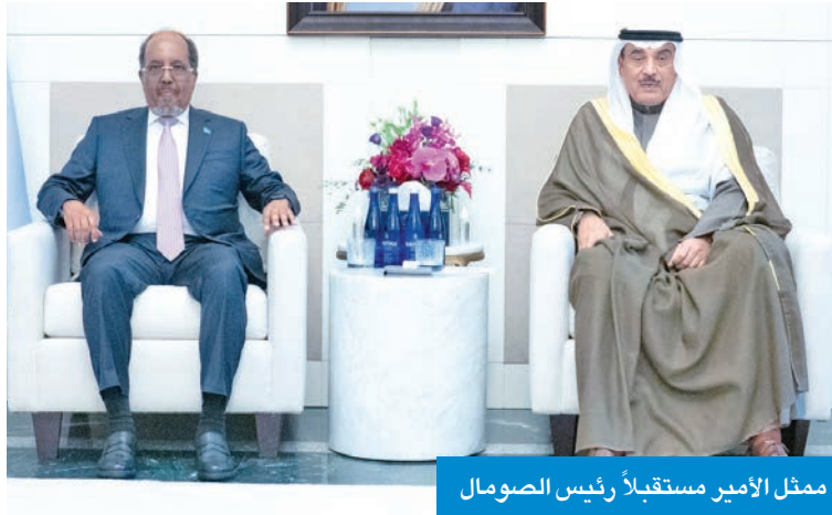
ممثل الأمير مستقبلاً رئيس الصومال

واستقبل سموه أيضاً رئيس جمهورية ليبيريا جوزيف بواكاي، وتم خلال اللقاء بحث العلاقات وسبل تطويرها. وحضر اللقاءات وزير الخارجية عبدالله الجبيا، ومدير عام هيئة تشجيع الاستثمار المباشر الشيخ د. مشعل الجابر، ووكيل الشؤون الخارجية بالديوان الأميري مازن العيسى، ومساعد وزير الخارجية لشؤون مكتب الوزير السفير بدر التنب، والمندوب الدائم لدولة الكويت لدى الأمم المتحدة السفير طارق البناي، وعلى هامش اجتماعات الدورة الـ 80 للجمعية العامة للأمم المتحدة، التقى ممثل صاحب السمو، ورئيس وزراء اليابان، شيجيرو إيشيبا، وتم خلال اللقاء استعراض العلاقات الثنائية المتميزة بين البلدين، وسبل دعم العلاقات المشتركة، وتعزيز الشراكة بما فيه مصلحة البلدين والشعبين الصديقين، إضافة إلى مناقشة أبرز المستجدات على الساحة الدولية. كما التقى سموه رئيس وزراء النرويج، جوناس جار ستور، وجرى خلال اللقاء بحث العلاقات وسبل دعمها وتعزيزها لما فيه مصلحة البلدين والشعبين الصديقين، إضافة إلى مناقشة أبرز المستجدات على الساحتين الإقليمية والدولية.