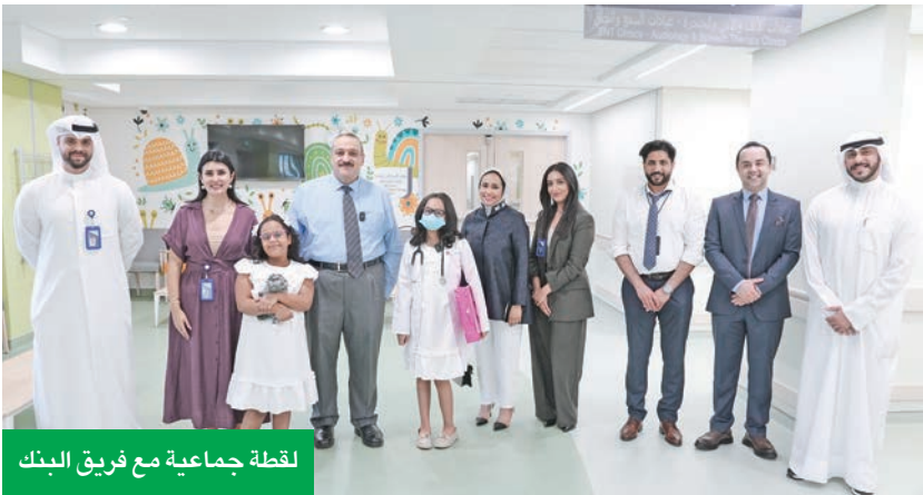
لقطة جماعية مع فريق البنك

مساهماته الدائمة والمتواصلة على كل المستويات، لاسيما خدمات الرعاية الصحية والأنشطة والمبادرات، التي يقدمها لتطوير المنظومة الصحية في مستشفى الوطني التخصصي للأطفال.