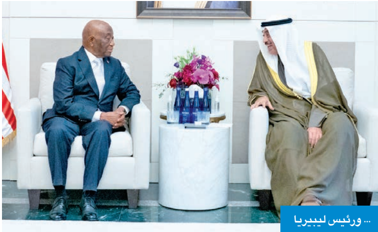
... ورئيس ليبيريا