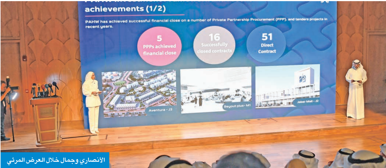
الأنصاري وجمال خلال العرض المرئي

ترسية الخطة الزمنية للمؤسسة خلال العام المقبل وبعدها سيتم التنفيذ