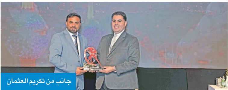
جانب من تكريم العثمان

تكريم مدير «الأمن السيبراني» في الجامعة بجائزة التميز لإسهاماته