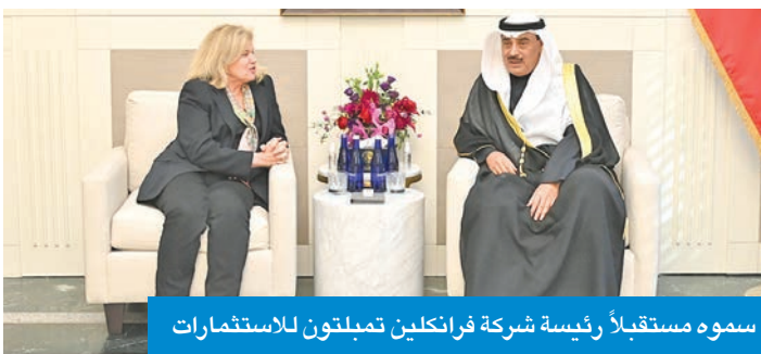
سموه مستقبلاً رئيسة شركة فرانكلين تيمبلتون للاستثمارات