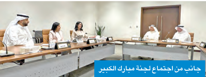
جانب من اجتماع لجنة مبارك الكبير