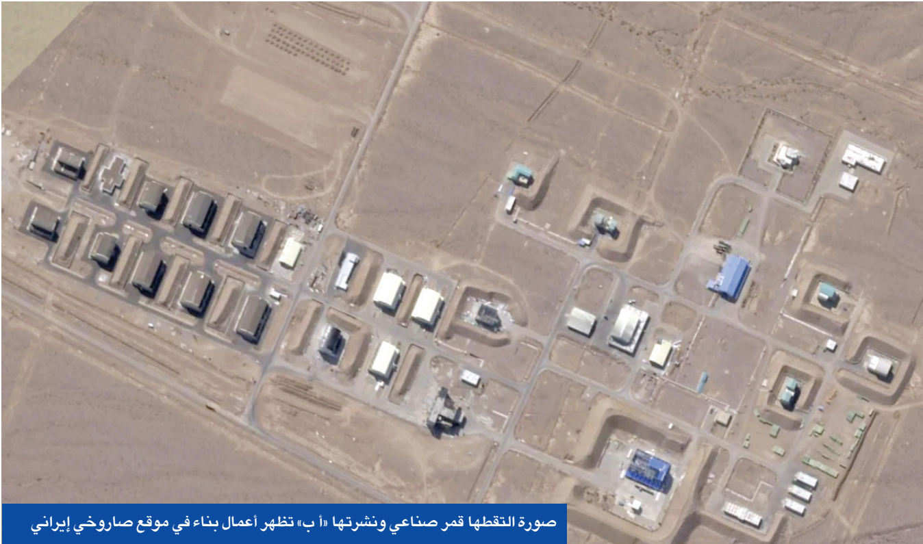
صورة التقطها قمر صناعي ونشرت في «ب» تظهر أعمال بناء في موقع صاروخي إيراني

على أكبر رفسنجاني الى السلطة بعد وفاة روح الله الخميني، وانتقلوا منذ ذلك الى صفوف المعارضة. وتعتبر الجبهة منشقة عن الإصلاحيين الذين يقودهم الرئيس السابق محمد خاتمي. وفي كلمته أمام الجمعية العامة، أمس، وصف الرئيس الإيراني مسعود بزشكيان، الهجوم الإسرائيلي على بلاده بأنه عدوان على النظام القانون الدولي، مؤكداً أن «إيران لن ترتع». واذ انتقد مساعي الترويكاً الأوروبية لإعادة العقوبات على بلاده معتبراً أنها خطوات غير قانونية، رحب بزشكيان بـ «التحالف الدفاعي بين السعودية وباكستان باعتباره بداية لإنشاء نظام أممي إقليمي شامل يتعاون الدول المسلمة في غرب آسيا».