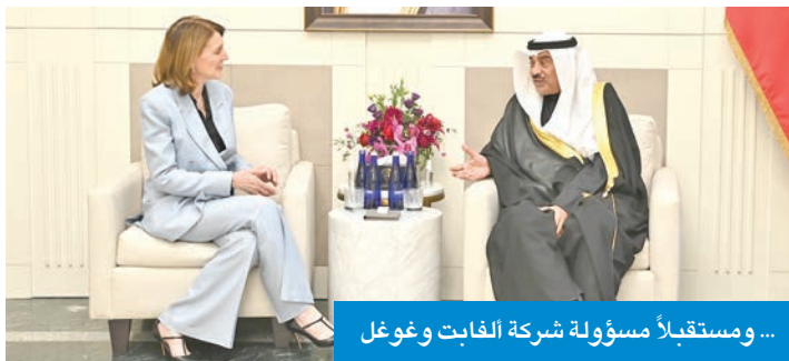
... ومستقبلاً مسؤولة شركة الغابت وغوغل

وصف نائب وزير الخارجية الأميركي، كريستوفر لاندو، سمو ولي العهد الشيخ صباح الخالد بـ «الرجل الحكيم والدبلوماسي البارع». وفي تغريدة كتبها على حسابه الخاص في موقع «X»، بعد لقائه سمو ولي العهد في مقر إقامته بنيويورك على هامش أعمال الدورة الـ 80 للجمعية العامة للأمم المتحدة، قال لاندو: «أنا متحمس لوجودي في نيويورك هذا الأسبوع لحضور جلسات الجمعية العامة للأمم المتحدة، والتي تُعد بمنزلة حدث رئيسي مهم في مجال عملي».