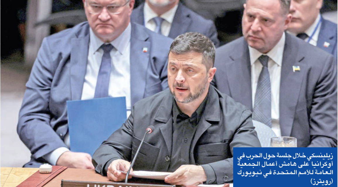
زيلينسكي خلال جلسة حول الحرب في أوكرانيا على هامش أعمال الجمعية العامة للأمم المتحدة في نيويورك

سيكروسكي، روسيا، في وقت سابق قائلاً إن «موسكو لا ينبغي أن تشتكي في الأمم المتحدة، إذا أسقطت طائراتها بعد دخولها الأجواء الجوية لدول حلف الناتو». والأسبوع الماضي أعلنت إسبانيا أن 3 طائرات مقاتلة روسية طراز ميغ -31 دخلت مجالها الجوي دون إذن، وبقيت فيه لمدة 12 دقيقة قبل أن تنصدى لها طائرات إف -35 إيطالية تمثل حلف الناتو، منمركزة في إسبانيا وتجبرها على الانسحاب.