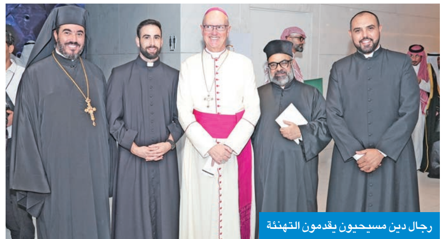
رجال دين مسيحيون يقدمون التهنئة