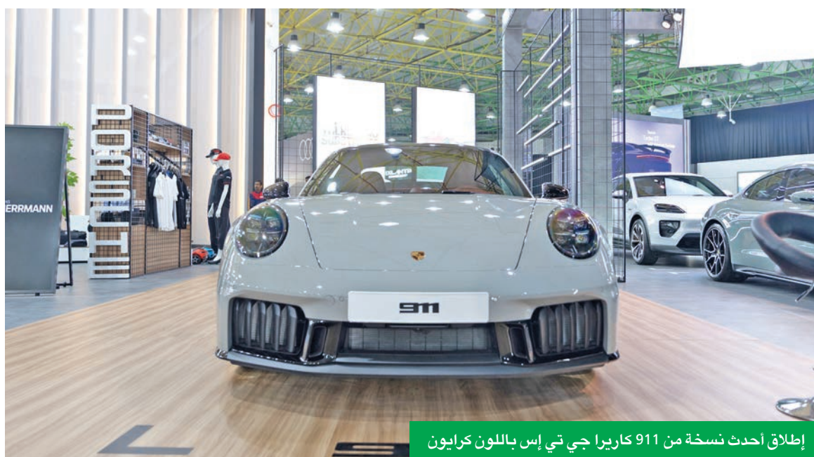
إطلاق أحدث نسخة من 911 كاريرا جي تي إس باللون كرايرون

لن تواجـد العلامة في المنطقة، ولتمنح ضيوفها من زوار «عالم السيارات 2025» مزيداً من التفؤد، قام مركز بورشه الكويت بالكشف عن سلسلة من العروض الخاصة، بمزايا متاحة طوال فترة المشاركة في المعرض حتى انتهائه، حرصاً على تقديم تجربة فريدة لا تـُسى لمحبي العلامة الشهيرة من الحضور.