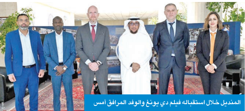
المندبل خلال استقباله فيلم دي يونغ والوفد المرافق أمس

الجمعية بحثت مع «الصليب الأحمر» تطوير العمل الإغاثي