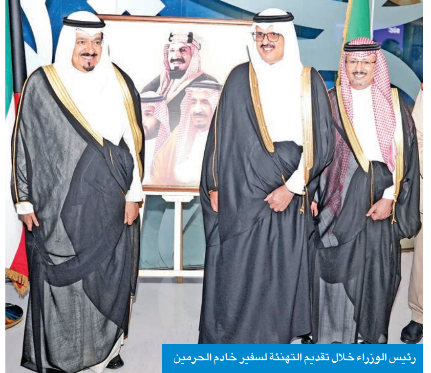
رئيس الوزراء خلال تقديم التهنئة لسفير خادم الحرمين

من جهته، هنأ سفير دولة فلسطين رامي طهوب، باسم الجالية الفلسطينية في الكويت وبالأصالة عن نفسه، المملكة قيادة وشعباً بمناسبة اليوم الوطني السعودي الـ 95. وقال طهوب، في تصريح صحفي: «انتقدم إلى خادم الحرمين الشريفين الملك سلمان بن عبدالعزيز، وسمو ولي العهد الأمير محمد بن سلمان باطيب التهاني بهذه المناسبة العزيرة». وأضاف أن هذه المناسبة فرصة لاستذكـار الدور الكبير والدعم المتواصل الذي تقدمه المملكة العربية السعودية لدولة فلسطين والشعب الفلسطيني وقضيته العادلة، مشيراً إلى أن من أبرز هذه الجهود قيادة المملكة، إلى جانب فرنسا، للتحالف الدولي الرامي إلى تنفيذ حل الدولتين، وهو ما أفضى مؤخراً إلى اعتراف عدد من الدول بدولة فلسطين في خطوة تاريخية مهمة نحو وقف حرب الإبادة التي يتعرض لها الشعب الفلسطيني في قطاع غزة المنكوب وباقي الأراضي الفلسطينية المحتلة.