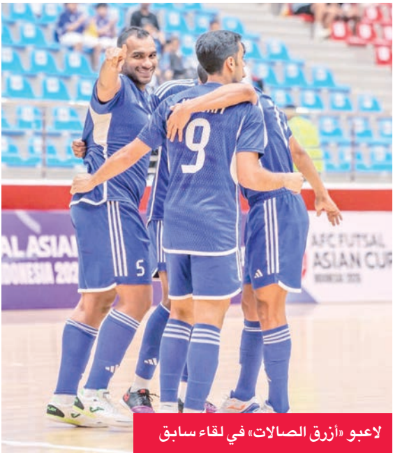
لاعبو «أزرق الصالات» في لقاء سابق

يخوض منتخب الكويت لكرة قدم الصالات، مساء اليوم (الأربعاء)، مواجهة حاسمة أمام نظيره الأسترالي ضمن الجولة الثالثة من تصفيات كأس آسيا، في لقاء سيحدد هوية المتأهل المباشر عن المجموعة الأولى إلى النهائيات المقررة بإندونيسيا في يناير المقبل. ويدخل المنتخبان اللقاء برصيد متساو من النقاط (6 نقاط لكل منهما)، مع أفضلية فارق الأهداف لمصلحة المنتخب الأسترالي، الذي اكتسح الهند بنتيجة 10-1، فيما حقق «الأزرق» فوزاً مهماً على منغوليا بنتيجة 6-2 في الجولة الثانية.