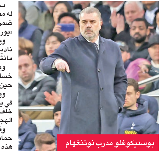
بوسيتكوغلو مدرب نوتنغهام

يخوض نوتنغهام فوريست أول حملة أوروبية له منذ 30 عاماً، عندما يلعب اليوم مع ريال بيتيس ضمن الجولة الأولى من الدوري الأوروبي لكرة القدم «يوروبا ليغ». ويعول نوتنغهام على مدربه بوسيتكوغلو الذي قاد ناديه السابق توتنهام إلى الفوز باللقب على حساب مانشستر يونايتد. ويبحث المدرب الأسترالي عن فوزه الأول بعد خسارتين، من بينها خروج مبكر من كأس الرابطة، في حين تعادل مع بيرنلي 1-1 ضمن الدوري. ويحاول بوسيتكوغلو الذي أقلل من تدريب توتنهام في يونيو بعد أسوأ موسم للفريق في الدوري الممتاز، خلف البرتغالي نونو إشبيرييتو سانتو، تطبيق أسلوبه الهجومي مع فوريست سعياً وراء الألقاب. وقال «أحب أن تلعب الفرق التي أدريتها كرة قدم حماسية وتسجيل أهداف»، مضيفاً «لا أعذار عن ذلك. هذه طريقتي وهذا ما أريد أن أراه في فرقي».