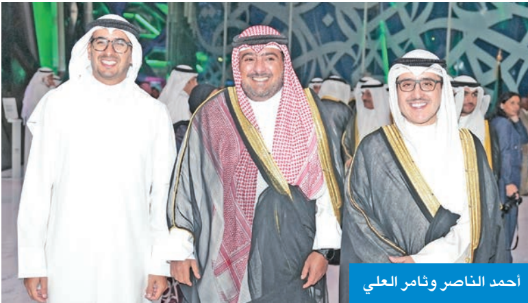
احمد الناصر وثامر العلي

فخر لنا جميعاً في دول مجلس التعاون الخليجي، ويعكس حكمة قيادتها الرشيدة ورؤية 2030 الطموحة التي تمثل قفزة نوعية نحو مستقبل مزدهر للمملكة والمنطقة اجمع. وأضاف: «وانني إذ اشارك أخي صاحب السمو الأمير سلطان بن سعد آل سعود سفير المملكة العربية السعودية لدى دولة الكويت وكافة أعضاء السفارة هذا اليوم الأغر، لأؤكد إن العلاقات الأخوية التاريخية التي تجمع مملكة البحرين والمملكة العربية السعودية تمثل نموذجاً متقدراً للوحدة والتلاحم، حيث وخذتنا روابط الدين والدم والمصير المشترك، ورسختها المواقف الصادقة بين البلدين في مختلف المحافل. ونؤكد بهذه المناسبة الغالية اعترازنا بهذه الروابط، وحرصنا الدائم على تعزيزها بما يخدم مصالح الشعبين الشقيقين وبحقق الأمن والازدهار للمنطقة بأسرها».