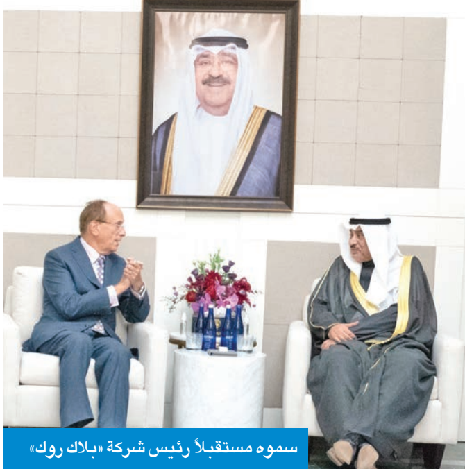
سموه مستقبل رئيس شركة «بلاك روك»