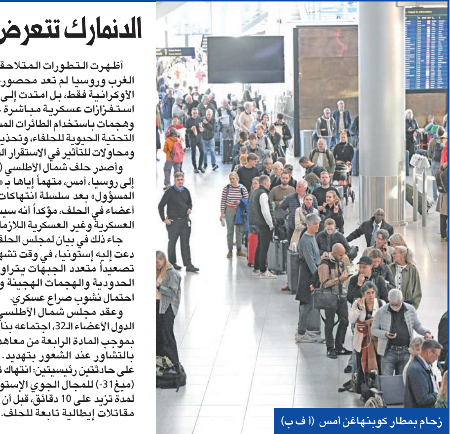
زحام بمطار كوبنهاغن أمس

وعقد مجلس شمال الأطلسي، المكون من سفراء الدول الأعضاء الـ32، اجتماعه بناءً على طلب إستونيا بموجب المادة الرابعة من معاهدة واشنطن الخاصة بالتشاور عند الشعور بتهديد. وجاء الاجتماع رداً على حادثتين رئيسيتين: انتهاك ثلاث مقاتلات روسية (ميغ-31) للمجال الجوي الإستوني يوم 19 سبتمبر لمدة تزيد على 10 دقائق، قبل أن تعترضها وتضربها مقاتلات إيطالية تابعة للحلف. كما ناقش المجلس