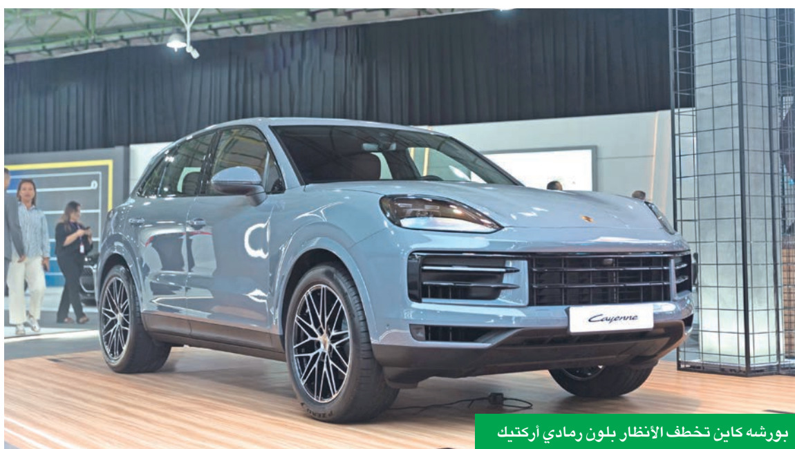
بورشه كاين تخطف الأنظار بلون رمادي أركتيك