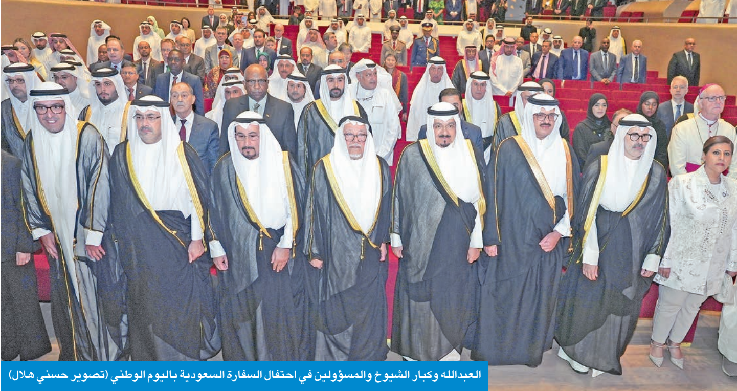
العبدالله وكبار الشيوخ والمسؤولين في احتفال السفارة السعودية باليوم الوطني