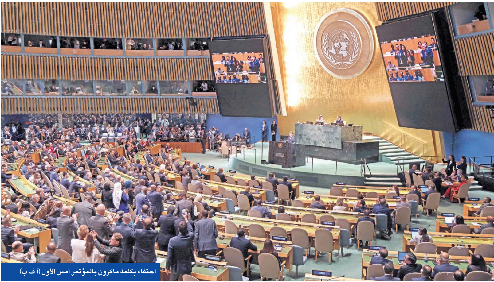
احتفاء بكلمة ماكرون بالمؤتمر امس الاول

مؤتمر حل الدولتين بمشاركة ممثل الأمير ينتزع اعتراف 160 عضواً في الأمم المتحدة بالدولة الفلسطينية ● الكويت والسعودية للمجتمع الدولي: حل الدولتين السبيل الوحيد لتحقيق السلام الدائم في المنطقة