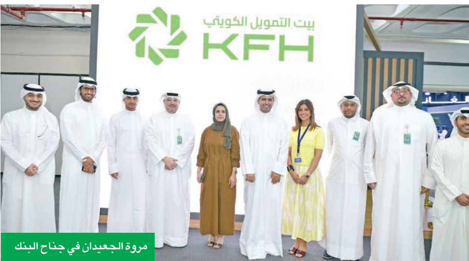
مروة الجعديان في جناح البنك

يشارك بيت التمويل الكويتي في معرض Auto World Show كمشريك استراتيجي، من 22 حتى 27 الجاري، بارض المعارض في مشرف، انطلاقاً من حرصه على تقديم أفضل الحلول والمزايا التمويلية المتنوعة لعملائه، والمشاركة في هذه الأحداث والفعاليات الاقتصادية المختلفة. وشهد حفل الافتتاح حضور وكيلة وزارة التجارة والصناعة بالتكليف مروة الجعديان.