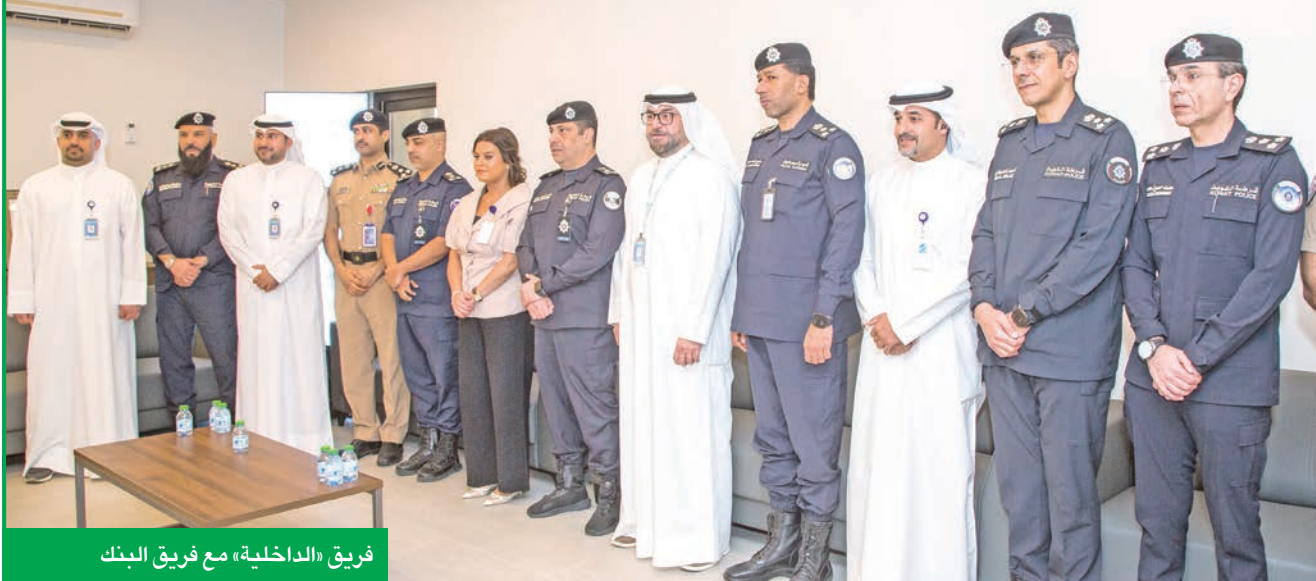
فريق «الداخلية» مع فريق البنك

وبهذه المناسبة، قال العميد أنور أحمد اليتامي، رئيس قطاع الموارد البشرية وتقنية المعلومات بـ «الداخلية»: «انطلاقاً من رؤية سمو أمير البلاد الشيخ مشعل الأحمد، وبتوجيهات النائب الأول لرئيس مجلس الوزراء وزير الداخلية الشيخ فهد الجوسف، وبدعم وكيل الوزارة بالتكليف اللواء علي مسفر العدواني، لنقل الكويت إلى حال أفضل عبر تعزيز مسيرة التحول الرقمي، فإننا نهدف إلى تمكين الكفاءات وتطوير قدراتهم الرقمية، بما يضمن تحويل الوزارة إلى