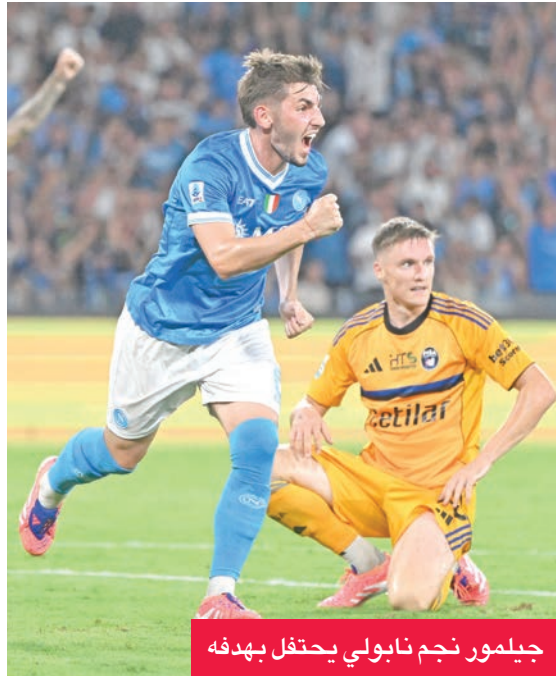
جيلمور نجم نابولي يحتفل بهدفه

انفرد نابولي بصدارة «السيري أ»، بعد أن حقق فوزاً بشق الأنفس على ضيفه الصاعد حديثاً، بيزا، بنتيجة 2-3، في اللقاء الذي احتضنه ملعب ديبغو أرماندو مارادونا، الاثنين، في ختام الجولة الرابعة بدوري الدرجة الأولى الإيطالي لكرة القدم.