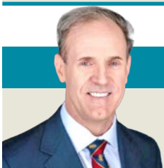
سامويل غريغ *

الحديث عن الأنساب والقبائل العربية ممتد من ابن السائب الكلبي إلى اليوم، وهو من أشهر المؤرخين الذين وثقوا تاريخ القبائل. كذلك الكتاب الأكثر شهرة معجم أعلام القبائل العربية بالأندلس، وكتاب جمهرة أنساب العرب لابن حزم، وكتاب الأنساب للحمداني، وموسوعة القبائل العربية، وهذا بحر طويل من الأبحاث لا ينهي، وإي إضافة في هذا المضمار تعتبر رسيداً جديداً يضاف إلى المكتبة العربية عموماً.