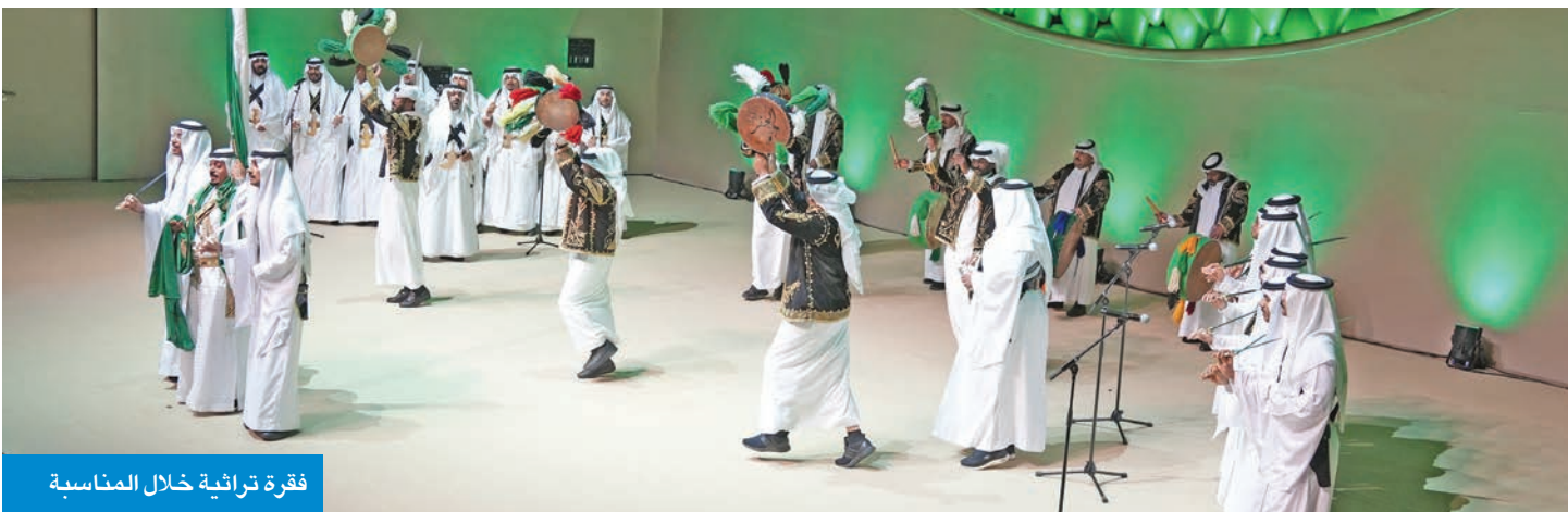
فقرة تراثية خلال المناسبة

المناسبة فرصة لاستذكـار الدور الكبير والدعم المتواصل الذي تقدمه المملكة للشعب الفلسطيني وقضيته العادلة سفير فلسطين