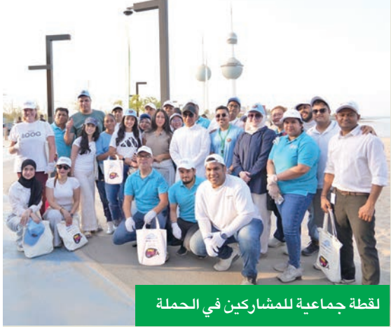
لقطة جماعية للمشاركين في الحملة

كما عززت هذه المشاركة ثقافة المسؤولية الاجتماعية داخل الشركة وخارجها، ونامل أن تكون حافزاً للجميع لمواصلة الجهود في حماية البيئة. وقالت الممثلة الرسمية لدولة الكويت في الحملة، المديرية التنفيذية لمشروع «كفو»، د. فاطمة الموسوي: «نفتخر بتضافر الجهود وعدد الجهات والمتطوعين المشاركين معنا، وننتقل لمشاركات أكثر في المستقبل لنشر ثقافة التطوع وخدمة التزامنا تجاه حماية بيئتنا».