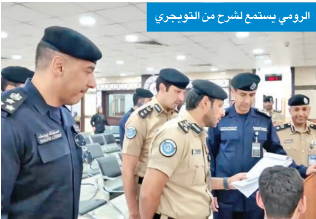
الرومي يستمع لشرح من التوجيهي

العمل وتسهيل إجراءات المراجعين، مشيراً إلى أن هناك إجراءات مشددة تُطبق على الكفيل والزائر في حال وجود أي مخالفة للقوانين واللوائح. وفي ختام الجولة، دعا الرومي جميع الموظفين إلى الالتزام بروح الفريق الواحد، والعمل على تقديم أفضل الخدمات، مؤكداً أن نجاح قطاع الإقامة والجنسية يرتكز على تكاتف الجهود، وتطبيق أعلى معايير الجودة والشفافية في إنجاز المعاملات.