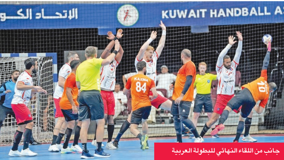
جانب من اللقاء النهائي للبطولة العربية

نادي الكويت تقدم بطلب لاستضافة بطولتي الخليج للأندية والآسيوية لأبطال الدوري