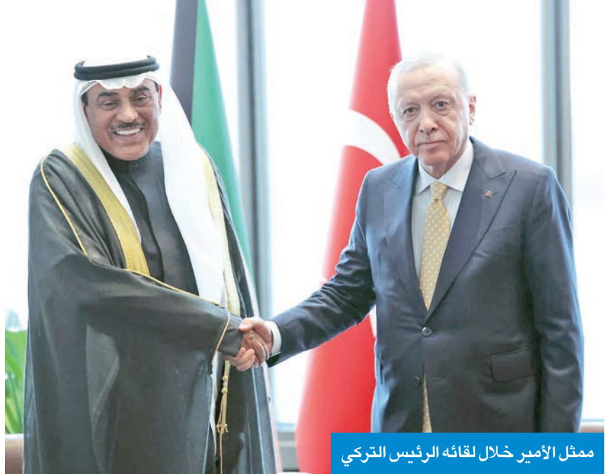
ممثّل الأمير خلال لقائه الرئيس التركي