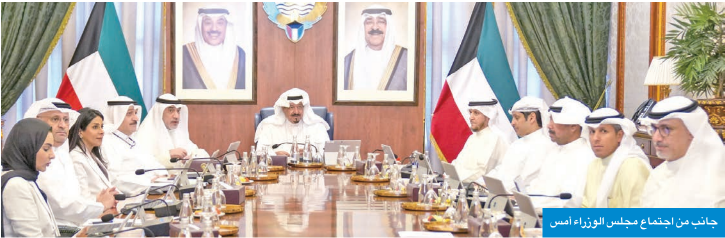
جانب من اجتماع مجلس الوزراء أمس

أكد مجلس الوزراء قوة ومنانة الاقتصاد الكويتي وملاءته بما يساهم في جذب الاستثمارات الأجنبية ويؤكد نجاح سياسة الدولة الرامية إلى الانفتاح الاقتصادي ودعم التوجه نحو جعل الكويت مركزاً مالياً وتجارياً جاذباً مع توفير فرص عمل مستدامة للأجيال القادمة. جاء ذلك خلال اجتماع المجلس أمس في قصر بيان برئاسة سمو الشيخ أحمد العبدالله رئيس مجلس الوزراء، وقد أعلن نائب رئيس مجلس الوزراء وزير الدولة لشؤون مجلس الوزراء شريدة المعوشرجي في ختام الاجتماع أن المجلس أعرب عن خالص تهانيه لخادم الحرمين الشريفين الملك سلمان بن عبدالعزيز آل سعود ملك المملكة العربية السعودية ولولي عهد المملكة رئيس مجلس الوزراء الأمير محمد بن سلمان وإلى الشعب السعودي بمناسبة الذكرى الـ 95 لليوم الوطني للمملكة، مغرباً عن تمنياته للسعودية بالمزيد من التقدم والازدهار في ظل قيادته الحكيمة وأن يدعم على المملكة الشقيقة نعمة الأمن والاستقرار والرفاه، مستذكراً مواقفها تجاه قضايا الأمن العربية والإسلامية، فضلاً عن مواقفها الأخوية الصادقة تجاه دولة الكويت، ومشيداً بما حققته المملكة في عهد خادم الحرمين الشريفين من إنجازات تنموية وحضارية بارزة في كل المجالات. من جانب آخر، أساط وزير الدفاع الشيخ عبدالله العلي مجلس الوزراء علماً برسالة رئيس منظمة الطيران المدني الدولي (ICAO) والتي أعرب خلالها عن إشادة المنظمة بالتقدم الذي أحرزته الهيئة العامة للطيران المدني في دولة الكويت في إرساء منظومة فعالة