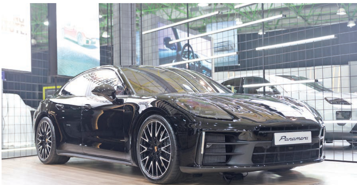
بورشه باناميرا تخطف الأنظار باللون الأسود

ونجسد النسخة الأحدث من 911 كاريرا جي تي إس قمة التوازن بين القوة والـدقة والـفخامة، مع استجابة ديناميكية أسرع وتجربة قيادة أكثر إثارة ورفاهية على الطريق. ومع عجلات كاريرا جي تي إس قياس 21/20 بوصة، ينطلق الطراز