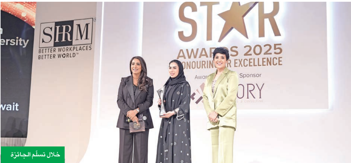
خلال تسلم الجائزة

وجمعية إدارة الموارد البشرية الأمريكية SHRM مؤسسة عالمية تعنى بإنشاء أماكن عمل أفضل، حيث يزدهر أصحاب العمل والموظفون معاً، كما تعد أول خبير ومنظم وقائد فكري في القضايا التي تؤثر على أماكن العمل المتطورة بمشاركة 325 ألف عضو في 165 دولة، وتؤثر على حياة أكثر من 235 مليون عامل وعائلة على مستوى العالم.