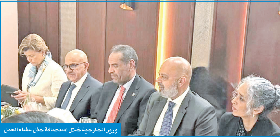
وزير الخارجية خلال استضافة حفل عشاء العمل

من جهة أخرى، استقبل ممثل سمو الأمير، رئيس مجلس الإدارة الرئيس التنفيذي لشركة غولدمان ساكس، ديفيد سولومون، ومالك والمؤسس المشارك لشركة بلومبيرغ، مايكل روبنزن، ورئيس مجلس الإدارة الرئيس التنفيذي لشركة بلاك روك، لاري فينك، في مقر وفد الكويت الدائم لدى الأمم المتحدة بمدينة نيويورك. ونقل سمو ولي العهد مستهل اللقاء تحيات صاحب السمو إلى الرئيس التركي. وجرى خلال اللقاء استعراض العلاقات الوطيدة بين الكويت وتركيا، وسبل دعمها وتعزيزها لما فيه مصلحة البلدين والشعبين الصديقين، بالإضافة إلى مناقشة أبرز المستجدات على الساحتين الإقليمية والدولية.