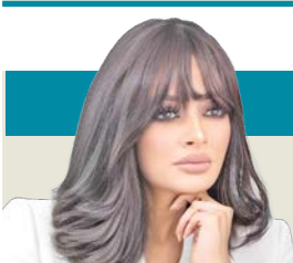
أميرة الحسن *