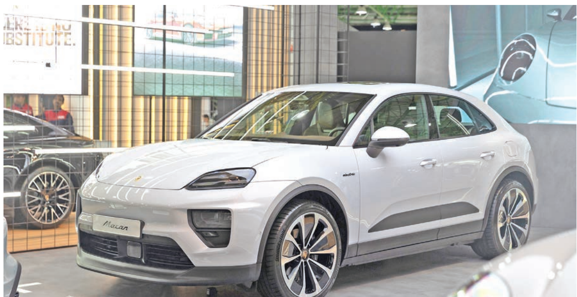
سيارة بورشه مكان الكهربائية بالكامل بلون رمادي ثلجي مبتاليك