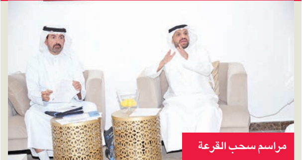
مراسم سحب القرعة