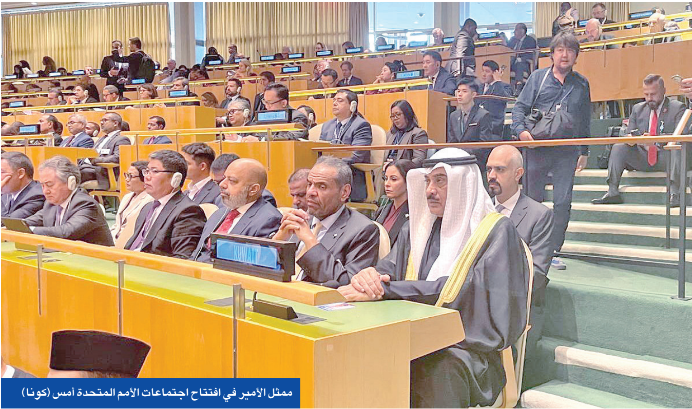
ممثل الأمير في افتتاح اجتماعات الأمم المتحدة أمس (كونا)

أردوغان: القيم الأوروبية تتآكل مع استمرار إبادة غزة... ونشكر الدول الخليجية لمساعدتها في استقرار سورية