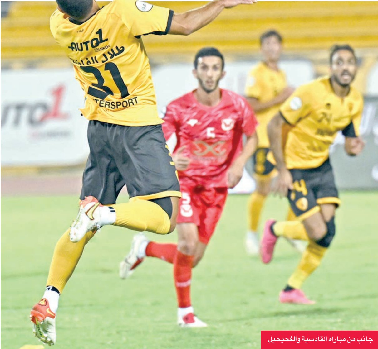
جانب من مباراة القادسية والفحيحيل

مفتاح الانتصار، خاصة بعد تجاوز المرحلة السابقة أمام الشباب. وأشار صولة إلى أن الفريق يسير برتم تصاعدي، متمنياً أن يواصل الأداء القوي في المواجهة المقبلة يوم الجمعة أمام نادي الكويت، التي وصفها بأنها أمام فريق كبير وتتطلب تركيزاً وروحاً رياضية عالية لتحقيق النقاط الثلاث.