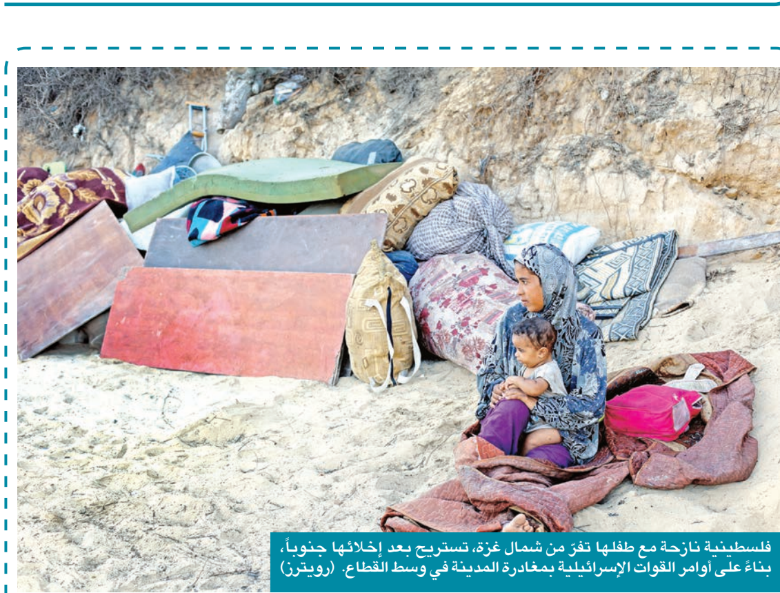
فلسطينية نازحة مع طفلها تفرّ من شمال غزة، تستريح بعد إخراجها جنوباً، بناءً على أوامر القوات الإسرائيلية بمغادرة المدينة في وسط القطاع. (رويترز)

على النحو الآتي: عرف أن سيدنا يوسف هو عزيز مصر وله وزنه حين اتخذ تلك القرارات، وعرف أنه نبي من الأنبياء كذلك، ومع هذا حافظ على الجانب الاجتماعي بكل عدالة بين الناس. امر العزيز باختيارن المؤنة وطبق هذا بشفاافية بين الناس، ولسبب أنه اتته رؤية إلهية تعطيه تلك النبوة. عرف