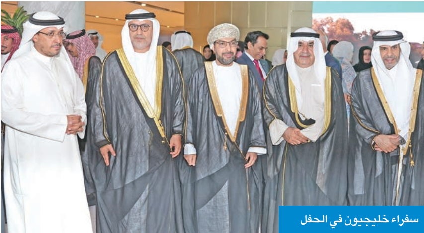
سفراء خليجيون في الحفل

فخر لنا جميعاً في دول مجلس التعاون الخليجي، ويعكس حكمة قيادتها الرشيدة ورؤية 2030 الطموحة التي تمثل قفزة نوعية نحو مستقبل مزدهر للمملكة والمنطقة اجمع. وأضاف: «وانني إذ اشارك أخي صاحب السمو الأمير سلطان بن سعد آل سعود سفير المملكة العربية السعودية لدى دولة الكويت وكافة أعضاء السفارة هذا اليوم الأغر، لأؤكد إن العلاقات الأخوية التاريخية التي تجمع مملكة البحرين والمملكة العربية السعودية تمثل نموذجاً متقدراً للوحدة والتلاحم، حيث وخذتنا روابط الدين والدم والمصير المشترك، ورسختها المواقف الصادقة بين البلدين في مختلف المحافل. ونؤكد بهذه المناسبة الغالية اعترازنا بهذه الروابط، وحرصنا الدائم على تعزيزها بما يخدم مصالح الشعبين الشقيقين وبحقق الأمن والازدهار للمنطقة بأسرها».