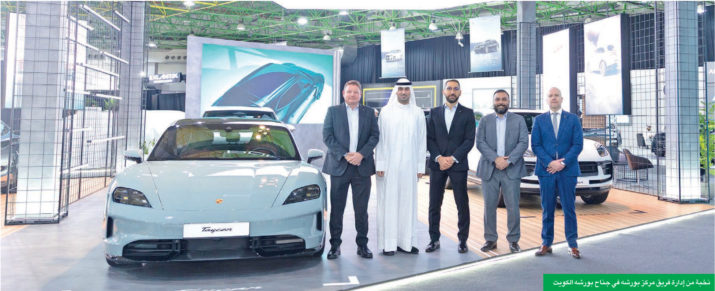
نخبة من إدارة فريق مركز بورشه في جناح بورشه الكويت