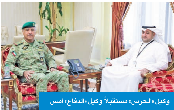
وكيل «الحرس» مستقبلاً وكيل «الدفاع» أمس

الالتحاق بالسلك العسكري. وأضاف أن قيادة الحرس البشري عسكرياً وعلمياً، لكونه الركيزة الأساسية في نجاح أي مؤسسة.