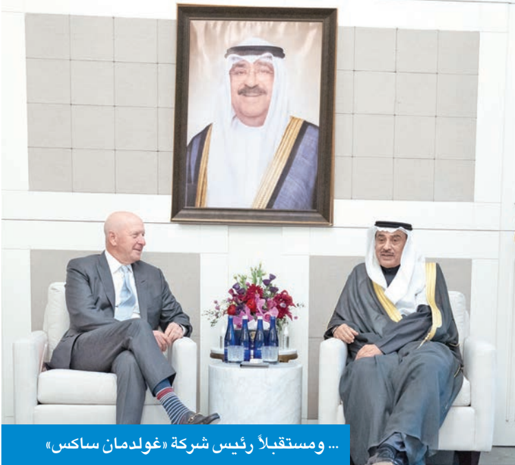
... ومستقبل رئيس شركة «غولدمان ساكس»