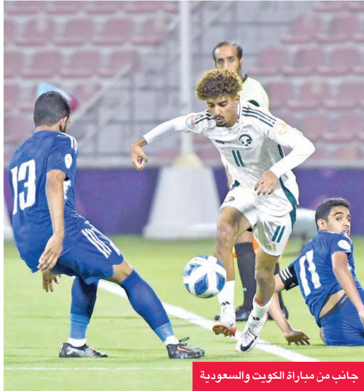
جانب من مباراة الكويت والسعودية