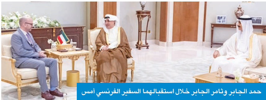
حمد الجابر وثامر الجابر خلال استقبالهما السفير الفرنسي أمس

استقبل وزير شؤون الديوان الأميري، الشيخ حمد الجابر، ورئيس ديوان سمو ولي العهد، الشيخ ثامر الجابر، بقصر بيان صباح أمس، سفير الأردن لدى الكويت سنان المجالي، حيث جرى خلال اللقاء استعراض العلاقات الأخوية التاريخية التي تربط الكويت والمملكة، وسبل تعزيزها في جميع المجالات. كما استقبل وزير الديوان ورئيس ديوان ولي العهد، السفير الفرنسي أوليفييه غوفان، وجرى خلال اللقاء بحث علاقات التعاون بين البلدين والشعبين الصديقين وسبل تنميتها في مختلف المجالات. ونقل حمد الجابر شكر الكويت على موقف