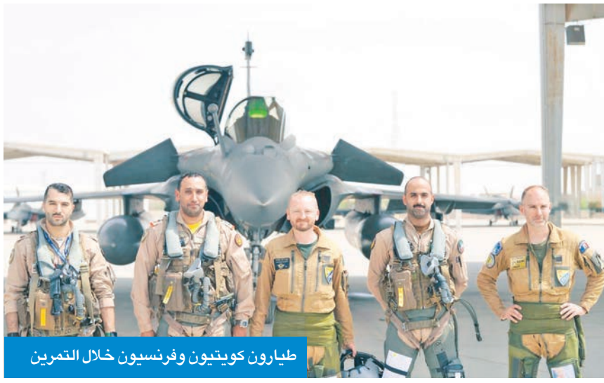
طيارون كويتيون وفرنسيون خلال التمرين