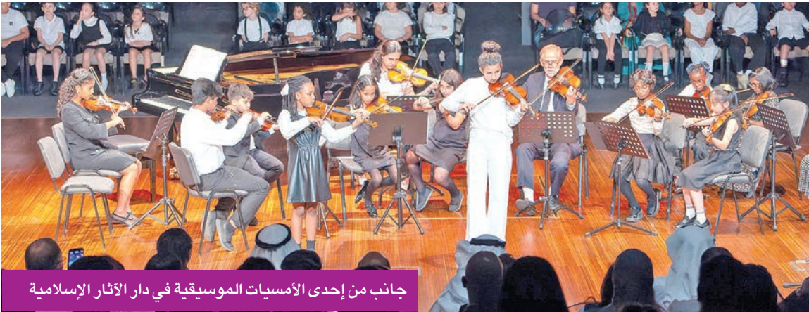
جانب من إحدى الأمسيات الموسيقية في دار الآثار الإسلامية