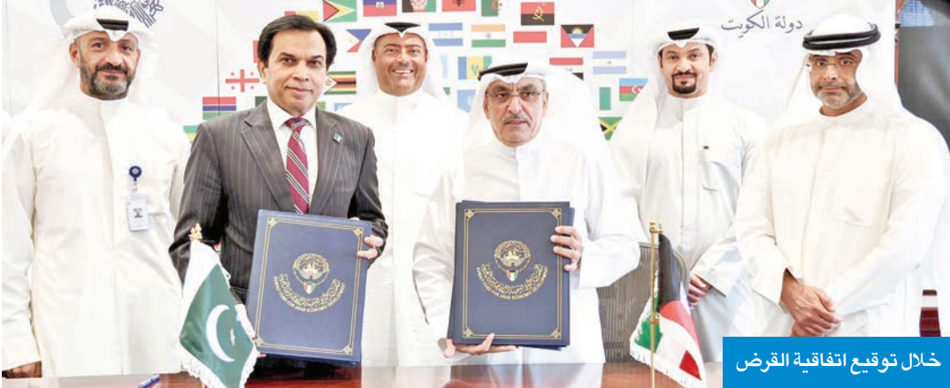
خلال توقيع اتفاقية القرض

ويهدف المشروع إلى دعم التنمية الاقتصادية والاجتماعية في باكستان عن طريق استخدام الموارد المائية المتاحة لتلبية الطلب المتزايد على الطاقة الكهربائية بتكلفة منخفضة، وسيساهم في حماية المناطق المأهولة بالسكان من مخاطر الفيضانات الموسمية في وادي «جهار سدا» ووادي «بشاور» الواقعين على ضفتي نهر سوات المغذي للمشروع وتوفير المياه للاستخدامات المختلفة وخاصة للري والشرب في إقليم خيبر باختونخوا، إضافة إلى خلق فرص عمل. ومن المتوقع أن يسهم المشروع في تحقيق أهداف التنمية المستدامة ومنها القضاء على الفقر والجوع وتأمين المياه النظيفة والنظافة الصحية، إضافة إلى الطاقة النظيفة وتوفير فرص العمل والصناعة والابتكار والهياكل الأساسية، فضلاً عن العامل المناخي