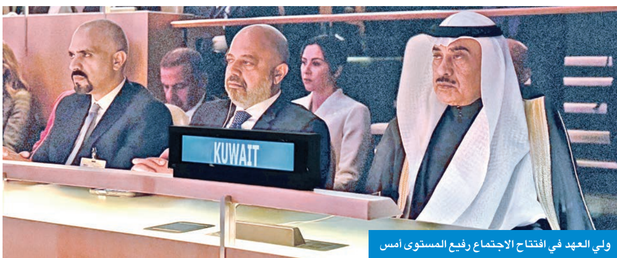
ولي العهد في افتتاح الاجتماع رفيع المستوى أمس

وشارك ممثّل صاحب السمو أمس في الاجتماع رفيع المستوى، الذي عقد أمس بمناسبة ذكرى مرور 80 عاماً على تأسيس الأمم المتحدة.