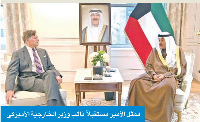
ممثّل الأمير مستقبلاً نائب وزير الخارجية الأمريكي