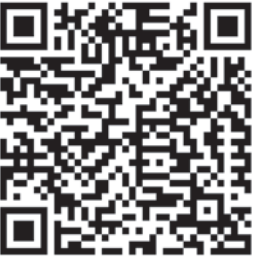
بيان إخلاء المسؤولية

تمثل تدفقات الأموال مؤشراً عملياً وسريع القراءة لسلوك المستثمرين، إذ تعكس القرارات الفعلية في السوق بعيداً عن التصريحات أو التوجهات المعلنة. وغالباً ما يشير توجه السيولة نحو الأسهم إلى نزعة تفاؤلية واتجاه صعودي، فيما يكشف انتقالها إلى السندات أو أدوات النقد عن بحث المستثمرين عن الأمان والتحوط. وتشير التدفقات المستمرة نحو قطاعات أو أدوات استثمارية معينة في الغالب إلى احتمال حصول موجات صعود في الأسعار، بينما تعكس التدفقات الخارجة المتواصلة ضغوطاً متزايدة أو تحديات تنظيمية تحد من أداء أسواق أو قطاعات محددة. ويعتمد المستثمرون المحترفون على تحليل حركة هذه التدفقات للكشف عن الاتجاهات الكامنة، وإدارة مخاطر السيولة خاصة خلال الفترات التي يتوقع أن تزداد فيها طلبات الاسترداد. في المقابل، يستعين بها صانعو السياسات لقياس متانة الاستقرار المالي، فيما توظفها الشركات كإداة استراتيجية لتحديد التوقيت الأمثل لعمليات جمع رؤوس الأموال عندما يكون إقبال المستثمرين في ذروته. كذلك يمكن الاستفادة من دراسة حركة تدفقات الأموال الاستثمارية في فهم سيكولوجيا المستثمرين، إذ تشير التدفقات الداخلة إلى الأسهم إلى نزعة تفاؤلية تتوقع أداء إيجابياً، بينما تعكس التدفقات إلى السندات توجهاً أكثر حذراً. كما يمكن أن تشكل هذه التدفقات مؤشرات رائدة (leading indicators) يمكن أن تساهم