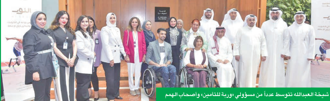
شبيخة العبدالله تتوسط عددًا من مسؤولي «وربة للتأمين» وأصحاب الهمم

سُيُقام المعرض برعاية الرئيسة الفخرية للنادي الكويتي الرياضي للمعاقين الشبيخة شبيخة الصباح، في لوبي فندق سيمفوني سنابل- السالمية، من 1 إلى 3 أكتوبر 2025، من صباحاً حتى 7 مساءً، وبمشاركة نخبة من الأفراد والمؤسسات. ويهدف المعرض إلى تمكين ذوي الاحتياجات الخاصة، وتعزيز اندماجهم في المجتمع، إلى جانب إبراز مواهبهم الفنية، وتشجيعهم على الإبداع، والمساهمة في مسيرة التنمية. كما سيوفر المعرض منصة مميزة للمشاركين من ذوي الاحتياجات الخاصة لعرض وبيع أعمالهم الفنية، بما يعزز ثقافتهم بأنفسهم، ويدعم استقلاليتهم. وسيشارك في تنظيم المعرض عدد من المتطوعين من مؤسسة الرعاية