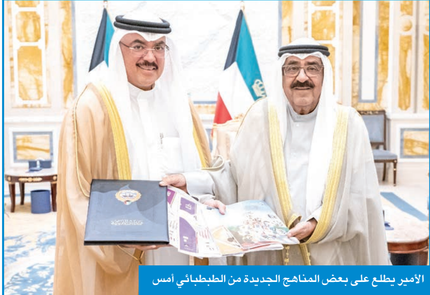
الأمير يطلع على بعض المناهج الجديدة من الطبباطي أمس

وأشاد سموه بجهود القائمين بـ «التربية»، مؤكداً سموه أهمية الاستعداد المبكر والاهتمام بكل متطلبات التنمية وإعداد أجيال مبدعة قادرة على المنافسة. وتمنى سموه لأبنائه الطلاب والطالبات كل التوفيق والنجاح.