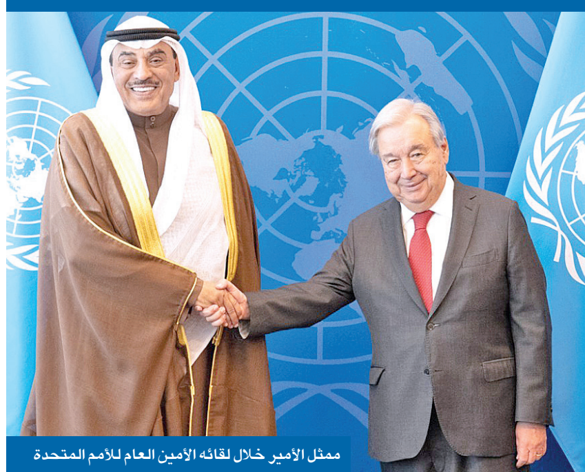
ممثل الأمير خلال لقائه الأمين العام للأمم المتحدة

وَبَشِّرِ الصَّابِرِينَ الَّذِينَ إِذَا أَصَابَتْهُمُ مُصِيبَةٌ قَالُوا إِنَّا لِلَّهِ وَإِنَّا إِلَيْهِ رَاغِبُونَ