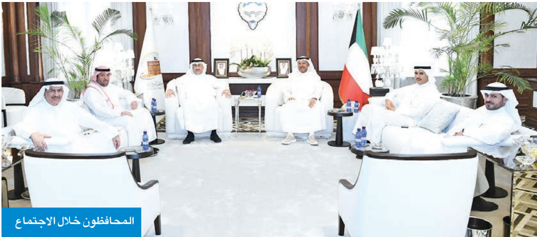
المحافظون خلال الاجتماع

تقديرهم وامتنانهم للقيادة السياسية والحكومة على الدعم الكامل في تعزيز دورهم بخدمة الكويت، مؤكداً أن التنسيق المستمر فيما بينهم الهدف منه توحيد الجهود