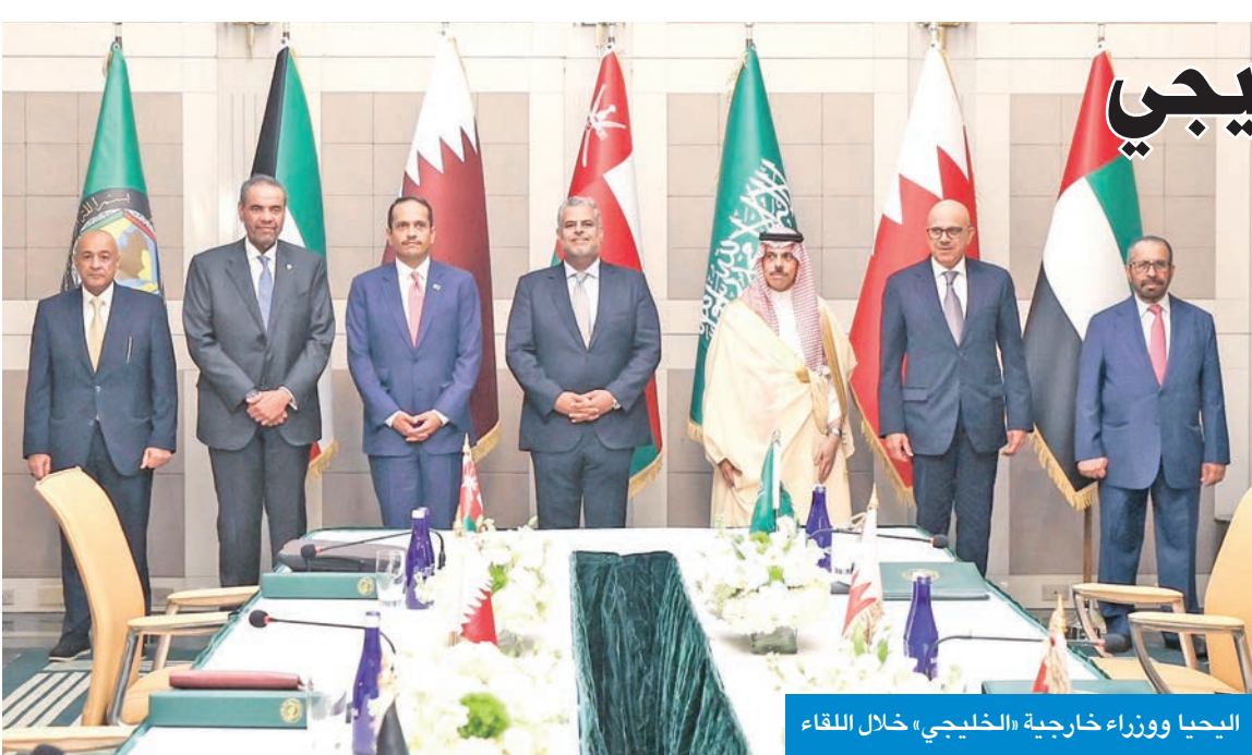
الحيا ووزراء خارجية «الخليجي» خلال اللقاء

التقى ممثّل صاحب السمو أمير البلاد الشيخ مشعل الأحمد، سمو ولي العهد الشيخ صباح الخالد، أمس، رئيس جمهورية تركمانستان سيردار بيردي محمدوف، ورئيس جمهورية لاتفيا إدغارز رينكفيلتش، ورئيس جمهورية بنما خوسيه راؤول مولينو، وذلك على هامش اجتماعات الدورة 80 للجمعية العامة للأمم المتحدة بمقر منظمة الأمم المتحدة في نيويورك. ونقل سمو ولي العهد في مستهل اللقاءات