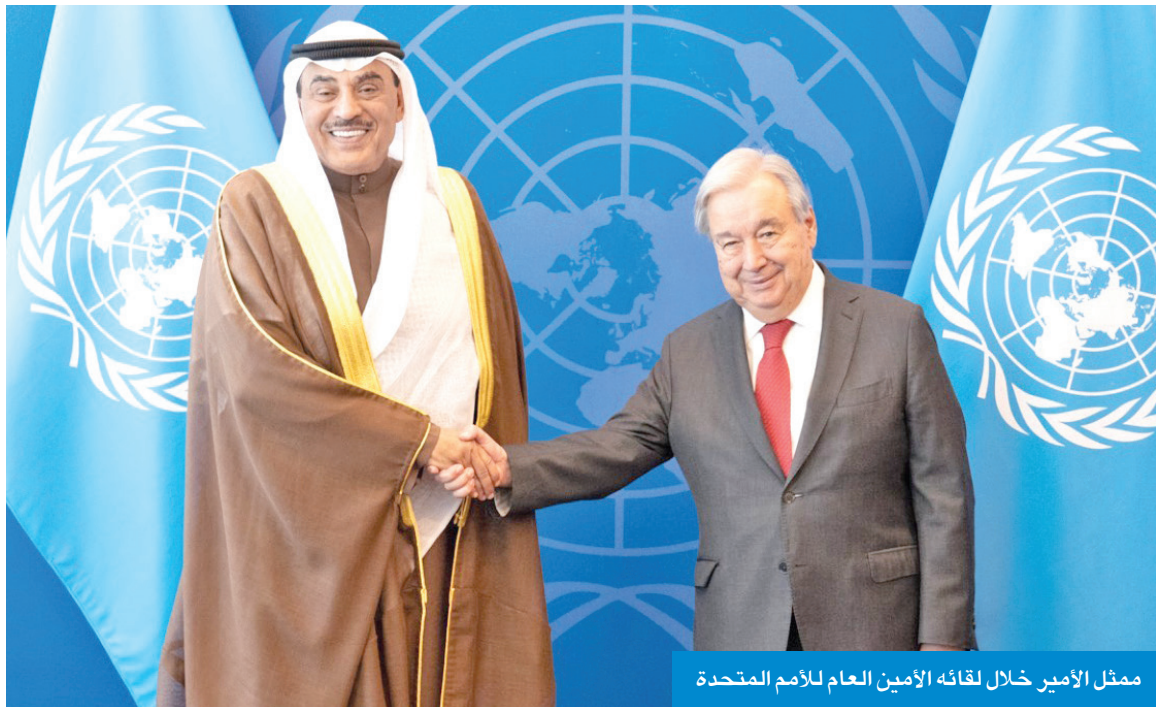
ممثّل الأمير خلال لقائه الأمين العام للأمم المتحدة

التي تُطرح بشكل مستمر في اجتماعات الجمعية العامة.