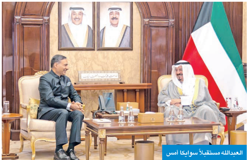
العبدالله مستقبلاً سوايكا أمس

استقبل رئيس مجلس الوزراء سمو الشيخ أحمد العبدالله، في قصر بيان أمس، سفير جمهورية الهند لدى الكويت د. أدارش سوايكا، بمناسبة انتهاء مهام عمله في البلاد. وتم خلال اللقاء بحث أوجه التنسيق والتعاون وتأكيد حرص الكويت على توسيع آفاق الشراكة مع الهند بما يخدم المصالح المشتركة للبلدين والشعبي البلدين الصديقين. حضر المقابلة رئيس ديوان رئيس مجلس الوزراء بالإتابة الشيخ خالد محمد الخالد.