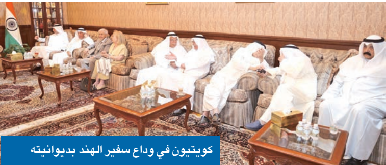
كويتيون في وداع سفير الهند بديوانيته

من قلبي خلال السنوات الثلاث الماضية التي قضيتها هنا". وقال إنه سينقل معه إلى كينيا فكرة "الديوانية الكويتية" التي أحبّها. وكان سوايكا، التقى في وقت سابق مساعد وزير الخارجية لشؤون آسيا السفير سامح جوهر حيات، معرباً له عن شكره