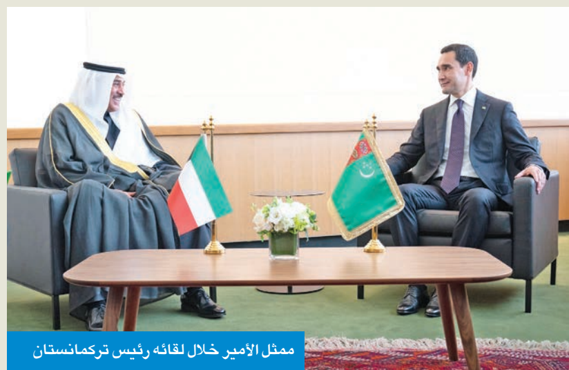
ممثّل الأمير خلال لقائه رئيس تركمانستان