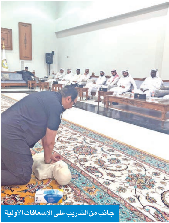
جانب من التدريب على الإسعافات الأولية

في إطار حرص محافظة الجهراء على تعزيز الوعي الصحي وبناء القدرات لدى موظفيها، نظمت المحافظة بالتعاون مع وزارة الصحة، ممثلة بإدارة الطوارئ الطبية، محاضرة توعية متخصصة في مجال الإسعافات الأولية. أقيمت المحاضرة في ديوان المحافظة، وهدفت إلى تزويد المشاركين بالمهارات والمعرفة الأساسية للتعامل مع الحالات الطارئة مثل الاختناق، والحروق، والنزيف، والإغماء، والكسور، إضافة إلى التدريب العملي على استخدام أدوات الإسعاف الأولية.