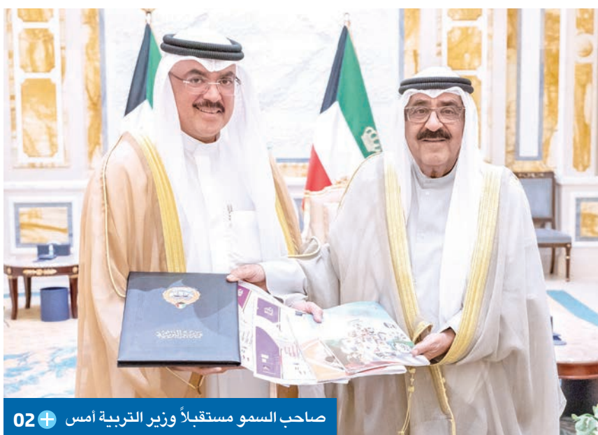
صاحب السمو مستقبلاً وزير التربية أمس 02+