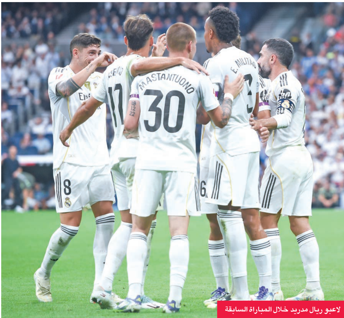
لاعبو ريال مدريد خلال المباراة السابقة

الإيقاع، بهدف لعب دور أكبر في سلسلة مباريات ريال مدريد الأربع خلال 12 يوماً. وواصل ترينت وروديجر وميندي عملية تعافيتهم مع متخصصي العلاج الطبيعي في صالة الألعاب الرياضية، فيما قام تشابي ألونسو بتحليل الحالة البدنية للاعبين، من أجل ضبط التعديلات على التشكيل الأساسي خلال زيارة ليفانتي. وفي باقي المباريات، يلعب اتلتيك بلباو مع جيرونا، وإسبانيول مع فالنسيا، وإشبيلية مع فياريال.