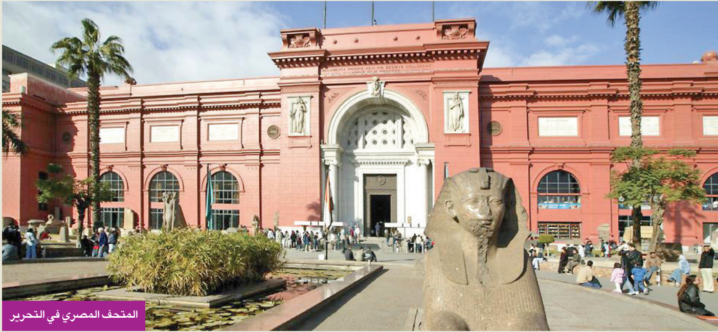
المتحف المصري في التحرير

الجانية اختصاصية ترميم باعت قطعة نادرة عمرها 3300 سنة بـ 3600 دولار