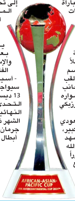
AFRICAN-ASIAN-PACIFIC CUP 2024

يحتضن ملعب الإنماء في مدينة جدة مساء اليوم الثلاثاء مواجهة مرتقبة تجمع الأهلي السعودي، بطل آسيا، مع بيراميدز المصري، بطل إفريقيا، في نهائي كأس إفريقيا - آسيا - المحيط الهادئ ضمن النسخة الثانية من كأس القارات، في أول لقاء رسمي بين الفريقين. ويخوض الأهلي المباراة متسلحاً بمعنويات عالية بعد تعادل مثير أمام الهلال في قمة السدوري المحلي، حيث قلب تأخره بثلاثية نظيفة إلى تعادل 3 - 3، مواصلاً بدايته القوية للموسم دون خسارة، وتحقيقاً لقب السوبر المحلي، إلى جانب فوزه في افتتاح مشواره القاري على ناساف الأوزبكي بنتيجة 4 - 2. ويعول الفريق السعودي على دعم جماهيره الكبير، خصوصاً بعد أن شهد ملعب مدينة الملك عبد الله الرياضية حضوراً تجاوز 60 ألف مشجع في نهائي دوري أبطال آسيا الموسم الماضي، الذي