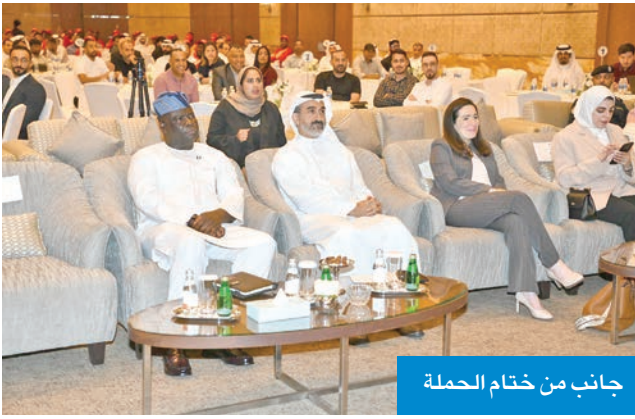
جانب من ختام الحملة

وأضاف أن «دعم السائقين بجوائز نوعية وتحفيزهم على الالتزام بإجراءات السلامة هو استثمار في العنصر البشري الذي نعتمد عليه يومياً، ويعكس شراكتنا الحقيقية مع المجتمع».