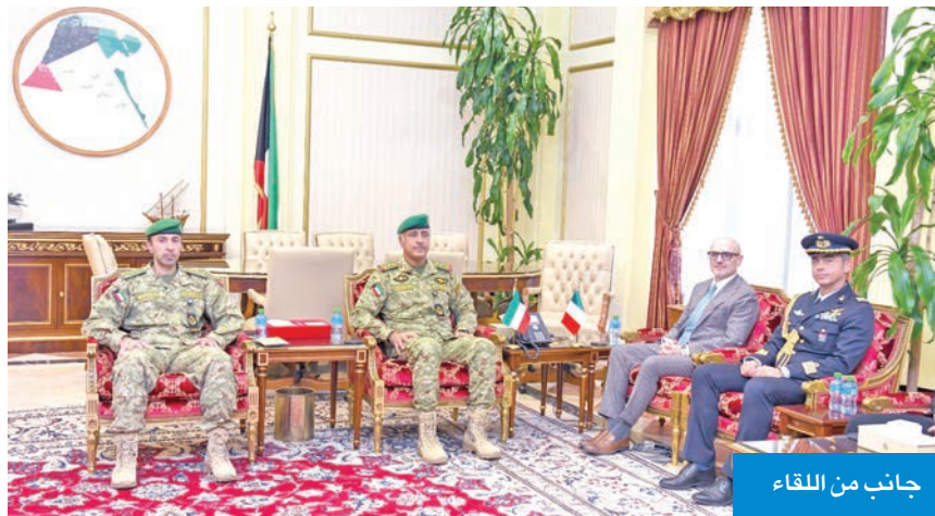
جانب من اللقاء

استقبل وكيل الحرس الوطني، الفريق الركن حمد البرجس، سفير إيطاليا لدى الكويت، لورينزو موريني، والملحق العسكري بالسفارة الإيطالية، العقيد ميكيلي ريفا. ورحب البرجس بالسفير، ونقل له تحيات قيادة الحرس الوطني ممثلة في رئيسه الشيخ مبارك الحمود، ونائبه الشيخ فيصل النواف، وتم خلال اللقاء بحث الموضوعات ذات الأهتمام المشترك.