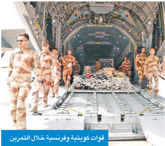
قوات كويتية وفرنسية خلال التمرين

بجولة اطلعوا خلالها على بعض جوانب التمرين ونتائجه، مؤكداً أهمية مواصلة مثل هذا التعاون في تعزيز الأمن والاستقرار المشترك.