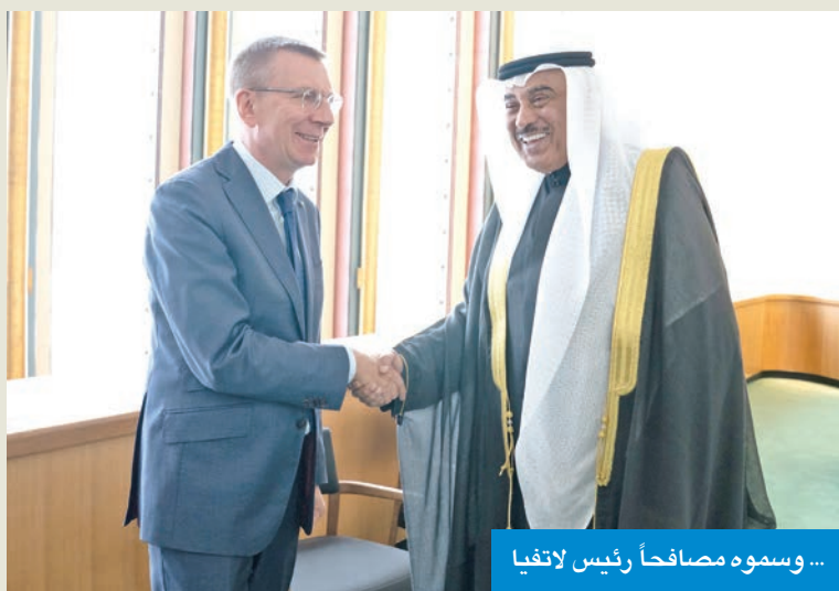
... وسموه مصافحاً رئيس لاتفيا