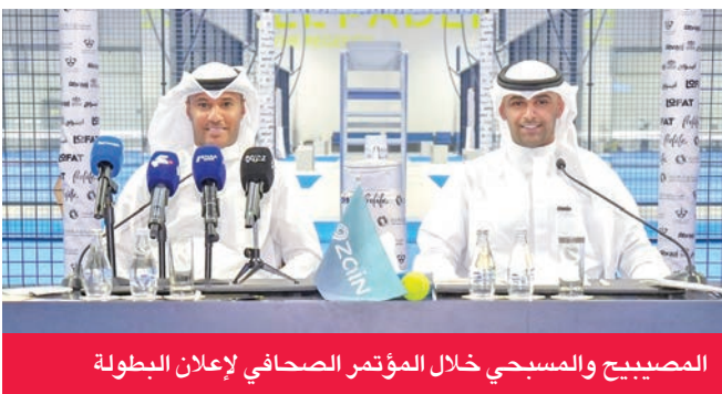
المصبيح والمسيحي خلال المؤتمر الصحافي لإعلان البطولة

تجمع أكثر من 250 لاعباً من الكويت والخليج