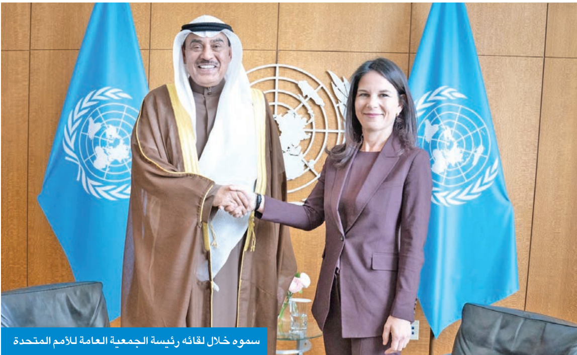
سموه خلال لقائه رئيسة الجمعية العامة للأمم المتحدة