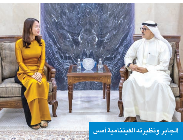
الجابر ونظيرته الفيتنامية أمس

استقبل نائب وزير الخارجية، السفير الشيخ جراح الجابر، أمس، نائبة وزير الخارجية في فيتنام، نغوين مينه هانغ، حيث تم بحث سبل توطيد العلاقات بين البلدين الصديقين في جميع المجالات، إضافة إلى المواضيع ذات الاهتمام المشترك.