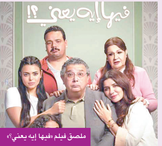
ملصق فيلم «فيها إيه يعني؟»