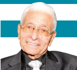
المستشار شفيق امام