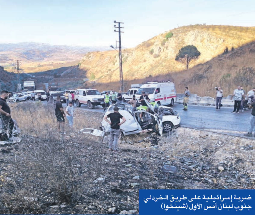
ضربة إسرائيلية على طريق الخردلي جنوب لبنان (أمس الأول)

ضغافه لناحية الشمال، لا سيما أن هناك تشديداً إسرائيلياً على ضرورة مداهمة عدد من المواقع والأنفاق، في مناطق حددها الإسرائيليون بالاسم في وادي السلوقي، وادي الحجير، وادي صريفا وغيرها. كما تفيد المعلومات بأن هناك مساعي لاستخدام فرق جديدة إلى «يونيفيل» مهمتها تحديد مواقع الأسلحة أو تتبع أثر الحركة لرصد أي مواقع أو عناصر لحزب الله ينشطون في الجنوب. الضغوط الإسرائيلية لا تتوقف عند هذا الحد، بل هناك ضغط عسكري يتواصل، بدءاً من التصريحات والتهديدات الإسرائيلية ضد حزب الله والجهة منعه من إعادة بناء قواه العسكرية، وصولاً إلى حد إجراء مناورات تحاكي اجتياحاً برياً للبنان وخوض معارك في مواقع تحت الأرض، إضافة إلى إرسال تعزيزات عسكرية جديدة باتجاه الحدود، وسط معلومات عن سعي إسرائيلي لتوسيع نطاق السيطرة على أكثر من 8 نقاط، ما يعني إقامة نقاط عسكرية جديدة داخل الأراضي اللبنانية.