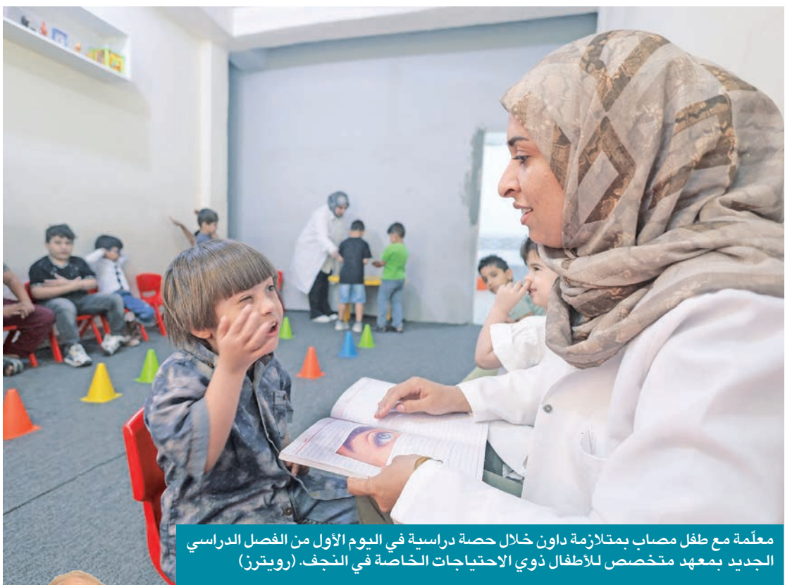
مُعلّمة مع طفل مصاب بمتلازمة داون خلال حصّة دراسية في اليوم الأول من الفصل الدراسي الجديد بمعهد متخصص للأطفال ذوي الاحتياجات الخاصة في النجف.

وإسرائيل لم تدخل بوأية المجتمع العالمي والدولي من بايه الأمامي من اعتراف الدول عامة، والأمم المتحدة خاصة، بدولة تتكون من حكومة وشعب وأرض، بل كانت نيت