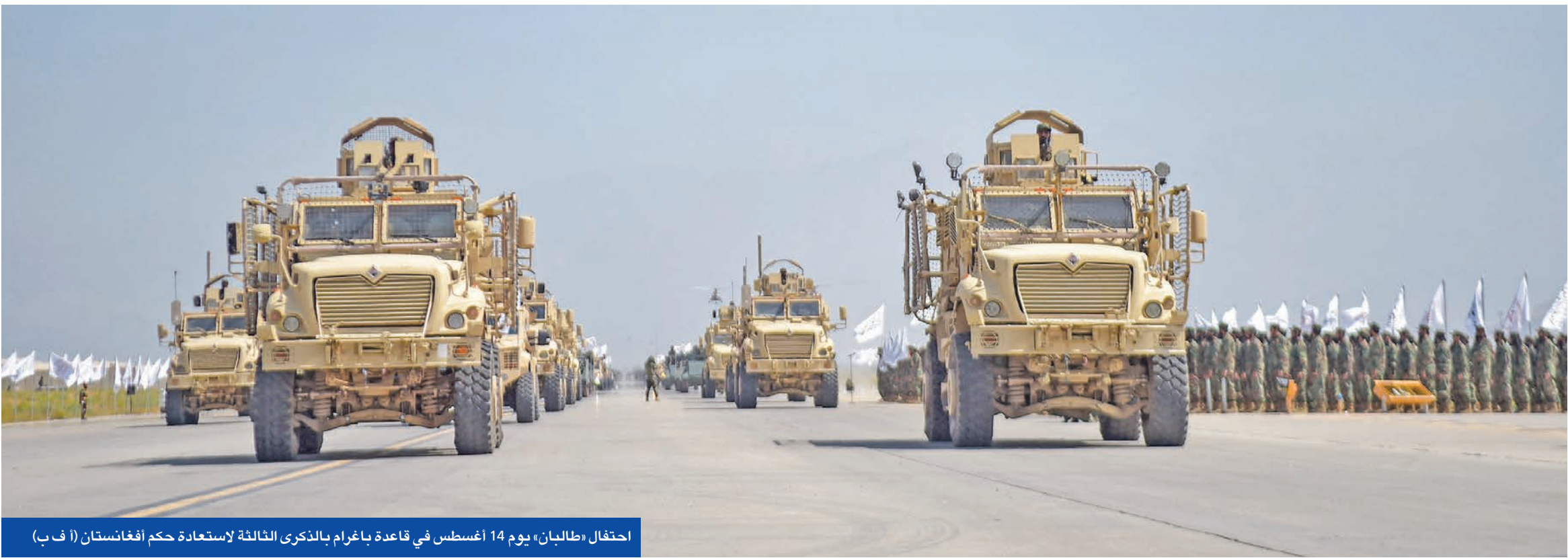
احتفال «طالبان» يوم 14 أغسطس في قاعدة باغرام بالذكرى الثالثة لاستعادة حكم أفغانستان

لاستعادة السيطرة على القاعدة التي استخدمتها القوات الأميركية عقب هجمات 11 سبتمبر 2001، وقال للصحافيين يوم الجمعة إنه يجري محادثات مع أفغانستان بهذا الشأن. لكن حركة طالبان ردّت سريعاً، معتبرة أن أي اتفاق بشأن القاعدة «مستحيل». وقال قائد الجيش الأفغاني فصيح الدين فطرت: «حتى شبر من أرض أفغانستان لن يُعاد. لسنا بحاجة إلى الأميركيين». وحذر خبراء من أن إعادة السيطرة الأميركية على القاعدة، التي كانت مركزاً رئيسياً للقوات الأميركية، قد يتطلب إرسال آلاف الجنود ونشر دفاعات جوية متطورة، مما يعني عملياً فتح صفحة جديدة من الحرب في أفغانستان. ووسط ترقب لقاء الرئيس السوري أحمد الشرع والرئيس الأمريكي، أعلن الرئيس التركي رجب طيب أردوغان أنه سيجت ملفات التجارة والصناعات الدفاعية مع ترامب، إضافة إلى قضية غزة. ويرى مراقبون أن لقاءات أردوغان قد تضيف مزيداً من التعقيد للمشهد الإقليمي، خصوصاً مع تقاطع الأزمات بين غزة وسورية والعلاقات الأميركية - التركية.