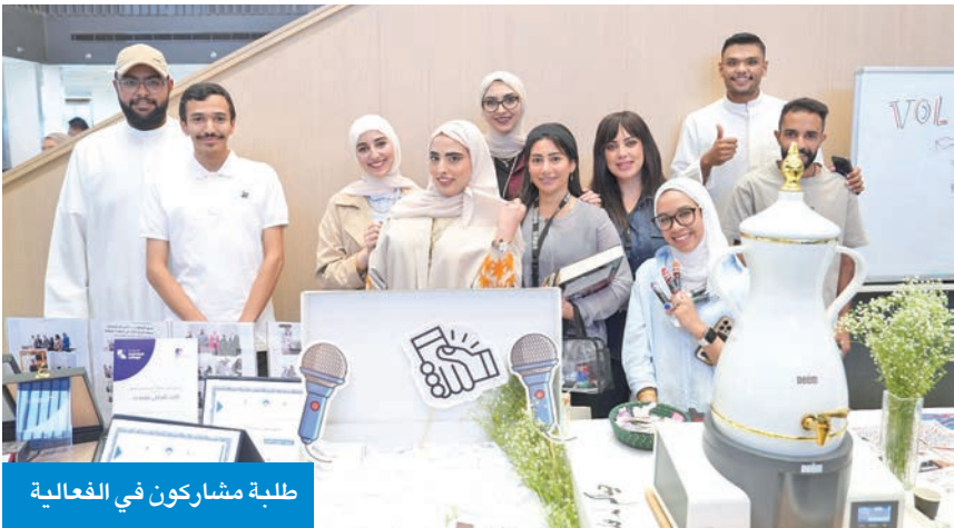
طلبة مشاركون في الفعالية

أصبحت جزءاً مهماً من الحياة الطلابية في AIU، حيث تشجع الطلاب على الانخراط في الأنشطة الجامعية، واكتشاف مجالات جديدة، وبناء علاقات قيمة خارج الفصول الدراسية، مؤكدة أن الجامعة تواصل التزامها بتوفير الفرص التي تدعم نمو الطلاب، وإبداعهم، وتعاونهم.