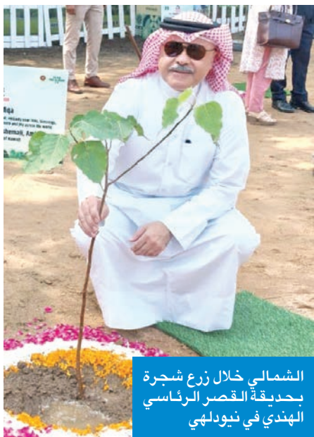
الشمالي خلال زرع شجرة بحديقة القصر الرئاسي الهندي في نيودلهي