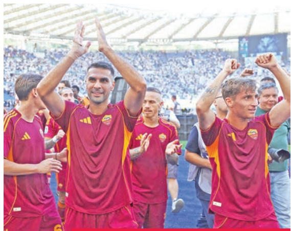
فرحة لاعبي روما بعد الفوز على لاتسيو

وحصد فريق المدرب المخضرم ماسيميليانو أليغري انتصاره الثالث تواليًا، ليرفع محصوله إلى 9 نقاط. بينما ذاق أودينيزي مرارة الخسارة الأولى هذا الموسم، ليتجدد رصيده عند 7 نقاط.