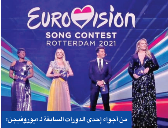
من أجواء إحدى الدورات السابقة لـ «يوروفيجن»

موسيقيين وفنانين، وخطط دورهم بسياسات الدول يبدو لي أمراً إشكالياً جداً». من جانبه، قرّر اتحاد البث الأوروبي، وهو الجهة المُشرفة على المسابقة في اجتماعه العام الأخير في بولني، إجراء «حوار داخلي» حول الموضوع. وقال مدير المسابقة مارتن غرين: «نحن نتفهم المخاوف والآراء المتعلقة بالصراع في الشرق الأوسط».