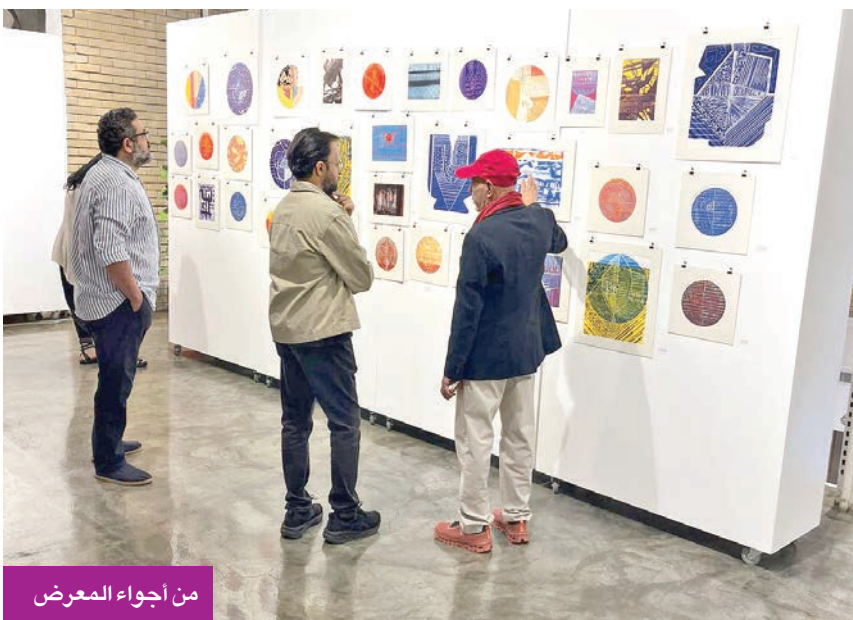
من أجواء المعرض