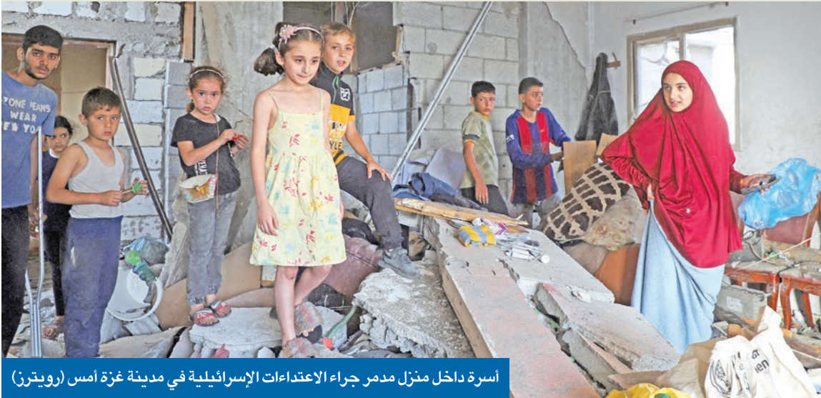
أسرة ءالء مئزل مءمى ءراء الاعءءاءات الإسرائىلىة فى مءىنة غزة أمس (روىءرن)

إبقاء إمكانيه السلام وءل الءولءىن ءىة»، مضافاً: «هءا يعنى وءوء إسرائىل أمانة إلى ءانب ءولة فلسطىنىة قابلة للءىاة، وفى الوقت الءالى، لىس لءىنا آئى منها». وبمواءة انءقاءاء ءاآلىة وضغوط ءارءىة من ءانب إسرائىل والولاءىاء المءءءة، ءافع رئىس الوزراء عن موقفه، معءبراً أن «هءا الءل لىس مكافاة لءماس، لأنه يعنى عءم إمكانيه وءوء مسءقبل لها، أو ءور فى الءكومة، أو ءءى فى الأمى». وقال إن «ءءوئنا لءل ءقضى قاءم على ءولءىن هى نقضى ءام لرؤىة ءماس البغىضة»، مؤكداً أنه ءىء إطلاق سراح الرهائىن المءءءزىن فى القاءع فوراً، ومواصله «النضال لإبقاءهم فى وطنهم». وفى أوءاوا، أعلن رئىس الوزراء الءنءى مارك كارنى، اعءراف بلاده بءولة فلسطىن، وعرض الشراكه فى بناء «مسءقبل سلمى وأعء لكل من فلسطىن وإسرائىل».