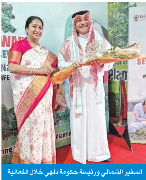
السفير الشمالي ورئيسة حكومة دلهي خلال الفعالية

شارك سفير الكويت لدى جمهورية الهند مشعل الشمالي، في فعالية احتفالية لغرس الأشجار بحضور رئيسة حكومة دلهي ريخا غوبتا، وكبار الوزراء في الحكومة، إلى جانب جمع من السفراء وأعضاء السلك الدبلوماسي من معظم الدول العربية والأجنبية، وذلك تلبية لدعوة موجهة إليه من وزير الصناعات والأغذية والإمدادات ووزير البيئة والغابات والحياة البرية في حكومة دلهي.