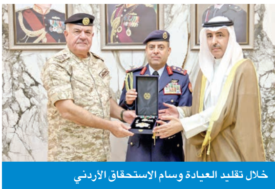
خلال تقليد العيادة وسام الاستحقاق الأردني

البلاد الشيخ مشعل الأحمد، وأخيه العاهل الأردني الملك عبد الله الثاني». وشدد على حرص السفارة الكويتية في الأردن والمكاتب الفنية الملحق بها على تعزيز عمق العلاقات الثنائية بين البلدين الشقيقين وتطويرها، والصعد والمستويات الرسمية والشعبية،