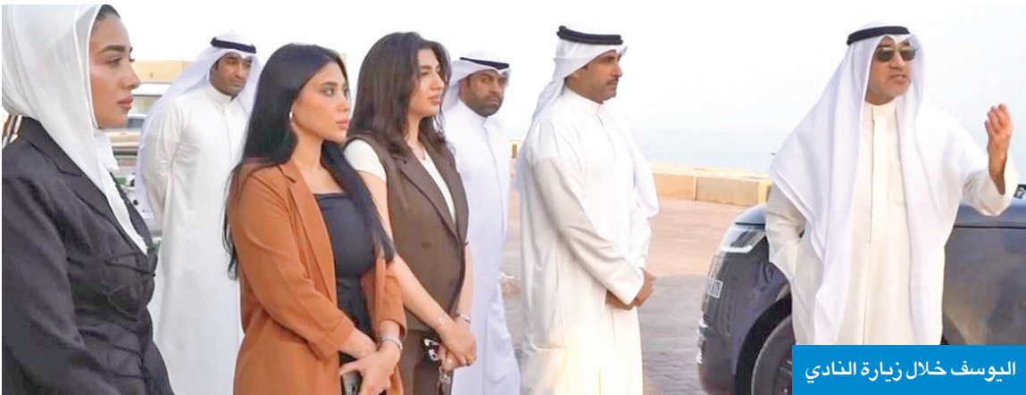
اليوسف خلال زيارة النادي