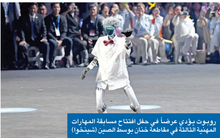
روبوت يؤدي عرضاً في حفل افتتاح مسابقة المهارات المهنية الثالثة في مقاطعة خنان بوسط الصين

بارتفاع 1.75 متر ووزن 32 كيلوغراماً، ومرتبداً قميصاً أزرق قصير الأكمام، استقبل الروبوت المجسد «شيويهيا 01» أخيراً كأول طالب دكتوراه روبوتي في أكاديمية شانغهاي للمسرح، حيث سيواصل دراسة تصميم الأداء الرقمي في قسم تصميم المسرح خلال السنوات الأربع القادمة. وقالت وكالة شينخوا أمس إن البرنامج الذي أطلق بالتعاون بين أكاديمية شانغهاي للمسرح وجامعة شانغهاي للعلوم والتكنولوجيا، يهدف إلى تطوير طرق تدريب تجريبية لجيل جديد من الوكلاء المجسدين، مع التركيز على التفاعل المتعدد الوسائط والتعبير الفني والنمو الإدراكي. وخلال البرنامج الذي يمتد أربع سنوات، سيتعلم «شيويهيا 01» بشكل منهجي الحركات الأساسية والروتين وتقنيات الأداء في الأوبرا الصينية التقليدية. ويتولى فريق جامعة شانغهاي للعلوم والتكنولوجيا تدريبه على الجوانب التقنية والمعرفة الأساسية، بينما يركز فريق