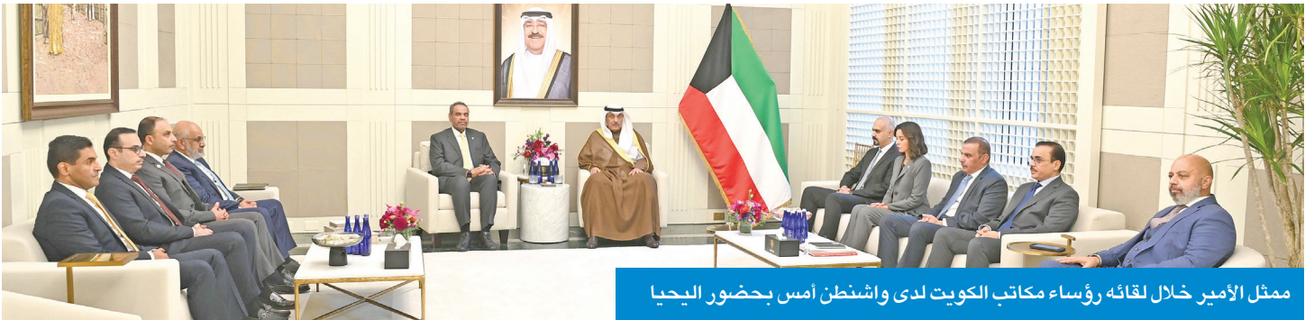
ممثل الأمير خلال لقائه رؤساء مكاتب الكويت لدى واشنطن أمس بحضور اليحيا