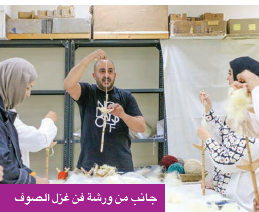
جانب من ورشة فن غزل الصوف