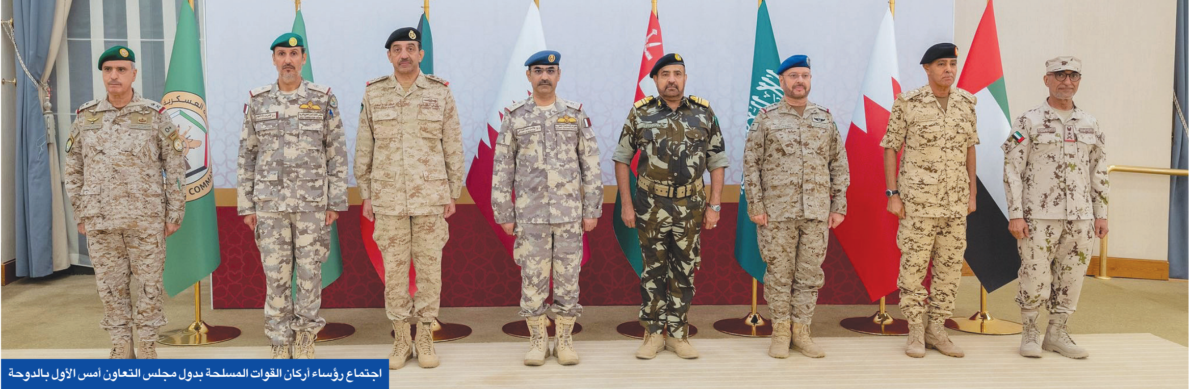
اجتماع رؤساء أركان القوات المسلحة بدول مجلس التعاون أمس الأول بالدوحة

على قطر»، الذي وصفه بـ«غير القانوني وبانتهاك جسيم للقانون الإنساني الدولي»، وأفاد المسؤول بأن قطر «ستواصل الانخراط مع الشركاء والمؤسسات الدولية لتعزيز احترام سيادة القانون، ومنع المزيد من الانتهاكات، والحفاظ على السلام والأمن في منطقتنا». في موازاة ذلك، كشف مسؤول في وزارة الحرب الأميركية أن المقاتلات الإسرائيلية أطلقت صواريخ بالستية فوق البحر الأحمر لاستهداف قادة حركة حماس في قطر الأسبوع الماضي، في هجوم غير مسبوق يرجح أنه صمم لتجاوز أنظمة الدفاع الجوي، وتفاذي دخول أجواء أي دولة شرق أوسطية. وقال مسؤول أميركي آخر إن الضربة كانت هجوماً «عبر الأفق» من خارج المجال الجوي القطري.