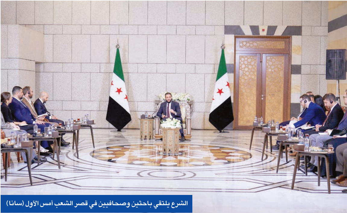
الشرع يلتقي باحثين وصحافيين في قصر الشعب أمس الأول