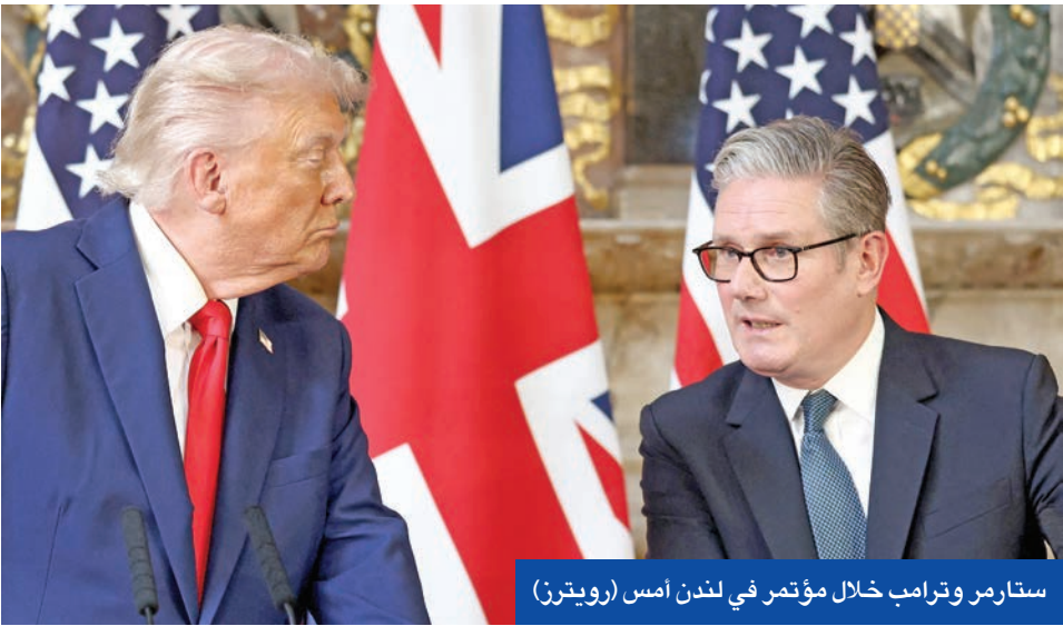
ستارمر وترامب خلال مؤتمر في لندن أمس

ورداً على سؤال بشأن نية بريطانيا الاعتراف بدولة فلسطينية الأسبوع المقبل وهو ما يعارضه ترامب، قال ستارمر: «ننقذ على الحاجة إلى السلام لأن الواقع في غزة لا يمكن تحمله، ويجب أن يتم إدخال المساعدات إلى القطاع»، مبيّناً أن الاعتراف «جزء من حزمة شاملة للسلام بين الإسرائيليين والفلسطينيين». وسبق المؤتمر توقيع ترامب وستارمر مذكرة «اتفاق الإنهاء الحرب في أوكرانيا»، التي تهدف إلى تعزيز التعاون بين واشنطن ولندن في مجالات التكنولوجيا والذكاء الاصطناعي والطاقة النووية المدنية.