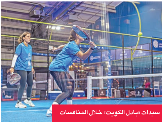
سيدات «بادل الكويت» خلال المنافسات

حقق منتخب الكويت للناشئين والسيدات الأربعة الفوز في ثالث أيام منافسات بطولة الخليج العربي للبادل (قطر 2025) في الدوحة والتي تستمر حتى 19 الجاري بمشاركة جميع دول مجلس التعاون لدول الخليج العربية.