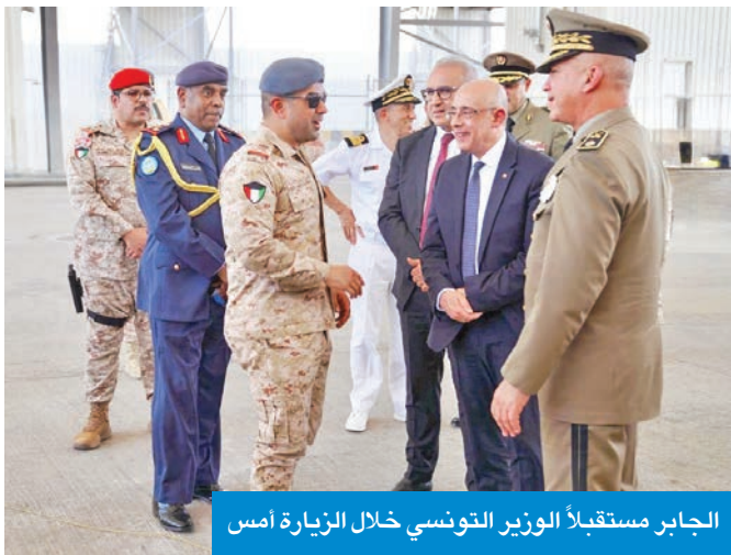
الجابر مستقبلاً الوزير التونسي خلال الزيارة أمس

زار وزير الدفاع التونسي، خالد السهيلي، مساء أمس، قاعدة عبدالله المبارك الجوية، وكان في استقباله نائب رئيس الأركان العامة للجيش، اللواء الركن الطيار صباح الجابر، وعدد من كبار ضباط القاعدة. ورحب نائب رئيس الأركان بالضيف والوفد المرافق له، مؤكداً أن هذه الزيارة تعكس عمق العلاقات الأخوية بين البلدين الشقيقين، وحرص الجانبين على تعزيز التعاون وتبادل الخبرات في مختلف المجالات العسكرية. وخلال الزيارة استمع الوزير إلى إيجاز تعريفي حول مهام ووحدات القاعدة، وأعقبها جولة للوزير على مرافق القاعدة، اطلع خلالها على مختلف مرافقها، وتعرف على إمكاناتها وما تضمه من تجهيزات ومشتات.