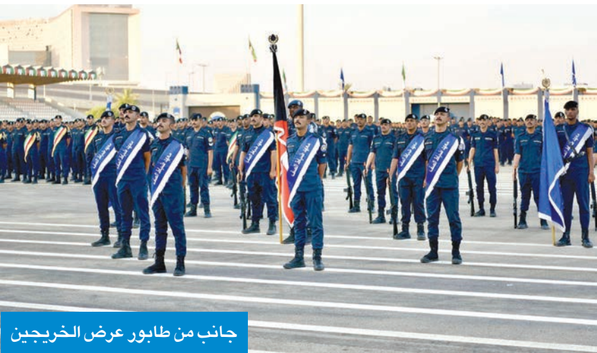
جانب من طابور عرض الخريجين