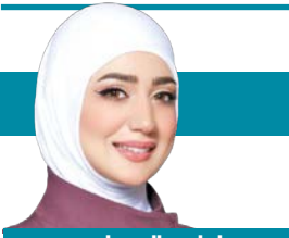
ليلع ال عباس

تمادي الظالم في ظلمه، وبغى في الأرض، وظن أن لا رادع له، ويراه مَنْ لا يخفى عليه ولا يُعجزه شيء في السماوات وفي الأرض، ووده النصر، وقوله الحق. دائماً ما أقول إن الوقت المُفضَّل عندي في الكويت هو شهر مارس، حين يحل الربيع، وتبهج الطيور، يعود الموسم الزراعي، ويُحصد الحنسل الكويتي، وأجد النور على جوانب الطريق. فقسى أن يتم النصر، ويُدخِر العدوان، وتحل السكنة على الأراضي المُحتلة. ذلك قادم لا محالة، سواء طال الزمن أم قُصر.