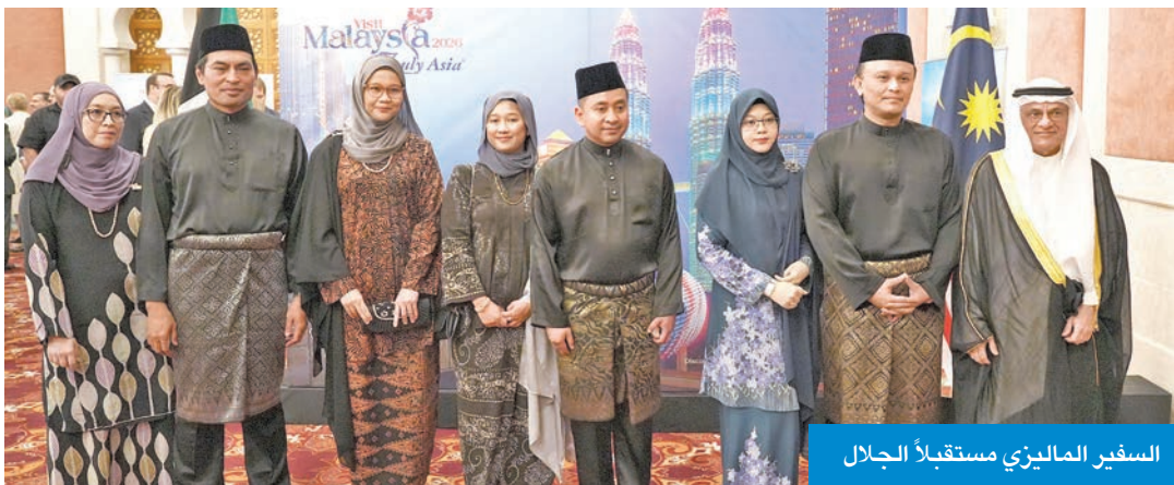
السفير الماليزي مستقبلاً الجلال

إضافة إلى معرض «أفضل ما في ماليزيا»، الذي سيتناول فرص التعليم، والصحة، والاستثمار العقاري، وبرنامج «ماليزيا بيتي الثاني». وفي مجال الدفاع، أوضح السفير محمد خالد، قام بزيارة رسمية إلى الكويت في أكتوبر 2024، حيث تم الاتفاق على تسريع المفاوضات بشأن مذكرة تفاهم لتعزيز التعاون الدفاعي والتبادل العسكري بين البلدين.