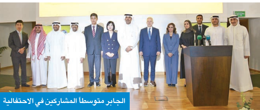
الجابر متوسطا المشاركين في الاحتفالية

مختلف الجهات الداعمة، متطلعاً إلى مزيد من التعاون بين القطاعات المختلفة لتطوير الخدمات وتحسينها بما يخدم المجتمع الكويتي. وتضمنت الاحتفالية استعراضاً لحلول قائمة على الذكاء الاصطناعي، تهدف إلى إلهام الشباب، إلى جانب فتح آفاق جديدة للاستثمار وتعزيز الشراكات الاستراتيجية، وتأتي هذه الخطوة لتسريع دمج التقنيات المتقدمة بالسوق الكويتي للإسهام في رفع كفاءة القطاع اللوجستي، ودعم النمو المستدام وتعزيز مكانة البلاد نحو التحول الرقمي.