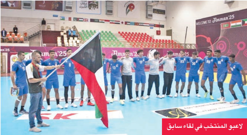
لاعبو المنتخب في لقاء سابق

الرئيسي السبت، بإقامة ثلاث مباريات، حيث يلتقي منتخب إيران مع الأردن عند الثالثة عصراً ضمن المجموعة الثانية، ويواجه منتخب كوريا الجنوبية نظيره الصين تايبيه الساعة الخامسة مساءً، فيما يلتقي منتخب السعودية مع البحرين في التاسعة مساءً بالمجموعة الأولى.