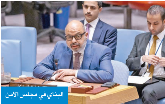
البناي في مجلس الأمن

الأمم المتحدة، فيما يتعلق بالملفات العالقة، وتسعى إلى تمكينه من تجاوز التحديات كافة، انطلاقاً من إيمانها الراسخ بأن نجاح العراق هو «نجاح للكويت والمنطقة بأسرها». وشدد البناي على أن الكويت أثبتت عبر التاريخ أنها لا تبحث عن المواجهة والتصعيد «بل عن العدالة والسلام»، وتعتبر أن الشفافية الدولية هي الضمانة الأكيدة لتحقيق نتائج عادلة ودائمة.