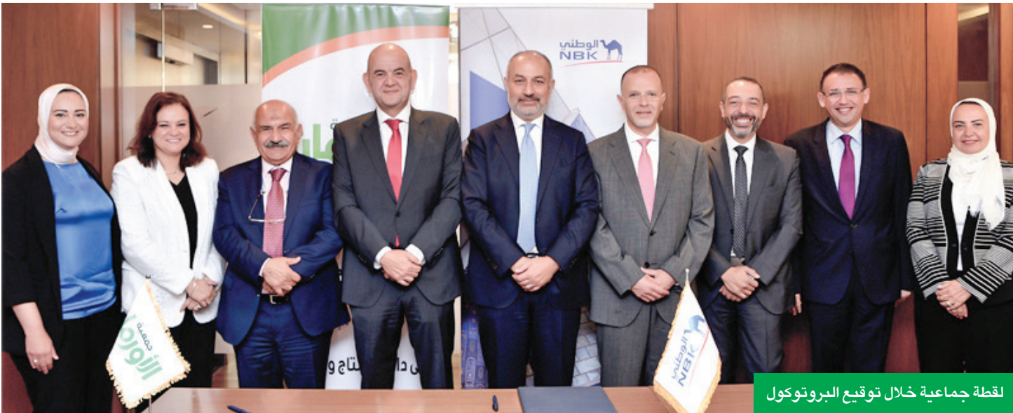
لقطة جماعية خلال توقيع البروتوكول

إلى نحو 59 مليون جنيه مصري بحلول عام 2029، ويتوقع أن توفر المحطة بجميع مراحلها ما يقرب من 40 بالمتة من احتياجات المستشفيات من الكهرباء، بما يسهم في خفض التكاليف، وتوفير بيئة صحية وآمنة للمرضى. يُذكر أن بنك الكويت الوطني يحرص باستمرار على دعم كل المشاريع والمبادرات الهادفة لتعزيز جهود الاستدامة في جميع الدول التي يعمل بها، كما قطع البنك شوطاً طويلاً في مجال الحوكمة البيئية والاجتماعية والمؤسسية، حتى أصبحت الاستدامة ركيزة أساسية في جميع نماذج أعماله وعملياته التشغيلية وثقافته المؤسسية، مما يعزز الانتقال إلى اقتصاد مستدام ومنخفض الكربون.