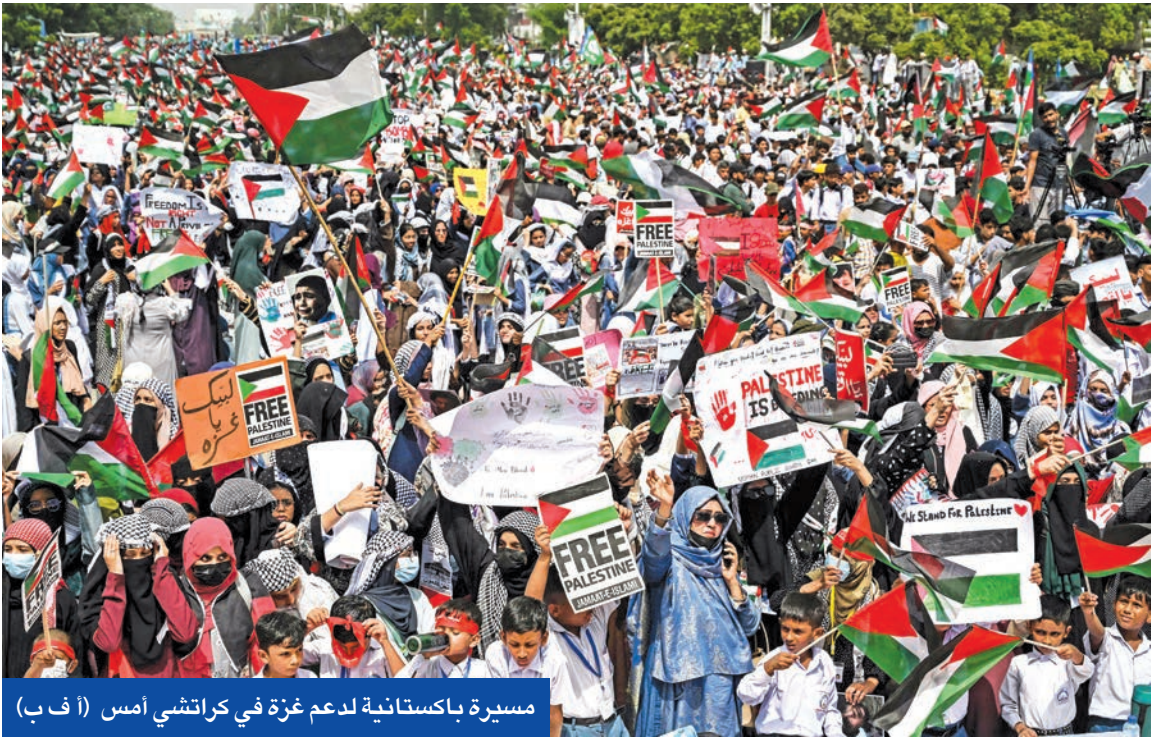
مسيرة باكستانية لدعم غزة في كراتشي أمس

وواصل الجيش الإسرائيلي تنفيذ عمليات نسف مبان سكنية بعدة طرق بينها المركبات المفخخة في المنطقة الشمالية لمدينة غزة وخصوصاً في حي الشيخ رضوان ومنطقة