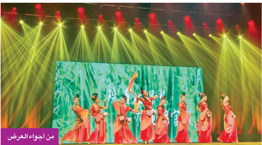
من أجواء العرض

بموازاة ذلك، افتتحت، أمس، المعارض الثقافية، تشنغدو أكثر من موطن البائدا العملاقة، ومعرض