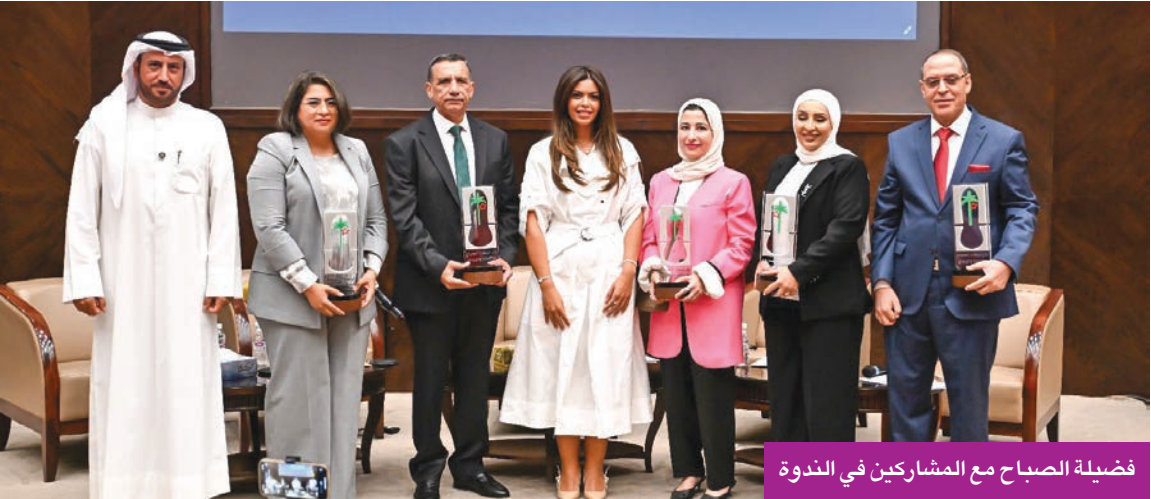
فضيلة الصباح مع المشاركين في الندوة