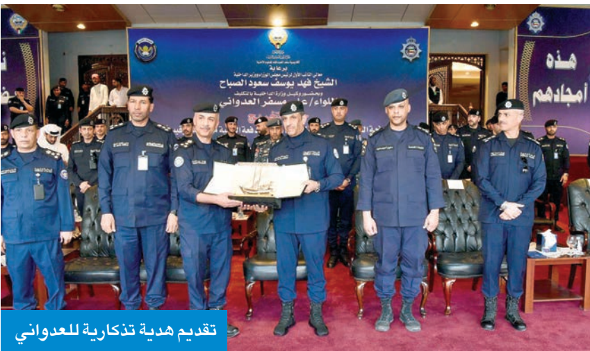
تقديم هدية تذكارية للعدواني

وتحيات النائب الأول لرئيس مجلس الوزراء وزير الداخلية إلى الخريجين، مشيداً بجهودهم وانضباطهم طوال فترة التدريب، متمنياً لهم التوفيق والسداد في مسيرتهم العملية القادمة، وأن يكونوا قدوة في أداء الواجب وخدمة الوطن بعزيمة وإخلاص. وبلغ عدد الخريجين 1599 خريجاً، أكملوا متطلبات التخرج وفق أحدث البرامج الأمنية والعلمية المعتمدة، ليكونوا إضافة نوعية تعزز من كفاءة العمل الشرطي، وتدعم مسيرة الأمن والاستقرار في البلاد. الخاص والمؤسسات الإصلاحية العميد دخيل الدخيل، ومدير عام أكاديمية سعد العبدالله للعلوم الأمنية العميد يوسف الحمدان، وعدد من القيادات الأمنية. ونقل اللواء العدواني تهاني