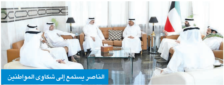
الناصر يستمع إلى شكاوى المواطنين

وحل المشاكل التي يعانيها الأهالي، مشيراً أن مثل هذه الزيارات تجسد قوة الروابط والتعاون بين المواطنين والمسؤولين في الكويت. وفي ختام اللقاء، تقدم الأهالي بالشكر للمحافظ على حفاوة الاستقبال وكرم الضيافة وسعة صدره للاستماع إلى هموم المواطنين ومتطلباتهم وحل مشاكلهم ورفع كفاءة الخدمات المقدمة لأهالي في جميع مناطق المحافظة.