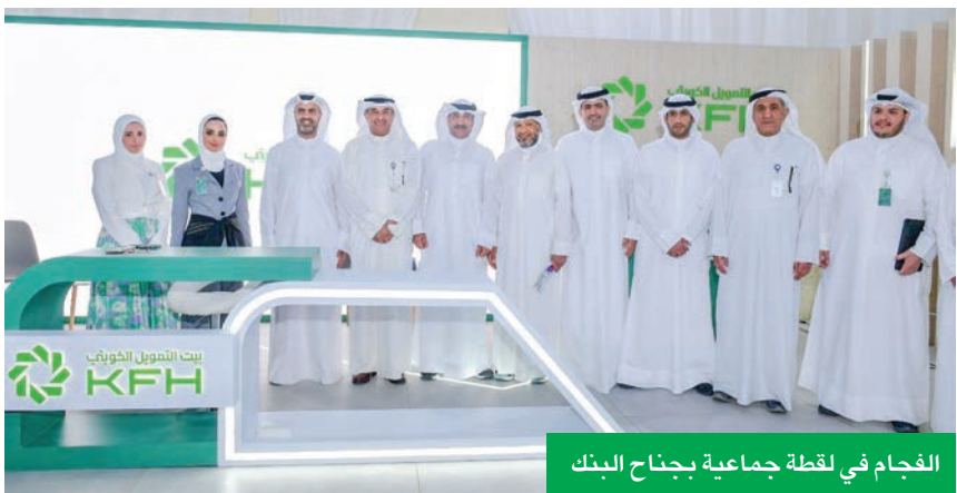
الفجاء في لقطة جماعية بجناح البنك

العمل والمحاضرات التي تسهم في تطوير الأداء العلمي والمهني للطلبة والخريجين.