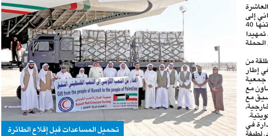
تحميل المساعدات قبل إقلاع الطائرة

الأردن محملة بالمواد الغذائية الأساسية العاجلة لإغاثة الأشقاء الفلسطينيين في القطاع. وأعربت عن الشكر للجمعيات والمبرات الخيرية الكويتية على مساهمتها الإنسانية، متمنة في الوقت ذاته تعاون جهات الدولة المعنية وجميعهالهال الأحمر المصري والهيئة الخيرية الأردنية