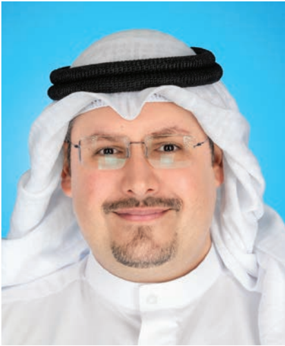
الشيخ حمود الصباح