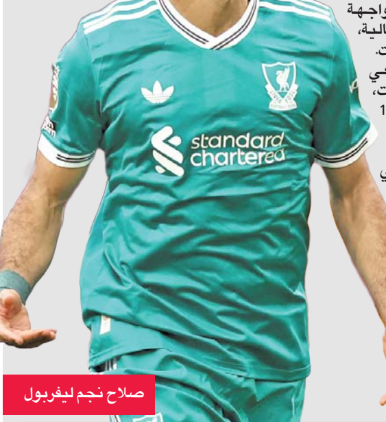
صلاح نجم ليفربول

أما أتلانتا، فخسارته أمام باريس في دور الثمانية لموسم 2019 - 2020 تبقى الوحيدة له في خمس مباريات أوروبية أمام الأندية الفرنسية. (د ب أ)