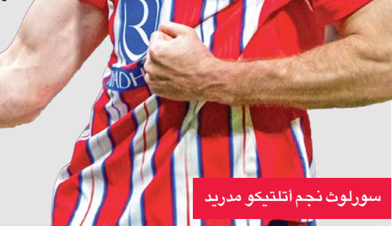
سورلوت نجم أتلتيكو مدريد

وحقق ليفربول 12 انتصاراً متتالياً في مباريات دوري الأبطال (مرحلة المجموعات/الدوري) قبل خسارته 2 - 3 أمام أيندهوفن في الجولة الثامنة من مرحلة الدوري لموسم 2024 / 2025، وحقق الفوز في 9 من مبارياته الـ14 الأخيرة في الجولة الافتتاحية وتعادل في ثلاث وخسر في مباراتين. وحقق أتلتيكو