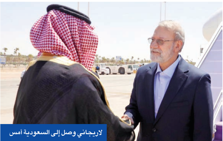
لاريجاني وصل إلى السعودية أمس

سلمان، حول ملفات متعددة وفي مقدمتها توسيع التعاون الاقتصادي إضافة إلى ملفات إقليمية أخرى. وذكر التلفزيون الإيراني أن ثالث زيارة إقليمية للاريجاني بعد بغداد وبيروت منذ توليه منصبه الشهر الماضي، تأتي بسبب دعم الأخيرة للسعوديين، وصف الرئيس التركي رجب طيب أردوغان، نتنهايو بأنه «قريب ايدبولوجيا» من الزعيم النازي أدولف هتلر، وتوقع أنه سيلقى مصيره.