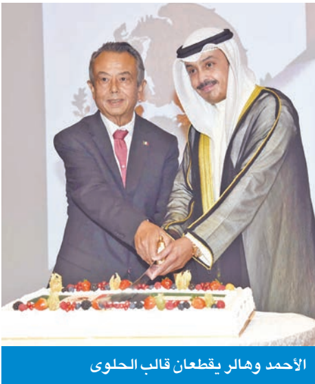
الأحمد وهالر يقطعان قالب الحلوى

المتجددة، والتعليم، والسياحة والابتكار، وهي مبادئ وأعدت تتشارك فيها الرؤى والطموحات. وزاد: «احتفالنا اليوم، هو تكريم مزدوج لذكرى استقلال المكسيك، ولـ 50 عاماً من الصداقة والشراكة مع الكويت، وهو أيضاً مناسبة نستحضر فيها الماضي، ونحتفي بالحاضر، ونستشرف المستقبل بثقة وتفاؤل». وفي ختام كلمته، توجّه سفير المكسيك بخالص الشكر والتقدير إلى القيادة السياسية، وحكومة وشعب الكويت الصديقة، على ما يقدمونه من دعم وصداقة صادقة للمكسيك، أملاً أن تتواصل مسيرة الازدهار والرفاهية لشعبينا الصديقين، وأن يسود السلام والتعاون جميع أنحاء العالم».