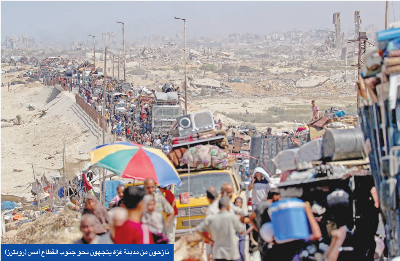
نازحون من مدينة غزة يتجهون نحو جنوب القطاع أمس

التصعيد الإسرائيلي، إذ اعتبرت وزيرة الخارجية البريطانية إيفيت كوبر أن العملية «متهورة ومروعة»، مؤكدة أن هناك حاجة ملحة إلى «وقف فوري لإطلاق النار، وإطلاق سراح جميع المحتجزين، والسماح بدخول المساعدات دون قيود، ووضع مسار نحو سلام دائم». وفي بروكسل، اعتبر الاتحاد الأوروبي أن توسيع عملية غزة سيسبب «المزيد من الدمار والموت والنزوح ويعرض حياة الرهائن للخطر»، فيما أعلنت محدثة باسم المفوضية الأوروبية، أن زعماء دول التكتل سيوافقون اليوم على فرض عقوبات اقتصادية جديدة على إسرائيل. وبينما تواصل تصاعد التوتر الدبلوماسي بين تل أبيب ومدير، بسبب دعم الأخيرة للفلسطينيين، وصف الرئيس التركي رجب طيب أردوغان، نتنهايو بأنه «قريب ايدبولوجيا» من الزعيم النازي أدولف هتلر، وتوقع أنه سيلقى مصيره.