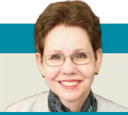
بولا مارانترز كوهين *

سابقاً، كان السادة الليبراليون يُتاجرون بالرققيق أنفسهم، أما الحاضر، فقد اعتقوهم، ليشغلوا منهم «الأسواق الناشئة»، كما يُطلقون عليها. وبالحقيقة، لم تتحوّل هذه الأسواق إلا إلى «أسواق نخاسة»، وبدلاً من أن يُباع ويُشترى فيها فرد أو قطع من البشر، غدت القوى النيوليبرالية العُظمى تتبع لبعضها البعض شعوباً برُمّتْها، بارضها، وأسواقها، ومواردها الطبيعية، والمساومة فيما بينها على تبادل المصالح التجارية، والاستثمار باقتصاديات الدول المنهوبة، مع كبّ خريات شعوبها. هذه هي خلاصة النيوليبرالية التي يدعو إلى اعتناقها المتفذلكون من العرب.