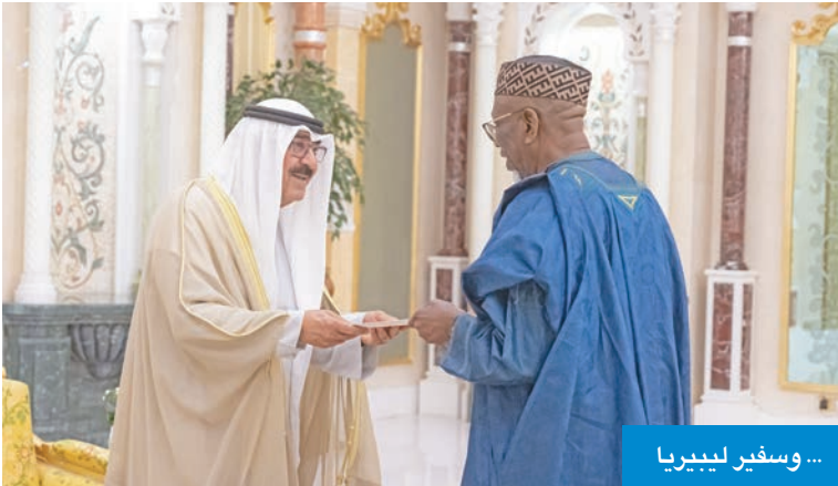
... وسفير ليبيريا