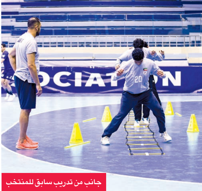
جانب من تدريب سابق للمنتخب