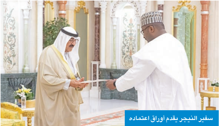
سفير النيجر يقدم أوراق اعتماده