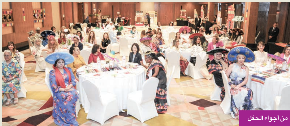
من أجواء الحفل