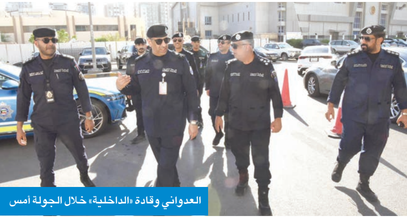
العدواني وقادة «الداخلية» خلال الجولة أمس

الأمني على الطرق السريعة والتقاطعات الرئيسية والفرعية المؤدية إلى المناطق السكنية التي تقع في محيطها العديد من المدارس، لمنع عرقلة حركة السير والقضاء على الوقوف العشوائي أمام المدارس. ودعا وكيل «الداخلية» بالتكليف أولياء الأمور والطلبة إلى التعاون مع رجال المرور والالتزام بالأنظمة والتعليمات المرورية، بما يساهم في تعزيز الجهود الأمنية والمرورية وتحقيق أعلى درجات الانسيابية والسلامة على الطرق.