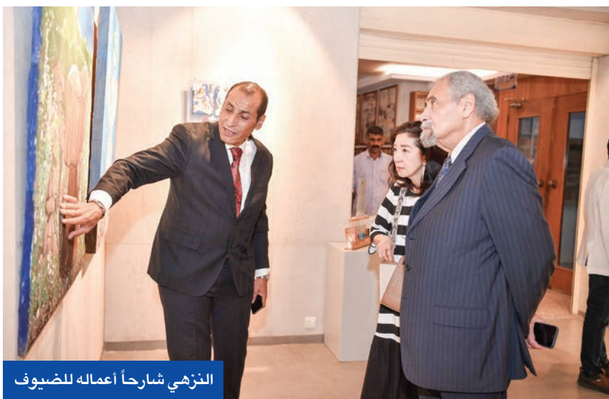
النزهي شارحاً أعماله للضيوف

خلال افتتاح معرضه الشخصي الأول في الكويت «أبعاد من الطبيعة»