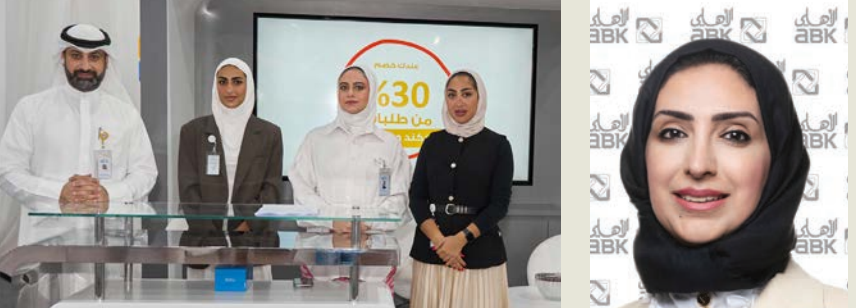
جناح البنك في الفعالية

في إطار التزامه المستمر بدعم قطاع التعليم وتمكين الشباب وخدمة المجتمع، أعلن البنك الأهلي الكويتي مشاركته في الملتقى التنويري للطلبة المستجدين بالهيئة العامة للتعليم التطبيقي والتدريب، إحدى أكبر المؤسسات التعليمية في الكويت.