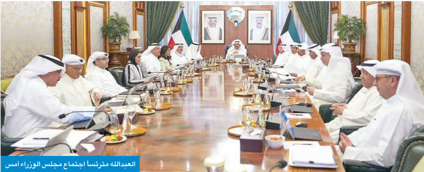
العيدالله مترئسا اجتماع مجلس الوزراء امس

لجنة دائمة لإدارة استثمارات «القصر» تكون لها السلطة العليا في تحديد الشروط