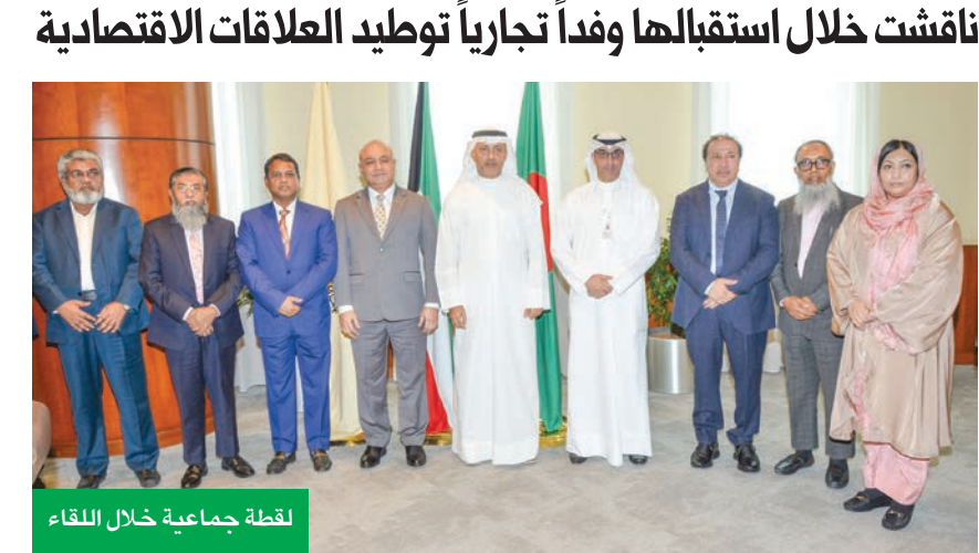
لقطة جماعية خلال اللقاء

42.2 مليوناً عام 2023، مما يعكس قوة الطلب في السوق وتعمق العلاقات. وأوضح أن الاجتماع يجسد هذه الروح التعاونية التي تمثلها صناعات متنوعة مثل خدمات الرعاية الصحية، وخدمات الطاقة، والأدوية والأجهزة الطبية، والمعادن والموارد المعدنية. من جانبه، أعرب رئيس الجانب البنغلادشي عن شكره للغرفة على تنظيمها الاجتماع، وإلى رجال الأعمال الكويتيين لحضورهم، حيث قدم عرضاً مرئياً حول أهم الخطوات والتسهيلات المقدمة من الحكومة للمستثمرين، كما استعرض أيضاً أبرز الفرص الاستثمارية المتاحة أمام المستثمرين لعقد الشراكات التجارية والاستثمارية مع نظرائهم من الجانب الكويتي، كما أتاح الفرصة لأعضاء الوفد لتقديم أنفسهم والشركات التي يمثلونها والتي حازت اهتمام المشاركين من منتسبي الغرفة.