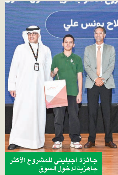
جائزة أجيليتي للمشروع الأكثر جاذبية لدخول السوق