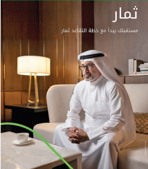
ثمار مستقبل يبدأ مع خطة التقاعد ثمار

استمراراً لجهودهم في توفير أفضل الحلول والخطة الاستثمارية وفق أعلى المعايير العالمية في الجودة والتميز، يطرح بيت التمويل الكويتي الخطة الاستثمارية «ثمار» لتحقيق حياة آمنة بعد التقاعد والعمل لسنوات طويلة، ليستطيع العميل جني ثمار سنوات العطاء، والاستمتاع بحياة تقاعدية مريحة تلبي بمشوار حياته.