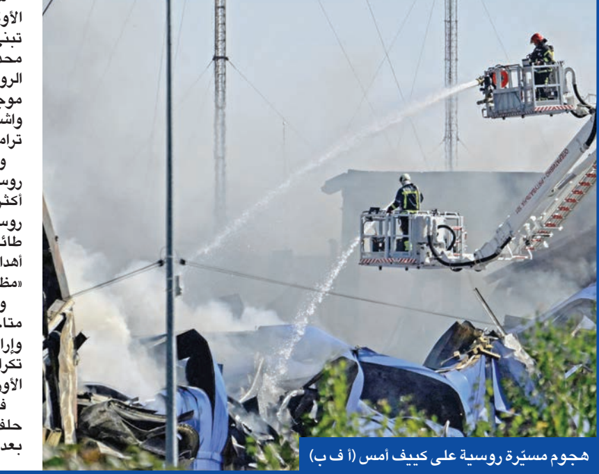
هجوم مسيرة روسية على كييف أمس

مع تصاعد الهجمات الروسية على أوكرانيا، دعا الرئيس الأوكراني فولوديمير زيلينسكي القادة الأوروبيين إلى تبني مشروع إنشاء منظومة دفاع جوي أوروبية مشتركة، محذراً من أن القارة لم تعد في مأمن من «الإرهاب الجوي الروسي». وجاءت هذه الدعوة فيما شهدت مدن أوكرانية موجة جديدة من القصف الليلي، وفي وقت تستعد فيه واشنطن لوساطة جديدة بقوفا الرئيس الأمريكي دونالد ترامب عبر لقاء مرتقب مع زيلينسكي الأسبوع المقبل. وأعلنت سلطات مدينة زابوريجيا أنها تعرضت لقصف روسي أسفر عن إصابة 13 شخصاً بينهم طفلان، وتضرر أكثر من 20 مبنى سكنياً. وقال الرئيس زيلينسكي إن روسيا أطلقت خلال الأسبوعين الماضيين أكثر من 3500 طائرة مسيرة، و2500 قنبلة انزلاقية، و200 صاروخ على أهداف أوكرانية، معتبراً أن هذه الهجمات تؤكد الحاجة إلى «مظلة أوروبية متعددة الطبقات لحماية السماء». وشدد زيلينسكي على أن «جميع التقنيات اللازمة متاحة، لكنه لفت إلى أن المشروع يتطلب «استثمارات واردة سياسية وقرارات حازمة»، وأوضح أن الهدف منع تكرار سيناريو إرسال مقاتلات على عجل أو ترك الدول الأوروبية تحت ضغط مباشر من موسكو. في وارسو، دعا الرئيس البولندي كارول ناوتوسكي حلف شمال الأطلسي (الناتو) إلى تعزيز قدراته الردعية بعد حادثة دخول 19 مسيرة روسية الأجواء البولندية