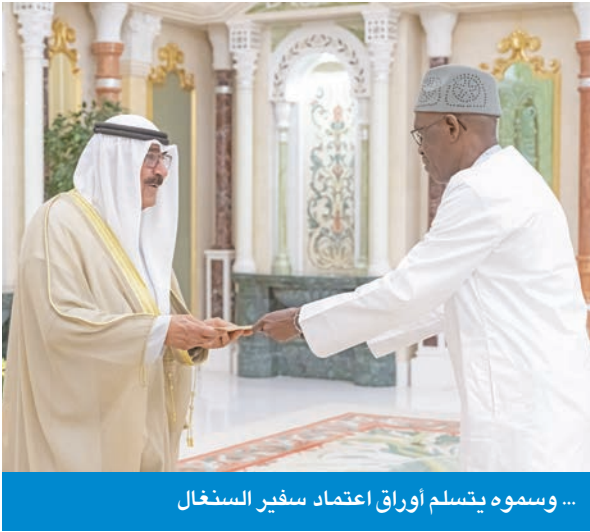
... وسموه يتسلم أوراق اعتماد سفير السنغال