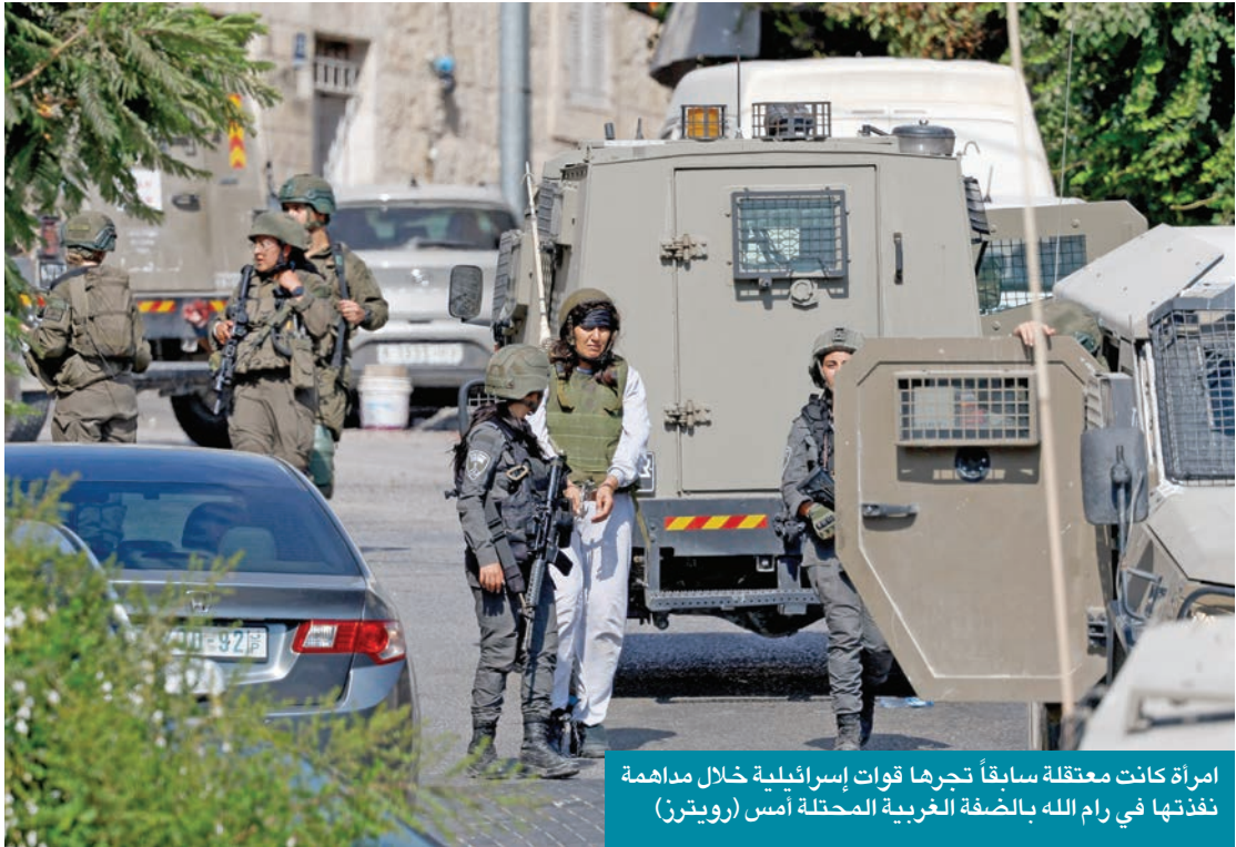
امرأة كانت معتقلة سابقاً تحرّها قوات إسرائيلية خلال مداخمة نفذتها في رام الله بالضفة الغربية المحتلة أمس

في مساء يوم من أيام الجمعة من شهر يوليو الماضي، وتحديداً قرابة منتصف الليل، لاحظت صدفة علامة غريبة على زاوية حسابي الشخصي على منصة X (تويتر سابقاً)، وهي عبارة عن شكل دائري يدعوك بطريقة غريبة، ولا شعورية، إلى أن تضغط عليه. فقبلها كُنْتُ قد لاحظت العديد من التغريدات، وهي تشير، بطريقة أو بأخرى، إلى أحاديث واستنباط للمعلومات من محاكاة ذكاء