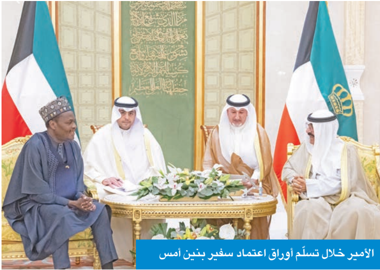
الأمير خلال تسلّم أوراق اعتماد سفير بنين امس

احتفل في قصر بيان، صباح امس، بتسلم سمو أمير البلاد الشيخ مشعل الأحمد، أوراق اعتماد كل من د. آدم عبده حسن سفيراً للنيجر، ود. براهيميا دياكيتي كايا سفيراً لليبيريا، وباديرو أغيمون سفيراً للبنين، وميشال جوليو سفيراً لبولندا، وحسن سوغو سفيراً للسنگال، وذلك سفراء لبلادهم لدى الكويت. حضر مراسم الاحتفال وزير شؤون الديوان الأميري، الشيخ حمد الجابر، ووزير الخارجية عبدالله الجحيا، ومدير مكتب سمو الأمير، الفريق المتقاعد جمال الذياب، ووكيل الديوان الأميري الشيخ عبدالعزيز المشعل، ومساعد وزير الخارجية لشؤون المراسم، الوزير المفوض عبدالمحسن الزيد، وأمر الحرس