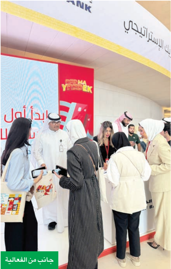
جانب من الفعالية

عمالنا، ودعم الشباب والمبادرات من أصحاب المشروعات الصغيرة والمتوسطة. ومن خلال مبادرة نقصة الخليج بالتعاون مع أفضل المطاعم والمتاجر الكويتية، نعمل على مكافأة عمالنا ودعم الاقتصاد الوطني في الوقت نفسه.