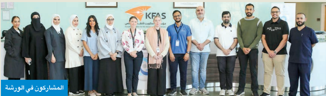
المشاركون في الورشة

اختتم معهد دسمان للسكري، الذي أنشأته مؤسسة الكويت للتقدم العلمي ورشة العمل المكثفة بعنوان «الوقاية من مضاعفات القدم السكرية وعلاجها»، والتي عُقدت خلال الفترة من 14 إلى 16 الجاري في مقر المعهد، بالتعاون مع الإدارة المركزية للرعاية الصحية الأولية بوزارة الصحة ومنظمة الصحة العالمية. وشهدت ورشة هذا العام مشاركة 16 طبيباً من مختلف قطاعات الرعاية الأولية البلدي الخاص بموقع حديقة الحيوان بالعمرية، ليصبح تخصصها إلى إدارة أملاك الدولة، بدلاً من الخزائنة العامة في تقييم القدم السكرية وعلاجها. وتضمنت الورشة عدة محاور أساسية،