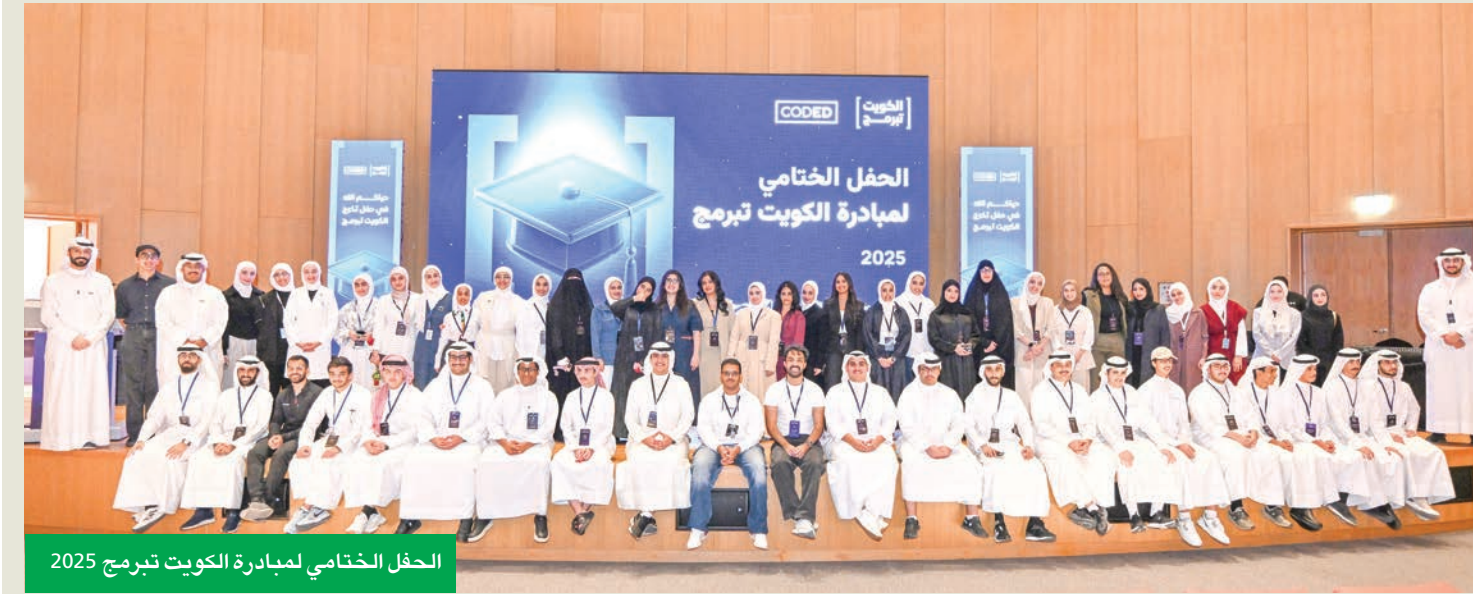
الحفل الختامي لمبادرة الكويت تيرمج 2025