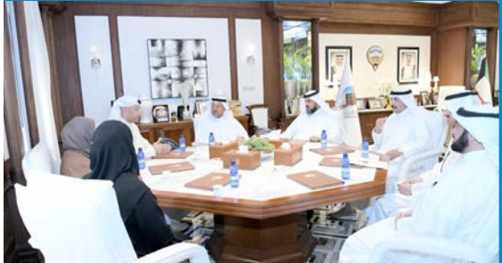
جانب من لقاء متابعة الاستعدادات للعام الدراسي