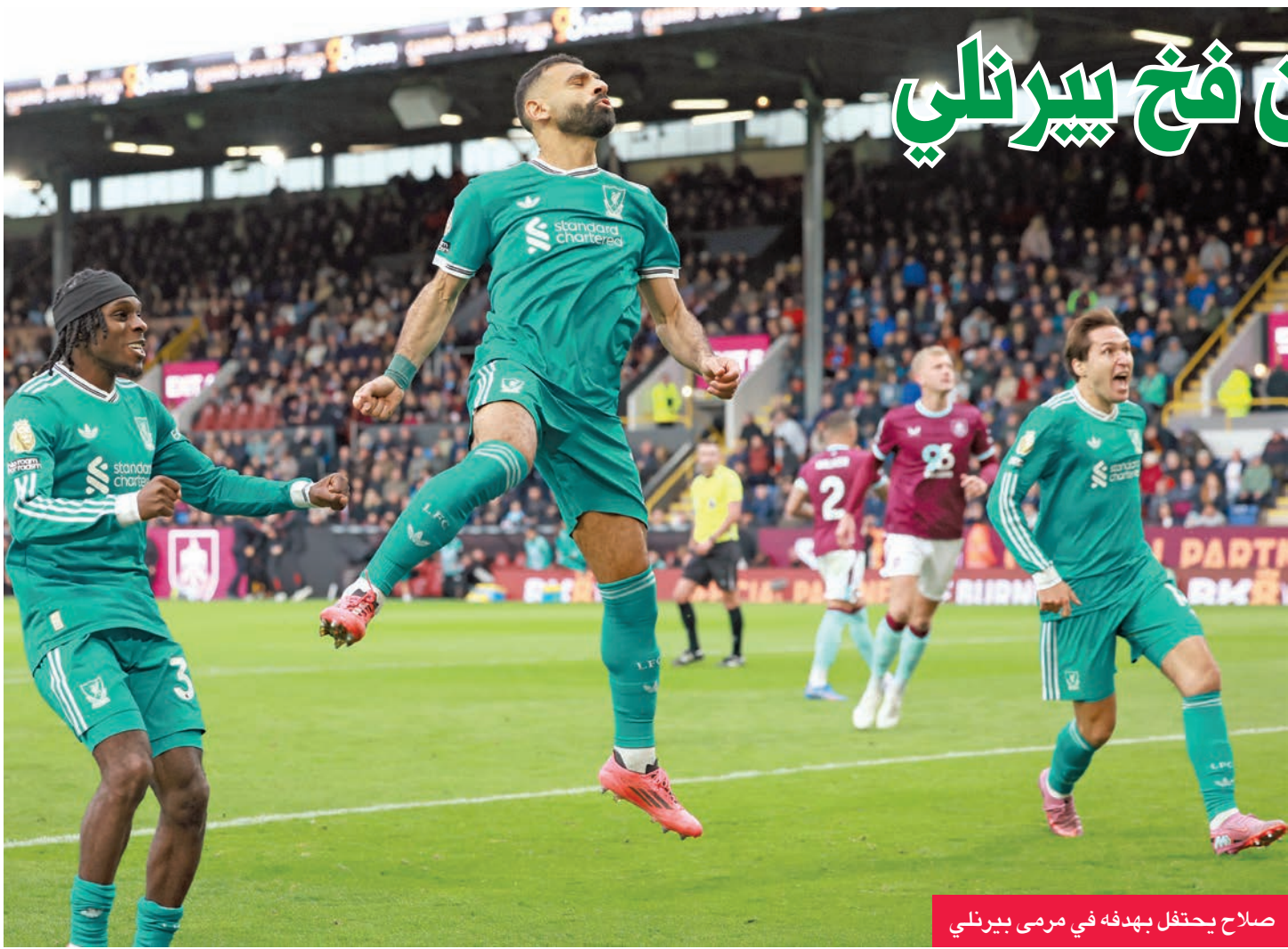
صلاح يحتفل بهدفه في مرمى بيرنلي