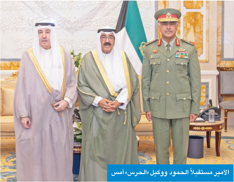
الأمير مستقبلاً الحمود ووكيل «الحرس» أمس

استقبل سمو أمير البلاد، الشيخ مشعل الأحمد، بقصر بيان صباح أمس، سمو ولي العهد الشيخ صباح الخالد. كما استقبل سموه رئيس مجلس الوزراء سمو الشيخ أحمد العبدالله. واستقبل سموه رئيس الحرس الوطني الشيخ مبارك الحمود، حيث قدم لسموه وكيل الحرس الوطني، الفريق الركن حمد البرجس، بمناسبة تعيينه في منصبه الجديد. كما استقبل سموه وزير الدفاع الشيخ عبدالله العلي، حيث قدم لسموه رئيس الأركان العامة للجيش الفريق الركن خالد الشريعان، بمناسبة تعيينه بمنصبه الجديد. واستقبل سموه قائد القيادة الأميركية الوسطى، الفريق أول بحري براد كوبر، والوفد المرافق، وذلك بمناسبة زيارته للبلاد. حضر اللقاء وزير شؤون الديوان الأميري، ومدير مكتب سمو الأمير، ووكيل الديوان الأميري، ووكيل الشؤون الخارجية بالديوان الأميري، ورئيس الأركان.