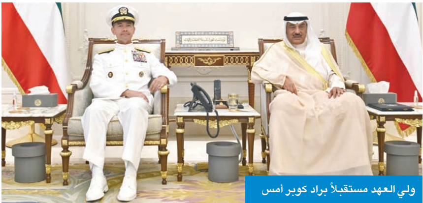
ولي العهد مستقبلاً براد كوبر أمس

يغادر ممثل سمو أمير البلاد الشيخ مشعل الأحمد؛ سمو ولي العهد الشيخ صباح الخالد، والوفد الرسمي المرافق لسموه أرض الوطن اليوم، متوجهاً إلى دولة قطر الشقيقة، لترأس وفد دولة الكويت المشارك في القمة العربية / الإسلامية الطارئة بالعاصمة القطرية الدوحة. في مجال آخر، استقبل سمو ولي العهد، بقصر بيان صباح أمس، النائب الأول لرئيس مجلس الوزراء وزير الداخلية، الشيخ فهد اليوسف، ووزير الداخلية بالمملكة العربية السعودية الشقيقة، عبدالعزيز بن سعود، بمناسبة زيارته للبلاد. ونقل بن سعود لسمو ولي العهد تحيات وتقدير خادم الحرمين الشريفين الملك سلمان بن عبدالعزيز، وولي العهد الأمير رئيس مجلس الوزراء محمد بن سلمان، وتمنياتها لسموه بموفور الصحة ودوام العافية والتقدم والرخاء في ظل القيادة