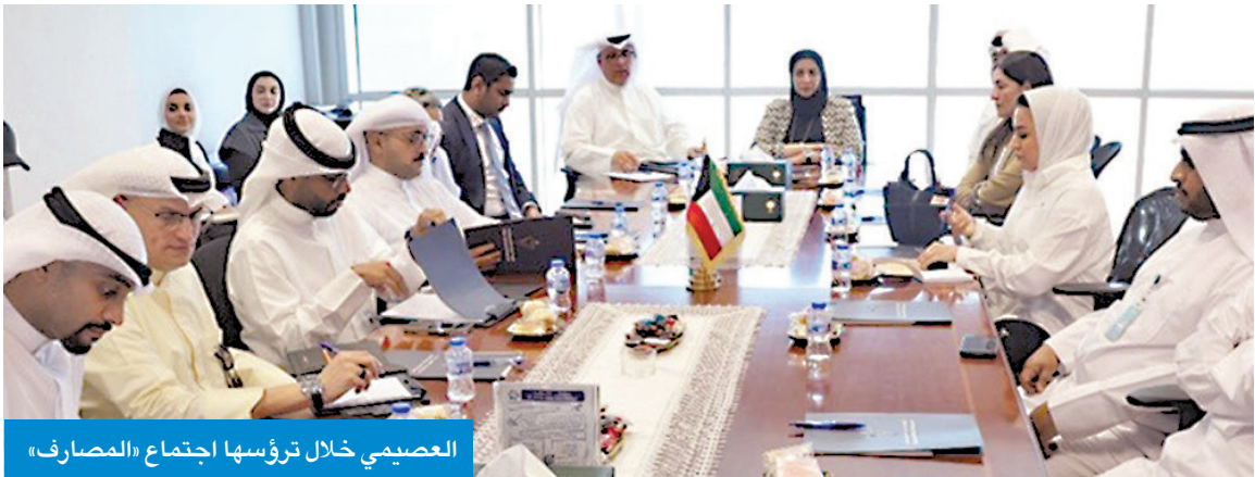
العصيمي خلال ترؤسها اجتماع «المصارف»

العصيمي ترأست اجتماعاً مع «المصارف» لتحويل الرواتب عبر «أسهل»