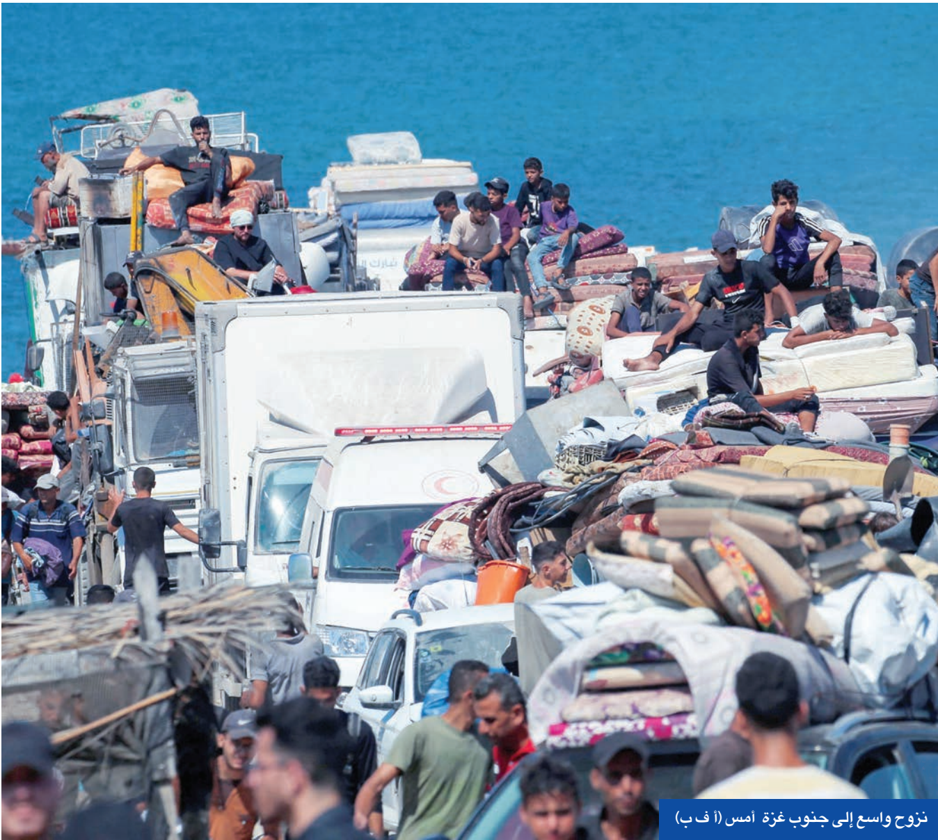
نزوح واسع إلى جنوب غزة أمس

تخنيهاهو مزيداً من تصريحاته العدوانية بشأن الدوحة. إذ شدد على أن القضاء على قادة «حماس» المقيمين في قطر سيزيل العقبة الرئيسية أمام إطلاق سراح جميع الرهائن وإنهاء الحرب في القطاع الفلسطيني المدمر، حيث كشف جيش الاحتلال قصفه لمدينة غزة ودمّر برج الكوثر، وسط موجة نزوح كبيرة لسكانها. وفي منشور على منصة «إكس» قال تخنيهاهو: «قادة حماس الإرهابيون المقيمون في قطر لا يكتفون لشعب غزة، لقد عرقلوا جميع محاولات وقف إطلاق النار لإطالة أمد الحرب إلى ما لا نهاية». واتهم تخنيهاهو قادة «حماس» بتعطيل الجهود التي كانت تتوسط بها قطر ومصر بمشاركة الولايات المتحدة من أجل وقف إطلاق النار في القطاع مراراً. وتعليقاً على كلام تخنيهاهو، اعتبر منتدى عائلات الرهائن الإسرائيليين المحتجزين في غزة أن رئيس الوزراء «يمثل عقبة» أمام إنهاء الحرب وإطلاق سراح أقربائهم، قائلاً إنه «في كل مرة يقرب فيها التوصل إلى صفقة، يقوم تخنيهاهو بتخريبها».