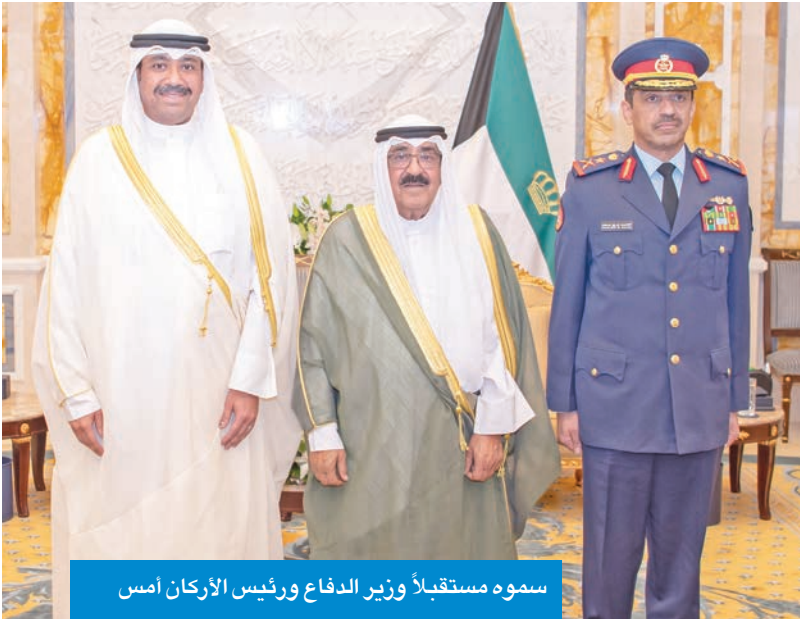
سموه مستقبلاً وزير الدفاع ورئيس الأركان أمس