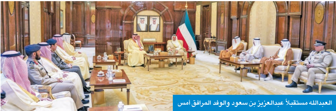
العبدالله مستقبلاً عبدالعزيز بن سعود والوفد المرافق أمس

سموه استقبل وزير الدفاع ورئيس الأركان بمناسبة تعيينه في منصبه الجديد