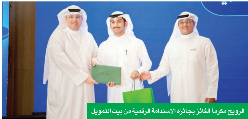
الرويح مكرمًا الفائز بجائزة الاستدامة الرقمية من بيت التمويل

ريادة متواصلة بالمسؤولية الاجتماعية وتمكين الشباب في مجالات الابتكار والتكنولوجيا الرويح