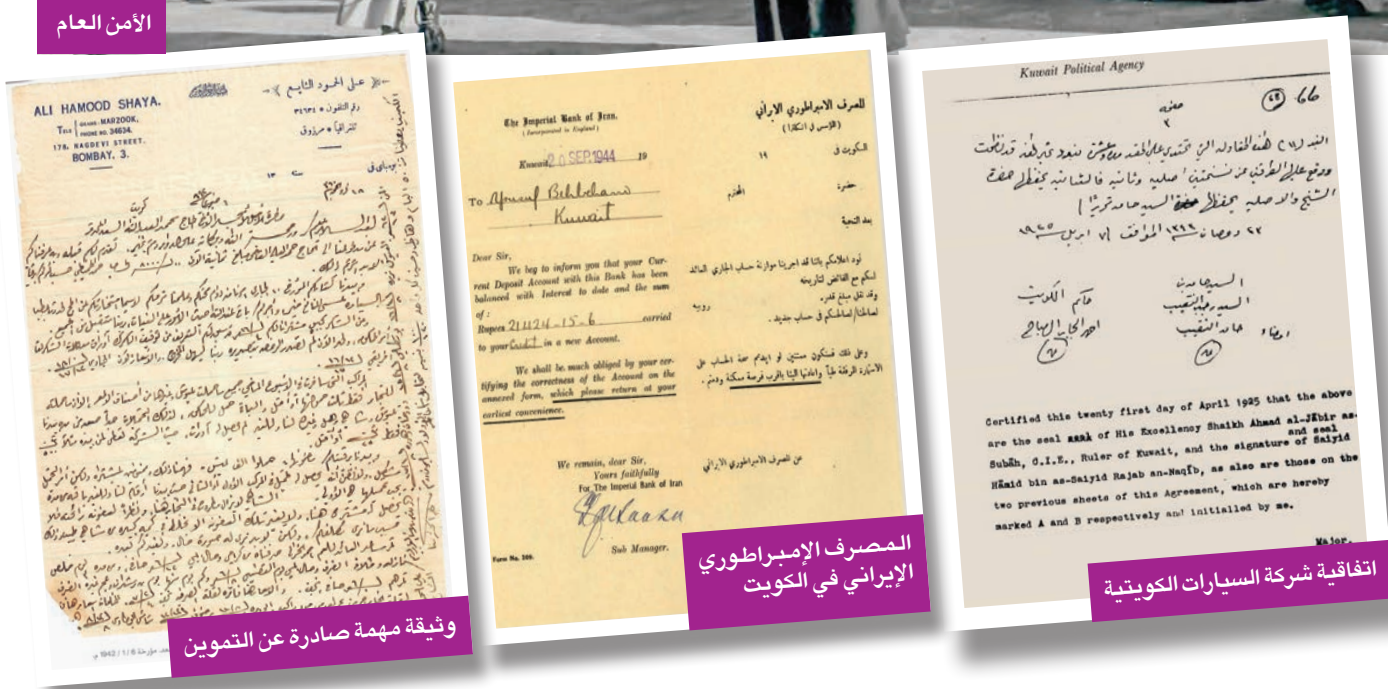
وثيقة مهمة صادرة عن التمويل