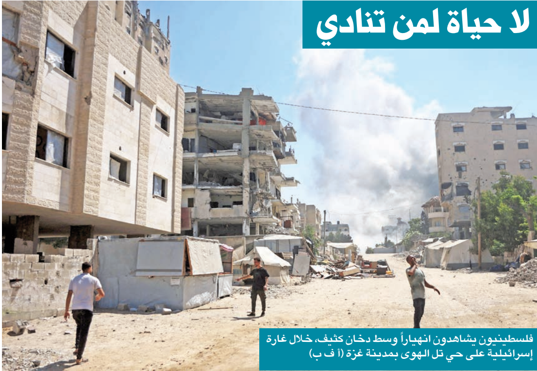
فلسطينيون يشاهدون انهياراً وسط دخان كثيف، خلال غارة إسرائيلية على حي تل الهوى بمدينة غزة