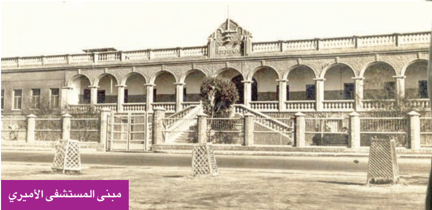
مبنى المستشفى الأميري