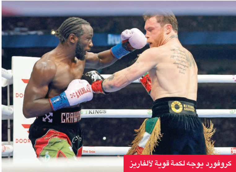
كروفورد يوجه لكمة قوية لآلفاريز

جيسون ستانام، والممثل الأمريكي سارك ولجيرغ، إلى جانب الملاكمين التاريخيين توماس هيرنز وشاين موسلي، ولاعب كرة القدم الأمريكية السابق تشاد أوتشوسينكو.