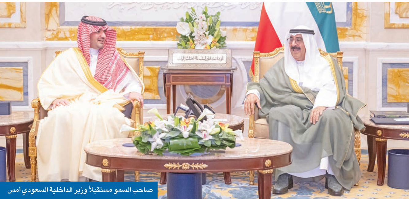
صاحب السمو مستقبلاً وزير الداخلية السعودي أمس