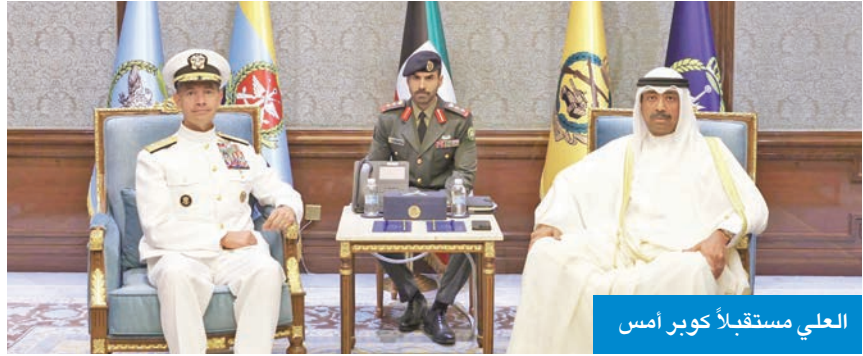
العلي مستقبلاً كوبر أمس

بحثا المستجدات وتعزيز الشراكة الاستراتيجية