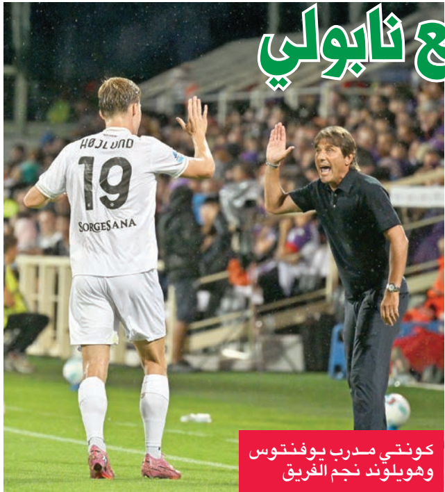
كونتي مدرب الفريق وهويلوند نجم الفريق

من العام المقبل، مؤكداً أن «اللاعب الموهوب يجب أن يكون أيضاً جيداً على المستوى البدني. ينبغي أن تكون لياقته البدنية على مستوى 100 في المئة، وليس 80 في المئة. نيمار يتحسّن». كما تحدث المدرب الإيطالي عن نجم آخر من نجوم منتخب «الكناري»، وهو فينيسوس جونيور، الذي درّبه في ريال مدريد. وقال في هذا الصدد: «تربطني بفيني علاقة رائعة، فهو ينفذ ما أطلبه. لم أواجه أي مشكلة معه قط». لكن أنشيلوتي حذّر من مسألة أن يكون اللاعب غير راضٍ عن دوره كبديل، موضحاً أن دوره كمدرّب لمنتخب يختلف عما كان عليه عندما كان في ناب. وتابع: «إذا لم يكن اللاعب راضياً عن دوره، فلا مشكلة، ساتصل بأخ. لم يعد لدي الالتزام الذي كان عليّ في النادي بإدارة لاعب طوال الموسم». (إفي)