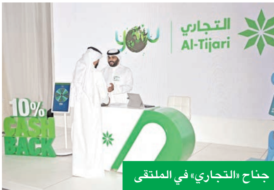
جناح «التجاري» في الملتقى