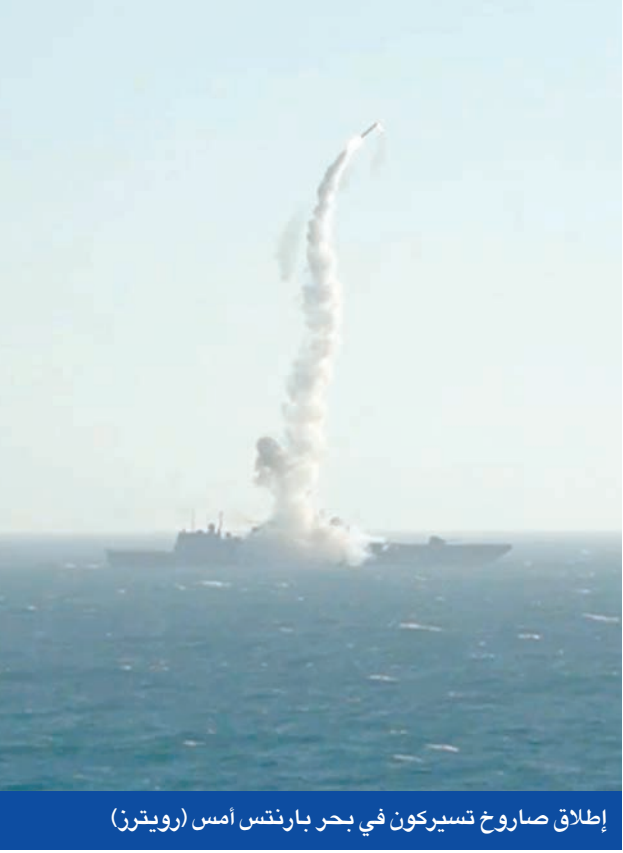
إطلاق صاروخ تسيركون في بحر بارنتس امس (رويترز)

وفي بوخارست، دانت وزارة الدفاع الرومانية «بشدة» اختراق مسيرة روسية لمجالها الجوي خلال هجوم على أوكرانيا، معتبرة أن ما جرى «تحر جديد لأمن البحر الأسود». وأوضح أن مقاتلات «إف-16» رُصدت لتعقب الطائرة حتى اختفت قرب قرية تشيليافيتشي، مؤكدة أنها لم تشكل تهديداً مباشراً للسكان، فيما بدأت فرق البحث بالنحري عن حطام محتمل.