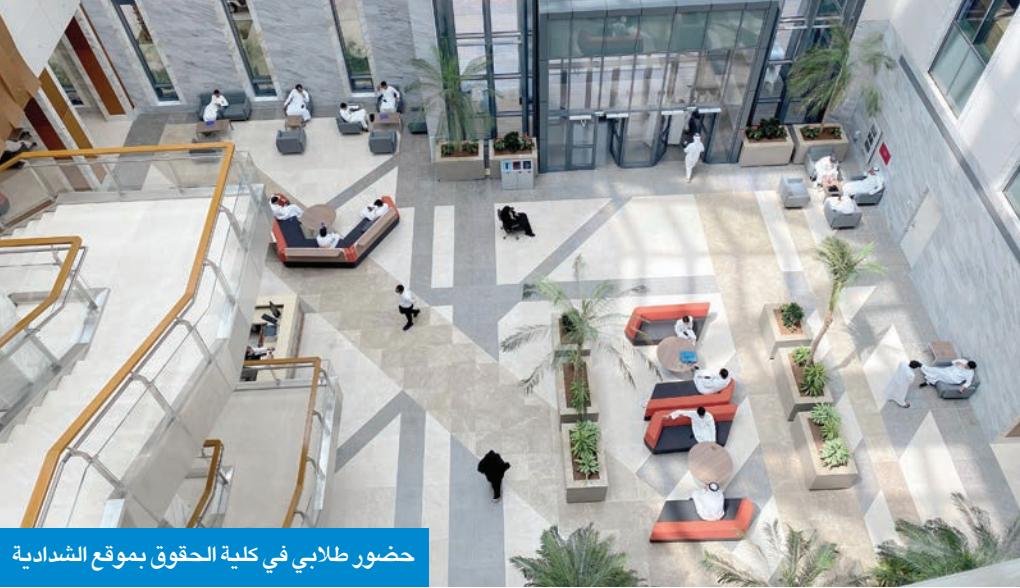
حضور طلابي في كلية الحقوق بموقع الشدايية

وأفادت السويح، في تصريح، بأن الجامعة تعتمد نهجين، منهما التطوير على ما هو قائم من مناهج لمواكبة متطلبات العصر، وإضافة تخصصات تخدم سوق العمل والواقع الذي نعيشه، فعلى سبيل المثال تم إضافة عدة برامج جديدة مثل التعليم التكنولوجي بكلية التربية، والأمن السيبراني، والتمريض نظرا للحاجة الماسة له في سوق العمل، إلى جانب المعلومات والذكاء الاصطناعي. ومن جانب آخر، دعت عمادة القبول والتسجيل في الجامعة الطلبة إلى مراجعة الجدول الدراسي بعد إلغاء الشعب غير المستوفية للشروط للفصل الدراسي الأول 2025 - 2026، لافتة إلى بدء فترة السحب والإضافة 4 بدون مواعيد مسبقة للتسجيل عبر (الأولايين) حتى 20 الجاري.