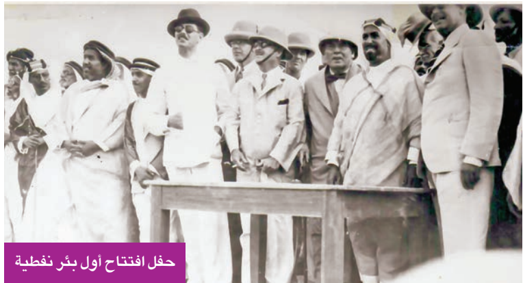
حفل افتتاح أول بئر نفطية