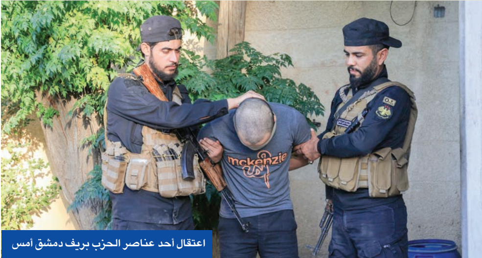
اعتقال أحد عناصر الحزب بريف دمشق أمس

وأكد البوسلامة، لقناة الجزيرة، أن الجماعة لم تتلق أي تواصل رسمي أو ضغوط من السلطات السورية بخصوص حل نفسها، ولو رأت أن في حلها مصلحة سورية لاتخذت القرار فوراً، وقال: «وجودنا ضروري، وبمثل إضافة للحالة السورية الجديدة».