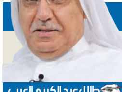
من صيد الخاطر

وسافر هاري إلى بريطانيا الاثنين الماضي من أجل سلسلة من الارتباطات. وزار في وقت سابق من الأربعاء مركزاً بحثياً متخصصاً في