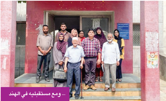
... ومع مستقبله في الهند