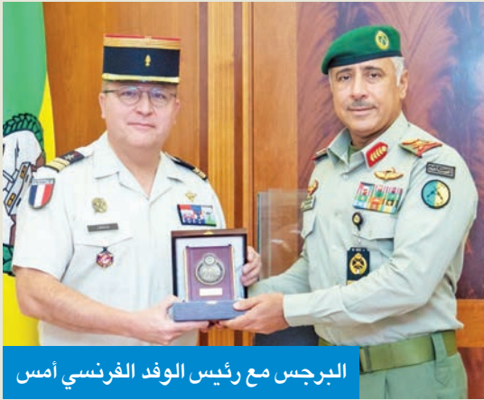
البرجس مع رئيس الوفد الفرنسي أمس

بحث وكيل الحرس الوطني، الفريق الركن حمد البرجس، أمس، مع الملحق العسكري بسفارة فرنسا لدى الكويت، العقيد جيروم بوجو، تطوير العلاقات الدفاعية الثنائية بين البلدين الصديقين. وقال الحرس الوطني، في بيان، إن البرجس استقبل الملحق العسكري الفرنسي برفقة وفد عسكري من الإدارة العامة للتسليح، بوزارة الدفاع الفرنسية، ترأسه مدير مديرية الشرق الأوسط بالإدارة الدولية، العقيد سيدريك برثومي، بحضور معاون للإسناد الإداري بالحرس، اللواء المهندس عصام نايف. ورحب البرجس بالوفد