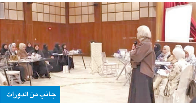
جانب من الدورات

نظمت دورات استعرضت أبرز ما تضمنته التعديلات بالكتب الجديدة