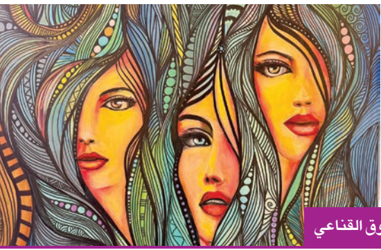
من أعمال مرقوق القناعي

يُذكر أن القناعي شارك في معارض عدة داخل الكويت وخارجها، منها مشاركة للفنانين الكويتيين بمعرض مجموعة القصص في باريس عام 2015، ومجموعة اشتراك بإسطنبول، إلى جانب مشاركاته في مسقط وبروناي، وكان آخرها مشاركته في النسخة الثانية من معرض «ملقى الإبداع» برعاية المؤسسة العامة للفن الثقافي - كتارا، بدولة قطر مع 11 فناناً كويتياً.