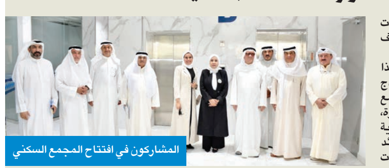
المشاركون في افتتاح المجمع السكني

الدلال: مشروع وقفي رائد يجمع بين الاستثمار والخدمة المجتمعية