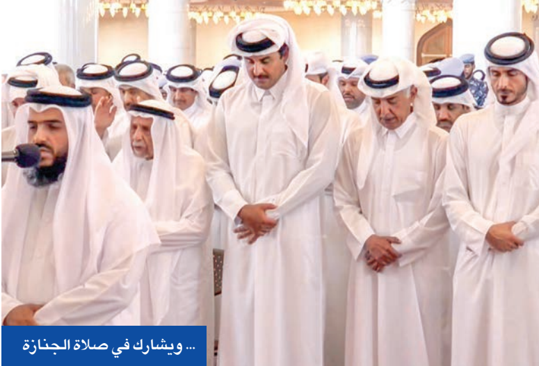
... ويشارك في صلاة الجنازة