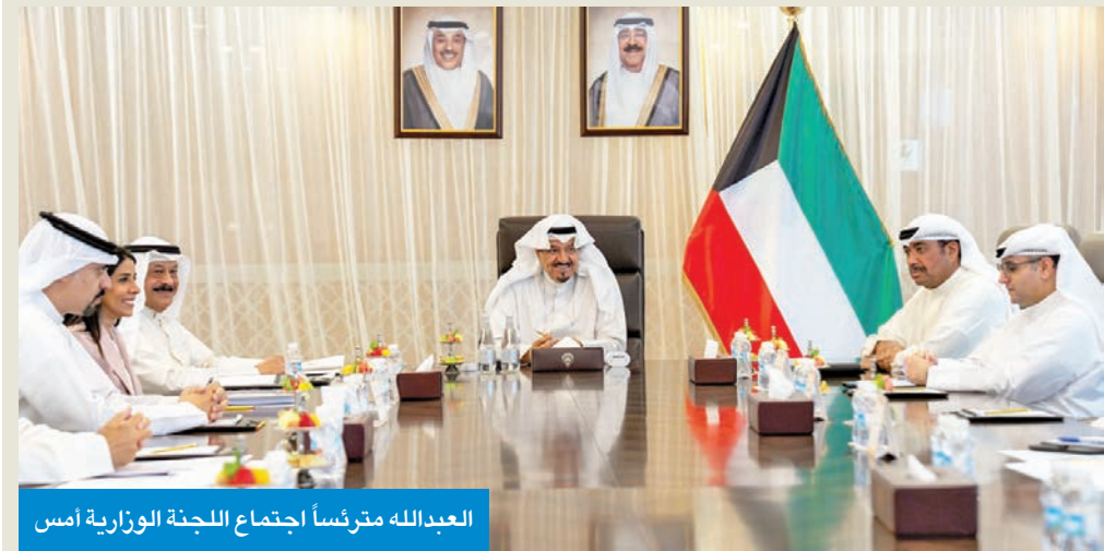
العبدالله مترأساً اجتماع اللجنة الوزارية أمس

والتشريع المستشمار صلاح الماجد، ومساعد وزير الخارجية لشؤون آسيا وعضو ومقرر اللجنة الوزارية السفير سميح جوهري حيات.