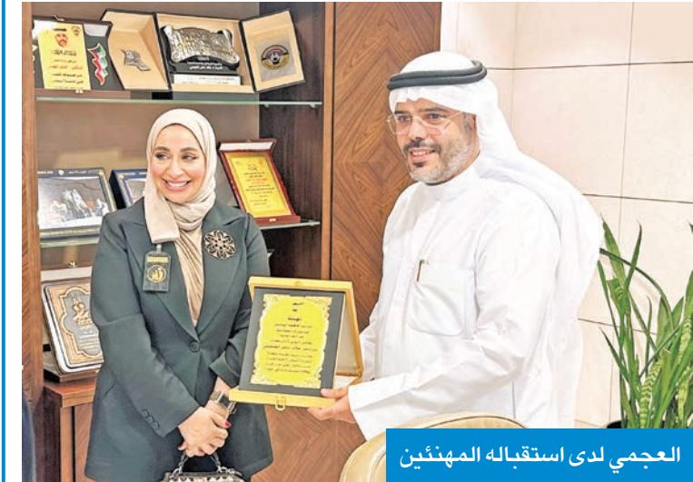
العجمي لدى استقباله المهنيين

الخدمة ذات الطابع الإنساني والاجتماعي، كما أن الرهان الحقيقي على الكفاءة الوطنية القادرة على إحداث الفارق وصنع التميز المؤسسي. على التمكين الحقيقي للكفاءات الوطنية، لاسيما الشابة منها، وتوسيع دائرة المشاركة في اتخاذ القرار، من خلال البات شفافة تضع مصلحة العمل فوق كل اعتبار، فالوزارة ماضية في تنفيذ رؤيتها الطموحة القائمة على «الحوكمة» والتحول الرقمي والارتقاء بالخدمات، بما يلبي تطلعات المواطنين والمراجعين، ويرتقي بجودة الأداء المؤسسي، في ظل «ابواب مفتوحة» أمام الجميع لطرح الأفكار والمبادرات البناءة، وسط بيئة داعمة ومحفزة تعلي من شأن العمل الجماعي وتُقدّر العطاء المخلص.