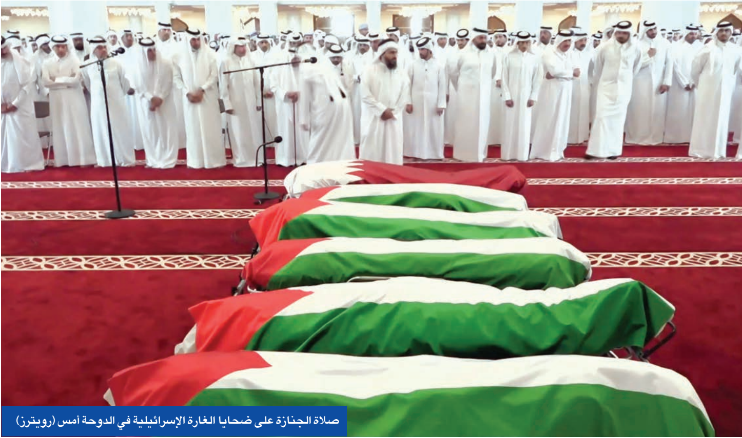
صلاة الجنازة على ضحايا الغارة الإسرائيلية في الدوحة أمس

باكستان، محمد شهباز شريف، زيارة أخوية إلى الدوحة لإظهار التضامن، أكدت وزارة الدفاع التركية أن «انقرة تقف إلى جانب قطر بكل إمكانياتها ضد هذا الهجوم الذي يمثل انتهاكاً صارخاً لسيادتها».