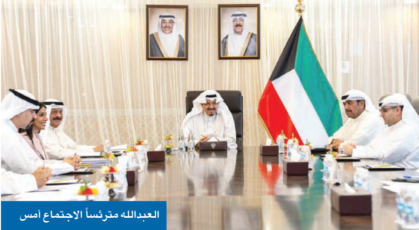
العبدالله مترئساً الاجتماع أمس

العبدالله للجنة «الوزارية»: سرعة توقيع الاتفاقيات مع الشركات الصينية رئيس الوزراء ترأس الاجتماع الـ 26 للجنة متابعة الاتفاقيات الموقعة مع الصين