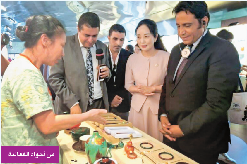
من أجواء الفعالية