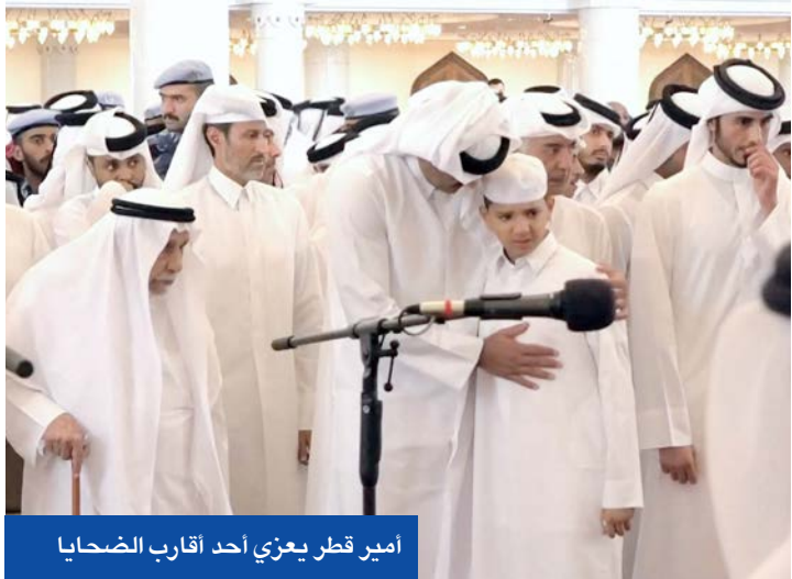
أمير قطر يعزي أحد اقارب الضحايا

مصر تحذر من عواقب وخيمة إذا حاولت إسرائيل العمل على أرضها