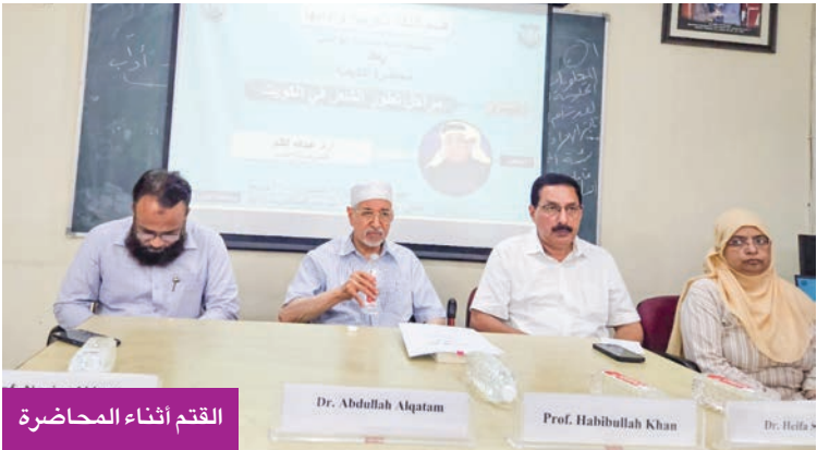
القتم أثناء المحاضرة