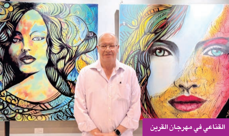
القناعي في مهرجان القرين

في العلاج بالفن (Art Therapy)، فضلاً عن الجانب الإبداعي والجمالي لهذا الفن الذي ينتج أعمالاً غنية بالتفاصيل والزخارف، ويمكن دمجه مع فنون أخرى (البورتريه، الطبيعية، التجريد) وغيرهم، حيث يضيف بُعداً بصرياً وسردياً إضافياً.