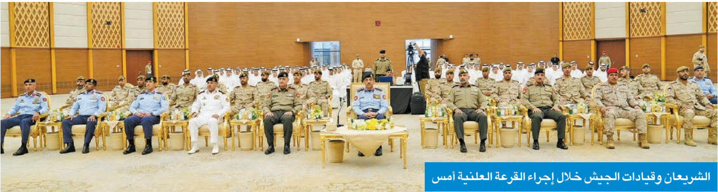
الشريعان وقيادات الجيش خلال إجراء القرعة العلنية أمس

على ترسيخ مبدأ الشفافية وتكافؤ الفرص، مشيداً بالإجراءات التنظيمية التي تضمن العدالة في اختيار المرشحين وفق معايير واضحة ونزيهة. وهذا الشريعان الطلبة المقبولين، وتمنى لهم التوفيق في مسيرتهم العسكرية، ليكونوا جنبا إلى جنب مع اخوانهم في القوات المسلحة، مؤكداً أن من لم يحالف الحظ فما زالت أمامه العديد من الفرص لخدمة الوطن في مختلف المجالات.