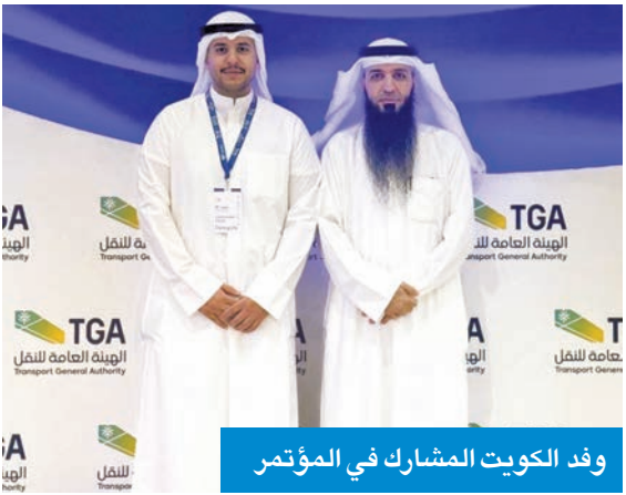
وفد الكويت المشارك في المؤتمر

وورش عمل جديدة، تسلط الضوء على الرقمنة والأمن السيبراني ودور الكفاءات البشرية في رسم مستقبل القطاع البحري.