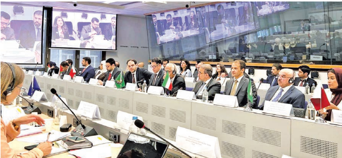
البدر مترئسا الجانب الخليجي خلال الاجتماع

إطلاق مبادرات مبتكرة في مجالات الاقتصاد الرقمي وأمن الطاقة والتحول الأخضر