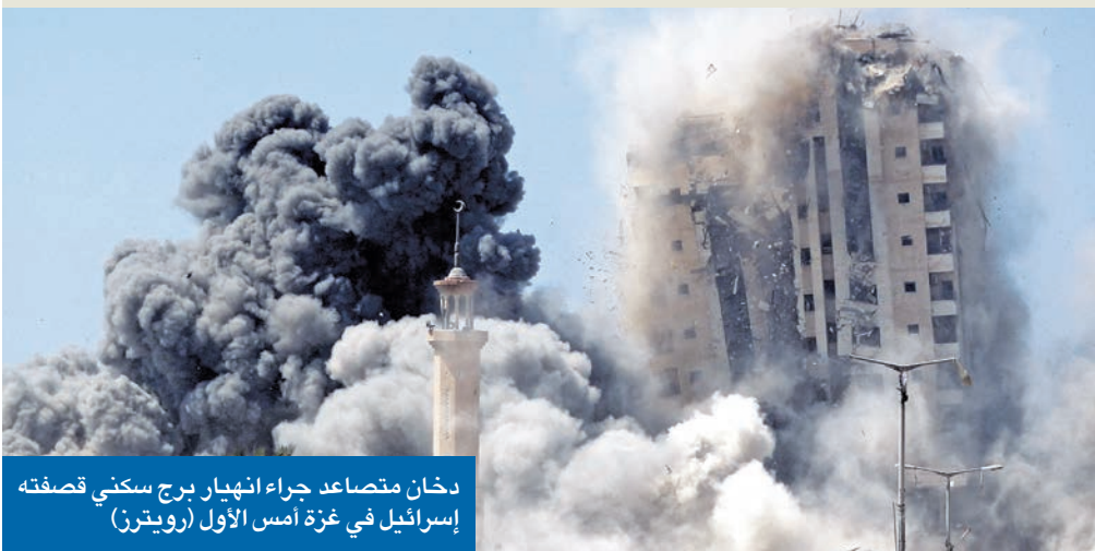
دخان متصاعد جراء انهيار برج سكني قصفته إسرائيل في غزة أمس الأول

الكويت تدعو لإنهاء الإبادة والعقاب الجماعي • عبد العاطي: لن نسمح بـ «هراء نتنياهو»