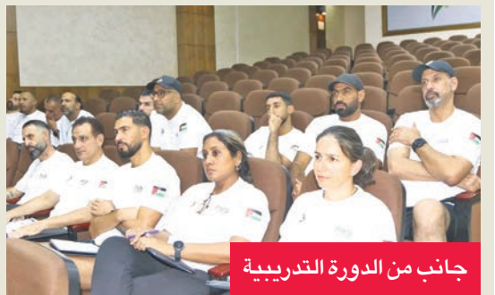
جانب من الدورة التدريبية

مستوى التأهيل الفني للمدربين المشاركين. يشرف على الدورة المحاضران الدوليان التونسي محمد بن مصطفى والتركي جنكين.