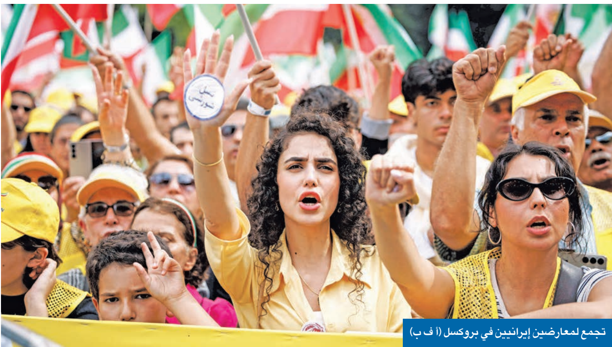
تجمع لمعارضين إيرانيين في بروكسل (أ ف ب)

علمت «الجزيرة»، من مصدر رفيع في المجلس الأعلى للأمن القومي الإيراني، أن مجموعات صغيرة من «فرق الموت» الإسرائيلية نجحت في التسلل إلى الداخل الإيراني عقب حرب الـ 12 يوماً بين طهران وتل أبيب في يونيو الماضي. وأوضح المصدر أن هذه المجموعات نفذت عمليات عسكرية محدودة، استهدفت في معظمها تصفية بعض العملاء الذين استعانت بهم إسرائيل خلال المراحل الأولى من الحرب وأثناءها، والذين انكشف أمرهم؛ بهدف منع تسرب أي معلومات أو كشف التكتيكات التي يعتمد عليها جهاز الموساد الإسرائيلي. ووفق المصدر، فوجئت الأجهزة الأمنية الإيرانية بأحد العملاء الذين جندتهم إسرائيل ببادر بالاتصال طالباً التعاون معها مقابل الحصول على الحماية. وبعد أن سلم نفسه، كشف للمحققين أن معظم العملاء الذين استعانت بهم تل أبيب خلال الحرب تمت تصفيتهم على يد «فرق موت» إسرائيلية داخل الأراضي الإيرانية. في وقت تمت ملاحقة آخرين خارج الحدود، وأنه تمكن من الفرار بعد أن لاحقه عملاء إسرائيليون في إقليم كردستان العراق، حيث لجأ إلى هناك عقب انتهاء الحرب. ونقل المصدر عن اعترافات العميل أن «الموساد» كان قد أعد منازل آمنة لعملائه داخل إيران للجوء إليها عند تعرضهم للخطر، ووعدهم