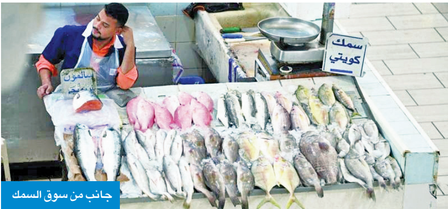
جانب من سوق السمك

والشعري، والسكن، والشماهي، والخباط، والكاسور، والعندق، والسبيطي، والباصي.