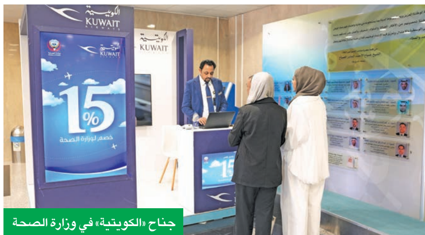
جناح «الكويتية» في وزارة الصحة

تجربة سفر مميزة، لافتة إلى التزامها بتوفير أفضل الخدمات التي تلبي رغبات وتطلعات المسافرين. وأكدت الشركة أنها مستمرة في طرح مبادرات نوعية بالمستقبل مع جهات الدولة، حتى تكون قريبة من الجميع، من خلال مد جسور التعاون معها، بما يعكس رؤيتها في الريادة والتميز، وجعلها خبائراً مفضلاً للمسافرين داخل الكويت وخارجها. كذلك تسعى دائماً لتكون قريبة من عملائها، متمسكة باحتياجاتهم، من حيث تقديم أفضل الخدمات، إضافة إلى مرونة وإنسانية سفرهم على متن طائرات «الكويتية».