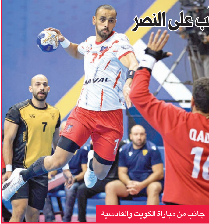
جانب من مباراة الكويت والقادسية

«الأبيض» عزز صدارته في الدوري... و«الأخضر» تغلب على النصر