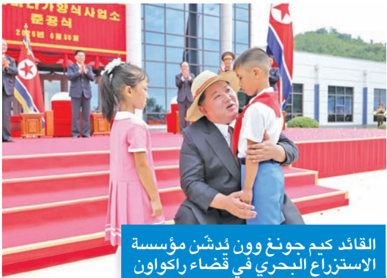
القائد كيم جونغ وون يُدشن مؤسسة الاستزراع البحري في قضاء راكواون

قالت السفارة الكورية الشمالية لدى البلاد إن «جمهورية كوريا الديمقراطية الشعبية هي حقاً دولة الشعب، فمُنذ تأسيسها في 9 سبتمبر 1948، جرى كل ما يتعلق ببناء الدولة وأنشطتها وفق إرادة الشعب، وبما يخدم مصالحه». وذكرت السفارة، في بيان، بمناسبة الذكرى 77 لتأسيس «الجمهورية» التي تصارف التاسع من سبتمبر الجاري، أن «الرئيس المؤسس كيم إيل سونغ دعا أبناء الشعب لبناء مجتمع جديد، فتمكّن خلال فترة قصيرة من جعل الشعب صاحباً للبلاد، وشيّد دولة اشتراكية مستقلة تعتمد على الذات، حيث يخدم كل شيء فيها الشعب». وأشارت إلى أنه «بعد رحيل