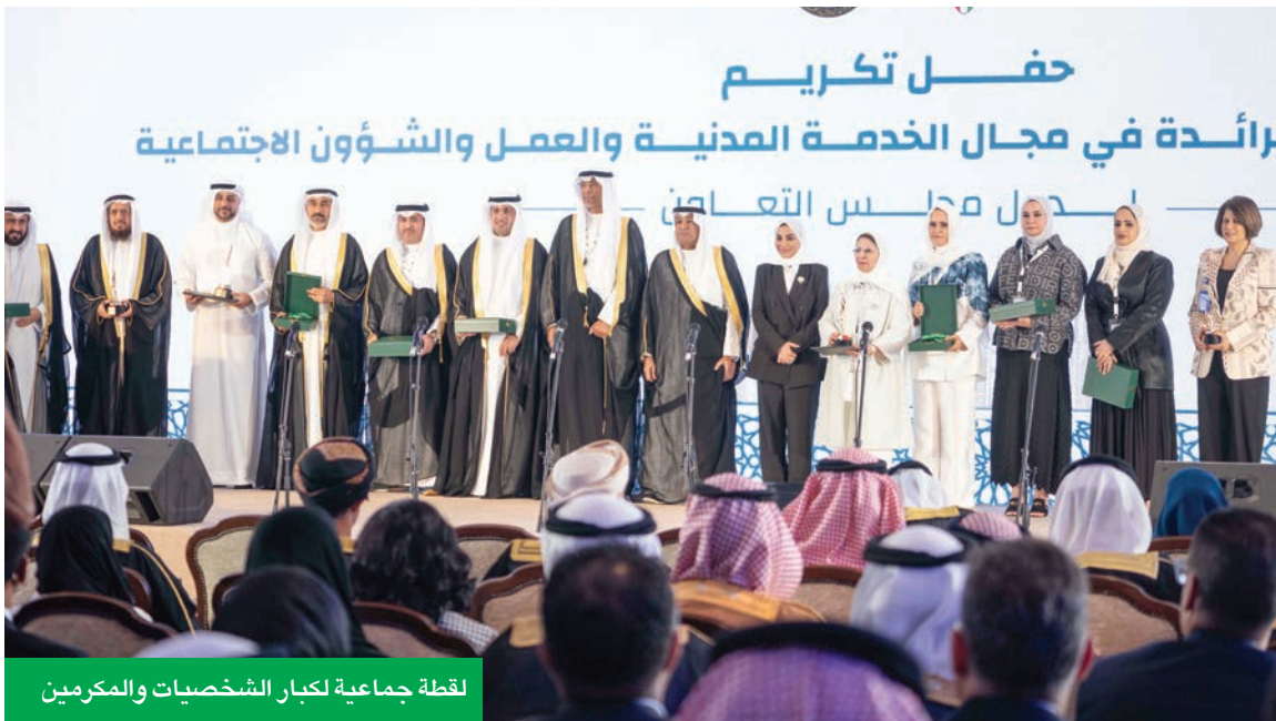
لقطة جماعية لكبار الشخصيات والمكرمين

حقق نسبة تكويت استثنائية على مستوى القطاع المصرفي بلغت 86% خلال 2024