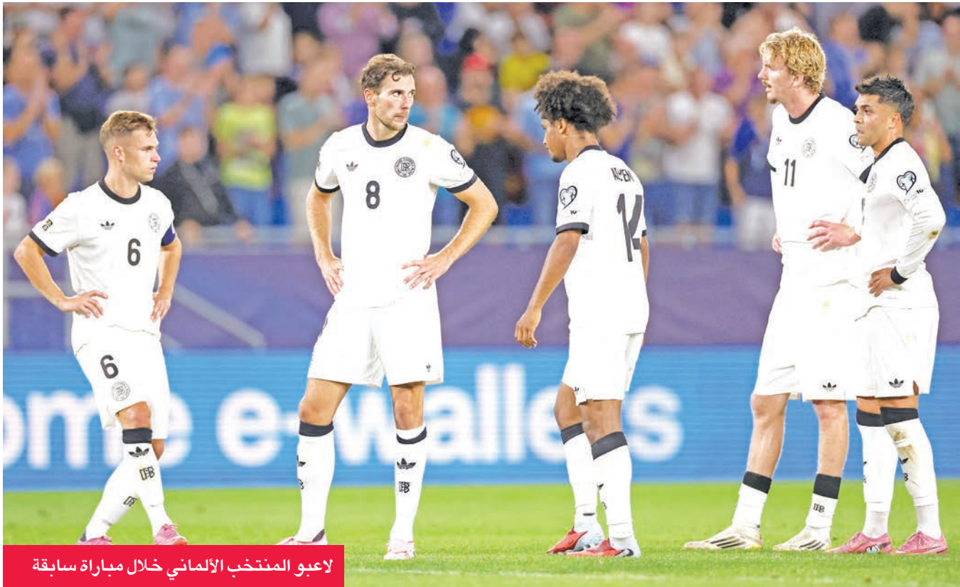
لاعبو المنتخب الألماني خلال مباراة سابقة

المنتخب. اللاعب غير قادر على خوض مباراة التصفيات أمام ليتوانيا بعد مشاركته ضد بولندا، وسيعود اللاعب إلى برشلونة حيث سيخضع خلال الساعات المقبلة لفحوصات طبية لتحديد مدى خطورة الإصابة والمدة المحتملة لغيابه عن الملاعب.