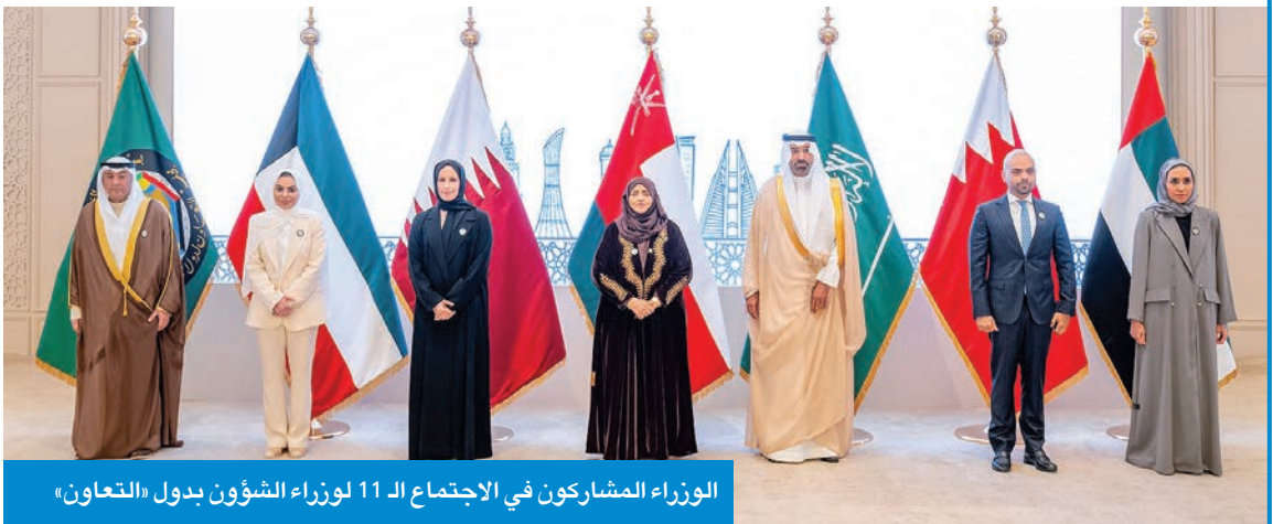
الوزراء المشاركون في الاجتماع الـ 11 لوزراء الشؤون بدول «التعاون»

التكامل بين دول المجلس عبر ملفات مكافحة المخدرات وخط العمل الاجتماعي والخيري والتطوعي ودعم الشباب، مشيراً إلى أن دول المجلس حققت نقاطاً أعلى من المتوسط العالمي في مؤشر التقدم الاجتماعي لعام 2025. وأوضح البديوي أن من أبرز الإنجازات؛ قرار المجلس الأعلى في دورته الـ 55 «الكويت 2014» باعتماد الاستراتيجية الخليجية لمكافحة المخدرات (2025- 2028) لتعزيز الجهود المشتركة لحماية الأطفال والشباب والأسر، إلى جانب فعالية الأمانة العامة في 26 أبريل 2022 لدعم الشباب، وتكريم شاب وشابة من كل دولة، وما ترتب عليها من برامج تعزز ملف الشباب الخليجي.