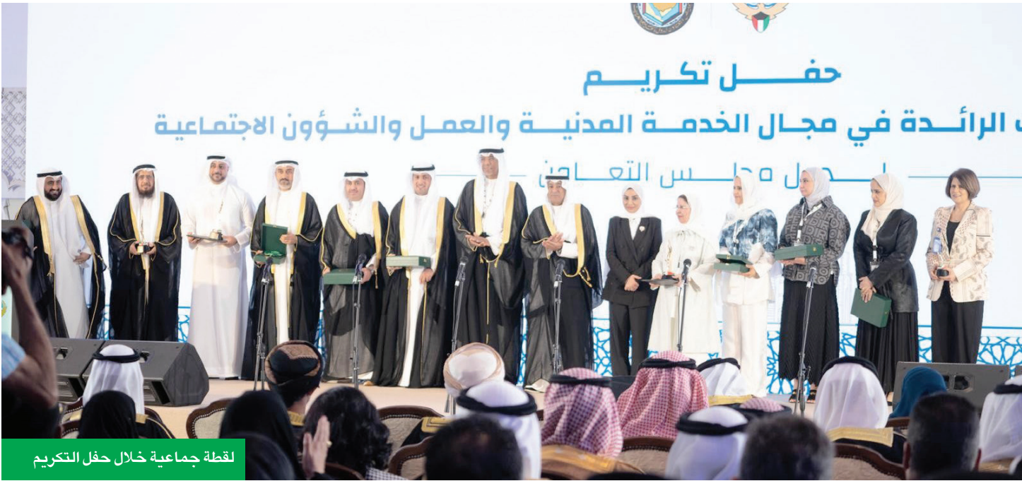
لقطة جماعية خلال حفل التكريم