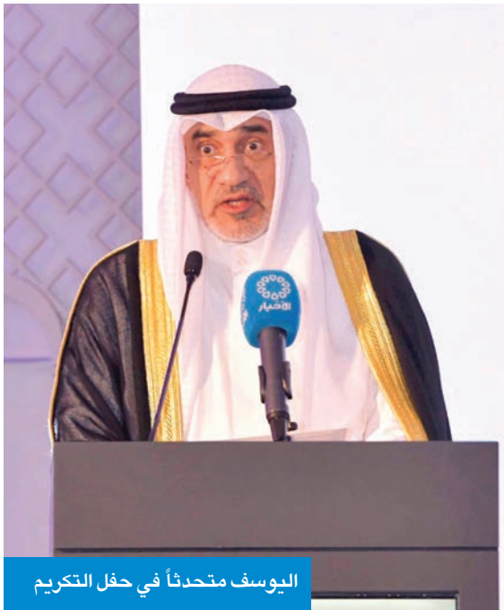
اليوسف متحدثاً في حفل التكريم