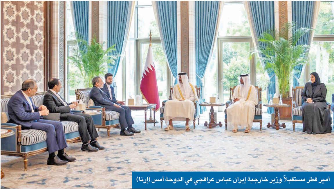
امير قطر مستقبلاً وزير خارجية إيران عباس عراقجي في الدوحة أمس (إرنا)

أوهامهم السياسية خسرتنا 500 مليار دولار وعلينا تفادي عودة العقوبات الأممية • كنا جاهزين للعودة للاتفاق النووي عام 2021 في عهد بايدن لولا التدخلات