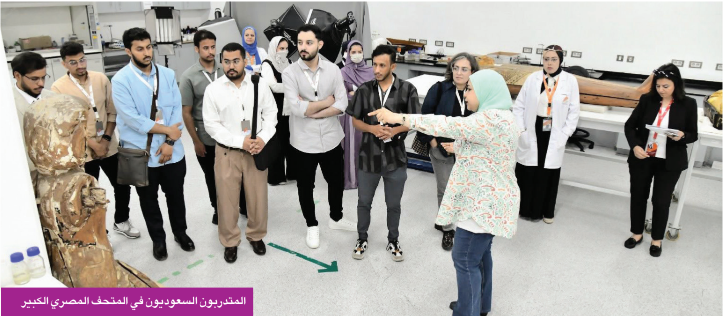
المندوبون السعوديون في المتحف المصري الكبير