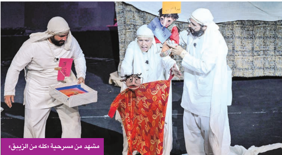
مشهد من مسرحية «كله من الزيق»