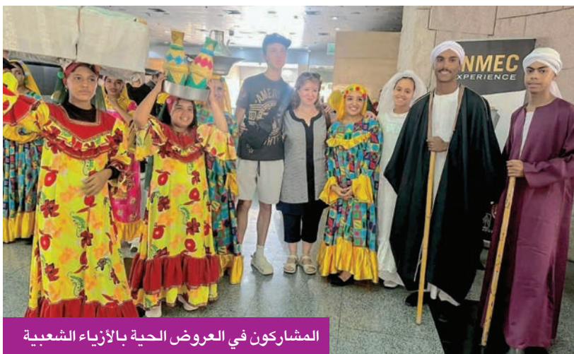
المشاركون في العروض الحية بالأزياء الشعبية