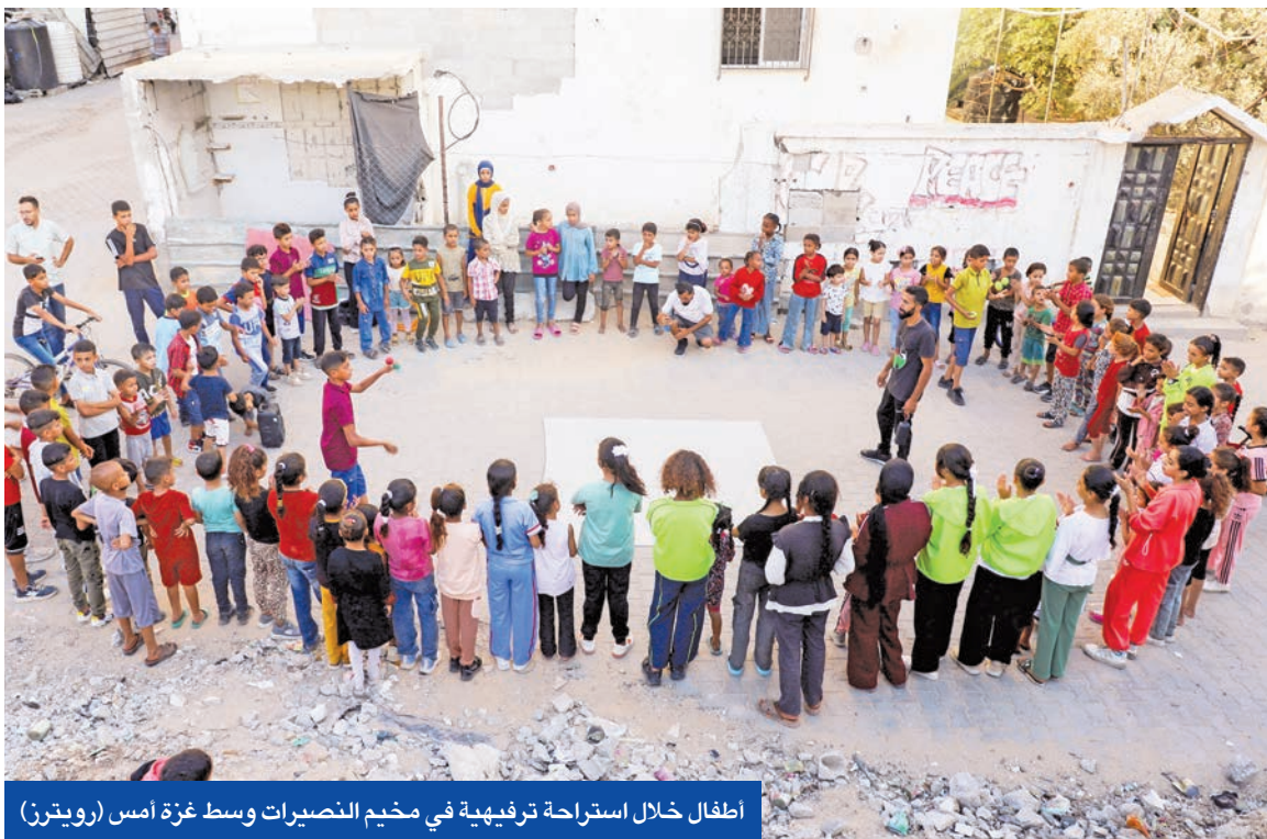
اطفال خلال استراحة ترفيهية في مخيم النصيرات وسط غزة أمس

كشف سياسي فلسطيني، أميركي بتوسط بين إدارة الرئيس دونالد ترامب و«حماس» عن اتصالات تجري حالياً بمشراكة إقليمية لدفع صفقة شاملة تطلق سراح المحتجزين الإسرائيليين وتوقف حرب غزة، في حين أدت ضغوط أميركية إلى إجراء مناقشة خرائط لضمّ الضفة الغربية المحتلة باجتماع حكومي إسرائيلي، بعد ردود فعل عربية ودولية.