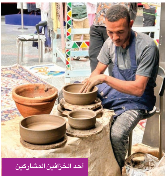
أحد الخزافين المشاركين