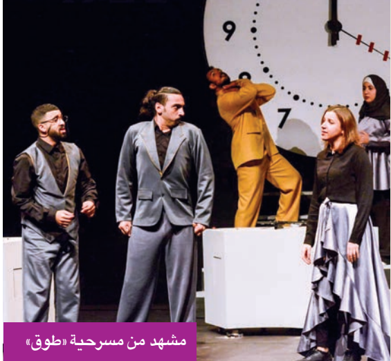
مشهد من مسرحية «طوق»