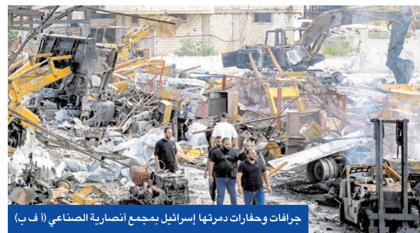
جرافات وحفارات دمرتها إسرائيل بمجمع أنصارية الصناعي (ا ف ب)

لودريان للتحضير لعقد مؤتمر لدعم لبنان في مجال إعادة الإعمار ومؤتمر مخصص لتقديم الدعم والمساعدات للجيش اللبناني، علماً أن المصادر المعنية تشير إلى تباين بين المقاربة الأميركية والمقاربة الفرنسية، إذ أن باريس تفضل خيار الحوار والهدوء بدلاً من التصعيد والصدام.