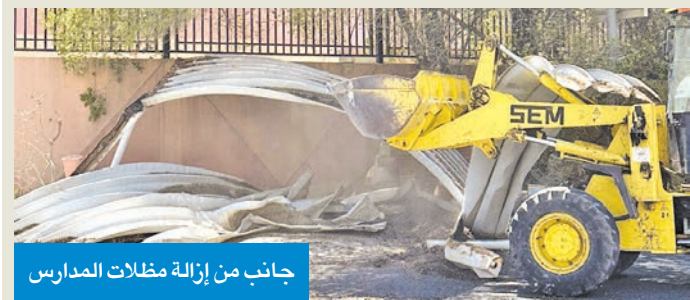
جانب من إزالة مظلات المدارس

في ردها على طلب جمعية المعلمين: الفرق الرقابية متوقفة عن إزالة استراحة الطلبة والمدرسين