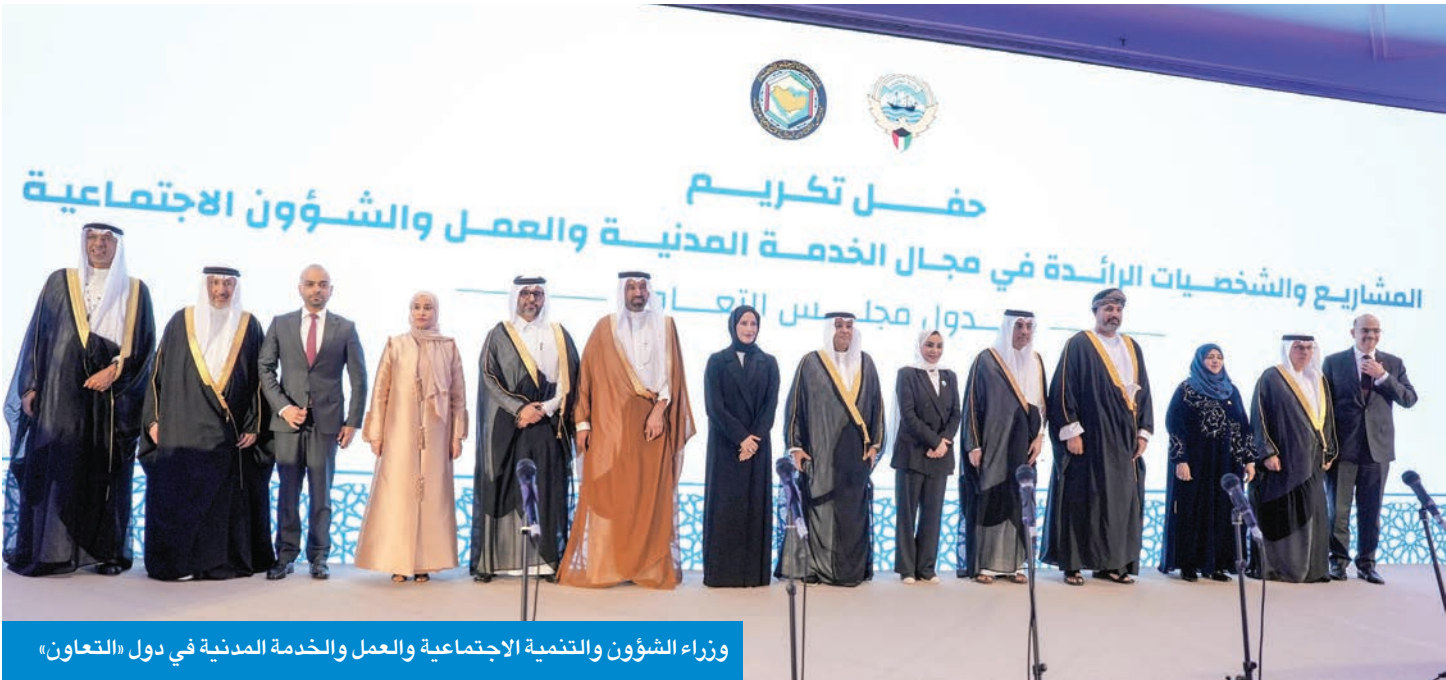
وزراء الشؤون والتنمية الاجتماعية والعمل والخدمة المدنية في دول «التعاون»