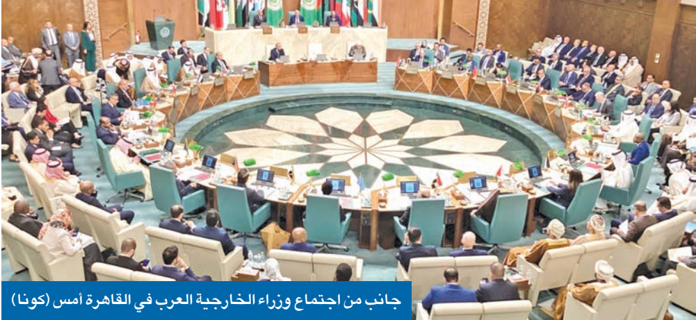
جانب من اجتماع وزراء الخارجية العرب في القاهرة أمس

• اليحيا يستعرض مع لازاريني تطورات الأوضاع في غزة والضفة وجهود دعم «الأونروا» • وزراء الخارجية ينددون بخطة الاستيطان في منطقة «E1» للاستيلاء على القدس الشرقية