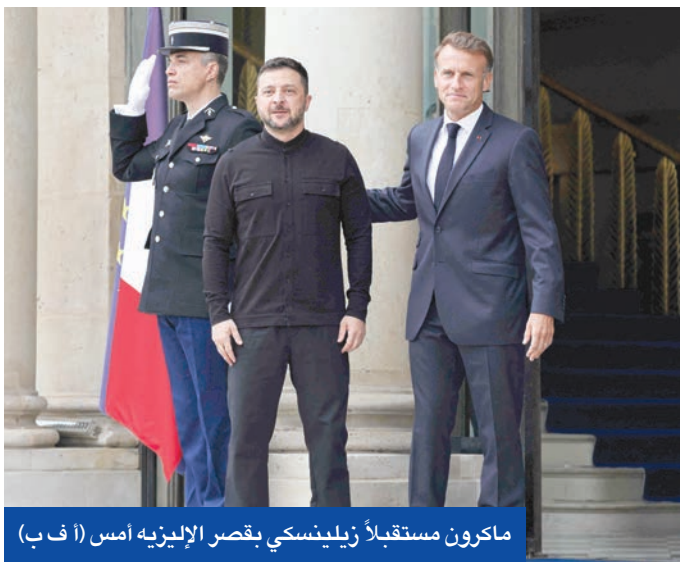
ماكرون مستعبلاً زيلينسكي بقصر الإليزيه أمس

أوروبا جهزت ضماناتها وتنتظر واشنطن... وموسكو ستستبدل أصولها بالأرض