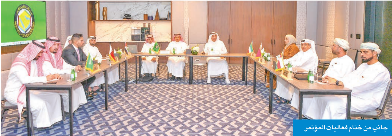
جانب من ختام فعاليات المؤتمر

العقاري وفق معايير دقيقة معتمدة من الوزارة.