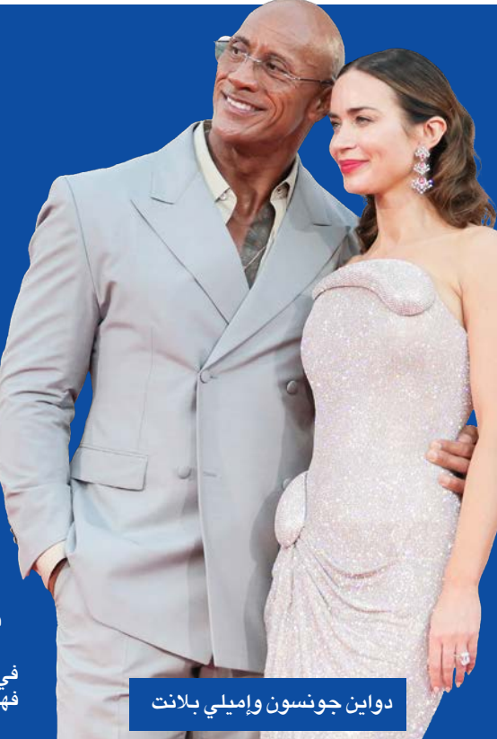
دواين جونسون وإميلي بلانت

على الورق، كان الدور في الفيلم مصمماً خصّوصاً له، إذ يُؤدي دور المصارع مارك كبر، وهو مقاتل سابق كان من رواد فنون القتال المختلطة في بدايات القرن الحالي.