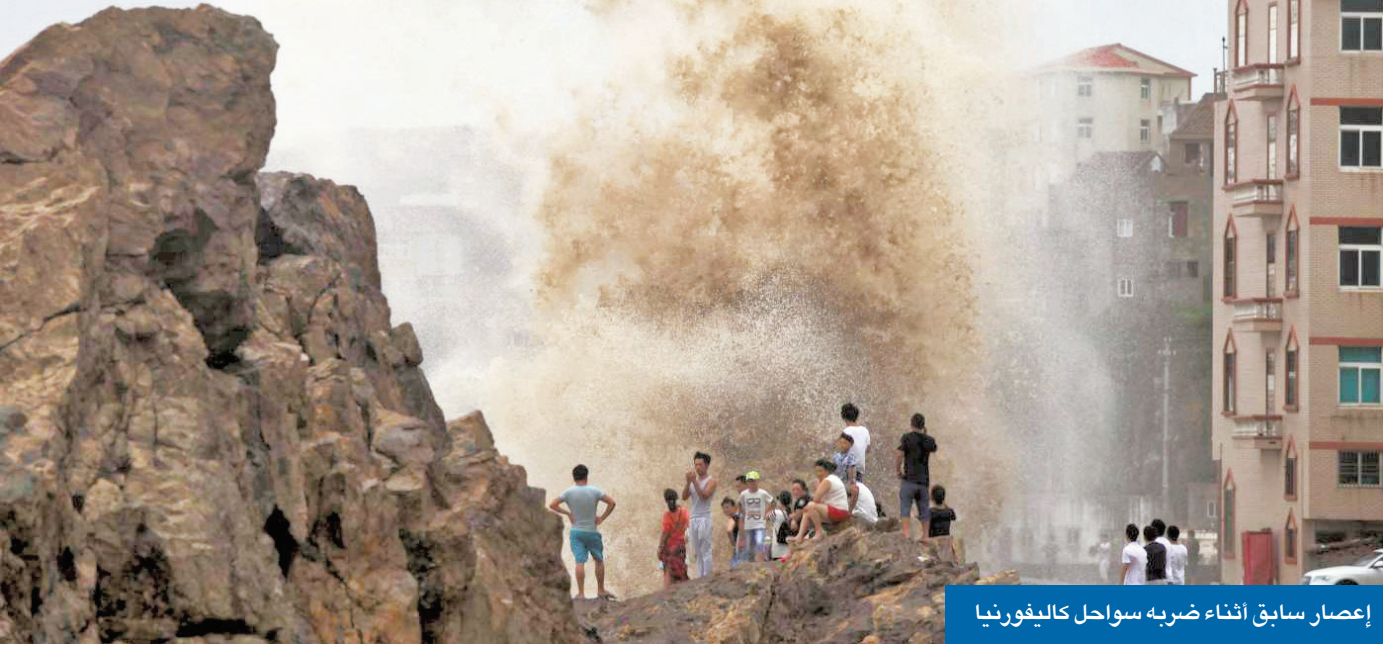
إعصار سابق أثناء ضربه سواحل كاليفورنيا

حذرت منظمة الأمم المتحدة للطفولة (يونيسيف) من أن 6 ملايين طفل إضافيين قد يحرمون من التعليم بحلول نهاية عام 2026، بسبب الانقطاع الكبير المتوقع في المساعدات الدولية بقطاع التعليم، مما سيرفع العدد الإجمالي للأطفال المحرومين من الدراسة إلى 278 مليوناً حول العالم. وأشارت المنظمة التابعة للأمم المتحدة، في