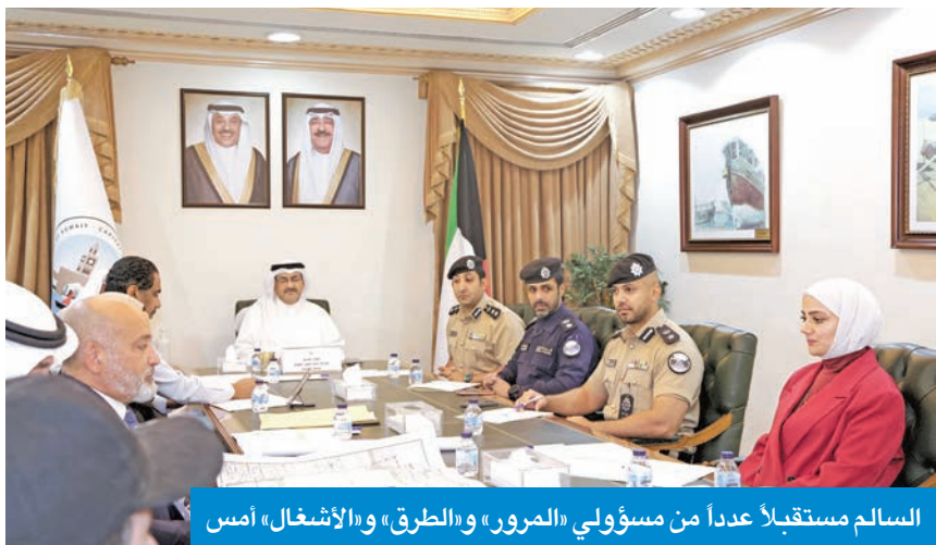
السالم مستقبلاً عدداً من مسؤولي «المور» و«الطرق» و«الأشغال» أمس

أكد محافظ العاصمة، محافظ الفروانية بالإناية، الشيخ عبدالله السالم، أهمية الاستمرار في تنفيذ مشاريع تطوير البنية التحتية والقيام بأعمال صيانة وتأهيل الطرق وفق أعلى معايير الجودة والسلامة ووضع حلول مبتكرة، واستخدام أحدث التقنيات والمواد لضمان ديمومة الطرق وسلامة مستخدميها. جاء ذلك خلال استقبله، في مكتبه بديوان المحافظة صباح أمس، عدداً من المسؤولين من «المور»، والهيئة العامة للطرق والنقل البري، والأشغال، إلى جانب عدد من مسؤولي المجموعة المشتركة.