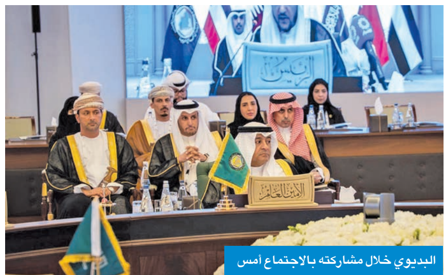
البيديوي خلال مشاركته بالاجتماع أمس

وأضاف البيديوي أن المسيرة المباركة لمجلس التعاون حققت إنجازات كبيرة ساهمت في الوصول للعديد من الأهداف التي رسمها قادة دول المجلس لتعزيز العمل والتكامل المشترك في كل الميادين، ومما زال العمل قائماً بهدف الوصول بالمسيرة إلى أقصى مراحل التكامل، لتلبية لتطلعات القادة وطموحات مواطني دول المجلس. وأشار إلى أن اللجنة المؤقتة لتفسير بخطى ثابتة نحو تحقيق التعاون والتكامل في مجال الخدمة المدنية والتنمية الإدارية، مدفوعة برؤى وطنية طموحة لتعزيز كفاءة الأجهزة الحكومية، ورفع جودة الأداء، وتطوير الكوادر الوطنية، وتطبيق أحدث الممارسات الإدارية. كما أوضح أن أجهزة الخدمة المدنية في دول المجلس تعد ركيزة أساسية للتعاون الحكومي، إذ أسهمت منذ تأسيس المجلس في تبادل الخبرات ووضع السياسات المشتركة لتنمية الموارد البشرية