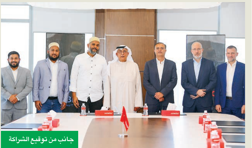
جانب من توقيع الشراكة

كشفت شركة Ooredoo الكويت، عن توقيع شراكة استراتيجية جديدة مع منصة WiBi (Want it Buy it)، المتخصصة في تجارة الإلكترونيات عبر الإنترنت، في خطوة نوعية تهدف إلى تقديم تجربة تسوّق أكثر تميزاً وابتكاراً لعملاء الشركة، وترسيخ مكانتها كشركة رائدة في تقديم أسلوب حياة رقمي متكامل.