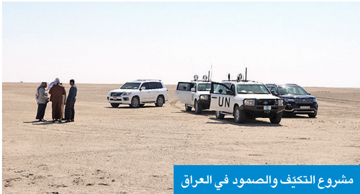
مشروع التكيف والصمود في العراق

وأوضحت أن أبحاثها شملت تحليل دور الإعلام في تشكيل الرأي العام وصناعة الموافقة في القضايا السياسية والاجتماعية والثقافية، مبيّنة كيف تستخدم وسائل الإعلام بمختلف أشكالها في توجيه