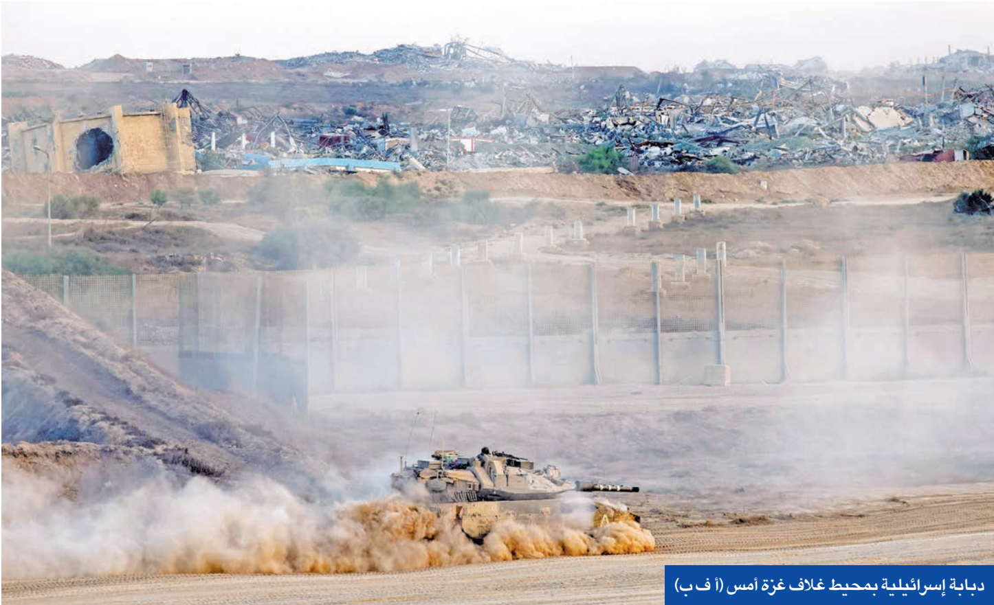
دبابة إسرائيلية بمحيط غلاف غزة أمس

ماكرون المؤيدة للفلسطينيين والمطالبة بالاعتراف بدولتهم من شأنها أن «تقوض استقرار المنطقة وتدفع نحو خطوات أحادية الجانب، زاعماً أن ماكرون «لا يعترض» على ما سناه ب نظام الدفع مقابل القتل».