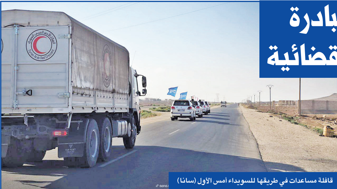
قافلة مساعدات في طريقها للسويداء أمس الأول

ل لإدارة الذاتية، أمس، إحباط عملية هروب نفذها أفراد عائلات تنظيم داعش وعددهم 56 شخصاً، باستخدام مركبة كبيرة، نفذت إدارة مكافحة المخدرات السورية والاستخبارات التركية، عملية ضبط كمية من المخدرات في ريف دمشق، لأول مرة، شملت 500 كغ من المواد الأولية المخصصة لصناعة المخدرات، وكمية كبيرة من حبوب الكبتاغون في منطقة ينفور.