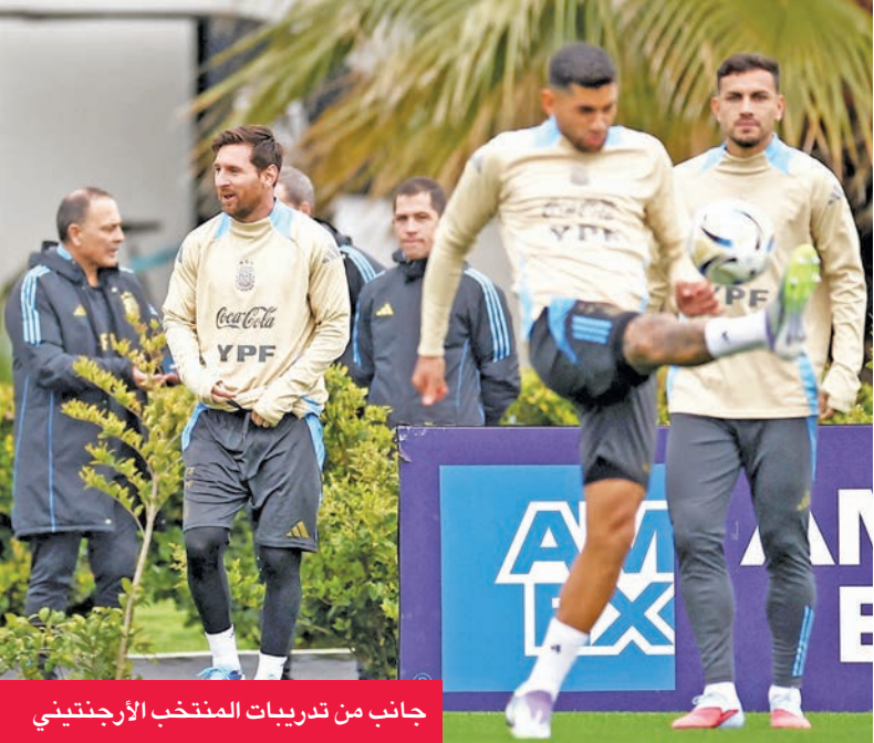
جانب من تدريبات المنتخب الأرجنتيني

تستعد منتخبات أميركا الجنوبية لخوض جولتين حاسمتين في صراع التاهل لنهائيات كأس العالم 2026 لكرة القدم، التي تستضيفها الولايات المتحدة والمكسيك وكندا.