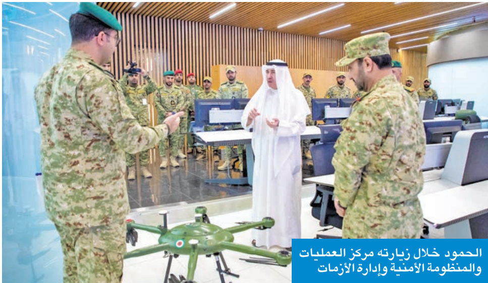
الحمود خلال زيارته مركز العمليات والمنظومة الأمنية وإدارة الأزمات

شدد رئيس الحرس الوطني، الشيخ مبارك الحمود، على الحفاظ على جاهزية الحرس الوطني لتأدية دوره في حفظ أمن وأمان البلاد بكل كفاءة وأقترار في ظل قيادته الرشيدة. جاء ذلك خلال زيارته لمركز العمليات والمنظومة الأمنية وإدارة الأزمات بالرئاسة العامة للحرس الوطني. وقال الحمود، في بيان، إن الحمود أشاد خلال الزيارة بجهود القائمين على المركز وقدرتهم على تنفيذ المهام الموكلة إليهم. وأضاف أن الحمود استمع خلال الزيارة إلى إيجاز من رئيس فرع العمليات العميد الركن غازي سرحان، ورئيس فرع الأنظمة الأمنية، العقيد المهندس أحمد علي، حول مركز العمليات ومهامه في الارتقاء بعمليات تأمين مواقع الحرس الوطني والمنشآت الحيوية التي يتولى الحرس حمايتها والدور المهم لمركز العمليات الرئيسي في تعزيز جهود إسناد أجهزة الدولة عبر الربط الآلي مع الوزارات والمؤسسات. وأشار إلى أن رئيس الحرس الوطني قام كذلك بجولة في أقسام المركز وتفقّد أنظمة المراقبة ومركز التحكم الرئيسي.