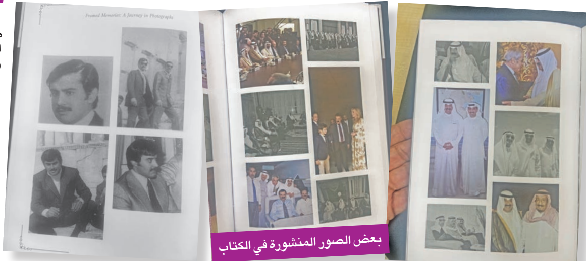
بعض الصور المنشورة في الكتاب

ويستعرض الإصدار مسيرة الراحل الطويلة، يقول: «في كل جيل، يولد رجال قلائل لا يكتنون التاريخ بالكلمات، بل