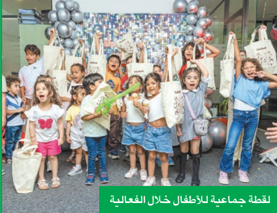
لقطة جماعية للأطفال خلال الفعالية

التفاعلية. مثل هذه المبادرات تجسّد ثقافة «طلبات» التي تدرك أنّ الحياة خارج العمل أهمية موازية لما هو داخل العمل، وأن الاحتفاء بها معًا يثري تجربتنا المهنية. تخلّل اليوم العديد من الفعاليات الترفيهية وورش العمل والألعاب والجلسات التفاعلية، التي أفسحت المجال أمام الأطفال للتعرف عن قرب على طبيعة عمل أولياء أمورهم، كما شمل البرنامج أنشطة مخصصة لبناء روح الفريق، عززت أواصر التعاون والانسجام بين الموظفين وأسهمت في ترسيخ الروابط داخل عائلة «طلبات».