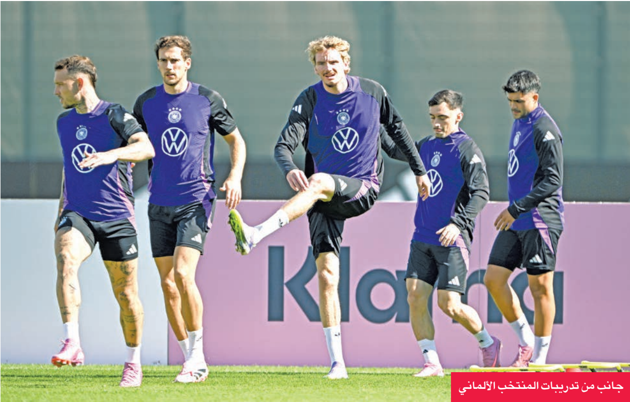
جانب من تدريبات المنتخب الألماني

يستهل المنتخب الإسباني مشواره في التصنيفات المؤهلة لنهائيات كأس العالم وأمم أوروبا اليوم، بمواجهة بلغاريا ضمن منافسات المجموعة الخامسة.