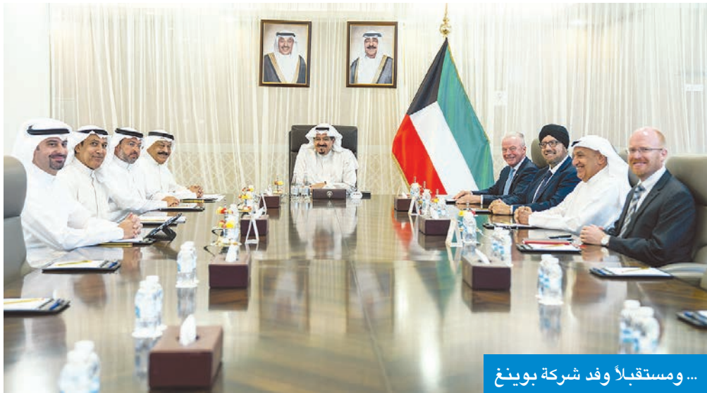
... ومستقبلاً وفد شركة بوينغ