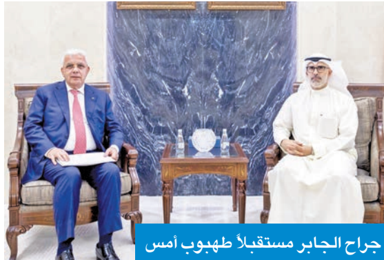
جراح الجابر مستقبلاً طهوب أمس

استقبل نائب وزير الخارجية السفير الشيخ جراح الجابر، أمس، سفير فلسطين لدى الكويت رامي طهوب، حيث تم بحث العلاقات الثنائية بالإضافة إلى تطورات الأحداث في الأراضي الفلسطينية المحتلة.