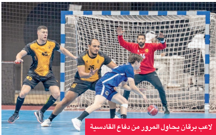
لاعب برقان يحاول المرور من دفاع القادسية