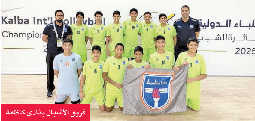
فريق الأشبال بنادي كاظمة

حقق فريق الكرة الطائرة للأشبال بنادي كاظمة المركز الثالث في بطولة كلباء الدولية التي اختتمت أخيراً في الإمارات وسط مشاركة واسعة من أندية خليجية بارزة، منها نادي دار كلب البحرين ونادي الهلال السعودي وفريق كلباء الإماراتي المستضيف.