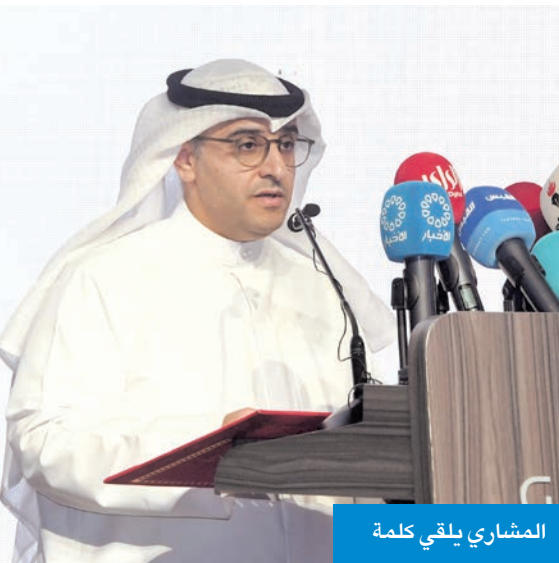
المشاري يلقي كلمة

مشاريع صروح وهي تهدف لتنمية مستدامة ومن اهم التحديات الخاصة بالتنمية العقارية في سلطنة عُمان التي نواجهها ندرة الأراضي المخططة المجهزة ارتفاع تكاليف تطوير البنية التحتية ومن ثم الطلب المتزايد على الإسكان الميسر والتحديات البيئية والمناخية. وأضاف مرهون أننا وفرنا حلاً مقترحاً لهذه التحديات وهي توسع حضري واستثمار وتخصيص أراضٍ ومشاريع البنية التحتية، وموضحاً أن مشروع صروح عبارة عن حي سكني متكامل قوي ومتناسك والمرافق عالية ويوفر اقتصاد محلي وفرص عمل.