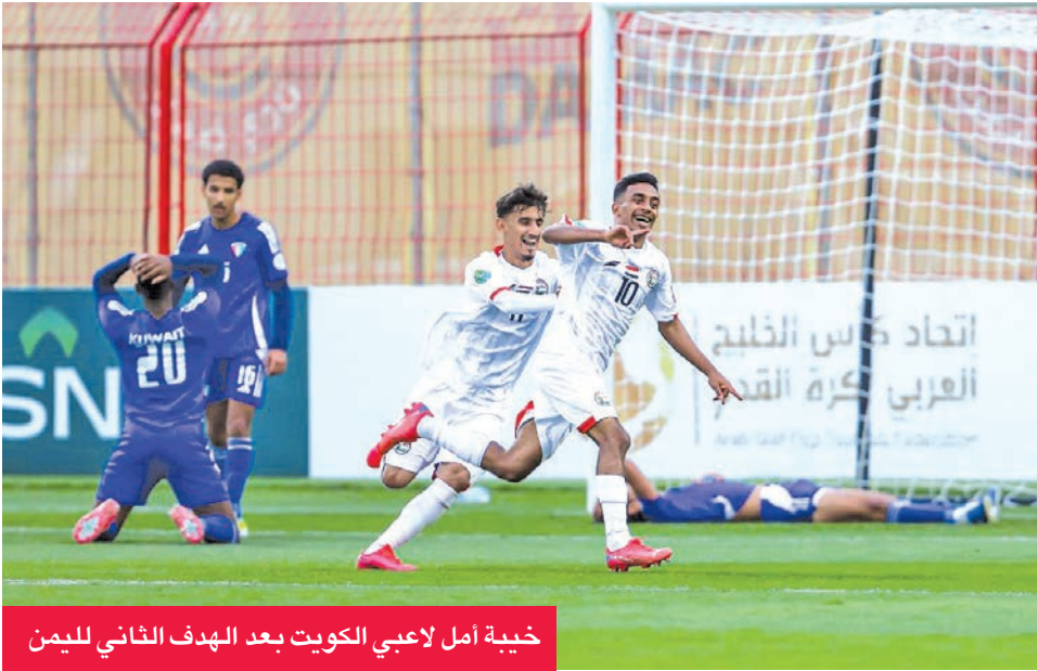
خيبة أمل لاعبي الكويت بعد الهدف الثاني لليمن

خسر أمام اليمن 2-0 في الجولة الثالثة للبطولة