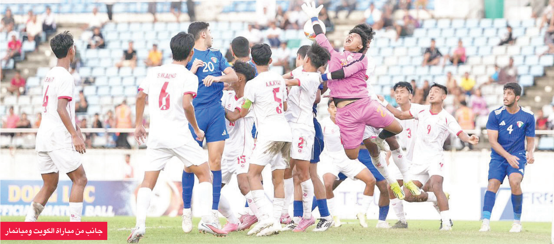
جانب من مباراة الكويت وميانمار

اليابان هزم أفغانستان في منافسات المجموعة الثانية