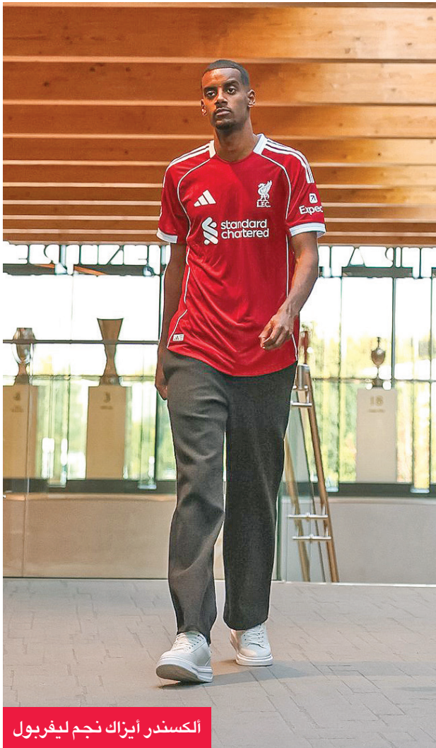
الكسندر إيزاك نجم ليفربول