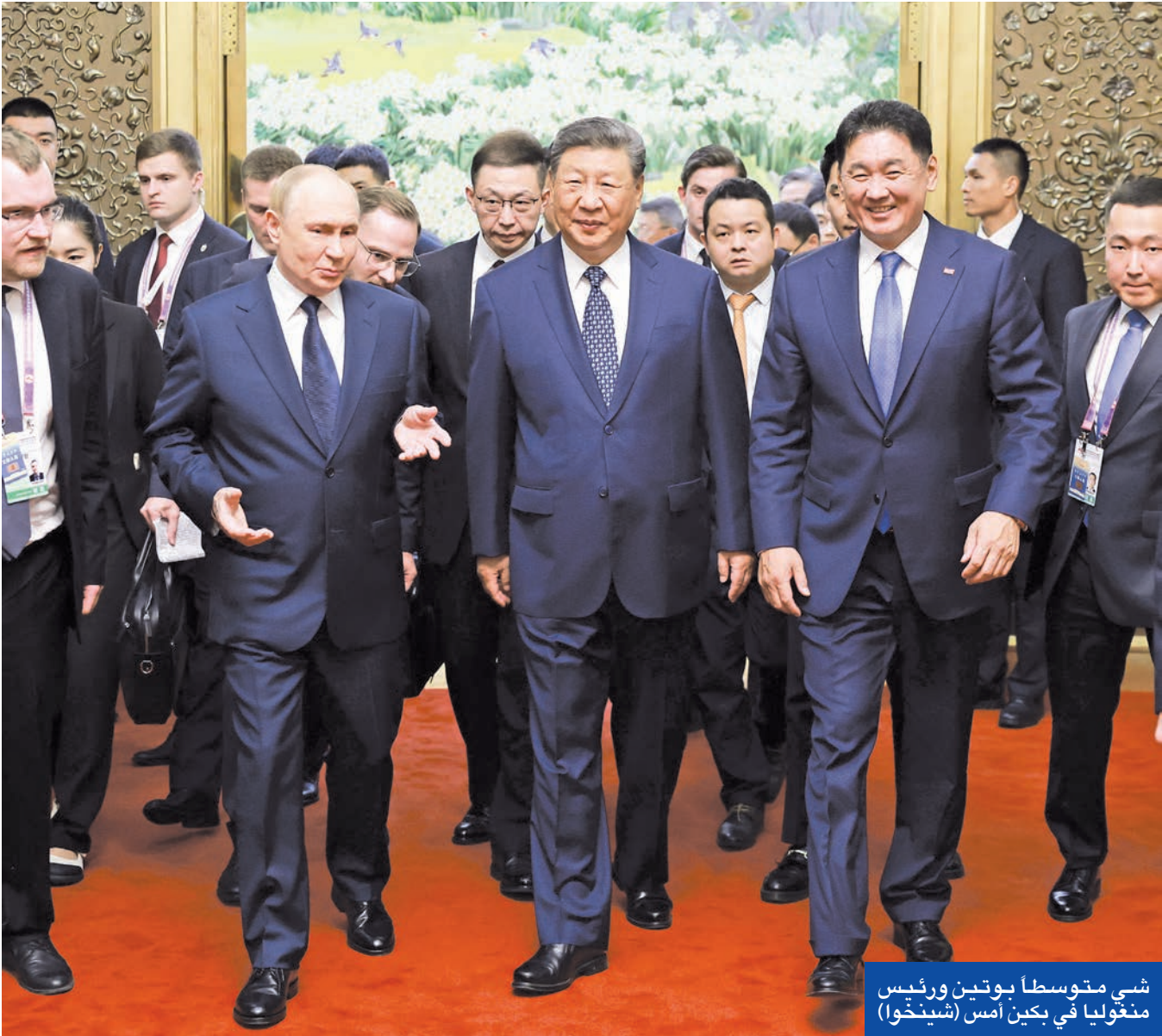
شي متوسطا بوتين ورئيس منغوليا في بكين أمس

في وقت يحاول الرئيس الأمريكي دونالد ترامب إبعاد روسيا عن الصين، بعد أن وصف، بعد قليل من لقائه النادر مع الرئيس الروسي فلاديمير بوتين في الأسكا، الشهر الماضي، البلدين الجارين بأنهما «عدوان طبيعيان»، تعهد الرئيس الصيني شي جينبينغ و«الصديق القديم» بوتين، خلال لقائهما في بكين أمس، بتعزيز الشراكة والتنسيق بين بلديهما، في وقت تشهد العاصمة الصينية استعراضاً عسكرياً ضخماً في ذكرى الانتصار بالحرب العالمية الثانية، يرى خبراء أن هدفه إظهار الصين كقوة عظمى على المستوى العسكري، كما هي قوة عظمى معترف بها على المستوى الاقتصادي.