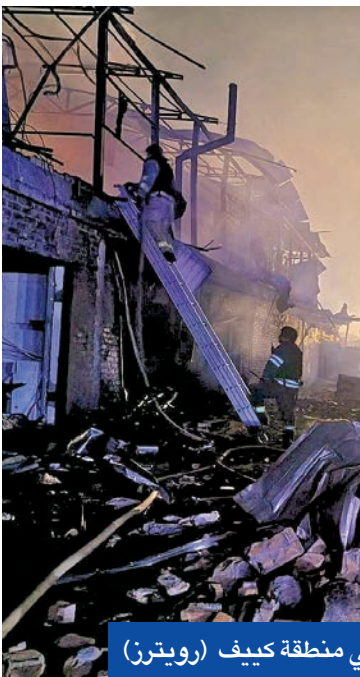
عمال إغاثة في موقع استهدفته مسمّرات روسية في منطقة كييف

توقع رئيس الوزراء الإثيوبي أبي أحمد أن يوفر سدّ النهضة، الذي أنشأته حكومته على النيل الأزرق، والمقرر تشغيله الشهر الجاري، إيرادات قدرها مليار دولار سنوياً، في وقت عاد التوتر بين أديس أبابا ومقديشو بشأن الدعم العسكري المصري للصومال. وقال أحمد في لقاء متلفز بُثّ ليل الاثنين، الثلاثاء بمناسبة اقتراب موعد تشغيل السد: «هذه المشاريع ستستثمرها في مشاريع أخرى»، موضحاً أن أديس أبابا تعزّم إقامة «مشاريع أخرى مثل مشروع سدّ النهضة الكبير خلال السنوات الخمس أو العشر أو الـ 15 المقبلة». وأضاف أن «الكثير من أصدقاءنا ناقشوا، حذروا، وهدّدوا» إثيوبيا لمنع تشغيل السد، مشدداً على «رغبة بلاده في ألا يسبب سدّ السد قلقاً أو مخاوف» لدى القاهرة والخرطوم. إلى ذلك، واصلت