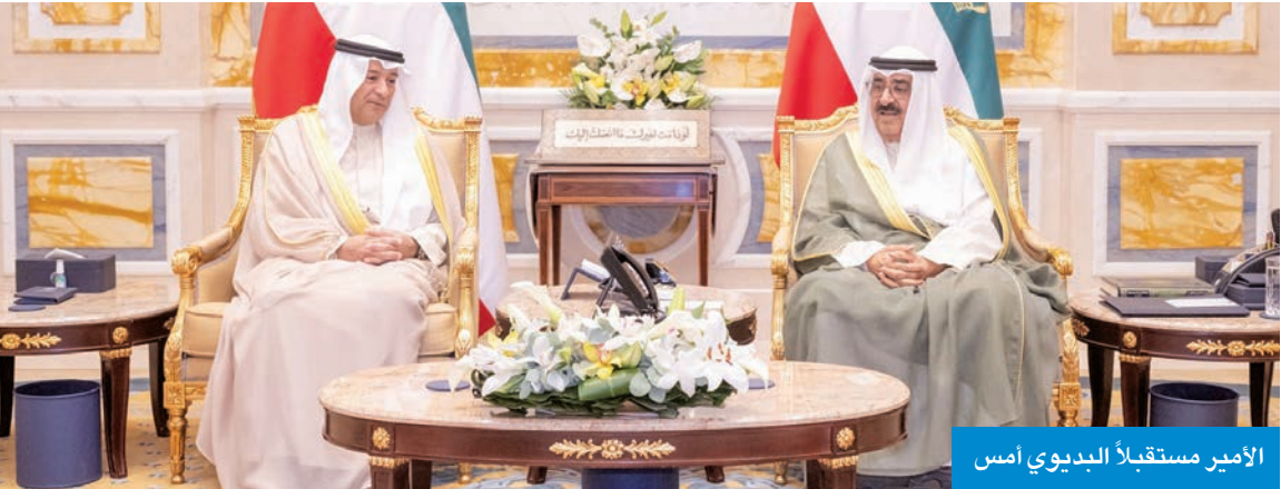
الأمير مستقبلاً البديوي أمس

استقبل سمو أمير البلاد الشيخ مشعل الأحمد، بقصر بيان صباح أمس، الأمين العام لمجلس التعاون جاسم البديوي. كما استقبل سمو ولي العهد الشيخ صباح الخالد، بقصر بيان، البديوي، بحضور رئيس ديوان سمو ولي العهد، الشيخ ثامر الجابر. من جهة أخرى، بعث صاحب السمو ببرقية تهنئة إلى الرئيس البديوي، بحضور رئيس ديوان سموه عن خالص تهانيه بمناسبة ذكرى استقلال بلاده. وتمنى سموه له موفقو الصحة والعافية ولفيتنام وشعبها الصديق كل التقدم والازدهار. كما بعث سمو ولي العهد الشيخ صباح الخالد ببرقية تهنئة إلى رئيس فيتنام، ضمنها سموه خالص تهانيه بمناسبة ذكرى استقلال بلاده، متمنيا سموه له موفقو الصحة والعافية ولفيتنام وشعبها الصديق كل التقدم والنماء. وبعث رئيس مجلس الوزراء سمو الشيخ أحمد عبدالله ببرقية تهنئة مماثلة.