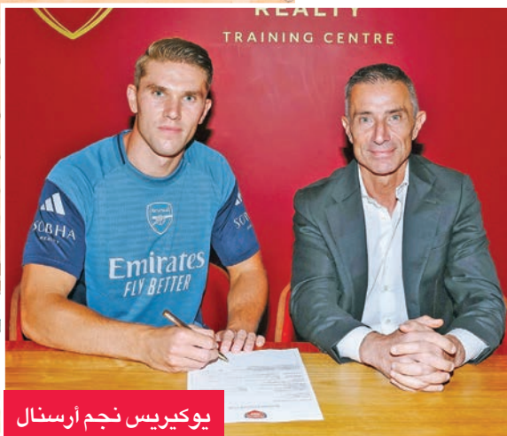
يوكيريس نجم أرسنال