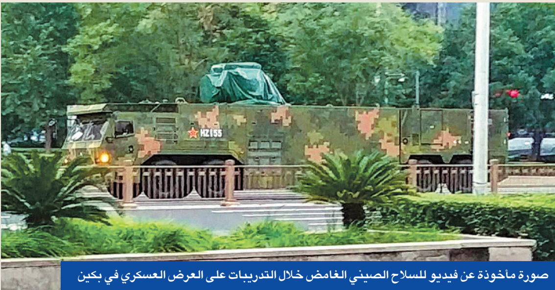
صورة مأخوذة عن فيديو للسلاح الصيني الغامض خلال التدريبات على العرض العسكري في بكين

بقوة 60 كيلوواط زُكَب على المدمرة «يو إس إس بريديل» عام 2022 يعمل بحسب التقارير بثلت طاقته فقط، ولم تُثبت في القتال. فيما تَحَلَّى سلاح الجو كلياً عن مشروع تزويد مقاتلة تكتيكية بليزر لاعترض صواريخ كروز. لكن الاتجاه العام واضح، وفق جاريد كيلر، كاتب نشرة «حروب الليزر»، إذ يقول: «أعتقد أننا نقرب من نقطة تحول، ليس فقط لأن التكنولوجيا تطورت، بل أيضاً لأن العوامل المساندة، مثل مصادر الطاقة، تحسنت». وتقرب عدة شركات إلى جانب وزارة الدفاع الأميركية من إنتاج مولدات متنقلة تمكّن من تشغيل الليزر ضمن مفهوم «أطلق وتحرك». ويعتقد أن النظام الصيني الذي سيجوب سوارع بكين هو OW5-A10 بقوة 10 كيلوواط، وهو ليزر مثبت على شاحنة يُقال إنه قادر على اعتراض أسراب المسمّرات.