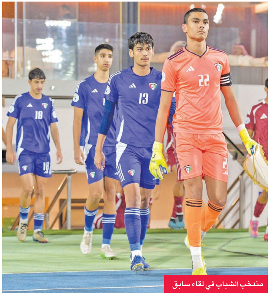
منتخب الشباب في لقاء سابق

يدخل منتخب الكويت اللقاء تحت شعار «الفرصة الأخيرة»، بعد أن تعادل في أول جولتين أمام قطر (2-2) والسعودية (1-1)، ليحتل المركز الثالث في المجموعة برصيد نقطتين. ويحتاج الأزرق إلى الفوز فقط لضمان