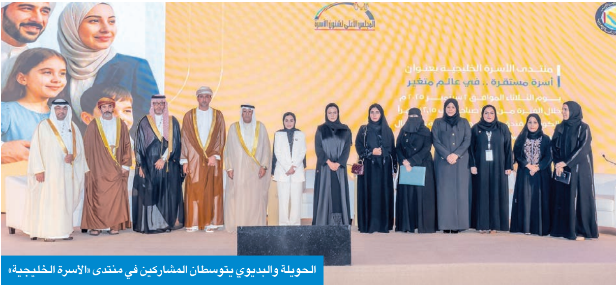
الحويلة والبيديوي يتوسطان المشاركين في منتدى «الأسرة الخليجية»

وزيرة الشؤون أكدت خلال منتدى «الأسرة الخليجية» وجود آليات لإيواء ضحايا العنف الأسري «العمل الخليجي المشترك ليس خياراً بل التزام ومسؤولية... وما يجمعنا أكبر من الحدود والمسافات»