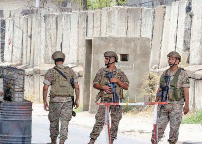
جنود لبنانيون أمام مدخل مخيم فلسطيني للاجئين

يزداد المشهد اللبناني ضبابية مع اقتراب جلسة مجلس الوزراء المرتقبة يوم الجمعة، والخصخصة لبحث بند وحيد يتمثل في تطبيق حصرية السلاح بيد الدولة، عبر خطة الجيش اللبناني واليثة التنفيذية. وتوجه الأنظار إلى ما ستفضي إليه الجلسة، في ظل استمرار المساعي لتفادي مزيد من الانقسام أو الوصول إلى لحظة صدام، خصوصاً أن حزب الله أعلن صراحة أنه لا يعترف بقرارات الحكومة، ما يطرح إشكالية مشاركته في مناقشة هذا البند. ورغم محاولات إدخال بنود جديدة إلى جدول الأعمال لضمان حضور الوزراء الشيعية، لم يتم التوصل حتى الآن إلى اتفاق حول توسيع جدول الأعمال. وبحسب معلومات متداولة، فإن قرار الثنائي الشيعي بالمشاركة لم يُحسم بعد، في وقت يتربق موقف الحكومة: هل ستكتفي بالإطلاع على خطة الجيش، أم ستصمر على اتخاذ قرار بالبدء في تنفيذها؟ الاتصالات الجارية على