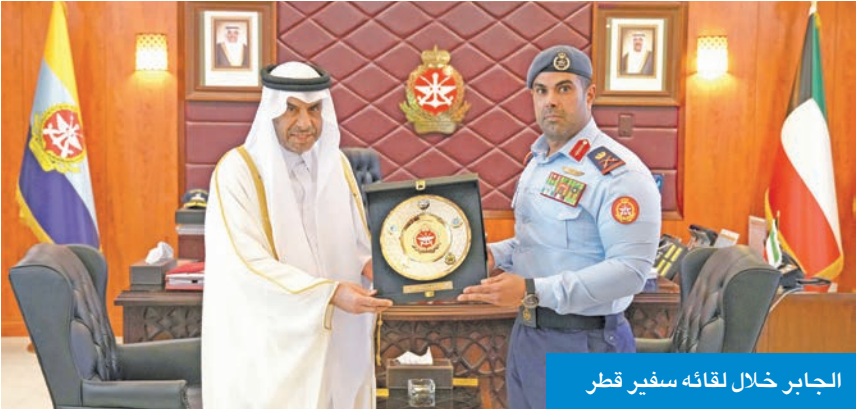
الجابر خلال لقائه سفير قطر