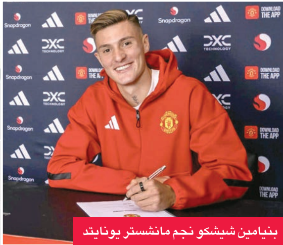
بنيامين شيشكو نجم مانشستر يونايتد

أموريم تحسين مردود هجومه المتمثر، بعد أن ضم أيضا المهاجمين الكامبروني براين مومو والبرازيلي ماتيو س كونيّا في صفقات بلغت قيمتها 200 مليون جنيه.