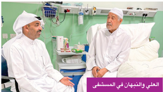
العلي والنبهان في المستشفى