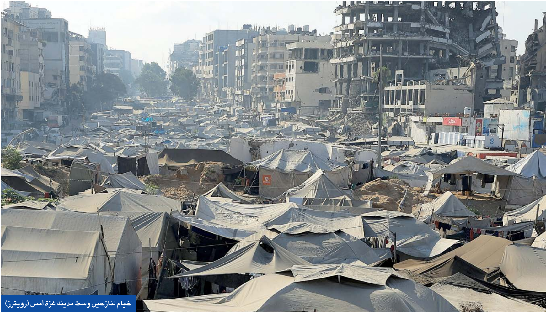
خيام لنازحين وسط مدينة غزة أمس

● ترامب: إسرائيل تنتصر بالقتال لكنها تخسر بالعلاقات ● بلجيكا تنضم لمبادرة الاعتراف بـ«دولة فلسطين»