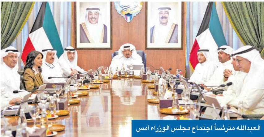
العبدالله مترئساً اجتماع مجلس الوزراء أمس

جاء هذا القرار، بعد أن أحاط العجيل المجلس علماً بصنود قرارات من مجلس إدارة هيئة الصناعة، بسحب وإلغاء تراخيص إدارة 50 قسيمة صناعية وخدمية وحرفية، خلال الأشهر الثلاثة الماضية، مؤكداً أن قرارات السحب استندت إلى مخالفات جسيمة ارتكبتها أصحاب القسائم، حيث إنهم استخدموا تلك القسائم لغير الأغراض التي من أجلها خصصت لهم، وشملت المخالفات ما بين التعدي على أملاك الدولة، والتأجير بالباطن، وممارسة أنشطة دون تراخيص رسمية، وعدم الجدية في تنفيذ المشاريع. وشدد العجيل على أن «الصناعة» ماضية في نهجها الثابت، لحماية أراضي الدولة الصناعية، وأنها لن تتوانى عن اتخاذ الإجراءات القانونية، ضد كل من يثبت تلاعبه أو تجاوزه للضوابط المعمول بها. من جهة، دعا المجلس القائمين على الهيئة إلى مواصلة الجهود في تطبيق القانون والضوابط المعمول بها على جميع المخالفين من أصحاب التراخيص للقسائم الصناعية، بهدف دعم المصانع