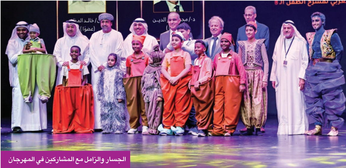
الجسار والزامل مع المشاركين في المهرجان

الجسار: الاستثمار في عقل الطفل هو الأفضل لمستقبل الأمة