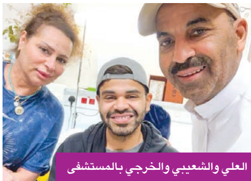
العلي والشعبي والخرجي بالمستشفى