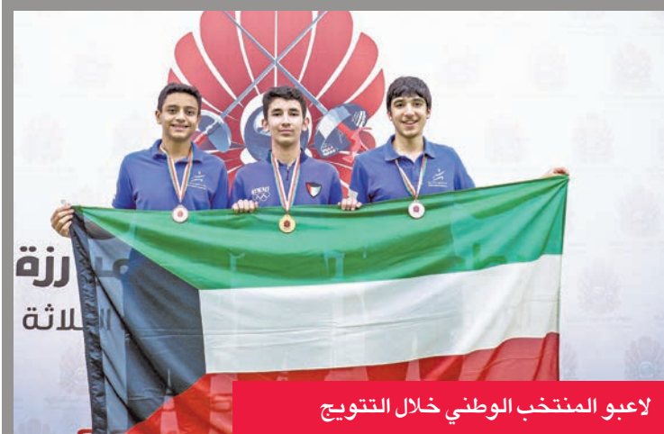
لاعبو المنتخب الوطني خلال التتويج