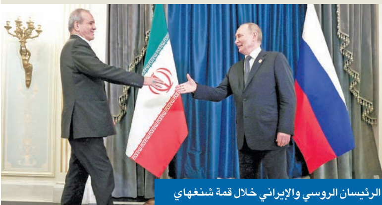
الرئيسان الروسي والإيراني خلال قمة شنتهاي

«لا نقاش حول الجزر الثلاث وستتخذ إجراءات رداً على التدخلات الخليجية»