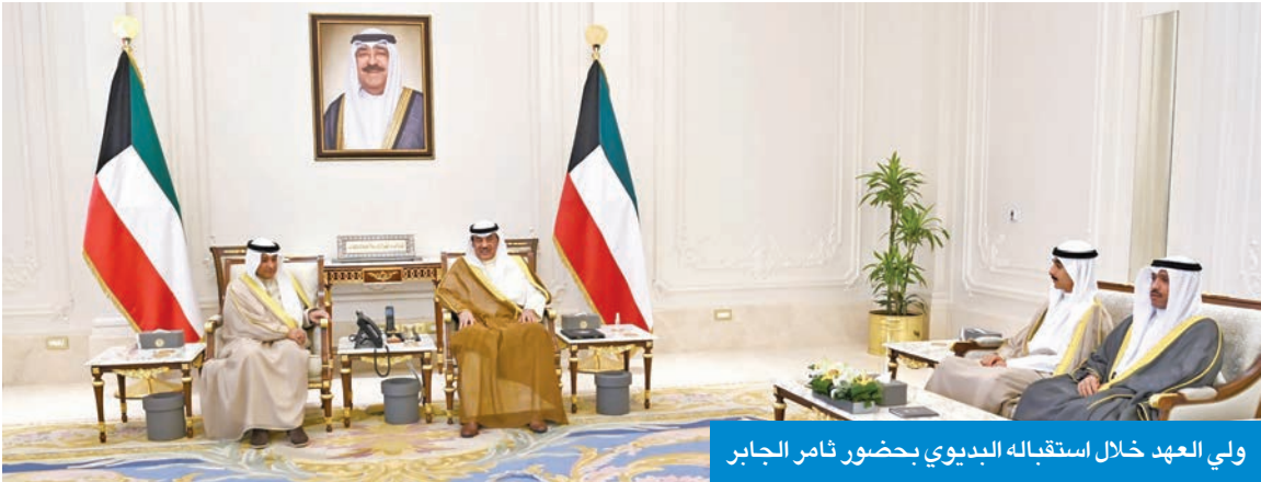
ولي العهد خلال استقباله البديوي بحضور ثامر الجابر