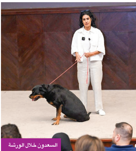
السعدون خلال الورشة

بالتعاون مع المكتبة الوطنية، لاستضافة الورشة، والسماح بدخول الكلاب إلى قاعة التدريب في سابقة هي الأولى من نوعها بالكويت، والتي تكشف بشكل عملي حجم الدعم الذي توجهه المؤسسات الثقافية في الكويت، من أجل زيادة الوعي بين الجمهور، ورفع مستوى ثقافة التعامل مع الحيوانات. وكشفت عن استمرار التعاون مع المكتبة الوطنية في ورش قادمة، نظراً للإقبال الكبير من الجمهور، وحرصهم على التعلم والاستفادة، وإيماناً من المجلس الوطني بأهمية توعية الجمهور وتدريبهم، أو في رحلات خارجية على أرض الواقع، بالتعاون مع جمعية الرفق بالحيوان، بالتركيز على الأطفال والمراهقين، في السلوك الإنساني، لذلك فإن توعية الجمهور بالتعامل