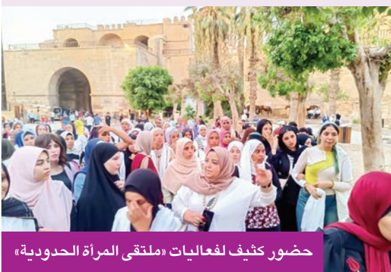
حضور كثيف لفعاليات «ملتقى المرأة الحدودية»