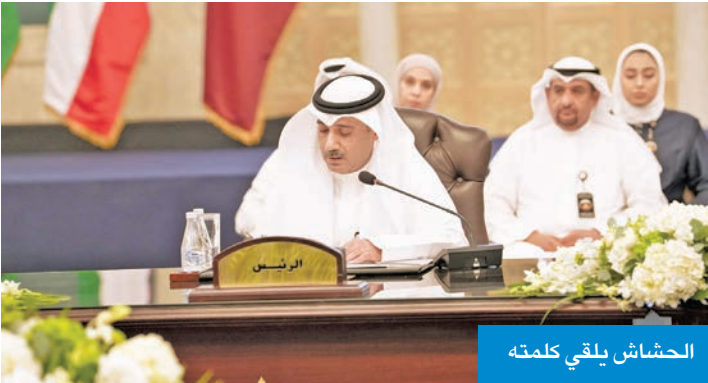
الحشاش يلقي كلمته

لمجلس التعاون، وخصوصاً الأمانة العامة للشؤون الأمنية «على جهودها المستمرة في تيسير وتنسيق أعمالنا». وعبر عن بالغ التقدير والشكر لرؤساء الوفود الخليجية على الجهود على المبدولة لتحقيق التكامل الخليجي في مجالات الحماية المدنية من خلال تقديم