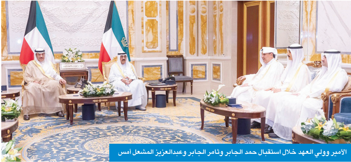
الأمير وولي العهد خلال استقبال حمد الجابر وثامر الجابر وعبد العزيز المشعل أمس

استقبل صاحب السمو أمير البلاد الشيخ مشعل الأحمد، بقصر بيان، صباح أمس، سمو ولي العهد الشيخ صباح الخالد، واستقبل صاحب السمو رئيس مجلس الوزراء سمو الشيخ أحمد العبدالله، ورئيس الحرس الوطني الشيخ مبارك الحمود، والنائب الأول لرئيس مجلس الوزراء ووزير الداخلية الشيخ فهد اليوسف، كما استقبل سموه، الممثل الخاص للأمين العام للأمم المتحدة في العراق رئيس بعثة الأمم المتحدة لمساعدة العراق السفير د. محمد الحسان، وذلك بمناسبة زيارته للبلاد.