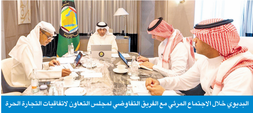
البيديوي خلال الاجتماع المرئي مع الفريق التفاوضي لمجلس التعاون لاتفاقيات التجارة الحرة

بجهود الفريق التفاوضي. وجدد الأمين العام التأكيد على الأهمية البالغة لاتفاقيات التجارة الحرة في دفع مسيرة التكامل الاقتصادي بين دول مجلس التعاون وتوسيع آفاق التعاون مع شركاء المجلس في مختلف المجالات.