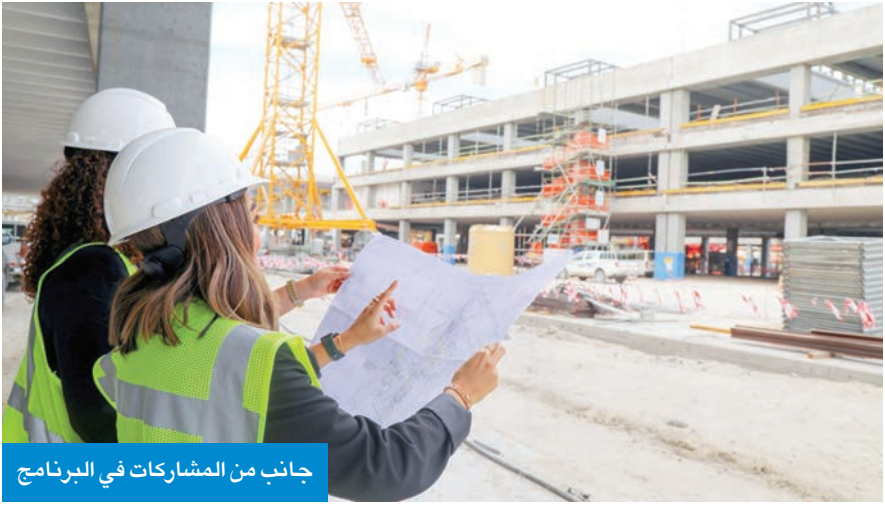
جانب من المشاركات في البرنامج

التمثلة بتلبية احتياجات السوق المحلي من التخصصات الهندسية والعمارية، مما يساهم في تعزيز دور الكفاءات الكويتية في دعم الاقتصاد الوطني، لا سيما القطاع الخاص.