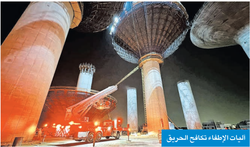
آليات الإطفاء تكافح الحريق

وأوضحت أنه تم فتح تحقيق للوقوف على أسباب الحادث وملايساته، واتخاذ الإجراءات اللازمة، بما يضمن عدم تكرار مثل هذه الحوادث مستقبلا. وتقدمت الوزارة بخالص الشكر والتقدير لقوة الإطفاء العام ووزارة الداخلية على سرعة