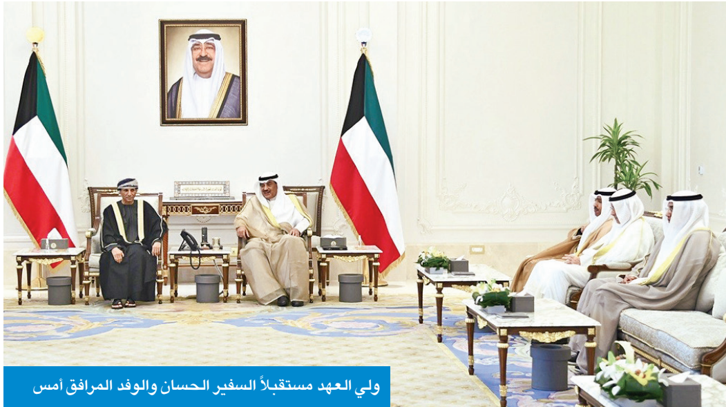
ولي العهد مستقبلاً السفير الحسان والوفد المرافق أمس