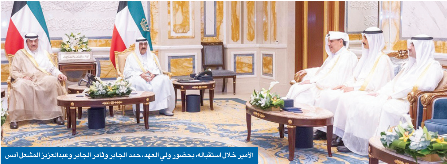
الأمير خلال استقبله، بحضور ولي العهد، حمد الجابر وثامر الجابر وعبدالعزیز المشعل أمس