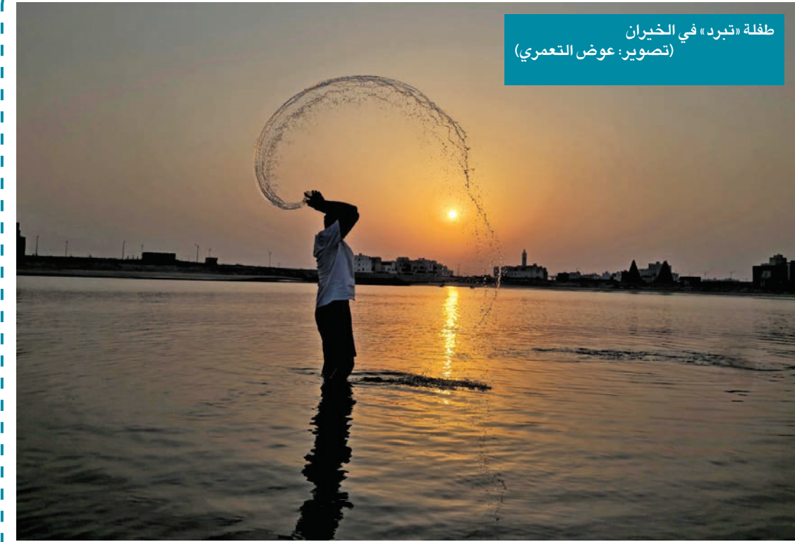
طفلة «تبرد» في الخيران