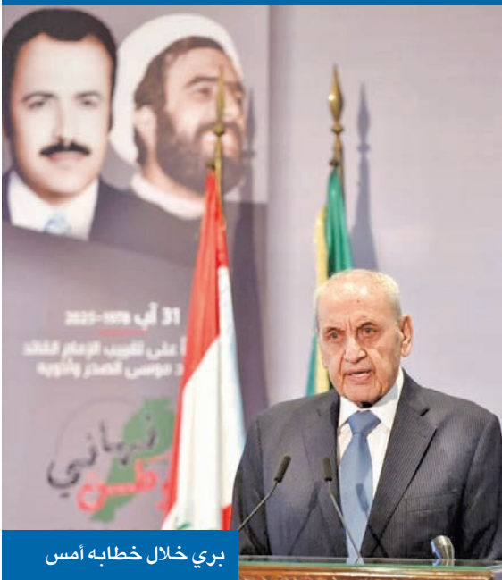
بري خلال خطابه أمس

لبحث خطة الجيش لتنفيذ «حصر السلاح»، قال بري إن ما هو مطروح في ورقة براك «يتجاوز مبدأ حصر السلاح بل وكأنه بديل عن اتفاق نوفمبر لوقف إطلاق النار»، مضيفاً أن «لبنان نغذ ما عليه وما فرضه هذا الاتفاق، بينما أصرت إسرائيل على استمرار إطلاق النار واستباحة السيادة وسلب الإرادة الوطنية، وتصر على عدم الانسحاب من الأراضي المحتلة». وعبر بري عن أسفه لموافقة الحكومة على أهداف الورقة الأميركية، مضيفاً أنه «من غير الجائز وطنياً وبأي وجه من الوجوه رمي كرة النار في حضن الجيش اللبناني، الذي كنا وسنبقى نعتبره درع الوطن وحصنه الحصين». ورغم ذلك، أكد بري «أننا منفتحون لمناقشة مصير السلاح الذي هو عزنا