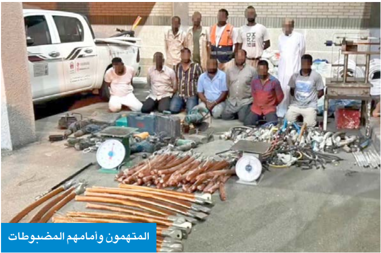
المتهمون وأمامهم المضبوطات

يضم 13 شخصاً... وضبط أكثر من طن «كيابل» بحوزة المتهم الرئيسي