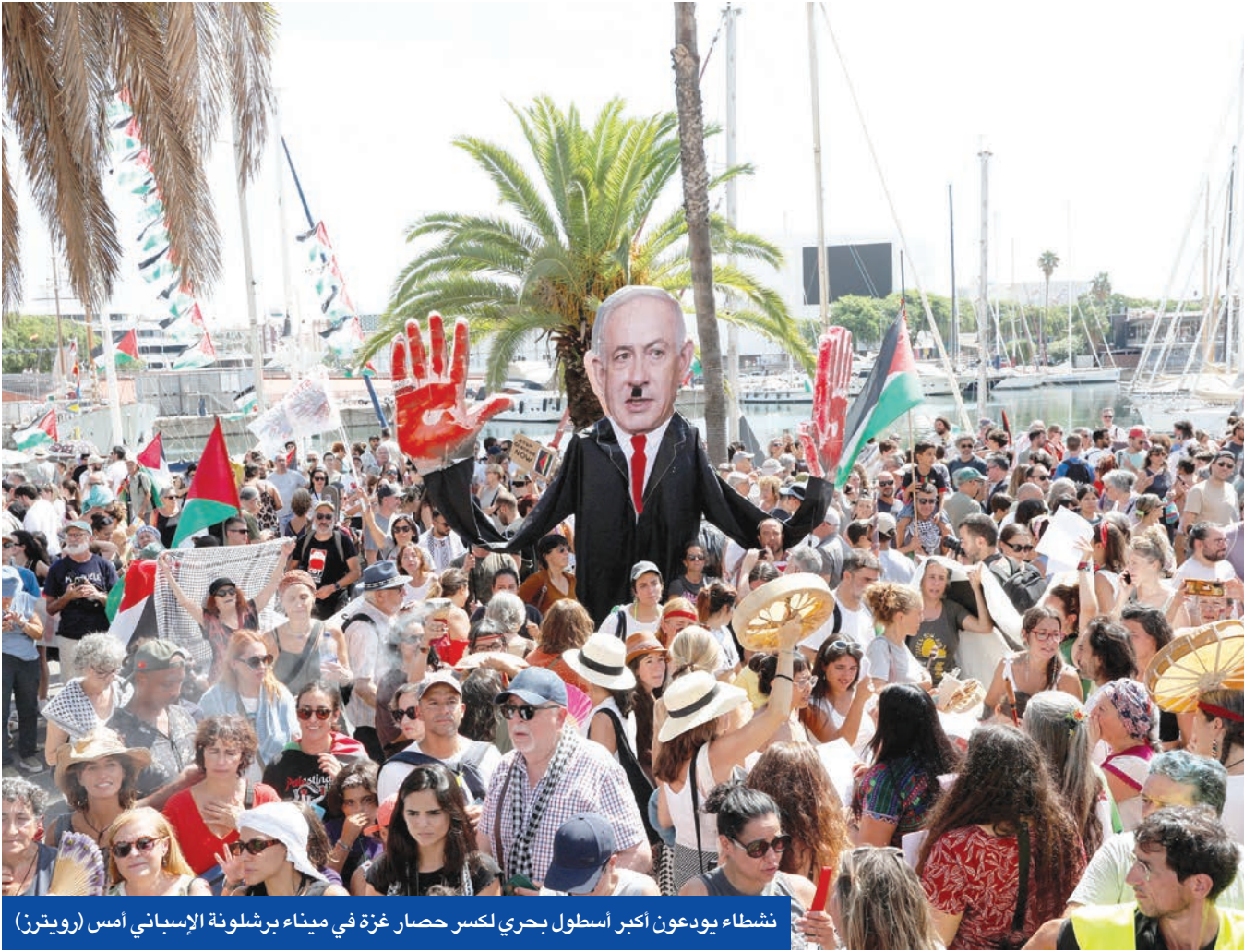
نشطاء يودعون أكبر أسطول بحري لكسر حصار غزة في ميناء برشلونة الإسباني أمس

في غضون ذلك، عقد مجلس الوزراء الإسرائيلي المصغر (الكابينت) اجتماعاً لمناقشة خطة تفصيلية طرحها الجيش للسيطرة على مدينة غزة التي يصفها بأنها آخر معاقل «حماس». ووسط خلافات بشأن مسار الحرب وحسم الموقف من الصفقة التي طرحها الوسطاء لإطلاق سراح نصف المحتجزين الإسرائيليين بالقطاع، ذكرت تقارير عبرية أن رئيس الوزراء بنيامين نتنياهو أصر على مناقشة الخطة العسكرية لاحتلال مركز القطاع فقط دون