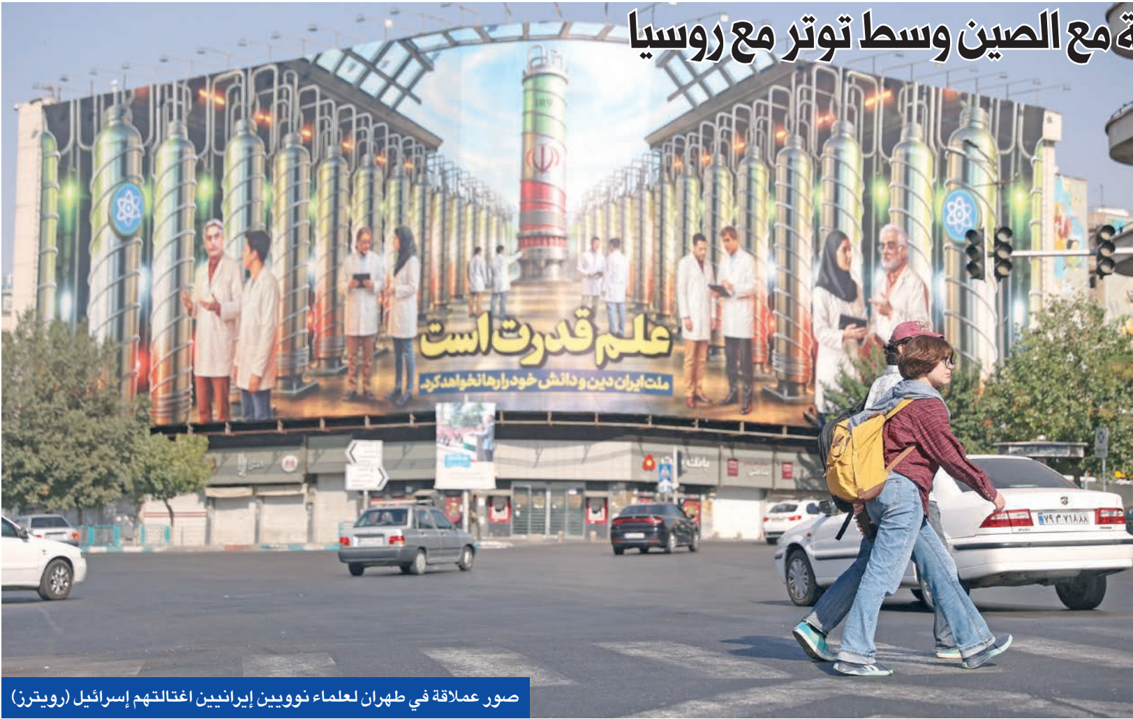
صور عملاقة في طهران لعلماء نوويين إيرانيين اغتالتهم إسرائيل

وصرح 3 مسؤولين إيرانيين كبار وعضو في الحرس الثوري بأن إيران اعتقلت سراً أو وضعت تحت الإقامة الجبرية عشرات الأشخاص من الجيش والمخابرات والأجهزة الحكومية يشتبه في تجسسهم لمصلحة إسرائيل، وبعضهم من ذوي الرتب العالية. وبحسب التقرير، فإن إسرائيل بدأت دراسة اغتيال العلماء والمسؤولين الإيرانيين بدءاً من أكتوبر الماضي، لكنها لم ترغب في الدخول بصدام مع إدارة الرئيس الأميركي السابق جو بايدن. ومنذ نهاية العام الماضي وحتى يونيو، راجع ما أطلقت عليه إسرائيل «فريق التصفية» الخاص بها، ملفات جميع العلماء في المشروع النووي الإيراني المعروفين لدى إسرائيل، ليقرروا من سيوصون بقتله. إلى أن هناك القائمة الأولى 400 اسم، ثم خُفّضت إلى 100، استناداً بشكل رئيسي إلى مواد من أرشيف نووي إيراني سرقة جهاز الاستخبارات الإسرائيلي (الموساد)، من إيران عام 2018.