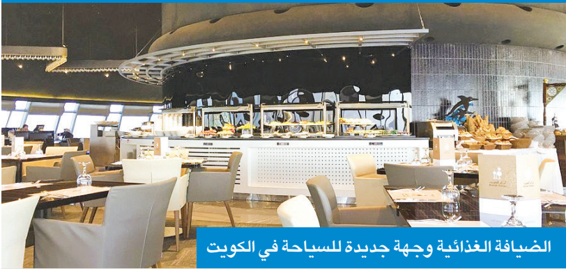
الضيافة الغذائية وجهة جديدة للسياحة في الكويت

بات نقطة ملازمة رئيسة بين الزائر والمشهد المحلي، ومن أبرز التحديات التي يواجهها المدونون، الحفاظ على مصداقية تقيمتاتهم وسط تضخم التعاون التجاري المدفوع. ولهذا السبب أوصى مدونو الأظعمة بضرورة إرساء قواعد مهنية واضحة، مثل الإفصاح الكامل عن أي تعاون تجاري واعتماد معايير موضوعية للتقييم الزّيه والشفاف، وسط توقعات بأن يتعاظم دورهم خلال الفترة المقبلة لدعم منظومة التنمية السياحية والاقتصادية في البلاد.