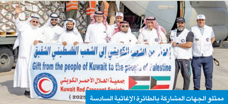
ممثلو الجهات المشاركة بالطائرة الإغاثية السادسة (2025)

دخول ثلاث شاحنات يوم الخميس الماضي، في أولى دفعات المساعدات الكويتية للقطاع عبر معبر «كرم أبو سالم»، مبيّناً أن العمل جارٍ لإدخال المزيد من الشاحنات، لاسيّما وسط الظروف القاسية في القطاع. وأشار إلى أن دخول المساعدات خطوة مهمة نحو فتح الطرق أمام إدخال المزيد من الشاحنات الغذائية العاجلة للإسهام في سد النقص الحاد في المواد الأساسية والتخفيف من معاناة الآلاف من الأسر الفلسطينية.