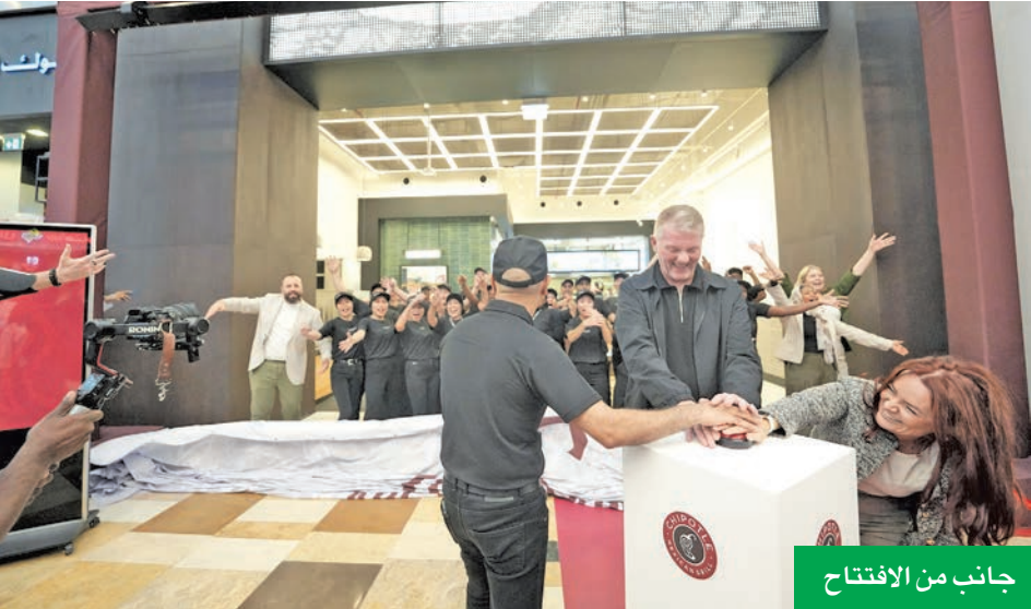
جانب من الافتتاح

أعلنت تشيبوتلي مكسيكان جريل، أمس، افتتاح فرعها الثالث في الإمارات، بالشراكة مع مجموعة الشايح، الشركة الرائدة في إدارة وتشغيل العلامات التجارية العالمية. يقع المطعم الجديد في ياس مول بأبوظبي، ويمتد على مساحة 237.7 متراً مربعاً، ويستقبل ضيوفه من 10:00 صباحاً حتى 11:00 مساءً بالتوقيت المحلي خلال أيام الأسبوع، وحتى 12:00 منتصف الليل في عطلة نهاية الأسبوع. في أبريل من العام الماضي، بدأت «تشيبوتلي» رحلة توسعها في منطقة الشرق الأوسط، بافتتاحها مطعم تشيبوتلي في الأفنيوز، أكبر مركز تسوق في الكويت، حيث كانت المرة الأولى التي تدخل فيها الشركة سوقاً جديداً منذ أكثر من 10 سنوات. ومنذ ذلك الحين، افتتحت مجموعة الشايح ستة مطاعم تشيبوتلي، ثلاثة منها في الكويت، وثلاثة بالإمارات. ومن المقرر افتتاح الفرع السابع في فيلاجيو مول بفطر في سبتمبر، مع خطط لافتتاح فروع إضافية أخرى في الإمارات والكويت بحلول نهاية العام. وبهذه المناسبة، أكد نيت لوتون، رئيس إدارة تطوير الأعمال لدى «تشيبوتلي»: «نحن متحمسون لمواصلة التوسع بدول مجلس التعاون الخليجي، من خلال افتتاح فرعنا الجديد في ياس