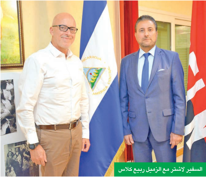
السفير لاشتر مع الزميل ربيع كلاس

العلاقات الخنائية بين الكويت ونيكاراغوا، سواء على المستوى التنموي أو الدبلوماسي أو الاستثماري؟ - مثل هذه المشاريع لا تقتصر آثارها على الجانب التنموي فقط، بل تمتد لتعزيز العلاقات السياسية والدبلوماسية بين بلدينا. فهي تعكس روح التضامن والصداقة، وتفتح آفاقاً أوسع للتعاون في المحافل الدولية. كما أنها تخلق بيئة مشجعة لتعزيز التعاون الاستثماري والاقتصادي، حيث يرى القطاع الخاص في كلا البلدين فرصاً واعدة للتبادل والشراكة. وباختصار، فإن هذه المبادرات تمثل جسوراً حقيقية للتعاون الشامل بين نيكاراغوا والكويت على مختلف المستويات.