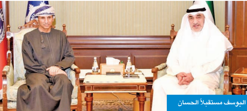
اليوسف مستقبلاً الحسان

أكد النائب الأول لرئيس مجلس الوزراء وزير الداخلية الشيخ فهد اليوسف حرص الكويت على مواصلة التعاون الوثيق مع الأمم المتحدة. جاء ذلك خلال استقباله، أمس، ممثل الأمين العام للأمم المتحدة في العراق رئيس بعثة الأمم المتحدة لمساعدة العراق السفير د. محمد الحسان، في إطار زيارته الرسمية إلى الكويت. وجرى خلال اللقاء بحث أوجه التعاون