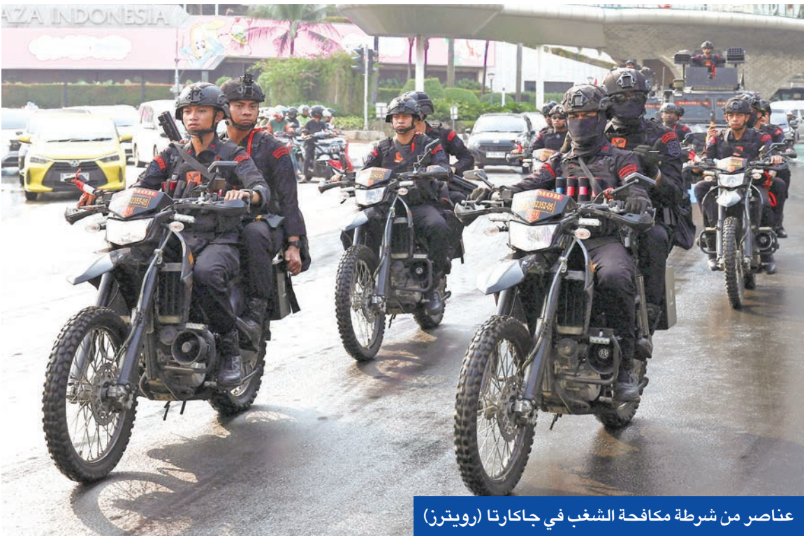
عناصر من شرطة مكافحة الشغب في جاكارتا

شدد رئيس الحكومة العراقية محمد شياع السوداني، أمس الأول، على أن إعادة ترتيب العلاقة مع التحالف الأمريكي لا تعني القطيعة مع المجتمع الدولي، مؤكداً أن ظروف العراق اليوم تختلف عما كانت عليه عام 2014. واعتبر السوداني، خلال تجمع للعشائر في بغداد، أن «اعتماد سيادة القانون وحصر السلاح واحترام مؤسسات الدولة والحفاظ على القرار الوطني ومكافحة الفساد ومسؤوليتنا كانت المحافظة على مصالح العراق والعراقيين وعدم الانزلاق إلى ساحة الحرب». وأضاف: «موقفنا من أحداث المنطقة واضح ومعلن على المستوى السياسي والإعلامي والإغاثي، والعراق كان جزءاً من الحراك مع الدول