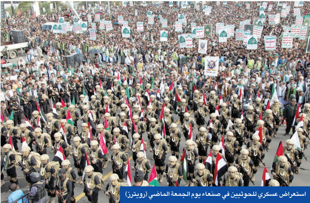
استعراض عسكري للحوثيين في صنعاء يوم الجمعة الماضي

● الحوثي: استهداف إسرائيل بالصواريخ والمسيرات سيستمر ويتصاعد