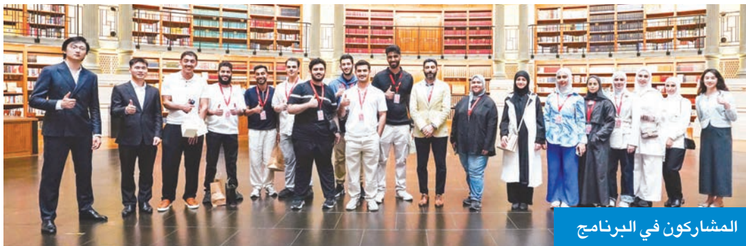
المشاركون في البرنامج

وأكدت أن اختتام هذا البرنامج يمثل محطة استراتيجية في جهودها لبناء منظومة وطنية متكاملة لإعداد قادة المستقبل في مجالات التكنولوجيا، وتعزيز الشراكات مع المؤسسات الرائدة