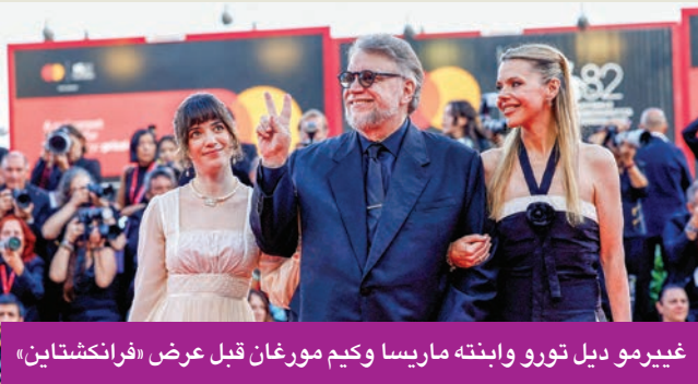
غييرمو ديل تورو وابنته ماريسا وكيم مورغان قبل عرض «فرانكشتاين»

الفيلم يركز على الإنسانية والانتقام والإرادة الجامحة وعواقب الغطرسة