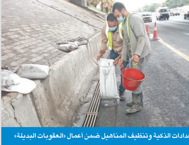
تركيب العدادات الذكية وتنظيف المناهيل ضمن أعمال «العقوبات البديلة»

المشاركة في تنظيم المقابر وإدارة شؤون الجنائز وإزالة مخلفات الطرق