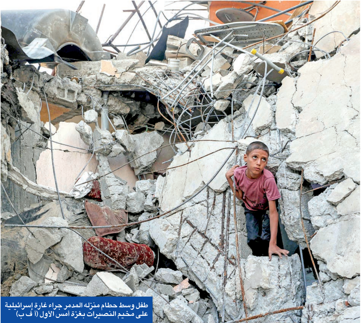
طفل وسط حطام منزله المدمر جراء غارة إسرائيلية على مخيم النصيرات بغزة أمس الأول

وغداة إعلان الجيش أن «مدينة غزة ستصبح منطقة قتال خطيرة»، مع شروعه في تكثيف هجومه لتنفيذ خطة احتلالها بالكامل، أقر الجيش بتعرض مشارف المدينة المكتظة بـ 1.2 مليون نسمة، بعد ساعات من نفي متحدته الإعلامية وقوع أي عمليات بالمنطقة. وتحذرت تقارير عن هجوم مركب نفذته عناصر «كتائب القسام»، بعد أن تمكن مقاومون من الوصول إلى مناطق تتركز فيها القوات الإسرائيلية داخل حي الزيتون، عبر فتحات أنفاق تسللوا منها إلى المنطقة، وفاجأوا تلك القوات بإطلاق النار تجاهها، وتفجير عبوات، وعبوات ناسفة زرع بعضها سابقاً في إطار التجهيز للعملية، والتي لم تكشفها