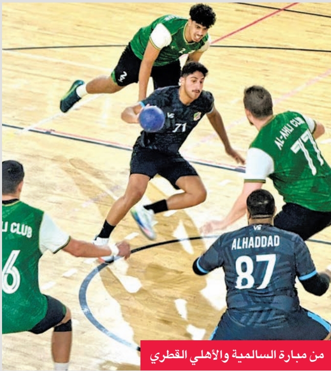
من مباراة السالمة والأهلي القطري