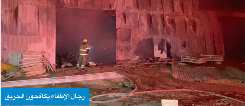
رجال الإطفاء يكافحون الحريق

سيطرت قوة الإطفاء العام، مساء أمس الأول، على حريق مخزن في مزرعة بمنطقة الخويسات. وقالت القوة، في بيان، إن فرق إطفاء مراكز الجهراء وكاظمة انتقلت إلى موقع الحادث على الفور، بعد تلقي بلاغ يفيد باندلاع حريق في مزرعة بمنطقة الخويسات، وأشارت إلى أنه تمت مكافحة الحريق والسيطرة عليه دون وقوع أي إصابات.