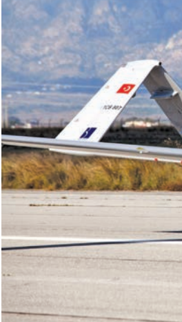
طائرات «بيرقدار» المسيّرة

هدفنا دائماً هو تمكين شركائنا من خلال مشاركة المعرفة وتعزيز الاعتماد على الذات.