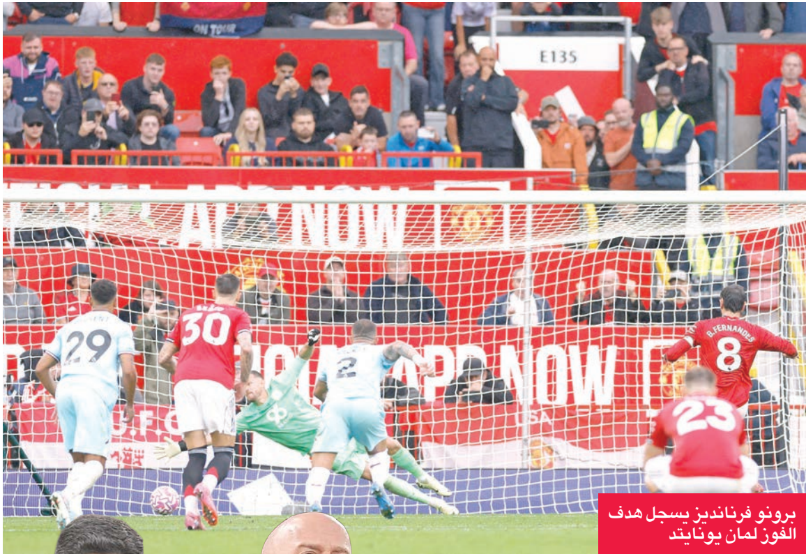
برونو فرنانديز يسجل هدف الفوز لمان يونايتد