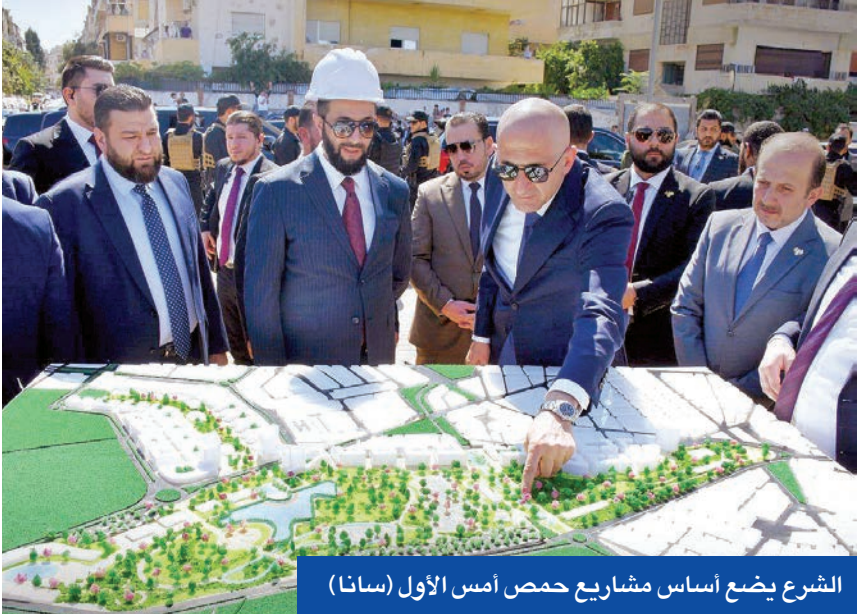
الشرع يضع أساس مشاريع حمص أمس الأول

وكانت الشرطة الإيرانية أعلنت الشهر الماضي اعتقال 21 ألف شخص خلال الحرب مع إسرائيل، التي شهدت قصفاً إسرائيلياً لاستهداف مواقع عسكرية وبنووية ومدنية، مما أدى إلى مقتل أكثر من 1000 شخص بينهم عدد من كبار القادة العسكريين والعلماء النوويين الإيرانيين.