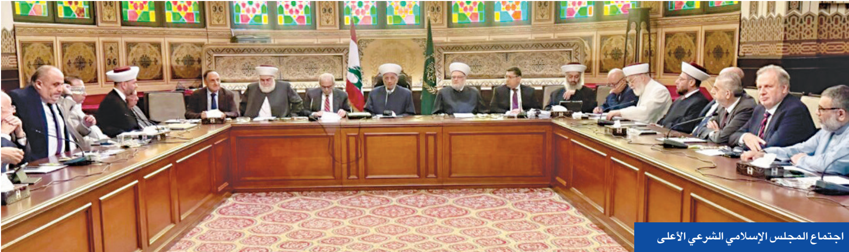
اجتماع المجلس الإسلامي الشرعي الأعلى

يتربق لبنان؛ الذي وصل إلى نقطة سياسية حرجية، اليوم، خطاب رئيس مجلس النواب زعيم حركة أمل الشيعية، نبيه بري، في ذكرى تغييب الإمام موسى الصدر، حيث يتوقع أن يصعد ضد المساعي لنزع سلاح «حزب الله».