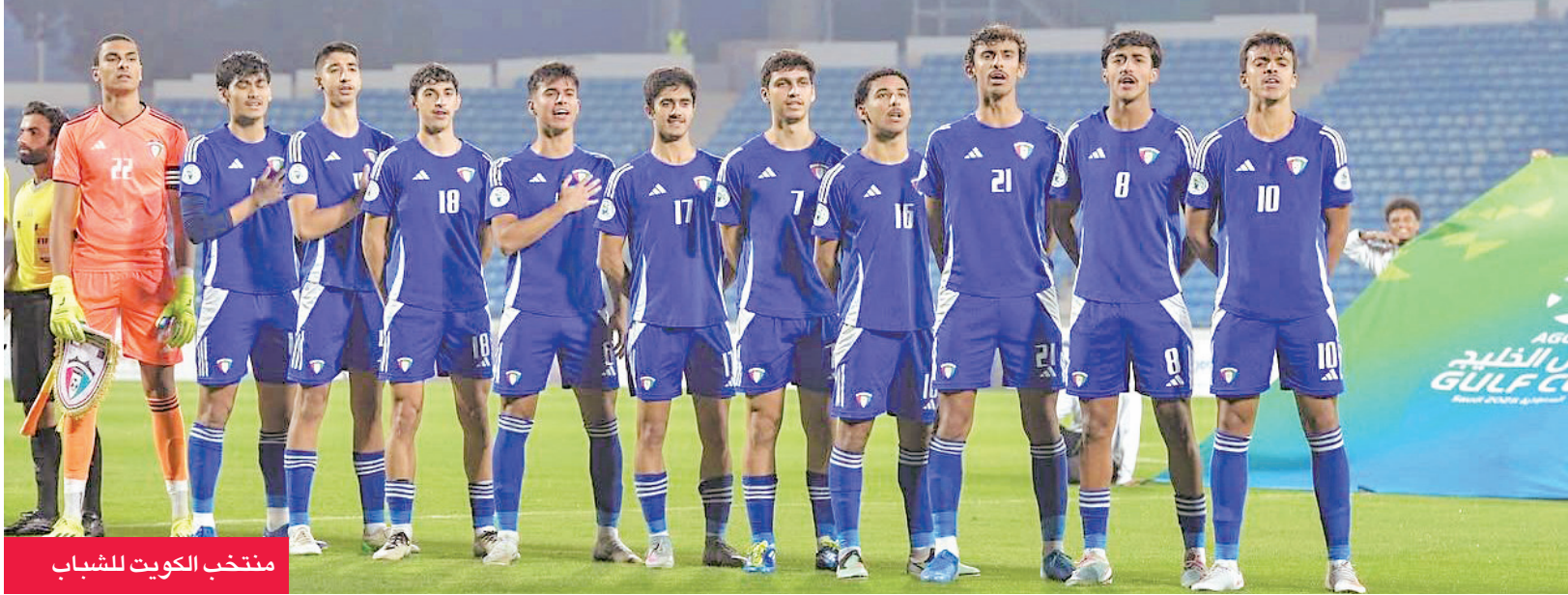
منتخب الكويت للشباب

«المنتخب الأول» يغادر اليوم إلى الدوحة واستدعاء القيسي بعد اعتذار بورسلي