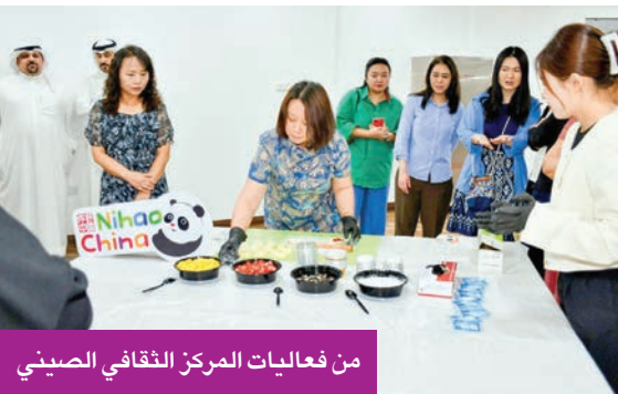
من فعاليات المركز الثقافي الصيني

وتخللت الفعالية ورش عمل تفاعلية اتاحت للمشاركين تجربة صنع حلوى «المونشي» بأنفسهم، تحت إشراف طهاة محترفين. كما شهدت جلسة حوارية عبّر خلالها عدد من الحضور عن تجاربهم وانطباعاتهم تجاه المطبخ الصيني، مما عكس كيف يمكن للطعام أن يشكل جسراً ثقافياً بين الشعوب.