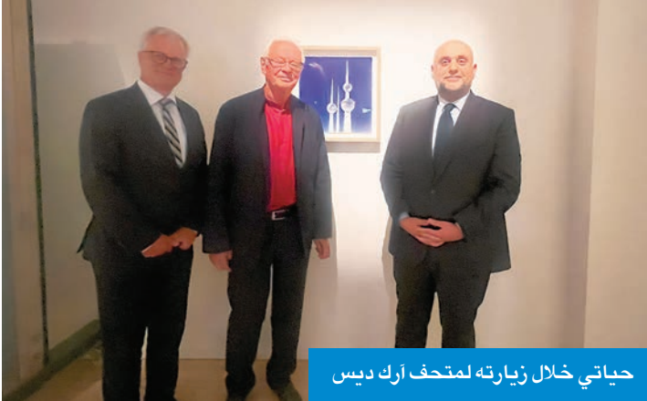
حياتي خلال زيارته لمتحف آرك ديس

شاهد على التعاون المثمر بين الكويت والسويد في ستينيات القرن الماضي وسبعينياته». وشدد على أن الأبراج لا تزال تمثل رمزاً للفن الهندسي المعاصر المستمد من الإرث التاريخي المتماثل لدولة الكويت، الأمر الذي جعله يحظى باعتراف عالمي باعتباره معلماً بارزاً من عمارة الخليج الحديثة. وأشار السفير إلى أن أبراج الكويت ليست فقط المشروع الوحيد الذي