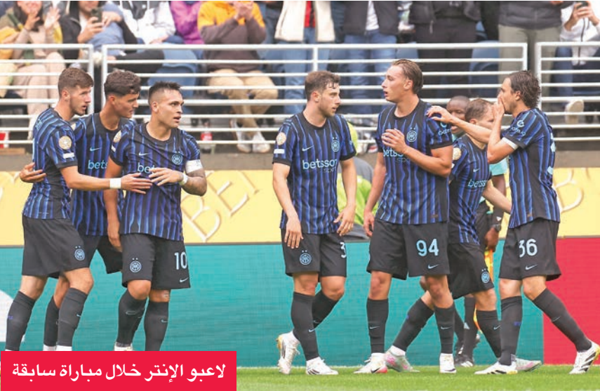
لاعبو الإنتر خلال مباراة سابقة

الأكبر في الانتصار على بارما، من جانب آخر، افتتح ميلان رصيده من الانتصارات بعد فوزه على مضيفه ليتشي بهدفين نظيفين أمس الأول