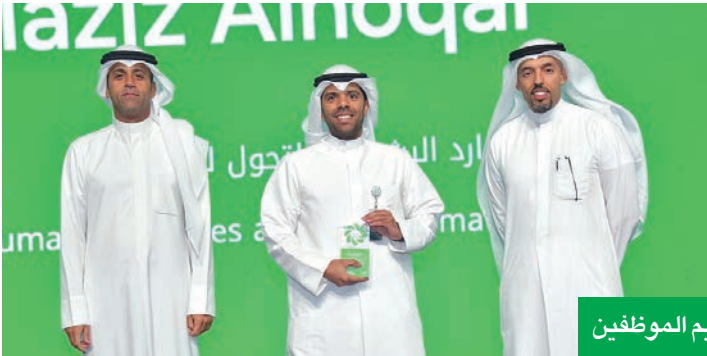
جانب من تكريم الموظفين