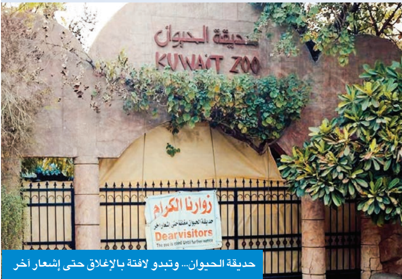
حديقة الحيوان... وتبدو لافتة بالإغلاق حتى إشعار آخر

التخدير، وكذلك صغر حجم معزل العيادة. مصير الحيوانات واكد مصدر في الهيئة العامة لشؤون الزراعة والثروة السمكية استمرار تلقي الحيوانات القاطنة في الحديقة كل سبل الرعاية، وبين أن مصيرها لم يتضح حتى الآن لحين الانتهاء من الإجراءات الكاملة لنقل تبعية موقع الحديقة لوزارة المالية. ولفتت إلى أن الهيئة تنظر لعدة أفكار بشأن مصير الحيوانات، حيث من الممكن أن يتم نقلها إلى الموقع التابع لهيئة الزراعة في الصليبية، والمقام على مشروع «الغابة الصغيرة»، ويستغله أحد المستثمرين، كبديل صغير الحجم ومؤقت، إلى أن يحدد مشروع جديد لحديقة الحيوان إن وجد، بعد استلام موقع بديل من البلدية، لكن إلى الآن لا توجد أي دراسة لإنشاء حديقة جديدة، أو اختيار أرض أو موقع محدد لإنشاء حديقة حيوان بديلة لحديقة العمرية، مضيفة أن الفكرة الأخرى تتمثل في إمكانية الاحتفاظ بالحيوانات في المحاجر الخاصة بهيئة الزراعة، أو تصدير تلك الحيوانات، خاصة المفترسة منها والنادرة، إلى الخارج، وبيعها إلى دول قريبة. كما بين الديوان عدم توفير الاحتياجات اللازمة لتشغيل الحديقة، أبرزها وجود نقص كبير للعماله المتخصصة لتربية الحيوانات، كالزراعة وأكلات اللحوم، وعدم توفير العديد من الأجهزة الطبية لعبادة البيطرة في الحديقة، ومنها جهاز السونار والأشعة العادي والمتنقل، وجهاز تعقيم المعدات ومعدات التشريح والجراحة والتطهير، وأدوات بندقية