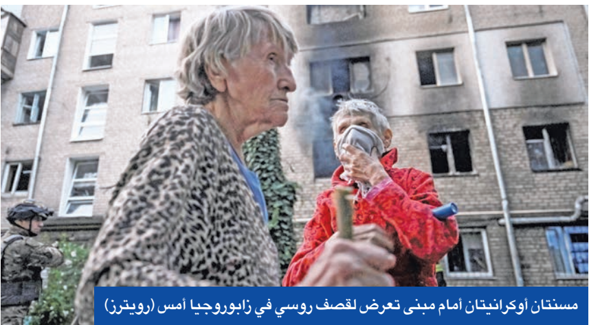
مستنات اوكرانياتان أمام مبنى تعرض لقصف روسي في زابورجيا أمس

وإلى الجنوب، أفاد حاكم منطقة زابوريجيا، إيفان فيدوروف، بوقوع انفجارات، ونشر صورة على «تليغرام» لمنزل محترق في عاصمة