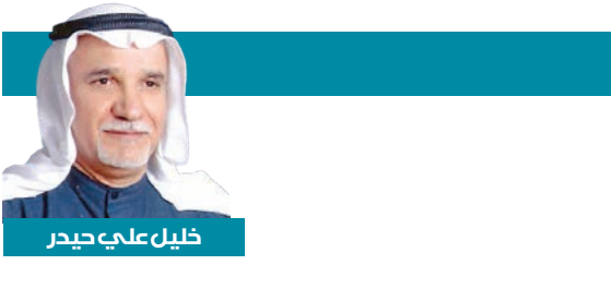
خليل علي حيدر

لقد تركت لنا وصية غير مكتوبة: أن نُكمل الطريق. ونحن - مَنْ أحببناك وعرفناك - لن نخون تلك الوصية. سنظل نحمّل الراية، كما علمتنا، ونقف حيث كنت تقف، ونقول ما كنت نقول. سلام عليك يا حكيم الأمة، سلام على مَنْ جعل السياسة شرفاً، والنضال حياة، والخبرة قدراً. رحلت بالبدن، لكنك ستظل الحاضر الذي لا يموت.