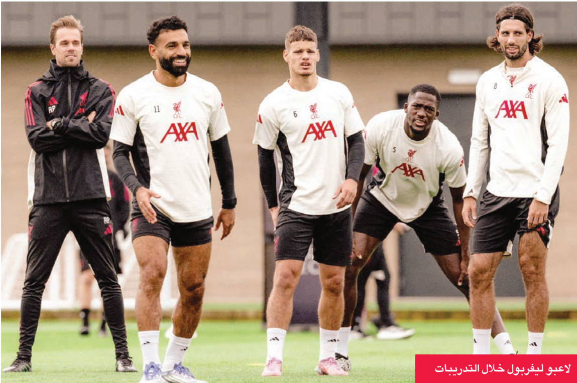
لاعبو ليفربول خلال التدريبات

وفي الجهة الأخرى، يعاني إيدي هاو، مدرب نيوكاسل، حالة ضعف هجومي واضح، وتآثر الفريق كثيراً بازمنة تركز نجمه وهادفه السويدي الكسندر إيزاك، الذي دخل في صدام مباشر مع إدارة النادي، وطلب الرحيل رسمياً قبل ثلاثة مواسم من انتهاء تعاقد، فيما تتمسك إدارة نيوكاسل باستمراره، ولديه بانها رفضت عرضاً يزيد على 110 ملايين