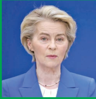
أورسولا فون دير لاين

التوصل إلى اتفاق، وقاما بشن حرب تجارية... لم يكن سيحتفي بذلك سوى موسكو وبيكين»، وفق وكالة الأنباء الألمانية (د ب أ).