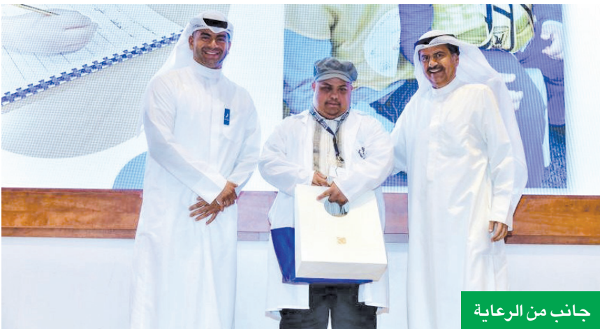
جانب من الرعاية