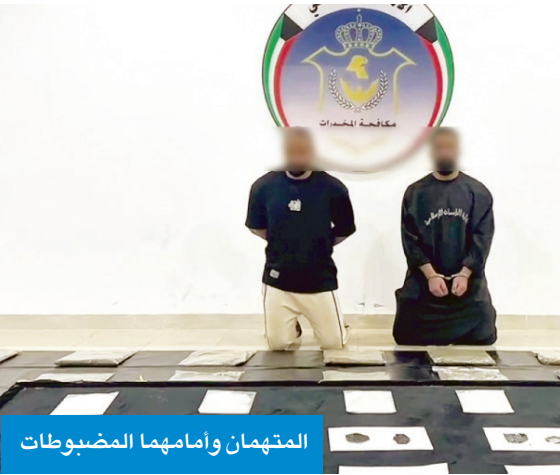
المتهمان وامامهما المضبوطات

المخدرة، مشيرة إلى أن رجال المكافهة لن يتهاونوا مع أي محاولة تستهدف العبث بأمن البلاد، أو تهدد صحة المواطنين والمقيمين وسلامتهم.