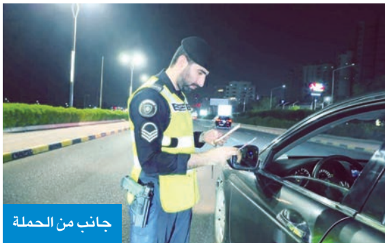
جانب من الحملة

«شرطة النجدة» تنفذ حملة أمنية شاملة لضبط المخالفين