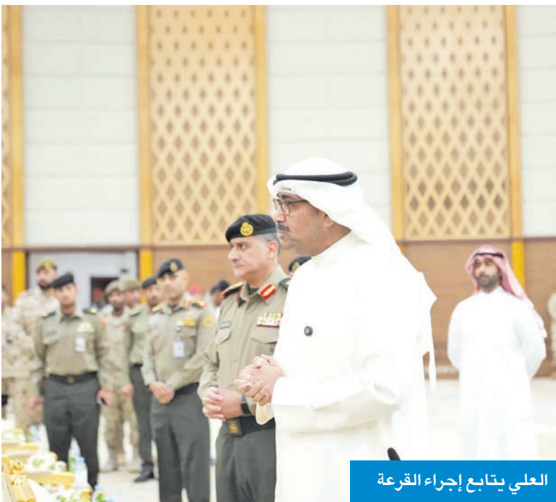
العلي يتابع إجراء القرعة

شهد وزير الدفاع، الشيخ عبدالله العلي، إجراءات القرعة العلنية لاختيار المتقدمات لدورة الطلبة الضباط الدفعة 1 من حملة الشهادة الجامعية للعنصر النسائي التي أجريت، أمس الأول، في مبنى متعدد الأغراض بمعسكرات المباركية. وأكد العلي، خلال عملية القرعة العلنية، وفاء ببيان صحافي لوزارة الدفاع، أمس، حرص الوزارة على ترسيخ مبدأ الشفافية وتكافؤ الفرص. كما أشاد وزير الدفاع بالإجراءات التنظيمية التي تضمن العدالة في اختيار المرشحات وفق معايير واضحة ونزيهة. حضر إجراءات القرعة نائب رئيس الأركان العامة للجيش اللواء الركن الطيار صباح الجابر، وأمر كلية علي الصباح العسكرية العميد الركن عبدالله التركيت، وعدد من كبار الضباط القادة. وبلغ عدد المتقدمات 654، في حين بلغ عدد المقترعات 112، وتم قبول 51 مرشحة، كما تم اختيار 18 مرشحة ضمن قائمة الاحتياطي موزعات على التخصصات العلمية والأدبية وفق احتياجات القوات المسلحة.