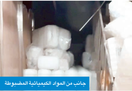
جانب من المواد الكيميائية المضبوطة

لا شك أن الطريق نحو بناء صناعة دوائية متكاملة ليس سهلاً. فالتحديات تشمل ارتفاع تكاليف الإنتاج، وصعوبة الحصول على براءات اختراع أو تقنيات تصنيع متقدمة، إضافة إلى المنافسة مع شركات دوائية عالمية تمتلك نفوذاً واسعاً. لكن هذه التحديات يمكن تجاوزها عبر حلول عملية: