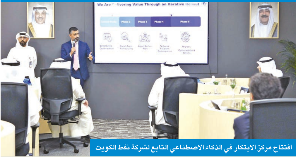
افتتاح مركز الابتكار في الذكاء الاصطناعي التابع لشركة نفط الكويت

الوطنية وتوظيف البحث العلمي والتكنولوجيا والابتكار في مواجهة التحديات الوطنية وتحقيق التنمية المستدامة في دولة الكويت. وشهد الثاني من يونيو توقيع المركز العلمي التابع لمؤسسة الكويت للتقدم العلمي اتفاقية شراكة مع برنامج الأمم المتحدة للمستوطنات البشرية (الموئل) بهدف تعزيز التعاون في مجالات التوعية البيئية والتعليم المستدام والمشاركة المجتمعية. وأعلن وزير التربية م. سيد جلال الطبطبائي في 29 يونيو استحداث (مكتب الموهوبين) وإحاقه بإدارة مكتب الوزير لرعاية أبناء الكويت من المبدعين ليكونوا خير سفراء يحملون راية الإبداع في المحافل العلمية الدولية.