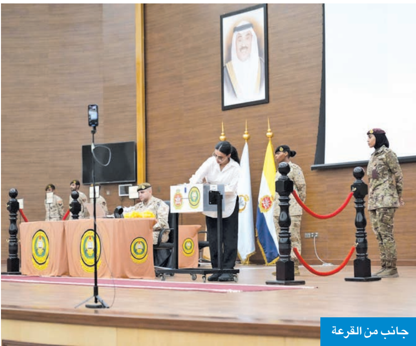
جانب من القرعة

الإجراءات التنظيمية تضمن العدالة في اختيار المرشحات وفق معايير واضحة ونزيهة