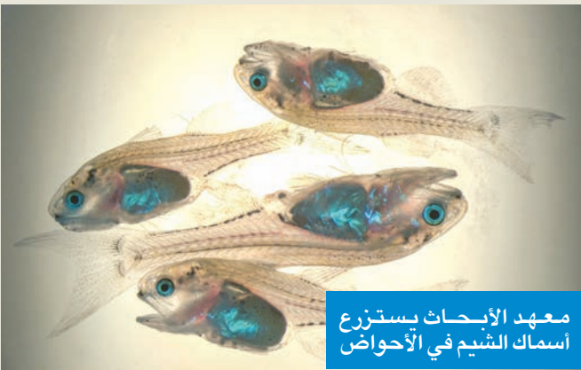
معهد الأبحاث يستزرع أسماك الشيم في الأحواض

شراكة مع الأمم المتحدة لتعزيز التعاون في مجالات التوعية البيئية والتعليم