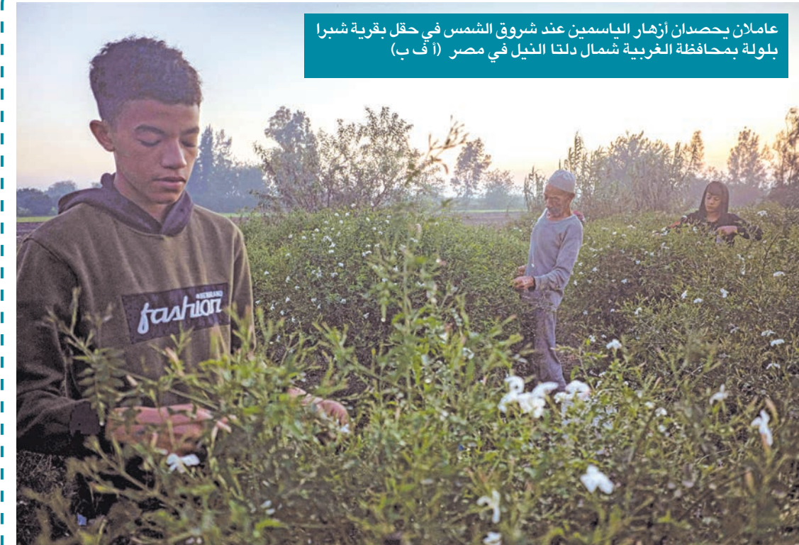
عاملان بحصادن أزهار الياسمين عند شروق الشمس في حقل بقرية شبرا بلولة بمحافظة الغربية شمال دلتا النيل في مصر