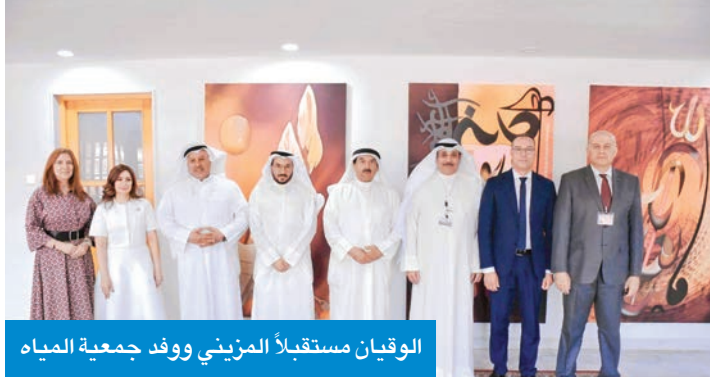
الوقيان مستقبلاً المزيني ووفد جمعية المياه

الوقيان والمزيني بحثا التعاون العلمي لتطوير مصادر المياه