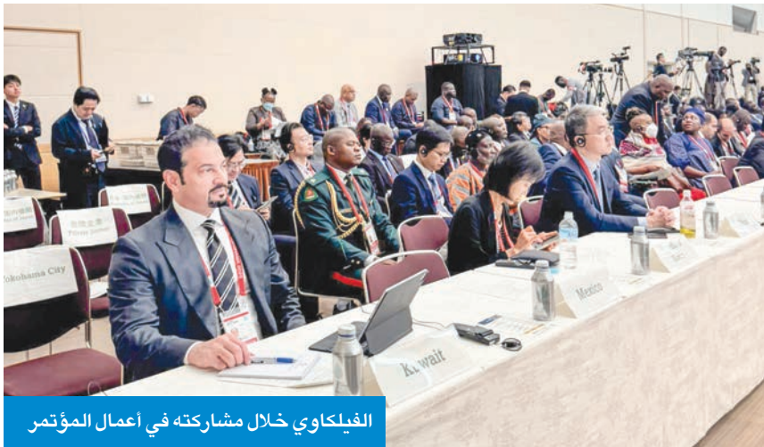
الفيلكاوي خلال مشاركته في أعمال المؤتمر

اعتماد إعلان يوكوهاما لتعزيز التعاون الإفريقي - الياباني