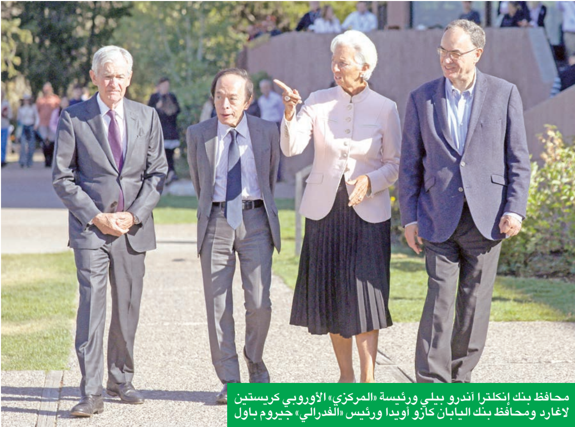
محافظ بنك إنكلترا أندرو بيلي ورئيسة «المركزي» الأوروبي كريستين لاغارد ومحافظ بنك اليابان كارو أويدا ورئيس «الفدرالي» جيروم باول

ولأيزال التضخم أعلى من هدف البنك المركزي، البالغ 2 في المئة، ومن المتوقع أن يرتفع مع تأثير الرسوم الجمركية الجديدة على أسعار المستهلكين.