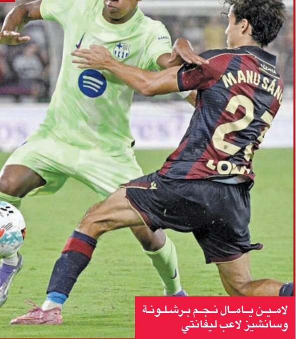
لامين يامال نجم برشلونة وسانشيز لاعب ليفانتي

حقوق برشلونة (حامل اللقب) «ريمونتادا»، قلب بها الطاولة على مضيعة ليفانتي العائد 2-3، أمس الأول السبت، في المرحلة الثانية من الدوري الإسباني لكرة القدم. وجاءت ثلاثية الفريق الكتالوني في الشوط الثاني بعدما تأخر في الأول بهدي إيفان روميرو (15) وخوسيه موراليس (7+45)، لكنه رد في أربع دقائق بهدي بيدري (49) وفيران توريس (52)، وقبل انتهاء المباراة، أهدى أوساي إيلغيسابال أودونزو برشلونة هدفاً ثالثاً بتسجيله بالخطأ في مرماه (1+90). ورفع برشلونة، بقيادة مدربه الألماني هازري فليك، رصيده إلى ست نقاط في الصدارة، بعدما استهل مشواره بفوز على مضيعة ريال مايوركا بثلاثية نظيفة، فيما تلقى ليفانتي خسارته الثانية بعد الأولى أمام مضيعة الافيس 2-1.