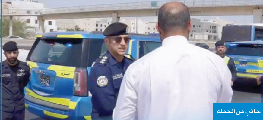
جانب من الحملة