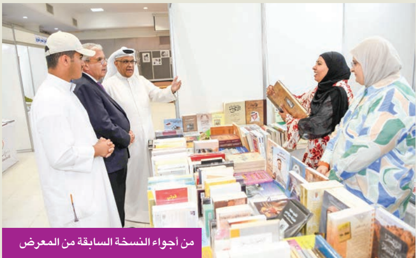
من أجواء النسخة السابقة من المعرض

مقدمتها دعم المؤلف الكويتي ودور النشر، وإفساح المجال للمؤسسات الوطنية لعرض ما لديها من إصدارات جديدة خلال الثلث الأخير من العام. يذكر أن النسخة الأولى من المعرض انطلقت عام 2016 في قاعة الشهيد مبارك فالج الثوت بمقر الجمعية، بمشاركة مجموعة من دور النشر المحلية، إضافة إلى بعض المؤسسات الثقافية الحكومية والخاصة.