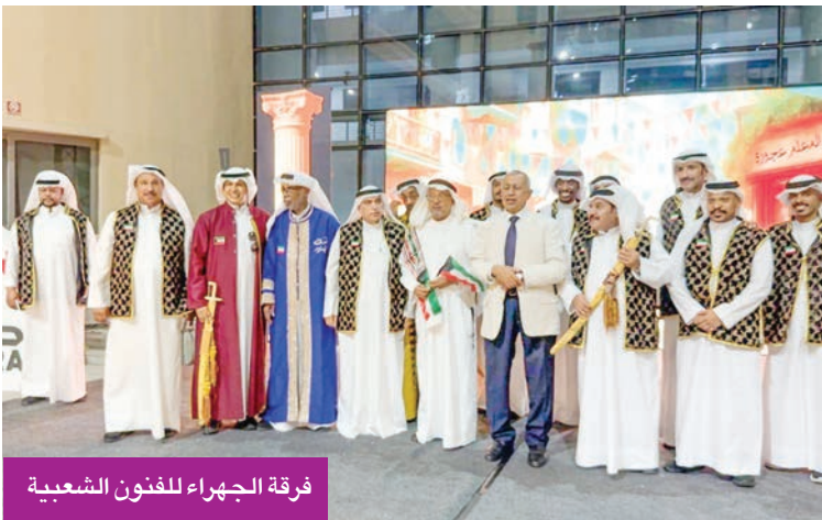
فرقة الجهراء للفنون الشعبية

لمكانة الفرقة ودورها في إبراز الفنون الكويتية، وأشاد بالمحفل الذي وصفه بأنه إحدى أبرز المنصات للتلاقي الثقافي والفني بين الشباب العرب