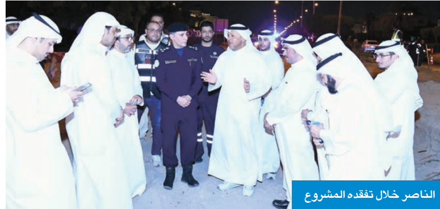
الناصر خلال تفقده المشروع

من جانبه، أوضح الرشدي أن الأعمال تسير وفق الخطة الموضوعية، وبالتنسيق مع الجهات المختصة، مؤكداً استمرار التعاون مع المحافظة لتحقيق أفضل الخدمات لأهالي المنطقة.