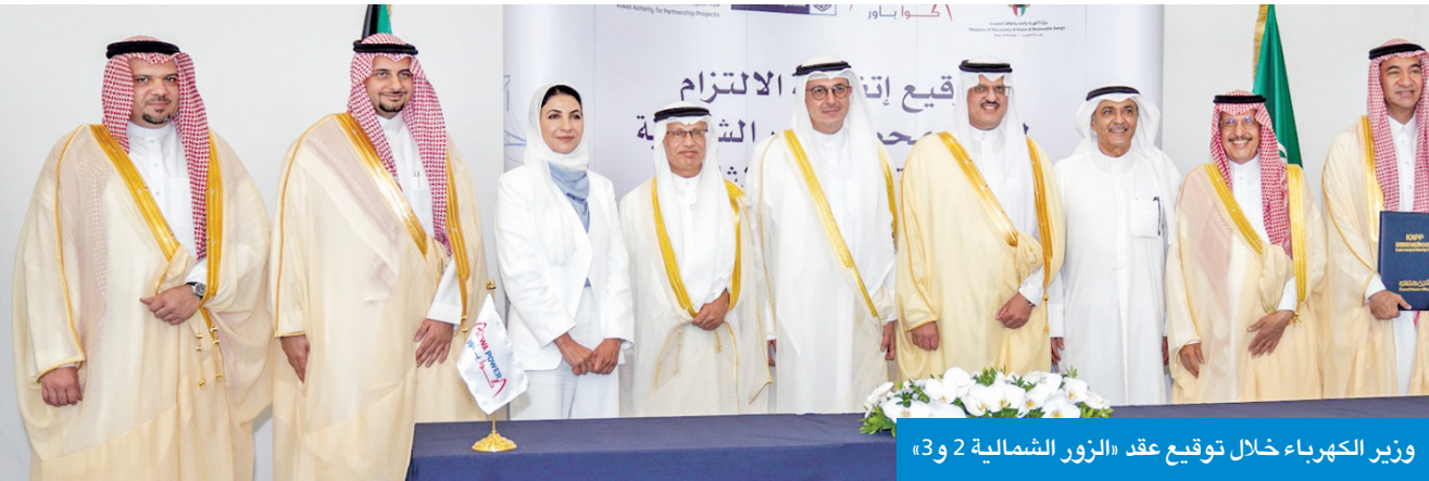
وزير الكهرباء خلال توقيع عقد «الزور الشمالية 2 و3»

وتسعى الحكومة إلى تقليل العبء المالي عن الميزانية العامة بنسبة تبلغ نحو 30 في المئة، علاوة على استقطاب استثمارات خاصة وأجنبية بقيمة تصل إلى 10 مليارات دينار، وتحقيق إيرادات سنوية تصل إلى مليار دينار بحلول عام 2030 وتوفير أكثر من 50 ألف فرصة عمل جديدة. وتحتضن خطة التنمية السنوية 2025 / 2026 التي اعتمدها الكويت في شهر مارس الماضي عدداً غير مسبوق من المشروعات الإنشائية، منها 69 مشروعاً ضمن ميزانيات الوزارات والإدارات الحكومية و21 مشروعاً للهيئات الملحقة و34 مشروعاً للمؤسسات المستقلة. وكانت الكويت قد وقعت عدد من مذكرات التفاهم مع الصين عام 2023، تشمل تنفيذ مشروع ميناء مبارك الكبير، والتعاون في مجالات الطاقة الكهربائية والتطوير الإسكاني ومعالجة مياه الصرف الصحي والمناطق الحرة والمناطق الاقتصادية، إضافة إلى تطوير مشروعات الطاقة المتجددة والتعاون بشأن منظومة خضراء منخفضة الكربون لإعادة تدوير النفايات.