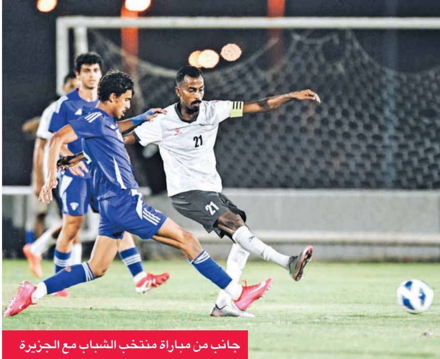
جانب من مباراة منتخب الشباب مع الجزيرة