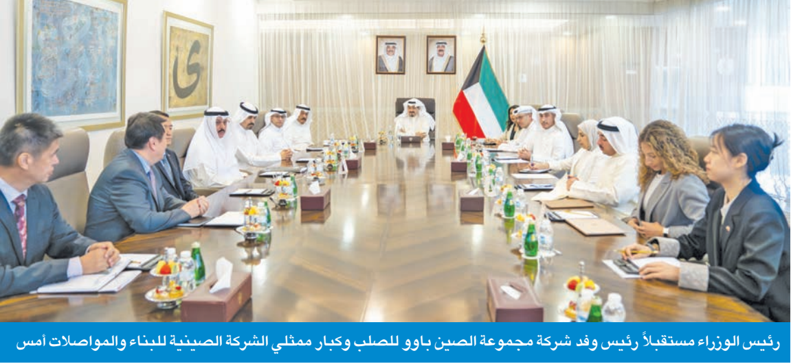
رئيس الوزراء مستقبلاً رئيس وفد شركة مجموعة الصين باوو للصلب وكبار ممثلي الشركة الصينية للبناء والمواصلات أمس

خلال شهر أغسطس الجاري، معرباً عن اهتمام الجانبين وحرصهما على الاستمرار في دفع التعاون الثنائي بينهما في جميع المجالات. من جانب آخر، استقبل سمو رئيس مجلس الوزراء، في قصر بيان أمس، رئيس وفد شركة مجموعة الصين باوو للصلب الحكومية، وانغ جيان، والوفد الرسمي المرافق، وكبار ممثلي الشركة الصينية للبناء والمواصلات المحدودة الحكومية التابعة لوزارة النقل الصينية المكلفة باستكمال تنفيذ مشروع ميناء مبارك الكبير. وقدم الوفد الصيني عرضاً مرئياً يوضح نشأة الشركة ودورها على المستوى الدولي في تقديم السلع والخدمات وبناء المشاريع الكبرى، وأهم تفاصيل المشاريع المنفذة من قبل الشركة الصينية الحكومية، التي تعتبر أكبر مصنع للفولاذ في العالم. ووجه سمو رئيس مجلس الوزراء إلى بذل الجهود اللازمة نحو الارتقاء بالعلاقات الثنائية الاستراتيجية مع الصين، ودفع التعاون