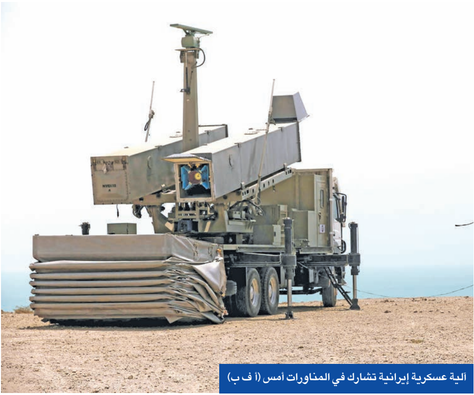
العة عسكرية إيرانية تشارك في المناورات امس

إلى ذلك، أعلن ممثل الأمين العام للأمم المتحدة في