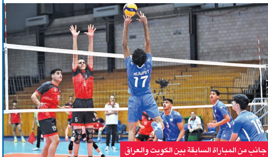
جانب من المباراة السابقة بين الكويت والعراق