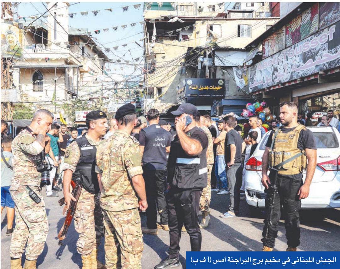
الجيش اللبناني في مخيم برج البراجنة امس

بدأت السلطات اللبنانية، أمس، تنفيذ المرحلة الأولى من خطة تسلّم الأسلحة من داخل المخيمات الفلسطينية، وذلك بعد نحو 3 أشهر على الاتفاق الذي أقر بين الجانبين اللبناني والفلسطيني. وبخلاف ليات الجيش اللبناني إلى مخيم برج البراجنة في بيروت، تمهيداً لبدء تسليم السلاح الفلسطيني، في خطوة وصفت بأنها مقدمة لتعميمها لاحقاً على بقية المخيمات. وأكد رئيس لجنة الحوار اللبناني - الفلسطيني، السفير رامي دمشقي، أن العملية تشكل «الخطوة الأولى» في مسار تسليم دفعات من السلاح، على أن تستكمل في الأسابيع المقبلة داخل مخيم برج البراجنة وسائر المخيمات. وشدد على أن هذه العملية تأتي تنفيذاً لمقررات القمة اللبنانية - الفلسطينية التي جمعت الرئيسين اللبناني