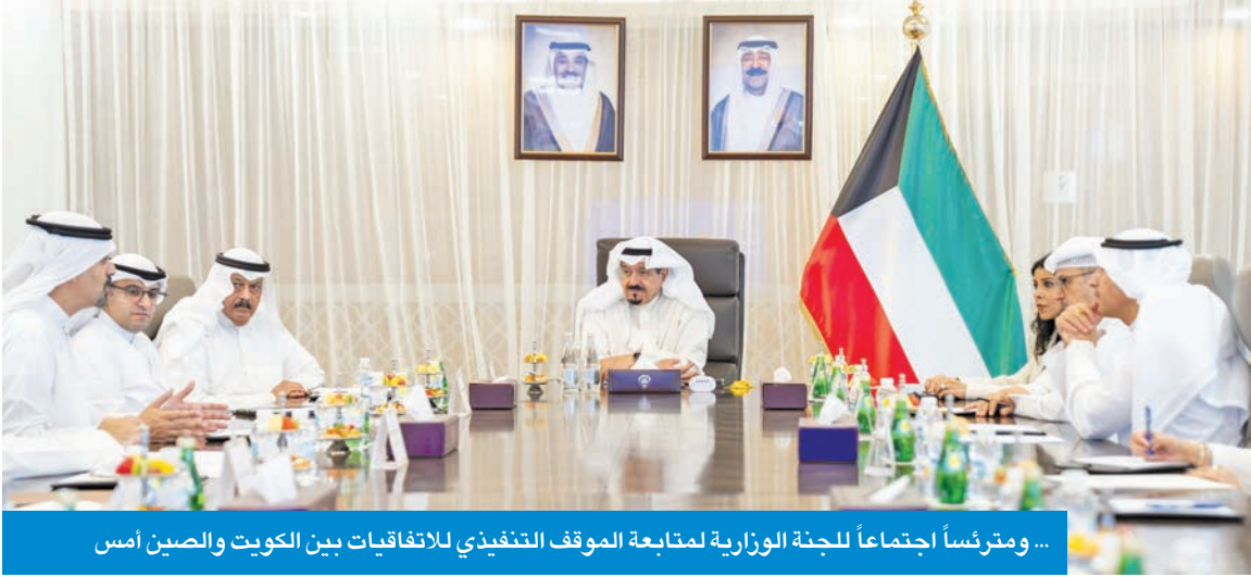
... ومرتسأ اجتماعاً للجنة الوزارية لمتابعة الموقف التنفيذي للاتفاقيات بين الكويت والصين أمس