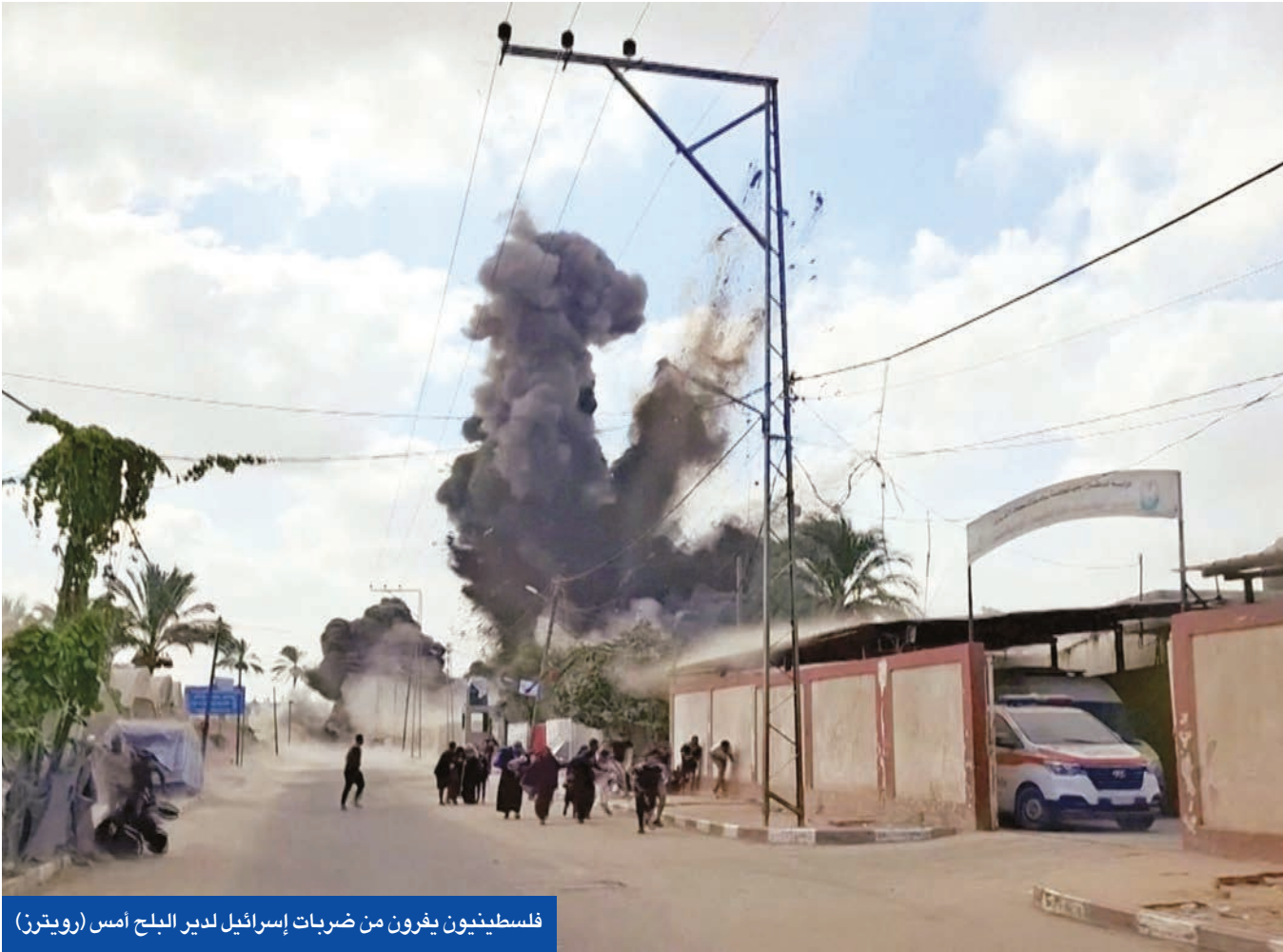
فلسطينيون يفرون من ضربات إسرائيل لدبر البلح امس

وقال نتنياهو أمس، إن الحرب «يمكن أن تنتهي اليوم» بشرطين: أن تلقى «حماس» سلاحها، ويتم نزعه بالكامل، وأن تطلق سراح جميع المحتجزين الإسرائيليين المتبقين. وأضاف: «سواصل السيطرة على مدينة غزة حتى لو وافقت حماس على اتفاق لوقف النار في اللحظة الأخيرة». وشدد على أن القضاء على ما وصفه بـ «المعقل الأخير لحماس» هو شرط أساسي وضروري لتحقيق سلام دائم، مضيفاً أن «هدفنا ليس احتلال غزة، بل إعطاؤها وإسرائيل مستقبلاً مختلفاً، واعتقد أننا قريبون من تحقيق ذلك ونشارف على نهاية الحرب». وأشار رئيس الوزراء الإسرائيلي إلى أن الرئيس الأميركي دونالد ترامب «يدعم بشكل كامل هدفنا العسكري للسيطرة على مركز قطاع غزة من أجل القضاء على حماس». وانهم زعيم الائتلاف اليميني الحاكم في الدولة العبرية «زعماء