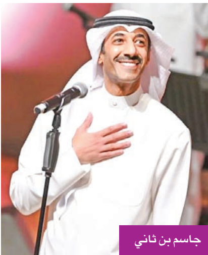
جاسم بن ثاني

يستعد المطرب جاسم بن ثاني لطرح أغنيات جديدة الشهر المقبل ضمن ألبوم «المواني» الذي يعد أول أعماله مع شركة روتانا، بعد تعاقدته معها أخيراً.