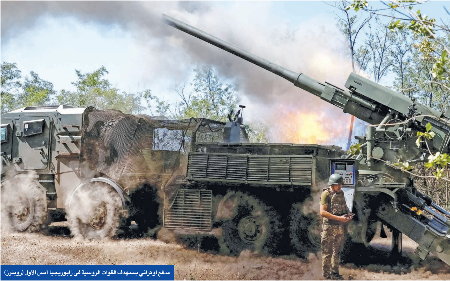
مدفع اوكراني يستهدف القوات الروسية في زابوريجيا امس الاول

السلام المحتملة بين روسيا وأوكرانيا، وأكد استمرار جهوده من أجل إنهاء الحرب بسلام عادل. وإن أعلن أنه يراقب عن كثب المباحثات التي جرت في الأسكا وواشنطن، شدد على استعداد تركيا لاستضافة أي جهود في مفاوضات السلام بين أوكرانيا وروسيا. وفي تطور منفصل، أعلنت حلف «ناتو» تأكيد دعمها لكيف خلال اجتماع لرؤساء أركان الحلف عبر الفيديو، فيما تتواصل المناقشات بين واشنطن وحلفائها بشأن طبيعة الضمانات الأمنية التي يمكن أن تُمنح لأوكرانيا. وفي تطور منفصل، أعلنت النجاية العامة الألمانية أن السلطات الإيطالية اعتقلت مواطنًا أوكرانيًا يشتبه في ضلوعه بتنسيق الهجوم على خط أنابيب «نورد ستريم» عام 2022. ومن المقرر تسليمه إلى برلين لمواجهة اتهامات بالتخريب والتفجير غير المشروع.