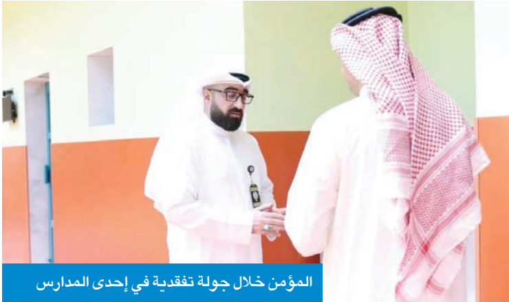
المؤمن خلال جولة تفقدية في إحدى المدارس

المؤمن: الطبطبائي يتابع تقارير «بلّغ» عبر شاشة رقمية لتعزيز التحول الرقمي