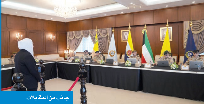
جانب من المقابلات

وشهدت المقابلات التي استمرت عدة أيام تقييماً شاملاً للمتقدمات، إضافة إلى التدقيق في استيفاء جميع المتطلبات والشروط، تمهيداً لإجراء القرعة العلنية لاختيار المقبولات وفق الضوابط والمعايير المقررة.