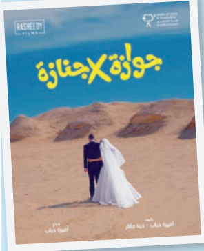
جوازة في جنازة

● القاهرة- محمد قحري يستعد عدد من نجوم وصناع الفن لطرح أعمال سينمائية جديدة في الفترة القادمة. وخلال أيام قليلة تشهد دور العرض استقبال 3 أفلام جديدة، بعد سلسلة متتالية من الأعمال التي استقبلتها السينمات منذ عيد الأضحى الماضي. البداية مع فيلم «ماما وبابا»، وهو فيلم كوميدي خفيف، بطولة ياسمين رئيس ومحمد عبدالرحمن، ومن المقرر طرحه بدور العرض بداية من 27 الجاري، وتدور القصة حول زوجين يعيشان حياة أسرية هادئة برفقة طفلتهما، لكن حياتهما تنقلب رأساً على عقب بصورة مفاجئة بعدما يتبادلان الأدوار الجسدية؛ إذ تتحوّل الزوجة إلى رجل، ويتحوّل الزوج إلى امرأة، فيقعان في مواقف كوميدية، كما يشارك في البطولة وفام مجدي وحنا يوسف، ومن إخراج أحمد القبعي. وتعود النجمة نيللي كريم بتجربة سينمائية مختلفة، من خلال فيلمها الجديد (جوازة في جنازة)، المقرر عرضه 10 سبتمبر المقبل، وهو التجربة الروائية الطويلة الأولى للمخرجة أميرة دياب، تأليف أميرة دياب ودينا ماهر، ويشارك في البطولة: شريف سلامة، ولبلبة، والفنان اللبناني عادل كرم، وانتصار، ومحمود البزاي، وأمير صلاح الدين، ودينا ماهر. والفيلم تجربة عربية جديدة ترمز بين عناصر من الكوميديا والدراما والرومانسية الاجتماعية، في إطار يراهن عليه صناعه لجذب فئات متنوعة من الجمهور. ويجهز طاقم العمل فيلم «برشامة»، بطولة الفنان هشام ماجد، للعرض خلال الأيام المقبلة، بعد انتهاء التصوير، ويشارك في البطولة: ريهام عبدالغفور، وباسم سمرة، ومصطفى غريب، ومن إخراج خالد دياب.