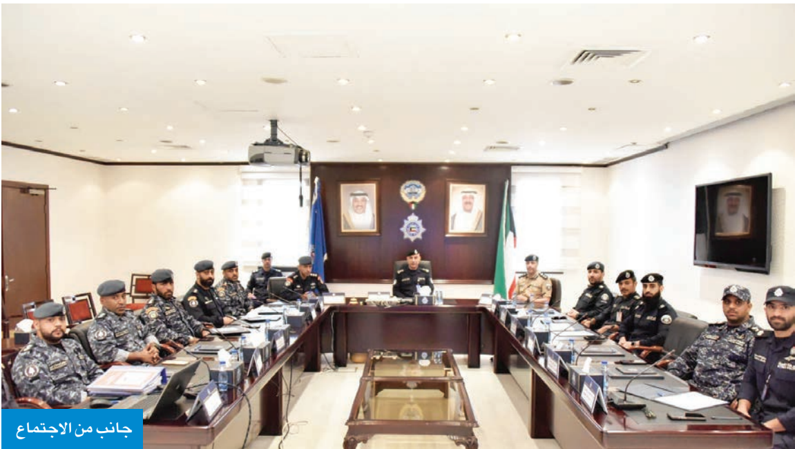
جانب من الاجتماع

من الإدارة العامة لشؤون قوة الشرطة، إضافة إلى فريق الإمداد والتجهيز. كذلك تطرق رئيس اللجنة العليا للتمرين التعبوي المشترك، خلال الاجتماع، إلى بحث البات التنسيق وتوحيد الجهود بين الفرق والقطاعات المعنية، بما يعزز الجاهزية للمشاركة في التمرين، وتأكيد تكامل الأدوار بما يساهم في الحرص على نجاح مشاركة الكويت وتعزيز منظومة الأمن الخليجي المشترك.