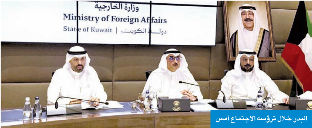
البدر خلال ترؤسه الاجتماع أمس

لتعزيز مسارات التعاون مع سورية في مختلف المجالات، ولاسيما في الجوانب الاقتصادية والتنموية والاستثمارية، بما يحقق الأهداف والطموحات المشتركة.