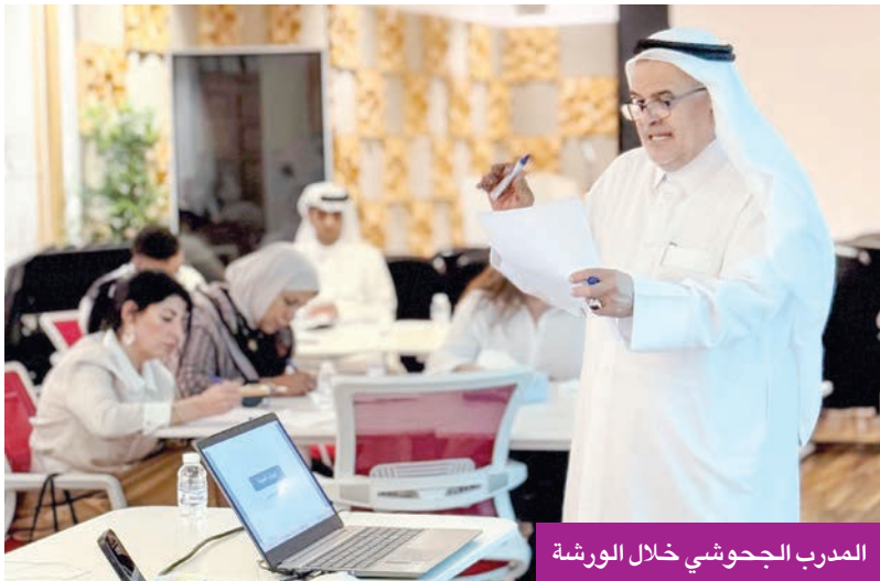
المدرّب الجحوشي خلال الورشة

المشاركون تدربوا على كيفية التحكم في درجات الصوت المختلفة وتوظيفها وفق طبيعة النص والمحتوى