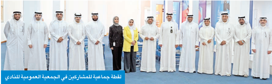
لقطة جماعية للمشاركين في الجمعية العمومية للنادي

اعتمد التقريرين الإداري والمالي لعام 2024 وميزانية 2025