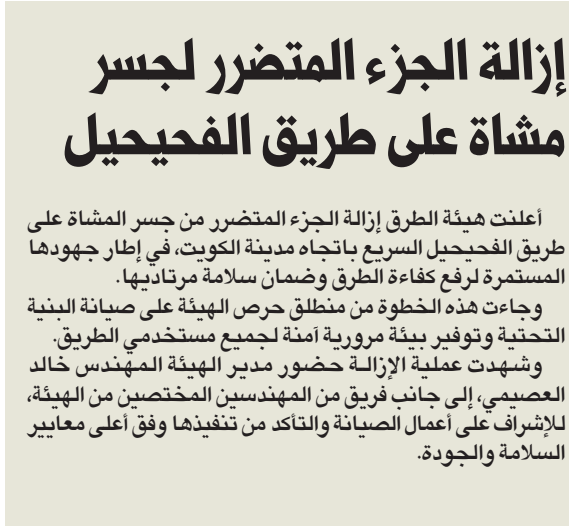
جانب من أعمال الإزالة

أعلنت هيئة الطرق إزالة الجزء المتضرر من جسر المشاة على طريق الفحيحيل السريع باتجاه مدينة الكويت، في إطار جهودها المستمرة لرفع كفاءة الطرق وضمان سلامة مرتاديها. وجاءت هذه الخطوة من منطلق حرص الهيئة على صيانة البنية التحتية وتوفير بيئة مرورية آمنة لجميع مستخدمي الطريق. وشهدت عملية الإزالة حضور مدير الهيئة المهندس خالد العصيمي، إلى جانب فريق من المهندسين المختصين من الهيئة، للإشراف على أعمال الصيانة والتأكد من تنفيذها وفق أعلى معايير السلامة والجودة.