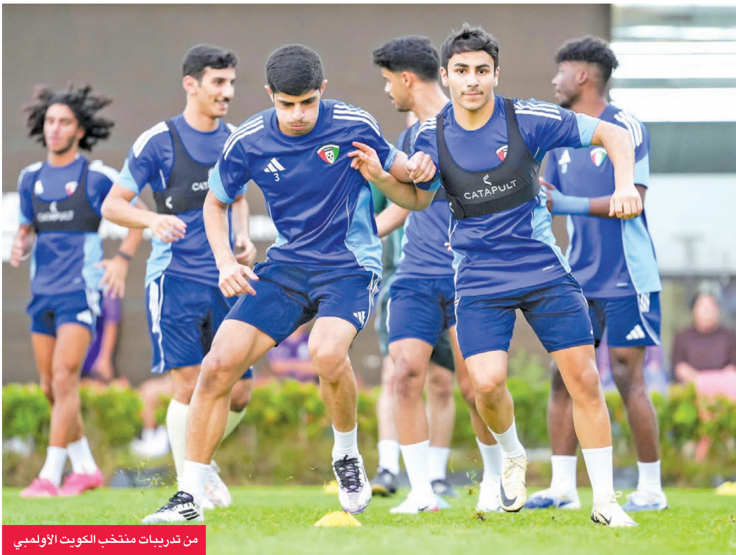
من تدريبات منتخب الكويت الأولمبي