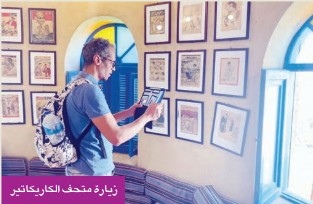
زيارة متحف الكاريكاتير