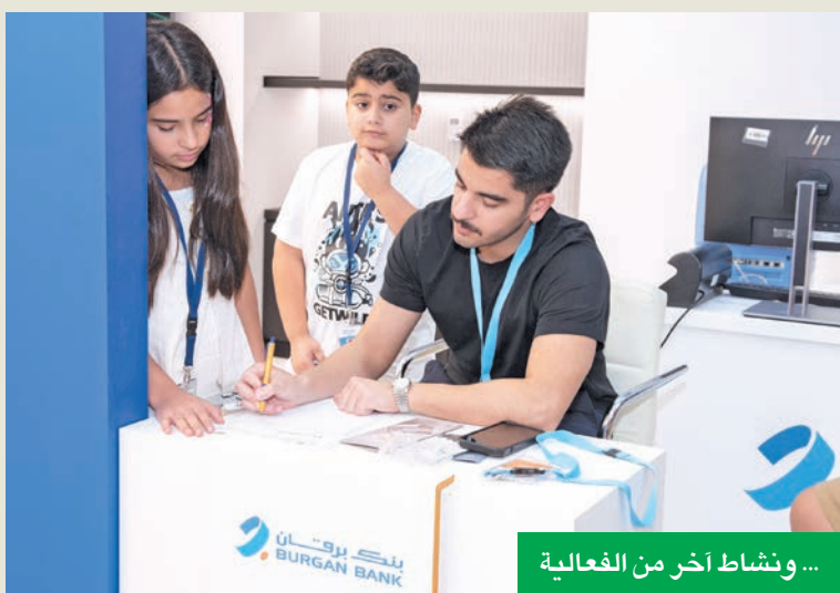
... ونشاط آخر من الفعالية