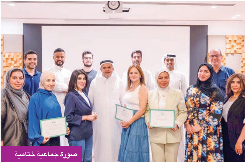
صورة جماعية ختامية