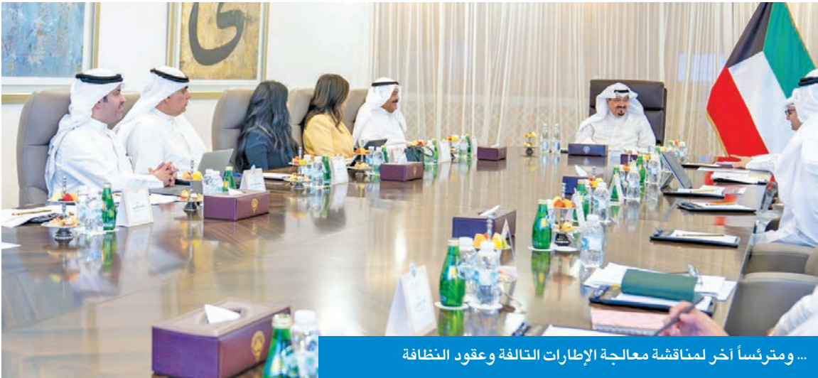
... ومرتسأ آخر لمناقشة معالجة الإطارات التالفة وعقود النظافة

العبدالله: حريصون على استكمال جميع ملفات الرعاية السكنية في لقاءات قادمة تسريع وتيرة العمل للاستفادة من الإطارات المستعملة وتطوير آلية طرح عقود النظافة تحقيق النهضة العمرانية عبر تطوير البنى التحتية والخدمات الحكومية ونظم الرعاية السكنية