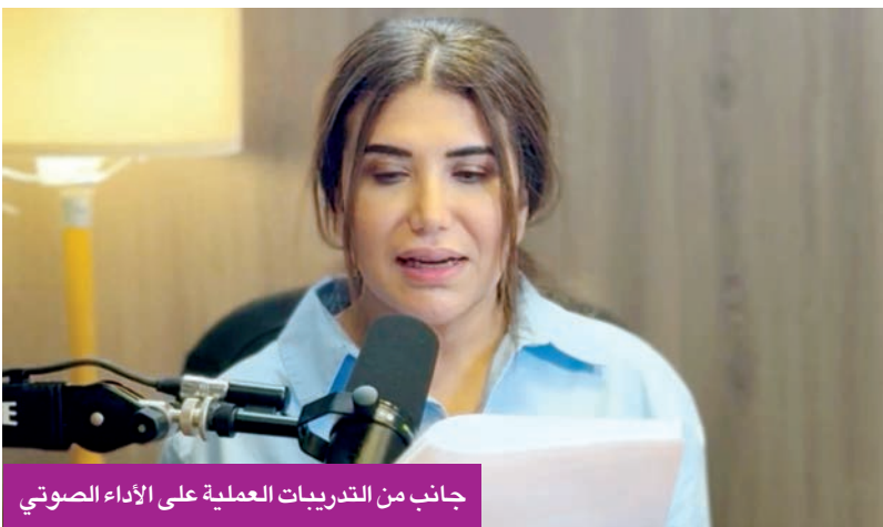
جانب من التدريبات العملية على الأداء الصوتي

ويُنغذ «الجوهر» برعاية شركة المركز المالي الكويتي (المركز)، وجريدة «الجريدة»، وشركة الصناعات الهندسية الثقيلة وبناء السفن (هيسكو)، وفندق فوربوينتس شيراتون.