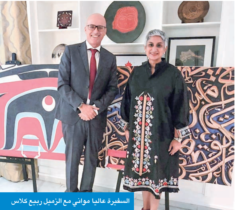
السفيرة عاليًا مواني مع الزميل ربيع كلّاس

تصيحتي دائماً أن تكون مفتوحة على العلاقات والفرص؛ تُعطي الأولوية للمبادرات المهمة بالنسبة إلى كندا والكويت؛ تحضر الدبلوماسية وتتفاعل مع مختلف الأحدث عبر «إنستغرام»، مما يساهم على التعرف إلى جميع المجتمعات المتنوعة في الكويت، وتستمتع بكل ما تقدمه الكويت من تجارب. أما أنا، فيسكون لي منصب رسمي في المقر الرئيسي لتنفيذ السياسة الخارجية الكندية في القطب الشمالي وتعزيز انخراطها هناك، وهو ما يمثل حالياً أولوية قصوى للحكومة، وأنا متحمسة جداً لذلك، سيكون أمراً رائعاً ومثيراً للاهتمام.