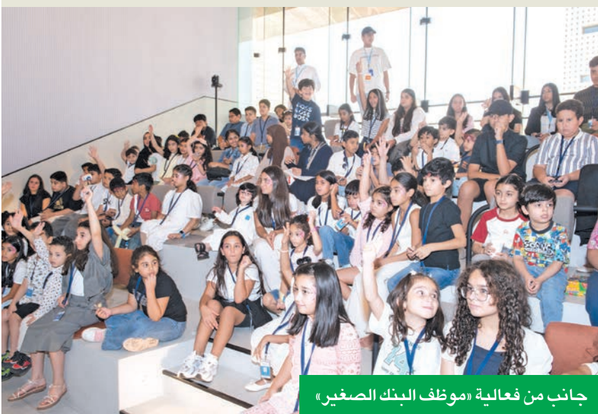
جانب من فعالية «موظف البنك الصغير»

احتفاءً بالقيم العائلية وتعزيزاً لبيئة العمل الإيجابية