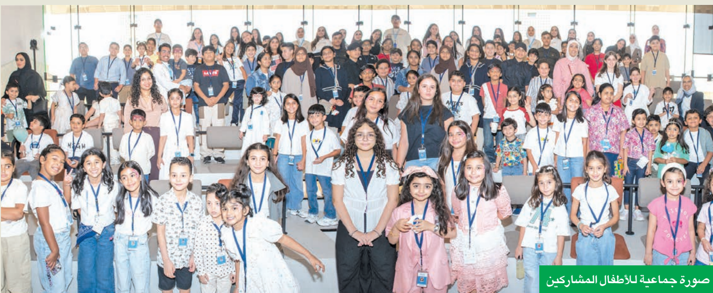
صورة جماعية للأطفال المشاركين

الجوهرية لبنك برقان والمتمثلة في الثقة، والالتزام، والتميز، والتطور، كما تدعم أهداف البنك في مجال الحوكمة البيئية والاجتماعية والمؤسسية (ESG)، وتعزز مكانته كبنك حاصل على شهادة «أفضل بيئة عمل» (Great Place to Work). إلى جانب التزامه بترسيخ بيئة عمل شاملة ومحفزة ومستدامة، تضع تمكين الأفراد وتعزيز القيم المؤسسية في صميم منظومتها.