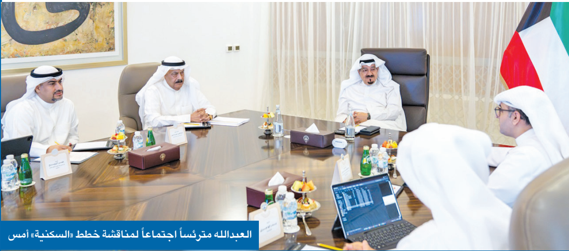
العبدالله مرفساً اجتماعاً لمناقشة خطط «السكنية» أمس