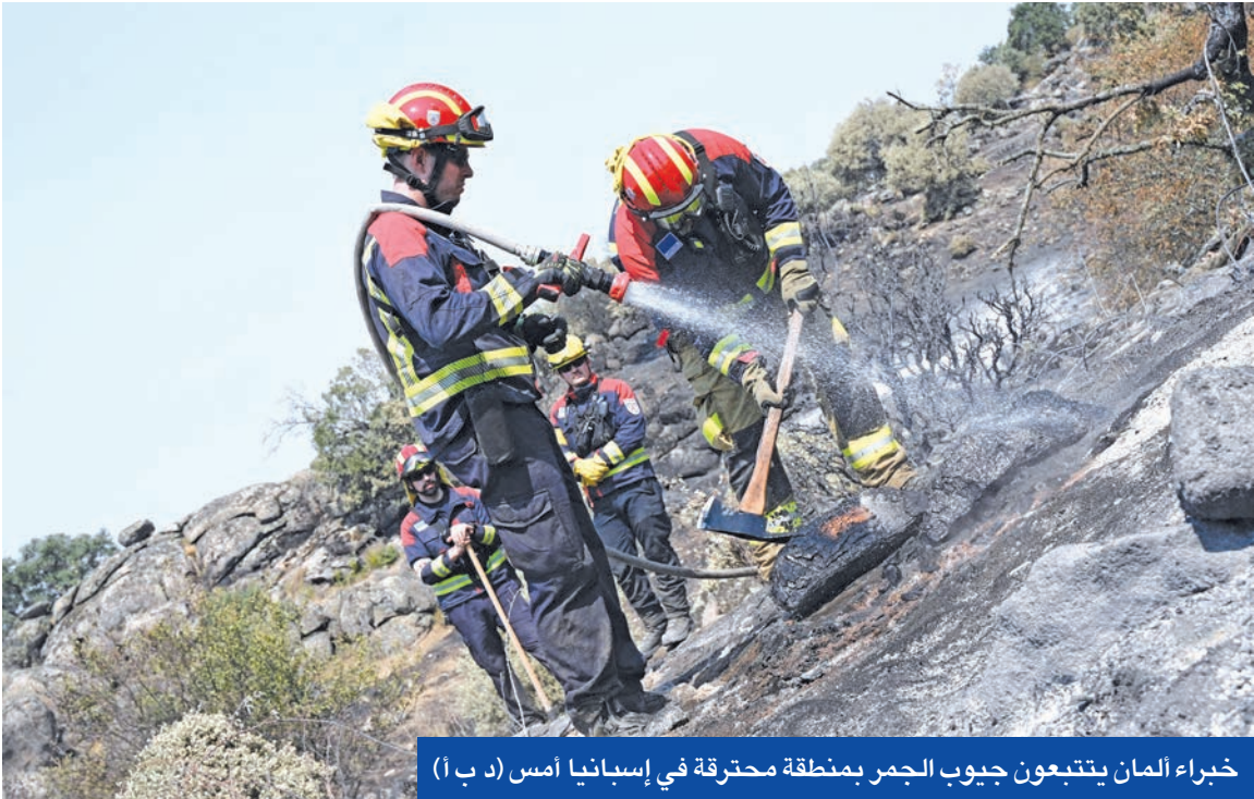
خبراء المان يتبعون جيوب الجمر بمنطقة محترقة في إسبانيا أمس

الصحة العامة أن أكثر من 1100 حالة وفاة على صلة بموجة الحر التي انتهت للتو في إسبانيا، واستمرت 16 يوماً.