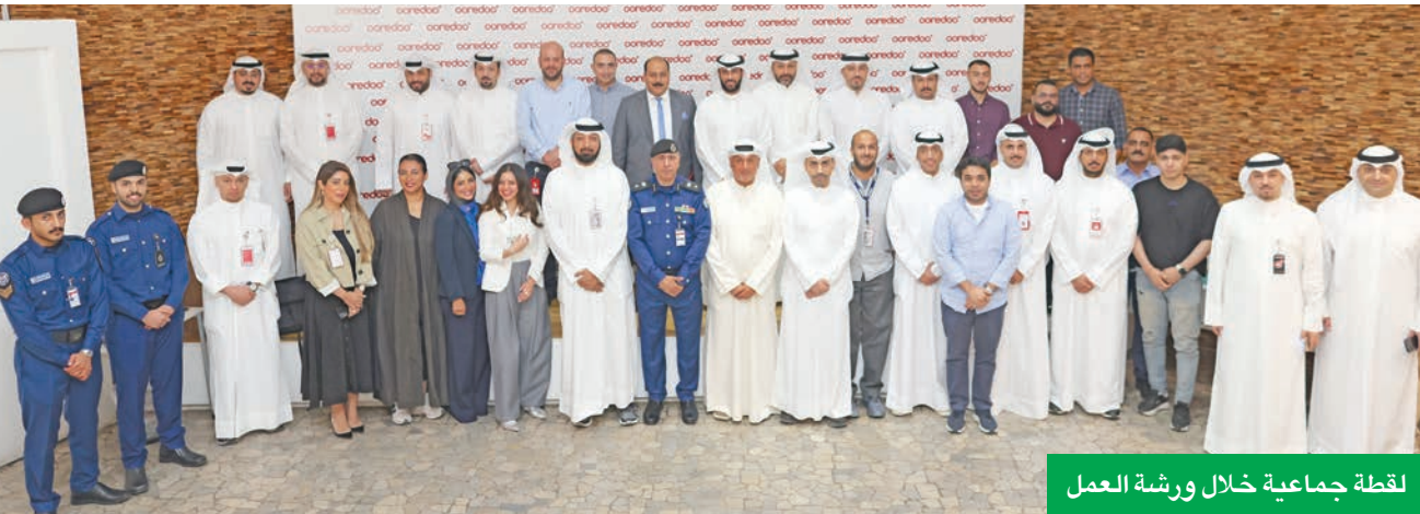
لقطة جماعية خلال ورشة العمل

تقديم برنامج متكامل وفَعَال يصل إلى موظفي جميع الفروع، وخرج المشاركون من الورشة بوعي أكبر بالمخاطر، ومهارات عملية لمواجهة الطوارئ بكفاءة، إضافة إلى قناعة راسخة بأهمية مشاركة هذه المعرفة مع الآخرين. وأكدت Ooredoo أن هذه المبادرة تمثل خطوة مهمة ضمن استراتيجيتها المستمرة لتعزيز ثقافة السلامة والمسؤولية الاجتماعية. فمن خلال تمكين موظفيها بالمهارات الأساسية لحماية حياتهم وحياة من حولهم، تعكس الشركة التزامها برعاية أرواسمائها البشري والمساهمة الإيجابية في المجتمع.