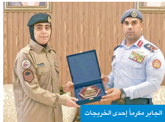
الجابر مكرماً إحدى الخريجات

كرم الحاصلات على المراكز الأولى في دورة الإدارة الأساسية