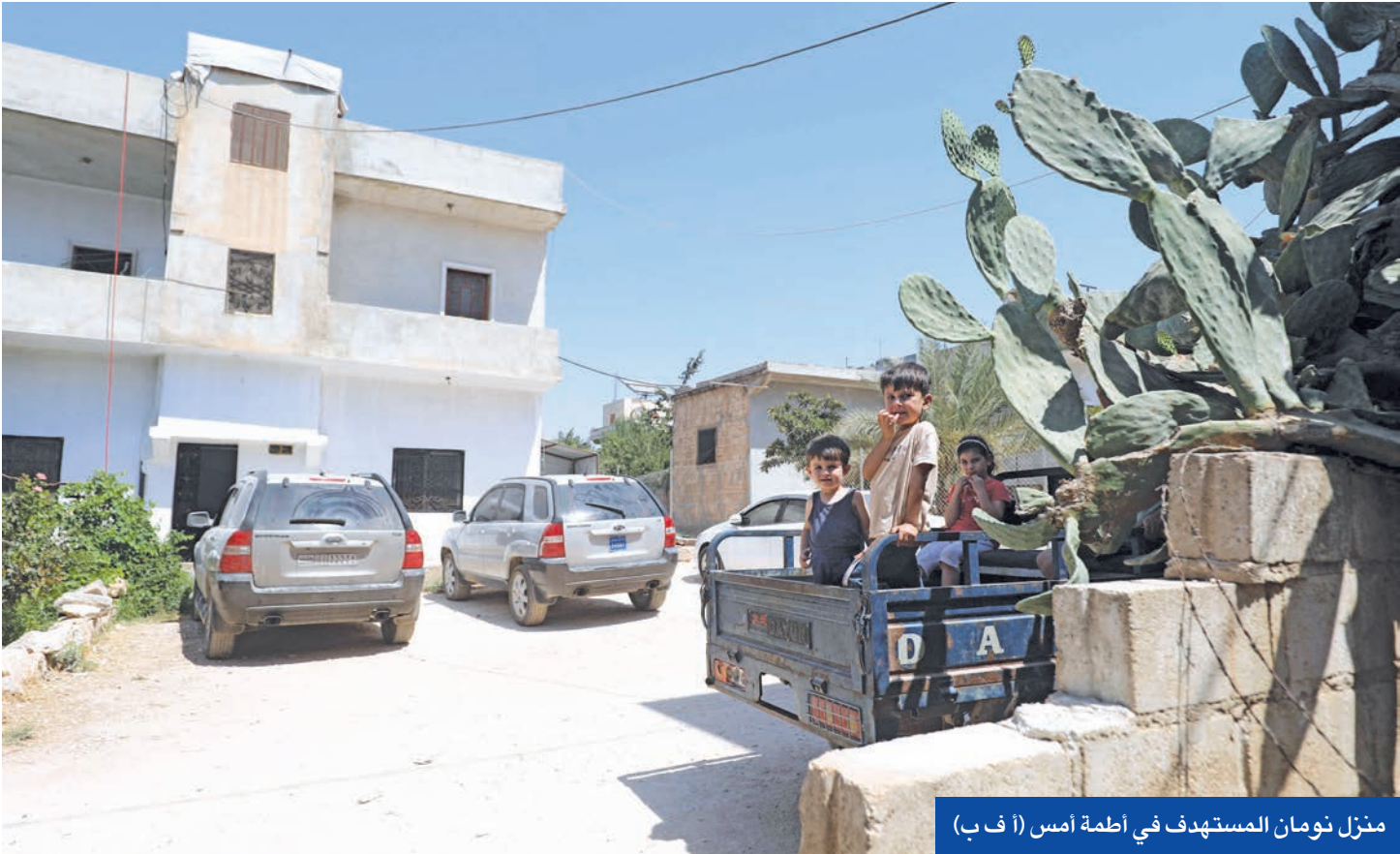
منزل نومان المستهدف في أطمة أمس