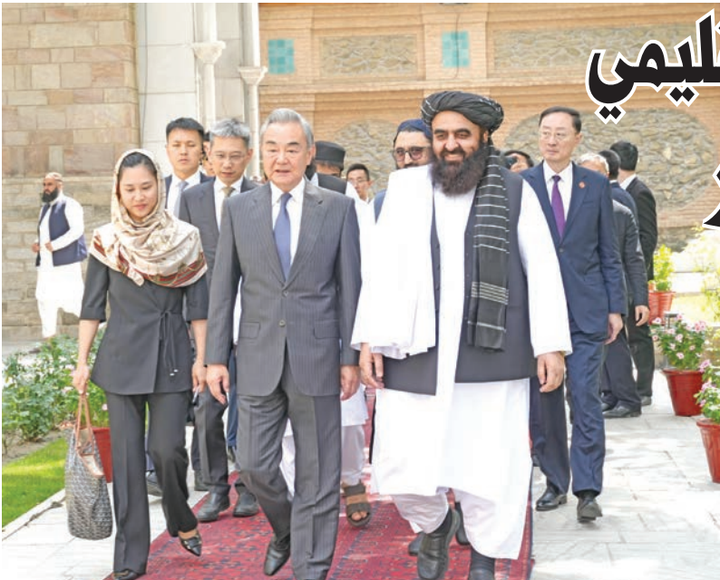
وزير الخارجية الصيني والأفغاني في كابول أمس (شينخوا)

تجمع بين التنمية الداخلية والرسائل الداعمة للاستقرار العالمي. وفي الوقت الذي تسعى قوى دولية إلى فرض سياسات أحادية، تطرح بكين خطاباً يقوم على العدالة والتعاون، لتجعل من القرن الحادي والعشرين «قرناً صينياً» بامتياز.