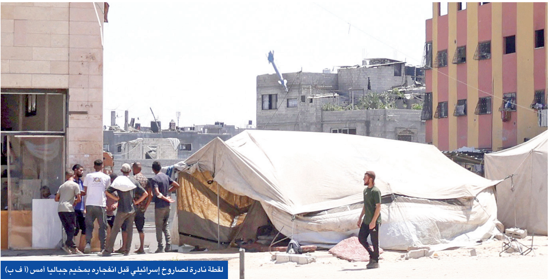
لقطة نادرة لصاروخ إسرائيلي قبل انفجاره بمخيم جباليا أمس

أضافت المصادر أن اتصالات مصرية مكثفة تتم مع الأطراف المعنية، وفي مقدمتها الولايات المتحدة، لبحث تل أبيب على التعامل بصورة إيجابية مع مقترح الوساطة للتهنئة الذي يتضمن إطلاق سراح نصف المحتجزين الإسرائيليين الأحياء والأموات بغزة مقابل إطلاق سجناء فلسطينيين وإقرار هدنة لمدة 60 يوماً لتحسين الأوضاع الإنسانية بالقطاع الذي ينتشر به الجوع وبدء محادثات فورية أشمل لإنهاء الحرب. في هذه الأثناء، أفادت مصادر طبية في غزة بمقتل 58 فلسطينياً جراء الاعتداءات الإسرائيلية خلال الـ 24 ساعة الماضية، فيما أفاد وزير الشباب الإماراتي سلطان النجادي بأن مساعدات بلاده للقطاع عبر الجو والبحر زادت على مليار ونصف المليار دولار.