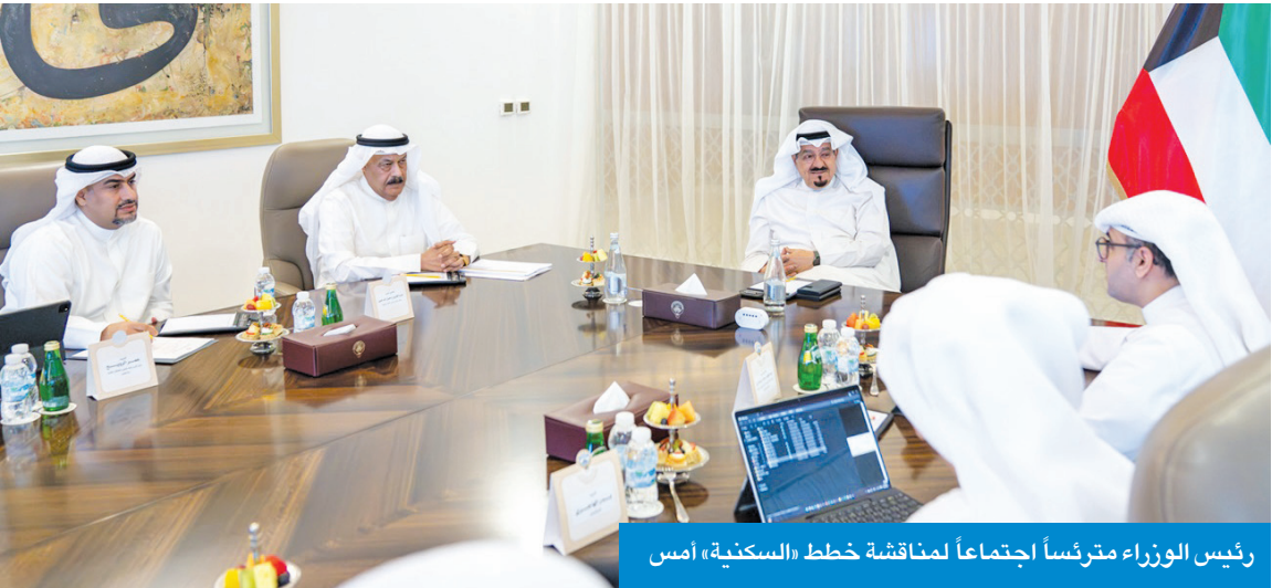
رئيس الوزراء مرتسأ اجتماعاً لمناقشة خطط «السكنية» أمس

مجال إعادة التدوير والمحافظة على البيئة وخلق روافد مالية جديدة للميزانية العامة للدولة والجهات الحكومية ذات الصلة. كما ناقش الاجتماع الموقف التنفيذي لعقود النظافة العامة الجديدة وما تضمنته من البات معتمدة لتفعيل الرقابة على الأداء ورفع كفاءة التنظيم والتنفيذ وتطوير الخدمات المقدمة من الشركات المنفذة، بما يضمن رفع مستويات النظافة العامة في البلاد وتحقيق المصلحة العامة. حضر الاجتماع رئيس ديوان رئيس مجلس الوزراء عبدالعزيز الدخيل وعدد من كبار المسؤولين في بلدية الكويت والجهات المعنية.