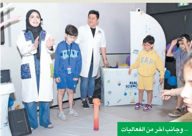
... وجانب آخر من الفعاليات

في إطار التزامه المستمر بترسيخ بيئة عمل إيجابية تتمحور حول العنصر البشري، نظم بنك برقان فعالية خاصة بعنوان «اصطحب طفلك إلى العمل»، في مبادرة تعد الأولى من نوعها على مستوى البنك. واستقبلت الفعالية أبناء الموظفين الذين تتراوح أعمارهم بين 5 و 15 عاماً، ليوم حافل بالتعلم والإبداع والتجارب التفاعلية التي قدمت لهم لمحة ممتعة ومبسطة عن عالم العمل المصرفي. لم تكن هذه الفعالية مجرد مناسبة ترفيهية، بل جسدت التزام «برقان» العميق برفاهية الموظفين، وتعزيز الروابط