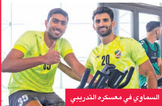
السمواي في معسكره التدريبي

يواصل الفريق الأول لكرة القدم بنادي السالمية استعداداته للموسم المقبل ضمن معسكره التدريبي المقام حالياً في تركيا، حيث يلتقي اليوم فريق إزمير التركي في ثاني مواجهاته الودية. وكان السمواي استهل معسكره بفوز كبير على ماغوسا القبرصي بأربعة أهداف مقابل هدف، في لقاء شهد أداءً هجومياً لافتاً.