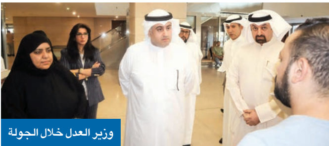
وزير العدل خلال الجولة

«لمواكبة تطلعات البلاد وتعزيز كفاءة الأداء واختصار وقت المراجعين»