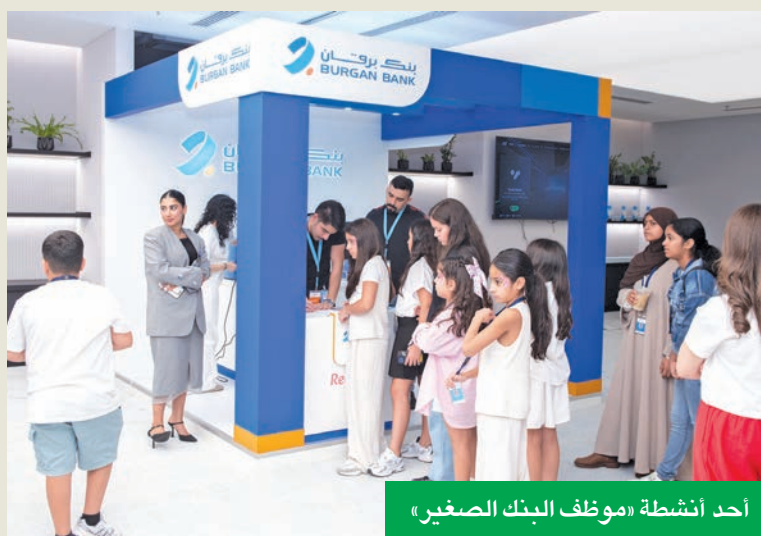
أحد أنشطة «موظف البنك الصغير»