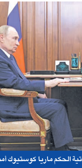
بوتين مجتمعاً في موسكو بحاكمة المنطقة اليهودية الذاتية الحكم ماريا كوستيوك أمس

وتبقى قضية الأراضي التي تسطر عليها روسيا - والتي تقدر بنحو 20 في المئة من أوكرانيا - العائق الأكبر أمام أي اتفاق محتمل. فبينما تصبّ كريف على عدم تقديم أي تنازلات