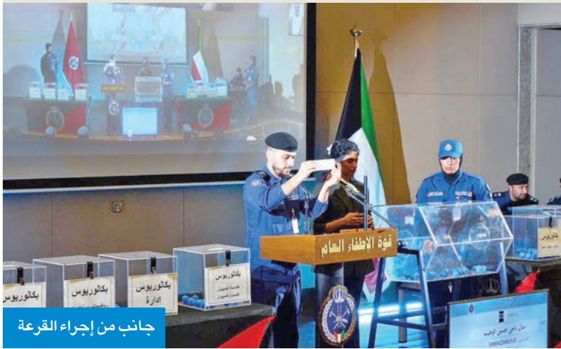
جانب من إجراء القرعة

«القوة» أجرت قرعة علنية ورشحت 25 متقدمة أخرى كقائمة احتياطية