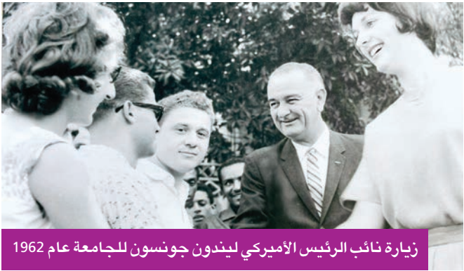
زيارة نائب الرئيس الأميركي ليندون جونسون للجامعة عام 1962

تحكي لنا ميقاتي، المتخصصة في علوم الكمبيوتر، والتي تولت مهمتها بإدارة المكتبة والأرشيف منذ سنوات، كيف أن أسنادة مارست التدريس بالجامعة وعمرها قارب على المئة سنة لديها أرشيف وثائقي قامت بإهدائه إلى المكتبة، وهي أرادت ذلك مثالا على المجموعات الخاصة بوثائق وأرشيف شخصيات سياسية ووطنية وفنية، كالموسيقار وليد غلمية، ورؤساء