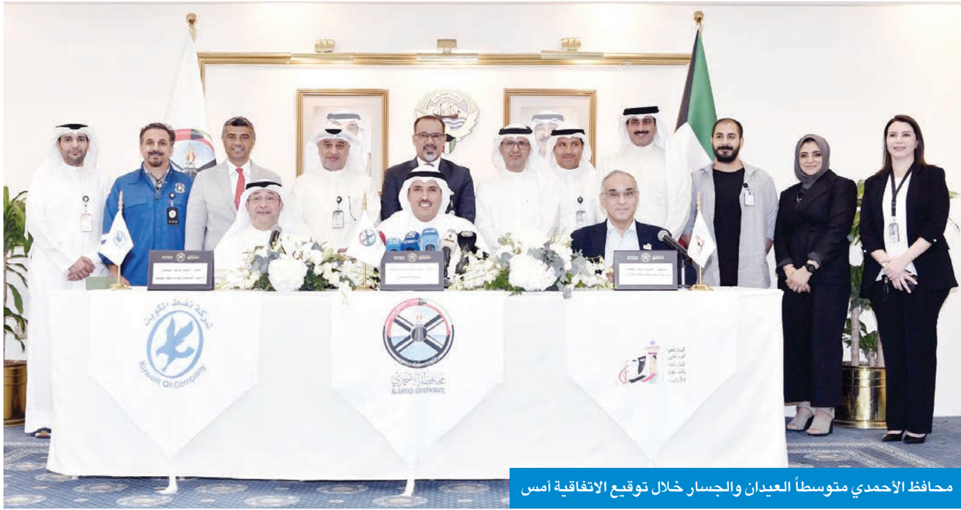
محافظ الأحمدى متوسطاً العبدان والجسار خلال توقيع الاتفاقية أمس

أكد محافظ الأحمدى الشيخ حمود الجابر، أمس، أن مشروع ترميم سوق الأحمدى القديم وسينما الأحمدى يجسّد حرص الكويت على صون هويتها التراثية والحضارية، مثنياً دعم مجلس الوزراء ووزير الإعلام والثقافة وزير الدولة لشؤون الشباب عبدالرحمن المطيري، ووزير النفط طارق الرومي، وكل الجهات المعنية. وقال الجابر لـ «كونا»، عقب توقيع اتفاقية الإشراف على تنفيذ أعمال المشروع بين شركة نفط الكويت والمجلس الوطني للثقافة والفنون والآداب، تنفيذاً لقرار مجلس الوزراء رقم 927 الصادر في 8 يوليو 2025، إن محافظة الأحمدى ستواصل دورها في المتابعة والتنسيق بين الجهات الحكومية لتسريع وتيرة التنفيذ، وتذليل أي عقبات قد تعترض المشروعين، في إطار دعم المشاريع التنموية.