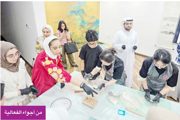
من أجواء الفعالية

المحلية، ويمثل معاني الفرح والوحدة والصدقة. ويمثل الحدث انطلاقة لسلسلة فعاليات ثقافية ينظمها المركز على مدار شهر أغسطس الجاري، تتضمن ورش عمل، وعروض فنون شعبية، ومحاضرات تعريفية بثقافة الصين، ضمن استراتيجية طويلة الأمد لتعزيز الحوار الثقافي والتقارب بين الشعبين الصيني والكويتي. ويعد المركز الثقافي الصيني بالكويت الأول من نوعه في منطقة الخليج، وأصبح نافذة حيوية لتعلم اللغة الصينية والتعرف على الثقافة الصينية التقليدية والمعاصرة.