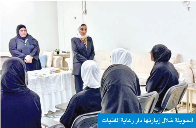
الحويلة خلال زيارتها دار رعاية الفتيات

قالت وزارة الخارجية، إن الكويت أحبت اليوم العالمي للعمل الإنساني، الذي وافق أمس، أن الكويت تستذكر بإجلال تضحيات مقدمي الدعم الإنساني والإغاثي، لاسيما الذين يقفون في الصفوف الأمامية بمناطق الكوارث والزلاعات، مؤكدة ضرورة تكاتف المجتمع الدولي لوضع البات فعالة تضمن استدامة العمل الإنساني وتخفيف الأعباء الملقة على عاتق العاملين في هذا المجال. وشددت على أن تعدد التحديات الإنسانية يتطلب تعزيز آليات الحماية والمساءلة بما يكفل بيئة آمنة تضمن حقوق مستحقي المساعدات وسلامة القائمين على إيصالها، لاسيما في ظل ما يتعرض له الشعب الفلسطيني الأعزل من بطش قوات الاحتلال الإسرائيلي.