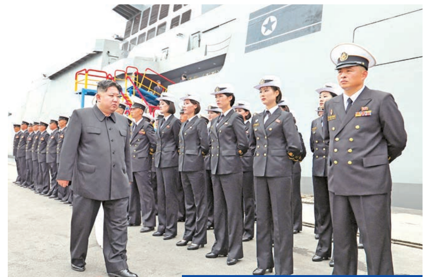
كيم يتفقد طاقم المدمرة «تشيه هيون» أمس الأول

شأن رعيم كوريا الشمالية كيم جونج أون هجوماً حاداً على الولايات المتحدة وكوريا الجنوبية واعتبر مناوراتها العسكرية الجارية حالياً «محاولة واضحة لإشعال الحرب وتهديداً كبيراً للسلام والأمن في المنطقة»، داعياً جيشه إلى توسيع قدراته النووية سريعاً. وذكرت وكالة الأنباء المركزية، أمس، أن كيم تفقد أمس الأول الاختبار التشغيلي المتكامل لأنظمة الأسلحة على متن المدمرة «تشيه هيون» أول مدمرة كورية شمالية بوزن 5000 طن التي تم تدشينها في أبريل الماضي بميناء نامبو غرب كوريا. وقال الريعم الكوري إن التعاون العسكري المتزايد بين الولايات المتحدة وكوريا الجنوبية واستعراض