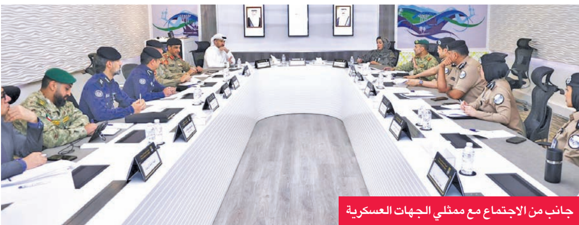
جانب من الاجتماع مع ممثلي الجهات العسكرية

التي تستدعي ذلك، مع الحفاظ على التوازن بين الالتزامات الوظيفية والتمثيل الرياضي. ووجه السالم الشكر إلى الجهات العسكرية والأطقم الإدارية على تعاونهم في صياغة ملاحظات وتوصيات سيتم العمل على تنفيذها بما يخدم مصلحة اللاعبين المنتسبين إلى تلك الجهات. ومن المنتظر عقد اجتماعات إضافية خلال الفترة المقبلة، لوضع البات تنفيذية تحقق التكامل بين الجهات الحكومية والقطاع الرياضي، بما يساهم في تعزيز مكانة الرياضة الكويتية على المستويين الإقليمي والدولي.