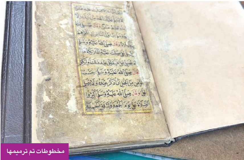
مخطوطات تم ترميمها