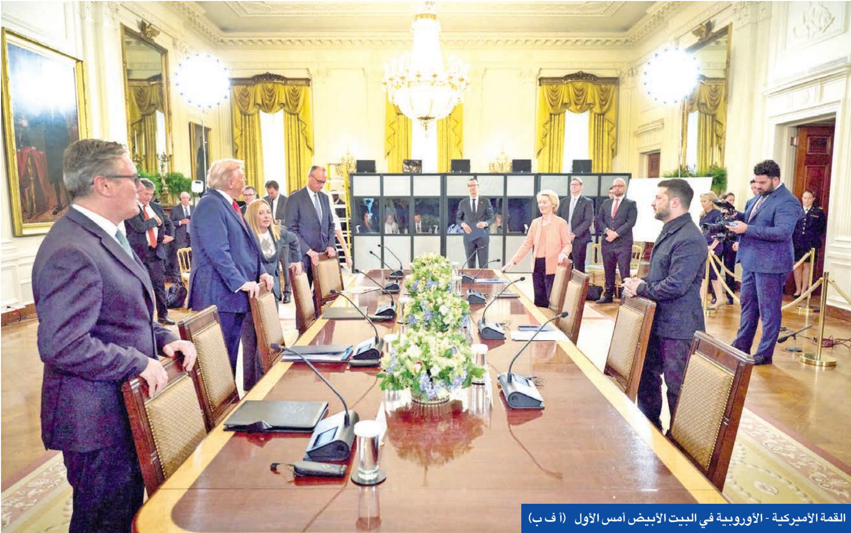
القمة الأميركية - الأوروبية في البيت الأبيض أمس الأول

مع انفتاح روسيا المشروط، واستعداد أوكرانيا للقاء بلا شروط مسبقة، وتنامي ضغوط الأوروبيين، يرى مراقبون أن الأسابيع المقبلة ستكون حاسمة؛ فإما أن تنجح جهود واشنطن في صياغة اتفاق إطار يوقف نزيف الدماء، أو أن تعود الحرب إلى التصعيد مع مزيد من الخسائر.