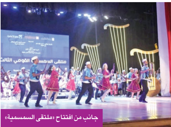
جانب من افتتاح «ملتقى السمسسية»

وقدّمت فرق من محافظات القنّاة وسيناء عروضاً غنائية وموسيقية جسّدت روح السمسسية وإيقاعاتها المميزة، في مشهد أعاد إلى الأذهان أجواء الأفراح الشعبية وملامح المقاومة الوطنية. ويستمر الملتقى على مدار يومين بمشاركة 9 فرق فنية، تتوزع عروضها بين الإسماعيلية ومدن القنّاة، بهدف تعزيز حضور السمسسية في المشهد الثقافي المصري.