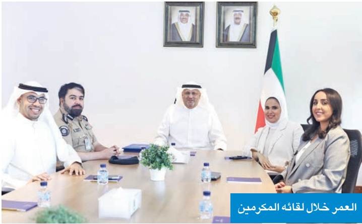
العمر خلال لقائه المكرمين

أكدت وزيرة الشؤون الاجتماعية وشؤون الأسرة والطفولة د. أمثال الحويلة أن اليوم العالمي للعمل الإنساني يشكل محطة سنوية لتكريم وتقدير جهود العاملين في المجال الإنساني حول العالم.