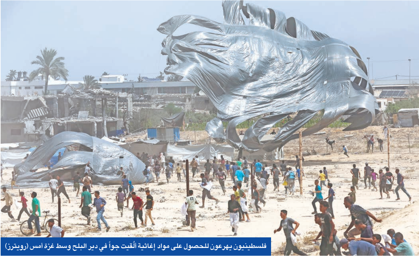
فلسطينيون يهرعون للحصول على مواد إغاثية أُلقيت جواً في دير البلح وسط غزة أمس

حماس حُسمت. لذا أوقفوا القصف»، وأكد رفض بلاده اتجاه إسرائيل لغزو قطاع غزة واحتلال أجزاء من الضفة الغربية. وتعليقاً على تقارير أفادت بأن إسرائيل تتفاوض مع دول عدة لنقل سكان قطاع غزة إليها، قال تاباني: «هذا أمر غير مقبول»، مشيراً إلى أن إيطاليا مستعدة لإرسال قوات تحت مظلة بعثة أممية بقيادة عربية لبناء الدولة الفلسطينية. في موازاة ذلك، جددت فنلندا تأكيدها أنها تنتظر اللحظة المناسبة للاعتراف بدولة فلسطينية، فيما دان «الاتحاد الأوروبي» هدم إسرائيل مدرسة يمولها مع فرنسا لاستقبال الأطفال الفلسطينيين في الضفة الغربية، داعياً سلطات الاحتلال لحماية استثمارته الداعمة للشعب الفلسطيني وفقاً للقانون الدولي.