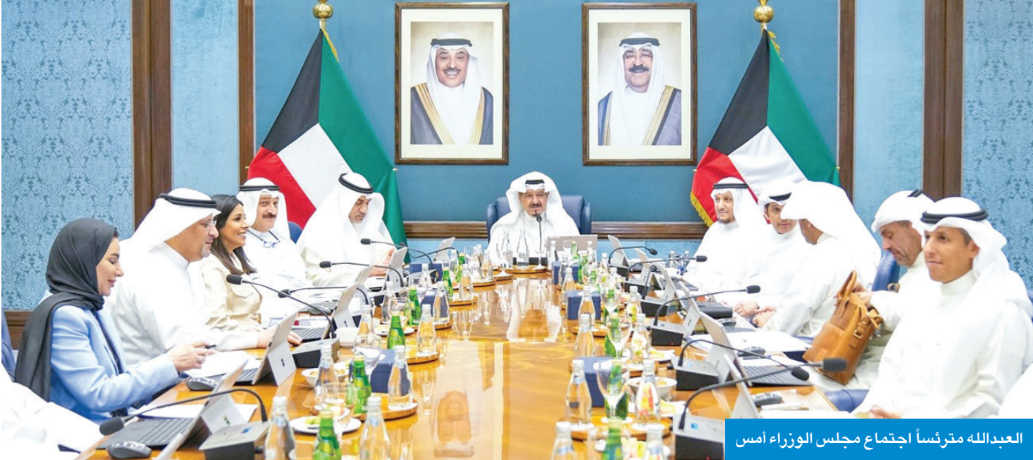
العيدالله مترئساً اجتماع مجلس الوزراء أمس

● اتخاذ الإجراءات القانونية اللازمة وإغلاق عدد من المحال المخالفة