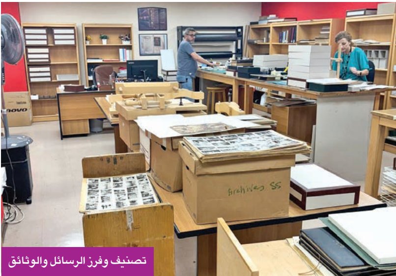
تصنيف وفرز الرسائل والوثائق