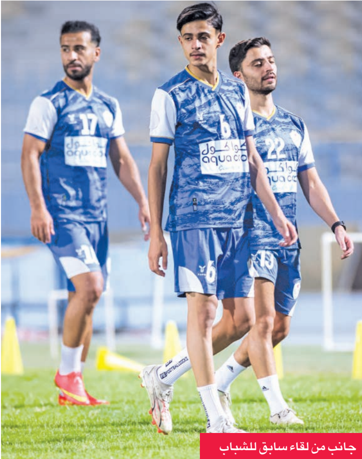
جانب من لقاء سابق للشباب