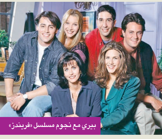
بيري مع نجوم مسلسل «فريبنذر»

وأثناء تفتيش منزلها، عثر المحققون على 80 قارورة من الكيتامين والميثامفيتامين والكوكايين والزئبق، وغيرها من المخدرات التي تم الحصول عليها بطريقة غير مشروعة. وبالنسبة للكيتامين، كانت سانغا تفاخر بقدرتها على «تلبية أي طلب»، وفق التحقيق، بفضل علاقاتها مع طاه وعالم. وكتب الوسيط المدعي عليه إلى مساعد ماثيو بيري الشخصي: «إنها تتعامل فقط مع المشاهير والطبقة الراقية»، مضيفا: «لو لم تكن تقدم نوعية جيدة لخسرت زبائنها».