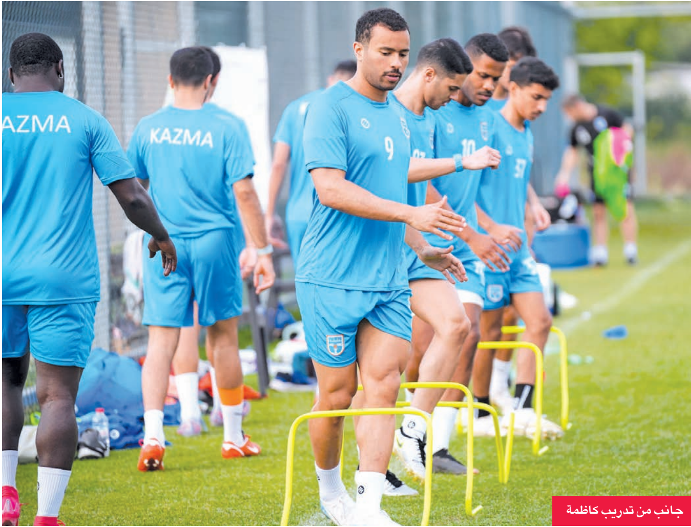
جانب من تدريب كاظمة

الأولى، والارتقاء بالثانية بشكل مستمر. وتحرص إدارة النادي على تذليل كل العقبات التي تواجه الفريق، من أجل التركيز فقط في المستطيل الأخضر.