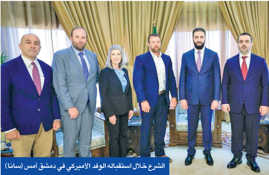
الشرع خلال استقباله الوفد الأمريكي في دمشق أمس (سانا)

عبرية بأن قوات الجيش الإسرائيلي أعادت المستوطنين الذين كانوا يعتزمون البقاء بالمنطقة السورية فترة طويلة وفتحت تحقيقاً معهم، نشرت صور