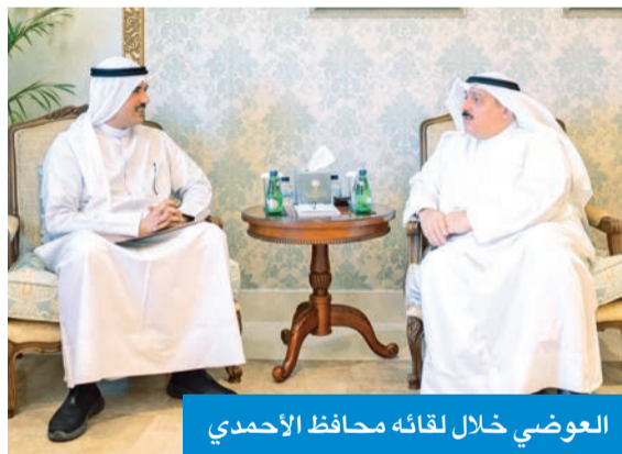
العوضي خلال لقائه محافظ الأحمدية

أوضح أن الاجتماع تناول المحطة المستقبلية التي تتضمن إنشاء مرافق طبية متطورة، وفصل العيادات الخارجية عن المستشفى الرئيسي، لتقليل الازدحام، وإنشاء مستشفى جديد