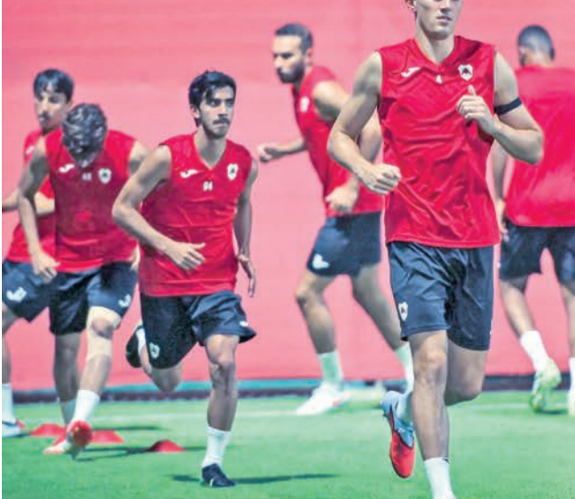
جانب من تدريب فريق الريان