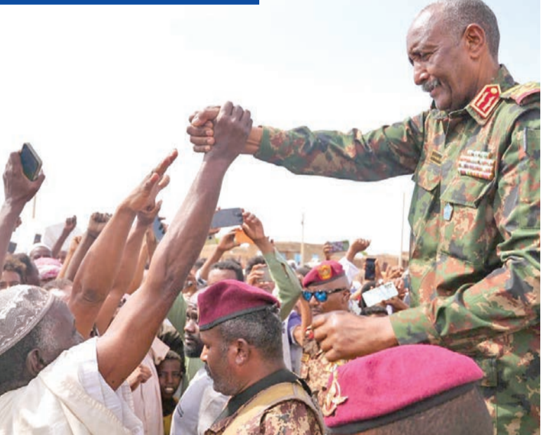
زيارة البرهان لود النورة 5 أغسطس

وبمثل رد كيكل، الذي انشق في وقت سابق عن «الدعم السريع»، على الضربة التي تعد الأولى من نوعها في المنطقة منذ أشهر، خطوة باتجاه تعزيز وجود قواته في المناطق التي تشهد اشتباكات عنيفة بين الجيش الموالي لرئيس مجلس السيادة عبدالفتاح البرهان وقوات المتمردين بزعامة محمد حمدان دقلو، المعروف بـ «حميدتي»، وأمس الأول، تحدثت مصادر سودانية عن لقاء جمع البرهان بمستشار الرئيس الأميركي للشؤون الإفريقية، مسعد بولس، في سويسرا، حيث بحثا مقترحاً أميركياً لإرساء السلام في السودان. وحسب ما رشح عن اللقاء، تم بحث سبل التوصل لوقف لإطلاق النار وتأمين وصول المساعدات وإحياء مسار للتحول الديمقراطي بما يتوافق مع مطالب ثورة ديسمبر 2018، وإعادة التعاون في مجال مكافحة الإرهاب.