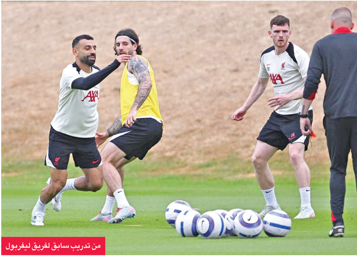
من تدريب سابق لفريق ليفربول

قبل انطلاق «البريميرليغ» تشلسي يسعى لمواصلة الصراع ومانشستر يونايتد لموسم مثير