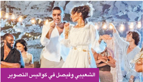
الشعبي وفيصل في كواليس التصوير