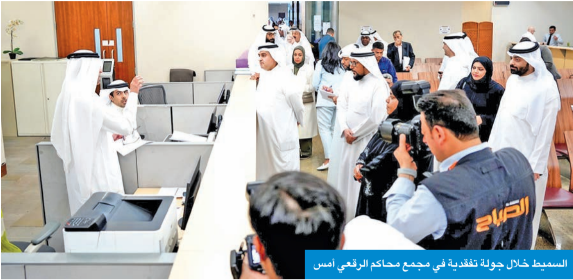
السميط خلال جولة تفقدية في مجمع محاكم الرفعي أمس

أعلن وزير العدل المستشار ناصر السميّط إطلاق أكبر خطة لتطوير التشريعات في تاريخ الكويت قريباً بتضافر جهود مختلف جهات الدولة ومؤسسات المجتمع المدني، بما يشمل تسخير الثورة الرقمية لخدمة العدالة والقانون وتحقيق عدالة ميسرة وفعالة ومتواصلة. وقال المستشار السميّط، في تصريح صحفي أمس، خلال جولة تفقدية له في مجمع محاكم (الرفعي) أمس، إن الكويت شهدت نهضتين تشريعتين الأولى قبل صدور الدستور (منذ سنة 1959 حتى سنة 1965) وأنجزت خلالها قوانين رئيسية من ضمنها قانون الجنسية.