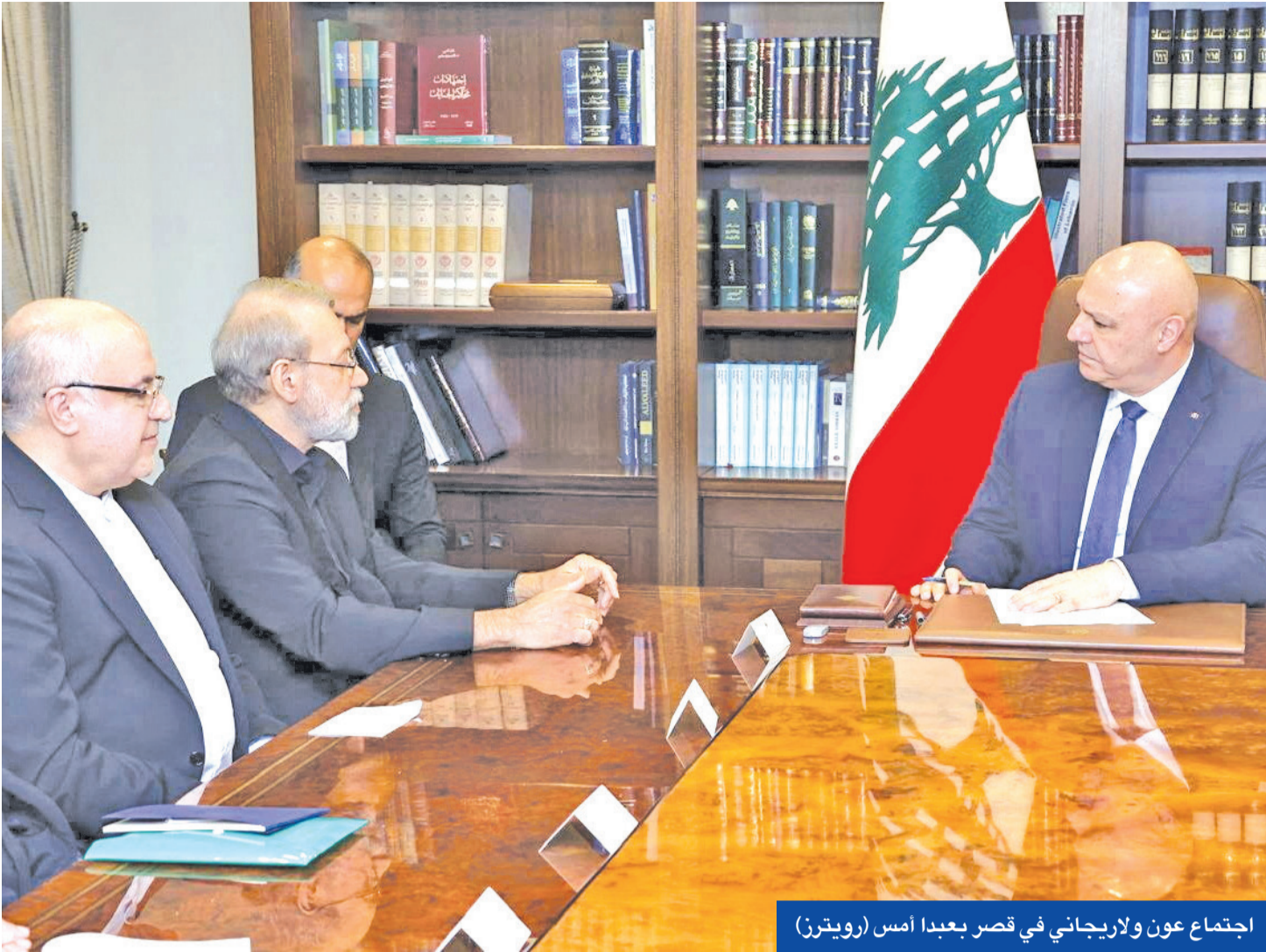
اجتماع عون ولاريجاني في قصر بعبدآ امس

عون: لغة بعض المسؤولين الإيرانيين غير مساعدة... ولن نسمح لأي جهة بحمل السلاح والاستقواء بالخارج