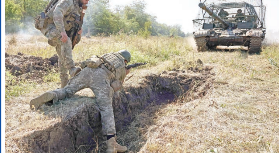
جنود أوكرايونيون عند نقطة اشتباك مع القوات الروسية في زابوريزهيا أمس

وأوضحت أن «موقف روسيا من السلام في أوكرانيا لم يتغير، وهو الموقف الذي حدده بوتن في يونيو العام الماضي».