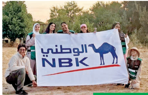
جانب من البرنامج

في إطار التزامه الراسخ بتنمية المجتمع وتطوير الشباب الكويتيين ليصبحوا قادة فاعلين في المستقبل، شمل بنك الكويت الوطني برعايته برنامج المغامرة الخضراء، في إطار شراكته الاستراتيجية مع مؤسسة لويك.