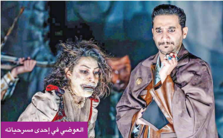
العوضي في إحدى مسرحياته

أكد لـ الجريدة. أنه يستعد لتقديم مسلسل موسمي من 10 حلقات