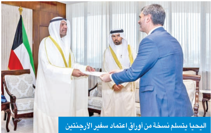
اليحيا يتسلم نسخة من أوراق اعتماد سفير الأرجنتين

ديوان عام وزارة الخارجية، وتمنى الوزير اليحيا للسفير الجديد التوفيق في مهام عمله وللعلاقات الثنائية الوثيقة التي تجمع البلدين الصديقين المزيد من التقدم والأزدهار. وعلى صعيد متصل، تلقى اليحيا اتصالاً هاتفياً من نائب رئيس الوزراء ووزير الخارجية وشؤون المغتربين في المملكة الأردنية الهاشمية أيمن الصفدي، وقالت وزارة الخارجية في بيان إنه جرى خلال الاتصال استعراض مجمل العلاقات الثنائية الوثيقة التي تربط بين البلدين الشقيقين وأطر تعزيزها وتنميتها في مختلف المجالات والمستجندات ذات الاهتمام المشترك.