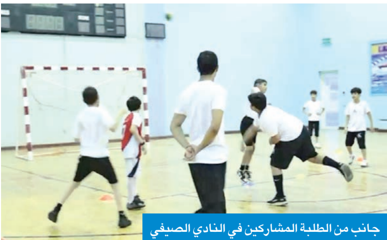
جانب من الطلبة المشاركين في النادي الصيفي

الكرامة التي أسهمت في إتاحة الفرصة للطلبة للاستفادة من أوقاتهم خلال العطلة الصيفية في بيئة تعليمية وتربوية آمنة.