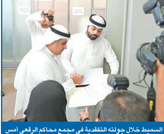
السميط خلال جولته التفقدية في مجمع محاكم الرقعي أمس

وزير العدل: مشروع «القضاء الجديد» في عهدة «الفتوى والتشريع»... وإقراره قريباً