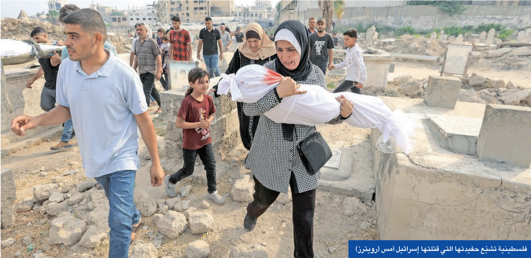
فلسطينية تشيع حفيدتها التي قتلتها إسرائيل أمس

زامير مجدداً، مؤكداً أنه «بعد أحداث 7 أكتوبر، لم يعد هناك جيش خارج نطاق الرقابة»، وجاء ذلك في وقت تم إلغاء جلسة لجنة الخارجية والأمن بد «الكنيست»، لعدم توافر أغلبية للمصادقة على تمديد أوامر استدعاء الاحتياطي.