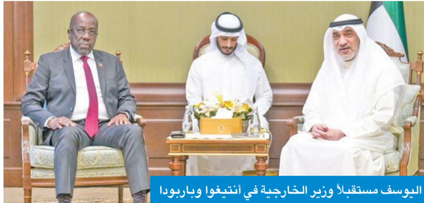
اليوسف مستقبلاً وزير الخارجية في أنتيغوا وباربودا

المرافق له، بمناسبة زيارته للبلاد. وجرى خلال اللقاء استعراض العلاقات الثنائية بين البلدين وسبل تعزيزها إضافة إلى تبادل وجهات النظر حول القضايا ذات الاهتمام المشترك.