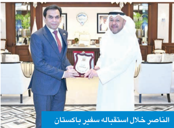
الناصر خلال استقباله سفير باكستان

وأشاد المحافظ بجهود الهيئة في خدمة شباب الكويت، مؤكداً حرصه على التزام محافظة الفروانية بدعم المبادرات الشبابية وتشجيع مشاركة الشباب في صياغة مستقبل أفضل للكويت وتذليل العقبات التي قد تواجه مراكز الشباب في المحافظة بالتنسيق مع الجهات المختصة، واهتمامه بكل ما من شأنه دعم الشباب وتمكينهم للمساهمة في التنمية المجتمعية.