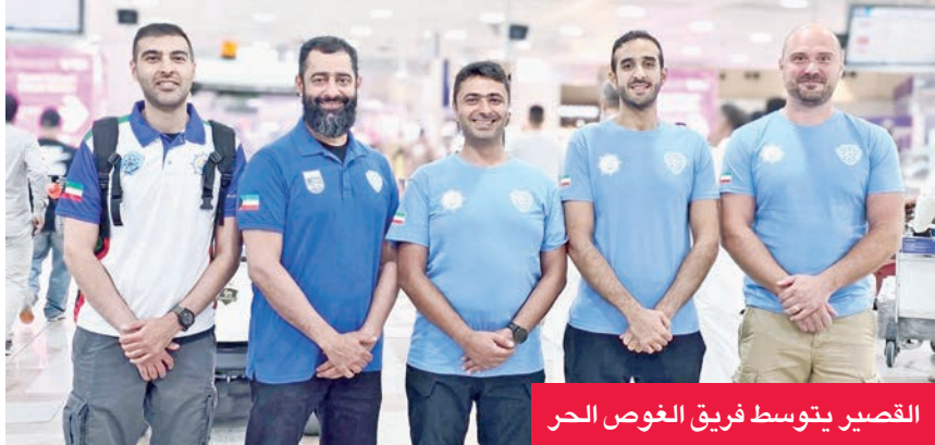
القصير يتوسط فريق الغوص الحر

نأمل تحقيق نتائج مشرفة وسط مشاركة دولية واسعة علي الشمالي