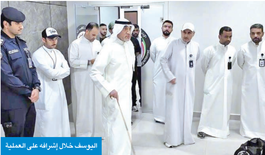
اليوسف خلال إشرافه على العملية