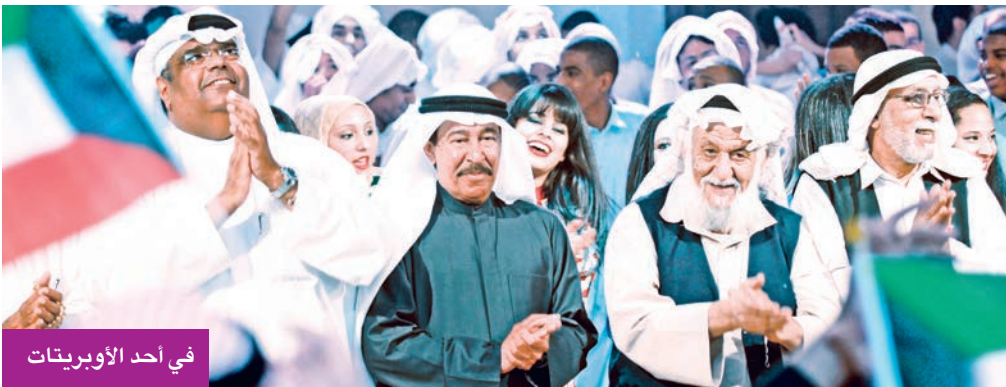
في أحد الأوبريتات

وأضافت أن الراحل تميز بحضوره المؤثر وأسلوبه العفوي ووفائه لمهنته وجمهوره، فكان مثلاً للفنان المخلص الذي جمع بين المهية والالتزام، وترك بصمة لا تنسى في ذاكرة الفن الكويتي والخليجي.