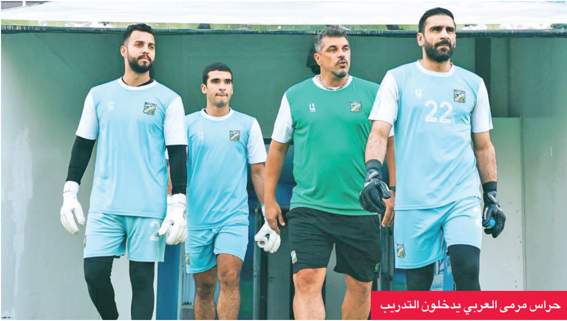
حراس مرمى العربي يدخلون التدريب