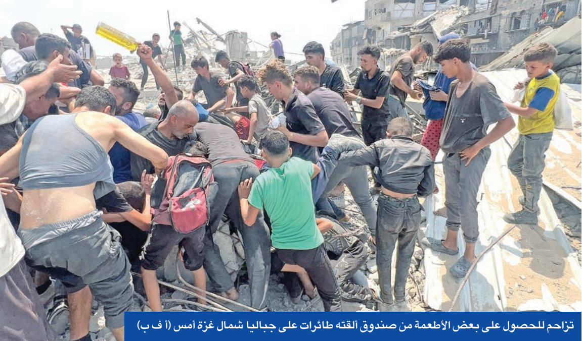
تزامن للحصول على بعض الأطعمة من صندوق الفته طائرات على جباليا شمال غزة أمس

القطري محمد عبدالرحمن في إسبانيا لمناقشة خطة شاملة لإنهاء حرب غزة. ونقلت وكالة أسوشيتد برس، عن مسؤولين عريبيين أن الوسيطين القطري والمصري يعكفان على إعداد مقترح اتفاق جديد، في غضون أسبوعين، سيُشمل إطلاق جميع الجنود الإسرائيليين الأسرى، الأحياء منهم والأموات، دفعة واحدة مقابل إنهاء الحرب وانسحاب قوات الاحتلال من القطاع.