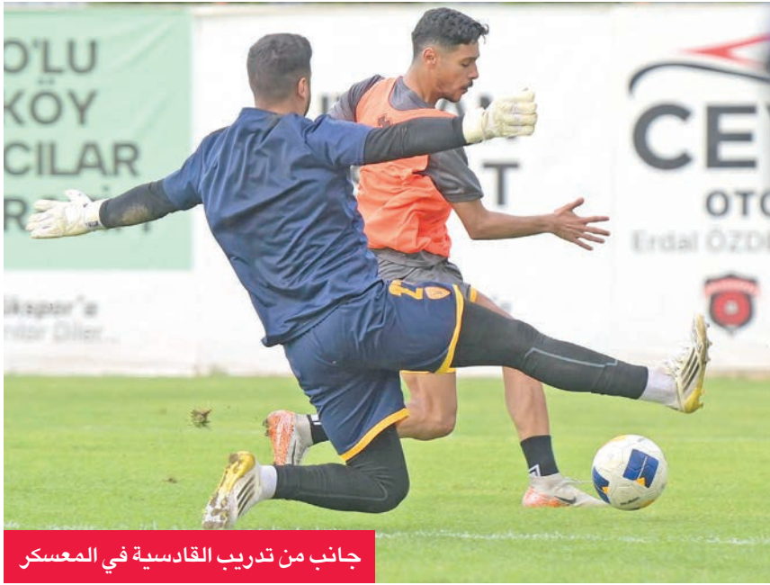
جانب من تدريب القادسية في المعسكر