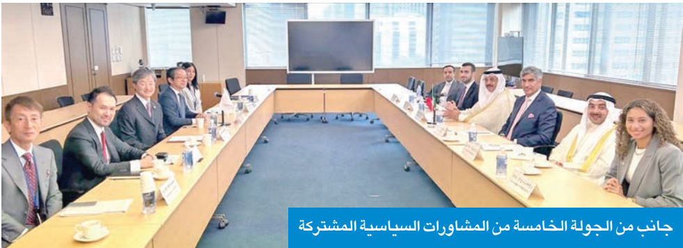
جانب من الجولة الخامسة من المشاورات السياسية المشتركة

إبوابا تاكيشي، إلى الكويت في الأول من شهر سبتمبر المقبل، التي سيجري خلالها مباحثات رسمية مع وزير خارجية الكويت عبدالله الجبير تهدف إلى فتح جديد واستمرار رفع مستوى التعاون الثنائي في عدد من القطاعات ذات الاهتمام المشترك، إضافة إلى مشاركته في أعمال الاجتماع الوزاري الثاني المشترك للحوار الاستراتيجي بين دول مجلس التعاون واليابان.