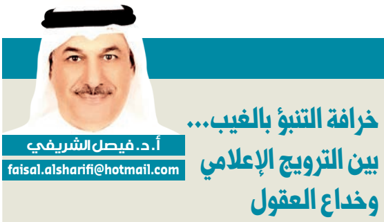
خرافة التنبؤ بالغيب...