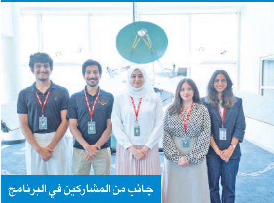
جانب من المشاركين في البرنامج

التدرب العملي المباشر على أحدث التقنيات الفضائية، واكتساب مهارات تخصصية في مجالات عدة، منها: دمج الحمولة ضمن مركبات الفضاء، والتعامل مع بروتوكولات التفريغ الكهروستاتيكي، وإجراءات العمل في الغرف النظيفة، إلى جانب التعرف على أساسيات تصميم المركبات الفضائية والهندسة النظمية. وتابعت أنه تم تنفيذ البرنامج بإشراف مباشر من علماء ومهندسي مختبر LASP، ما منح الطلبة بيئة تدريبية متقدمة تنسجم مع أفضل الممارسات العالمية في هذا المجال. وأكدت أن دعمها لتلك الفعالية العلمية في جامعة كولورادو، التي تتمتع بخبرة تمتد أكثر من 70 عاماً في هذا المجال، يُجسد التزامها بوضع الكويت في مصاف الدول الرائدة علمياً، عبر تأسيس قاعدة وطنية متخصصة قادرة على تصميم وتشغيل وإدارة المشاريع الفضائية.