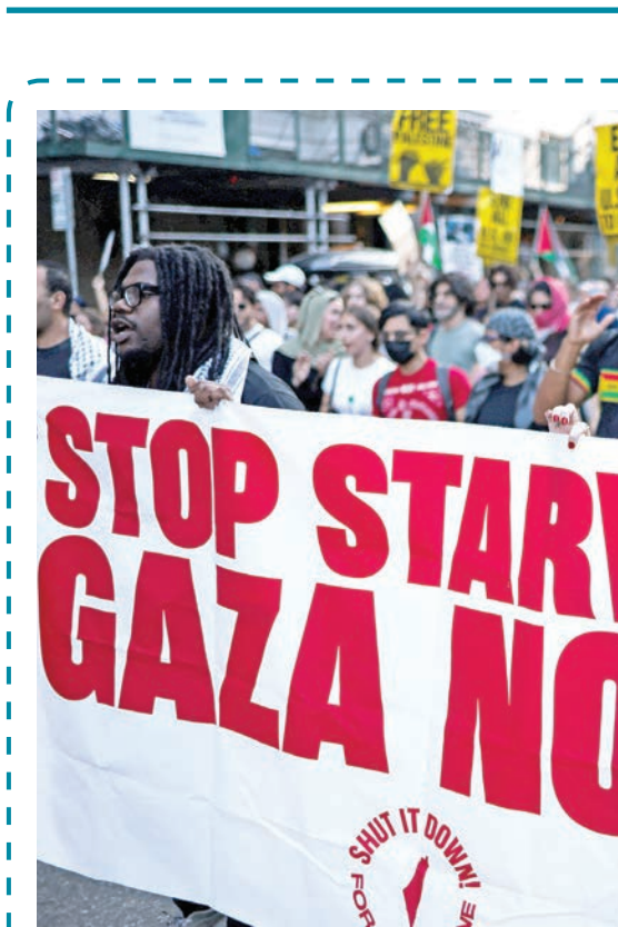
متظاهرون يشاركون في مظاهرة «انهضوا من أجل غزة» في نيويورك