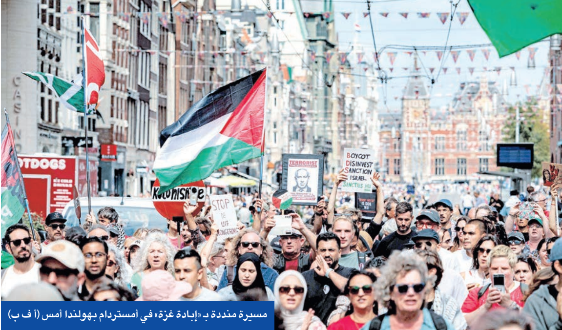
مسيرة منددة بـ «إبادة غزة» في أمستردام بهولندا أمس