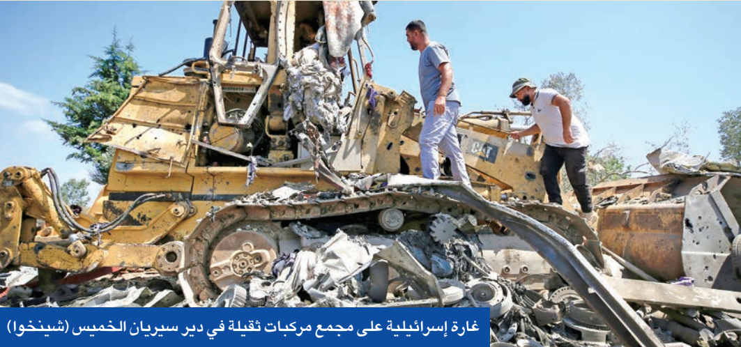
غارة إسرائيلية على مجمع مركبات ثقيلة في دير سيريان الخميس

السلاح وكيفية تطبيقها، وموقف حزب الله الرافض لذلك كلياً، معتبراً أنه لن يناقش ملف السلاح قبل انسحاب إسرائيل ووقف الخروقات والاعتداءات وإطلاق سراح الأسرى وإطلاق مسار إعادة الإعمار. إن تقسيم سيقود إلى احتمالين، إما أن تتجج الضغوط الأميركية على إسرائيل لوقف الضربات وحشد الدعم للبنان في إطار تقوية موقف الدولة. وإما ألا تتجج في ذلك فيستمر الصراع الذي سينعكس إلى مزيد من التجاذب على الساحة اللبنانية بين حزب الله من جهة، وخصومه من جهة أخرى، مما سينتج المزيد من التوترات السياسية والأمنية.