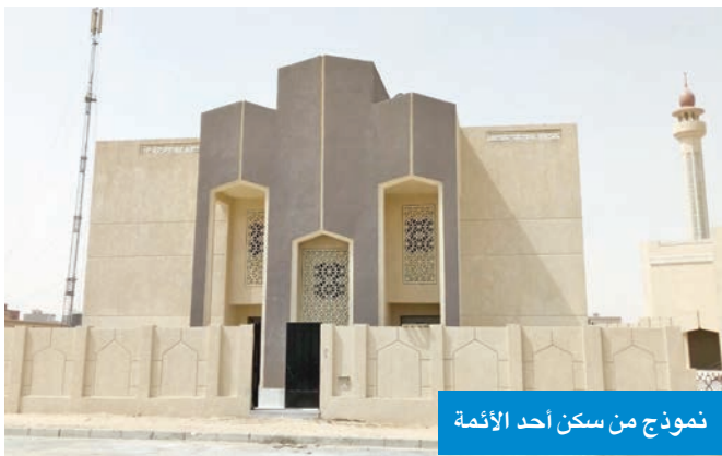
نموذج من سكن أحد الأئمة

الموافقة المبدئية على الطلب ورفعها إلى البلدية للنظر في إمكانية تخصيص الموقع في حال ما إذا تبين أن هناك حاجة إلى تخصيص الموقع للغرض محل الطلب وتوافر الشروط المطلوبة في هذه اللائحة بشأنه. وأضافت أن من مهام اللجنة، أيضاً، دراسة المشاكل والعقبات العملية والفنية والإجرائية التي تعترض طلبات التخصيص واقترح الحلول لتذليلها، ورفع مقترحاتها بشأنها لكل من المسؤولين في وزارة الشؤون الإسلامية، والبلدية، وأخيراً، تقديم المقترحات الخاصة بتطوير عمل تخصيص مواقع المساجد والسكن العائلي للأئمة والمؤذنين الكريم وعلومه الشرعية ورفعها للمسؤولين في وزارة الشؤون الإسلامية والبلدية.