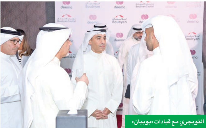
التوجيهي مع قيادات «بوبيان»

وأضاف الغانم: «صُنِفَ اليوم بين أبرز مزودي BNPL في الخليج، وننتقل إلى تسريع توسعنا في أسواق جديدة بقطاع التكنولوجيا المالية بدعم من هذا التعاون، من خلال تقديم حلول مرنة تساهم في تسهيل العمليات المالية للعملاء بالمنطقة». وتشكل هذه الشراكة نقلة نوعية في السوق الكويتي، كونها تجمع للمرة الأولى بين مؤسسة مالية إسلامية رائدة وشركة تكنولوجيا مالية مرخصة في قطاع BNPL، وتؤكد مجموعة بوبيان من خلالها التزامها بزيادة الحلول المصرفية الرقمية، ودعم الشركات الوطنية، وبناء منظومة تمويل متكاملة تستشرف الاحتياجات المستهلك الرقمي في الكويت والمنطقة. وتعد شركة ديمة الكويت من الشركات الرائدة في تقديم حلول BNPL، حيث نجحت منذ تأسيسها في بناء نموذج أعمال رقمي بالكامل بخدم شريحة واسعة من المستهلكين في الكويت، وهو ما يعكس التزام «بوبيان كابيتال» بتوفير منتجات وخدمات مالية حديثة تواكب احتياجات الأفراد والشركات في عصر الاقتصاد الرقمي.