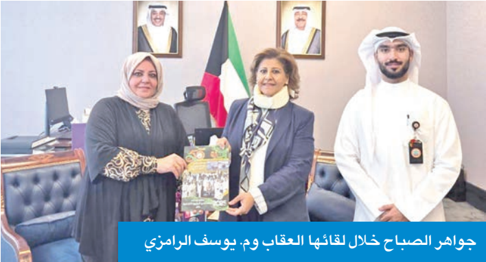
جواهر الصباح خلال لقائها العقاب وم. يوسف الرامزي

من المهام والأدوار التي تقوم بها المرأة تجاه تلك القضية المتداخلة مع جميع مجالات الحياة، معتبرة أن هذا الإصدار يتواءم مع التزامات الكويت الوطنية والدولية المتعلقة بالبيئة.