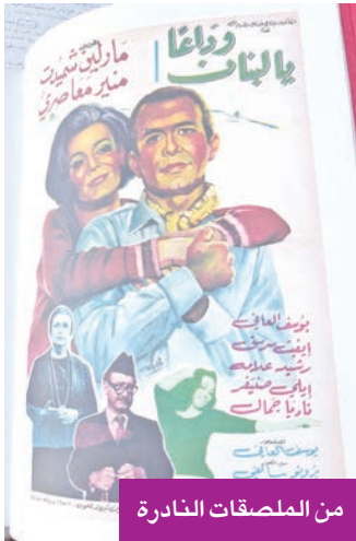
من الملصقات النادرة