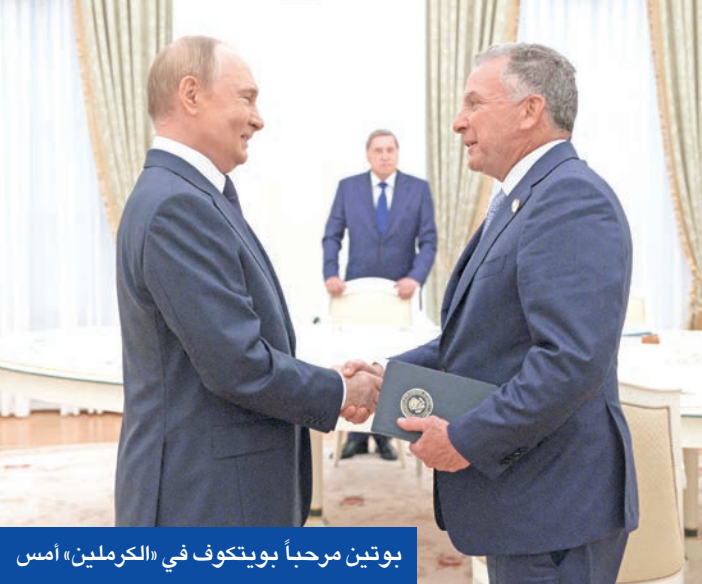
بوتين مرحباً بوييتكوف في «الكرملين» أمس

البهائي الروسي بأنه أجرى إلى جانب البحرية الصينية تدريبات على إطلاق المدفعية خلال المرحلة الختامية من تدريبات التفاعل 2025. وقالت وزارة الدفاع إن سلاحي البحرية الروسية والصينية أجريا تدريبات على مطاردة وتدمير غواصة معادية في بحر اليابان، وذلك بعد أيام من تحريك ترامب لغواصتين نوويتين إلى مسافة أقرب من روسيا، فيما يبدو أن الجيش الروسي يحضر لشتاء ساخن بأوكرانيا.