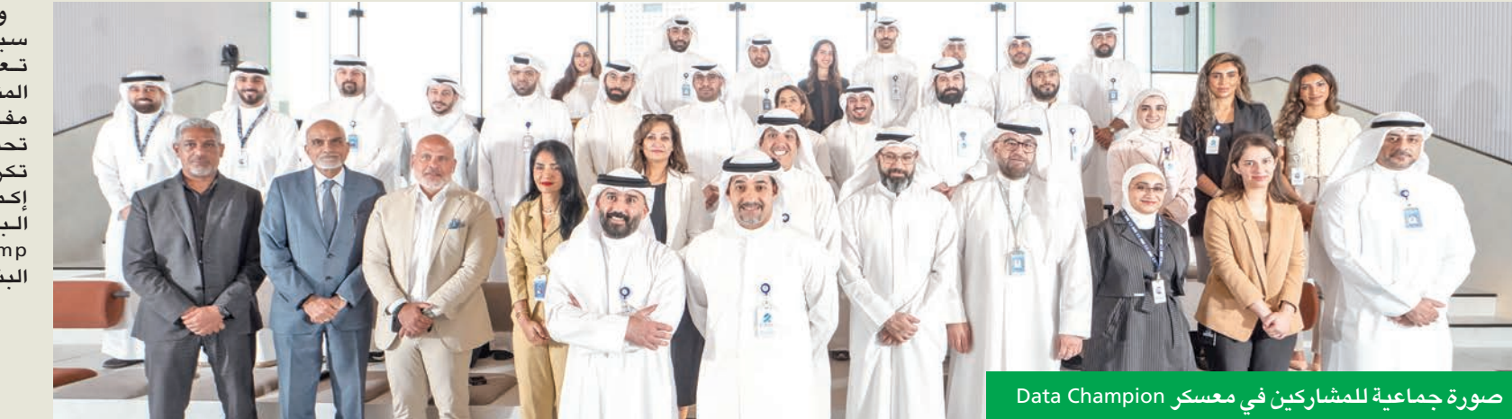
صورة جماعية للمشاركين في معسكر Data Champion