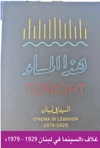
غلاف «السينما في لبنان 1929 - 1979»