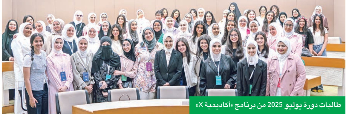
طالبات دورة يوليو 2025 من برنامج «أكاديمية X»

اجهات المستخدم، وتوظيف تقنيات الذكاء الاصطناعي لابتكار تطبيقات تفاعلية، إلى جانب تطوير مهارات التواصل، والقيادة، والعمل الجماعي، وهو ما يساهم في تعزيز قدرة الطالبات على التفكير الإبداعي وتحويل الأفكار إلى مشاريع واقعية قابلة للتنفيذ في المستقبل. ويتجسد التزام «إجيليتي» بإعداد الشباب للمستقبل من خلال بناء شركات فعالة مع مؤسسات المجتمع المدني الرائدة، بهدف توفير المزيد من فرص التعليم والتدريب التقني والمهني، وبأني دعم الشركة للتواصل الأكاديمية كودد بوصفه نموذجاً للشراكات المثمرة وطويلة الأمد، فبند إطلاق برنامج «أكاديمية X» كنسخة مصغرة ضمن برنامج «الكودد» تبرمج، في عام 2023، مروراً بإطلاق نسختها الرسمية الأولى العام الماضي، وصولاً إلى نسختها الثانية هذا العام؛