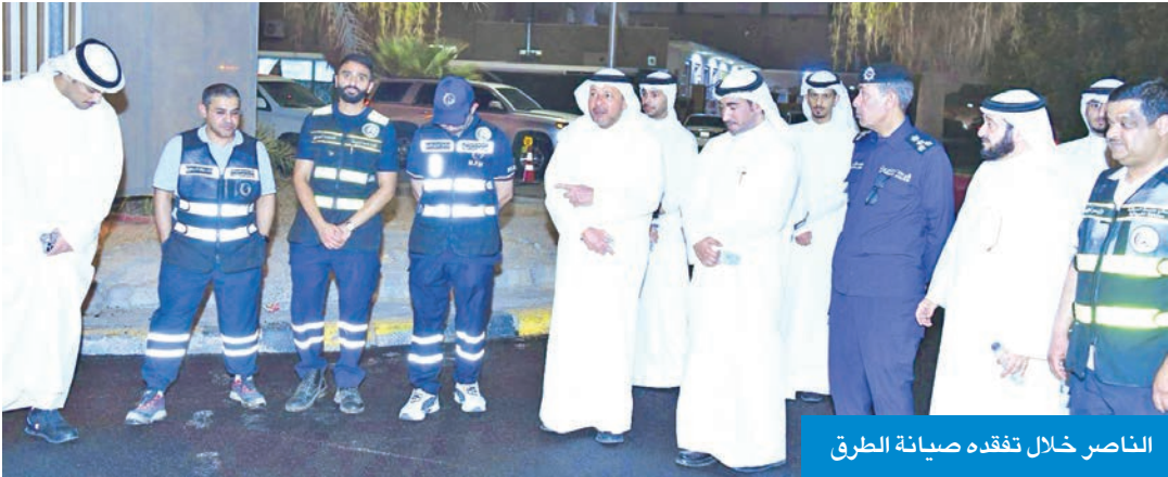
الناصر خلال تفقده صيانة الطرق

أكد محافظ الفروانية، محافظ الناصر، أهمية الالتزام بالجدول الزمني والمواصفات الفنية المعتمدة، ومواصلة المتابعة الميدانية لتحقيق تطلعات المواطنين والمقيمين في تحسين البنية التحتية والخدمات العامة في المحافظة.