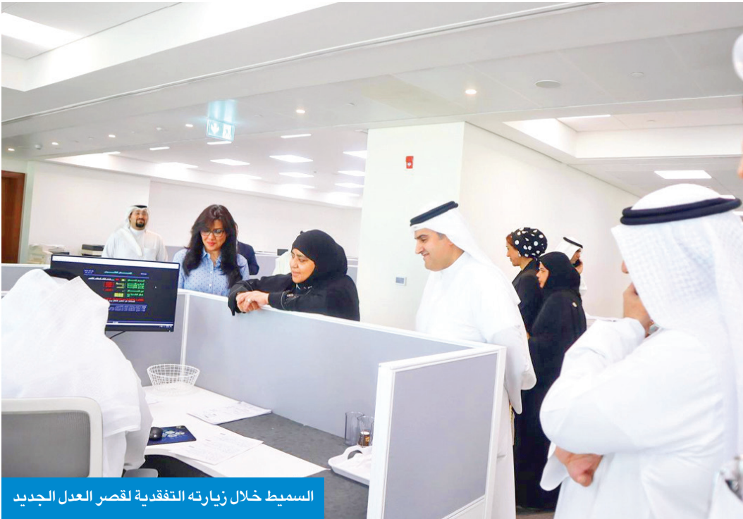
السميط خلال زيارته التفقدية لقصر العدل الجديد

تفقد قصر العدل الجديد واطلع على سير العمل • تقديم خدمة عدلية ميسّرة وعصرية تواكب التطولات