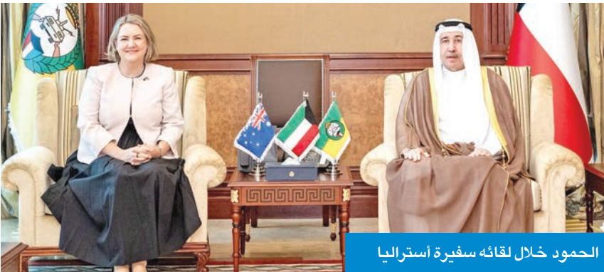
الحمود خلال لقائه سفيرة أستراليا

استقبل رئيس الحرس الوطني الشيخ مبارك الحمود، في ديوانه بالرئاسة العامة للحرس، سفيرة دولة أستراليا لدى الكويت ميليسا كيللي. ورحّب الحمود بالسفيرة الأسترالية، وبحث