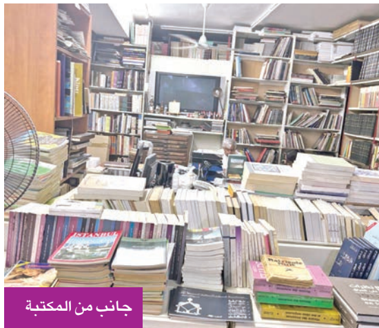
جانب من المكتبة