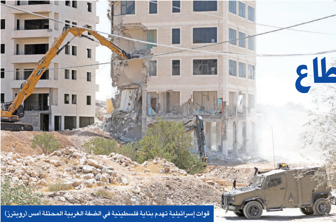
قوات إسرائيلية تهدم بناية فلسطينية في الضفة الغربية المحتلة أمس

في هذه الأثناء، صدّدت القاهرة لهجتها على المستوى الرسمي، إذ أكد وزير الخارجية، بدر عبدالعاطي، أن على المجتمع الدولي أن يخرج من الوضع الراهن في غزة. وأشار عبدالعاطي إلى «حملات التجويع الممنهجة التي تقوم بها إسرائيل بلا رادع من المجتمع الدولي، والتي وصلت كما وصفها الرئيس عبدالفتاح السيسي إلى الإبادة الجماعية، من خلال سياسة ممنهجة مرفوضة». في موازاة ذلك، حذّر السيسي من محاولات بث الفُرقة بين الشعوب العربية عبر وسائل الإعلام، مؤكداً قوة العلاقات المصرية مع الدول العربية، ولاقئاً إلى أن المنطقة تمر بظروف استثنائية منذ عام 2011، وليس منذ