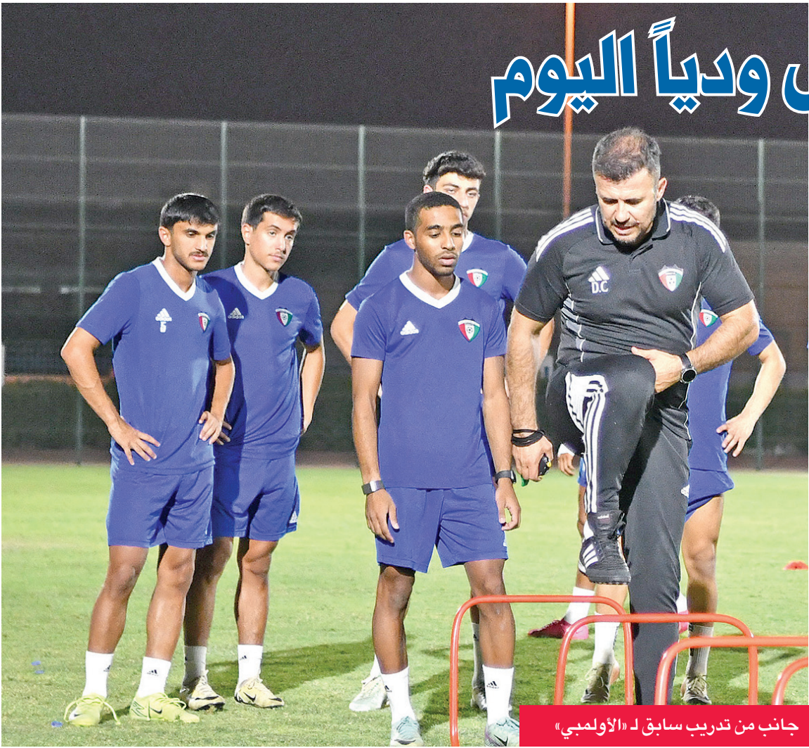
جانب من تدريب سابق لـ «الأولمبي»