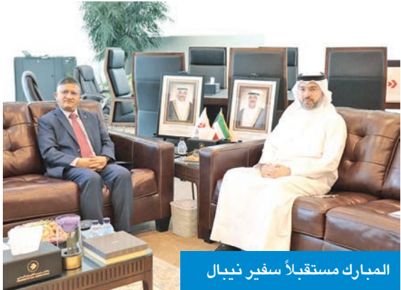
المبارك مستقبلاً سفير نيبال

بحث رئيس الهيئة العامة للطيران المدني، الشيخ حمود المبارك، أمس الأول، مع سفير نيبال لدى الكويت، غانا لامسال، سبل تعزيز التعاون المشترك في مجال الطيران المدني.