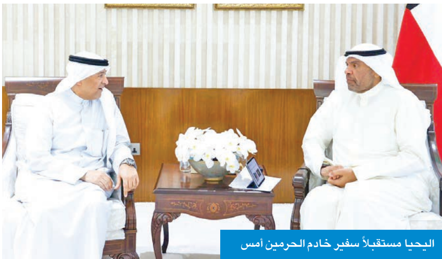
اليحيا مستقبلاً سفير خادم الحرمين أمس

بن فرحان، تتصل باواصر العلاقات المتينة التي تربط البلدين الشقيقين وأطر تعزيزهما وتنميتها في مختلف المجالات. وجاء ذلك خلال استقباله في ديوان الوزارة، صباح أمس، سفير خادم الحرمين الشريفين لدى الكويت، الأمير سلطان بن سعد.