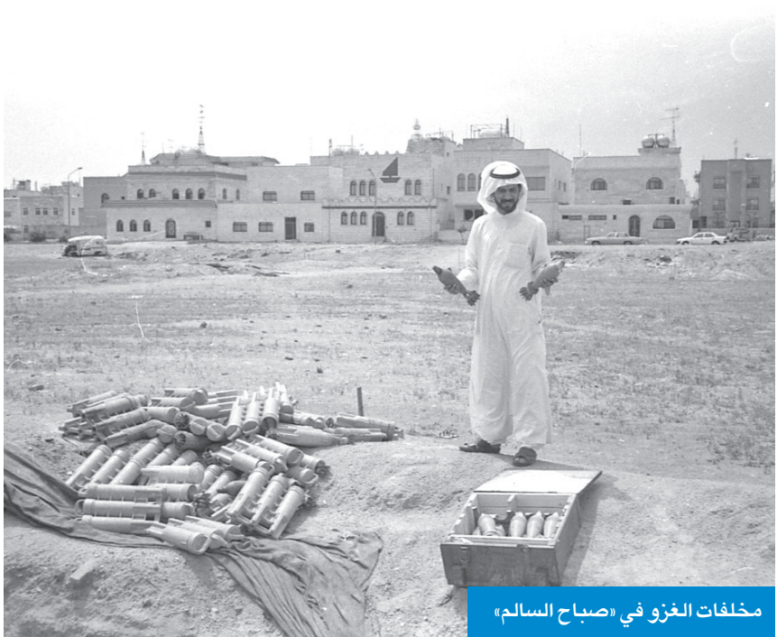
مخلفات الغزو في «صباح السالم»