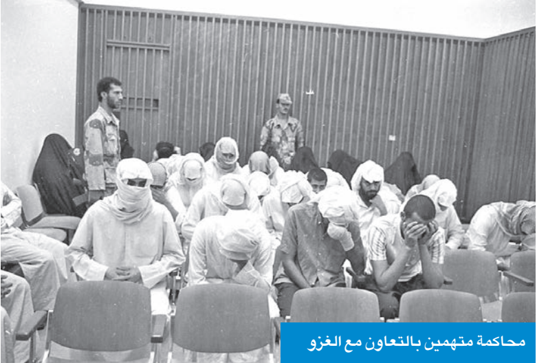
محاكمة متهمين بالتعاون مع الغزو