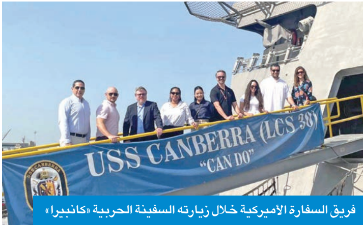
فريق السفارة الأميركية خلال زيارته السفينة الحربية «كانبيرا»

وتحرص السفارة الأميركية سنوياً على إحياء ذكرى هذا الحدث، تأكيداً على التزام الولايات المتحدة الثابت بأمن الكويت واستقرار المنطقة، كما تشكل هذه المناسبة محطة لاستذكارت التضحيات وتعزيز قيم التضامن والصداقة بين الشعبين الكويتي والأميركي.