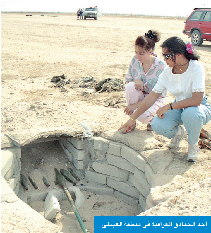
أحد الخنادق العراقية في منطقة العبدلي