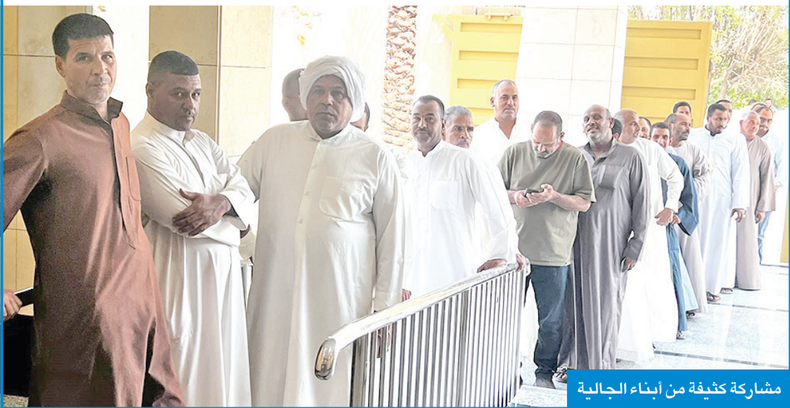
مشاركة كثيفة من أبناء الجالية