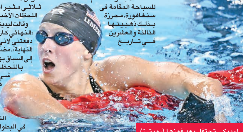
ليديكي تحتفل بعد فوزها

أكدت السباحة الأميركية كايتي ليديكي مكانتها كإيقونة سباقات المسافات الطويلة، بعدما تفوقت على منافستها الكندية سامر ماكنتوش في سباق 800 متر حرة، ضمن منافسات بطولة العالم للسباحة المقامة في سنغافورة، محرزة بذلك ذهبيتها الثالثة والعشرين في تاريخ