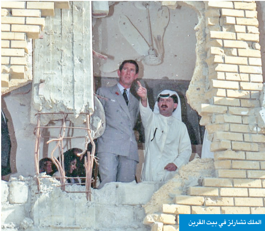
الملك تشارلز في بيت القرين