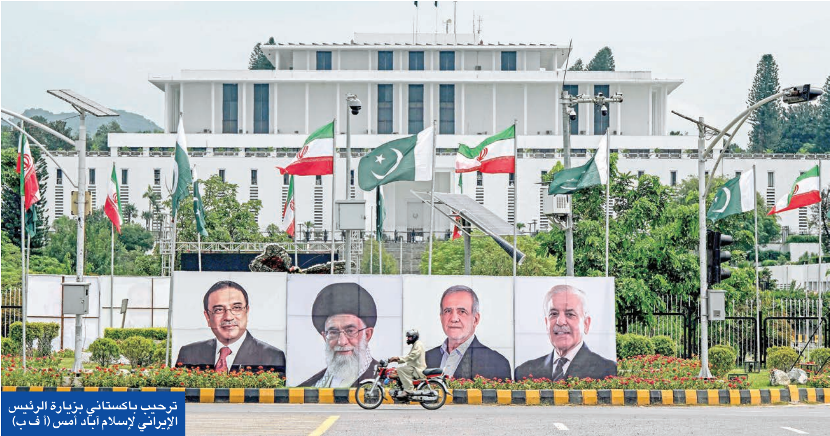
ترحب باكستاني بزيارة الرئيس الإيراني لإسلام آباد أمس (ا ف ب)