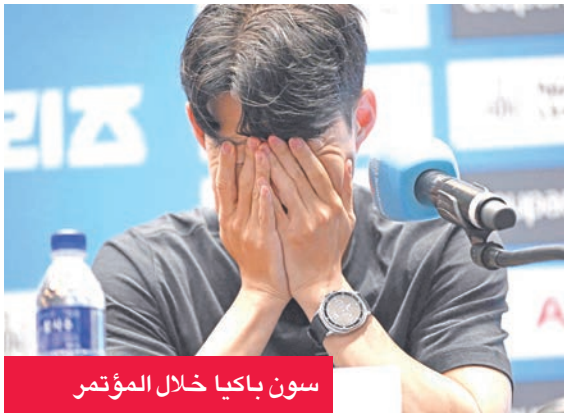
سون باكيا خلال المؤتمر

أعلن المهاجم وقائد الفريق الكوري الجنوبي سون هيونغ-مين، السبت، نيته الرحيل هذا الصيف، بعد عشرة مواسم أمضاها مع فريق شمال لندن توتنهام أحرز خلالها لقباً واحداً. وقال الجناح أمام صحافيين في سيول، حيث يلعب توتنهام مع نيوكاسل الإنكليزي مباراة ودية اليوم (الأحد): «قبل