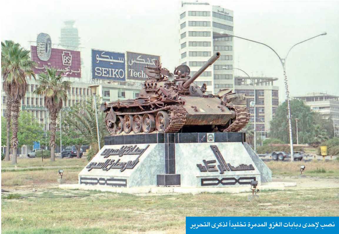
نصب لإحدى دبابات الغزو المدمرة تخليداً لذكرى التحرير

صور صبيحة الاجتياح شاهدة على وحشية الاحتلال وشجاعة شعب رفض الانحاء