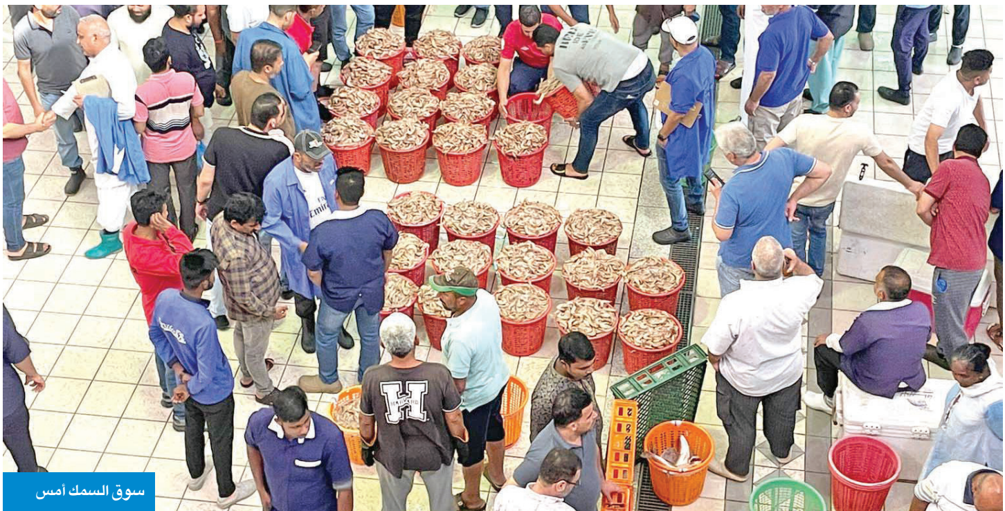
سوق السمك امس

وأفاد بأن التنافس على مقاعد جميع الكليات كان وفق المعدل المكافئ أو نسبة الثانوية من دون تمييز بين الذكور والإناث المتقدمين إلى الجامعة علماً بأن المعدل المكافئ يحتسب بناءً على نتائج اختبارات القدرات الأكاديمية المطلوبة لكل كلية والتي يؤديها كل طالب قبل