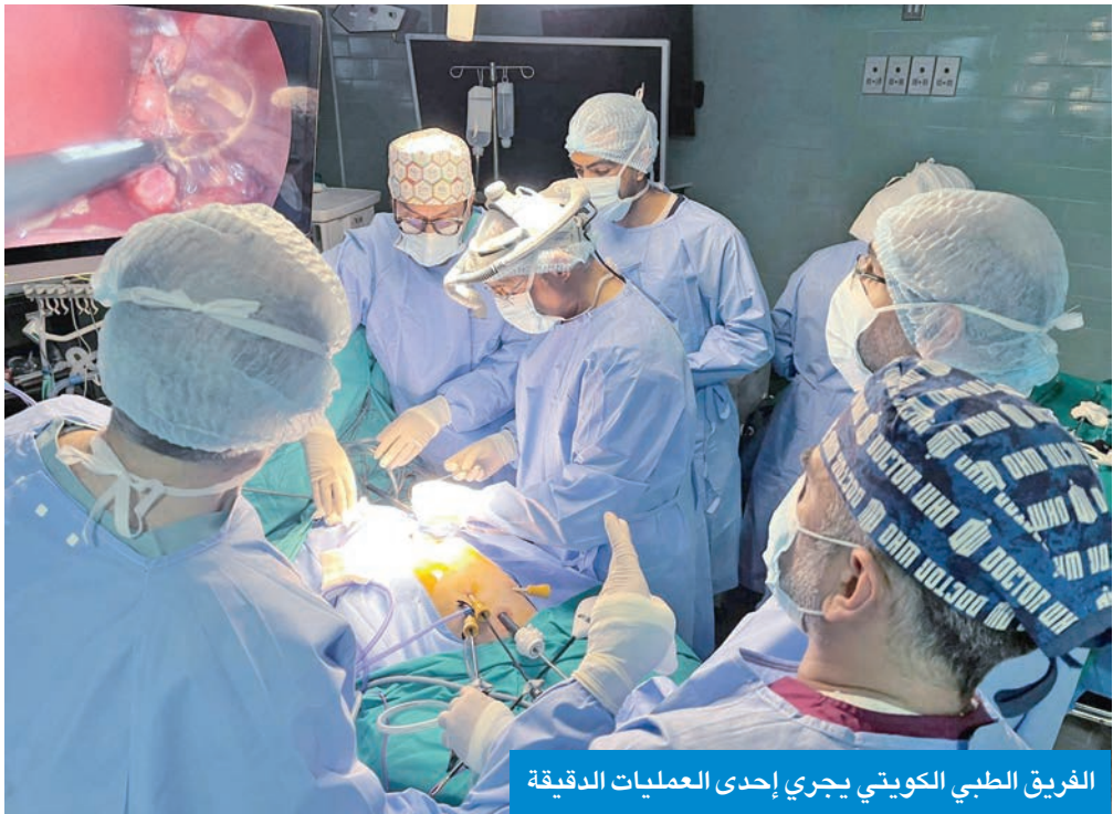
الفريق الطبي الكويتي يجري إحدى العمليات الدقيقة

الفريق المعالج وذوي المريض زرع الأمل والثقة، حيث تم إجراء العملية الجراحية بنجاح تام وكتب للمريض الشفاء دون الحاجة إلى استخدام العلاج الكيميائي والاكتفاء بالمراقبة في وحدة أورام الأطفال في مستشفى البند الوطني. ولفت إلى أن الفريق الطبي المشرف على حالات الأورام يعمل على دراسة كل حالة باهتمام شديد، مستنداً إلى أحدث الطرق العلمية للتشخيص الكامل وإعداد كل ما يلزم لبدء مرحلة العلاج من خلال البروتوكولات العالمية برعاية أطباء أكفاء يحملون شهادات من أرقى الجامعات العالمية يولون المرضى كامل اهتمامهم، حيث يدرسون أدق التفاصيل لكل مريض ويقومون بمراحل العلاج وتطور المرض مع وبعد كل مرحلة من مراحل التشخيص والعلاج.