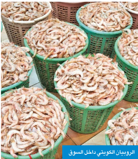
الروبيان الكويتي داخل السوق