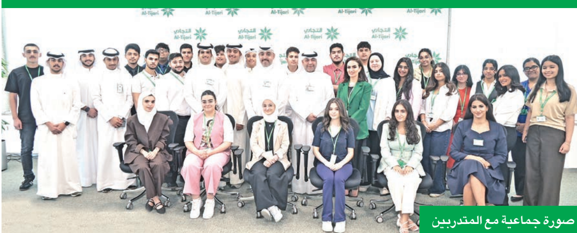
صورة جماعية مع المتدربين