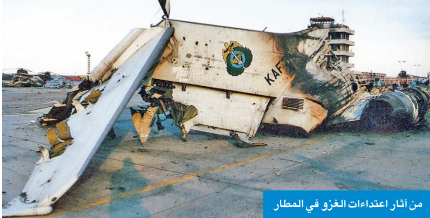
من آثار اعتداءات الغزو في المطار

وذكرت الإدارة، في بيان بمناسبة الذكرى الـ 35 للغزو الغاشم، «نستذكر بالهم وحزن تلك اللحظات العصيبة التي مرت بها بلادنا، ونستحضر ما تعرض له وطننا من اعتداء سافر على سيادته وأمنه واستقراره»، مضيفة أن «العاملين في الطيران المدني يبادرو بتوثيق الانتهاكات والجرائم التي طالت منشآت المطارات، والتي