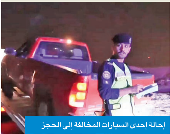
إحالة إحدى السيارات المخالفة إلى الحجز

المواقع التي تشهد كثافة في الحركة المرورية أو تكراراً للمخالفات الجسيمة. وأكدت عدم تهاونها في تطبيق القانون بحق كل من يعرض حياته وحياة الآخرين للخطر، داعية جميع قائدي المركبات إلى ضرورة الالتزام بقواعد المرور واللوائح المنظمة، وعدم التهاون في احترام الإشارات والعلامات التحذيرية. وأشارت إلى أن الهدف من هذه الحملات هو الوقاية أولاً، وتعزيز بيئة مرورية آمنة تسودها ثقافة احترام القانون والمسؤولية على الطريق.