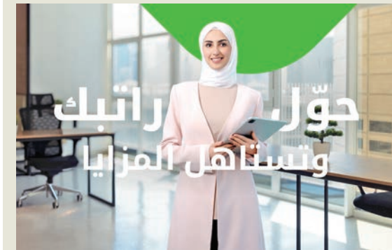
حول راتبك وتستاهل المزايا

حقوق تطلعات العملاء بأعلى معايير التميز والجودة