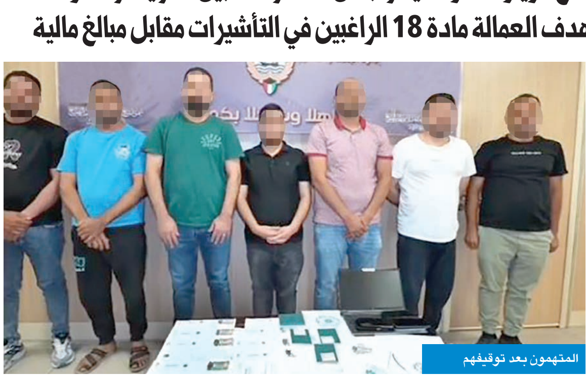
المتهمون بعد توقيفهم

أعلنت وزارة الداخلية أنها بناءً على تعليمات النائب الأول لرئيس مجلس الوزراء وزير الداخلية، الشيخ فهد اليوسف، كثفت الحملات الأمنية والمرورية على أنحاء البلاد كافة، لضبط المطلوبين والخارجين على القانون ومخالفي قانون المرور والإقامة. ونفذ قطاع المرور والعمليات، ممثلاً في الإدارة العامة للمرور والإدارة العامة لشرطة النجدة، بمشاركة قطاع شؤون الأمن الخاص، حملة أمنية مبرورية شاملة على الطرق الرئيسية والسريعة الخميس الماضي، أسفرت عن تحرير 934 مخالفة مرور متنوعة، وضبط 13 شخصاً مخالفاً لقانون الإقامة والعمل، و6 أشخاص لا يحملون إثباتاً نهائياً، و3 أحداث لقيادتهم مركبات من دون رخص. كما تم ضبط شخص بحالة غير طبيعية، وشخصين لحيازتهما مواد يشتبه بأنها مخدرة ومسكرة، وشخص مطلوب بتهمة التغييب، وإحالة شخص إلى الحجز التحفظي. وأكدت وزارة الداخلية استمرار الحملات الأمنية والمرورية على جميع أنحاء البلاد لضبط كل من تسول له نفسه مخالفة القوانين، داعية الجميع إلى التعاون مع رجال الأمن والإبلاغ عن أي تجاوزات ومخالفات للحفاظ على أمن وسلامة الجميع. وأعلنت وزارة الداخلية تنفيذها حملة مرور باستخدام أجهزة الرادار المتنقلة على طريق مدينة المطلاع السكنية، أسفرت عن تحرير 225 مخالفة مرور متنوعة، وضبط 8 مخالفين ومطلوبين.