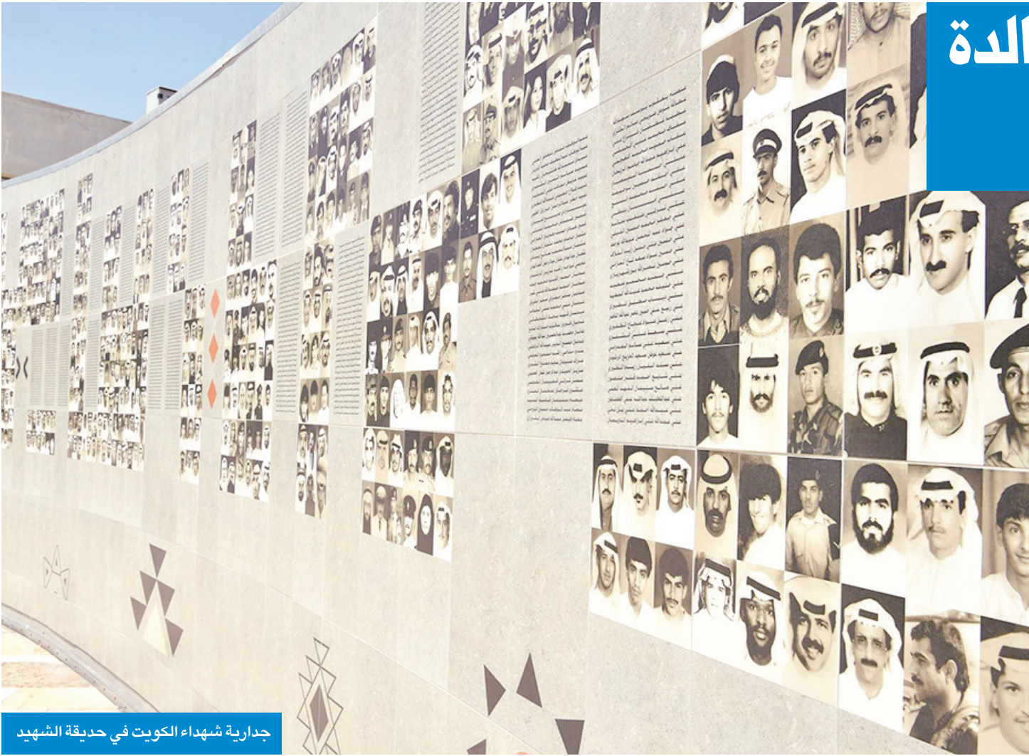
جدارية شهداء الكويت في حديقة الشهيد

و«متحف شهداء القرين»، وغيرها، فيماواصل الكويتيون اليوم السير على خطى شهدائهم محافظين على الوطن ورايته مستلهمين من تضحياتهم دروساً في الغداء والوحدة.