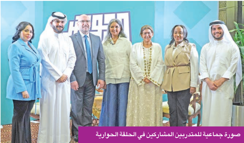
صورة جماعية للمتدربين المشاركين في الحلقة الحوارية