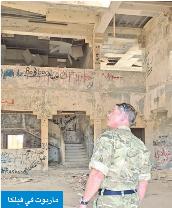
ماريوت في فيلكا

السلطات الكويتية لضمان نجاح العملية الانتخابية، متمناً تعاون الجهات المعنية في الدولة المضيفة في تسهيل إجراءات التصويت، وعبر عن «عظيم الشكر والتقدير لكل من وازرني الخارجية والداخلية بدولة الكويت على ما بذلناه من جهود مقدرة لتيسير عملية التصويت والانتخاب لأبناء