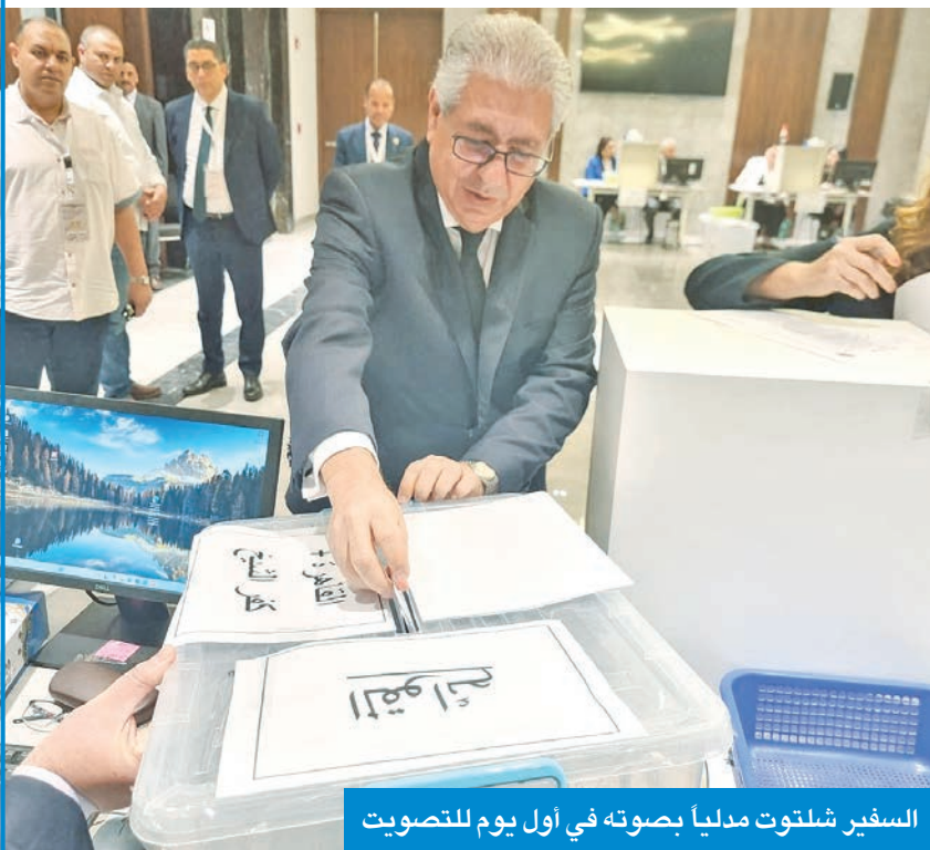
السفير شلتوت مدليا بصوته في أول يوم للتصويت

اختتمت في التاسعة من مساء أمس في الكويت عملية تصويت المصريين بالخارج في انتخابات مجلس الشيوخ 2025، والتي استمرت على مدى يومين داخل مقر السفارة المصرية، وسط إقبال لافت وكثيف من أبناء الجالية المصرية.