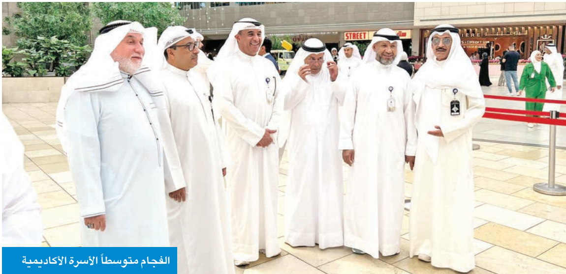
الفجام متوسطاً الأسرة الأكاديمية

2025 / 2026 مقتصرة على الكويتيين فقط، موضحاً أن التقديم سيكون من 5 حتى 18 الجاري. ولفت الدوخي إلى أنه تم استحداث بعض الآليات الجديدة في قبول هذا العام، إذ يتعيّن على جميع الطلبة المقبولين اعتماد قبولهم أولاً بعد إعلان النتائج، مؤكداً أنه سيتم إلغاء قبول كل من لم يعتمد قبوله مباشرة بعد انتهاء المدة المحددة، إذ ستكون عملية إلغاء القبول بعد اعتماده من قبل الطالب مقابل 20 ديناراً.