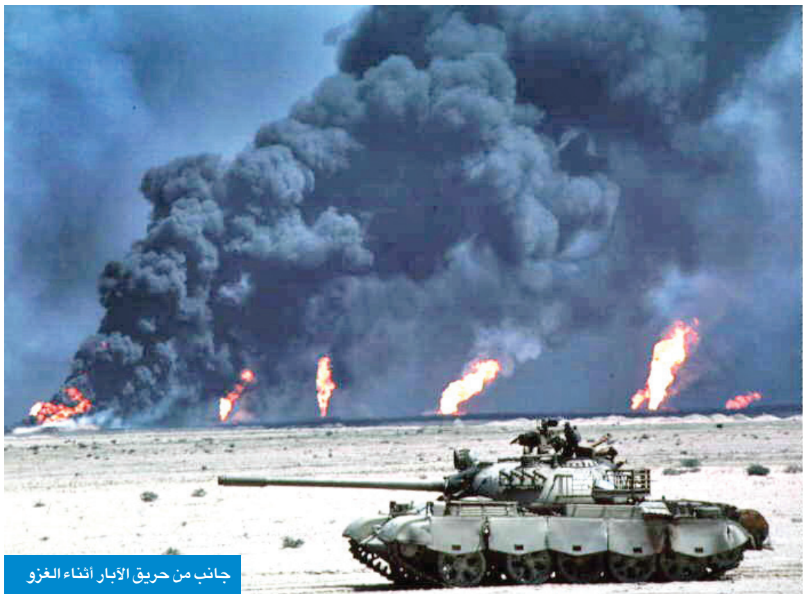
جانب من حريق الآبار أثناء الغزو