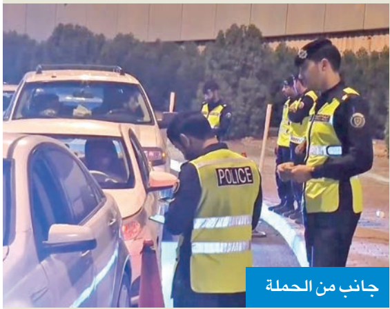
جانب من الحملة

225 مخالفة في حملة بالرادار المتقل على طريق المطلاع