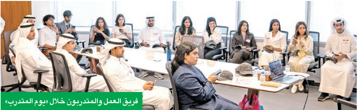
فريق العمل والمتدربون خلال «يوم المتدرب»

الوطني والاستثمار في رأس المال البشري، سواء بين الموظفين أو المتدربين، حيث تمثل النساء 43 في المئة من الموظفين، فيما تصل نسبة الكوادر الوطنية (الكويت) 70 في المئة من إجمالي فريق العمل. وأكدت التزام «إنفست جي بي» بتعزيز دورها الرائد بالقطاع الخاص في دعم وتطوير الكفاءات الوطنية، من خلال برامج التدريب والمبادرات المؤسسية الأخرى، وتواصل الشركة دعم النمو المستدام للاقتصاد الكويتي عبر تمكين الجيل القادم من المهنين.