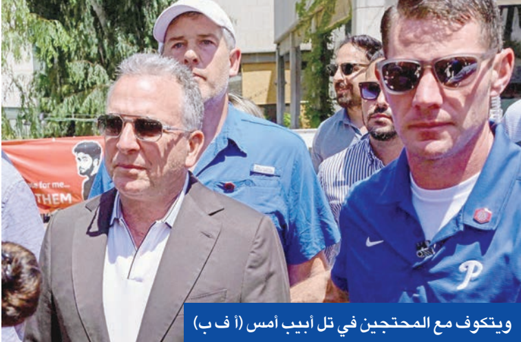
ويتكوف مع المحتجين في تل أبيب أمس

حرب الإبادة من أجل البقاء في السلطة. ميدانياً، تفاقت أزمة العطش بعد توقف جميع محطات تحلية المياه جنوب غزة، فيما أحصت السلطات الصحية مقتل 98 بينهم 26 من منتظري المساعدات خلال 24 ساعة.