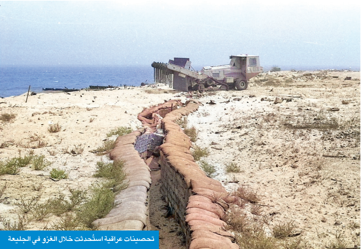
تحصينات عراقية استُحدثت خلال الغزو في الجليعة