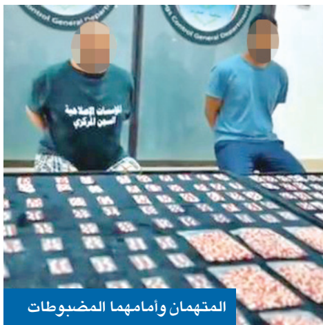
المتهمان وامامهما المضبوطات

وجهت إدارة مكافحة المخدرات بوزارة الداخلية ضربة قوية لعصابات تهريب المخدرات، بتمكنها من ضبط أكبر تشكيل عصابي إجرامي دولي متخصص في جلب وترويج المؤثرات العقلية من نوع «ليريك» داخل البلاد، إذ قدرت كمية المضبوطات بنحو 800 ألف كبسولة، إضافة إلى كمية من بودرة «ليريك» تُقدر قيمتها السوقية بمبالغ مالية طائلة. وأعلنت «الداخلية»، في بيان أمس، أن التحريات كشفت أن المتهم الرئيسي في القضية هو مواطن نزيل في السجن المركزي، وهو من الأسماء المرتبطة بقضايا الاتجار بالمخدرات، وصادر بحقه عدد من الأحكام القضائية. وأوضحت الوزارة أنه نتيجة لرصد تحركات أحد معاوني المتهم خارج السجن، وهو من المقيمين بصورة غير قانونية، تبين أنه باع كمية من المؤثرات العقلية لمصدر سري، مشيرة إلى أنه بمواصلة التحريات تم 02