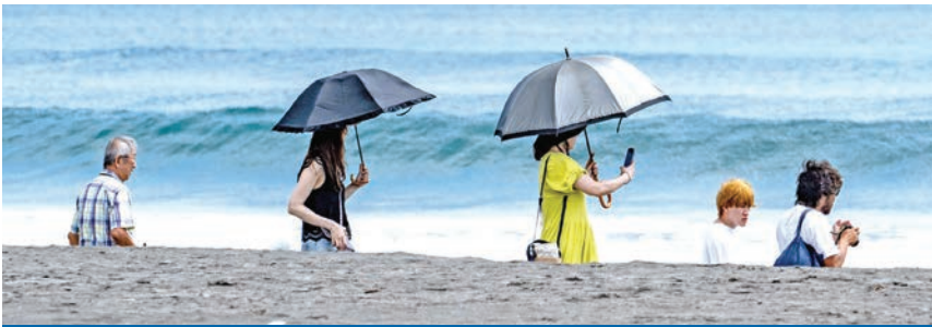
شاطئ هيساورا بمحافظة تشيبا اليابانية بعد رفع تحذير «تسونامي» أمس (أ ف ب)

عاد ملايين من سكان سواحل المحيط الهادئ، من اليابان إلى الإكوادور، إلى ديارهم أمس، بعدما تسبب الزلزال الذي ضرب أقصى شرق روسيا أمس الأول، والذي يُعد من بين الأشد على الإطلاق، في إنذارات بوقوع تسونامي. وأفادت هيئة المسح الجيولوجي الأميركية، وفقاً للخبر الذي نشرته «رويترز»، بأن زلزالاً بقوة 8.8 درجات وقع عند الساعة 11:24 صباحاً بالتوقيت المحلي أمس الأول (23:24 ت.غ)، على عمق 20.7 كيلومتراً، وعلى بُعد 126 كيلومتراً قبالة ساحل بتروبولوفسك - كامتشاتسكي، عاصمة شبه جزيرة كامتشاتكا الروسية. وضربت المنطقة بعد ذلك 6 هزّات ارتدادية على الأقل، إحداها بلغت قوتها 6.9 درجات. وفي اليابان، رفعت هيئة الأرصاد الجوية أمس الإنذار من «تسونامي». وكانت الصين أصدرت أيضاً تحذيراً من احتمال وقوع تسونامي في العديد من المناطق الساحلية. من جانبها، حثّت الفلبين السكان المقيمين على الساحل الشرقي على الانتقال إلى الداخل. وأمرت السلطات في بالاو، الواقعة على بُعد نحو 800 كيلومتر شرقاً، السكان بمغادرة «جميع المناطق على طول الساحل». على الجانب الآخر من المحيط الهادئ، حذرت المكسيك أيضاً من احتمال وقوع