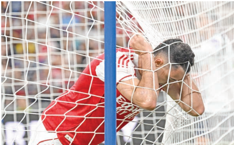
غابرييل مار تينجلي لاعب أرسنال يُبدي أسفه بعد إهداره فرصة محققة (أ ف ب)

وبهذا الفوز، يستعد توتنهام لمواصلة جولته الآسيوية بملاقاة نيوكاسل يونايتد في كوريا الجنوبية، في حين يختم أرسنال رحلته بعد ثلاث مباريات خاضها في سنغافورة وهونغ كونغ. (أ ف ب)