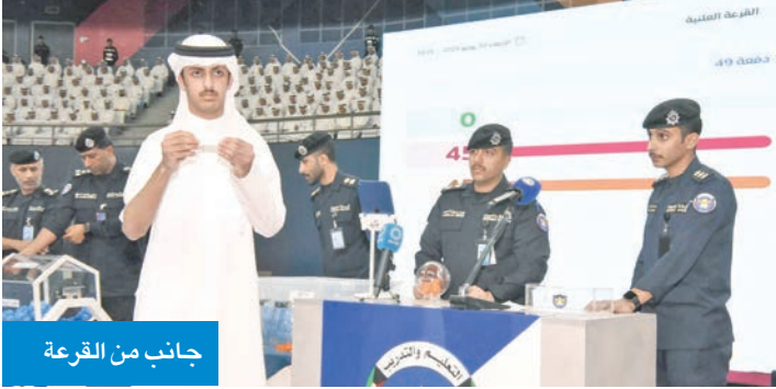
جانب من القرعة

يذكر أن جميع المرشحين سيخضعون لفحوصات طبية متقدمة كمرحلة نهائية للقبول، حرصاً على استيفاء جميع المتطلبات والمعايير المحددة.