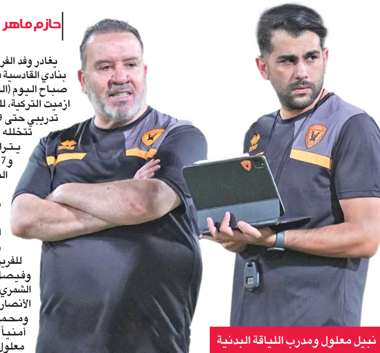
جانب من تدريبات الأصفر قبل السفر