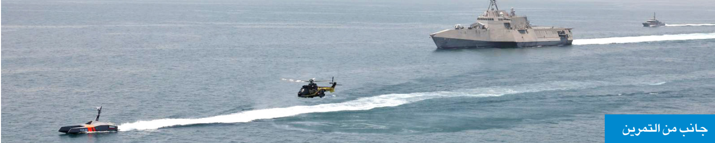
جانب من التمرين

المعيد الركن البحري، المعبد الشيخ مبارك الصباح، ومدير الإدارة العامة لطيران الشرطة، المعبد سالم الشهاب، وقيادات القوة البحرية الأميركية. وشهد التمرين مشاركة زورق تابع لطيران الشرطة، ووزارة الدفاع ممثلة بالقوة البحرية الكويتية، وبحضور أمر القوة البحرية، اللواء سيف الهملان، ومدير الإدارة العامة لخفر السواحل،