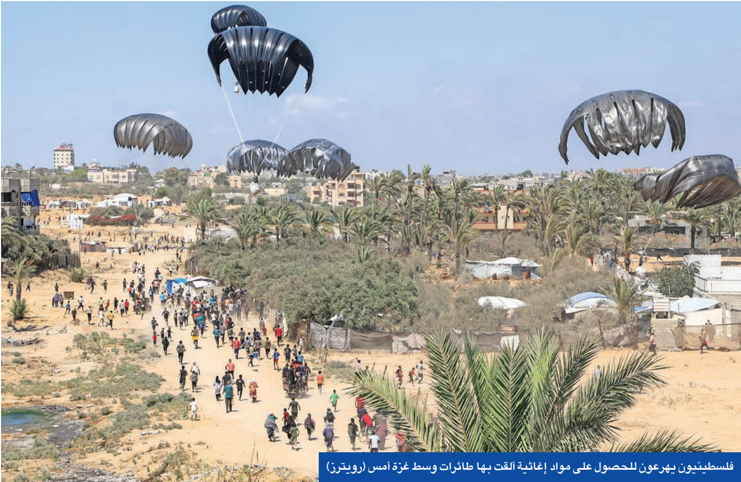
فلسطينيون يهرعون للحصول على مواد إغاثية ألقت بها طائرات وسط غزة امس (رويترز)

وتطبيق السيادة على المنطقة المحتلة. وفي حين ذكرت وزارة الصحة الفلسطينية أن إجمالي عدد ضحايا المجاعة وسوء التغذية في القطاع ارتفع إلى 159 شخصاً، بينهم 90 طفلاً، زعمت ميليشيا «باسر أبو شبيب»، المدعومة من قبل جيش الاحتلال، أنها أجلت عشرات الفلسطينيين من مناطق عدة في غزة إلى مناطق سيطرتها شرق مدينة رفح، أقصى جنوب القطاع. وقالت «أبو شبيب»، في فيديو، «بدا اليوم التالي لحماس بغزة الجديدة».