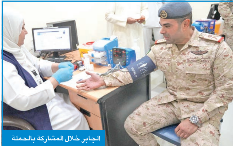
الجابر خلال المشاركة بالحملة

من جهتها، قالت مديرية إدارة خدمات نقل الدم بوزارة