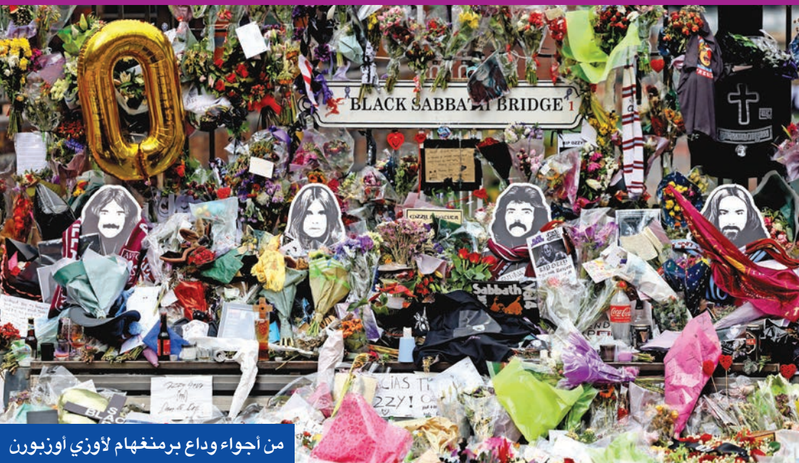
من أجواء وداع برمنغهام لأوزي أوزبورن

وسط هتافات «شكراً أوزي»، استقبل الآلاف بتأثر موكب جنازة أسطورة موسيقى الهيفي ميتال ومغني فرقة «بلاك سابات» (Black Sabbath) أوزي أوزبورن في مسقطه مدينة برمنغهام الإنكليزية، قبل مراسم دفن خاصة له.