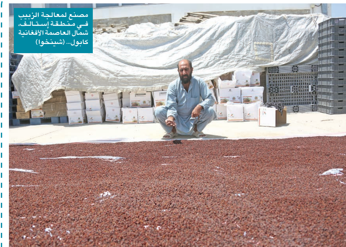
مصنع لمعالجة الزبيب في منطقة إستاتلف، شمال العاصمة الأفغانية كابول...