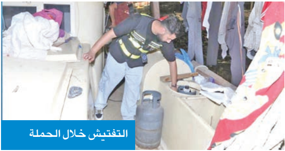
التفتيش خلال الحملة

إلى تثقيف وتوعية منتسبي الشركة عن مخاطر الحريق والحوادث، وأسبابها، وسُبل الوقاية منها. واشتملت المحاضرة على شرح نظري لكيفية الإخلاء في حالات الطوارئ، وطريقة استخدام مطفاة الحريق، وأهمية كاشف الدخان، والحمل الزائد، والنماس الكهربائي، وتسرب الغاز، وكيفية استخدام بطانية الحريق.