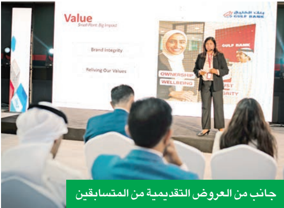
جانب من العروض التقديمية من المتسابقين

واستقبلت اللجنة المنظمة العديد من الأفكار المبتكرة التي تجمع بين التحول الرقمي والإبداع لتعزيز التصميم الداخلي لفرع بنك الخليج التي تصب جميعاً في اتجاه تحسين تجربة العملاء، حيث تمت تصفية الأفكار وترتيبها وتدريب المتسابقين لتقديم أفكارهم أمام لجنة التحكيم. ويعتبر بنك الخليج هذه المسابقة منصة لتشجيع موظفيه في مختلف الإدارات على المشاركة الفعالة في تطوير تجربة العملاء، تحت شعار «الابتكار للجميع»، وتهدف إلى تحفيز جميع الموظفين من مختلف الإدارات والأقسام على الابتكار وتقديم أفكار جديدة، يمكن أن تحدث تأثيراً إيجابياً وقيماً للبنك وللصناعة المصرفية على حد سواء.