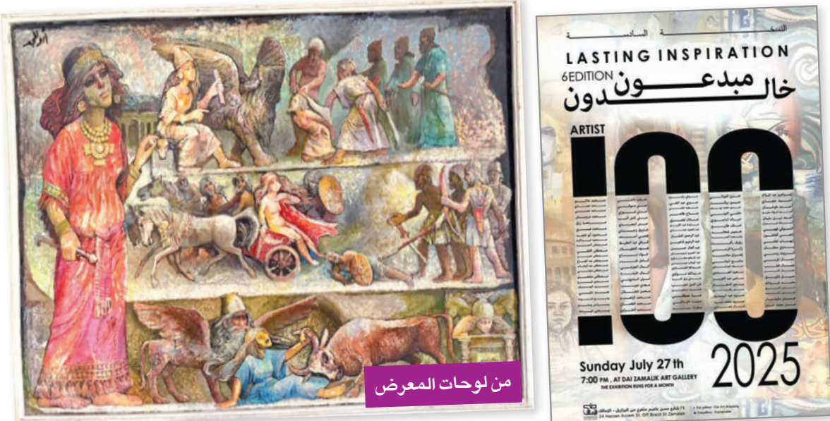
من لوحات المعرض