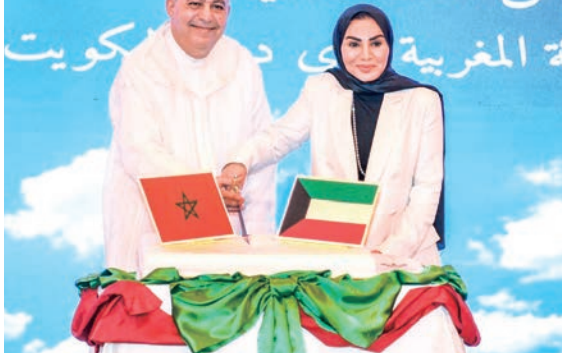
الحويلة وبين عيسى يقطعان قالب الحلوى بمناسبة الذكرى 26 لعيد العرش

جذب السياح، مشيرا إلى أن العام الماضي كان عاما قياسيّا باستقبال 17.5 مليون زائر، من بينهم أكثر من 23 ألفا من الكويت، وهو رقم يتجاوز الرقم القياسي