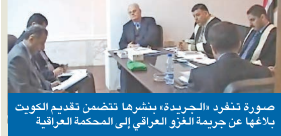
صورة تنفرد «الجريدة» بنشرها تتضمن تقديم الكويت بلاغها عن جريمة الغزو العراقي إلى المحكمة العراقية