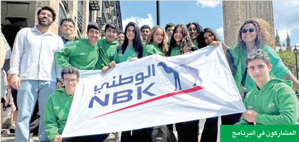
المشاركون في البرنامج

خلال هذه الرحلة المكثفة، انخرط المشاركون في مجموعة متنوعة من الأنشطة الخارجية، بما في ذلك التزحزح سيرا على الأقدام عبر الحقول الخضراء، واستكشاف القرى الساحرة، إضافة إلى بناء العلاقات من خلال المسابقات الودية. كما ركّز البرنامج على تطوير مهارات القيادة العملية، مستندا إلى كتاب ستيفن ر. كوفي الشهير عالمياً «العادات السبع للأشخاص الأكثر فعالية»، حيث اكتسب الطلاب أدوات قيمة لإدارة أفكارهم وأفعالهم ومشاعرهم، ما يمكنهم من القيادة بفعالية وبنية مستقبل. تأتي رعاية «الوطني» لبرنامج القيادة الشابة في إطار الشراكة الاستراتيجية مع «لويك»، حيث يلتزم البنك بتمكين الشباب الكويتيين، ومساعدتهم في تحقيق أهدافهم