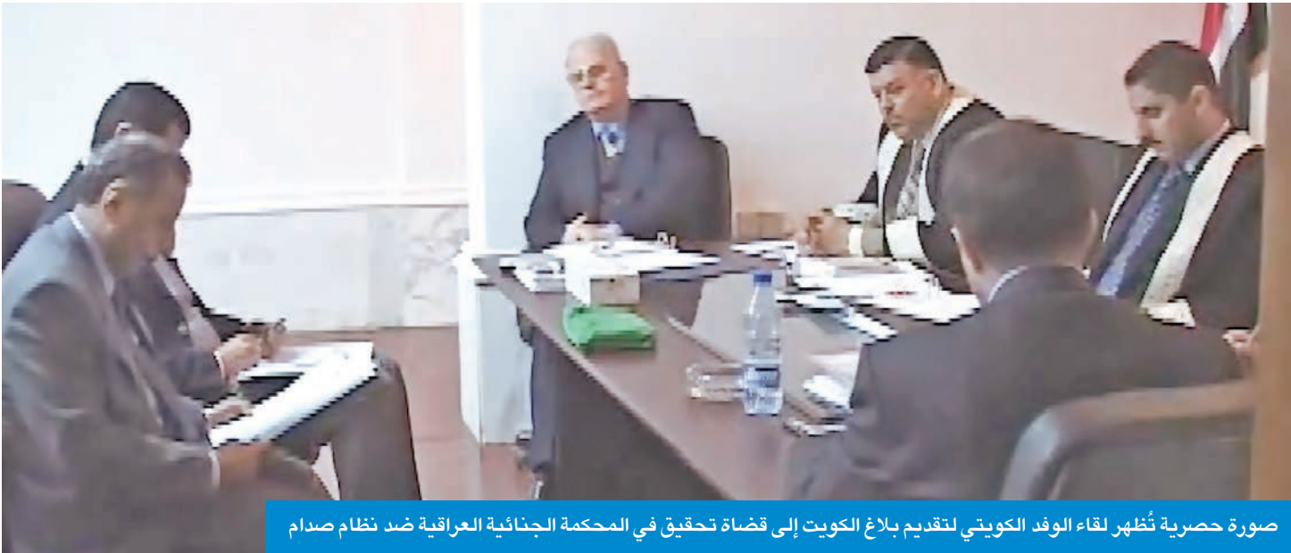
صورة حصرية تُظهر لقاء الوفد الكويتي لتقديم بلاغ الكويت إلى قضاة تحقيق في المحكمة الجنائية العراقية ضد نظام صدام

القضاة العراقيين في الولايات المتحدة وفي عدد من الدول الأخرى كابيطاليا وبريطانيا على المحاكمة الجنائية العراقية، وتمت إقامة المحكمة في مقر حزب البعث، حيث حوكم صدام وشركاؤه الذين عندما كان يدخل القاعة يقفون لحتيته، وكانوا يعاملونه كرئيس!