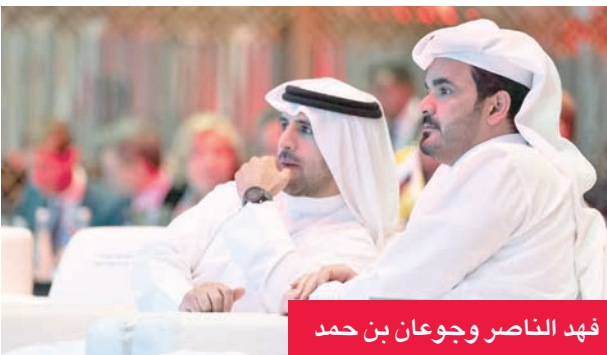
فهد الناصر وجوعان بن حمد

أعلنت اللجنة الأولمبية الكويتية ترشيحها ودعمها الكامل لرئيس اللجنة الأولمبية القطرية الشيخ جوعان بن حمد آل ثاني، لتولي رئاسة المجلس الأولمبي الآسيوي.