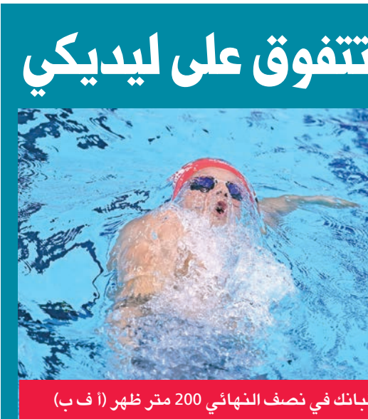
البريطاني غرينباتك في نصف النهائي 200 متر ظهر (أ ف ب)

وكان «أزرق السلة» خسر أمام منافسه الجزائري بنتيجة 74 - 86، أمس الأول، ضمن الجولة الخامسة من البطولة التي شهدت فوز قطر على الإمارات 78 - 71، وتونس على مصر 85 - 73. وبذلك احتل الأزرق المركز الأخير برصيد 4 نقاط من 4 هزائم أمام الإمارات، ومصر، وتونس، وأخيراً الجزائر. ويسعى الأزرق اليوم إلى تحقيق انتصاره الأول والوحيد في البطولة على حساب نظيره القطري، طمعا في الهروب من المركز الأخير في الترتيب العام للبطولة.