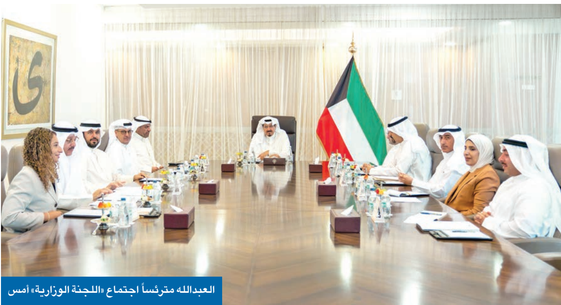
العبدالله مقررماً اجتماع «اللجنة الوزارية» أمس