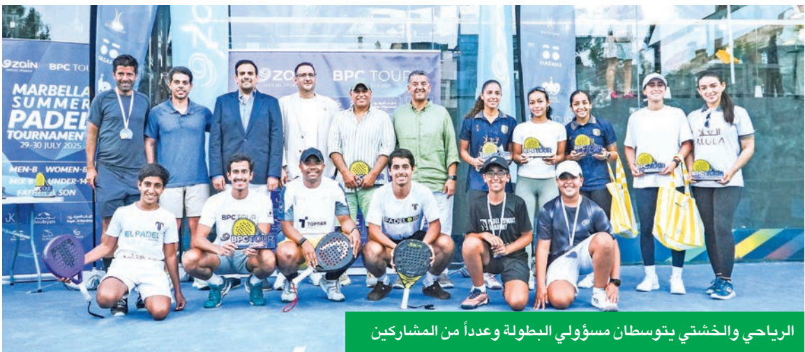
الرياحي والخشتي يتوسطان مسؤولي البطولة وعدداً من المشاركين

وتعكس رعاية «زين» المتواصلة لهذا الحدث الرياضي المتميز التزامها بدعم الرياضات الصاعدة مثل البادل، والتي أصبحت تحظى بشعبية كبيرة بين فئة الشباب في الكويت والمنطقة، وتحرص «زين» على أن تكون جزءاً من المبادرات التي تمكن الرياضيين من استعراض مواهبهم، وتمنحهم الفرصة للتألق في الساحات الدولية. وتأتي هذه الرعاية استمراراً لدعم «زين» المتواصل لرياضة البادل، والتي باتت من أكثر الرياضات رواجاً بين فئة الشباب في الكويت والمنطقة، حيث حرصت الشركة خلال السنوات الماضية على دعم بطولات محلية وإقليمية كبرى، وتنظيم فعاليات داخلية لموظفيها بهدف ترسيخ ثقافة النشاط البدني والتشجيع على أسلوب حياة صحي، وتؤمن «زين» بأن رياضة