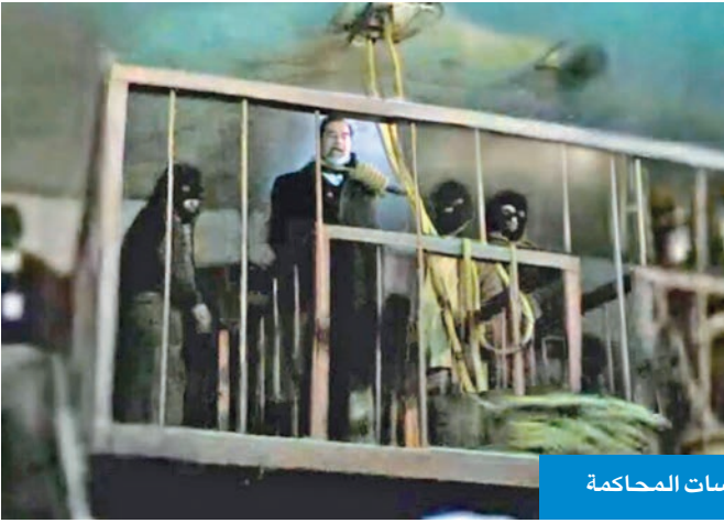
... ولقطات أخرى من جلسات المحاكمة