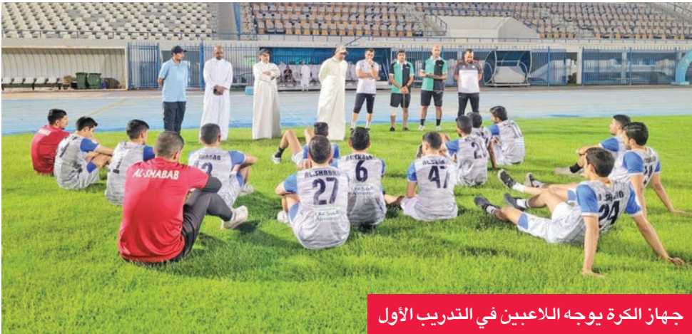
جهاز الكرة يوجه اللاعبين في التدريب الأول

يواصل الفريق الأول لكرة القدم بنادي الشباب تدريباته اليومية على استاد الشباب والملعب الفرعي، استعداداً لخوض منافسات الموسم المقبل 2025-2026، تحت قيادة المدرب المونتينيغري سلافيفو. وكان الشباب قد نجح في التأهل لدوري زين الممتاز، بعد أن حل وصيفاً في الموسم الماضي لدوري الدرجة الأولى، خلفاً للجهراء، وعاد الفريقان معاً بعد هبوطهما في الموسم الرياضي 2023-2024. إلى ذلك، تقرر أن يدخل الشباب معسكراً تدريبياً في العاصمة المصرية القاهرة خلال الفترة من 20 الجاري حتى 4 سبتمبر المقبل استعداداً للموسم المقبل، على أن تتخلله 3 مباريات تدريبية متدرجة المستوى، وأن يتم تحديد أطراف هذه المباريات لاحقاً.