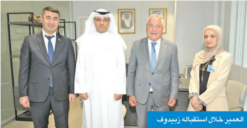
العمير خلال استقباله زبيدوف

للارتقاء بالجانب المعرفي والأكاديمي بين البلدين. ولفت إلى أنه «تم بحث أوجه التبادل الطلابي بين الطرفين التي تربطها معهم مذكرات تفاهم مشترك لصقل المواهب الطلابية، والتعرف على آخر التطورات العلمية والأكاديمية». في السياق ذاته، أكد زبيدوف، حرص بلاده على توسيع أطر التعاون المتبادل والمشارك بينهما، وذلك يتم من خلال البرامج العلمية المشتركة، وحصول طلبة طاجيكستان على مزيد من البعثات للارتقاء بالجانب الأكاديمي والبحثي.