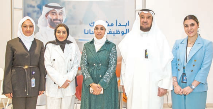
وزيرة الشؤون الاجتماعية د. أمثال الحويلة تتوسط ممثلي «برقان» أثناء المعرض الوظيفي «شركاء لتوظيفهم»