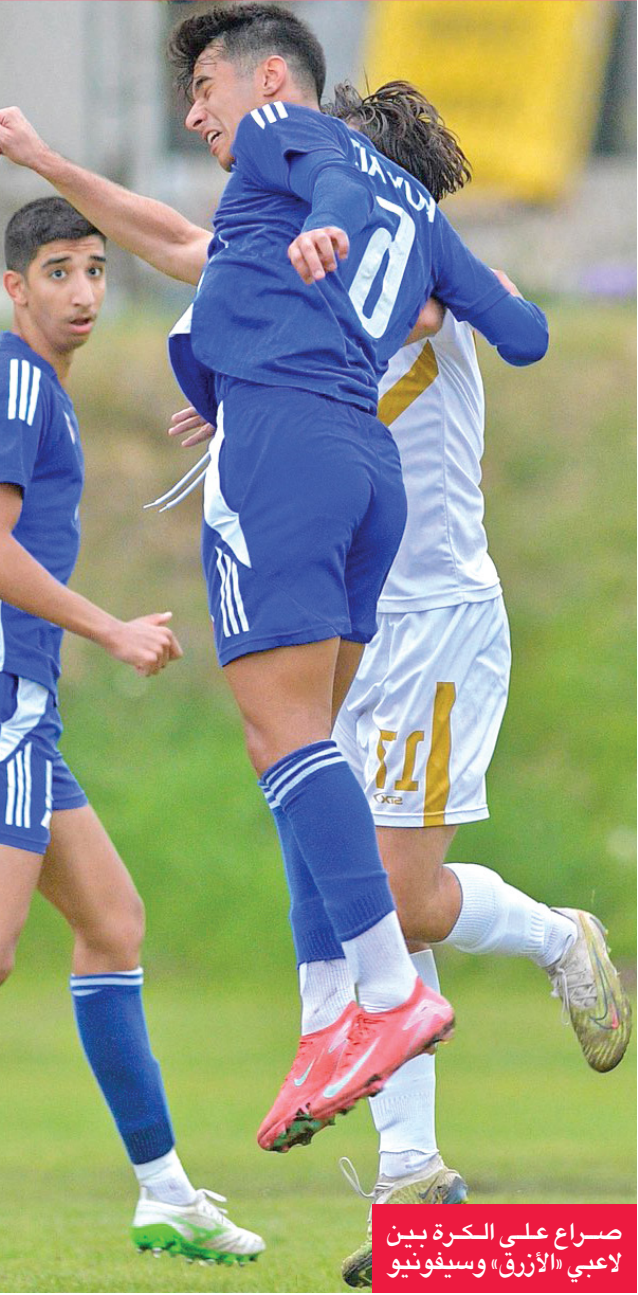
صراع على الكرة بين لاعبي «الأزرق» وسيفونيو