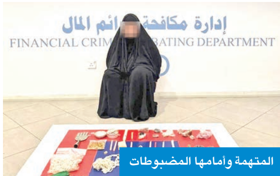
المتهمه وأمامها المضبوطات

والدجل، مستغلة حاجة البعض إلى حل مشكلاتهم الشخصية والعائلية والمالية، مقابل مبالغ مالية. وبعد التأكد من صحة المعلومات من خلال المتابعة والرصد، تم استصدار الإذن القانوني من جهة التحقيق المختصة، ونصب كمين محكم أسفر عن ضبط المتهمة متلبسة في منطقة العدان، وحبوزتها طلاس ومعدات تستخدم في أعمال الشعوذة، من بينها أوراق مكتوبة، أعشاب، دهون، أحجية مغلفة،