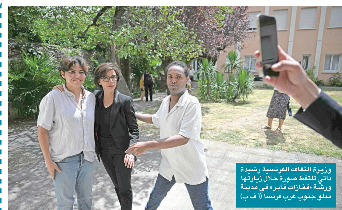
وزيرة الثقافة الفرنسية رشيدة داني تلتقط صورة خلال زيارتها ورشة «قافازات فاير» في مدينة ميلو جنوب غرب فرنسا

فيما يتعلق بالانتفاع من أراضي الدولة. قامت قائمة أصحاب الشاليهات، تراجعت الحكومة عن قرارها من بعد. وهذا لا يعنيني صحة القرار وأثره البتة، بل طريقة صناعة ودراسة واتخاذ القرارات في الدولة التي وإن وجب بات من المهم صنعاتها بمهنية واحترافية كبرى، وهي ليست المرة الأولى التي تتخذ حكومة كويتية قراراً ومن ثم تتراجع عنه.