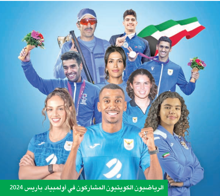
الرياضيون الكويتيون المشاركون في أولمبياد باريس 2024