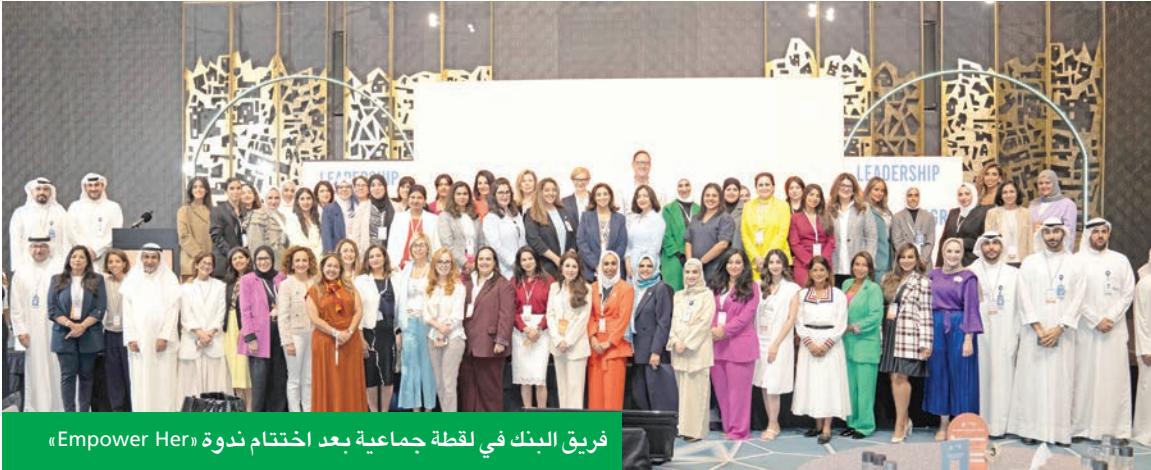
فريق البنك في لقطة جماعية بعد اختتام ندوة (Empower Her)