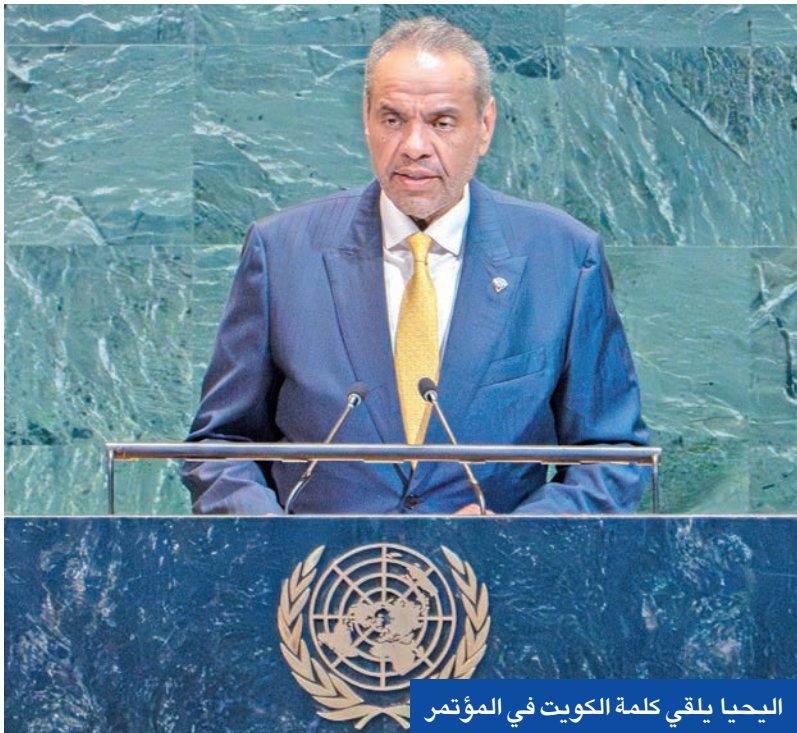
اليحيا يلقي كلمة الكويت في المؤتمر

في كلمته أمام المؤتمر الدولي رفيع المستوى لتسوية قضية فلسطين بالوسائل السلمية، وتنفيذ حل الدولتين بمقر الأمم المتحدة في نيويورك أمس، أطلق وزير الخارجية عبدالله اليحيا للتحرك الفوري لنجدة أهالي غزة الذين يعيشون مأساة غير مسبوقة، مؤكداً أن العالم «أمام مشهد إنساني مفرج لا يقبله ضمير حي، حيث يقتل الأبرياء على أبواب المستشفيات وتجف الملاحي وتحرم غزة من الماء والغذاء والدواء... فهل من معيذ؟ وهل من نصير لأهل غزة؟». ودعا اليحيا إلى دعم الجهود السياسية والدبلوماسية كافة، لإحياء عملية السلام وفق قرارات الشرعية الدولية ومبادرة السلام العربية لعام 2002، ورفض كل السياسات التي تؤخر تحقيق حل الدولتين. وأكد أن السلام العادل والشامل لا يمكن أن يتحقق من دون إنهاء الاحتلال الإسرائيلي وتمكين الشعب الفلسطيني من نيل حقوقه المشروعة كافة، معتبراً أن الصمت على الجرائم المرتكبة في غزة يمثل تواطؤاً مع الجلاء ضد الضحية. وأضاف: «إننا نجتمع تحت وطأة ظروف استثنائية ومأساوية تمر بها الأراضي الفلسطينية، وتحديدًا في القطاع الذي يتعرض لعدوان عسكري إسرائيلي غير مسبوق خلف عشرات الآلاف من الشهداء، أغليبتهم من النساء والأطفال، ودماراً واسعاً شمل البنية التحتية والمستشفيات والمدارس ومرافق المياه والكهرباء وحتى الملاحي». وشدد على أن الحصار الجائر المفروض على غزة وقطع الغذاء والدواء والكهرباء والمياه نتج عنهما كارثة إنسانية تهدد حياة أكثر من مليوني إنسان معظمهم من المدنيين الأبرياء،