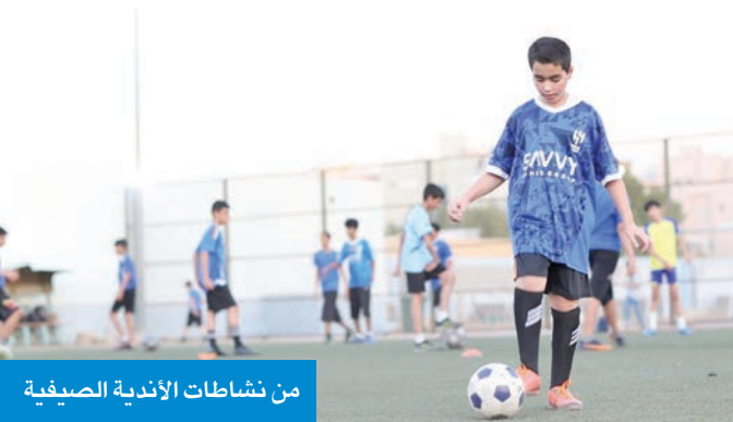
من نشاطات الأندية الصيفية