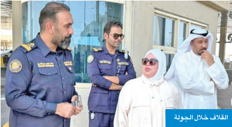
القلاف خلال الجولة

وفي ختام جولتها، وجّهت الشكر لموظفي الجمارك في منفذ النويصيب، مشددة على أن إدارة الجمارك ستواصل دعمها الدائم لهم، والعمل على تذليل كل العقبات التي تواجههم، تحقيقاً لأعلى درجات الانضباط والكفاءة في حماية أمن البلاد.