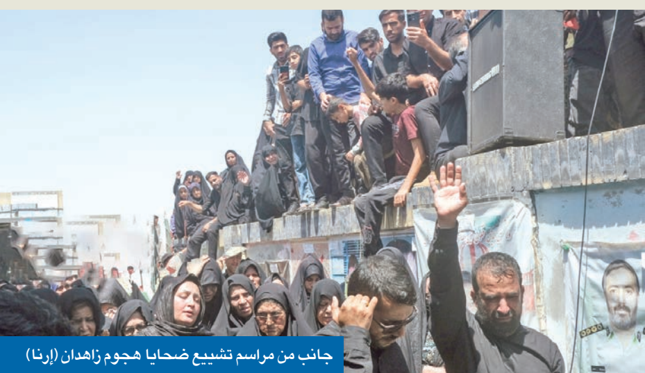
جانب من مراسم تشييع ضحايا هجوم زاهدان

قاني تضمن ضرورة تشكيل فريق متخصص بالحرب الإلكترونية، لمواجهة «الهجوم السيبراني المتقدم» الذي تشنه إسرائيل والولايات المتحدة ضد إيران. وأبيح، وفق المصدر، على تقنيات لمحو الإشارات الإلكترونية، حيث تعتمد تل الذكاء الاصطناعي في تنفيذ عمليات الإغتيال، بما في ذلك استهداف قادة وشخصيات المقاومة والعلماء الإيرانيين. ويّين أن المرشد أصدر أمراً بتشكيل فرق عمل مختصة لمواجهة هذه الحرب الإلكترونية، مع تخصيص الميزانية المطلوبة لها، مشدداً على ضرورة أن تكون تلك الفرق منتشرة عالمياً،