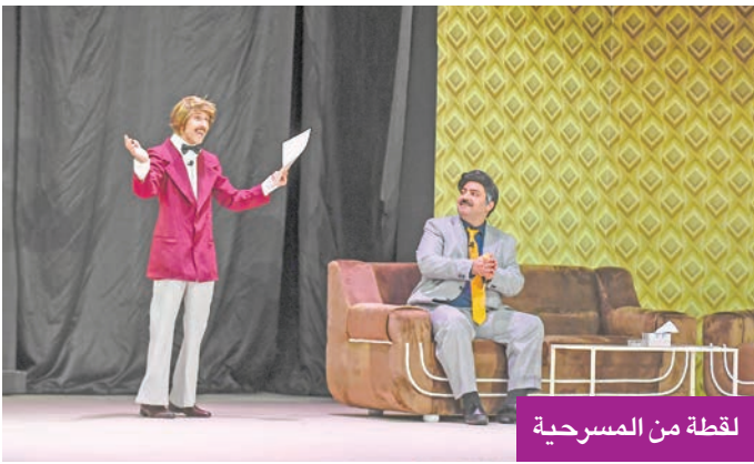
لقطة من المسرحية

الجمهور إلى أجواء الثمانينيات، لكن بإيقاع وزمن 2025.