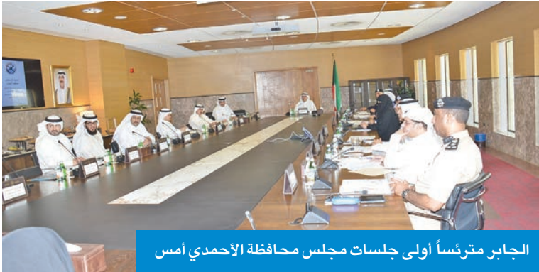
الجابر مترئساً أولى جلسات مجلس محافظة الأحمدى أمس

ترأس أولى جلساته بحضور ممثلي الجهات الحكومية وقرر تشكيل لجانة