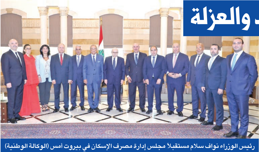
رئيس الوزراء نواف سلام مستقبلاً مجلس إدارة مصرف الإسكان في بيروت أمس

العسكرية، وهناك اتجاه ثالث ينظر إلى أن النتيجة ستكون بفقدان الاهتمام الدولي بلبنان، ومنع تقديم أي دعم أو مساعدات له، فيبقى منعزلاً ومنطوياً على نفسه، ويواجه أزماته بلا أي مساعدة خارجية.