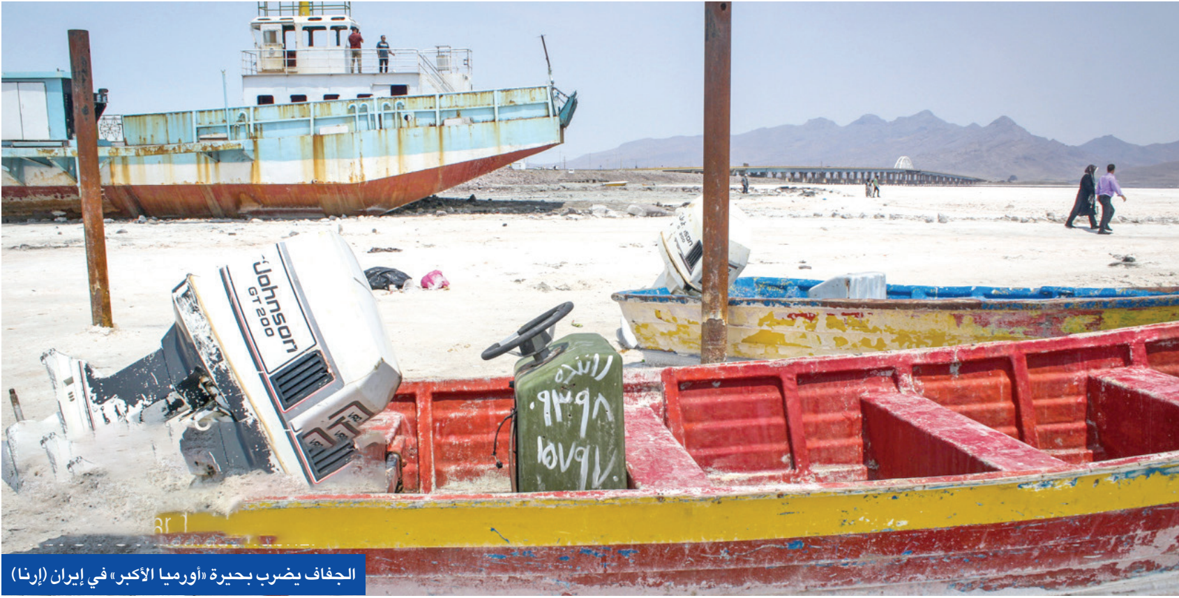
الجفاف يضرب بحيرة «أورميا الأكبر» في إيران (إرنا)

قسري لمدة أسبوع، على الهيئات والجامعات والمدارس في طهران. وقالت المتحدثة باسم الحكومة، فاطمة مهاجراني، أمس الاثنين، إن «وضع المياه في طهران سيئ جداً، لذلك فإننا ندرس إغلاق العاصمة لمدة أسبوع».