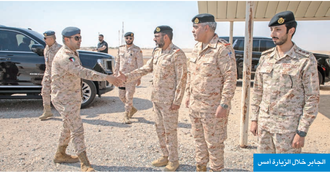
الجابر خلال الزيارة أمس

وفي مستهل الزيارة استمع الجابر لإيجاز قدمه أمر قيادة الإسناد الإداري حول الميدان وما يحتويه من مرافق ومنشآت تشتمل على ميادين تدريبية متخصصة، وموقع للرماية، وبرج للمراقبة، إلى جانب منشآت دعم لوجستي وفني. وفي ختام الزيارة، أشاد نائب رئيس الأركان بالمستوى المتطور الذي بلغه الميدان متعدد الأغراض، مؤكداً أنه يُعدّ نموذجاً للمرافق التدريبية المتكاملة التي تُسهم بشكل مباشر في تعزيز كفاءة وحدات الجيش، ورفع مستوى الجاهزية القتالية. وأوضح أن وجود مثل هذه الميادين المتخصصة يشكل ركيزة أساسية في إعداد وتأهيل منتسبي الجيش لمواجهة مختلف السيناريوهات الميدانية، مشيراً إلى أن التطوير المستمر للمرافق التدريبية يعكس حرص القيادة على توفير بيئة