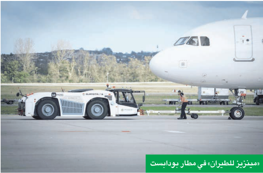
«مينيز للطيران» في مطار بودابست

ستحول «إيربورت سيرفيس بودابست» عملياتها في مجال خدمات المناولة الأرضية والشحن إلى «مينيز للطيران» مقابل استحوادها على حصة أقلية في «مينيز للطيران المجرية» و«مينيز للشحن الجوي».