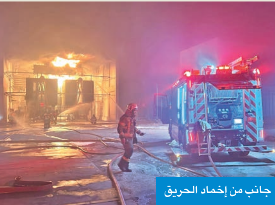
جانب من إخماد الحريق