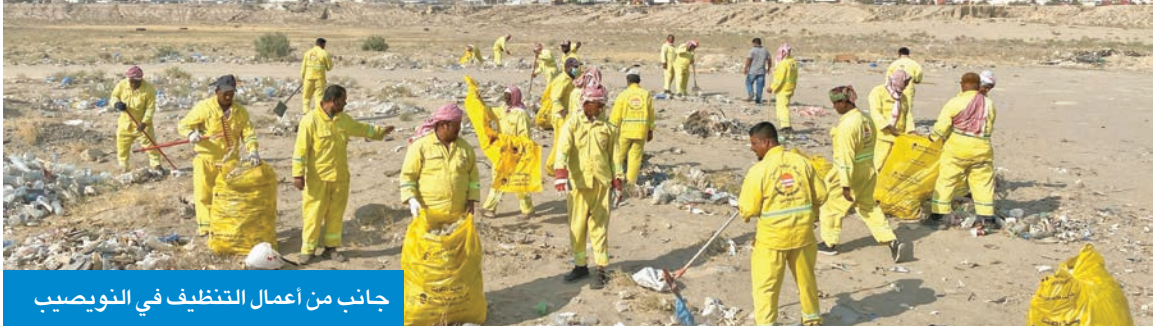
جانب من اعمال التنظيف في النويصيب

وأكدت البلدية، في بيان أمس، أن فرق النظافة قامت بالتعامل الفوري بهذا الخصوص، من خلال تكثيف أعمال النظافة، التي شملت الكس البدوي وتجميع النفايات في أكياس ورفعها وتنظيف تلك الأماكن،