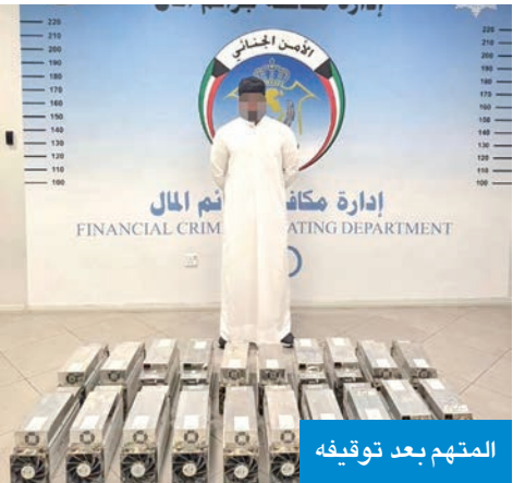
المتهم بعد توقيفه

أعلنت وزارة الداخلية، أمس، ضبط مواطن لقيامه بمزاولة نشاط تعدين العملات المشفرة داخل منزل مستأجر في مدينة صباح الأحمد السكنية، «وهو نشاط محظور قانوناً لما يسببه من استنزاف مفرط للطاقة الكهربائية والضغط على الشبكة العامة، بما يؤثر على استقرارها».