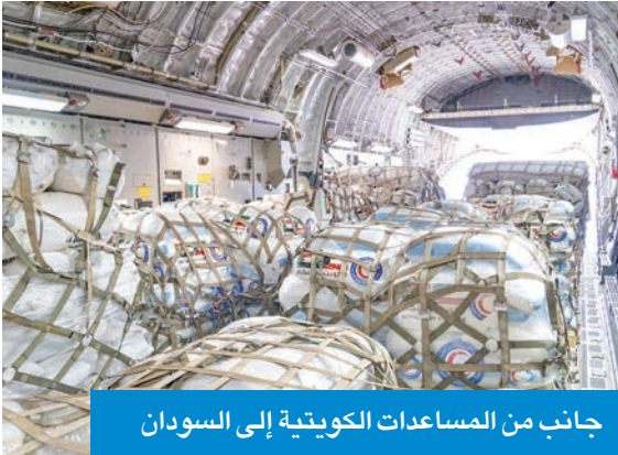
جانب من المساعدات الكويتية إلى السودان

● السفير السوداني لـ الجريدة: الكويت نموذج يُحتذى في التضامن العربي