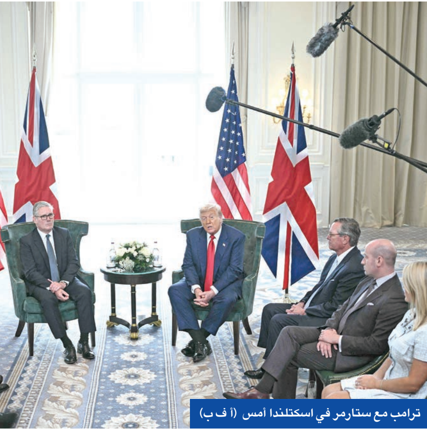
ترامب مع ستارمر في إسكتلندا أمس

وقصص الرئيس الأمريكي، أمس، مهلته لنظيره الروسي لوقف حرب أوكرانيا قائلاً: «سأحشد مهلة نهائية جديدة تبلغ نحو 10 أيام أو 12 يوماً اعتباراً