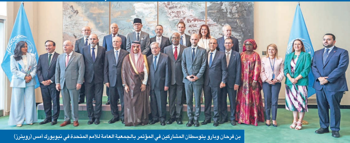
بن فرحان وبارو يتوسطان المشاركين في المؤتمر بالجمعية العامة للأمم المتحدة في نيويورك أمس

التزاماً بموقفها التاريخي الثابت في دعم الشعب الفلسطيني، أعلنت الكويت أنها ستطلق جسراً جويًا لإغاثة غزة خلال الأيام القليلة المقبلة، لتقديم مواد غذائية وإغاثية إلى أهالي القطاع الذي يواجه أوضاعاً إنسانية مأساوية.