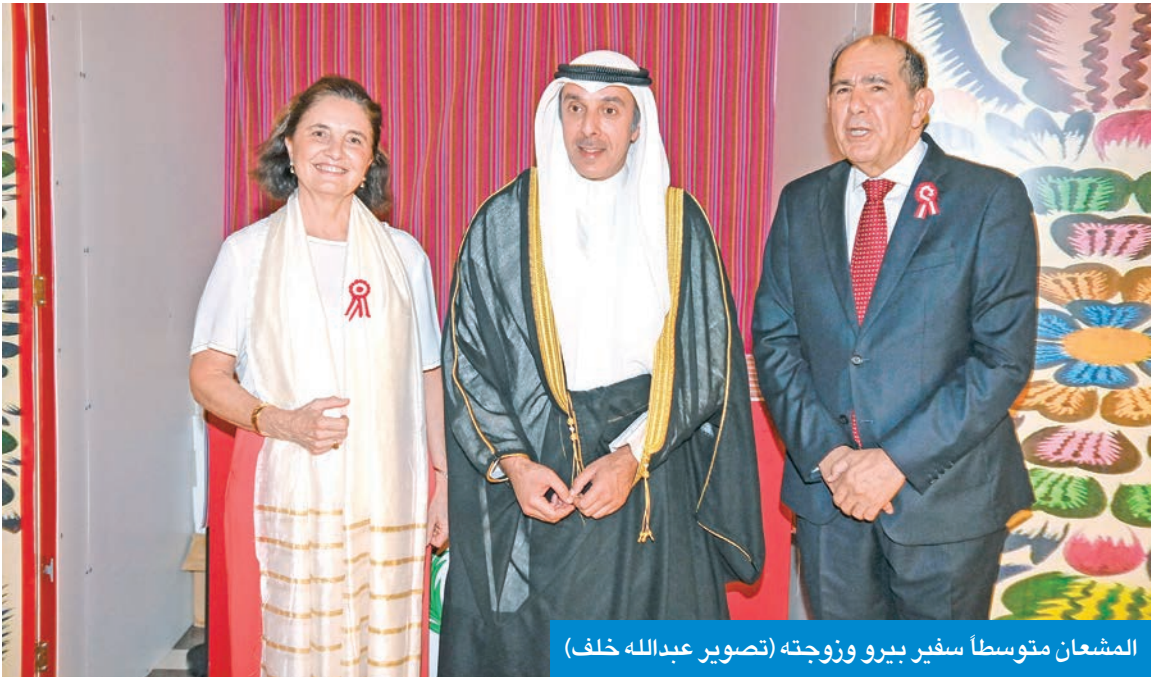
المشعان متوسطاً سفير بيرو وزوجته