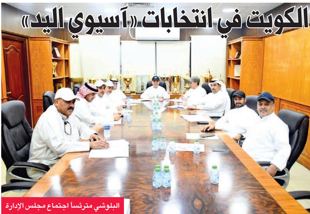
البلوشى مترشساً لاجتماع مجلس الإدارة

محمد عبدالعزيز أعلن الاتحاد الكويتى لكرة اليد دعمه لترشيح نائب رئيس الاتحاد الدولى، بدر الذياب، لمنصب رئيس الاتحاد الآسيوي لكرة اليد، وأمين السرقايد العدواني لمنصب أمين صندوق «الآسيوي»، وذلك ضمن الدورة الانتخابية الجديدة الممتدة من عام 2025 وحتى عام 2029.