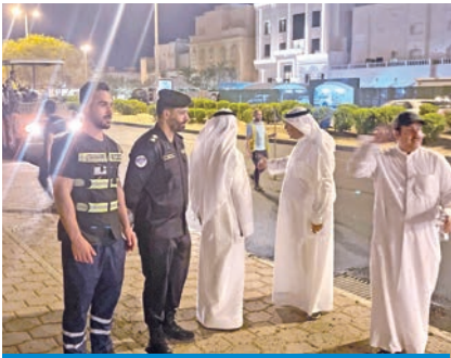
المحافظ الحبشي خلال تفقده أعمال الصيانة

الحبشي تفقّد سير الأعمال واطلع على المراحل التنفيذية الجارية