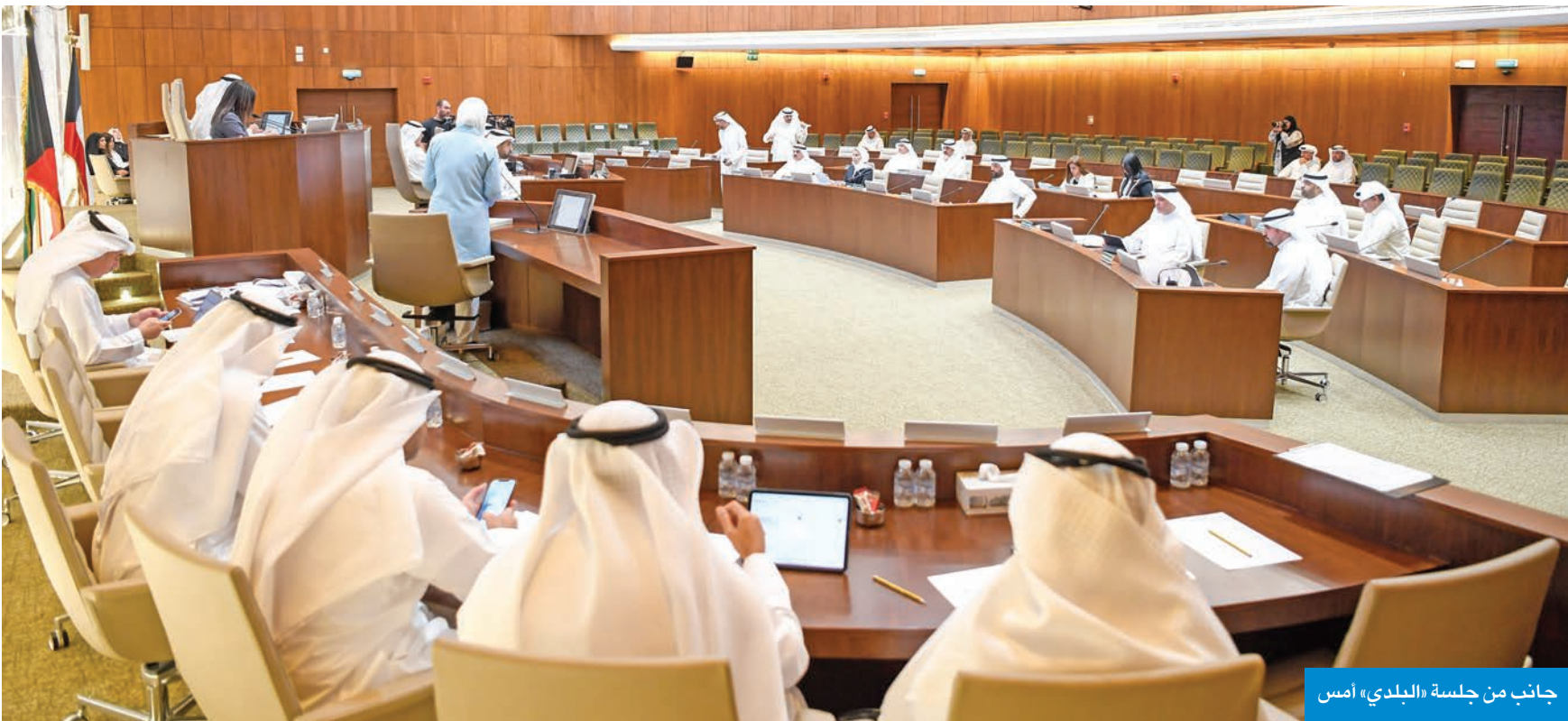
جانب من جلسة «البلدي» أمس

وافق على موقع بديل لشركة دواجن وتخصيص مسار مياه لتغذية مصنع الغاز المسال لـ «ناقلات النفط»