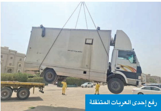
رفع إحدى العربات المتنتقلة

الإجراءات القانونية حيال المخالفين للائحة النظافة العامة وإشغالات الطرق.