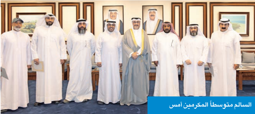
السالم متوسطاً المكرمين أمس

كرّم عاملين بـ«هيئة الغذاء» لجهودهم في ضبط الأسماك الفاسدة