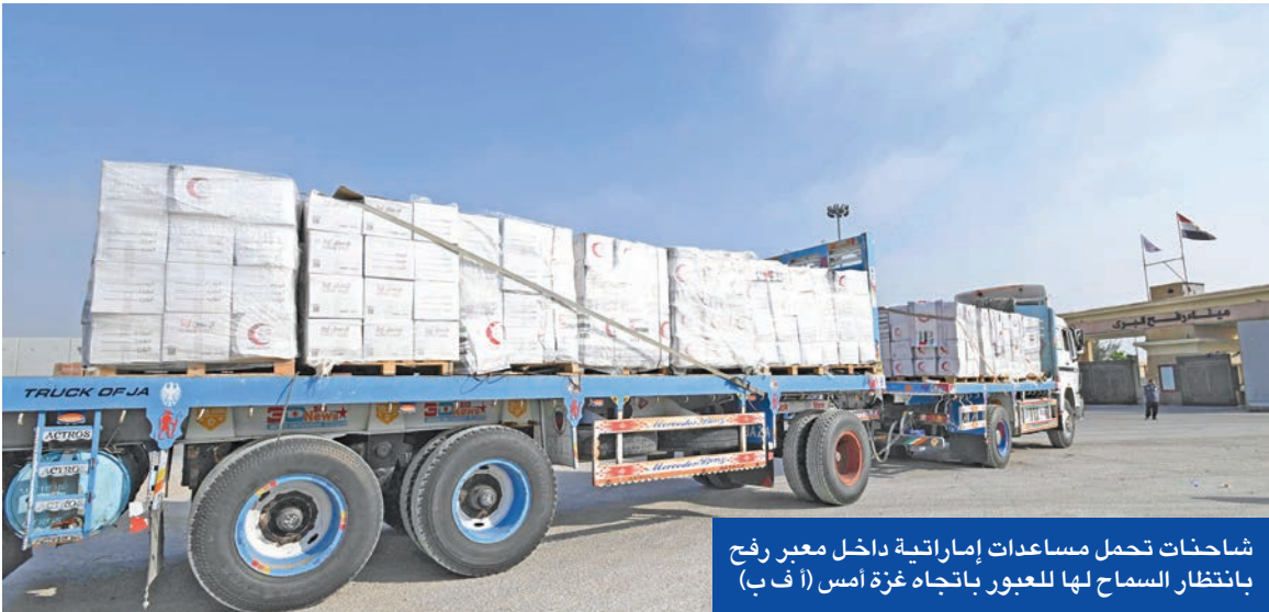
شاحنات تحمل مساعدات إماراتية داخل معبر رفح بانتظار السماح لها للعبور باتجاه غزة أمس

ولا يمكن أن تؤدي دوراً بمستقبل غزة، وأنه لا يمكن نسيان هجومها على إسرائيل في 7 أكتوبر 2023. ونقلت «جيو روزايم بوست» عن مصدر أن مسؤولين بالبيت الأبيض قالوا إن الوقت مناسب لصفقة شاملة تؤدي لإطلاق كل الرهائن وإنهاء حرب غزة.