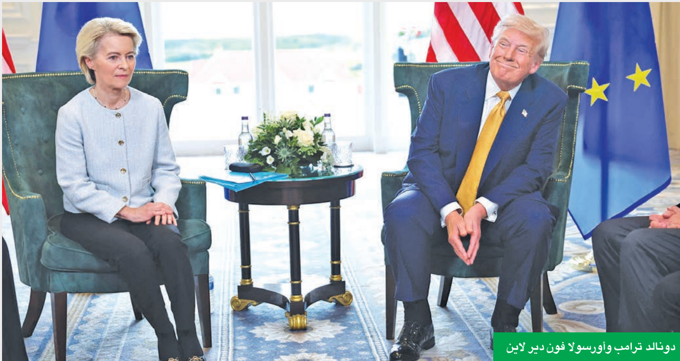
دونالد ترامب وأورسولا فون دير لاين

من جانبها، وصفت خبيرة المانية بارزة في الشؤون الاقتصادية، اتفاقية الرسوم الجمركية بين الاتحاد الأوروبي والولايات المتحدة بأنها تُشكل عبئاً كبيراً على قطاعات من الاقتصاد الألماني. وقالت أولريكه مالمندير، العضوة فيما يُعرف باسم «مجلس الحكماء» الذي يقدم المشورة للحكومة الألمانية بمجال الاقتصاد، في تصريحات لمجلة «إيه آر دي» الألمانية، أمس (الاثنين)، إن رسوم الـ 15 في المئة تُشكل عبئاً ثقيلاً على الاقتصاد، ليس هنا فحسب، بل في الولايات المتحدة أيضاً، مشيرة إلى أنه في السنوات والعقود السابقة، طُبِّقت نسبة تقارب 1 في المئة. بالمقارنة، هذه بالفعل