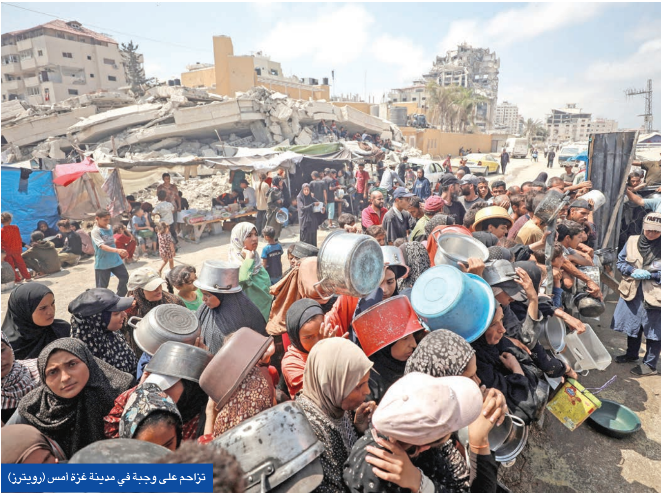
تزامن على وجبة في مدينة غزة أمس

وفي حين طالب بوضع أطر زمنية محددة لتنفيذ حل الدولتين، ووضع حد فوري للحرب والتجويع في غزة مع ضمان إطلاق سراح الرهائن الإسرائيليين وانسحاب قوات الاحتلال من القطاع، دعا مصطفى «حماس» إلى تسليم أسلحتها للسلطة وإنهاء سيطرتها عليه. وعقب الاجتماع، أكد وزير الخارجية الفرنسي أن المؤتمر حدث بالغ الأهمية، لأنه سيحصل على التزامات تاريخية للطرفين من أجل أمنهما وسلامتهما. بدوره، صرح رئيس وزراء السلطة الفلسطينية محمد مصطفى بأن المؤتمر يحمل وعداً وتعهداً للشعب الفلسطيني بأن الظلم التاريخي يجب أن ينتهي، وأن ما يحدث في غزة هو أحدث وأوحش تجلياته، وأن الجميع مدعو أكثر من أي وقت مضى للتحرك. وتابع بأن «الفلسطينيين والإسرائيليين ليس محكوماً عليهم بحرب أبدية، وهناك طريقاً آخر أفضل يؤدي إلى سلام مشترك وامن مشترك وازدهار مشترك في منطقتنا، ليس لأحد على حساب الآخر، بل للجميع». إلى أن الحرب في القطاع دامت فترة طويلة ويجب أن تتوقف. وبينما دعا الأمين العام للأمم المتحدة أنطونيو غوتيريش إلى استغلال زخم الاجتماع لوقف النزاع وتحقيق حل الدولتين، محذراً من أن سعي إسرائيل إلى «ضم الضفة الغربية غير قانوني، ويجب أن يتوقف لأنه يقوض حل الدولتين»، أكد أن «تجويع السكان وقتل عشرات الآلاف المدنيين وساعد عصف المستوطنين والتهجير القسري أمور ينبغي أن تتوقف».